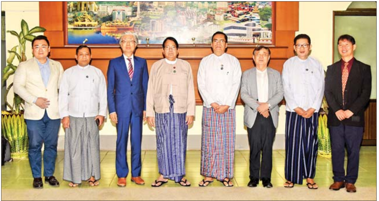
ပြည်ထောင်စုဝန်ကြီး ဒေါက်တာဖေမြင့်နှင့် တာဝန်ရှိသူများ ကိုရီးယားနိုင်ငံ ဘူဆန်မြို့ရှိ မြန်မာဂုဏ်ထူးဆောင် ကောင်စစ်ဝန်ချုပ် ဦးဆောင်သောအဖွဲ့နှင့် အတူ စုပေါင်းမှတ်တမ်းတင်ဓာတ်ပုံရိုက်စဉ်။

တွေ့ဆုံပွဲများသို့ ဒုတိယဝန်ကြီး ဦးအောင်လှထွန်းနှင့် တာဝန်ရှိသူများ တက်ရောက်ခဲ့ကြသည်။ သတင်းစဉ်