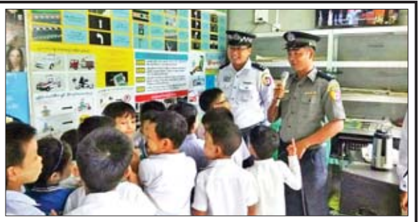
ဩဂုတ် ၈ ရက်က လွိုင်မြို့နယ် အမှတ် (၄) ရပ်ကွက် အေးရိမ်မွန်အိမ်ရာ (၁) လမ်း အလက (၈) စာသင်ကျောင်းရှေ့တွင် ပိတောက်ချောင်းနယ်မြေရဲစခန်းမှူး ရဲအုပ်ညီညီသွင်နှင့် အဖွဲ့ဝင်များ အသိပညာပေးယာဉ်ဖြင့် ကျောင်းသား ကျောင်းသူ ၃၂၄ ဦးအား မှုခင်းအသိပညာပေး ဆောင်ရွက်စဉ်။