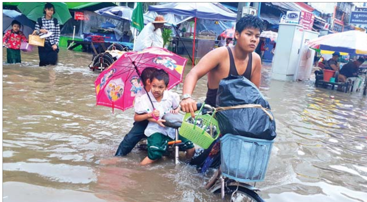
ရန်ကုန်မြို့၊ မင်္ဂလာတောင်ညွန့်မြို့နယ် ကန်တော်လေးတွင် မိုးအဆက်မပြတ်ရွာသွန်းမှုကြောင့် ဩဂုတ် ၇ ရက်က ရေကြီးရေလျှံမှုဖြစ်ပွားနေသည်ကို တွေ့ရစဉ်။