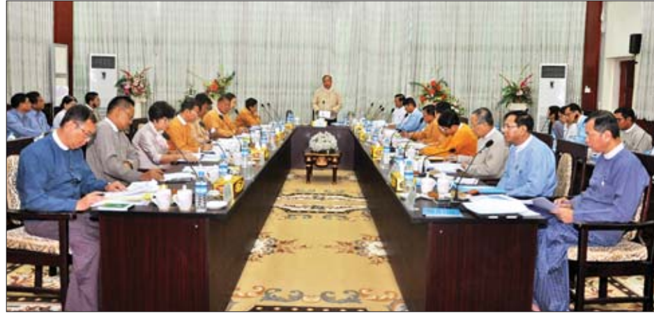
အညီ ဖြတ်သန်းချခင်းခွင့်ဆိုင်ရာ နည်းဥပဒေများ(Right of Way Rule) ရေးဆွဲနိုင်ရေးကိစ္စရပ်များနှင့် စပ်လျဉ်း ၍ ဆွေးနွေးပြောကြားသည်။

အစည်းအဝေးတွင် ကော်မတီဥက္ကဋ္ဌ ပို့ဆောင်ရေးနှင့် ဆက်သွယ်ရေးဝန်ကြီးဌာန ပြည်ထောင်စုဝန်ကြီး ဦးသန်းစင်မောင်က ဆက်သွယ်ရေးအခြေခံအဆောက် အအုံများ တည်ဆောက်ရာတွင် ကြုံတွေ့နေရသော အခက် အခဲများအားဖြေရှင်းနိုင်ရေး၊ ဆက်သွယ်ရေးအခြေခံ အဆောက်အအုံများ တည်ဆောက်ရာတွင် ဥပဒေ၊ နည်း ဥပဒေများနှင့်အညီ လျင်မြန်စွာစီမံခန့်ခွဲနိုင်ရေးနှင့် ဆက် သွယ်ရေးကွန်ရက် အထောက်အကူပြုအခြေခံအဆောက်