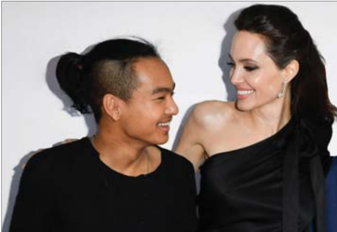
အေးပြည့် စုစည်းသည်

သတင်းရင်းမြစ်တစ်ဦးရဲ့ ပြောကြားချက်အရ ကြယ်ပွင့်တွေ လမ်းခွဲလိုက်ရတဲ့ အဓိကအကြောင်းရင်းကတော့ ဝေးကွာမှုကြောင့်ဖြစ်တယ်လို့ သိရပါတယ်။ ဘယ်လာဟာဒ်ဟာ လက်ရှိမှာ သူ့ရဲ့ ဖက်ရှင်ပြုတွေ အတွက် ပြင်ဆင်နေတာဖြစ်ပြီး သယ်ဝိမ်ကန်းဒ်ကတော့ တေးအယ်လ်ဘမ်သစ်အတွက် တေးသီချင်းတွေ ပြင်ဆင်နေပါတယ်။ သူတို့နှစ်ဦးဟာ နေရာဒေသတွေ ဝေးကွာနေကြသလို ခံစားချက်ချင်းလည်း ဝေးကွာသွားခဲ့တာကြောင့် လမ်းခွဲဖို့ရာ ဆုံးဖြတ်ခဲ့တာ ဖြစ်တယ်လို့လည်း သိရပါတယ်။