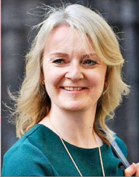
ဗြိတိန်နိုင်ငံခြားကုန်သွယ်မှုဝန်ကြီး လစ်ဇ်ထရစ်

ဆောင်ရွက်သည် လွန်ခဲ့သောလအတွင်းက အမေရိကန် သမ္မတ ထရန်က ပြောကြားခဲ့သည်။