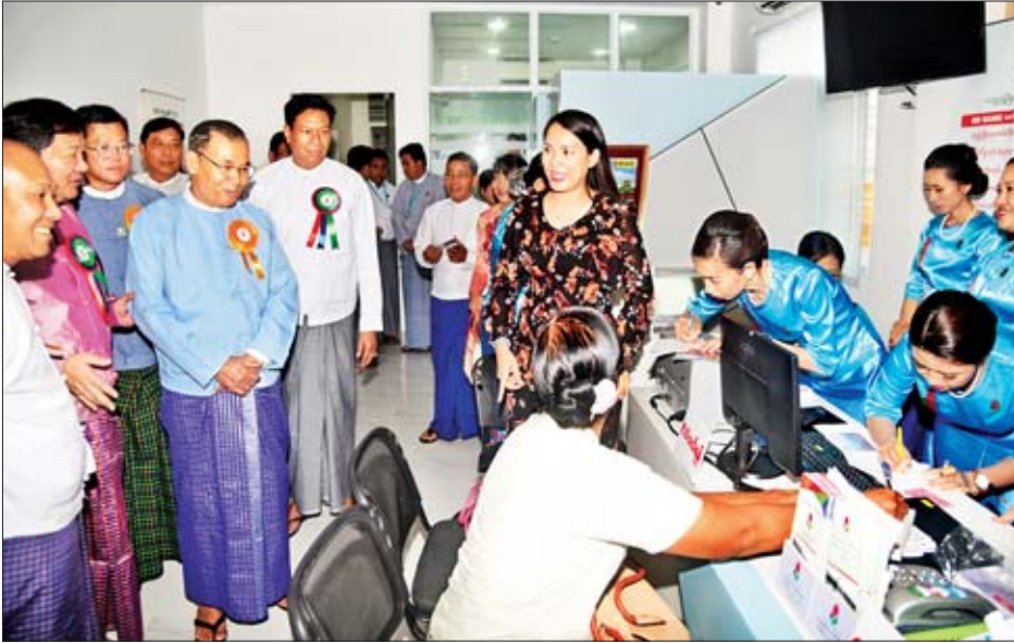
ဖွင့်လှစ်ပေးကြသည်။ စက်လှုပ်နှံမှု ဝန်ကြီး ဦးအုန်းဝင်း၊ ဦးလှိုင်ခွန်ဆာ ထိုနေ့က သတ္တုဖွံ့ဖြိုးရေးဘဏ် လီမိတက်ဆိုင်ဘုတ်ကို ပြည်ထောင်စု ဝန်ကြီး ဦးအုန်းဝင်း၊ ဦးလှိုင်ခွန်ဆာ နှင့် ဦးရုံးမုတို့က စက်လှုပ်နှံပွဲ ဖွင့်လှစ်ကြသည်။ လှည့်လည်ကြည့်ရှု ယင်းနေ့က ပြည်ထောင်စုဝန်ကြီး ဦးအုန်းဝင်းသည် သတ္တုဖွံ့ဖြိုးရေး ဘဏ်အဆောင်အဦအတွင်း ဘဏ် လုပ်ငန်း ဆောင်ရွက်နေမှုများကို လှည့်လည်ကြည့်ရှုကြောင်း သိရ သည်။ သတင်းစဉ်

ဖဲကြိုးဖြတ်ဖွင့်လှစ်ပေး အခမ်းအနားတွင် သယံဇာတနှင့် သဘာဝပတ်ဝန်းကျင် ထိန်းသိမ်းရေး ဝန်ကြီးဌာန ပြည်ထောင်စုဝန်ကြီး ဦးအုန်းဝင်း၊ နေပြည်တော် ဒုတိယ မြို့တော်ဝန် ဦးရဲမင်းဦး၊ သတ္တုတွင်း ဦးစီးဌာန ညွှန်ကြားရေးမှူးချုပ် ဦးခင်လတ်ကြီး၊ မြန်မာနိုင်ငံတော် ဗဟိုဘဏ် ညွှန်ကြားရေးမှူးချုပ်များ ဖြစ်ကြသည့် ဦးဝင်းသော်နှင့် ဦးအောင်အောင်၊ မြန်မာနိုင်ငံ ကျောက်မျက်ရတနာ လုပ်ငန်းရှင်များ အသင်းဥက္ကဋ္ဌ ဦးလှိုင်ခွန်ဆာနှင့် သတ္တုဖွံ့ဖြိုးရေးဘဏ် လီမိတက် ဒါရိုက်တာအဖွဲ့ဥက္ကဋ္ဌ ဦးရုံးမုတို့က ဘဏ်အဆောက်အဦကို ဖဲကြိုးဖြတ်၍