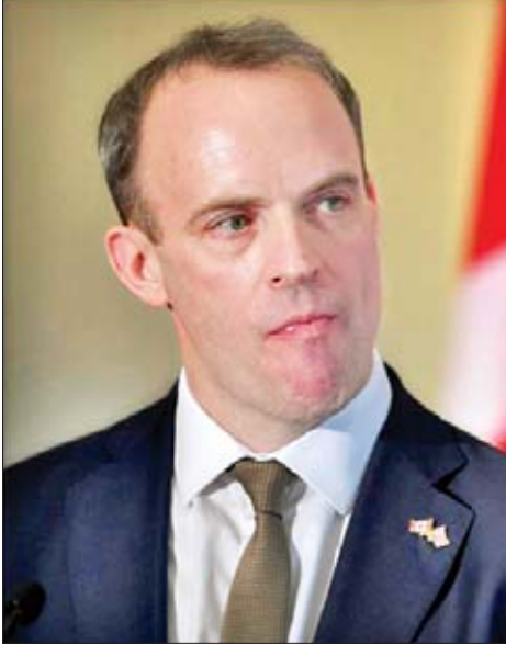
ဗြိတိန်နိုင်ငံခြားရေးဝန်ကြီး ဒိုမီနစ်ရက်စ်

ဗြိတိန်နိုင်ငံအနေဖြင့် ဥရောပသမဂ္ဂအဖွဲ့မှ နုတ်ထွက် သည်နှင့်တစ်ပြိုင်နက် အမေရိကန်နှင့် ဗြိတိန်နှစ်နိုင်ငံ ကုန်သွယ်ရေးကဏ္ဍကို တိုးမြှင့်လုပ်ဆောင်သွားမည် ဖြစ်ကြောင်းနှင့် နှစ်နိုင်ငံ ကုန်သွယ်မှုဆိုင်ရာ သဘောတူညီ မှုတစ်ရပ် ထွက်ပေါ်လာစေရန် ကြိုးပမ်းကြမည်ဖြစ်ကြောင်း ဗြိတိန်ဝန်ကြီးချုပ်သစ် ရာထူးတာဝန်များ စတင်တာဝန်ယူ