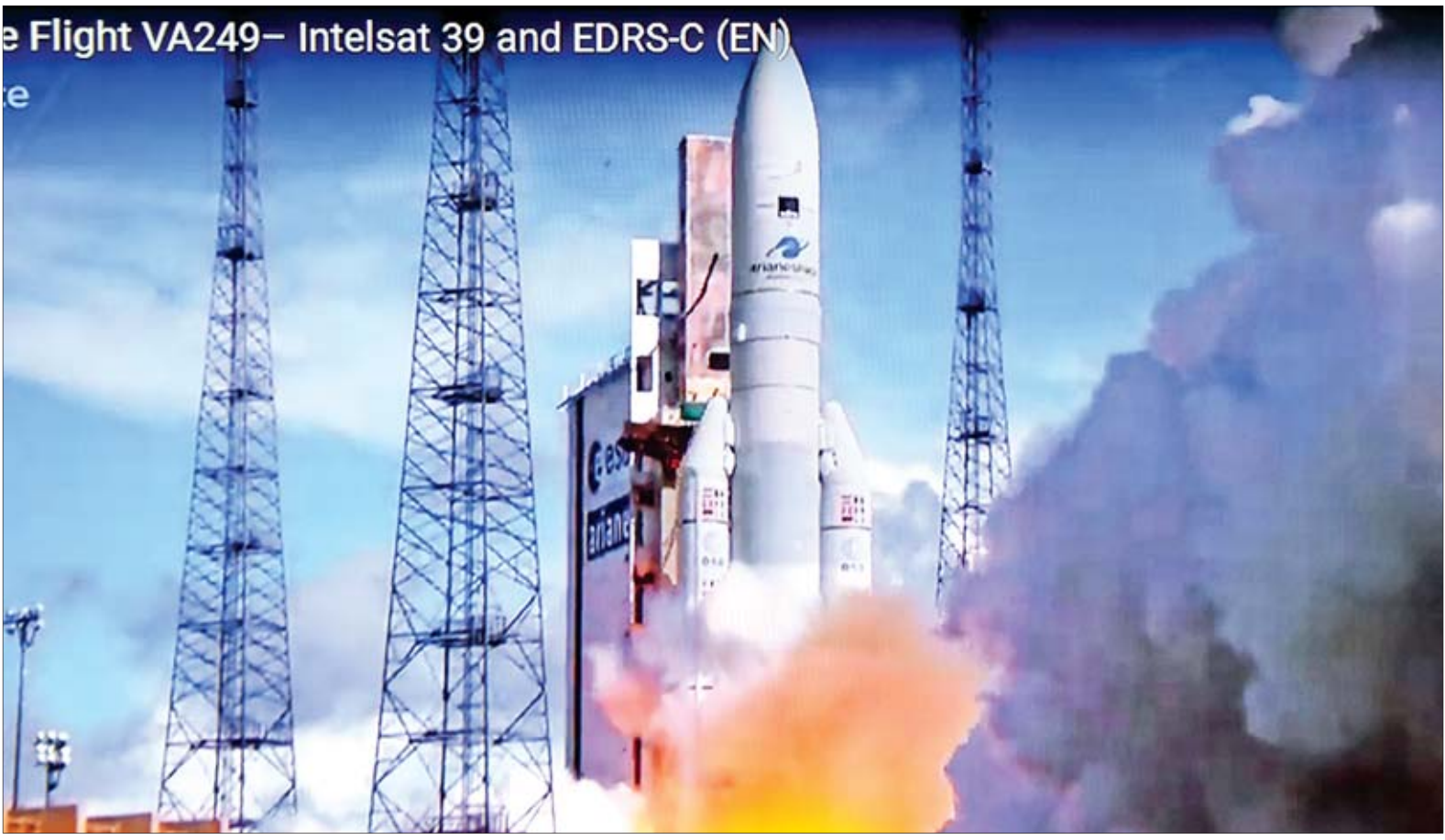
Flight VA249 - Intelsat 39 and EDRS-C (EN)

နေပြည်တော် ဩဂုတ် ၇ Myanmar Sat-2 ပါဝင်သည့် Intelsat 39 ကို ယနေ့ နံနက် ၂ နာရီတွင် တောင်အမေရိကတိုက် မြောက်အတ္တလန္တိတ် ကမ်းခြေရှိ ပြင်သစ်ဂီယာနာ အာရိယန် အကာသဒုံးပျံပစ်လွှတ်ရေး အခြေစိုက်စခန်းမှ အောင်မြင်စွာ လွှတ်တင်နိုင်ခဲ့သည်။