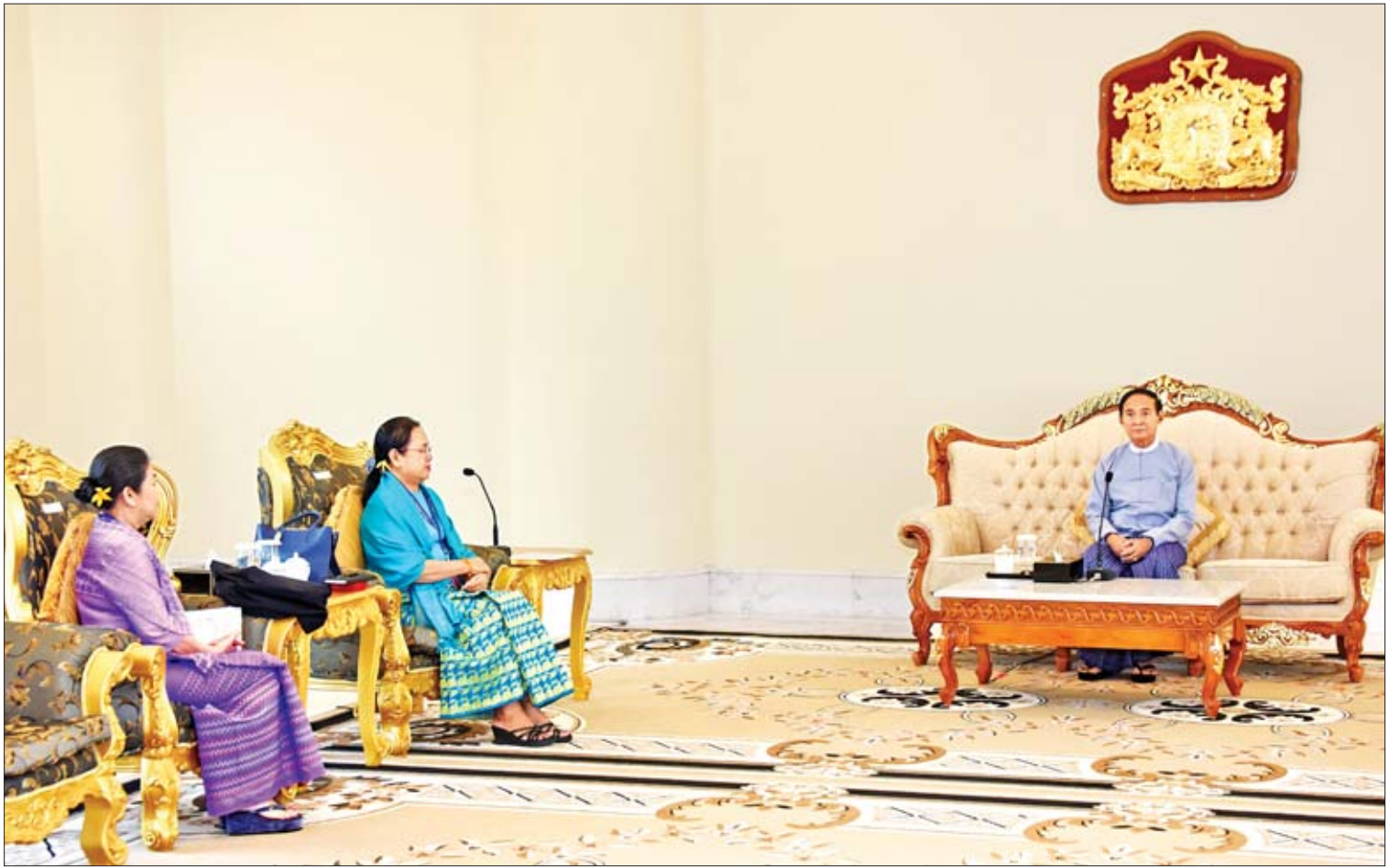
မြန်မာနိုင်ငံ ကြက်ခြေနီအသင်းနာယက နိုင်ငံတော်သမ္မတဦးဝင်းမြင့်အား မြန်မာနိုင်ငံ ကြက်ခြေနီအသင်းဥက္ကဋ္ဌ ပါမောက္ခ ဒေါက်တာဒေါ်မြသူနှင့် အချိန်ပြည့်အလုပ်အမှုဆောင် အဖွဲ့ဝင် ဒေါက်တာဒေါ်အမာမော်နိုင်တို့က လာရောက်ဂါရဝပြု တွေ့ဆုံစဉ်။

အသင်း၏ညီလာခံကို ဥပဒေ၊ လုပ်ထုံး လုပ်နည်း၊ စည်းမျဉ်းစည်းကမ်းများနှင့်အညီ ကျင်းပပြီး မဲပေးခွင့်ရှိသူများ မဲပေးပိုင်ခွင့်ရရှိ ရေးကို ဆောင်ရွက်ပေးရန်လိုအပ်ကြောင်း၊ မြန်မာနိုင်ငံ ကြက်ခြေနီအသင်းကောင်စီဝင် များကို ထိုညီလာခံက ရွေးချယ်ဖွဲ့စည်းပေးရ မည်ဖြစ်ပြီး ကောင်စီဝင်များ မှန်မှန်ကန်ကန် ရရှိရေးကိုလည်း ဦးတည်ဆောင်ရွက်ရန်လို ကြောင်း၊ ကောင်စီဝင်များထံမှ အလုပ်အမှု ဆောင်များအားစနစ်တကျ ရွေးချယ်ပြီး