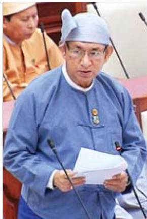
ဒုတိယဝန်ကြီး ဒေါက်တာရဲမြင့်ဆွေ