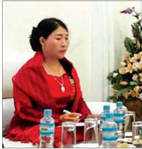
ဒေါ်နန်းထွေးသူ

ဒေါ်နန်းထွေးသူ။ တာဝန်ယူမှုနဲ့ပတ်သက်ပြီး အခြေခံမူ မှာပါရှိတာ အချက် ၁၀ ချက်ရှိပါတယ်။ တာဝန်ယူမှုဆိုတာ လွှတ်တော်ကိုယ်စားလှယ်တွေ အတွက် အင်မတန်အရေးကြီးပါတယ်။ လွှတ်တော် ကိုယ်စားလှယ်တွေရဲ့လုပ်ဆောင်ချက်တွေဟာ တာဝန်