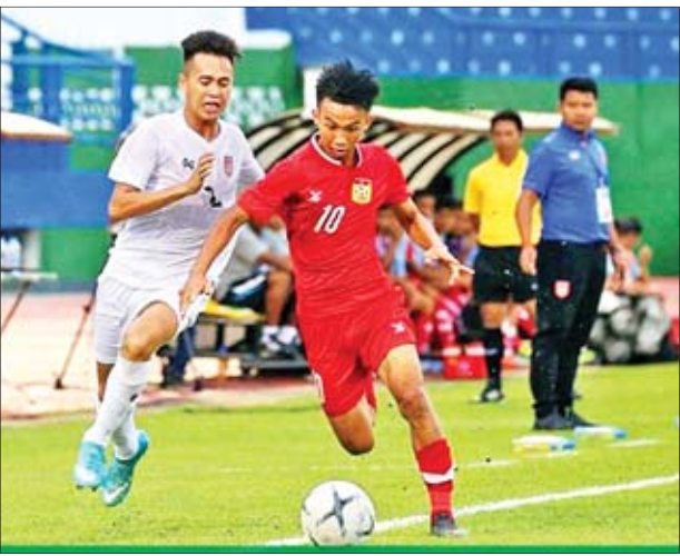
မြန်မာအသင်းနှင့် လာအိုအသင်းတို့ ယှဉ်ပြိုင်စဉ်။

ရန်ကုန် ဩဂုတ် ၆ ဗီယက်နမ်နိုင်ငံက အိမ်ရှင်အဖြစ် လက်ခံကျင်းပသည့် ၂၀၁၉ အာဆီယံ ယူ-၁၈ ပြိုင်ပွဲ အုပ်စုပထမနေ့ကို ယနေ့ညနေပိုင်းက ကျင်းပရာ မြန်မာ အသင်းက လာအိုအသင်းကို သုံးဂိုး- တစ်ဂိုးဖြင့် အနိုင်ရခဲ့သည်။ မြန်မာအသင်းသည် ခြေစွမ်းအရ အကောင်းဆုံးပုံစံ မရသေးသော် လည်း အဖွင့်ပွဲတွင် ရလဒ်ကောင်းရယူ နိုင်ခဲ့ခြင်းဖြစ်သည်။ မြန်မာအသင်း သည် အုပ်စုအနေအထားအရ နောက်တစ်ဆင့်တက်ရန် အခြေအနေ ကောင်းများရှိနေသလို အဖွင့်ပွဲ စာမျက်နှာ ၇ ကော်လံ ၁ သို့ ◆