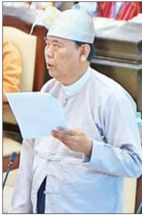
ဒုတိယဝန်ကြီး ဦးဝင်းမော်ထွန်း