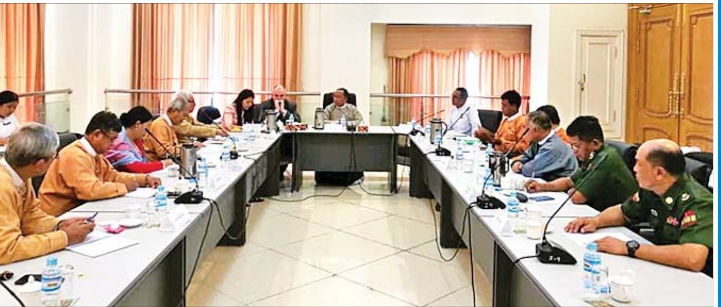
ပြည်သူ့လွှတ်တော် လွှတ်တော်အဖွဲ့အရေးကော်မတီ အတွင်းရေးမှူးနှင့် အဖွဲ့ဝင်များ UK House of Commons မှ Mr.Laim Laurence Symth အား ဇူလိုင် ၃၁ ရက်တွင် လက်ခံတွေ့ဆုံစဉ်။

ထိုသို့ ဆွေးနွေးခဲ့သည်များကို ဖော်ပြအပ်ပါသည်။ ဒေါက်တာလှဝင်း ။ ပြည်သူ့လွှတ်တော် လွှတ်တော် အဖွဲ့အရေး ကော်မတီအနေနဲ့ သက်တမ်း သုံးနှစ်ခွဲကာလကျော်ရှိခဲ့ပြီဖြစ်ပါတယ်။ ဒုတိယအကြိမ် ပြည်သူ့လွှတ်တော် လွှတ်တော်အဖွဲ့အရေးကော်မတီအနေနဲ့ လုပ်ငန်းတာဝန်တွေ မြောက်မြားစွာရှိပါတယ်။ အဓိကလုပ်ရတဲ့ လုပ်ငန်း တာဝန်တွေကတော့ လွှတ်တော်ကျင့်ဝတ်အခါ နေ့စဉ် လွှတ်တော်ရဲ့လုပ်ငန်းတာဝန်တွေ ထမ်းဆောင်ရသလို လွှတ်တော်ကိုယ်စားလှယ်တွေနဲ့ အစိုးရကြားမှာရှိတဲ့ ပွတ်တိုက်မှုတွေ၊ လွှတ်တော်ကိုယ်စားလှယ်တွေနဲ့ မဲဆန္ဒရှင်ပြည်သူတွေကြားမှာရှိတဲ့ ပွတ်တိုက်မှုတွေ၊ လွှတ်တော်ကိုယ်စားလှယ်အချင်းချင်းကြားမှာရှိတဲ့ ပွတ်တိုက်မှုတွေကို ဖြေရှင်းဆောင်ရွက်ပေးနေတဲ့ ကော်မတီတစ်ခုလည်းဖြစ်ပါတယ်။ ဥပဒေအတွင်းကနေ လွှတ်တော်ကိုယ်စားလှယ်တွေ ရသင့်ရထိုက်တဲ့ အခွင့်အရေးတွေကိုရရှိအောင် ဆောင်ရွက်ပေးနေတဲ့ ကော်မတီတစ်ခုလည်း ဖြစ်ပါတယ်။