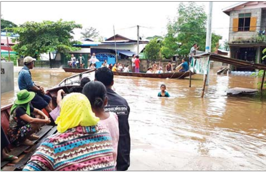
နာရီတွင် စိုးရိမ်ရေမှတ်ထက် ကျော်လွန်သည့် ၅၆၆ စင်တီမီတာသို့ ထပ်မံတိုးမြင့်သွားပြီး ကိုးနဝင်းဘုန်းတော်ကြီး

အဆိုပါ သောင်ရင်းမြစ်ရေသည် ယနေ့ မွန်းလွဲ ၃