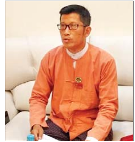
ဒေါက်တာစောနိုင်

အခန်းငါးခန်းပါရှိတဲ့ လွှတ်တော် ကိုယ်စားလှယ်တွေရဲ့ ကျင့်ဝတ်မှာ နောက်ဆုံးအခန်းငါးမှာဖော်ပြထားတဲ့ ကတိကဝတ် အပိုင်းကို ဆွေးနွေးချင်ပါတယ်။ လွှတ်တော်ကိုယ်စားလှယ် တွေရဲ့ Vision Mission တွေကိုလည်း ပြောပြပြီးသွား ပါပြီ။ ကျင့်ဝတ်ကို ဘာကြောင့်ရေးဆွဲတယ်ဆိုတာကို လည်း ဆွေးနွေးခဲ့ကြပါတယ်။ အခြေခံမူတွေကိုလည်း ပြောပြခဲ့ကြပါတယ်။ ကျင့်ဝတ်က အရေးကြီးပါတယ်။ ကျွန်တော်တို့နိုင်ငံဟာ ဒီမိုကရေစီဖက်ဒရယ်နိုင်ငံအဖြစ် တည်ထောင်နေတဲ့အချိန်ဖြစ်ပါတယ်။ ဒီလို ထူထောင် ရမှာ လွှတ်တော်ကိုယ်စားလှယ်တွေရဲ့အခန်းကဏ္ဍဟာ အရေးကြီးပါတယ်။ လွှတ်တော်ကိုယ်စားလှယ်တွေဟာ မဲဆန္ဒရှင်ပြည်သူတွေနဲ့ အစိုးရအဖွဲ့နဲ့၊ တရားစီရင်ရေး ကဏ္ဍတွေအကြားမှာ အပြန်အလှန်ထိန်းကျောင်းမှု အနေနဲ့ ဒီကျင့်ဝတ်တွေ လိုက်နာဆောင်ရွက်နေပါတယ် ဆိုတာက လွှတ်တော်ကိုယ်စားလှယ်တွေအပေါ်မှာ ယုံကြည်မှုတိုးပွားစေပါတယ်။