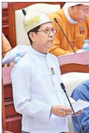
ဒုတိယဝန်ကြီး ဦးသာဦး