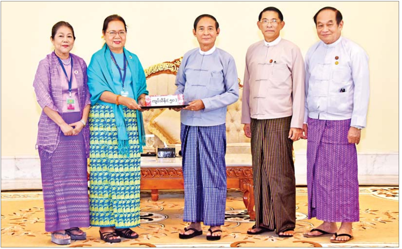
နိုင်ငံတော်သမ္မတ ဦးဝင်းမြင့် မြန်မာနိုင်ငံကြက်ခြေနီအသင်းအတွက် အလှူငွေကျပ်သိန်း ၅၀ ပေးအပ်လှူဒါန်းရာ မြန်မာနိုင်ငံ ကြက်ခြေနီအသင်းဥက္ကဋ္ဌ ပါမောက္ခ ဒေါက်တာဒေါ်မြသူ လက်ခံရယူစဉ်။

ရှင်းလင်းတင်ပြ တွေ့ဆုံစဉ် မြန်မာနိုင်ငံကြက်ခြေနီ အသင်းဥက္ကဋ္ဌ ပါမောက္ခ ဒေါက်တာ ဒေါ်မြသူက မြန်မာနိုင်ငံကြက်ခြေနီ အသင်း၏ ဖွဲ့စည်းမှု၊ ၂၀၁၅ ခုနှစ် ကြက်ခြေနီအသင်းဥပဒေအရ ၂၀၁၉ ခုနှစ် နိုဝင်ဘာလတွင် မြန်မာနိုင်ငံ ကြက်ခြေနီအသင်း ညီလာခံကျင်းပ သွားမည့်အခြေအနေ၊ အဆိုပါ ညီလာခံတွင် မြို့နယ်အသင်းခွဲမှစ၍ ကောင်စီဝင်နှင့် အလုပ်အမှုဆောင် အဆင့်ဆင့် ရွေးချယ်တင်မြှောက်သွား မည့်အခြေအနေ၊ အသင်းကြီး၏ နှစ်(၈၀)ပြည့် အထိမ်းအမှတ်အခမ်း အနားကို မူဝါဒလမ်းညွှန်ချက်များနှင့် အညီ ကျင်းပသွားမည့်အခြေအနေတို့ နှင့်စပ်လျဉ်း၍ ရှင်းလင်းတင်ပြသည်။ စာမျက်နှာ ၃ ကော်လံ ၁ သို့