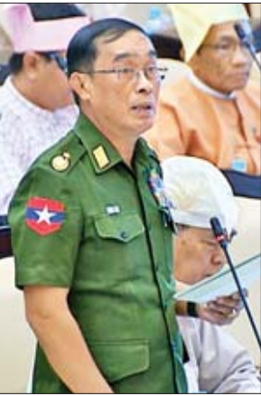
ဒုတိယဝန်ကြီး ဝိုလ်ချုပ်သန်းထွဋ်

ထို့ပြင် ၂၀၁၉ ခုနှစ် တက္ကသိုလ်ဝင်ခွင့်လမ်းညွှန်စာအုပ်တွင် ကျောင်းသား ကျောင်းသူများသည် တက္ကသိုလ်ဝင်ခွင့် လျှောက်လွှာများတွင် အမျိုးသားမှတ်ပုံတင်အမှတ်(သို့မဟုတ်) နိုင်ငံသားစိစစ်ရေးကတ်ပြားအမှတ် (သို့မဟုတ်) နိုင်ငံသားလက်မှတ် အမှတ်များ မမှန်မကန်ထည့်ခြင်းနှင့် လိမ်လည်မှုများတွေ့ရှိပါက ထိရောက်စွာ အရေးယူခြင်းခံရမည်ဟု ဖော်ပြထားပါကြောင်းနှင့် အဆင့်မြင့်ပညာဦးစီးဌာနအောက်တွင်ရှိ သည့် တက္ကသိုလ်များအားလုံး ဖော်ပြပါသတ်မှတ်ချက်များအတိုင်း တစ်ပြေးညီ ကျင့်သုံးဆောင်ရွက်လျက်ရှိပါ