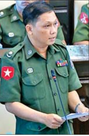
တပ်မတော်သားကိုယ်စားလှယ် ဝိုလ်မျိုးအောင်နိုင်ဦး