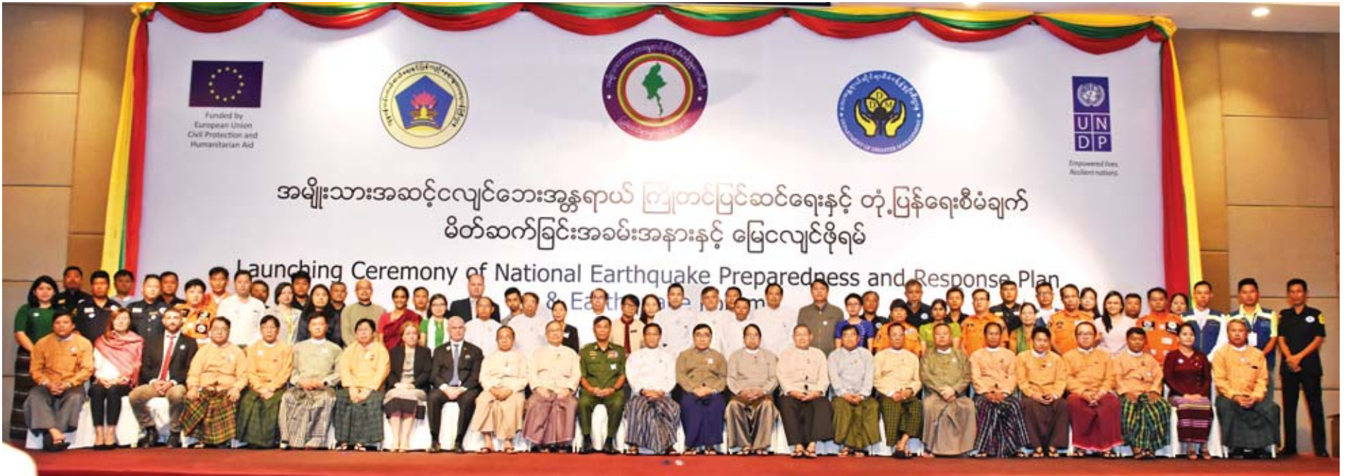
ဒုတိယသမ္မတ ဦးဟင်နရီပန်ထီးယူ ပြည်ထောင်စုဝန်ကြီးများ၊ တိုင်းဒေသကြီးနှင့် ပြည်နယ်ဝန်ကြီးများ၊ ပညာရပ်ဆိုင်ရာအသင်းအဖွဲ့များမှ ကိုယ်စားလှယ်ပညာရှင်များ၊ UN၊ INGO နှင့် NGO အဖွဲ့အစည်းများမှ ကိုယ်စားလှယ်များ အမျိုးသားအဆင့်လျှင်ဘေးအန္တရာယ် ကြိုတင်ပြင်ဆင်ရေးနှင့် တုံ့ပြန်ရေးစီမံချက် မိတ်ဆက်ခြင်းအခမ်းအနားနှင့် မြေငလျင်ဖိရပ်