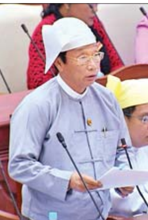
ဒုတိယဝန်ကြီး ဦးလှကျော်

ထို့ပြင် ဘီးလင်းမဲဆန္ဒနယ်မှ ဦးတင်ကိုကိုဦး(ခ) ဦးအတွတ်၏ “လယ်ယာမြေစီမံခန့်ခွဲရေးနှင့် စာရင်းအင်းဦးစီးဌာနအနေဖြင့် မြေကြီးမြေပုံမှန်ကန်ရေးအတွက် မည်ကဲ့သို့ စီမံခန့်ခွဲအကောင်အထည်ဖော် ဆောင်ရွက်နေသည်ကို သိလိုခြင်း” မေးခွန်းနှင့်စပ်လျဉ်း၍ စိုက်ပျိုးရေး၊ မွေးမြူရေးနှင့် ဆည်မြောင်းဝန်ကြီးဌာန ဒုတိယဝန်ကြီး ဦးလှကျော်က လယ်ယာမြေစီမံခန့်ခွဲရေးနှင့် စာရင်းအင်းဦးစီးဌာနမှ လက်ရှိအသုံးပြုလျက်ရှိသည့် ကွင်းမြေပုံများသည် မြေကြီးနှင့် မြေပုံ အစဉ်အမြဲမှန်ကန်မှု ရှိမှသာ နိုင်ငံတော်၏ မြေယာဆိုင်ရာမူဝါဒများ ချမှတ်ရာတွင်လည်းကောင်း၊ လယ်ယာကဏ္ဍ ဖွံ့ဖြိုးမှုဆိုင်ရာစီမံကိန်းများ ချမှတ်အကောင်အထည်ဖော်ရာတွင် လည်း