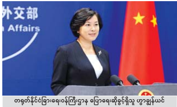
တရုတ်နိုင်ငံခြားရေးဝန်ကြီးဌာန ပြောရေးဆိုခွင့်ရှိသူ ဟွာချွန်ယင်

ပေကျင်း ဩဂုတ် ၆ နှစ်နိုင်ငံ လယ်ယာကဏ္ဍဆိုင်ရာ ပူးပေါင်းဆောင်ရွက်မှုအတွက် အခြေအနေများ ဖန်တီးရန်အတွက် ဂျပန်နိုင်ငံ အိန္ဒိယနိုင်ငံ နှစ်နိုင်ငံခေါင်းဆောင်များ ရရှိခဲ့သည့် အများအပြားအား အလေးအနက် အကောင်အထည် ဖော်ရန်နှင့် ကတိတည်ရန် တရုတ်နိုင်ငံခြားရေးဝန်ကြီးဌာန ပြောရေးဆိုခွင့်ရှိသူ က အမေရိကန်နိုင်ငံကို အင်အားတိုက်တွန်းပြောကြားလိုက်သည်။ တရုတ် စီးပွားရေးလုပ်ငန်းရှင်များက အမေရိကန် လယ်ယာထွက်ကုန်ပစ္စည်းများကို ဝယ်ယူမှုရပ်ဆိုင်းလိုက်သည့် ကိစ္စနှင့်ဆက်သွယ်သည့် တရုတ်ကုန်သွယ်ရေး ဝန်ကြီးဌာန၏ ကြေညာချက်နှင့် ပတ်သက်သည့် မေးမြန်းမှုအပေါ် ပြောရေး ဆိုခွင့်ရှိသူ ဟွာချွန်ယင်က ဤကဲ့သို့ ဖြေကြားခဲ့ခြင်းဖြစ်သည်။ အမေရိကန် ဒေါ်လာ ၃၀၀ ဘီလီယံ တန်ဖိုးရှိ တရုတ်ပို့ကုန်များအပေါ် အကောက်ခွန် ၁၀ ရာခိုင်နှုန်း ထပ်မံကောက်ခံမည့် အစီအမံကို အမေရိကန် ဘက်က ကြေညာခဲ့ကြောင်း ယင်းသို့ ကြေညာခြင်းသည် ဂျပန်နိုင်ငံ အိန္ဒိယက