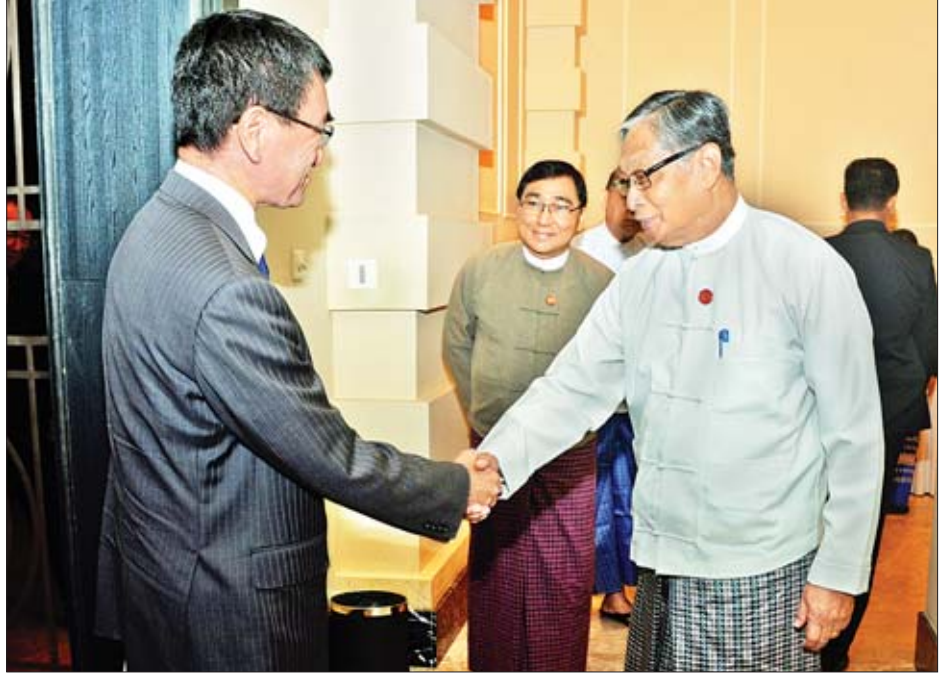
နေ့လယ်စာစားပွဲသို့ တက်ရောက်လာသော ဂျပန်နိုင်ငံခြားရေးဝန်ကြီး မစ္စတာ တာရိုခိုနိုအား ပြည်ထောင်စုဝန်ကြီး ဦးကျော်တင့်ဆွေက ရင်းရင်းနှီးနှီး ကြိုဆိုနှုတ်ဆက်စဉ်။

ဒီနေ့ တွေ့ဆုံပွဲကတစ်ဆင့် ဂျပန်နိုင်ငံသူ နိုင်ငံသားများ အားလုံးကို ကျွန်မတို့ ဝေဖွာပို့သန့်တန်ခွန်းဆက်ပါတယ်” ဟု ပြောကြားသည်။