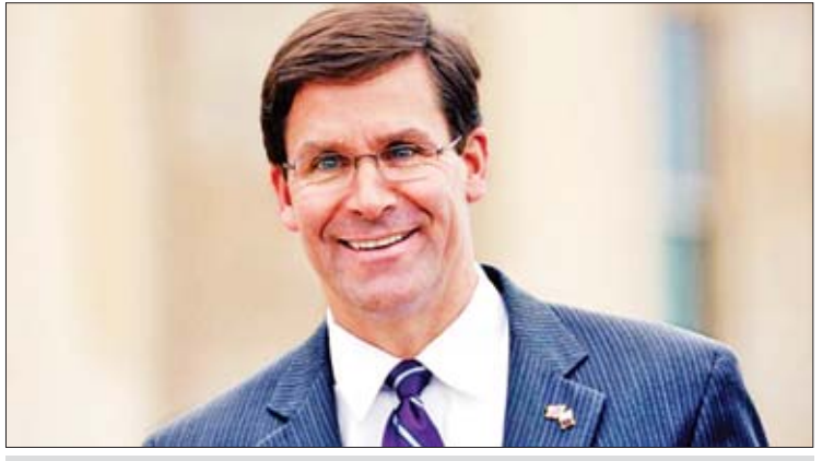
အမေရိကန်ကာကွယ်ရေးဝန်ကြီး မှန်အက်စ်ပါ

လွန်ခဲ့သည့်နှစ် ဒီဇင်ဘာလအတွင်းက အမေရိကန်ကာကွယ်ရေးဝန်ကြီး ဂျိမ်းစ်မတ်