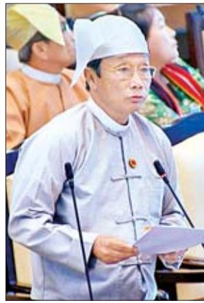
ဒုတိယဝန်ကြီး ဦးလှကျော်