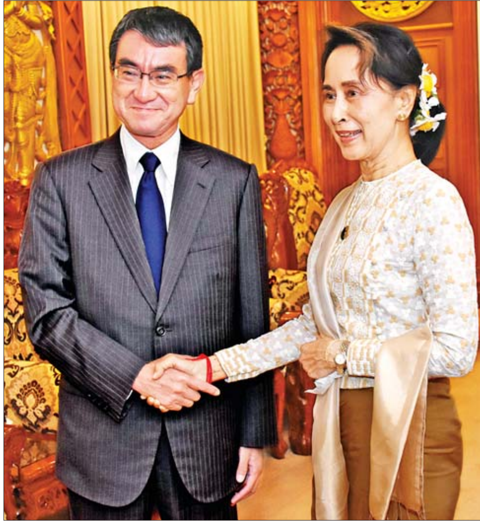
နိုင်ငံတော်၏ အတိုင်ပင်ခံပုဂ္ဂိုလ် ဒေါ်အောင်ဆန်းစုကြည် ဂျပန်နိုင်ငံခြားရေးဝန်ကြီး မစ္စတာ တာရိုခိုနို အား ရင်းရင်းနှီးနှီး နှုတ်ဆက်စဉ်။

○ ရှေ့မှ လာရောက်ခြင်းဖြစ်ပြီး အခုအချိန်မှာ အလည်အပတ် လာရောက်နိုင်တာကို အထူးပဲဝမ်းမြောက်မိပါတယ်။ ဒီနေ့မှာ နိုင်ငံတော်၏ အတိုင်ပင်ခံပုဂ္ဂိုလ် ဒေါ်အောင်ဆန်းစုကြည်နဲ့ မြန်မာနိုင်ငံအစိုးရအနေနဲ့ ဒီမိုကရေစီနိုင်ငံ ထူထောင်ရာမှာ ဂျပန်နိုင်ငံက စီးပွားရေး၊ လူမှုရေး အပါအဝင် ဘက်ပေါင်းစုံက ကူညီထောက်ပံ့သွားမယ်လို့ ထပ်မံ အတည်ပြု ပြောကြားလိုပါတယ်။