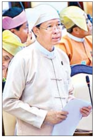
ပြည်ထောင်စုဝန်ကြီး ဒေါက်တာမျိုးသိမ်းကြီး