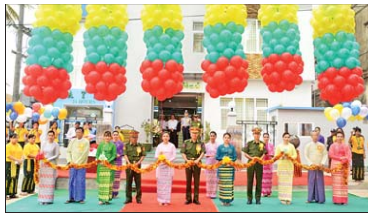
ပေးပို့နိုင်ခြင်းများအပါအဝင် Modern Banking အနေဖြင့်လည်း Mobile Banking နှင့် Internet Banking ဆိုင်ရာ ဘဏ်လုပ်ငန်းဝန်ဆောင်မှုများကို ဆောင်ရွက်ပေးသွားမည်ဖြစ်ကြောင်း သိရ သတင်းစဉ်

သရက်မြို့၏ စီးပွားရေး ဆောင်ရွက်နိုင်ရန် စာရင်းရှင်အပ်ငွေများ၊ ငွေစုဘဏ်အပ်ငွေ များ၊ စာရင်းသေအပ်ငွေများ၊ ခေါ်ယူအပ်ငွေ များ၊ တက္ကသိုလ်ပညာသင်ဆု ဝန်ဆောင်မှု အပ်ငွေများ၊ ATM ကတ်စာရင်းအပ်ငွေများ လက်ခံခြင်းနှင့် စီးပွားရေးလုပ်ငန်းရှင်များ၏ လိုအပ်သောရင်းနှီးငွေများအတွက် မရွှေ့ မပြောင်းနိုင်သော မြေနှင့်အဆောက်အအုံများ ကို အာမခံအဖြစ်ရယူ၍ ချေးငွေများ ထုတ် ချေးခြင်း၊ မြဝတီဘဏ်ခွဲအသီးသီးနှင့် ချိတ်ဆက်ထားသည့် မြန်မာ့စီးပွားရေးဘဏ် နှင့် ပုဂ္ဂလိကဘဏ်များသို့ အပြန်အလှန်ငွေလွှဲ