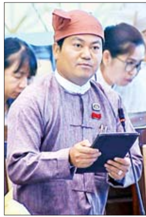
ကချင်ပြည်နယ် မဲဆန္ဒနယ် အမှတ်(၇)မှ ဦးဝင်းဇော်

နေပြည်တော် ဇူလိုင် ၃၁ - ဒုတိယအကြိမ်အမျိုးသားလွှတ်တော် (၁၃)ကြိမ်မြောက် ပုံမှန်အစည်းအဝေး ဆဋ္ဌမနေ့ကို ယနေ့နံနက် ၁၀ နာရီတွင် နေပြည်တော်ရှိ အမျိုးသားလွှတ်တော် အဆောက်အဦအစည်းအဝေးခန်းမ၌ ကျင်းပသည်။