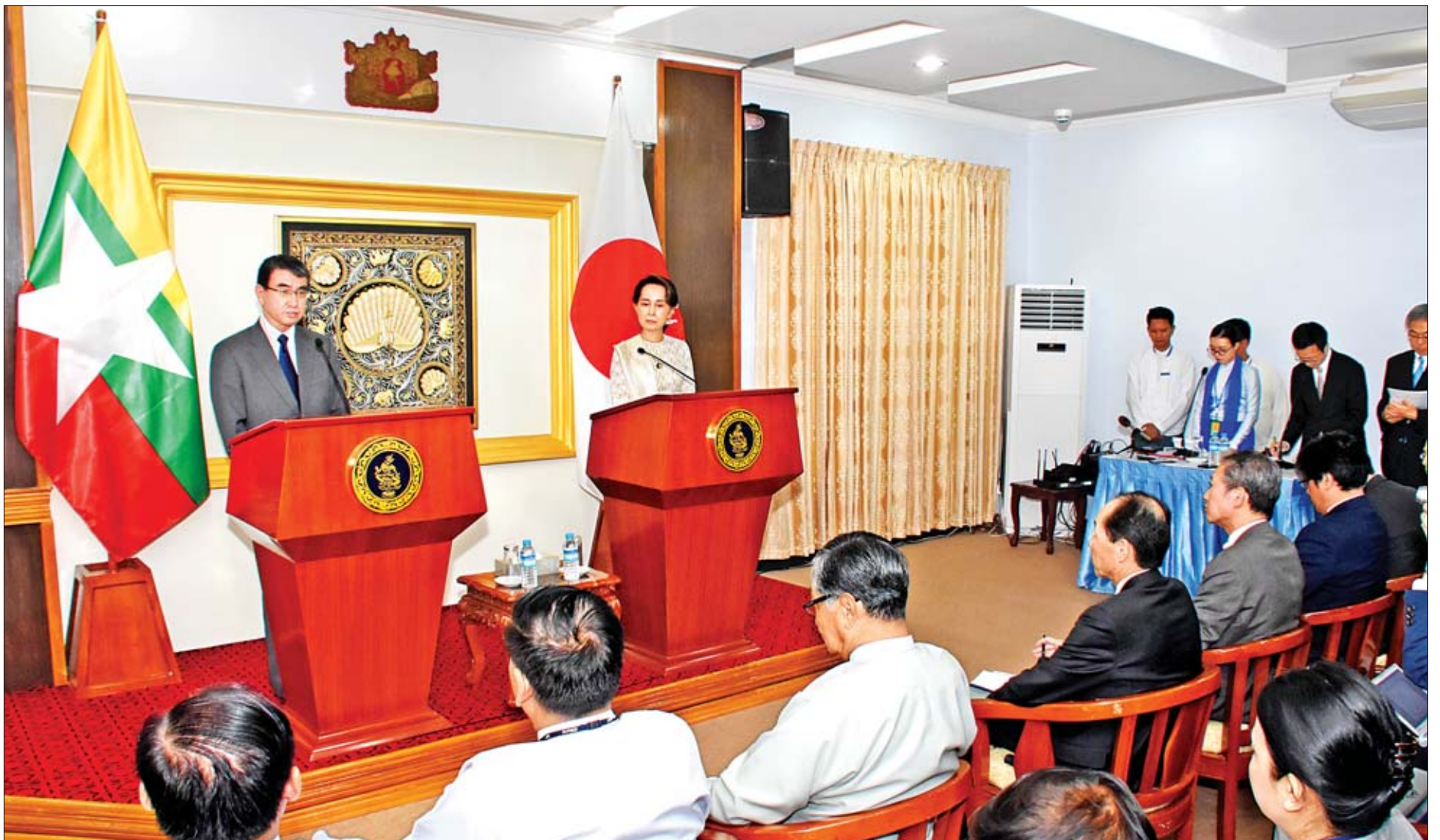
နိုင်ငံတော်၏ အတိုင်ပင်ခံပုဂ္ဂိုလ် ဒေါ်အောင်ဆန်းစုကြည်နှင့် ဂျပန်နိုင်ငံခြားရေးဝန်ကြီး မစ္စတာ တာရိုခိုနိုတို့ နှစ်နိုင်ငံပူးတွဲသတင်းစာရှင်းလင်းပွဲ ကျင်းပစဉ်။

ဂျပန်နိုင်ငံခြားရေးဝန်ကြီး မစ္စတာ တာရိုခိုနို