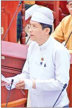
ဒုတိယဝန်ကြီး ဒေါက်တာထွန်းနိုင်