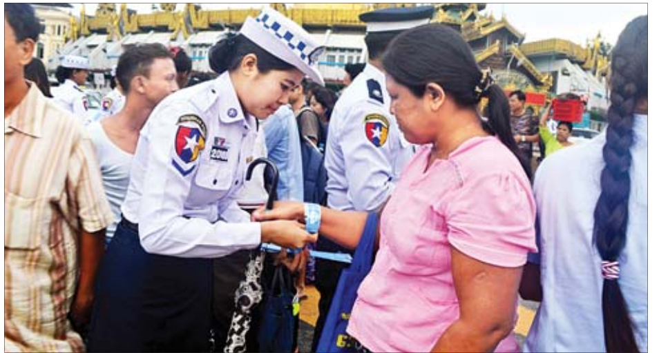
မြန်မာနိုင်ငံယာဉ်ထိန်းရဲတပ်ဖွဲ့က ပြည်သူများ ယာဉ်အန္တရာယ်ကင်းရှင်းရေးအတွက် ရောင်ပြန်လက်ပတ်များ ပေးဝေနေစဉ်။

“မြန်မာနိုင်ငံ ယာဉ်ထိန်းရဲတပ်ဖွဲ့ အနေနဲ့ ယာဉ်မတော်တဆမှု တွေ လျော့နည်းကျဆင်းအောင် စာမျက်နှာ ၁၁ ကော်လံ ၅ သို့ ❖