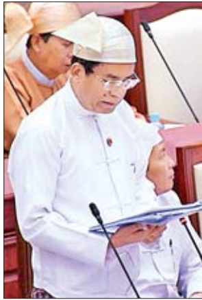
ဒုတိယဝန်ကြီး ဦးအောင်လှထွန်း