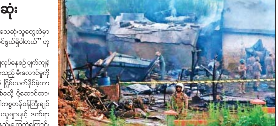
မီးလောင်မှုဖြစ်ပွားခဲ့ရာ လူ ၄၀ ကျော် သေဆုံး ခဲ့သည်။ ထို့အပြင် ၂၀၁၀ ပြည့်နှစ်တွင် ကရာ ချီမြို့မှ ထွက်ခွာပျံသန်းလာသည့် လေယာဉ် တစ်စင်းသည် အစ္စလာမာဘတ်မြို့အပြင် ဘက် တောင်ကုန်းဒေသ၌ ပျက်ကျခဲ့ရာ ၁၅၂ ဦး သေဆုံးခဲ့ကြောင်း သိရသည်။ ကိုးကား - အေအက်စ်ပီ ဘာသာပြန် - ဂျေတီ

အရှိန်ပြင်းတဲ့အတွက် မကယ်တင်နိုင်ခဲ့ပါဘူး။ သေဆုံးသူတွေထဲမှာ မိသားစုဝင်ခုနစ်ဦး ပါဝင်တဲ့ မိသားစုတစ်ခု ပါဝင်ဖွယ်ရှိပါတယ်” ဟု မျက်မြင်သက်သေတစ်ဦးက ဆိုသည်။ အဆိုပါ လေယာဉ်သည် ပုံမှန်လေ့ကျင့်မှု ပြုလုပ်နေစဉ် ပျက်ကျခဲ့ ခြင်းဖြစ်ပြီး လေယာဉ်ပျက်ကျမှုကြောင့် ဖြစ်ပွားသည့် မီးလောင်မှုကို ကူညီကယ်ဆယ်ရေးလုပ်သားများက အချိန်မီ ငြိမ်းသတ်နိုင်ခဲ့ကာ ဒဏ်ရာရရှိသူများကို ဒေသဆိုင်ရာ ဆေးရုံတစ်ခုသို့ ပို့ဆောင်ထား ကြောင်း သိရသည်။ တစ်ဆက်တည်းမှာပင် ပါကစ္စတန်ဝန်ကြီးချုပ် အီမရန်ခန်က လေယာဉ်ပျက်ကျမှု၌ သေဆုံးသူများနှင့် ဒဏ်ရာ ရရှိသူများ၏ မိသားစုနှင့် ထပ်တူထပ်မျှ ဝမ်းနည်းကြေကွဲကြောင်း တွစ်တာစာမျက်နှာပေါ်တွင် ရေးသားဖော်ပြထားသည်။ ထို့အတူ ၂၀၁၆ ခုနှစ်က ပါကစ္စတန် အပြည်ပြည်ဆိုင်ရာ လေကြောင်းလိုင်းမှ လေယာဉ်တစ်စင်းသည် နိုင်ငံ၏ မြောက်ဘက်မှ ကရာချီမြို့သို့ ဦးတည်ထွက်ခွာနေစဉ် စက်ချွတ်ယွင်းမှုကြောင့်