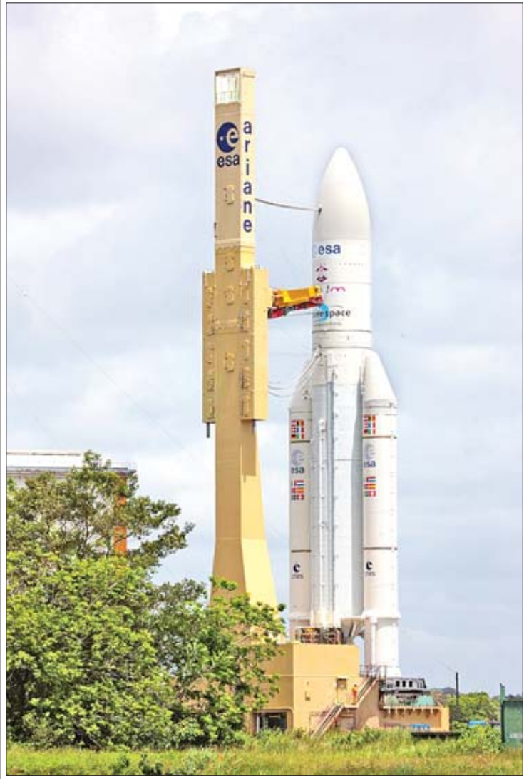
Ariane 5 ဒုံးပျံကို တွေ့ရစဉ်။

ဖြေ ။ နောက်ဆုံးပေါ် နည်းပညာ အသုံးပြုထားတဲ့ Myanmar Sat 1 ထက် အဆ ရှစ်ဆမှ ၁၀ ဆအထိ ပိုကောင်းတဲ့ အတွက် အရည်အသွေးမြင့်တဲ့ ဆက်သွယ်မှုတွေ ရရှိနိုင်ပါတယ်။ စာမျက်နှာ ၉ သို့ >>>