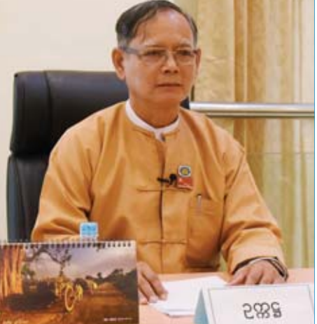
ဦးအောင်မင်း ပြည်သူ့လွှတ်တော်၊ ပြည်သူ့ငွေစာရင်းကော်မတီဥက္ကဋ္ဌ၊ ပြည်ထောင်စုလွှတ်တော်၊ ပြည်သူ့ငွေစာရင်းပူးပေါင်း ကော်မတီ ဒုတိယဥက္ကဋ္ဌ (၁)

ပြည်ထောင်စုလွှတ်တော်က တာဝန်ပေးအပ်သော ငွေစာရင်းဆိုင်ရာကိစ္စရပ်များနှင့်စပ်လျဉ်း၍ ဆောင်ရွက် နိုင်ရေးအတွက် ပြည်ထောင်စုလွှတ်တော်၏ သဘော တူညီချက်ဖြင့် ပြည်ထောင်စုလွှတ်တော်နယ်လွှတ်တော် ပြည်သူ့လွှတ်တော်နှင့် အမျိုးသားလွှတ်တော်တို့ရှိ ပြည်သူ့ငွေစာရင်းကော်မတီတို့တွင်ပါဝင်သော ကော်မတီ ဝင် ဦးရေတူညီစွာဖြင့် ပြည်သူ့ငွေစာရင်းပူးပေါင်း ကော်မတီကို ဖွဲ့စည်းခဲ့သည်။