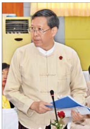
ပြည်ထောင်စုဝန်ကြီး ဒေါက်တာမျိုးသိမ်းကြီး

ဖွံ့ဖြိုးမှုလိုအပ်ချက်များ ထည့်သွင်း ကမ္ဘာ့နိုင်ငံ အားလုံးတွင်လည်း နိုင်ငံတကာကတိကဝတ်များနှင့်အညီ စဉ်ဆက်မပြတ် ဖွံ့ဖြိုးမှုပန်းတိုင်များကို အကောင်အထည်ဖော်ဆောင်ရွက် ရှိသကဲ့သို့ မိမိတို့နိုင်ငံ၏အခြေအနေ နှင့်လျော်ညီသည့် ဖွံ့ဖြိုးမှုလိုအပ်ချက် များကိုထည့်သွင်းထားသည့် မြန်မာ နိုင်ငံ၏ ရေရှည်တည်တံ့ခိုင်မြဲပြီး ဟန်ချက်ညီသော ဖွံ့ဖြိုးတိုးတက်မှု စီမံကိန်း(MSDP)(၂၀၁၈-၂၀၃၀)