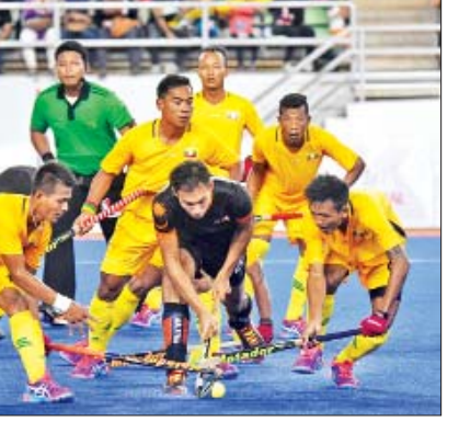
မြန်မာအမျိုးသားဟော်ကီအသင်း ၂၀၁၇ ဆီးဂိမ်းပြိုင်ပွဲတွင် ယှဉ်ပြိုင်နေစဉ်။

ပြိုင်ပွဲအကြိုပြင်ဆင်မှုများ ပြုလုပ် လျက်ရှိသည်။ ဆီးဂိမ်းပြိုင်ပွဲကို နိုဝင်ဘာ ၃၀ ရက်မှ ဒီဇင်ဘာ ၁၁ ရက် အထိ ကျင်းပမည်ဖြစ်ပြီး ဘောလုံး အပါအဝင် အားကစားနည်းအချို့ကို ဖွင့်ပွဲကျင်းပမည့်ရက်ထက် စော၍ ကျင်းပမည်ဖြစ်သည်။ ယခုနှစ်ဆီးဂိမ်း ပြိုင်ပွဲတွင် အားကစားနည်း ၅၆ မျိုး ထည့်သွင်းကျင်းပမည်ဖြစ်ပြီး ပြိုင်ပွဲ သမိုင်းတစ်လျှောက် အားကစားနည်း အများဆုံးပြိုင်ပွဲ ဖြစ်လာမည်ဖြစ် သည်။ ဖိလစ်ပိုင် အိုလံပစ်ကော်မတီ ၏ ထုတ်ပြန်မှုအရ အားကစားပြိုင်ပွဲ များကို မနီလာ၊ ဆူဘစ်နှင့် Clark မြို့တို့၌ အဓိက ကျင်းပမည်ဖြစ်ပြီး အခြားမြို့များတွင်လည်း ကျင်းပရန် စီစဉ်ထားသည်။ ဖွင့်ပွဲအခမ်းအနားကို မနီလာ၊ ပိတ်ပွဲအခမ်းအနားကို Clark မြို့၌ ကျင်းပမည်ဖြစ်ပြီး ဖိလစ်ပိုင် အိုလံပစ်ကော်မတီ၏ ထုတ်ပြန်မှုအရ အားကစားနည်းများအဖြစ် မနီလာ မြို့၌ ကြက်တောင်၊ ဘိုးလင်း၊ ဘတ်စ ကက်ဘော၊ E-Sports ၊ လက်ဝှေ့၊ ပဏာမကစားသမားများ ရွေးချယ် ကျွမ်းဘား၊ အလေးမတိုက်ကွမ်းခို၊