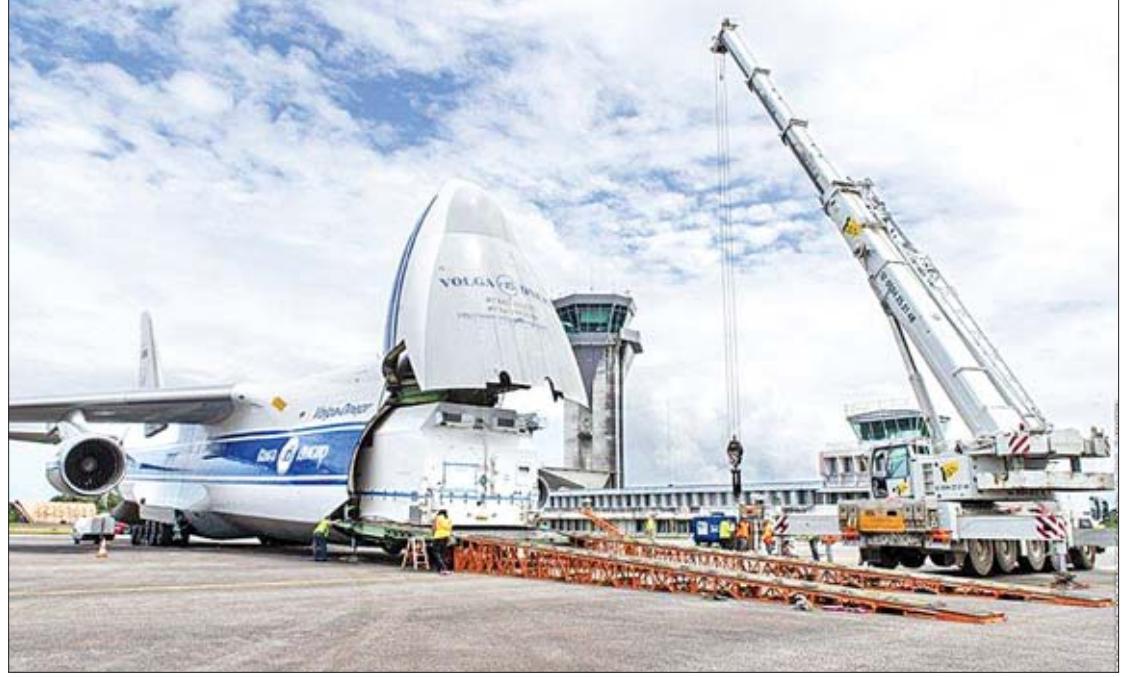
Myanmar Sat 2 ပါဝင်သည့် Intelsat 39 ဂြိုဟ်တု ပြင်သစ်ဂီယာနာသို့ ရောက်ရှိလာသည်ကို တွေ့ရစဉ်။