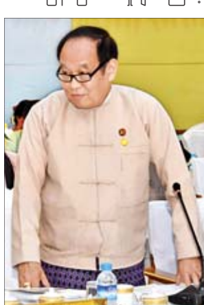
ပြည်ထောင်စုဝန်ကြီး ဒေါက်တာမြင့်ထွေး

ကိစ္စများနှင့်စပ်လျဉ်း၍ သက်ဆိုင်ရာ ဝန်ကြီးဌာနများ၏ ပူးပေါင်းပါဝင် မှုသည် များစွာအရေးကြီးပါကြောင်း၊ စာရင်းအင်းထုတ်ပြန်ရာ၌ ညီညွတ်မျှ တသောစာရင်းဖြစ်စေရန် စာရင်း ကောက်ယူ စုဆောင်းရာတွင် Definition ၊ Concepts များတူညီရန် လိုအပ်သည့်အတွက် ဌာနအချင်းချင်း စာရင်းအင်းအချက် အလက်များကို မျှဝေအသုံးပြု၍ ညှိနှိုင်းပူးပေါင်းဆောင်ရွက်သွားကြ ရန် မှာကြားလိုပါကြောင်း။