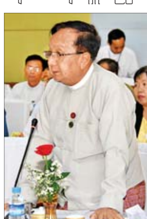
ပြည်ထောင်စုဝန်ကြီး ဦးဟန်ဇော်

အရည်အသွေးပြည့်ဝ၍ တိကျမှန် ကန်သော စာရင်းအင်းများကို ရရှိ အသုံးပြုနိုင်ခြင်းအားဖြင့် အစိုးရနှင့် ပြည်သူများအကြား၊ နိုင်ငံတကာ အသိုင်းအဝိုင်းများအကြား ယုံကြည် မှုတိုးမြှင့်စေနိုင်ပါကြောင်း၊ နိုင်ငံ တစ်နိုင်ငံ၏ အမျိုးသားစာရင်းအင်း စနစ်အရည်အသွေးပြည့်ဝမှုသာ စီမံ ကိန်းရေးဆွဲသူများ၊ ပုဂ္ဂလိကလုပ်ငန်း ရှင်များ၊ လူမှုစီးပွားသုတေသန ဆောင်ရွက်သူများ အားလုံးအနေ ဖြင့် မူဝါဒများချမှတ်နိုင်ရန် ထည့်သွင်း စဉ်းစားရာတွင် မှန်ကန်တိကျသော ဖောက်ပြန်ပြောင်းလဲမှုများကြောင့်