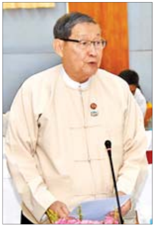
ပြည်ထောင်စုဝန်ကြီး ဦးစိုးဝင်း