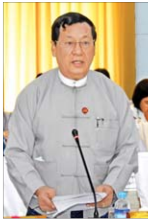
ပြည်ထောင်စုဝန်ကြီး ဦးသိန်းဆွေ

★ ရှေ့မှ သက်ဆိုင်ရာ လုပ်ငန်းအဖွဲ့များနှင့် ပူးပေါင်း၍ NSDS Action Plan ကို Living Document အနေဖြင့် ထားရှိပြီး အသီးသီးအကောင်အထည် ဖော်ဆောင်လျက်ရှိသည်ကို သိရှိရပါ ကြောင်း၊ ယင်းကိစ္စများဆက်လက် ဆောင်ရွက်ရမည့် Clusters အဖွဲ့ဝင် များ အချင်းချင်းပူးပေါင်းဆောင်ရွက် မှုပိုမိုအားကောင်းလာသည်ကို တွေ့ရှိ ရပါကြောင်း။