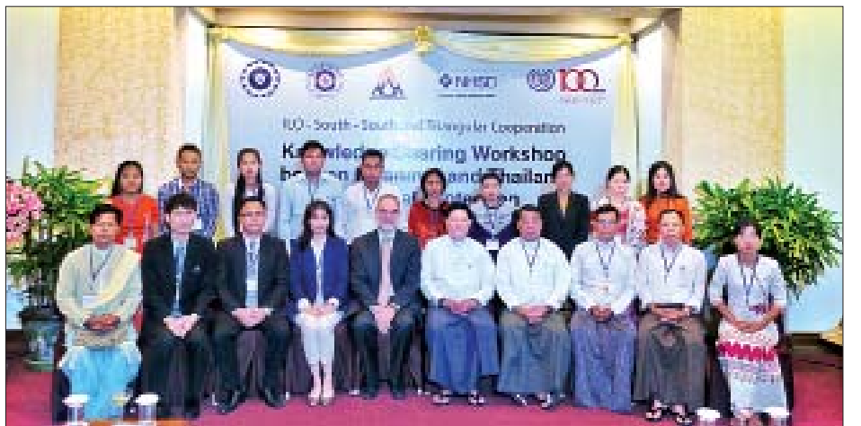
အလုပ်ရုံဆွေးနွေးပွဲ တက်ရောက်လာသူများ မှတ်တမ်းတင်ဓာတ်ပုံရိုက်စဉ်။

နေပြည်တော် ဇူလိုင် ၃၀ အလုပ်သမား၊ လူဝင်မှုကြီးကြပ်ရေးနှင့် ပြည်သူ့အင်အားဝန်ကြီးဌာန လူမှုဖူလုံရေးအဖွဲ့နှင့် ILO တို့ ပူးပေါင်း၍ South - South and Triangular Cooperation အစီအစဉ်အရ Knowledge Sharing Workshop between Myanmar and Thailand on Social Protection အလုပ်ရုံဆွေးနွေးပွဲ ဖွင့်ပွဲအခမ်းအနားကို ဇူလိုင် ၂၉ ရက် နံနက်ပိုင်းက နေပြည်တော်ရှိ သင်္ဘောတပ်တန်း ကျင်းပသည်။