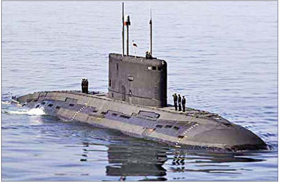
မြန်မာနိုင်ငံသို့ လွှဲပြောင်းပေးမည့် Sindhuvir ရေငုပ်သင်္ဘောအား တွေ့ရစဉ်။

အိန္ဒိယ-မြန်မာ ကာကွယ်ရေးကဏ္ဍ ပူးပေါင်းဆောင်ရွက်မှုများကို မြှင့်တင်ရန်နှင့် ပင်လယ်ရေကြောင်းဆိုင်ရာ လုံခြုံစိတ်ချရမှုအတွက် နှစ်နိုင်ငံစောင့်ကြည့်ထောက်လှမ်းမှုများအပါအဝင် ကာကွယ်ရေးလက်နက် အဆင့်မြှင့်တင်မှုများနှင့်ပတ်သက်ပြီး ကာကွယ်ရေးဦးစီးချုပ် ဗိုလ်ချုပ်မှူးကြီး မင်းအောင်လှိုင်နှင့် အိန္ဒိယအရှေ့ပိုင်းတိုင်း ရေတပ်စစ်ဌာနချုပ် ဒုတိယရေတပ်ဗိုလ်ချုပ်ကြီးတို့က ဆွေးနွေးခဲ့ကြသည်ဟု အိန္ဒိယကာကွယ်ရေးဝန်ကြီးဌာနက ဆိုသည်။