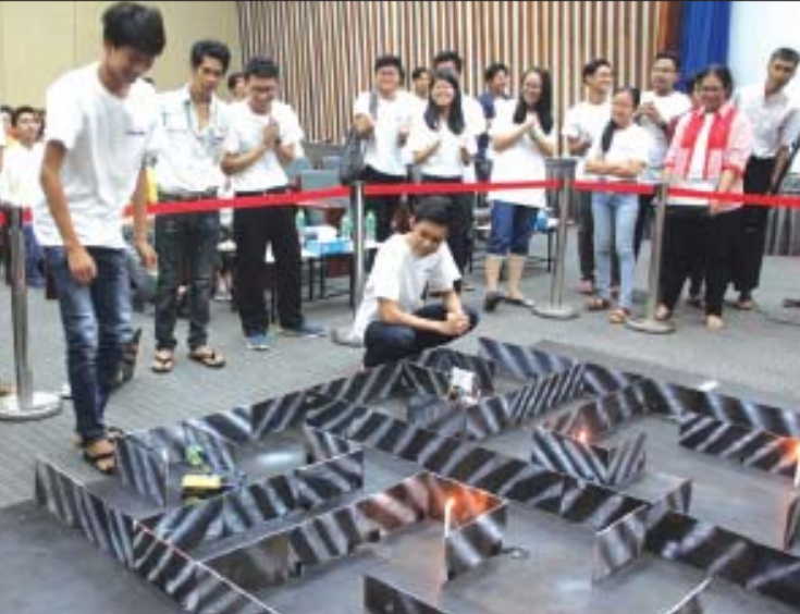
APT Young Professional and Students Programme 2018 Myanmar Robotic Competition စက်ရုပ်ပြိုင်ပွဲတွင် နည်းပညာတက္ကသိုလ်မှပြိုင်ပွဲဝင်များ ဝင်ရောက်ယှဉ်ပြိုင်နေကြသည်ကို တွေ့ရစဉ်။

အိုင်တီ ကျောင်းသား ကျောင်းသူများနှင့် အိုင်တီပညာရှင်တို့၏ အရည်အချင်းကို ဖော်ထုတ်ရန်၊ မြန်မာနိုင်ငံတွင် အိုင်တီပညာရပ်အား စိတ်ဝင်စားသူ တိုးပွားလာစေရန်၊ အိုင်တီကျောင်းသား ကျောင်းသူများနှင့် ပညာရှင်များအချင်းချင်း နေရာတစ်နေရာတည်းတွင် တွေ့ဆုံ၍ အသိပညာများ ဆွေးနွေးဖလှယ်နိုင်စေရန် နှင့် Robotic Logical Thinking ရင်းနှီးကျွမ်းဝင်စေရန်၊ ကျောင်းသား ကျောင်းသူများနှင့် ပညာရှင်များအနေဖြင့် Robot ပြိုင်ပွဲမှ တစ်ဆင့် ဂျပန်နိုင်ငံမှ အိုင်တီပညာရှင်များ၊ အိုင်တီကုမ္ပဏီကြီးများနှင့် အချိတ်အဆက် ရရှိပြီး အနာဂတ်တွင် ကောင်းမွန်သော အလုပ်အကိုင်အခွင့်အလမ်းများ ရရှိစေရန်အတွက် အဆိုပါပြိုင်ပွဲကို စီစဉ်ကျင်းပခြင်း ဖြစ်ကြောင်း Myanmar IT Contest ပြိုင်ပွဲအား စီစဉ်သည့် တာဝန်ရှိသူက ပြောကြားသည်။ ပွင့်သဗ္ဗာ