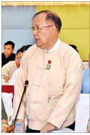
ပြည်ထောင်စုဝန်ကြီး ဦးသန်းစင်မောင်