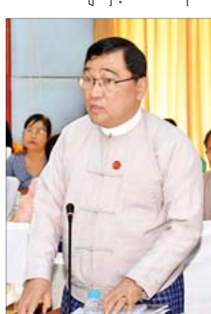
ပြည်ထောင်စုဝန်ကြီး ဒေါက်တာဝင်းမြတ်အေး

အလိုက် စာရင်းအင်းကဏ္ဍဖွံ့ဖြိုးတိုး တက်မှုအတွက် ဆောင်ရွက်ခဲ့မှု လုပ်ငန်းများနှင့်စပ်လျဉ်း၍ အသေး စိတ် ရှင်းလင်းတင်ပြသည်။ ထို့နောက် ဗဟိုကော်မတီအဖွဲ့ဝင် များဖြစ်ကြသည့် ပြည်ထောင်စုဝန် ကြီး ဦးသန်းစင်မောင်၊ ဦးသိန်းဆွေ၊ ဒေါက်တာမျိုးသိမ်းကြီး၊ ဒေါက်တာ မြင့်ထွေး၊ ဦးဟန်ဇော်နှင့် ဒေါက်တာ ဝင်းမြတ်အေး၊ ဒုတိယဝန်ကြီးများ၊ နေပြည်တော်ကောင်စီဝင်၊ တိုင်းဒေ သကြီးနှင့် ပြည်နယ်ဝန်ကြီးများ၊ စာရင်းအင်းဆိုင်ရာ လုပ်ငန်းအဖွဲ့ ခေါင်းဆောင်များနှင့် တက်ရောက်