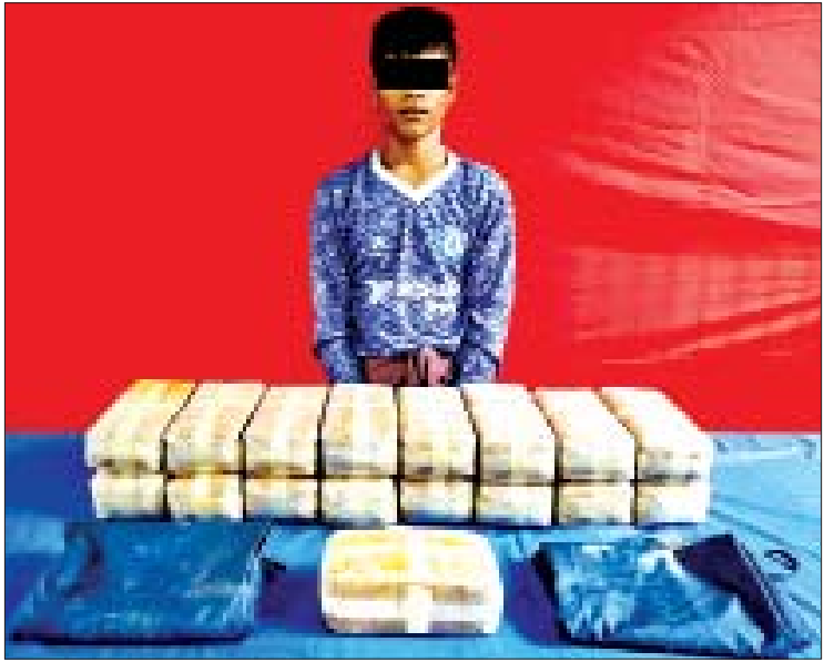
အူမောရီဖာရုပ်ကို သိမ်းဆည်းရမိသည့် စိတ်ကြွဆေးပြားများနှင့်အတူ တွေ့ရစဉ်။

ထို့အတူ ယင်းနေ့ မွန်းလွဲ ၂ နာရီခွဲက တစ်မတော်နှင့် မူးယစ်တစ်ဖွဲ့(၃၀)တာချီ လိတ်မှ တစ်ဖွဲ့ဝင်များ ပါဝင်သောပူးပေါင်းအဖွဲ့ သည် မိုင်းယောင်းမြို့နယ် မုန်းလိုက်ကျေးရွာ အုပ်စု ဝမ်းကျေးရွာတံတားတွင် ဂျောလေ မောင်းနှင်ပြီး မနာလောဘို လိုက်ပါလာသည့် မော်တော်ဆိုင်ကယ်ကို ရပ်တန့်ရှာဖွေရာ စိတ်ကြွဆေးပြား ၁၉၈၀၀ နှင့် လက်ကိုင်ဖုန်း