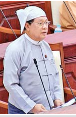
ပြည်ထောင်စုဝန်ကြီး ဦးသိန်းဆွေ

ကျိုင်းတုံမဲဆန္ဒနယ်မှ ဦးစတီဖန်၏ “မိုင်းလားမြို့နယ်၊ ဝမ်နောင်လုံအုပ်စုအတွင်းရှိ ဝမ်နောင်လေးကျေးရွာ၊ ဝမ်လောက်ကျေးရွာနှင့် အနီးအနားရှိကျေးရွာများကို မိုင်းခတ်မြို့နယ်အတွင်း ပြန်လည်ထည့်သွင်းဖွဲ့စည်းပေး နိုင်ရန်နှင့် ၎င်းကျေးရွာသူ၊ ကျေးရွာသားများအတွက် အိမ်ထောင်စုစာရင်းများ၊ နိုင်ငံသားစိစစ်ရေးကတ်ပြားများ ပြုလုပ်ပေးရန် အစီအစဉ် ရှိ၊ မရှိ” မေးခွန်းနှင့်စပ်လျဉ်း၍ အလုပ်သမား၊ လူဝင်မှုကြီးကြပ်ရေးနှင့်ပြည်သူ့အင်အား ဝန်ကြီးဌာန ပြည်ထောင်စုဝန်ကြီး ဦးသိန်းဆွေက ကျိုင်းတုံခရိုင် မိုင်းခတ်မြို့၊ ဝမ်နောင်လုံကျေးရွာအုပ်စု အတွင်းရှိ ကျေးရွာ(၄) ရွာသည် အထူးဒေသ-၄ မိုင်းလား ဒေသအုပ်ချုပ်မှုအောက်တွင်ရှိခြင်း၊ လုံခြုံရေးအရ ကန့်သတ်နယ်မြေဖြစ်ခြင်းတို့ကြောင့် ရှမ်းပြည်နယ်အစိုးရ အဖွဲ့မှ အထူးဒေသ(၄) မိုင်းလားဒေသတာဝန်ရှိသူများနှင့် ညှိနှိုင်းဆောင်ရွက်ပေးသွားမည်ဖြစ်ကြောင်း ရှင်းလင်း ပြောကြားသည်။