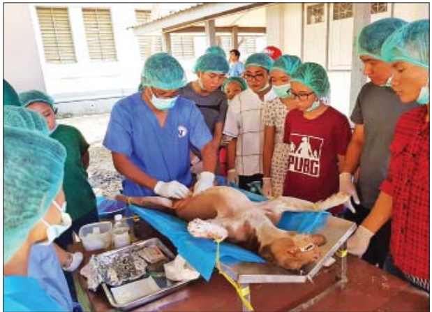
ခွေးရူးရောဂါအန္တရာယ် နည်းပါးလာစေရေး၊ ထူးချွန်ထက်မြက်သော မျိုးဆက်သစ် တိရစ္ဆာန်ဆရာဝန်များ ပေါ်ထွက်လာစေရေးစသော ရည်ရွယ်ချက်များနှင့် တည်ထောင်ခဲ့ခြင်းဖြစ်ကြောင်း၊ အဖွဲ့ဝင် ၂၉ ဦး ရှိပြီး ဆရာဝန် တစ်ဦး

ရန်ကုန် ဇူလိုင် ၂၉ ရန်ကုန်တက္ကသိုလ် ပရဝဏ်အတွင်းရှိ လေလွင့်ခွေးများအနက်မှ အထီးများကို ခွဲစိတ်သင်္ကေတပြုခြင်း၊ အမများအား ခွဲစိတ်သားအိမ်ထုတ်ပြီး မျိုးဆက်ပြန့်ပွားမှု ထိန်းချုပ်ခြင်း၊ ခွေးရူးရောဂါ ကာကွယ်ဆေးထိုးပေးခြင်းတို့ကို တိရစ္ဆာန်ဆေးကုဆရာဝန်များ ပရဟိတအဖွဲ့ (Infinity Vets Myanmar) (ရန်ကုန်) မှ ဆရာဝန်များက ဇူလိုင် ၂၈ ရက်တွင် လုပ်ဆောင်ပေးခဲ့ကြသည်။ ရန်ကုန်တက္ကသိုလ် ဆရာများသမဂ္ဂ၏ မေတ္တာရပ်ခံချက်နှင့် ရန်ကုန်တက္ကသိုလ် ပါမောက္ခချုပ်၏ အကူအညီတောင်းခံခဲ့မှုကြောင့် တိရစ္ဆာန်ဆေးကုဆရာဝန်များ၊ ပရဟိတအဖွဲ့မှ ဆရာဝန်များက ဆောင်ရွက်ပေးခဲ့သည်မှာ ယခုအပတ်နှင့်ဆိုလျှင် ပဉ္စမမြောက် သီတင်းပတ်ရှိပြီဖြစ်ကြောင်း၊ ယခု သီတင်းပတ်တွင် ခွေးထီး ၃၅ ကောင် သင်းကွတ်ခြင်း၊ ခွေးမအကောင် ၆၀ ကို ခွဲစိတ်ပြီး သားအိမ်ထုတ်ခြင်း၊ ၁၀၅ ကောင်ကို ခွေးရူးကာကွယ်ဆေးထိုးခြင်း တို့ ဆောင်ရွက်ပေးခဲ့ကြောင်း ဆရာဝန်တစ်ဦးက ပြောသည်။ တိရစ္ဆာန်ဆေးကု ဆရာဝန်များပရဟိတအဖွဲ့ကို ၂၀၁၆ ခုနှစ် အောက်တိုဘာ ၁ ရက်မှစတင်ဖွဲ့စည်းခဲ့ပြီး လေလွင့်ခွေးအရေအတွက် တိုးပွားလာခြင်း မရှိစေရန် ထိန်းချုပ်ခြင်းဖြင့် သဘာဝပတ်ဝန်းကျင်ကို ထိန်းသိမ်းခြင်း၊