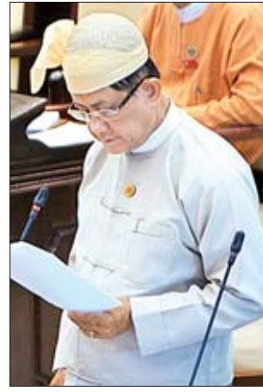
ဒုတိယဝန်ကြီး ဦးမောင်မောင်ဝင်း