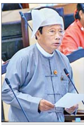
ဒုတိယဝန်ကြီး ဦးလှကျော်