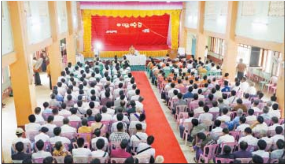
အောင်ဌေး (မလိုင်)

ဒေသကြီးအစိုးရအဖွဲ့အနေဖြင့် ကျေးလက်နေပြည်သူတို့၏ လူမှုစီးပွားဘဝ ဖွံ့ဖြိုးတိုးတက်အောင်၊ နိုင်ငံတော်ဘတ်ဂျက်များကို စနစ်တကျ စိစစ်ခွဲဝေချထားပေးထားကြောင်း၊ ဘတ်ဂျက်များချထားပေးရာတွင်လည်း ပြည်သူကိုအကျိုးပြုသည့် လုပ်ငန်းများဖြစ်ဖို့ အဓိကထားပါကြောင်း ပြောကြားသည်။ ယင်းနောက် တက်ရောက်လာသော ဒေသခံပြည်သူများက ကျေးလက်လမ်းများ အဆင့်မြှင့်တင်ပေးရေး၊ လျှပ်စစ်မီးလင်းရေး၊ မုရိုးတိုက်နယ်ဆေးရုံ ဝန်ထမ်းချထားပေးရေး၊ ရေရရှိရေး၊ ဆရာ ဆရာမ လုံလောက်စွာရရှိရေးနှင့် မြေယာကိစ္စများကို တင်ပြခဲ့ကြရာ တိုင်းဒေသကြီးဝန်ကြီးချုပ်နှင့် တိုင်းဒေသကြီးဝန်ကြီးများက ပြန်လည်ရှင်းလင်းခဲ့ကြောင်း သိရသည်။