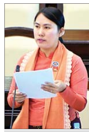
မွန်ပြည်နယ် မဲဆန္ဒနယ် အမှတ်(၅)မှ ဒေါ်မြတ်သီတာထွန်း

များအတွက် ရေဘောက်ဆာ ကားတစ်စီးစီ ချထားပေးရန် အစီအစဉ် ရှိ၊ မရှိ မေးခွန်း။ ဧရာဝတီတိုင်းဒေသကြီး မဲဆန္ဒနယ်အမှတ်(၈)မှ ဒေါ်အိအိပြုံး၏ ဧရာဝတီတိုင်း ဒေသကြီး မအူပင်မြို့နယ်တွင် ကျေးကျွဲနေသူများအား အောင်ချမ်းသာ အိမ်ရာနေရာနှင့် ဆက်စပ်နေရာများတွင် သာ ထားရှိရန်နှင့် အခြားလယ်ယာမြေနေရာများတွင် အကွက်ရိုက်ရောင်းချနေသည့် တာဝန်ရှိသူများအား မည်ကဲ့သို့ အရေးယူဆောင်ရွက်မည်ကို သိရှိလိုကြောင်း မေးခွန်းတို့နှင့်စပ်လျဉ်း၍ စီမံကိန်းနှင့်ဘဏ္ဍရေးဝန်ကြီး ဌာန ဒုတိယဝန်ကြီး ဦးမောင်မောင်ဝင်းနှင့် စိုက်ပျိုးရေး၊ မွေးမြူရေးနှင့်ဆည်မြောင်းဝန်ကြီးဌာန ဒုတိယဝန်ကြီး ဦးလှကျော်တို့က ပြန်လည်ရှင်းလင်းဖြေကြားခဲ့ကြသည်။ အခြေခံပညာရေးဥပဒေကြမ်းနှင့်စပ်လျဉ်း၍ ဆွေးနွေး ထို့နောက် အခြေခံပညာရေးဥပဒေကြမ်းနှင့် စပ်လျဉ်း၍ ရန်ကင်းတိုင်းဒေသကြီး မဲဆန္ဒနယ်အမှတ်(၁၁) မှ ဦးအေးဦးနှင့် မကွေးတိုင်းဒေသကြီး မဲဆန္ဒနယ်အမှတ် (၈)မှ ဦးဝင်းမြင့်တို့က ပြင်ဆင်၊ ဖြည့်စွက်လိုသည့် အပိုဒ်၊ အပိုဒ်ခွဲများနှင့် အကြောင်းအရာများကို ဆွေးနွေးတင်ပြကြ သည်။