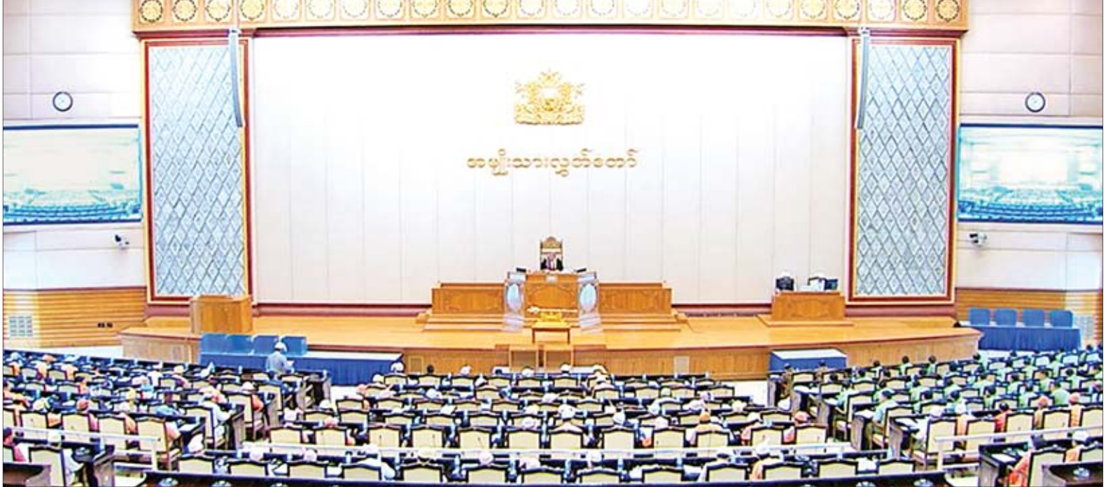
ဒုတိယအကြိမ် အမျိုးသားလွှတ်တော် (၁၃)ကြိမ်မြောက် ပုံမှန်အစည်းအဝေး ပဉ္စမနေ့ ကျင်းပစဉ်။

စစ်ကိုင်းတိုင်းဒေသကြီး မဲဆန္ဒနယ် အမှတ်(၄)မှ ဦးလှဦး၏ စစ်ကိုင်းတိုင်းဒေသကြီး ဝန်ကြီးချုပ် ဦးကျော်စွာ၊ စီးပွားရေးဘဏ်ကို ကျယ်ဝန်းသည့် နေရာသို့ဖြစ်စေ၊ ဘဏ်ခွဲတစ်ခု ဖွင့်လှစ်ခြင်းဖြစ်စေ ဆောင်ရွက်ပေးရန် အစီအစဉ် ရှိ မရှိ မေးခွန်းနှင့်စပ်လျဉ်း၍ စီမံကိန်းနှင့် ဘဏ္ဍာရေးဝန်ကြီးဌာန ဒုတိယဝန်ကြီး ဦးမောင်မောင်ဝင်းက စာမျက်နှာ ၅ ကော်လံ ၁ သို့ ❖