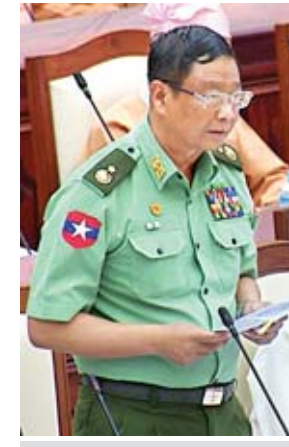
ဒုတိယဝန်ကြီး ဗိုလ်ချုပ်အောင်သူ