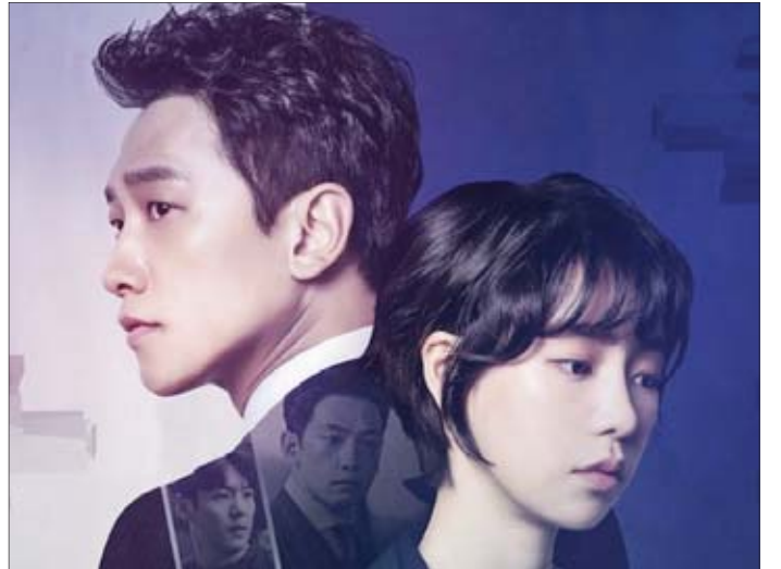
တယ်။ ဒီဇာတ်လမ်းတွဲမှာတော့ ရှေ့နေနဲ့ စုံထောက်နှစ်ဦးအကြားက အချစ်ဇာတ်လမ်း ကိုလည်း တွေ့မြင်ခံစားရမှာဖြစ်ပါတယ်။

လင်ဂျီယွန်းကတော့ စုံထောက်တစ်ဦးအဖြစ် ပါဝင်သရုပ်ဆောင်ထားပြီး သူဟာ အဓိကအမှုတစ်ခုမှာ ပါဝင်ဆောင်ရွက်ခွင့်ရရှိတဲ့ တစ်ဦးတည်းသော အမျိုးသမီးစုံထောက် တစ်ဦးလည်း ဖြစ်ပါတယ်။ ဒါ့အပြင် သူဟာလီဂျေဆန်းရဲ့ ချစ်သူဟောင်းလည်း ဖြစ်ပါ