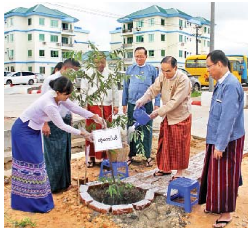
တမလန်း၊ ပိတောက် နှစ်ရှည်ပင်များအပါအဝင် ချဉ်းစသည့် သီးပင်စားပင်များ စုစုပေါင်း ၁၅၇ ပင် ကံကော်၊ ခရေပင်များနှင့် ပိန္နဲ၊ ဒန်သလွန်၊ ကင်ပွန်း စိုက်ပျိုးခဲ့ကြောင်း သိရသည်။ သတင်းစဉ်

နေပြည်တော် ဇူလိုင် ၂၉ တိုင်းရင်းသားလူမျိုးများရေးရာဝန်ကြီးဌာန၏ ၂၀၁၉ ခုနှစ် မိုးရာသီသစ်ပင်စိုက်ပျိုးပွဲ အခမ်းအနား ကို ယနေ့နံနက် ၈ နာရီခွဲတွင် ဝန်ကြီးဌာနမှ ဝန်ထမ်းများနေထိုင်သည့် ဗလသိဒ္ဓိရပ်ကွက် တိုက်အမှတ် (၂၂၁၆) ဝန်ထမ်းအိမ်ရာ ပတ်ဝန်းကျင် ၌ ကျင်းပသည်။ အခမ်းအနားတွင် ပြည်ထောင်စုဝန်ကြီး နိုင်သက်လွင်က မိုးရာသီသစ်ပင်စိုက်ပျိုးပွဲ အထိမ်း အမှတ်အဖြစ် ကံကော်ပင်ကို စိုက်ပျိုးပေးသည်။ ထို့အတူ ဒုတိယဝန်ကြီးက ခရေပင်ကို စိုက်ပျိုးပေး ပြီး ညွှန်ကြားရေးမှူးချုပ်များက သတ်မှတ်နေရာများ တွင် ပျိုးပင်များကို စိုက်ပျိုးပေးကြသည်။ ထို့နောက် အရာထမ်း၊ အမှုထမ်းများက သစ်ပင်ပျိုးပင်များကို သတ်မှတ်နေရာများ၌ စုပေါင်းစိုက်ပျိုးကြရာ ပြည်ထောင်စုဝန်ကြီးနှင့် အဖွဲ့က သစ်ပင်ပျိုးပင်များ စိုက်ပျိုးနေမှုများကို လှည့်လည်ကြည့်ရှု အားပေးကြသည်။ အဆိုပါ စိုက်ပျိုးပွဲသည် အပင်များ ရှင်သန်ဖြစ် ထွန်းရေးအတွက် အိမ်ရာရှိ ဝန်ထမ်းများက အနီး ကပ် တာဝန်ယူ ပြုစုထိန်းသိမ်းနိုင်ရေး တာဝန်ခွဲဝေ ပေးအပ်ထားကြောင်း သိရသည်။ ယနေ့အခမ်းအနားတွင် ကျွန်း၊ ပျဉ်းကတိုး၊