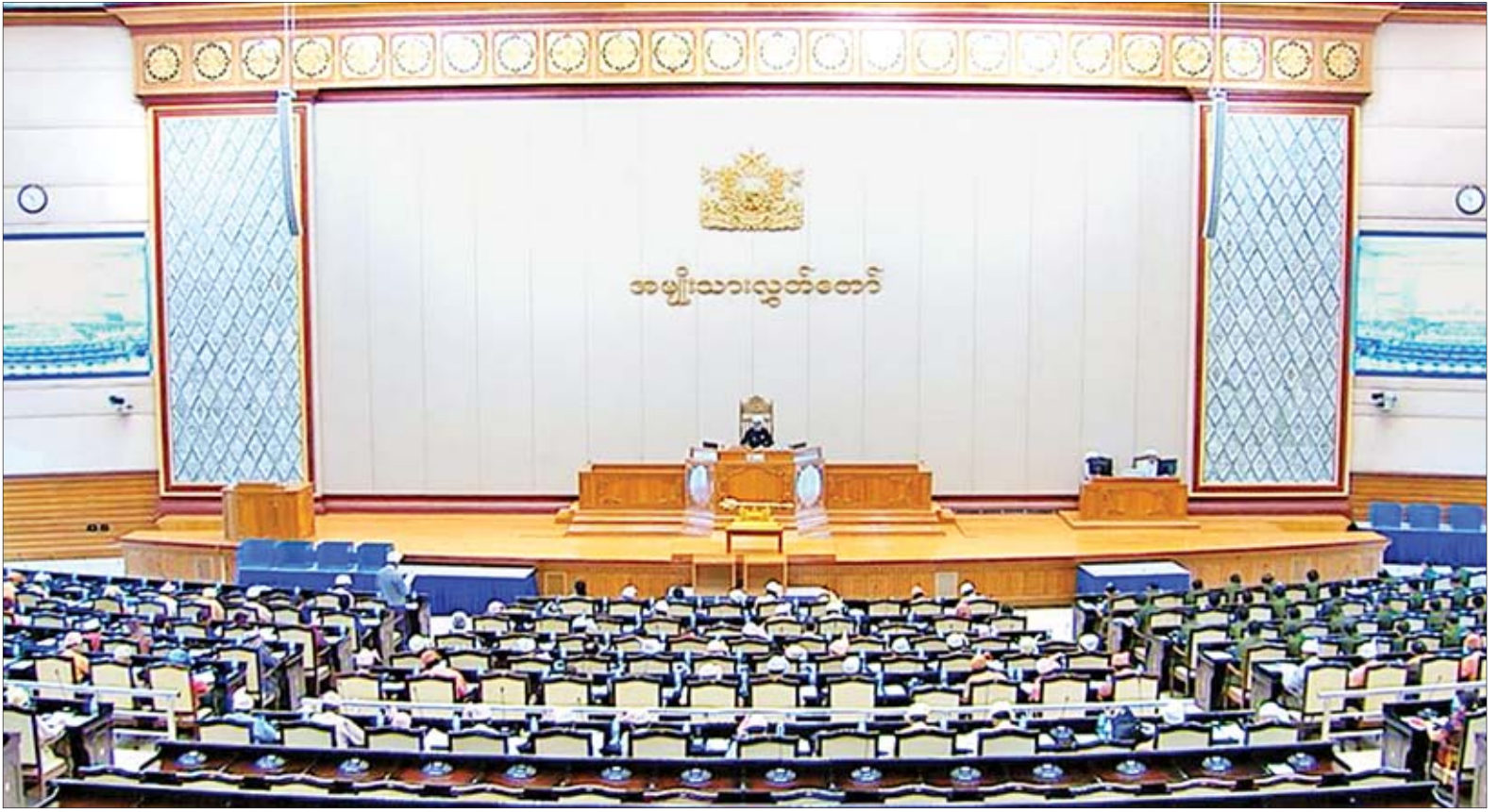
ဒုတိယအကြိမ် အမျိုးသားလွှတ်တော် (၁၃)ကြိမ်မြောက် ပုံမှန်အစည်းအဝေး စတင်နေ့ ကျင်းပစဉ်။

ချင်းပြည်နယ် မဲဆန္ဒနယ်အမှတ် (၃)မှ ဦးဘွဲ့ခိန်း၏ ချင်းပြည်နယ်၊ ထန်တလန်မြို့နယ်ရှိ ထန်တောရ်ချောင်းအား ၂၀၁၉-၂၀၂၀ ဘဏ္ဍာရေးနှစ်တွင် ကွန်ကရစ်တံတားတစ်စင်း တည်ဆောက်ပေးရန် အစီအစဉ် ရှိ မရှိ မေးခွန်းနှင့်စပ်လျဉ်း၍ ဆောက်လုပ်ရေးဝန်ကြီးဌာန ဒုတိယဝန်ကြီး စာမျက်နှာ ၅ ကော်လံ ၁ သို့