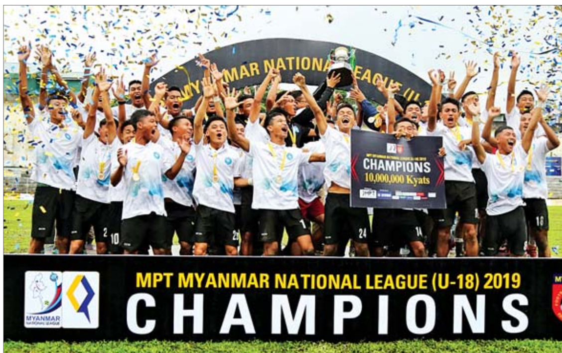
MNL-2 ယူ-၁၈ အမှတ်ပေးပြိုင်ပွဲ ချန်ပီယံ အား / ကာသိပ္ပံအသင်း အောင်ပွဲခံနေစဉ်။

ရန်ကုန် ဇူလိုင် ၂၅ ၂၀၁၉ ဘောလုံးရာသီ MNL-2 ယူ-၁၈ အမှတ်ပေးပြိုင်ပွဲ ပွဲစဉ်(၁၄)ကို ယနေ့ညနေပိုင်းက ကျင်းပရာ အား / ကာသိပ္ပံအသင်းက ရုံးပွဲမရှိဘဲ ချန်ပီယံဆုရခဲ့သည်။ ချန်ပီယံဆုအတွက် အဆုံးအဖြတ်ပွဲတွင် အား / ကာသိပ္ပံအသင်းက မြဝတီအသင်းကို သုံးဂိုးပြတ် အနိုင်ရခဲ့ခြင်းဖြစ်သည်။