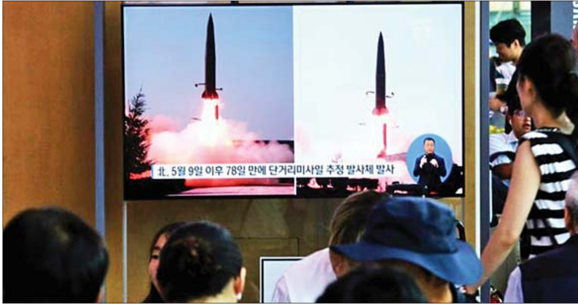
မြောက်ကိုရီးယားနိုင်ငံ၏ ဒုံးကျည်ပစ်ခတ်မှုကို ရုပ်မြင်သံကြားမှ ကြည့်ရှုနေကြသူများကို တွေ့ရစဉ်။

ဆိုးလ် ဇူလိုင် ၂၅ မြောက်ကိုရီးယားနိုင်ငံသည် အမျိုးအမည် မသိရသော ဒုံးကျည်နှစ်စင်းကို ယနေ့အစောပိုင်းက ပစ်ခတ်ခဲ့ကြောင်း တောင်ကိုရီးယား ပူးတွဲစစ်ဦးစီးချုပ်များအဖွဲ့က ပြောကြားသည်။ မြောက်ကိုရီးယားသည် အဆိုပါ ဒုံးကျည်နှစ်စင်းကို နိုင်ငံ၏ အရှေ့ဘက် ကမ်းရိုးတန်းမြို့ ဖြစ်သည့် ဝန်ဆန်မြို့အနီးတွင် ဒေသစံတော်ချိန် နံနက် ၅ နာရီ ၃၄ မိနစ်နှင့် နံနက် ၅ နာရီ ၅၇ မိနစ်တွင် အသီးသီး ပစ်လွှတ်ခဲ့ခြင်းဖြစ်ပြီး အမြင့် ကီလိုမီတာ ၅၀ ခန့်ဖြင့် ပျံသန်းကာ ကီလိုမီတာ ၄၃၀ ခန့် ဝေးကွာသော အရှေ့ရေပြင်ထဲသို့ ရောက်ရှိခဲ့ကြောင်း တောင်ကိုရီးယား ပူးတွဲစစ်ဦးစီးချုပ်များအဖွဲ့က ပြောကြားသည်။ မြောက်ကိုရီးယား၏ ဒုံးကျည်ပစ်ခတ်မှုနှင့်ပတ်သက်၍ တောင်ကိုရီးယားနှင့် အမေရိကန် စစ်ဘက်အာဏာပိုင်များသည် မြောက်ကိုရီးယားက ပစ်ခတ်ခဲ့သည့် ဒုံးကျည်များ၏ အမျိုးအမည်ကို ဆန်းစစ်လေ့လာလျက် ရှိကြောင်း သိရသည်။ ယခုမြောက်ကိုရီးယား၏ ဒုံးကျည်ပစ်ခတ်မှုသည် ပြီးခဲ့သည့် မေ ၉ ရက်က ဒုံးကျည်နှစ်စင်း ပစ်ခတ်ခဲ့ပြီးနောက်