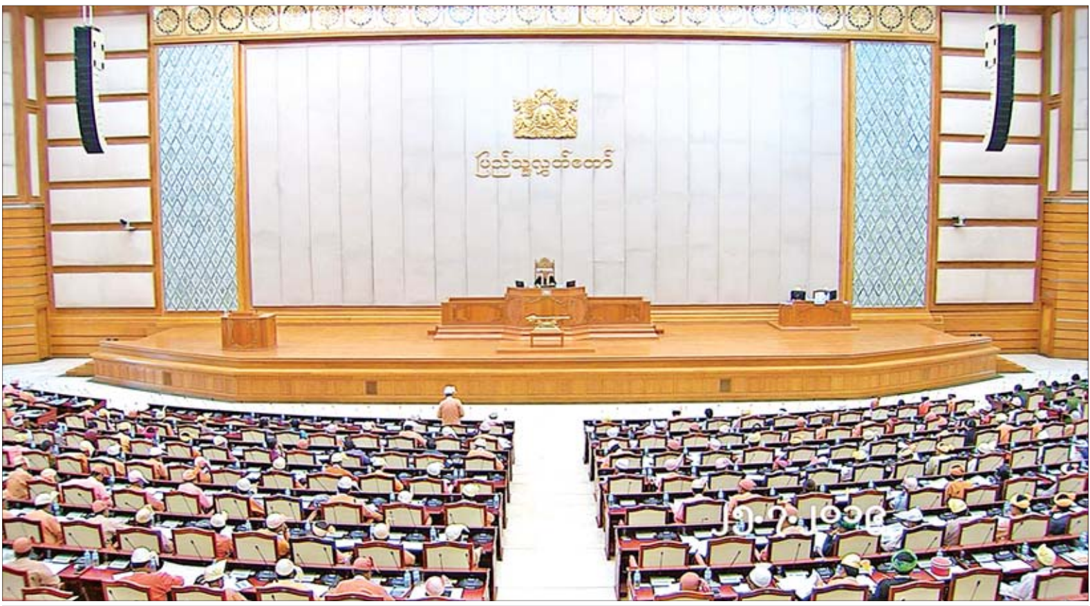
ဒုတိယအကြိမ် ပြည်သူ့လွှတ်တော်(၁၃)ကြိမ်မြောက် ပုံမှန်အစည်းအဝေး ကျင်းပစဉ်။

ယင်းအဆိုတွင် မိမိတို့နေ့စဉ်စား သုံးနေသည့် ဟင်းသီးဟင်းရွက် အသီး အနှံအားလုံးသည် ဓာတ်မြေဩဇာနှင့် ပိုးသတ်ဆေးများ နှင့်မကင်းဘဲ စနစ်တကျအသုံးပြု ထားခြင်း မရှိသည့်အတွက် စာမျက်နှာ ၄ ကော်လံ ၁ သို့