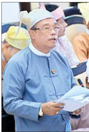
ဒုတိယဝန်ကြီး ဦးကျော်လင်း

မွန်ပြည်နယ် မဲဆန္ဒနယ်အမှတ်(၈)မှ ဦးမျိုးဝင်း၏ မွန်ပြည်နယ် ရေးမြို့မှ ခေါလာမြို့သို့ ဆက်သွယ်ထားသည့် ကတ္တရာလမ်းအား တစ်ဖက်လျှင် တစ်ပေခွဲစီ (သို့မဟုတ်) သုံးပေစီ တိုးချဲ့ပေးရန် အစီအစဉ် ရှိ မရှိ မေးခွန်းနှင့်စပ်လျဉ်း၍ ဒုတိယဝန်ကြီး ဦးကျော်လင်းက ရေး - ကလော့ - ခေါလာလမ်းပိုင်းကို ၁၂ ပေအကျယ်ကတ္တရာလမ်းမှ တစ်ဖက်လျှင် (၃)ပေစီချဲ့၍ ၁၈ပေအကျယ် ကတ္တရာလမ်းအဖြစ် တိုးချဲ့ပေးရန် ၂၀၁၉-၂၀၂၀ ဘဏ္ဍာနှစ်တွင် ရန်ပုံငွေပါရှိခြင်း မရှိပါကြောင်း၊ ၂၀၂၀-၂၀၂၁ ဘဏ္ဍာနှစ်တွင် ရန်ပုံငွေ လျာထားတင်ပြတောင်းခံသွားမည်ဖြစ်ပြီး ရန်ပုံငွေရရှိမှု အပေါ်မူတည်၍ ဆောင်ရွက်ပေးသွားမည် ဖြစ်ပါကြောင်း