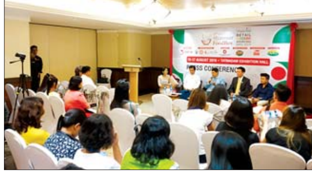
လုပ်ငန်းရှင်များ အချင်းချင်း ချိတ်ဆက်ဆောင်ရွက်နိုင်မည်ဖြစ်ပြီး လုပ်ငန်းရှင်များအတွက် စီးပွားရေး အခွင့်အလမ်းသစ်များနှင့် ယှဉ်ပြိုင်မှုများ ပိုမိုအားကောင်းလာစေရန် ရည်ရွယ်ကျင်းပခြင်းဖြစ်ကြောင်း သိရသည်။ အေးမင်းသူ

ကုန်ချောပစ္စည်းများအပြင် မြန်မာနိုင်ငံ ကုန်သည်များနှင့် စက်မှုလက်မှုလုပ်ငန်းရှင်များအသင်းချုပ် (UMFCCI)၊ မြန်မာနိုင်ငံစားသောက်ဆိုင်လုပ်ငန်းရှင်များအသင်း (MRA) နှင့် မြန်မာနိုင်ငံလက်လီလုပ်ငန်းရှင်များအသင်း (MMRA) တို့၏ အားဖြည့်ကူညီမှုဖြင့် နည်းပညာပိုင်းဆိုင်ရာများ၊ ကုန်ပစ္စည်းများနှင့် အလှဆင်ပစ္စည်းများလည်း ပါဝင်ပြသသွားမည်ဖြစ်သည်။ သတင်းစာရှင်းလင်းပွဲကို ဇူလိုင် ၂၄ ရက် နံနက်ပိုင်းက ရန်ကုန်မြို့ ဆူးလေရန်ဂရီလာတိုတယ်၌ ကျင်းပခဲ့ပြီး ပြည်တွင်း၊ ပြည်ပမှလုပ်ငန်းရှင်များနှင့် စိတ်ပါဝင်စားသူများ တက်ရောက်ကြသည်။ အဆိုပါ ကုန်စည်ပြပွဲသည် ထုတ်ကုန်များနှင့် လက်လီလုပ်ငန်းဆိုင်ရာနည်းပညာများကို ပြည်တွင်းလုပ်ငန်းရှင်များနှင့် နိုင်ငံတကာမှ