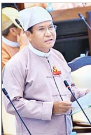
ဒုတိယဝန်ကြီး ဦးတင်မြင့်