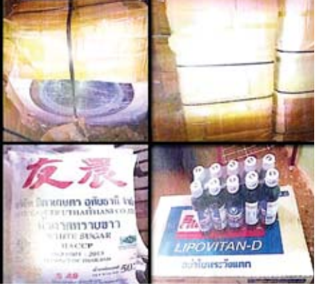
စားသောက်ကုန်များကို သိမ်းဆည်းရမိခဲ့ကြောင်း သတင်းရရှိသည်။ သတင်းစဉ်

နေပြည်တော် ဇူလိုင် ၂၅ တရားမဝင်ကုန်စည်များ တားဆီးထိန်းချုပ်ရေးအတွက် ရေပူနှင့် မရမ်းချောင်း အမြဲတမ်းစစ်ဆေးရေးစခန်းတို့ကို ဌာနဆိုင်ရာပူးပေါင်းအဖွဲ့များဖြင့် ၂၀၁၇ ခုနှစ် မတ် ၁ ရက်တွင် စတင်ဖွင့်လှစ်ဆောင်ရွက်ခဲ့ပြီး ဇူလိုင် ၂၄ ရက်တွင် မန္တလေး-မုဆယ် ပြည်ထောင်စုလမ်းမကြီးတစ်လျှောက် ကုန်သွယ်မှုယာဉ် ပို့ကုန်အစီး ၃၃၀၊ သွင်းကုန် ၂၅၂ စီး၊ ရန်ကုန်-မြဝတီလမ်းမကြီးတစ်လျှောက် သွင်းကုန် ၁၂၆ စီး ကုန်စည်များ သယ်ယူပို့ဆောင်လျက်ရှိသည်။ အဆိုပါ စစ်ဆေးရေးစခန်းများက တင်သွင်း၊ တင်ပို့သော ကုန်ပစ္စည်းများကို စစ်ဆေးမှုပြုလုပ်ဆောင်ရွက်လျက်ရှိရာ ဇူလိုင် ၂၄ ရက်တွင် မရမ်းချောင်း အမြဲတမ်းစစ်ဆေးရေးစခန်းက တားဆီးမှု လေးမှု ခန့်မှန်းတန်ဖိုး ငွေကျပ် ၅ ဒသမ ၀၅၂ သန်းတန်ဖိုးရှိ လှုပ်စစ်ပစ္စည်းများနှင့်