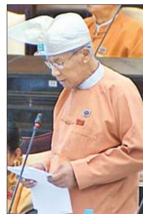
မကွေးတိုင်းဒေသကြီး မဲဆန္ဒနယ် အမှတ်(၆)မှ ဦးဝင်းမောင်

ဖြေကြားသည်။ ချင်းပြည်နယ် မဲဆန္ဒနယ် အမှတ်(၁၀)မှ ဦးလားလ်မင်းထန်၏ ချင်းပြည်နယ် မတူပီမြို့နယ်ရှိ အထွေထွေ အုပ်ချုပ်ရေးဦးစီးဌာန အမည်ပေါက်ကျေးရွာများအဖြစ် ဆောင်ရွက်ပေးရန် အစီအစဉ် ရှိ မရှိမေးခွန်းနှင့်စပ်လျဉ်း၍ ပြည်ထောင်စုအစိုးရအဖွဲ့ဝန်ကြီးဌာန ဒုတိယဝန်ကြီး ဦးတင်မြင့်က မတူပီမြို့နယ်အတွင်းရှိ ကျေးရွာ ၂၆ ရွာကို တရားဝင် အမည်ပေါက်ကျေးရွာများအဖြစ် ဆောင်ရွက်နိုင်ရေးအတွက် အမှုတွဲများအား လုပ်ထုံးလုပ်နည်းနှင့်အညီ ပြုစုဆောင်ရွက်လျက်ရှိပါကြောင်း၊ မြေလွတ်၊ မြေလပ်နှင့် မြေရိုင်းများစီမံခန့်ခွဲရေးကော်မတီ အဆင့်ဆင့်မှ စစ်စစ်ပြီး မြေလွတ်၊ မြေလပ်နှင့် မြေရိုင်းများ စီမံခန့်ခွဲရေးဗဟိုကော်မတီ၏ ခွင့်ပြုမိန့်ရရှိပါက ကျေးရွာအမည်ပေါက်ရရှိရေးအမှုတွဲကို အဆင့်ဆင့် ဆက်လက်တင်ပြဆောင်ရွက်