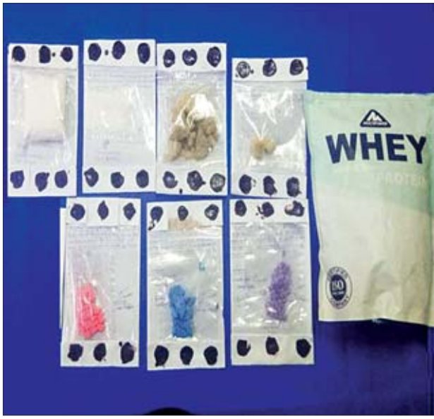
စိတ်ကိုပြောင်းလဲစေသော ဆေးဝါးများဆိုင်ရာဥပဒေပုဒ်မ ၁၉(က)/၂၀(ခ) ဖြင့် အမှုဖွင့်စုံစမ်းလျက်ရှိကြောင်း သိရသည်။

ဗဟိုစာတိုက်ကြီးမှ မူးယစ်ဆေးဝါး တားဆီးနှိမ်နင်းရေးရဲတပ်ဖွဲ့သို့ ဆက်သွယ်အကြောင်းကြားခဲ့ပြီး ပူးပေါင်းအဖွဲ့ဖြင့် ဖွင့်ဖောက်စစ်ဆေးခဲ့ရာ ပါဆယ်ထုပ်အတွင်းမှ ပလတ်စတစ်အိတ်များဖြင့် စနစ်တကျထုပ်ပိုးထားသည့် ကတ်တစ်စင်း ၉၅ ဂရမ်၊ ကိုကင်း ၈၅၀ Ecstasy ဆေးပြား ၉၆ ပြား (စုစုပေါင်း တန်ဖိုးငွေကျပ် သိန်းတစ်ရာကျော်)အား သိမ်းဆည်းရမိခဲ့သဖြင့် ကျောက်တံတားမြို့မရဲစခန်းက မူးယစ်(ပ)၉/၂၀၁၉၊ မူးယစ်ဆေးဝါးနှင့်