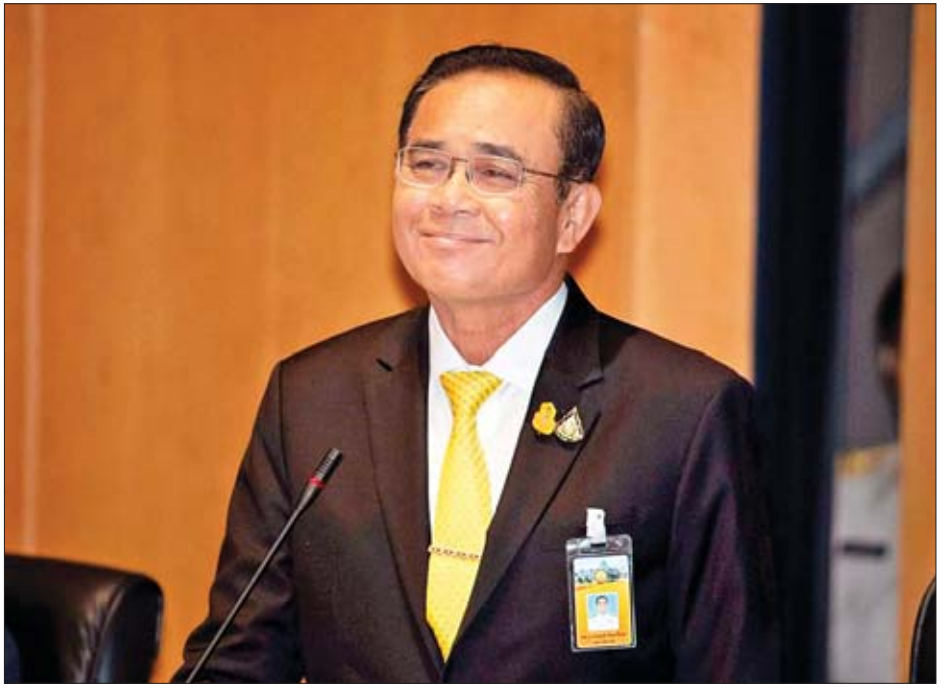
အတွက် အနည်းငယ်သာရရှိထားသည့်အတွက် ဝန်ကြီးချုပ် ချန်အိုချာအနေဖြင့် နိုင်ငံရေးကြီးတန်းပေါ်တွင် လမ်းလျှောက် များက ဆိုသည်။ အင်န်အိတ်ချ်ကေ

သို့သော် သူ၏ပါတီ ၁၉ ခုဖြင့် ဖွဲ့စည်းထားသော ညွန့်ပေါင်းအဖွဲ့သည် အောက်လွှတ်တော်တွင် အရေ