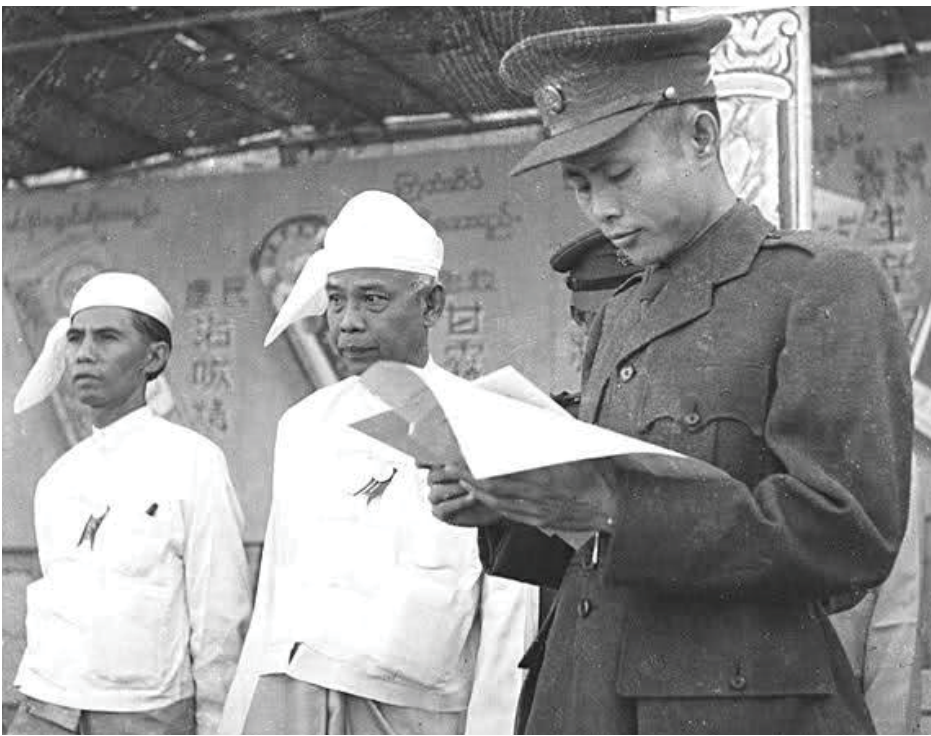
မသမာသူလူတစ်စု၏လက်ချက်ဖြင့် ကျဆုံးခဲ့ကြရသည်။

အတွင်းဝန်ရုံး ထိပ်ဆုံးစားပွဲတွင် နေရာယူထားသည့် ဗိုလ်ချုပ်အောင်ဆန်းနှင့် အစည်းအဝေးတက်ရောက်မည့် ဝန်ကြီးများကို လူလေးယောက်က တော်စီဂန်း သုံးလက်၊ စတင်းဂန်း တစ်လက်ဖြင့် ကျည်ကတ်အကုန်ပစ်ခတ် ထွက်ပြေးသွားခဲ့ကြသည်။ ထိုကဲ့သို့ပစ်ခတ်လုပ်ကြံမှု ကြီးတွင် လွတ်လပ်ရေးဗိသုကာ ဗိုလ်ချုပ်အောင်ဆန်း မှာ သေနတ်ကျည်ဆန် ၁၃ ချက် ထိမှန်ကျဆုံးခဲ့ရသည်။ ထိုအချိန်ကား စနေနေ့ နံနက် ၁၀ နာရီ ၃၇ မိနစ်အချိန် ဖြစ်ပါသည်။ ဗိုလ်ချုပ်အောင်ဆန်းနှင့်အတူ အစည်း အဝေးတက်ရောက်ခဲ့ကြသည့် သခင်မြ၊ ဒီးဒုတ်ဦးဘချို၊ ဦးဘဝင်း၊ မိုင်းပွန် စော်ဘွားစစ်စံထွန်း၊ မန်းဘခိုင်၊ ဦးရာဇော်၊ အတွင်းဝန် ဦးအုန်းမောင်နှင့် ရဲဘော်ကိုထွေးတို့