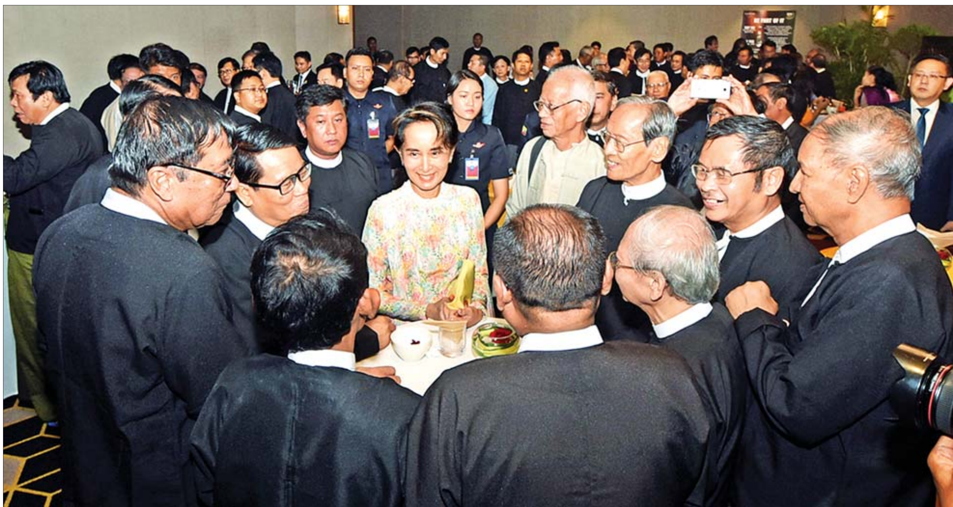
နိုင်ငံတော်၏အတိုင်ပင်ခံပုဂ္ဂိုလ် ဒေါ်အောင်ဆန်းစုကြည် စာရေးဆရာများအား ရင်းရင်းနှီးနှီး လိုက်လံနွှတ်ဆက်စဉ်။