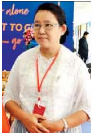
ဒေါက်တာမိမိသက်သွင်