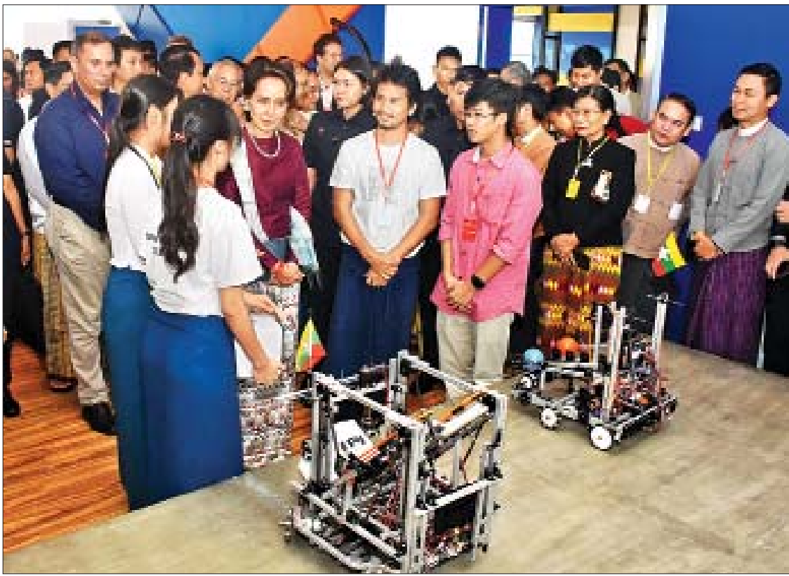
နိုင်ငံတော်၏အတိုင်ပင်ခံပုဂ္ဂိုလ် ဒေါ်အောင်ဆန်းစုကြည် Yangon Innovation Centre အတွင်း လှည့်လည်ကြည့်ရှုစဉ်။

“အခုက စတုတ္ထတော်လှန်ရေးလို့ ဆိုကြပါတယ်။ ဒီစတုတ္ထတော်လှန်ရေးကို ကြည့်တဲ့အခါ ရုပ်ပိုင်းဆိုင်ရာကိုပဲ ကြည့်လို့မရ