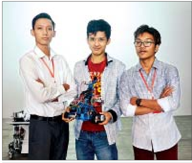
ကမ္ဘာ့အဆင့်စက်ရုပ်ပြိုင်ပွဲတွင် သွားရောက်ယှဉ်ပြိုင်မည့်အဖွဲ့အား တွေ့ရစဉ်။

Yangon Innovation Centre မှာ လူငယ်တွေဟာ ကောင်းမွန်တဲ့ Idea တွေ လာပြိုင်ရမယ်။ ပြိုင်ပွဲမှာ အနိုင်ရတဲ့သူတွေကို ဆုပေးမယ်။ ဆုရတဲ့ ကလေးတွေကို ငွေကြေးရိတ်လုပ်ငန်းရှင်တွေက အရင်းအနှီးတွေထုတ်ပေးမယ်။ ဒါဆို ကလေးတွေက သူတို့ရဲ့ ကုမ္ပဏီတွေကို ကြီးထွားအောင်လုပ်လိုရမယ် ဆိုတဲ့ပုံစံမျိုးကို ကျွန်မတို့က ဖန်တီးပေးတာဖြစ်ပါတယ်။ Yangon Innovation Centre သည် လူငယ်တွေရဲ့ အနာဂတ်ပါ။ လူငယ်တွေရဲ့ ထွက်ပေါက်ပါ။ လာရောက် လေ့လာပေးစေလိုပါတယ်။ Yangon Innovation Centre မှာ operator တွေရှိပါတယ်။ Seedstars ဟာ နိုင်ငံပေါင်း ၆၀ ကျော်လောက်မှာ Startup Ecosystem တွေကို ဆောင်ရွက် နေတဲ့ ဆွစ်ဇာလန်နိုင်ငံအခြေစိုက် ကုမ္ပဏီတစ်ခုဖြစ်ပါတယ်။ Yangon Innovation Centre ကို တိုင်းဒေသကြီးအစိုးရက Develop လုပ်တယ်။