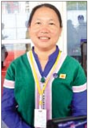
နော်ပန်းသဏ္ဍာမျိုး

ဒီနေ့က Yangon Innovation Centre ရဲ့ ဖွင့်ပွဲကို အဓိကထားပြီး လုပ်တာပါ။ ဒီနေ့ဖွင့်ပွဲမှာ Yangon Innovation Centre က ဘာအတွက် လဲ၊ ဘယ်သူတွေအတွက်လဲ၊ ဘာတွေလုပ်ဆောင်နိုင်သလဲဆိုတာကို အဓိက ပြောသွားမှာပါ။ Yangon Innovation Centre ဆိုတာက ဆန်းသစ် ဂေဟစနစ်လေးတစ်ခုကို အောင်မြင်အောင် အကောင်အထည်ဖော်ဖို့အတွက် ပါ။ ဘယ်လိုအောင်မြင်အောင် အကောင်အထည်ဖော်မလဲဆိုရင် ဂေဟစနစ် ထဲမှာရှိနေတဲ့ လုပ်ငန်းအသစ်လေးတွေကို ပံ့ပိုးပေးရမှာပါ။ ပံ့ပိုးပေးတဲ့အခါမှာ ရင်းနှီးမြှုပ်နှံမှုအသစ်တွေနဲ့ ပံ့ပိုးပေးတယ်။ စီးပွားရေးပညာရှင်တွေ၊ တက္ကသိုလ် က ပညာရှင်တွေကိုပေးတယ်။ အဲဒါအပြင် ကျွန်တော်တို့က ကောင်းမွန်တဲ့