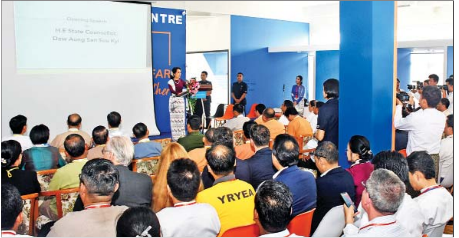
နိုင်ငံတော်၏အတိုင်ပင်ခံပုဂ္ဂိုလ် ဒေါ်အောင်ဆန်းစုကြည် Yangon Innovation Centre ဖွင့်ပွဲအခမ်းအနားတွင် အမှာစကားပြောကြားစဉ်။

အခမ်းအနားတွင် နိုင်ငံတော်၏အတိုင်ပင်ခံပုဂ္ဂိုလ်က Yangon Innovation Centre ကို ဖွင့်ပွဲအခမ်းအနားသို့ တက်ရောက်အမှာစကားပြောကြားရာတွင် “တီထွင်ဆန်းသစ်မှုဟာ ဒီကနေ့ ကမ္ဘာတစ်ဝန်းမှာ စတုတ္ထမြောက် စက်မှုတော်လှန်ရေး ကူးပြောင်းမှုကာလရဲ့ ထိပ်တန်းဦးစားပေးလုပ်ငန်းစဉ်တစ်ခုပဲ ဖြစ်လာခဲ့ပါပြီ။ ဖွံ့ဖြိုးပြီးတိုးတက်တဲ့နိုင်ငံတွေမှာတော့ စတုတ္ထမြောက် စက်မှုခေတ်ကိုဦးတည်ပြီး လယ်ယာကဏ္ဍကစလို့ ပညာရေးကဏ္ဍအထိ ကဏ္ဍတိုင်း၊ နယ်ပယ်တိုင်းမှာ မှတ်ဉာဏ်တု နည်းပညာ (Artificial Intelligence-AI) နဲ့