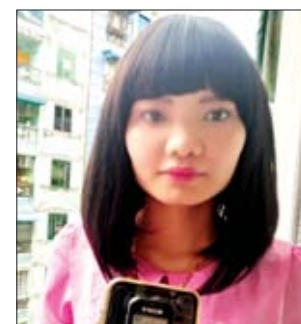
မယုစန္ဒာမြိုး

ပြည်သူတွေက အမှတ်ရနေဆဲ။ ချစ်နေဆဲပါ။ အာဇာနည်နေ့ရောက်တိုင်း အိမ်မှာ အလံတစ်ဝက်ထူတယ်။ အာဇာနည်နေ့ကို ကမ္ဘာတည်သရွေ့ ရှိစေချင်တယ်။ အာဇာနည်ခေါင်းဆောင်ကြီးတွေ မိမိကိုယ်ကျိုးအတွက် ဘာမှမလုပ်ခဲ့ဘူး။ နောင်မျိုးဆက်သစ်လူငယ်တွေ စာပေဖတ်ခြင်းဖြင့် အာဇာနည်ခေါင်းဆောင်ကြီးတွေကို သတိရနေစေချင်ပါတယ်။