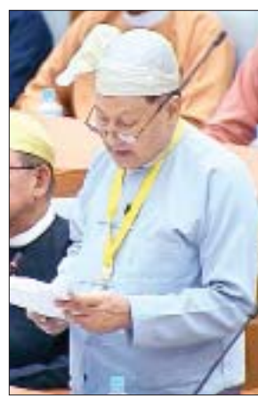
တရားလွှတ်တော်ချုပ်ရုံး တရားသူကြီး ဦးမြင့်အောင်