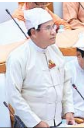
ဒုတိယဝန်ကြီး ဦးတင်မြင့်