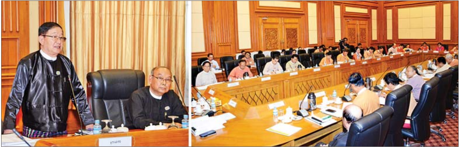
ပြည်ထောင်စုလွှတ်တော်နာယက ဦးတီခွန်မြတ် ၂၀၁၉-၂၀၂၀ ဘဏ္ဍာနှစ် အမျိုးသားစီမံကိန်းဥပဒေကြမ်း၊ ၂၀၁၉-၂၀၂၀ ဘဏ္ဍာနှစ် ပြည်ထောင်စု၏ဘဏ္ဍာငွေအရအသုံးဆိုင်ရာ ဥပဒေကြမ်းများနှင့်စပ်လျဉ်းသည့် အစည်းအဝေးတွင် အဖွဲ့အမှားစကားပြောကြားစဉ်။

၂၀၁၉-၂၀၂၀ ဘဏ္ဍာနှစ် အမျိုးသားစီမံကိန်း ဥပဒေကြမ်း၊ ၂၀၁၉-၂၀၂၀ ဘဏ္ဍာနှစ် ပြည်ထောင်စု၏ဘဏ္ဍာငွေအရအသုံးဆိုင်ရာ ဥပဒေကြမ်းများနှင့်စပ်လျဉ်း၍ ပြည်ထောင်စု လွှတ်တော်နာယကနှင့် ဥပဒေကြမ်းပူးပေါင်း ကော်မတီ၊ ပြည်သူ့ငွေစာရင်းပူးပေါင်း ကော်မတီ၊ စီမံကိန်းလုပ်ငန်းများနှင့် ရငွေသုံး ငွေများ စိစစ်ရေးပူးပေါင်းအဖွဲ့ (၂၀) ဖွဲ့တို့မှ ဥက္ကဋ္ဌ၊ ဒုတိယဥက္ကဋ္ဌများနှင့် ညှိနှိုင်းအစည်း အဝေးကို ယနေ့မွန်းလွဲ ၂ နာရီတွင် ဗျူဟာရိယာအစည်းအဝေးခန်းမ၌ ကျင်းပ သည်။