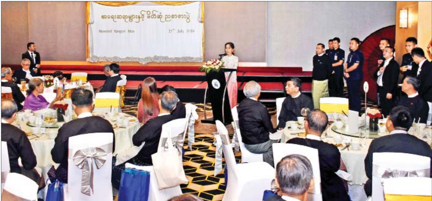
နိုင်ငံတော်၏အတိုင်ပင်ခံပုဂ္ဂိုလ် ဒေါ်အောင်ဆန်းစုကြည် စာရေးဆရာများနှင့် မိတ်ဆုံညစာစားပွဲတွင် အမှာစကားပြောကြားစဉ်။

❖ ရေခဲမှ ဖွံ့ဖြိုးတိုးတက်မှုနှင့် ဂုဏ်သိက္ခာမှာ မိမိတို့ နိုင်ငံသူ နိုင်ငံသားများ၏ ပညာအရည်အချင်း ပေါ်တွင် မူတည်ပါကြောင်း၊ ပညာဆိုသည်မှာ မှန်မှန်ကန်ကန်သုံးသပ်နိုင်ခြင်းဟု ယုံကြည် ယူဆပါကြောင်း၊ မှန်မှန်ကန်ကန်ဆင်ခြင် သုံးသပ်နိုင်ရန်ဆိုလျှင် ဘဝအတွေ့အကြုံနှင့် စာပေအတွေ့အကြုံများမှာ အရေးကြီးပါ ကြောင်း၊ မိမိတို့ပြည်သူ့ ပြည်သားများ အမြင်ကျယ်ပြန့်လာစေရန် ဆောင်ရွက်ပေး သည့်အတွက် စာပေလောကမှ ပုဂ္ဂိုလ်များကို လေးစား ကျေးဇူးတင်ပါကြောင်း၊ မိမိတို့နိုင်ငံမှ စာနယ်ဇင်းပုဂ္ဂိုလ်များအနေဖြင့် မိမိတို့ နိုင်ငံသူ နိုင်ငံသားများ အမြင်ကျယ်ခြင်း၏ ကောင်းကျိုးများနှင့် အမြင်ကျယ်ခြင်းသည် မိမိတို့ လူ့အသိုင်းအဝိုင်းကို မည်သို့ဆောင်ရွက် ပေးနိုင်သည်ကို ပညာပေးနိုင်မည်ဟု ယုံကြည် ပါကြောင်း၊ မိမိတို့နိုင်ငံသူ နိုင်ငံသား၏ စိတ်ပိုင်းဆိုင်ရာလုံခြုံမှုရရှိရန်၊ စိတ်ပိုင်းဆိုင်ရာ လုံခြုံမှုတိုးတက်လာစေရန် စာနယ်ဇင်းပုဂ္ဂိုလ်