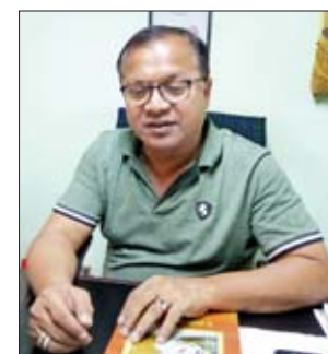
ဦးစိုးမြင့်