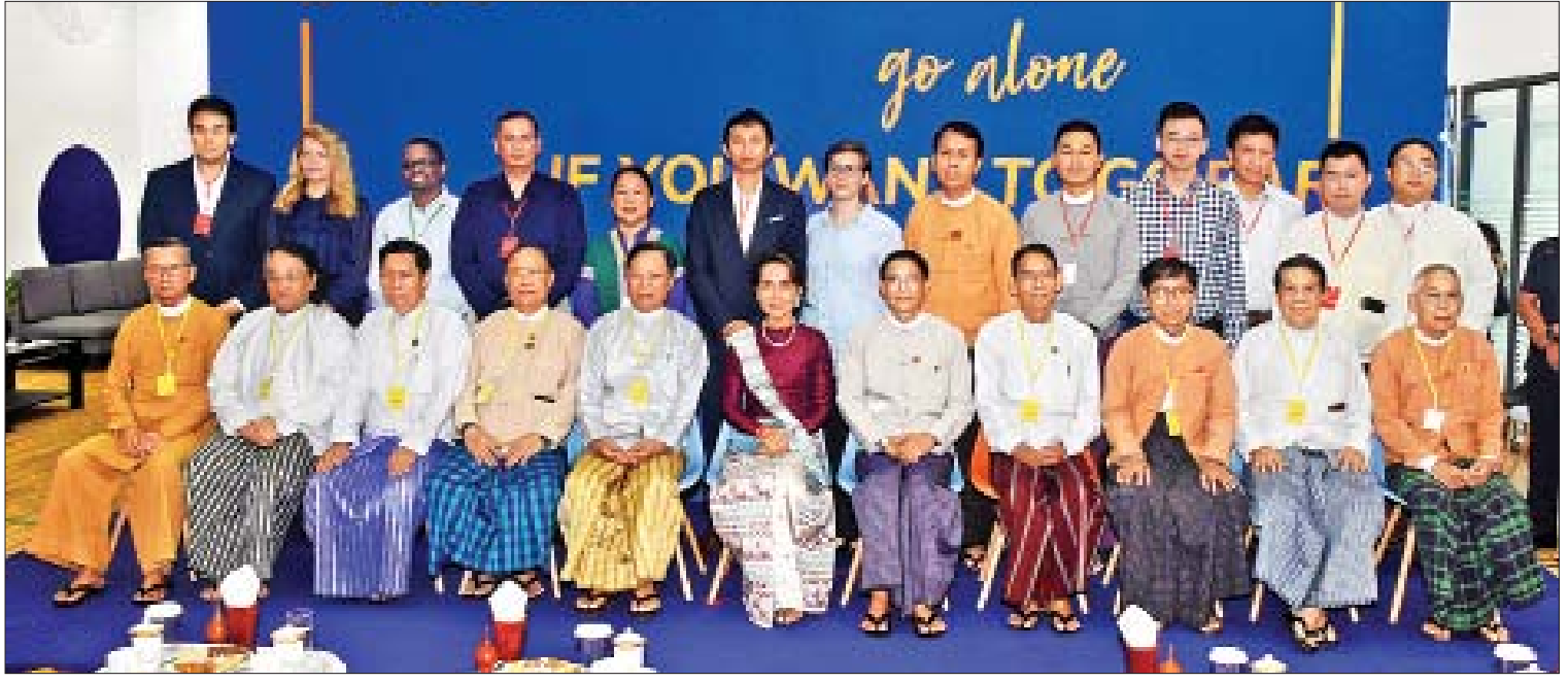
နိုင်ငံတော်၏အတိုင်ပင်ခံပုဂ္ဂိုလ် ဒေါ်အောင်ဆန်းစုကြည် ပြည်ထောင်စုဝန်ကြီးများ၊ ငြိမ်းချမ်းရေးကော်မရှင်ဥက္ကဋ္ဌ၊ Seedstars အဖွဲ့၊ Yangon Innovation Centre မှ တာဝန်ရှိသူများနှင့်အတူ စုပေါင်းမှတ်တမ်းတင်ဓာတ်ပုံရိုက်စဉ်။

“ကျွန်မတို့ ဒေသတွင်းက အိမ်နီးချင်းနိုင်ငံတွေမှာရှိတဲ့ အလားတူ ဆန်းသစ်တီထွင်မှုဗဟိုဌာနတွေလိုပါပဲ။ ဒီဌာနမှာ စွန့်ဦးမှု၊ ဆန်းသစ်မှုဂေဟစနစ်တွေနဲ့ ထိတွေ့မှုနည်းတို့ အတွေ့အကြုံနည်းတို့ နိုင်ငံတစ်ဝန်းက လူငယ်တွေ အစွမ်းအစရှိတဲ့ အလားအလာရှိတဲ့ လူငယ်တွေကို အကျိုးပြုပေးနိုင်ဖို့ ရည်ရွယ်ဆောင်ရွက်သွားမှာဖြစ်ပါတယ်။ ဒီဗဟိုဌာနမှာပဲ ပညာရှင်တွေ၊ ဒီဇိုင်းနာတွေ၊ ကွန်ပျူတာပရိုဂရမ်မာတွေ၊ စာရင်းကိုင်ပညာရှင်တွေ၊ စီးပွားရေးကျွမ်းကျင်သူတွေနဲ့ ရင်းနှီးမြှုပ်နှံသူတွေ၊ အတတ်ပညာရှင်တွေ၊ သုတေသနပညာရှင်တွေ၊ အရင်းအနှီးရှင်တွေ ပူးပေါင်းဆောင်ရွက်နိုင်ဖို့ အပြန်အလှန် ကူညီပေးမှုများ၊ ဆက်ဆံမှုများကို ဖြစ်ပေါ်လာဖို့ မျှော်လင့်ပါတယ်။ ဒီဗဟိုဌာနမှာပဲ ကျွန်မတို့ရဲ့ လူငယ်တွေဟာ နည်းပညာအခြေပြုတဲ့ စီးပွားရေးလုပ်ငန်းတွေကို ကိုယ်ထူကိုယ်ထ ထူထောင်လာနိုင်ကြမယ်။ ဆန်းသစ်တီထွင်မှုတွေ ထွက်ပေါ်လာကြမယ်ဆိုရင် ဒစ်ဂျစ်တယ်ဈေးကွက်ဝင်ထုတ်လုပ်မှုတွေ ထုတ်လုပ်လာနိုင်ကြမယ်။