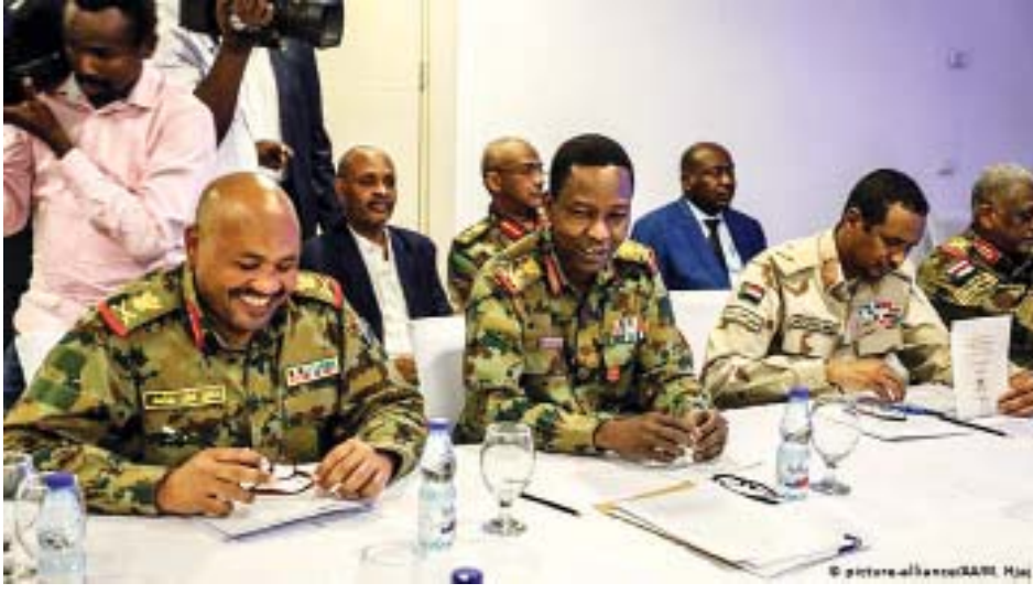
တိုးခဲ့ကြသည်။ နှစ်ဖက်အဖွဲ့များသည် သဘောတူညီမှုဆိုင်ရာ အသေးစိတ် အချက်အလက်များကို ညလုံးပေါက် အပြင်းအထန် ဆွေးနွေးခဲ့ပြီးနောက် ယင်းသို့ သဘောတူလက်မှတ်ရေး ထိုးကြခြင်းဖြစ်သည်ဟု အေအက်ဖ်ပီ သတင်းထောက်က ပြောကြားသည်။ ဆူဒန်စစ်ကောင်စီဝင် ဝိုလ်ချုပ် ကြီးများ၏ကိုယ်စား စစ်ကောင်စီ၏ ဒုတိယအကြီးအကဲ မိုဟာမက် အမ်ဒန်ဒါလာဂိုက လက်မှတ်ရေးထိုး ခဲ့ပြီး ယင်းသဘောတူညီချက်မှာ

ဆူဒန်နိုင်ငံမှ ဆန္ဒပြခေါင်းဆောင် များနှင့် နိုင်ငံအား လက်ရှိအုပ်စိုး နေသည့် စစ်ကောင်စီမှပိုလ်ချုပ်ကြီး တို့သည် အာဏာခွဲဝေ ရေး ဆိုင်ရာ သဘောတူညီမှုကို ဇူလိုင် ၁၇ ရက်တွင် လက်မှတ်ရေးထိုးခဲ့ကြ ကြောင်း၊ ယင်းမှာ သမ္မတ အိုမာ အမ်လ်ဘာရှားအား ဧပြီလအတွင်းက ရာထူးမှ ဖြုတ်ချပြီးကတည်းကစ၍ ဆန္ဒပြသမားများက တောင်းဆို ခဲ့သည့် အရပ်ဘက်အုပ်ချုပ်ရေး အတွက် လမ်းဖွင့်ပေးသည့် အဓိက အချက်ဖြစ်ကြောင်း သိရသည်။