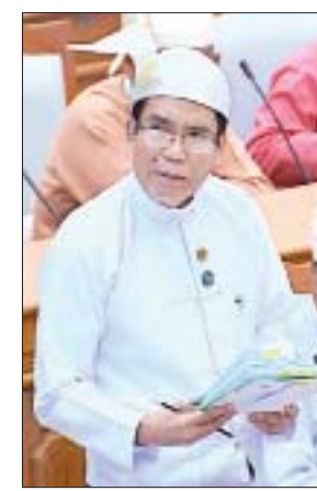
ဒုတိယဝန်ကြီး ဦးအောင်လှထွန်း