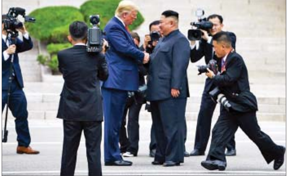
နောက် တောင်ကိုရီးယားနိုင်ငံနှင့် ပူးတွဲစစ်ရေးလေ့ ခဲ့သည်။ ကျင့်မှုများ ပြုလုပ်မှုကိုဆိုင်းငံ့မည်ဟု ကြေညာ ကိုးကား-အေအက်စ်ပီဘာသာပြန်-ကျော်ထိုက်စိုး

ပြီးခဲ့သည့်နှစ်က စင်ကာပူတွင် အမေရိကန်သမ္မတ ဒေါ်နယ်ထရမ်က မြောက်ကိုရီးယားခေါင်းဆောင် ကင်ဂျီအန်နှင့် သမိုင်းဝင် ထိပ်သီးအစည်းအဝေး ပြုလုပ်ပြီး