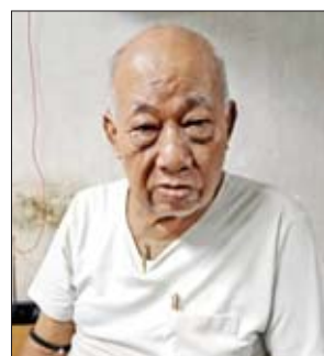
ဦးတင်မောင်

အာဇာနည်ခေါင်းဆောင်ကြီးတွေရဲ့စွမ်းဆောင်ချက်ကြောင့် လွတ်လပ်ရေးရခဲ့တယ်။ အဲဒီအတွက် ကျွန်မအင်မတန်မှ ဂုဏ်ယူမိပါတယ်။ သူတို့ကြောင့် လွတ်လပ်ရေးရဲ့အနှစ်သာရကို ခံစားခဲ့ရတယ်။ သူတို့ရဲ့ အဓိကရည်ရွယ်ချက် ကတော့ စည်းလုံးညီညွတ်ခြင်းပါ။ ကိုယ်ကျိုးစွန့်တယ်။ အနစ်နာခံတယ်။ ပြည်သူတွေနဲ့ တန်းတူညီတူနေတိုင်းတယ်။ ကိုယ့်အားကိုးကိုးတယ်။ အဓိက ပြောရရင် ခေါင်းဆောင်ကြီးတွေ ကျဆုံးသွားတဲ့အတွက် ဝမ်းနည်းမိတယ်။