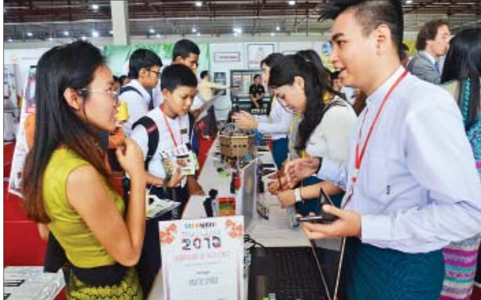
Yangon Innovation Centre တွင် ပြသထားသည့် နည်းပညာများကို စိတ်ဝင်စား ကြည့်ရှုနေကြသူ လူငယ်များ။

Yangon Innovation Centre ဖွင့်လှစ်လိုက်ခြင်းသည် ကျွန်တော်တို့လို တီထွင်ဖန်တီးချင်တဲ့ လူငယ်တွေအတွက် အခွင့်အရေးတစ်ခုပဲ။ အရင်ကဆို ဒါမျိုးတွေ မရှိခဲ့ဘူး။ ကျောင်းမှာ ကျွန်တော်တို့ Project လုပ်ရင် အခက်အခဲတွေရှိခဲ့တယ်။ ဒီလိုမျိုး ဖွဲ့စည်းခြင်းအားဖြင့် အခြားအဖွဲ့အစည်းတွေကလည်း ကျွန်တော်တို့ လုပ်နိုင်စွမ်းရှိတယ်ဆိုတာကို မြင်လာမယ်။ ထောက်ပံ့ပေးနိုင်မယ်။ လူငယ်တွေရဲ့ အရည်အချင်းတွေ တိုးတက်လာမယ်။ လူငယ်တွေ နေရာပိုရလာမယ်။ ပိုပြီးကြိုးစားလာနိုင်ကြမယ်။ motivation ပိုကောင်းလာမယ်။ ဒါလိုမျိုးရှိခြင်းအားဖြင့် လူငယ်တွေရဲ့ လုပ်နိုင်စွမ်းအားကို တင်ပေးတယ်။ ဒီလိုမျိုးဖွင့်ခြင်းသည် အထောက်အပံ့ကောင်းလို့ မြင်တယ်။ ကျွန်တော်အနေနဲ့ပြောချင်တာက လူငယ်တွေအနေနဲ့ ရွက်ပန်းသီးအဖြစ် မနေတော့ဘဲ ပြောချင်တယ်။ ဒါသည် တိုင်းပြည်အနေနဲ့လည်း နာတယ်။ ကျွန်တော် သူငယ်ချင်းအများစုက တော်ကြတယ်။ ပုံမှန်လေးပဲ နေလိုက်ကြတော့ လမ်းစပျောက်ကုန်တယ်။ ကိုယ်လိုချင်တဲ့ ဦးတည်ချက်ကို မသိကြတော့ဘူး ဖြစ်ကုန်တယ်။ ကိုယ်နဲ့ပတ်ဝန်းကျင်တူတဲ့ အဖွဲ့လေးတစ်ခုနဲ့ နေခြင်းအားဖြင့် တီထွင်နိုင်တယ်။ သူဘာလုပ်မလဲ ကိုယ်သိတယ်။ အခြားဘာလုပ်မလဲဆိုတာလည်း ကိုယ့်အဖွဲ့လေးနဲ့ တိုင်ပင်ပြီး အလုပ်လုပ်လို့ရတယ်။ ကိုယ့်အဖွဲ့အစည်းလေးနဲ့နေပါ။ တစ်ယောက်တည်းမနေပါနဲ့။