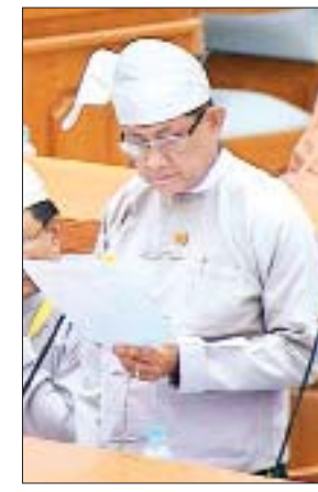
ဒုတိယဝန်ကြီး ဦးမောင်မောင်ဝင်း