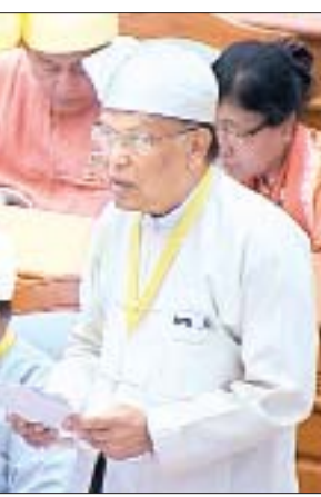
မြန်မာနိုင်ငံ အမျိုးသားလူ့အခွင့်အရေး ကော်မရှင်ဥက္ကဋ္ဌ ဦးဝင်းမြ

ထို့ပြင် ကော်မရှင်ရုံးသည် လူ့အခွင့်အရေး အသိပညာပေးခြင်း၊ လူ့အခွင့်အရေးကာကွယ်ရေးလုပ်ငန်းများ ဆောင်ရွက်ခြင်း၊ နိုင်ငံတော်အစိုးရသို့ ဥပဒေရေးရာ အကြံပြုချက်များပေးပို့ခြင်း၊ ဂုဏ်သမဂ္ဂအပါအဝင် အပြည်ပြည်ဆိုင်ရာ လူ့အခွင့်အရေးအဖွဲ့အစည်းများ၊ ဒေသဆိုင်ရာအဖွဲ့အစည်းများနှင့် ဆက်သွယ်ဆောင်ရွက်ခြင်း စသည့်လုပ်ငန်းတာဝန်များကို ဆောင်ရွက်သည့်နေရာတွင် နိုင်ငံတော်အစိုးရ၏ အားပေးကူညီထောက်ပံ့မှု ပြည်ထောင်စုဝန်ကြီးဌာနများနှင့် တိုင်းဒေသကြီး၊ ပြည်နယ် အစိုးရအဖွဲ့များ၏ ပူးပေါင်းကူညီဆောင်ရွက်မှုများ အထူးလိုအပ်လျက်ရှိကြောင်းကိုလည်း ထည့်သွင်းပြောကြား