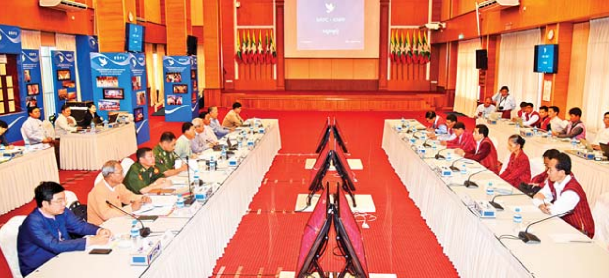
အမျိုးသားပြန်လည်သင့်မြတ်ရေးနှင့် ငြိမ်းချမ်းရေးဗဟိုဌာန ဒုတိယဥက္ကဋ္ဌ ပြည်ထောင်စုရှေ့နေချုပ် ဦးထွန်းထွန်းဦး ဦးဆောင်သည့်အဖွဲ့နှင့် ကရင်နီ အမျိုးသားတိုးတက်ရေးပါတီ ငြိမ်းချမ်းရေးဖော်ဆောင်ရေးကော်မတီအဖွဲ့ခေါင်းဆောင် ခူဦးရယ် ဦးဆောင်သည့်အဖွဲ့တို့ တွေ့ဆုံဆွေးနွေးစဉ်။

နေပြည်တော် ဇူလိုင် ၁၇ အမျိုးသားပြန်လည်သင့်မြတ်ရေးနှင့် ငြိမ်းချမ်းရေးဗဟိုဌာန ဒုတိယဥက္ကဋ္ဌ ပြည်ထောင်စုရှေ့နေချုပ် ဦးထွန်းထွန်းဦး ဦးဆောင်သည့်အဖွဲ့နှင့် ကရင်နီ အမျိုးသားတိုးတက်ရေးပါတီ ငြိမ်းချမ်းရေးဖော်ဆောင်ရေးကော်မတီအဖွဲ့ ခေါင်းဆောင် ခူဦးရယ် ဦးဆောင်သည့်အဖွဲ့တို့၏ တွေ့ဆုံဆွေးနွေးပွဲကို ယနေ့နံနက် ၁၀ နာရီတွင် နေပြည်တော်ရှိ အမျိုးသားပြန်လည်သင့်မြတ်ရေး နှင့် ငြိမ်းချမ်းရေးဗဟိုဌာန (NRPC) ၌ ကျင်းပသည်။