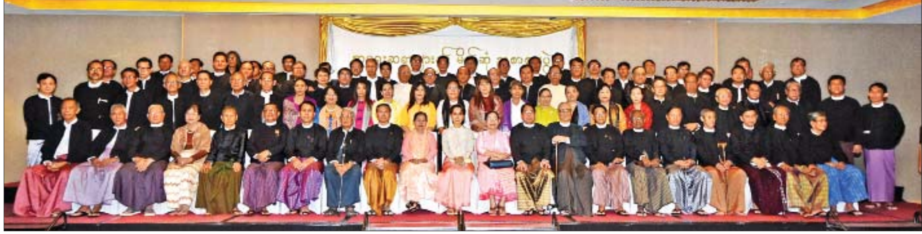
နိုင်ငံတော်၏အတိုင်ပင်ခံပုဂ္ဂိုလ် ဒေါ်အောင်ဆန်းစုကြည် ပြည်ထောင်စုဝန်ကြီးများ၊ ရန်ကုန်တိုင်းဒေသကြီး ဝန်ကြီးချုပ်၊ တာဝန်ရှိသူများနှင့် စာရေးဆရာ ဆရာမများ စုပေါင်းမှတ်တမ်းတင်ဓာတ်ပုံရိုက်စဉ်။

“ မိမိတို့နိုင်ငံမှ စာနယ်ဇင်းပုဂ္ဂိုလ်များအနေဖြင့် မိမိတို့နိုင်ငံသူ နိုင်ငံသားများ အမြင်ကျယ်ခြင်း၏ကောင်းကျိုးများနှင့် အမြင် ကျယ်ခြင်းသည် မိမိတို့ လူ့အသိုင်းအဝိုင်းကို မည်သို့ဆောင်ရွက် ပေးနိုင်သည်ကို ပညာပေးနိုင်မည်ဟု ယုံကြည်