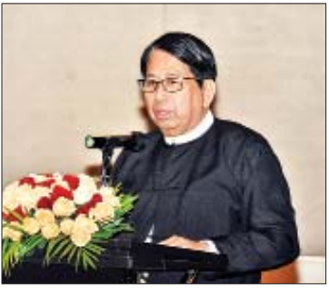
ပြည်ထောင်စုဝန်ကြီး ဒေါက်တာဖေမြင့် ရှင်းလင်းပြောကြားစဉ်။

က ကျေးဇူးတင်စကားပြောကြားသည်။ ယင်းနောက် နိုင်ငံတော်၏အတိုင်ပင်ခံ ပုဂ္ဂိုလ်သည် စာရေးဆရာ ဆရာမများနှင့် အတူ ညစာအတူတကွသုံးဆောင်သည်။ ညစာစားပွဲသို့ ပြည်ထောင်စုဝန်ကြီး ဦးမင်းသူ၊ သူရဦးအောင်ကို၊ ဒေါက်တာ ဖျိုးသိမ်းကြီး၊ ရန်ကုန်တိုင်းဒေသကြီးဝန်ကြီး ချုပ် ဦးဖိုးမင်းသိန်းနှင့် တာဝန်ရှိသူများ၊ စာရေးဆရာ ဆရာမများ တက်ရောက်ကြ သည်။ သတင်းစဉ်