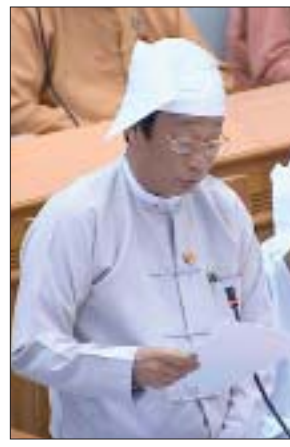
ဒုတိယဝန်ကြီး ဦးလှကျော်