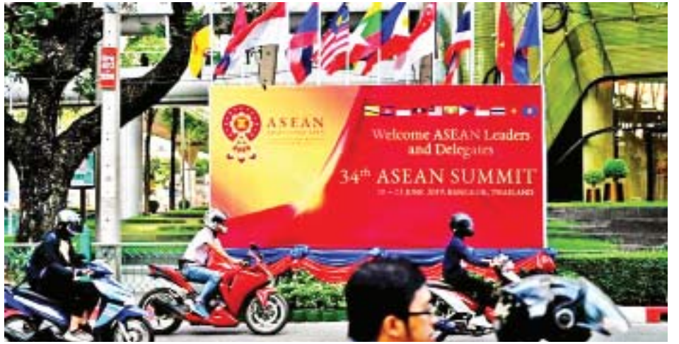
ဇွန်လအတွင်း သိသာစွာ လျော့ကျသွားခဲ့သည်။ အမေရိကန် နိုင်ငံအတွင်းသို့ သွင်းကုန်ပမာဏသည် ၃၁ ရာခိုင်နှုန်းအထိ နိုင်ငံအတွင်းသို့ တရုတ်နိုင်ငံ၏ ပို့ကုန်ပမာဏသည် လျော့ကျသွားခဲ့သည်။ ရှစ် ရာခိုင်နှုန်းကျဆင်းခဲ့ပြီး အမေရိကန်နိုင်ငံမှ တရုတ်

တရုတ်နိုင်ငံ၏ ပို့ကုန်နှင့် သွင်းကုန်ပမာဏသည်