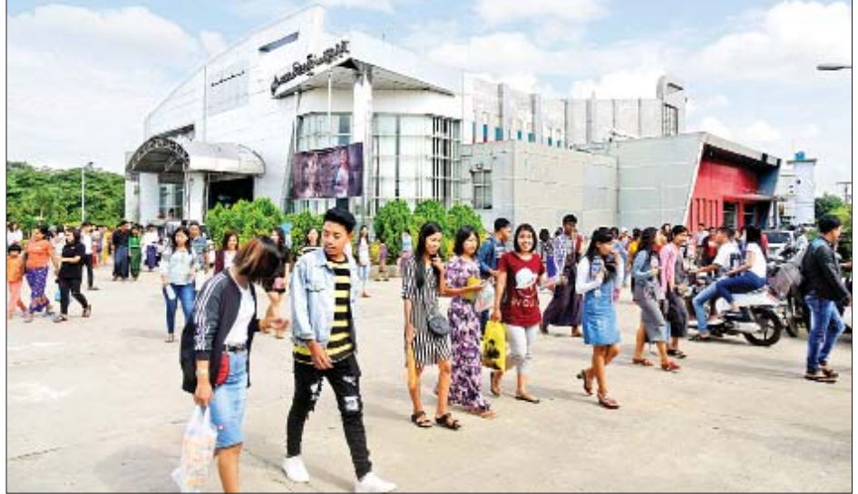
နေပြည်တော် သပြေကုန်းရှိ အောင်သပြေရုပ်ရှင်ရုံတွင် လာရောက်အပန်းဖြေကြသည့် ရုပ်ရှင်ကြည့်ပရိသတ်များ။