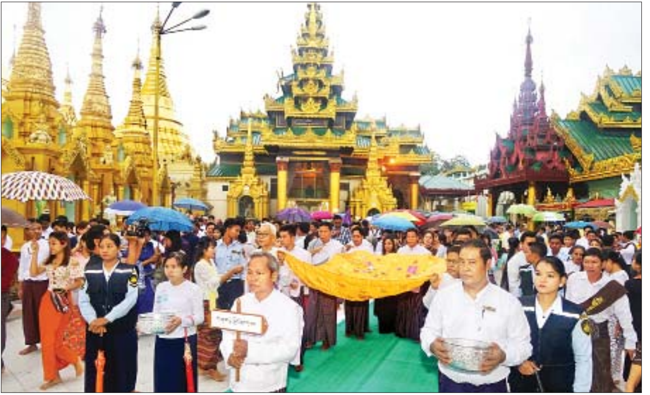
ရွှေတိဂုံစေတီတော်၌ ဘာသာရေးဝတ်အသင်းအဖွဲ့များက ရွှေကြာသင်္ကန်းများကို ကိုင်ဆောင်ကာလှည့်လည်ပူဇော်ကြစဉ်။

ဗိုလ်တထောင်ကျိုက်ဒေးအပ်ဆံတော်ဦးစေတီ ဂေါပကအဖွဲ့က ကြီးမှူး၍ ၁၃၈၁ ခုနှစ် ဝါဆိုလပြည့် ဓမ္မစကြာအခါတော်နေ့အခမ်းအနားကို နံနက်ပိုင်းမှ စတင်ကျင်းပရာ ဘုရားဖူးလာပြည်သူများဖြင့် စည်ကားလျက်ရှိကြောင်း တွေ့ရသည်။ ဗိုလ်တထောင်ကျိုက်ဒေးအပ်ဆံတော်ဦးစေတီ၌ ဝါတွင်းသုံးလဥပုသ်နေ့နံနက်တိုင်း ရင်ပြင်တော်ရှိ ဓမ္မာရုံ၌ စေတီတော်သြဝါဒါစရိယဆရာတော်ကြီးနှင့် သံဃာတော်များက ဝါတွင်းသီလပေးတရားတော်များ ချီးမြှင့်သွားမည်ဖြစ်