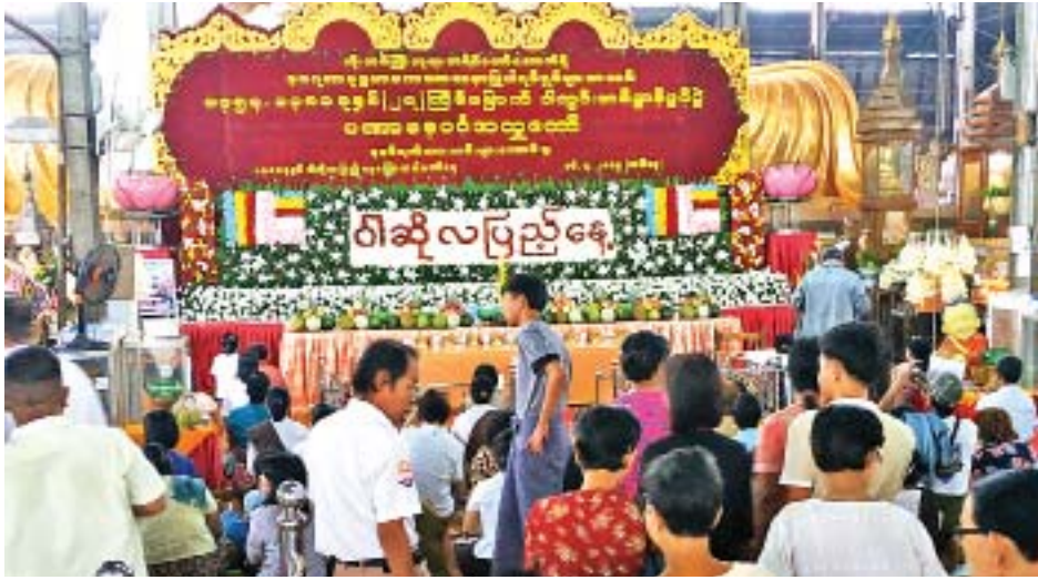
ဇူလိုင် ၁၆ ရက် (ဝါဆိုလပြည့်နေ့)က ရန်ကုန်မြို့ အတုလာဗိမာန်မဟာမုနိသကျကိုးထပ်ကြီးဘုရား၌ ဘုရားဖူးလာ သူများဖြင့် စည်ကားနေသည်ကို တွေ့ရစဉ်။