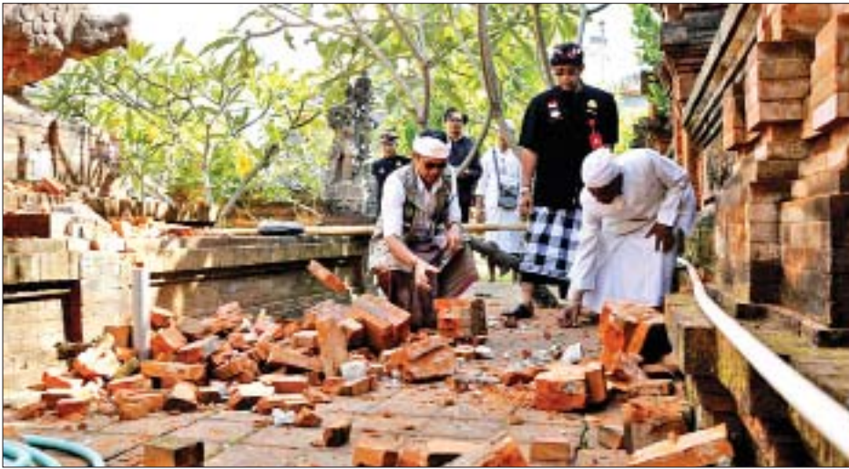
ဂျကာတာ ဇူလိုင် ၁၆

အင်ဒိုနီးရှားနိုင်ငံ ဘာလီကျွန်းတွင် ဇူလိုင် ၁၆ ရက် နံနက်အစောပိုင်းက ပြင်းအား ၆ ဒဿမ သူညီ မဂ္ဂနီကျူအဆင့်ရှိ မြေငလျင်လှုပ်ခတ်ခဲ့ရာ လူခုနစ်ဦး ဒဏ်ရာရရှိခဲ့ပြီး အမြောက်အမြားပျက်စီးခဲ့ကြောင်း သဘာဝဘေးအန္တရာယ်ဆိုင်ရာ အေဂျင်စီမှ အထက်တန်းတာဝန်ရှိသူတစ်ဦးက ပြောကြားသည်။