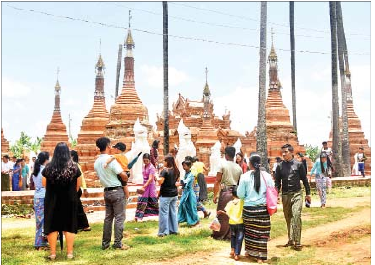
နေပြည်တော်ကောင်စီနယ်မြေ ညောင်ပင်ကြီးစုကျေးရွာရှိ ရှေးဟောင်းစေတီတော်များတွင် ဘုရားဖူးလာပြည်သူများဖြင့် စည်ကားလျက်ရှိသည်ကို တွေ့ရစဉ်။

သတင်း-ဟန်လင်းနိုင်၊ ဓာတ်ပုံ-ကျော်ငင်ထိုက်