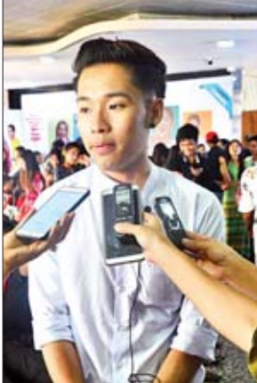
ဦးဇင်မင်းအောင်