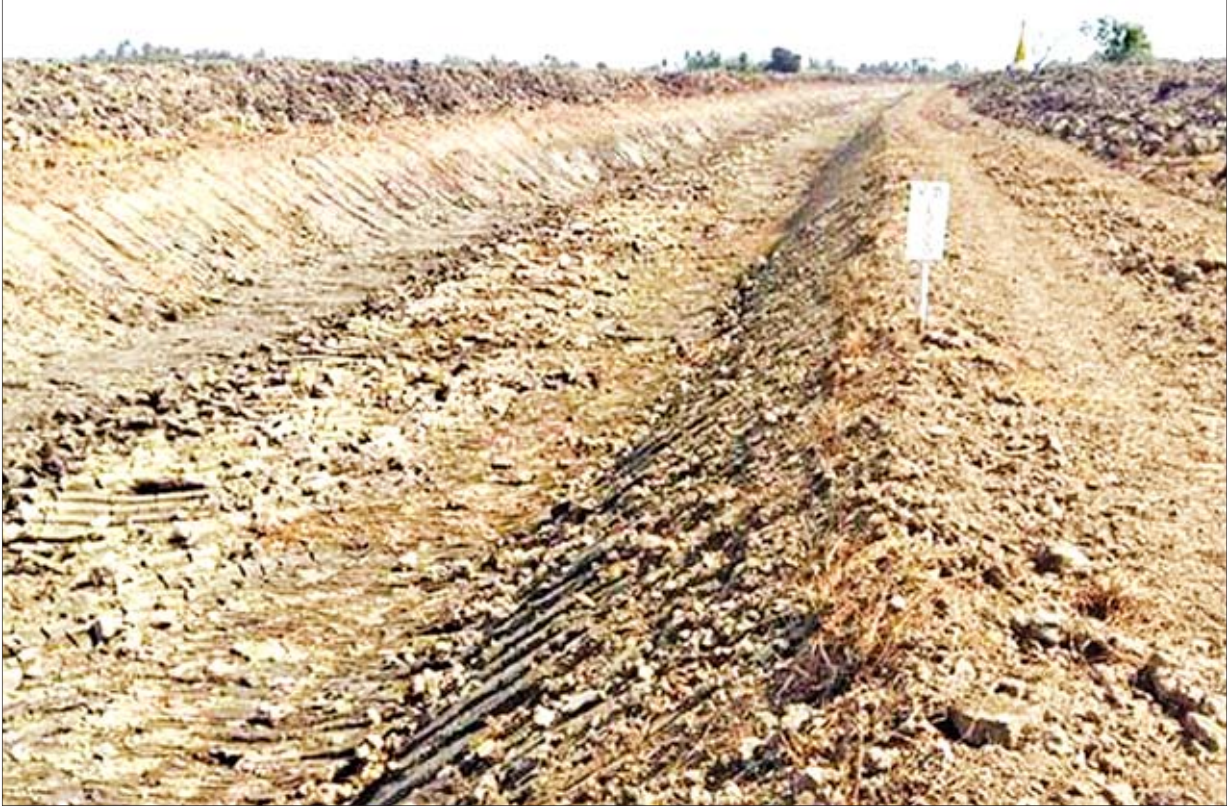
ကွမ်းခြံကုန်းမြို့နယ် ကော့ဒွန်းရွာမှ ကြခတ်ရွာအထိ သခွပ်မြစ်ကော တူးဖော်ထားမှုကို တွေ့မြင်ရစဉ်။

“ ကွမ်းခြံကုန်းမြို့နယ်က သခွပ်မြစ် ကောကို တစ်စိတ်တစ်ပိုင်း ပြန်တူးဖော် လိုက်တဲ့အတွက် ကျွန်တော်တို့လယ်တွေ ဟာ အများကြီးအကျိုးဖြစ်ထွန်းလာပါ တယ်။ အရင်က တစ်ဧကကို ဘေးကျားလို စပါးမျိုး တင်းငါးဆယ် ထွက်ဖို့ အတော်ကြိုးစားရပါတယ်။ ရေကြီးရေလျှံဖြစ်တဲ့အခါ ဧက ၃၀၀၀ လောက်မှာ အနည်းဆုံး ၃၀၀ လောက်က ပျက်သွားပါတယ်။ အခုဆိုရင် ရေလွှမ်း တာ တော်တော်သက်သာသွားပြီးတော့ စိုက်ပျိုးရတာ အဆင်ပြေပါတယ် ”