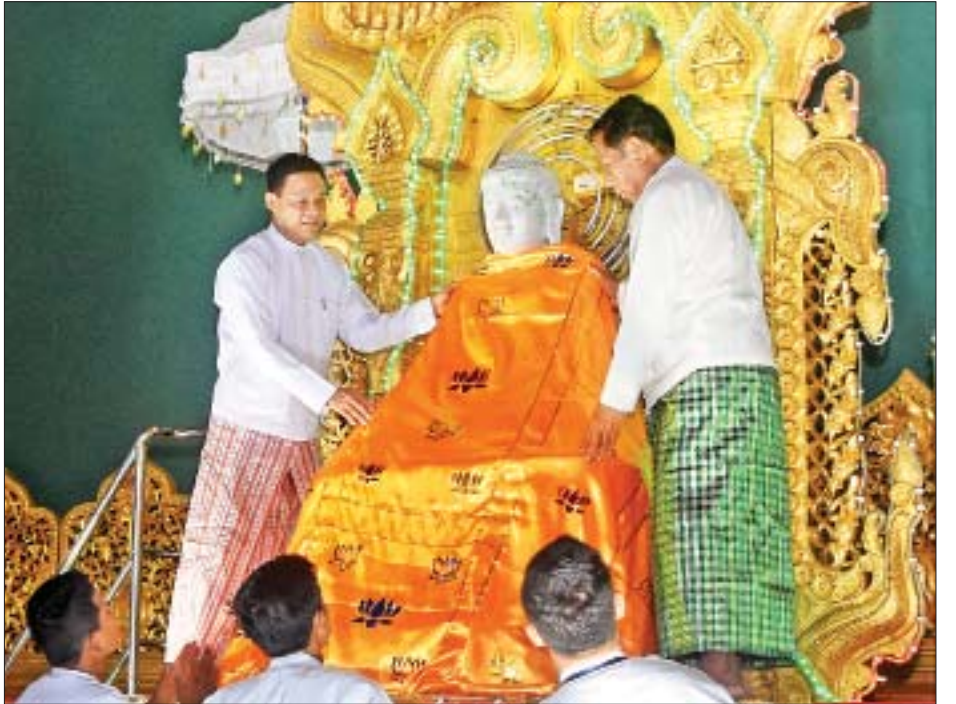
ပြည်ထောင်စုရှေ့နေချုပ် ဦးထွန်းထွန်းဦး ဗုဒ္ဓပဋိမာ ရုပ်ပွားဆင်းတုတော်အား ဝါဆိုရွှေကြာသင်္ကန်း ကပ်လှူစဉ်။

အခမ်းအနားသို့ဥပ္ပါတသန္တိစေတီတော်မြတ်ကြီးဂေါပက အဖွဲ့၏ ဩဝါဒါစရိယ ပျဉ်းမနားမြို့ မဟာဝိသုတာရာမ ဈေးကုန်းကျောင်းတိုက်ဆရာတော် အဘိဓဇမဟာရဋ္ဌဂုရု ဒေါက်တာဘဒ္ဒန္တကဝိသာရ အမှူးပြုသော ဆရာတော် သံဃာတော်များ၊ အမျိုးသားလွှတ်တော်ဥက္ကဋ္ဌ မန်းဝင်း ခိုင်သန်း၏ဇနီး ဒေါ်နန်းကြင်ကြည် ပြည်ထောင်စုရှေ့နေချုပ် ဦးထွန်းထွန်းဦးနှင့်ဇနီး၊ နေပြည်တော်ကောင်စီဥက္ကဋ္ဌ ဒေါက်တာမျိုးအောင်နှင့်ဇနီး၊ သာသနာရေးနှင့်ယဉ်ကျေးမှု ဝန်ကြီးဌာန ဒုတိယဝန်ကြီး ဦးကြည်မင်းနှင့်ဇနီး၊ နေပြည် တော်ကောင်စီဝင်များ၊ နေပြည်တော်စည်ပင်သာယာရေး ကော်မတီဝင်များ၊ ဌာနဆိုင်ရာဝန်ထမ်းများနှင့် ဝတ်အသင်း အဖွဲ့များ တက်ရောက်ကြသည်။