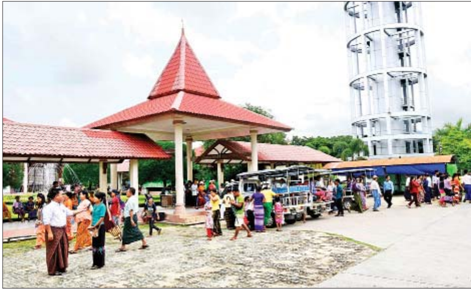
အမျိုးသားအထိမ်းအမှတ်ဥယျာဉ်(နေပြည်တော်)သို့ လာရောက်လည်ပတ်သူများကို တွေ့ရစဉ်။