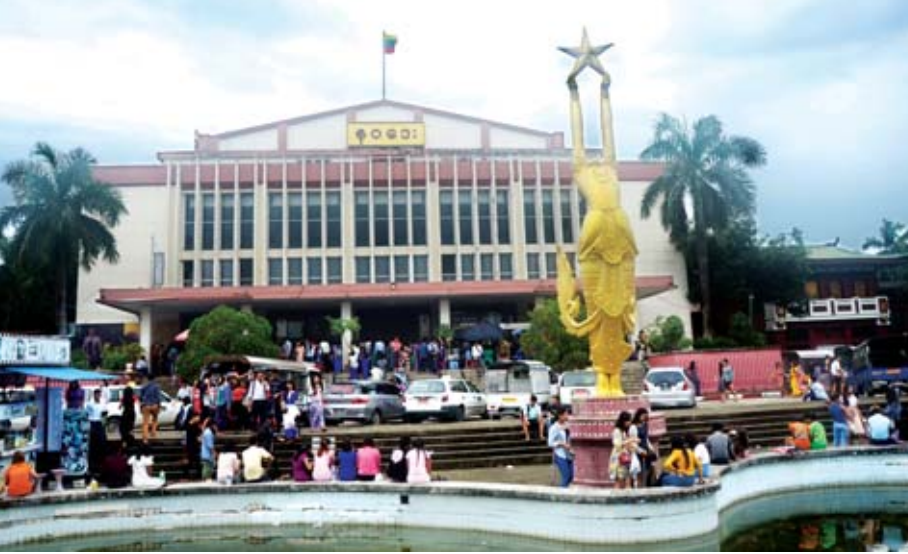
ရန်ကုန်မြို့၊ မရမ်းကုန်းမြို့နယ်ရှိ နဝဒေးရုပ်ရှင်ရုံတွင် ရုပ်ရှင်ကြည့်ပရိသတ်များဖြင့် စည်ကားနေသည်ကို တွေ့ရစဉ်။

နဲ့ဖြစ်စေ လာရောက်ဝယ်ယူတဲ့အခါ လက်ခံဆောင်ရွက်ပေးပါတယ်။ ဖုန်း နဲ့ ဘွတ်ကင်တင်ထားတဲ့ ကြိုတင် လက်မှတ်တွေကိုကျတော့ ပွဲချိန် မပြသမီ ၄၅ မိနစ်အထိ စောင့်ပါတယ်။ လာရောက်ဝယ်ယူခြင်းမရှိတဲ့ တယ်လီ ဖုန်း ဘွတ်ကင်လက်မှတ်တွေကို ၄၅ မိနစ်အလိုအထိ မရောက်ခဲ့ဘူးဆိုရင် ပယ်ဖျက်ပြီးတော့ အခြားသူတွေ ကို ပြန်လည်ရောင်းချပါတယ်။ ရုပ်ရှင် ရုံကို လာရောက်ကြည့်ရှုသူတွေကို စိတ်ချမ်းသာ အဆင်ပြေမှုရှိအောင်