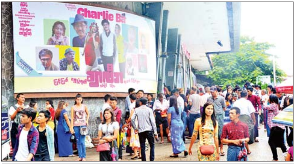
သမ္မတအဆင့်မြင့်ရုပ်ရှင်ရုံတွင် ရုပ်ရှင်ကြည့်ပရိသတ်များဖြင့် စည်ကားနေသည်ကို တွေ့ရစဉ်။

မှာဆိုရင် လာကြည့်ကြတဲ့ ပရိသတ် တွေကို ပုံမှန်ထက် ဝန်ဆောင်မှုတွေ အထူးဂရုစိုက် လုပ်ထားပေးပါတယ်။ ဒီလိုရုံးပိတ်ရက်မျိုးဆိုရင် ညပိုင်း ရုပ်ရှင်ဇာတ်ကား ပြတဲ့အချိန် ထပ် တိုးပြီး ၉ နာရီနောက်ပိုင်း ပြပေး တာတွေရှိပါတယ်။ လက်မှတ်ကို ကြိုဝယ်ထားရင် ပိုအဆင်ပြေပါတယ်။ အခုပြတဲ့ ဇာတ်ကားတွေက မြန်မာ ဇာတ်ကားဆိုရင် ဒဏ္ဍာရီမိုးရိုမယ်။ နိုင်ငံခြား ဇာတ်ကားဆိုရင် Spider Man၊ Crawl ဇာတ်ကားနဲ့ လူစိတ်ဝင်စားတဲ့ တခြားဇာတ်ကားတွေ ပြနေပါတယ်။ တစ်နေ့ကို ပွဲချိန် ငါးကြိမ်ပြသပေးတယ်။ ညပိုင်း နောက်