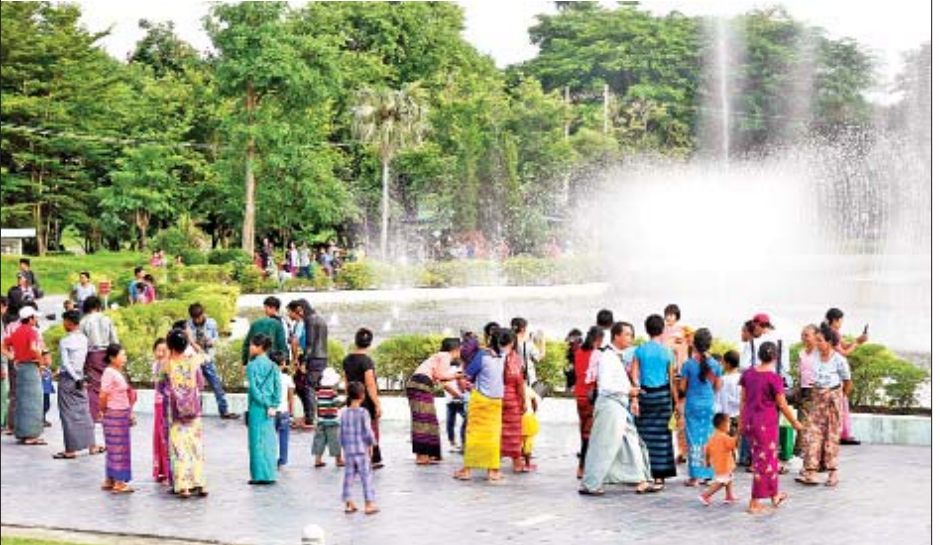
နေပြည်တော် ရေပန်းဥယျာဉ်တွင် လာရောက်အပန်းဖြေသူများဖြင့် စည်ကား။