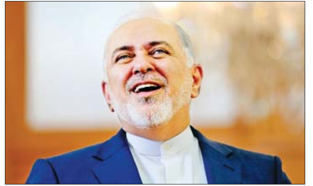
အီရန်နိုင်ငံပြင်ပတွင် မည်သည့်ပစ္စည်းမျှမပိုင်ဆိုင်သဖြင့် အရေးယူ မှုများက သူ့ကိုထိခိုက်စေမည်မဟုတ်ဟု ဇာရစ်ဖ်က နယူးယောက်တိုင်းမိ သတင်းစာနှင့် တွေ့ဆုံမေးမြန်းမှုတစ်ခုအတွင်း ပြောကြားခဲ့သည်။

“ကျွန်တော်တို့ နျူကလီးယားလက်နက်တွေ ထုတ်လုပ်ဖို့မဟုတ်ပါဘူး။ ကျွန်တော်တို့ နျူကလီးယားလက်နက် ထုတ်လုပ်ချင်ရင် ထုတ်လုပ်နိုင်စွမ်းရှိ တာကြာပါပြီ” ဟု ၎င်းကပြောသည်။ ဇာရစ်ဖ်၏ မှတ်ချက်စကားများမှာ ကုလသမဂ္ဂသို့လာရောက်မည့် ခရီးစဉ်တစ်ခုအတွင်း ၎င်း၏ လှုပ်ရှားမှုများကို ကန့်သတ်မှုများ ပြုလုပ်ရန် အမေရိကန်နိုင်ငံက သတ်မှတ်ခဲ့ချိန်တွင် ပြောကြား ခဲ့ခြင်းဖြစ်သည်။ အမေရိကန်နိုင်ငံက ဇာရစ်ဖ်အတွက် ဗီအေအိုင်ပေးခဲ့သော် လည်း မန်ဟတ်တန်မြို့လယ်ရှိ အီရန်နိုင်ငံ၏ ကုလသမဂ္ဂမစ်ရှင်ရုံးမှလွဲ၍ သွားလာခွင့်ပြုမည်မဟုတ်ဟု အမေရိကန်နိုင်ငံခြားရေးဝန်ကြီး မိုက်ပွမ်ပီယိုက ပြောသည်။ အီရန်နိုင်ငံခြားရေးဝန်ကြီး ဇာရစ်ဖ်သည် ဇူလိုင် ၁၇ ရက်တွင် ကုလသမဂ္ဂ စီးပွားရေးနှင့် လုံခြုံရေးကောင်စီ၌ မိန့်ခွန်းပြောကြားမည်ဖြစ်သည်။