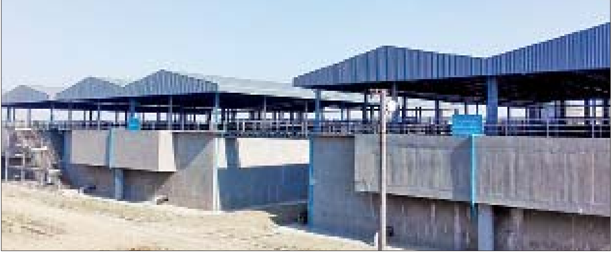
လွှန်းပြင်ရေပေးဝေရေးစီမံကိန်းမှ ရေစစ်ကန်များ တည်ဆောက်ထားမှုကို တွေ့ရစဉ်။

လက်ရှိတွင် ရန်ကုန်မြို့အတွက် ငမိုးရိပ်၊ ဖူးကြီး၊ ဂျိုးဖြူ ရေလှောင်ကန်တို့မှ သောက်သုံးရေဖြန့်ဖြူးပေးနေပြီး ရေပေးဝေမှုတိုးမြှင့်ပေးနိုင်ရန် လွှန်းပြင်ရေပေးဝေရေးစီမံကိန်းနှင့် ကုက္ကိုဝရေပေးဝေရေးစီမံကိန်းတို့ကို တိုးချဲ့ဆောင်ရွက်နေကြောင်း၊ ကုက္ကိုဝရေပေးဝေရေးစီမံကိန်းမှာ ၂၀၂၅ ခုနှစ်တွင် စာမျက်နှာ ၈ ကော်လံ ၁ သို့ ၀