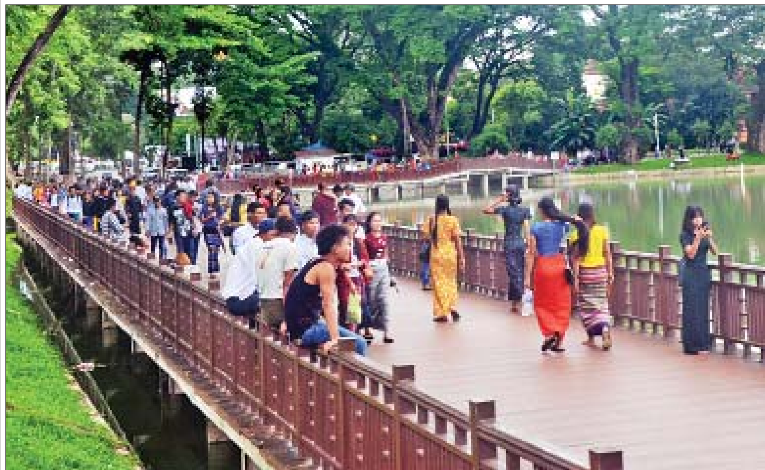
ဝါဆိုလပြည့်နေ့တွင် ရန်ကုန်မြို့ကန်တော်ကြီးပန်းခြံ၌ အပန်းဖြေလာရောက်ကြသူများဖြင့် စည်ကားလျက်ရှိသည်ကို တွေ့ရစဉ်။