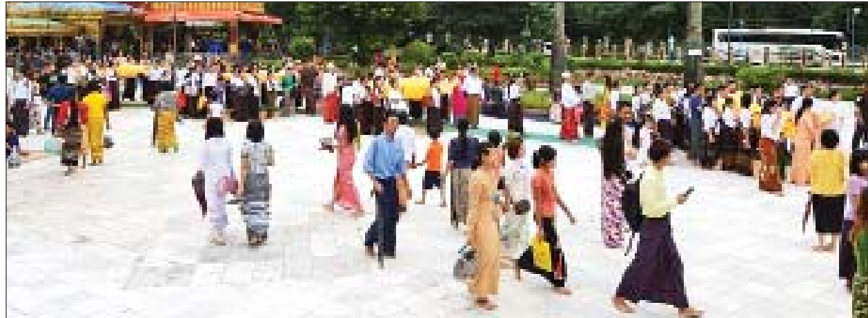
ဝါဆိုလပြည့်နေ့တွင် သီရိမင်္ဂလာ ကမ္ဘာအေးစေတီတော်ရင်ပြင်၌ ဘုရားဖူးလာပြည်သူများဖြင့် စည်ကားနေသည်ကို တွေ့ရစဉ်။