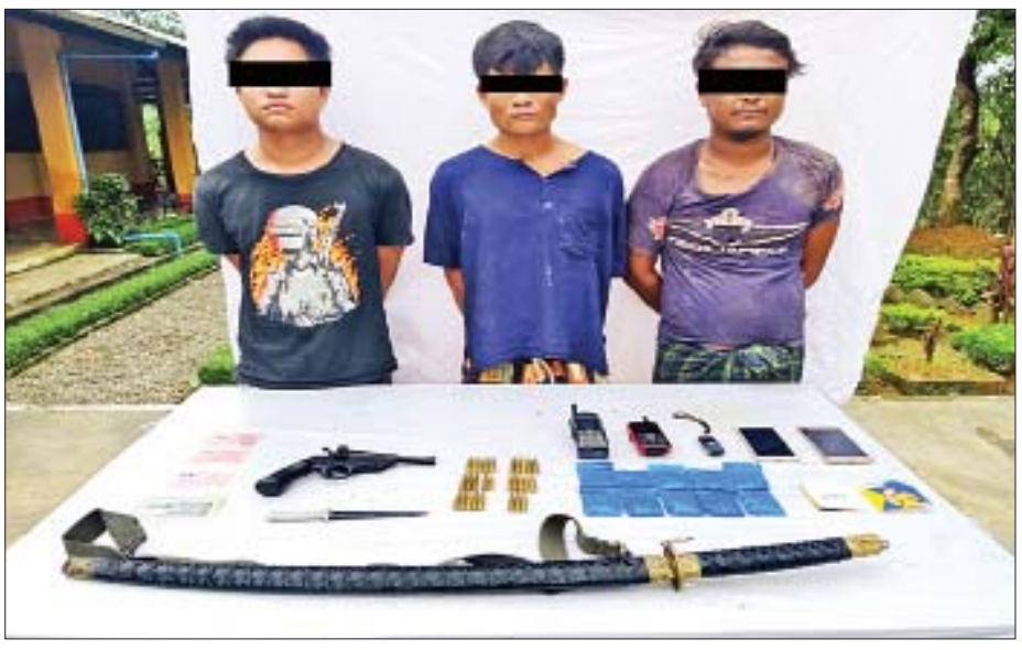
အရ အရေးယူနိုင်ရေး လုပ်ထုံးလုပ်နည်းနှင့်အညီ ဦးစီးချုပ်ရုံး၏ သတင်းထုတ်ပြန်ချက်အရ သိရသည်။ ဆောင်ရွက်လျက်ရှိကြောင်း တပ်မတော်ကာကွယ်ရေး သတင်းစဉ်