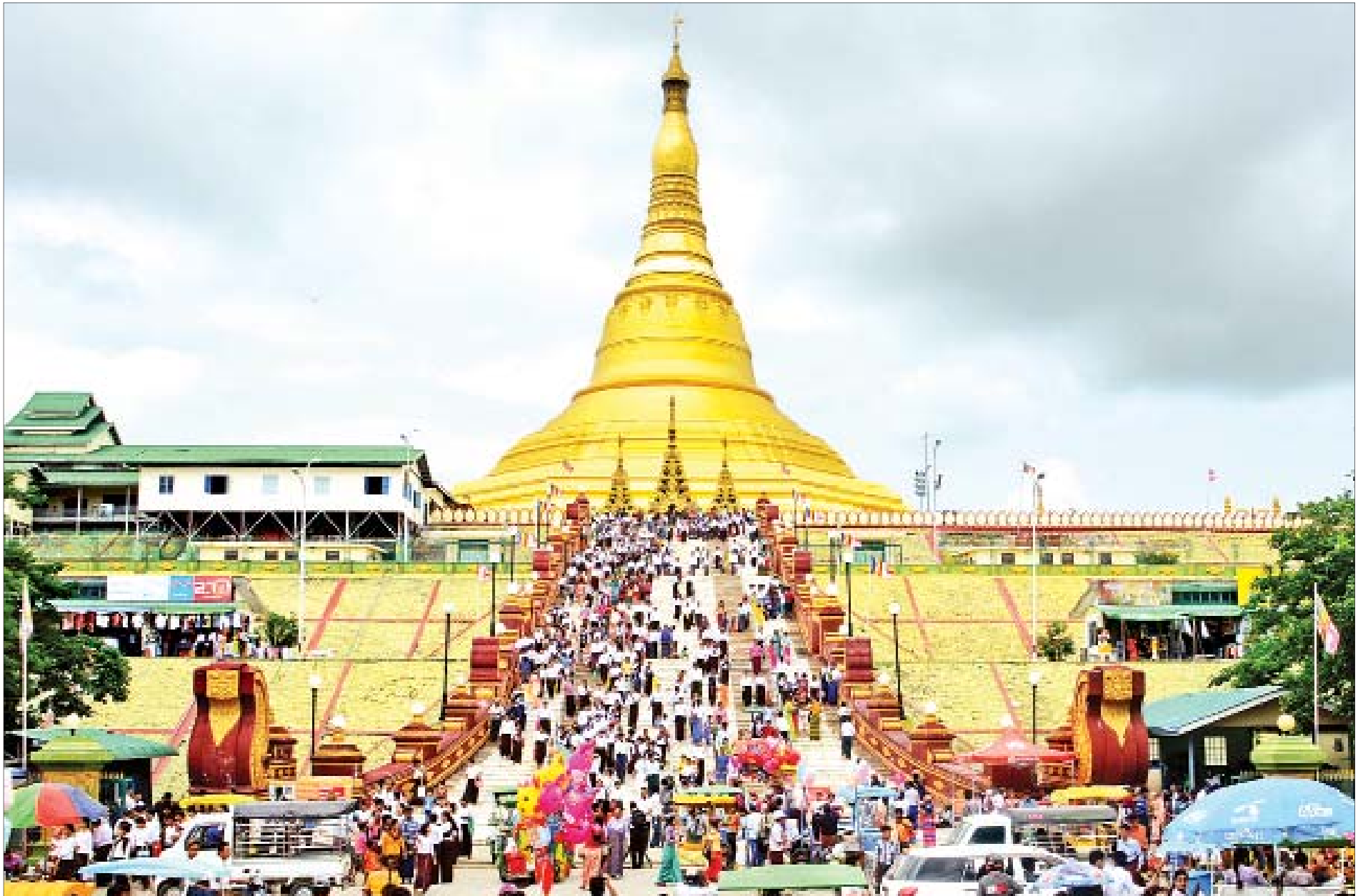
ဝါဆိုလပြည့်နေ့ ဓမ္မစကြာအခါတော်နေ့တွင် နေပြည်တော်ရှိ ဥပ္ပါတသန္တိစေတီတော်မြတ်ကြီး၌ ဘုရားဖူးလာပြည်သူများဖြင့် စည်ကားလျက်ရှိသည်ကို တွေ့ရစဉ်။