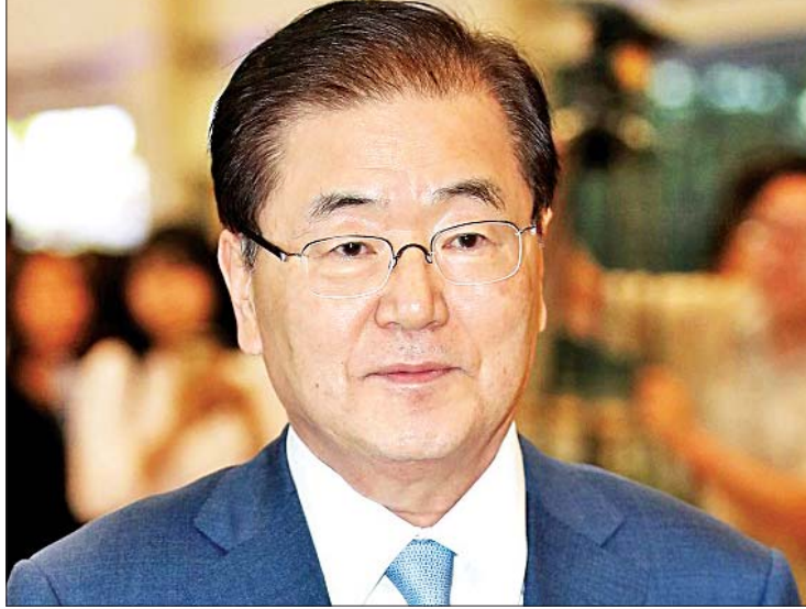
ဆိုးလ် ဇူလိုင် ၁၆

တောင်ကိုရီးယားနိုင်ငံသို့ ကုန်ပစ္စည်းတင်သွင်းမှု ပိတ်ပင်ခြင်းနှင့် ပတ်သက်ပြီး တောင်ကိုရီးယားအစိုးရအနေ ဖြင့် ပြတ်သားစွာလုပ်ဆောင်သွားမည်ဖြစ် သည်ဟု တောင်ကိုရီးယားအဆင့်မြင့် အရာရှိ တစ်ဦးက ယနေ့ပြောကြားခဲ့သည်။ လျှပ်ကာပစ္စည်းများ ထုတ်လုပ်ရာတွင် လိုအပ်သည့် နည်းပညာဖြင့် အဓိကပစ္စည်း များ တင်သွင်းမှုကို ဂျပန်က ဇူလိုင်၄ ရက်တွင် ပိတ်ပင်ခဲ့သည်။ ယင်းကိစ္စနှင့်ပတ်သက်ပြီး တောင်ကိုရီးယားအမျိုးသားလုံခြုံရေးဆိုင်ရာ ရုံးအကြီးအကဲ ချန်ဆီယွမ်က အာဏာရပါတီ လွှတ်တော်အမတ်များနှင့် ဇူလိုင် ၁၆ ရက်