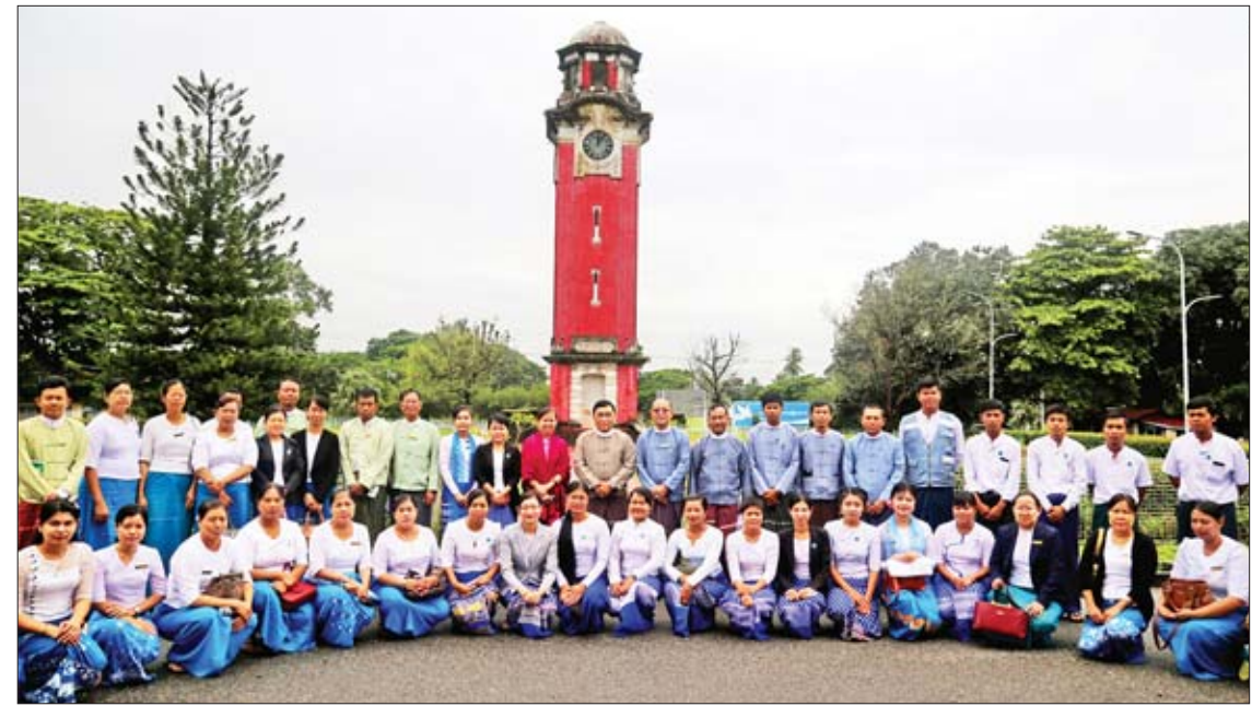
အစိုးရအနေဖြင့် ဦးတည်ချက်သုံးရပ် ချမှတ်လျက်ရှိပါကြောင်း၊ အခွင့်အလမ်းများကို ကြောင်း၊ ပေးအပ်ထားသော တာဝန်များကို ကာ အကောင်အထည်ဖော် ဆောင်ရွက် သာတူညီမျှစွာစားရရှိရန် ဆောင်ရွက်လျက်ရှိ လည်း ယခုထက်ပိုမိုတိုးတက်အောင်မြင်

အောင် ပူးပေါင်းဆောင်ရွက်ကြရန် လိုအပ်ကြောင်း ပြောကြားသည်။