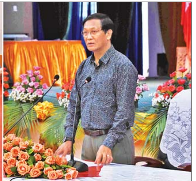
ဒုတိယသမ္မတ ဦးဟင်နရီဗန်ထီးယူ ပြည်နယ်ခန်းမ၌ ကယားပြည်နယ်ဝန်ကြီးချုပ်နှင့် ဝန်ကြီးများ၊ လွှတ်တော်ကိုယ်စားလှယ်များ၊ ပြည်နယ်၊ ခရိုင်နှင့် မြို့နယ်ဌာနဆိုင်ရာအဆင့်တာဝန်ရှိသူများအား တွေ့ဆုံမှာကြားစဉ်။

❖ ရှေ့မှ ယင်းနောက် နယ်စပ်ရေးရာဝန်ကြီးဌာန ပညာရေးနှင့် လေ့ကျင့်ရေးဦးစီးဌာန အမျိုးသမီးအိမ်တွင်းမှုသက်မွေးပညာသင်တန်းကျောင်း(လှိုင်ကော်)သို့ ရောက်ရှိရာ ဒုတိယသမ္မတအား သင်တန်းကျောင်း ကျောင်းအုပ်က သင်တန်းကျောင်းဆိုင်ရာ အချက်အလက်များနှင့်စပ်လျဉ်း၍ ရှင်းလင်းတင်ပြသည်။ ထို့နောက် ဒုတိယသမ္မတက နိုင်ငံတော်အနေဖြင့် နယ်စပ်ဒေသရှိ တိုင်းရင်းသူများ အလုပ်အကိုင်ရရှိရေးနှင့် သက်မွေးပညာတတ်မြောက်စေရန်အတွက် သင်တန်းကျောင်း ၄၅ ကျောင်းကို ရည်ရွယ်ချက်ငါးရပ်ဖြင့် ဖွင့်လှစ်သင်ကြားပေးလျက်ရှိကြောင်း၊ သင်တန်းသူများအနေဖြင့် သင်တန်းကျောင်းတွင် နေထိုင်သည့်ကာလတွင် ယုံကြည်ချက်ခိုင်ခိုင်မာမာ၊ ရိုင်းပင်းကူညီစိတ်၊ စည်းလုံးညီညွတ်စိတ်၊ တစ်ဦးအပေါ်တစ်ဦး သည်းခံနားလည်စိတ်တို့ဖြင့် စနစ်တကျ သင်ယူကြစေလိုကြောင်း၊ သင်တန်းဆရာများအနေဖြင့် သင်တန်းသူများအား ဆွေမျိုးသားချင်းသားဖွယ် သဘောထားပြီး လေ့ကျင့်သင်ကြားပေးစေလိုကြောင်း၊ သင်တန်းသူများအနေဖြင့် သင်တန်းပြီးဆုံးပြီးနောက် ကိုယ်ပိုင်အသက်မွေးဝမ်းကျောင်းလုပ်ငန်းများ လုပ်ကိုင်နိုင်သည်အထိ ကြိုးစားကြစေလိုကြောင်း ပြောကြားသည်။ ယင်းနောက် ဒုတိယသမ္မတသည် သင်တန်းသူများအား ရင်းရင်းနှီးနှီး နှုတ်ဆက်ပြီး သင်တန်းသူများ ချုပ်လုပ်ထားသည့် အဝတ်အထည်များ၊ အစားအသောက်များကို လိုက်လံကြည့်ရှုသည်။