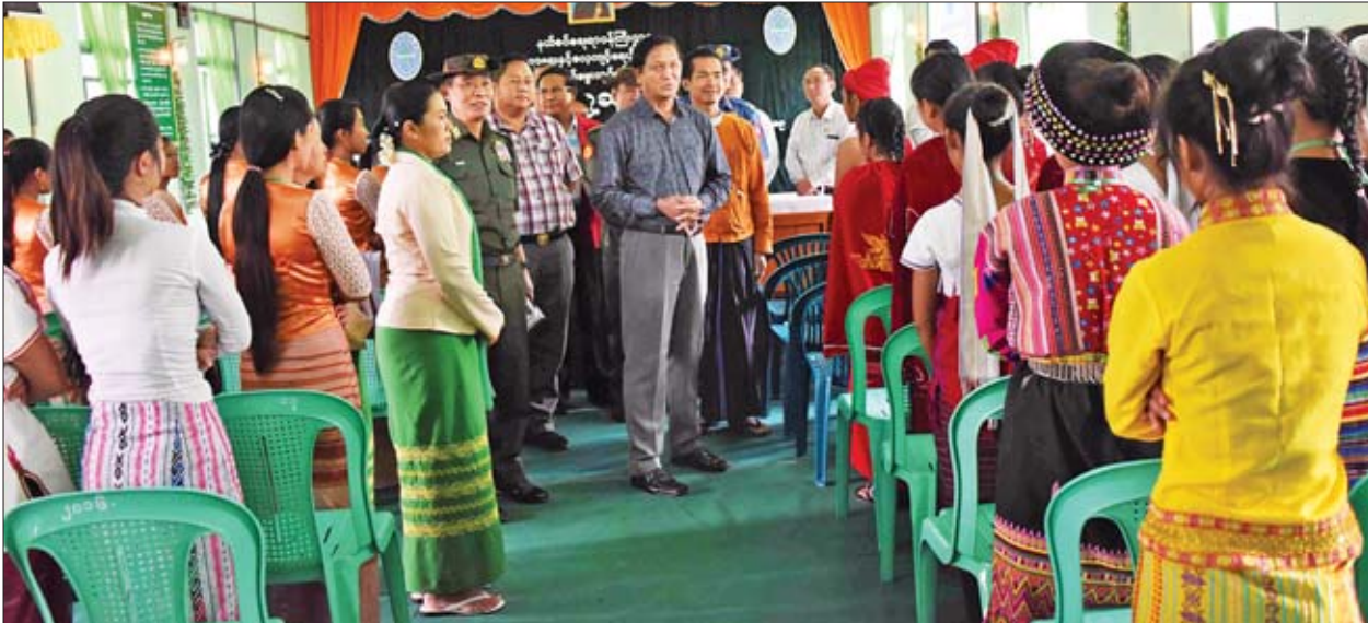
ဒုတိယသမ္မတ ဦးဟင်နရီဗန်ထီးယူ အမျိုးသမီးအိမ်တွင်းမှု သက်မွေးပညာသင်တန်းကျောင်း (လှိုင်ကော်)မှ သင်တန်းသူများအား ရင်းရင်းနှီးနှီးနှုတ်ဆက်စဉ်။