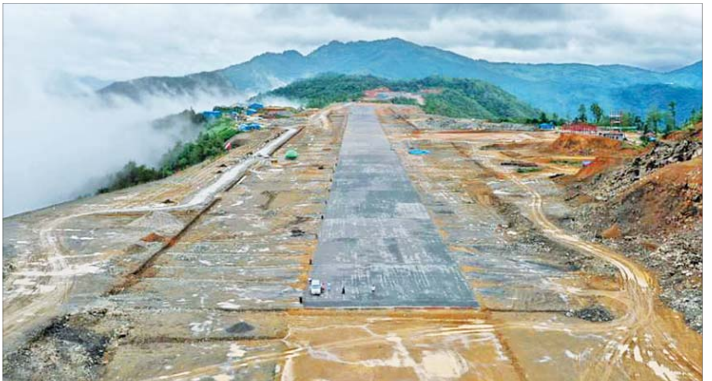
ချင်းပြည်နယ် ဖလမ်းမြို့ရှိ ဆူရ်ဘုန်လေယာဉ်ကွင်းသစ် တည်ဆောက်ရေးလုပ်ငန်းခွင်ကို တွေ့ရစဉ်။

“ဖလမ်းလေယာဉ်ကွင်း စီမံကိန်းကို ၂၀၁၆ ခုနှစ် ဧပြီလအတွင်းမှာ စတင်တည်ဆောက်ခဲ့ပါတယ်။ အခုသတ်မှတ်ထားတဲ့ လေယာဉ်ပြေးလမ်း ပေ ၆၀၀၀ မှာ ပေ ၄၀၀၀ ပြီးစီးနေပြီဖြစ်ပါတယ်။ ရာခိုင်နှုန်းအားဖြင့် ပြောရမယ်ဆိုရင် စာမျက်နှာ ၁၀ ကော်လံ ၁ သို့