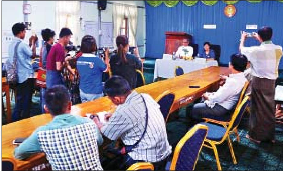
၆၂၈ ဦး၊ ရောဂါတွေ့ရှိသူ ၂၄၄ ဦး၊ သေဆုံးသူ ၄၃ ဦး၊ ၃၅ ဦး၊ ဖရောဝတီတိုင်းဒေသကြီးတွင် သုံးဦး၊ ပဲခူးတိုင်းဒေသကြီးတွင် နှစ်ဦး၊ စစ်ကိုင်းတိုင်းဒေသကြီးတွင် နှစ်ဦး၊ အများဆုံးသေဆုံးသူမှာ ရန်ကုန်တိုင်းဒေသကြီးတွင် နှစ်ဦး၊ စစ်ကိုင်းတိုင်းဒေသကြီးတွင် နှစ်ဦး၊

ရှေးဦးစွာ ပြည်နယ်ကုသရေးနှင့် ကျန်းမာရေးဦးစီးဌာနမှူး ဒေါက်တာဌေးလွင်က လွိုင်ကော်မြို့ ပြည်သူ့ဆေးရုံကြီးတွင် ရာသီတုပ်ကွေးရောဂါ(H1N1) တွေ့ရှိမှုနှင့်စပ်လျဉ်း၍ ပြောကြားရာတွင် အဆိုပါရောဂါသည် မိုးရာသီနှင့်ဆောင်းရာသီတွင် ကပ်ရောဂါအနေဖြင့် ဖြစ်ပွားတတ်ကြောင်း၊ ၂၀၁၉ ခုနှစ် ဇူလိုင်လ ၁၃ ရက်အထိ တစ်နိုင်ငံလုံးအတိုင်းတာနဲ့ H1N1 သံသယရှိသူ