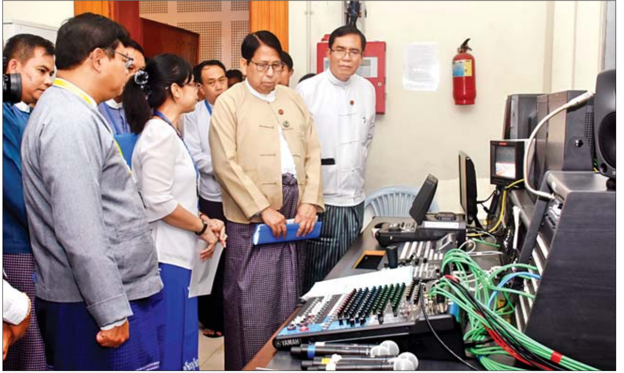
ပြည်ထောင်စုဝန်ကြီး ဒေါက်တာဖေမြင့် ပြည်ထောင်စုလွှတ်တော်အစည်းအဝေးခန်းမရှိ ရုပ်သံထိန်းချုပ်ခန်း၌ ကြည့်ရှုစစ်ဆေးစဉ်။

ထို့အတူ ပြည်ထောင်စုဝန်ကြီးနှင့် အဖွဲ့သည် ပြည်သူ့လွှတ်တော်ရှိ ပြည်တွင်း ပြည်ပ သတင်းမီဒီယာများ သတင်းရယူရန် သတ်မှတ်စီစဉ်ပေး ထားသည့် Media Corner ကိုလည်း လှည့်လည်ကြည့်ရှုခဲ့သည်။ သတင်းစဉ်