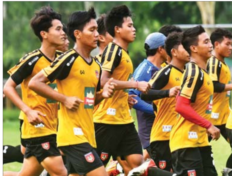
မြန်မာ ယူ-၁၈ အသင်း ဂျပန်ခရီးစဉ်အတွက် ရန်ကုန်မြို့၌ လေ့ကျင့်နေစဉ်။