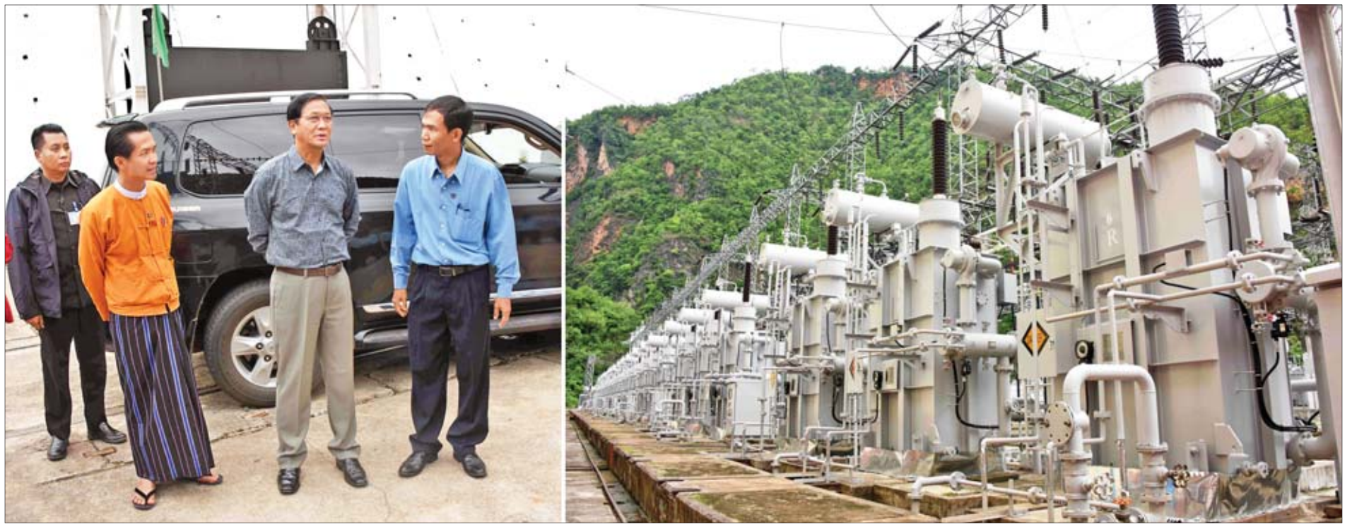
ဒုတိယသမ္မတ ဦးဟင်နရီဗန်ထီးယူ ဘီလူးချောင်း အမှတ်(၂) ရေအားလျှပ်စစ်ဓာတ်အားပေးစက်ရုံ၏ ဓာတ်အားပိုလွှတ်ရေးလိုင်းများကို ကြည့်ရှုစဉ်။

ကယားပြည်နယ် လွိုင်ကော်မြို့၌ ရောက်ရှိနေသည့် ဒုတိယသမ္မတ ဦးဟင်နရီဗန်ထီးယူသည် ကယားပြည်နယ်ဝန်ကြီးချုပ် ဦးအယ်လ်စောင်းရှို၊ ဒုတိယဝန်ကြီး ဝိုလ်ချုပ်မြင့်နွယ်၊ ဝိုလ်ချုပ်သန်းထွဋ်နှင့် ဦးတင်မြင့်၊ တာဝန်ရှိသူများနှင့်အတူ ယနေ့နံနက်ပိုင်းတွင် လွိုင်ကော်မြို့နယ်ရှိ ဘီလူးချောင်းအမှတ်(၂) ရေအားလျှပ်စစ်ဓာတ်အားပေးစက်ရုံသို့ ရောက်ရှိကြသည်။