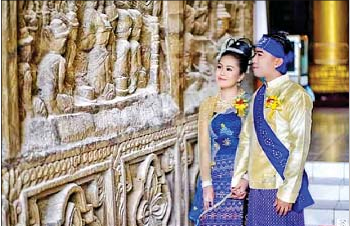
ရသော အင်္ကျီဖြစ်သည်။ အမျိုးသမီးအင်္ကျီမှာ ရခိုင်ရိုးရာ ထိုင်မသိမ်းပုံကို မွမ်းမံထားခြင်း ဖြစ်၏။ ရင်နားတစ်ဖက်စီတွင် သဇင်ပန်းနွယ် ကို တောက်လျှောက် ဖော်ဆောင်ရပါမည်။

အမျိုးသမီးဝတ်စုံ အမျိုးသမီးများ ရိုးရာဝတ်စုံအပြည့် ဆင်ယင်ရသောအခါ အမိတ်အဆာပန်းအနား ကွက်ပါသော ရိုးရာခြုံထည် တဘက်ကြီးကို ခြုံ၍ဝတ်ဆင်ရသည်။ အပေါ်ဝတ်အင်္ကျီကို အမျိုးသားများကဲ့သို့ အပေါ်မှထပ်၍ ဝတ်ဆင်