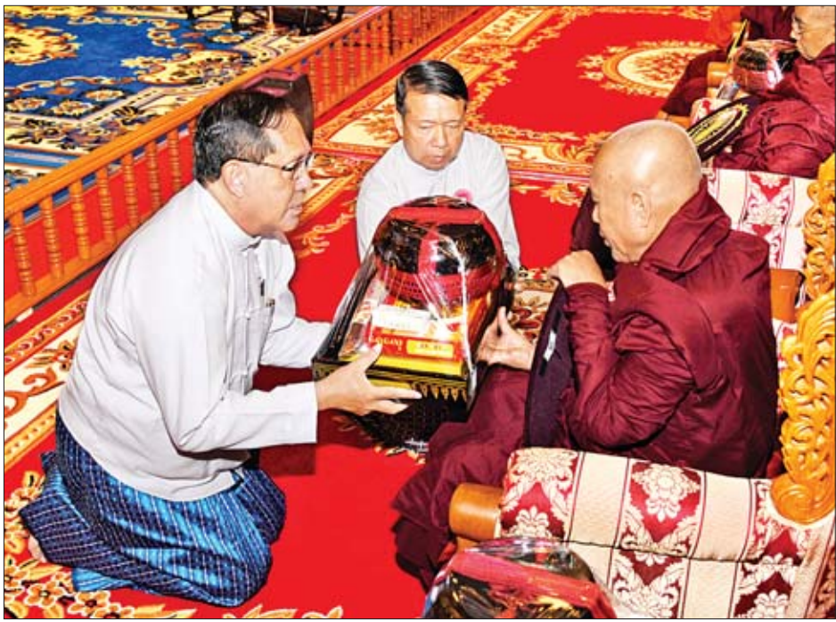
ပြည်ထောင်စုတရားသူကြီးချုပ် ဦးထွန်းထွန်းဦး နိုင်ငံတော်သံဃမဟာနာယကအဖွဲ့ ဒုတိယဥက္ကဋ္ဌ ဓမ္မရောင်ခြည် ဆရာတော် ဘဒ္ဒန္တ အဂ္ဂဓမ္မထံ ဝါဆိုသင်္ကန်းနှင့် လှူဖွယ်ဝတ္ထုပစ္စည်းများ ဆက်ကပ်လှူဒါန်းစဉ်။