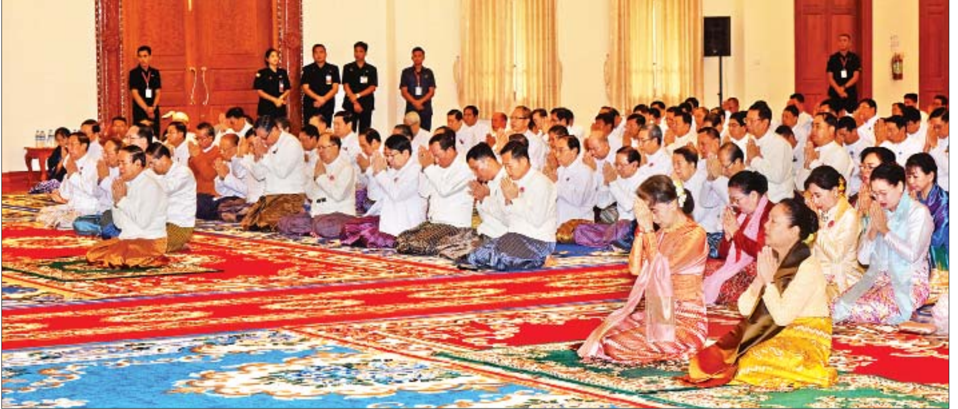
နိုင်ငံတော်သံယမဟာနာယကအဖွဲ့ဥက္ကဋ္ဌ မန္တလေးမြို့၊ ဗန်းမော်ကျောင်းတိုက် ပဓာနနာယကဆရာတော် ဒေါက်တာဘဒ္ဒန္တကုမာရာဘိဝံသထံမှ နိုင်ငံတော်သမ္မတ ဦးဝင်းမြင့်နှင့်ဇနီး ဒေါ်ချိုချို၊ နိုင်ငံတော်၏အတိုင်ပင်ခံပုဂ္ဂိုလ် ဒေါ်အောင်ဆန်းစုကြည်နှင့် ဧည့်ပရိသတ်များက ငါးပါးသီလခံယူဆောက်တည်ကြစဉ်။