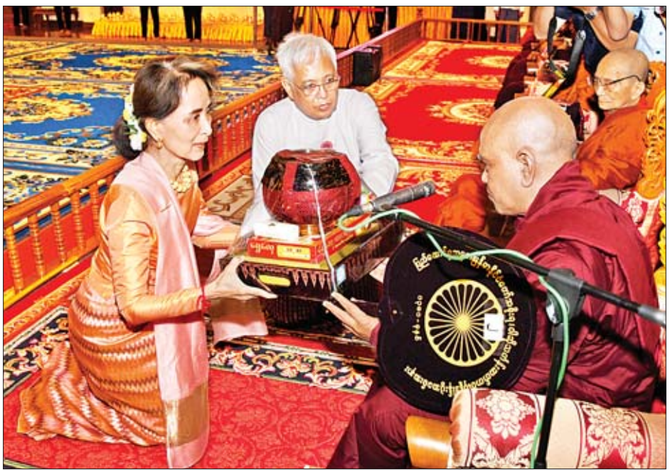
နိုင်ငံတော်၏အတိုင်ပင်ခံပုဂ္ဂိုလ် ဒေါ်အောင်ဆန်းစုကြည် နိုင်ငံတော်သံဃမဟာနာယကအဖွဲ့အကျိုးတော်ဆောင် သန်လျင်မင်းကျောင်း ပထမပြန်စာသင်တိုက် ပဓာနနာယကဆရာတော် အဂ္ဂမဟာပဏ္ဍိတ ဘဒ္ဒန္တစန္ဒိမာဘိဝံသထံ ဝါဆိုသင်္ကန်းနှင့် လှူဖွယ်ဝတ္ထုပစ္စည်းများ ဆက်ကပ်လှူဒါန်းစဉ်။

★ ရှေ့မှ ဝါဆိုသင်္ကန်းဆက်ကပ်လှူဒါန်းပွဲ မင်္ဂလာအခမ်းအနားမစတင်မီ နိုင်ငံတော်၏အတိုင်ပင်ခံပုဂ္ဂိုလ် ဒေါ်အောင်ဆန်းစုကြည်က သာသနာ့ဗိမာန်တော်အတွင်းရှိ ဗုဒ္ဓရုပ်ပွားတော်မြတ်အား ဖူးမြော်ကြည်ညိုပြီး ဆွမ်း၊ သစ်သီး၊ ပန်း၊ ရေချမ်းနှင့် ဆီမီးတို့ ဆက်ကပ်လှူဒါန်းသည်။