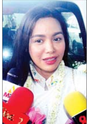
သရုပ်ဆောင် အေးဝတ်ရည်သောင်း