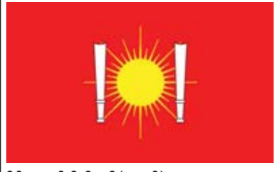
ဒီမိုကရေစီပါတီသစ်(ကချင်) [New Democracy Party (Kachin)] ၏ တံဆိပ်ပုံစံ

ဒီမိုကရေစီပါတီသစ်(ကချင်) [New Democracy Party (Kachin)] [N.D.P(Kachin)] ၏ အလံပုံစံ