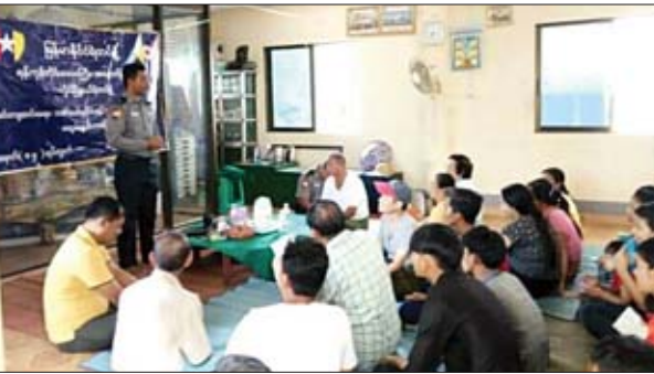
လှိုင်မြို့နယ် အမှတ် ၁၄ ရပ်ကွက် စိန်ပန်းဓမ္မာရုံ၌ ဇူလိုင် ၁၁ ရက် ညနေ ၄ နာရီက ပိတောက်ချောင်းနယ်မြေရဲစခန်း စခန်းမှူး ရဲအုပ်ညီညွတ် ရပ်ကွက်နေပြည်သူ ၃၅ ဦးခန့်အား မှုခင်းကျဆင်းရေး သက်ငယ်မှဒိမ်းနှင့် လူကုန်ကူးမှုတားဆီးကာကွယ်ရေး အသိပညာပေးဟောပြောစဉ်။ ကိုရဲ

နေပြည်တော် ဇူလိုင် ၁၂ ပြည်ထောင်စုရွေးကောက်ပွဲကော်မရှင်သည် နိုင်ငံရေးပါတီမှတ်ပုံတင်ခွင့် လျှောက်ထားချက်များကို စိစစ်ခွင့်ပြုပေးလျက်ရှိရာ ၂၀၁၉ ခုနှစ်၊ ဇူလိုင်လ ၂၁ ရက်နေ့တွင် ဒီမိုကရေစီပါတီသစ်(ကချင်)[New Democracy Party (Kachin)](N.D.P(Kachin)) က ပြည်ထောင်စုရွေးကောက်ပွဲကော်မရှင်သို့ နိုင်ငံရေးပါတီမှတ်ပုံတင်ခွင့် လာရောက်လျှောက်ထားခဲ့ကြောင်း သတင်းရရှိသည်။ သတင်းစဉ်