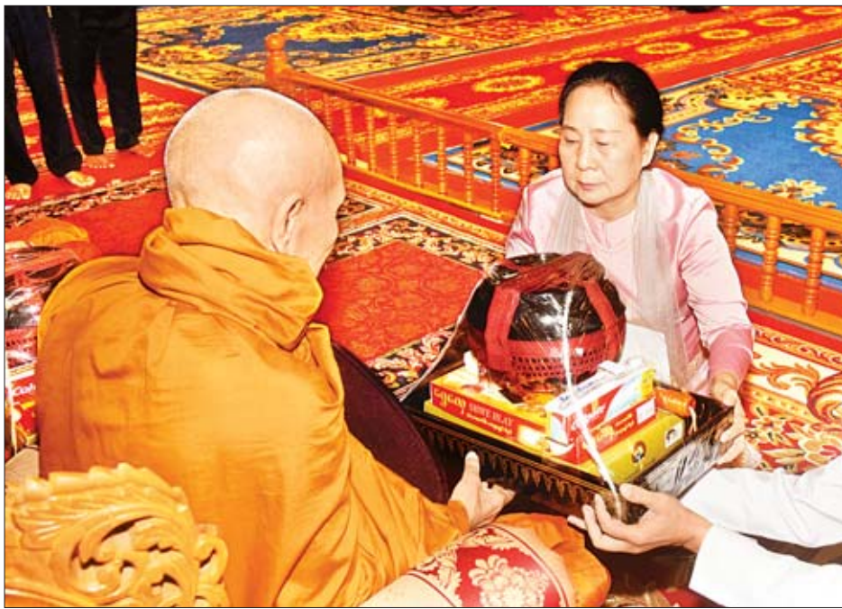
အမျိုးသားလွှတ်တော်ဥက္ကဋ္ဌ မန်းဝင်းခိုင်သန်း၏ဇနီး ဒေါ်နန်းကြင်ကြည် နိုင်ငံတော်သံဃမဟာနာယကအဖွဲ့ ဒုတိယဥက္ကဋ္ဌ မိုင်းသောက်၊ ညောင်ရွှေဆရာတော် ဘဒ္ဒန္တ သုမင်္ဂလာဘိဝံသထံ ဝါဆိုသင်္ကန်းနှင့် လှူဖွယ်ဝတ္ထုပစ္စည်းများ ဆက်ကပ်လှူဒါန်းစဉ်။

❖ စာမျက်နှာ ၃ မှ ယင်းနောက် ပြည်ထောင်စုဝန်ကြီးများ၊ ပြည်ထောင်စု ရှေ့နေချုပ်၊ ပြည်ထောင်စု စာရင်းစစ်ချုပ်၊ ပြည်ထောင်စု ရာထူးဝန်အဖွဲ့ဥက္ကဋ္ဌ၊ နေပြည်တော်ကောင်စီ ဥက္ကဋ္ဌ၊ မြန်မာနိုင်ငံ လူ့အခွင့်အရေးကော်မရှင် ဥက္ကဋ္ဌ၊ ညှိနှိုင်းကွပ်ကဲရေးမှူး(ကြည်း၊ ရေ၊ လေ)၊ ပြည်သူ့ငွေစာရင်းကော်မတီ ဥက္ကဋ္ဌ၊ နေပြည်တော်တိုင်းစစ်ဌာနချုပ် တိုင်းမှူး၊ ဒုတိယဝန်ကြီးများနှင့် နေပြည်တော် ကောင်စီဝင်တို့က ဆရာတော်၊ သံဃာတော်များထံ ဝါဆိုသင်္ကန်းနှင့် လှူဖွယ်ဝတ္ထုပစ္စည်းများ ဆက်ကပ်လှူဒါန်းကြသည်။ ထို့နောက် နိုင်ငံတော်သံဃမဟာနာယကအဖွဲ့ အကျိုးတော်ဆောင် သန်လျင် မင်းကျောင်း ပထမပြန်စာသင်တိုက်ပဓာနနာယက ဆရာတော်ထံမှ နိုင်ငံတော်သမ္မတနှင့်ဇနီး၊ နိုင်ငံတော်၏အတိုင်ပင်ခံပုဂ္ဂိုလ်နှင့် ဧည့်ပရိသတ်များက အနုမောဒနာ တရားနာယူကြပြီး လှူဒါန်းမှုအစုစုတို့အတွက် ရေစက်သွန်းလောင်းအမှုပေးဝေကြသည်။ နေဆွမ်းဆက်ကပ် အခမ်းအနားအပြီးတွင် နိုင်ငံတော်သမ္မတ ဦးဝင်းမြင့်နှင့်ဇနီးဒေါ်ချိုချို၊ နိုင်ငံတော်၏အတိုင်ပင်ခံပုဂ္ဂိုလ် ဒေါ်အောင်ဆန်းစုကြည်နှင့် ဧည့်ပရိသတ်များက ဆရာတော်၊ သံဃာတော်များအား နေဆွမ်းဆက်ကပ်လှူဒါန်းကြသည်။ သတင်းစဉ်