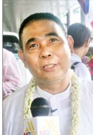
ဦးဝင်းမြင့်

အားကောင်းလာပြီး ပြည်သူတွေရဲ့လူနေမှုဘဝတွေ ပိုမိုတိုးတက်လာမယ်လို့မြင်ပါတယ်။ ပုဂံဒေသကို ဆက်လက် ထိန်းသိမ်းစောင့်ရှောက်မှုအပိုင်းအနေနဲ့ကတော့ ပြည်သူတွေအားလုံး ပူးပေါင်းပါဝင်ဖို့လိုပါတယ်။ ပုဂံဒေသအတွက် ပြည်သူတွေပါဝင်တဲ့ ဥပဒေသစ်ရေးဆွဲထားပြီးပြီ။ အဲဒီအပေါ်မှာ နည်းဥပဒေတွေထုတ်မယ်။ အဲဒီစည်းမျဉ်းစည်းကမ်းတွေကလည်း ပြည်သူတွေကိုချပြပြီး လုပ်ထားတဲ့ စည်းမျဉ်းစည်းကမ်းတွေဖြစ်ပါတယ်။ ညွှန်ကြားရေးမှူးချုပ် ဦးသန်းဇော်ဦး (ကမ္ဘာ့အမွေအနှစ်ဒေသများဌာနခွဲ) ရှေးဟောင်းသုတေသနနှင့် အမျိုးသားပြတိုက်ဦးစီးဌာန) ၁၉၉၄ ခုနှစ်ကတည်းက အစဉ်အဆက်လုပ်ဆောင်ခဲ့တဲ့ အကျိုးရလဒ်ပါ။ အခုပုဂံဆိုရင် အဓိကကတော့ သူ့ရဲ့ တန်ဖိုးရယ်။ စီမံခန့်ခွဲမှုရယ် နှစ်ခုလုံးမှာ နိုင်ငံတော်အနေနဲ့ အားလုံးစွမ်းဆောင်နိုင်တဲ့ အနေအထားပါ။ ပုဂံရဲ့တန်ဖိုးက ရှိပြီးသားပါ။ တစ်ချိန်တည်းမှာပဲ ပြောင်းလဲလာတဲ့ လူမှုစီးပွားဘဝရယ်။ နိုင်ငံသူ နိုင်ငံသားတွေရဲ့ ယဉ်ကျေးမှုအမွေအနှစ်အပေါ်မှာထားတဲ့ စိတ်ထားတွေနဲ့အတူ အဖွဲ့အစည်းတွေ၊ အစိုးရနဲ့ပြည်သူလူထုအားလုံး ပူးပေါင်းပါဝင်ဆောင်ရွက်တဲ့အတွက်ကြောင့် ပုဂံကို ကမ္ဘာ့အမွေအနှစ်စာရင်းဝင်အဖြစ် ရရှိခဲ့တာပါ။ အခုလို ပုဂံဒေသရရှိခြင်းဟာ ကျွန်တော်တို့နိုင်ငံသားအားလုံးအတွက် ကမ္ဘာမိသားစုထဲမှာပါဝင်နိုင်သလို မြန်မာနိုင်ငံသူ နိုင်ငံသားတွေရဲ့ စွမ်းဆောင်ရည်ကိုလည်း နိုင်ငံတကာက အသိအမှတ်ပြုတယ်။ လက်ခံတယ်။ အဲဒီအပေါ်မှာ မူတည်ပြီးတော့လည်း ကျွန်တော်တို့အနေနဲ့ ဆက်လက်ပြီးတော့ ပူးပေါင်းဆောင်ရွက်ဖို့လိုတယ်။ ယဉ်ကျေးမှု၊ လူမှုစီးပွားဘဝနဲ့ အခြား