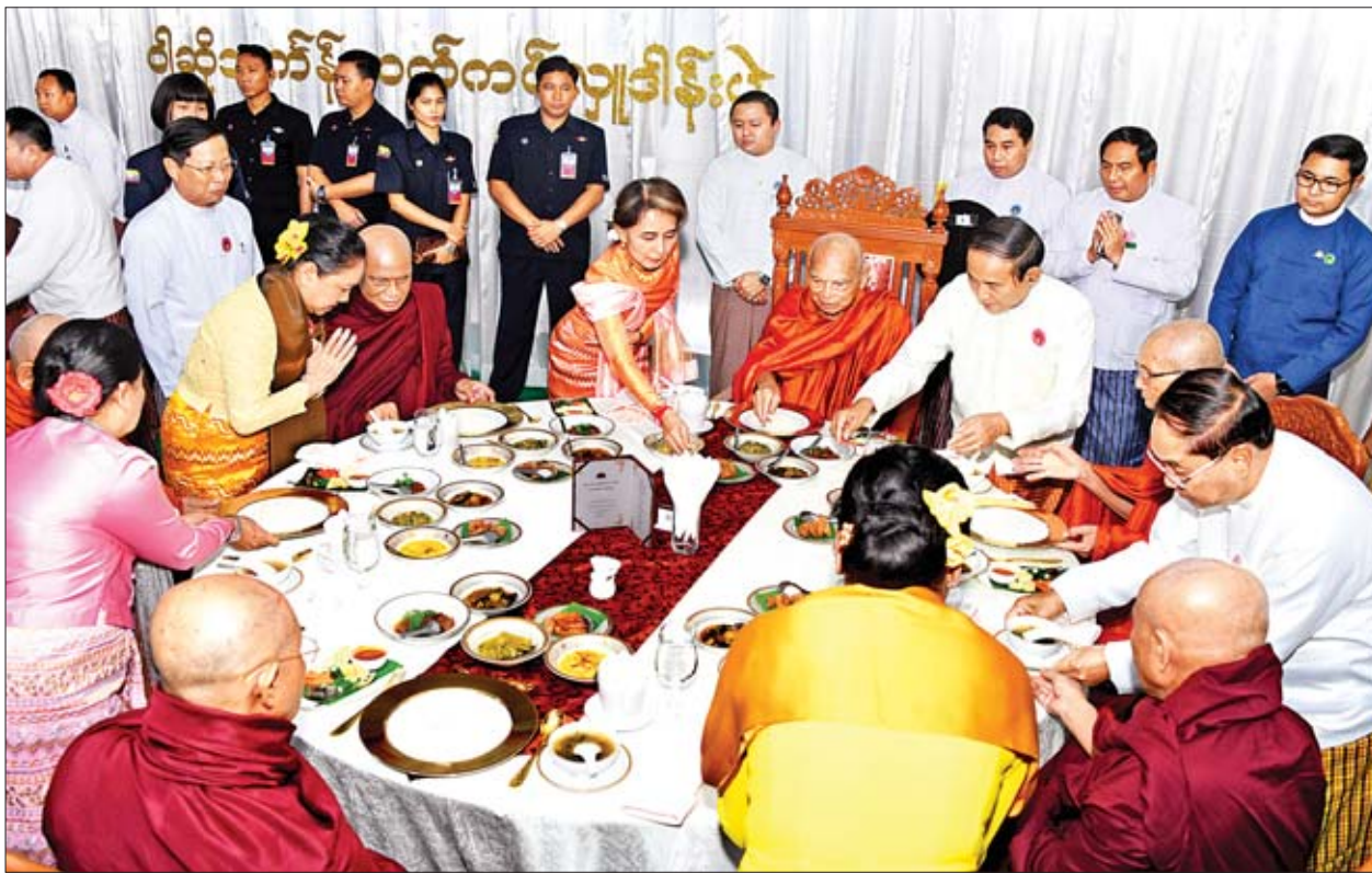
နိုင်ငံတော်သမ္မတဦးဝင်းမြင့်နှင့်ဇနီး ဒေါ်ချိုချို၊ နိုင်ငံတော်၏အတိုင်ပင်ခံပုဂ္ဂိုလ် ဒေါ်အောင်ဆန်းစုကြည်နှင့် ဧည့်ပရိသတ်များ ဆရာတော်၊ သံဃာတော်များအား နေဆွမ်းဆက်ကပ်လှူဒါန်းကြစဉ်။

မြန်မာနိုင်ငံပြန်တမ်း ဝန်ထမ်းအဖွဲ့အစည်းအကြီးအမှူး ခန့်ထားခြင်း ပြည်ထောင်စုသမ္မတမြန်မာနိုင်ငံတော် နိုင်ငံတော်သမ္မတသည် မြန်မာနိုင်ငံတော်ဗဟိုဘဏ် ငွေကြေးစီမံခန့်ခွဲမှုဌာနမှ ဒုတိယညွှန်ကြားရေးမှူးချုပ် ဦးဝင်းမြင့်ကို ယင်းဌာန၏ ညွှန်ကြားရေးမှူးချုပ်အဖြစ် တာဝန်ဝတ္တရားများကို စတင်ဆောင်ရွက်သည်နေ့မှစ၍ အစမ်းခန့်ထားလိုက်သည်။