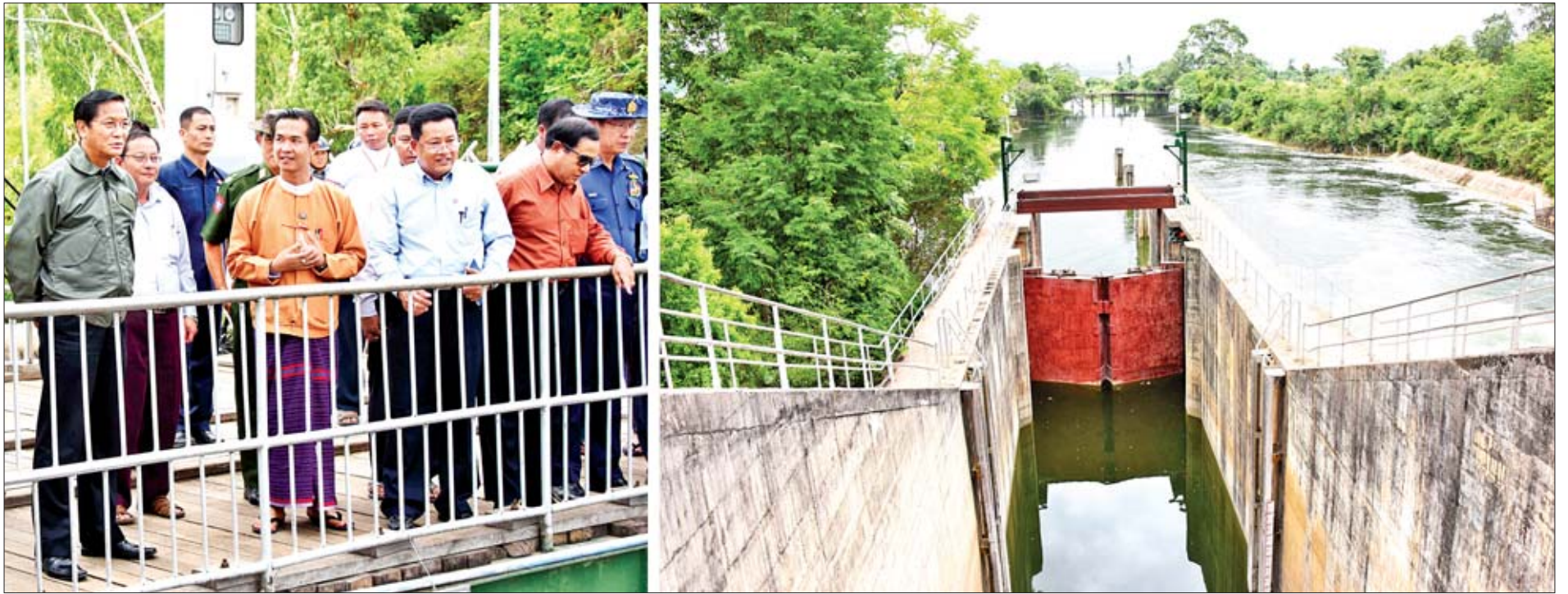
ဒုတိယသမ္မတ ဦးဟင်နရီဝန်ထီးယူ၊ ကယားပြည်နယ်ဝန်ကြီးချုပ် ဦးအယ်လ်ဖောင်းရှိနှင့် တာဝန်ရှိသူများ ရေပိုလွှဲအဆောက်အအုံပေါ်မှ စက်လှေဆိပ်ပြုလုပ်သည့် ရေထိန်းတံခါးနေရာနှင့် ရေလှောင်တံခါးအတွင်း ရေဝင်ရောက်မှုကို ကြည့်ရှုစဉ်။