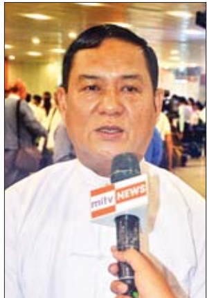
ဒုတိယဝန်ကြီး ဦးကြည်မင်း

အားကောင်းလာပြီး ပြည်သူတွေရဲ့လူနေမှုဘဝတွေ ပိုမိုတိုးတက်လာမယ်လို့မြင်ပါတယ်။ ပုဂံဒေသကို ဆက်လက် ထိန်းသိမ်းစောင့်ရှောက်မှုအပိုင်းအနေနဲ့ကတော့ ပြည်သူတွေအားလုံး ပူးပေါင်းပါဝင်ဖို့လိုပါတယ်။ ပုဂံဒေသအတွက် ပြည်သူတွေပါဝင်တဲ့ ဥပဒေသစ်ရေးဆွဲထားပြီးပြီ။ အဲဒီအပေါ်မှာ နည်းဥပဒေတွေထုတ်မယ်။ အဲဒီစည်းမျဉ်းစည်းကမ်းတွေကလည်း ပြည်သူတွေကိုချပြပြီး လုပ်ထားတဲ့ စည်းမျဉ်းစည်းကမ်းတွေဖြစ်ပါတယ်။ ညွှန်ကြားရေးမှူးချုပ် ဦးသန်းဇော်ဦး (ကမ္ဘာ့အမွေအနှစ်ဒေသများဌာနခွဲ) ရှေးဟောင်းသုတေသနနှင့် အမျိုးသားပြတိုက်ဦးစီးဌာန) ၁၉၉၄ ခုနှစ်ကတည်းက အစဉ်အဆက်လုပ်ဆောင်ခဲ့တဲ့ အကျိုးရလဒ်ပါ။ အခုပုဂံဆိုရင် အဓိကကတော့ သူ့ရဲ့ တန်ဖိုးရယ်။ စီမံခန့်ခွဲမှုရယ် နှစ်ခုလုံးမှာ နိုင်ငံတော်အနေနဲ့ အားလုံးစွမ်းဆောင်နိုင်တဲ့ အနေအထားပါ။ ပုဂံရဲ့တန်ဖိုးက ရှိပြီးသားပါ။ တစ်ချိန်တည်းမှာပဲ ပြောင်းလဲလာတဲ့ လူမှုစီးပွားဘဝရယ်။ နိုင်ငံသူ နိုင်ငံသားတွေရဲ့ ယဉ်ကျေးမှုအမွေအနှစ်အပေါ်မှာထားတဲ့ စိတ်ထားတွေနဲ့အတူ အဖွဲ့အစည်းတွေ၊ အစိုးရနဲ့ပြည်သူလူထုအားလုံး ပူးပေါင်းပါဝင်ဆောင်ရွက်တဲ့အတွက်ကြောင့် ပုဂံကို ကမ္ဘာ့အမွေအနှစ်စာရင်းဝင်အဖြစ် ရရှိခဲ့တာပါ။ အခုလို ပုဂံဒေသရရှိခြင်းဟာ ကျွန်တော်တို့နိုင်ငံသားအားလုံးအတွက် ကမ္ဘာမိသားစုထဲမှာပါဝင်နိုင်သလို မြန်မာနိုင်ငံသူ နိုင်ငံသားတွေရဲ့ စွမ်းဆောင်ရည်ကိုလည်း နိုင်ငံတကာက အသိအမှတ်ပြုတယ်။ လက်ခံတယ်။ အဲဒီအပေါ်မှာ မူတည်ပြီးတော့လည်း ကျွန်တော်တို့အနေနဲ့ ဆက်လက်ပြီးတော့ ပူးပေါင်းဆောင်ရွက်ဖို့လိုတယ်။ ယဉ်ကျေးမှု၊ လူမှုစီးပွားဘဝနဲ့ အခြား