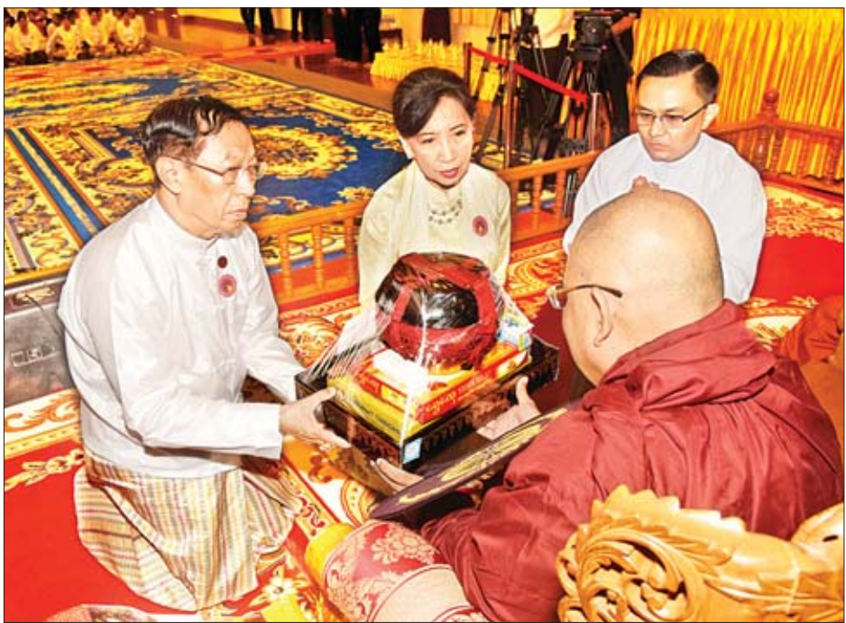
ပြည်ထောင်စုရွေးကောက်ပွဲကော်မရှင်ဥက္ကဋ္ဌ ဦးလှသိန်းနှင့် ဇနီး ဒေါ်အေးသီတာ နိုင်ငံတော်သံဃမဟာနာယကအဖွဲ့ ဒုတိယဥက္ကဋ္ဌ ကျိုက္ခမိဆရာတော် ဘဒ္ဒန္တ နန္ဒသာရထံ ဝါဆိုသင်္ကန်းနှင့် လှူဖွယ်ဝတ္ထုပစ္စည်းများ ဆက်ကပ်လှူဒါန်းစဉ်။