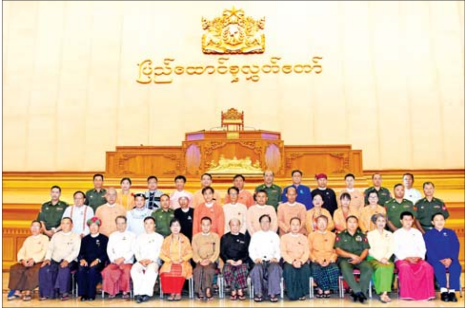
နိုင်ငံရေးပါတီများမှ လွှတ်တော် ကိုယ်စားလှယ်များနှင့် တပ်မတော် သားလွှတ်တော်ကိုယ်စားလှယ်များ၊ ပြည်ထောင်စု လွှတ်တော်ရုံးမှ တာဝန်ရှိသူများ တက်ရောက်ခဲ့ကြ သည်။ ယနေ့ကျင်းပသည့် အစည်းအဝေး တွင် ပူးပေါင်းကော်မတီက ပြည်ထောင်စု လွှတ်တော်သို့တင်သွင်းမည့် အစီ ရင်ခံစာကို ပူးပေါင်းကော်မတီဝင် များအားလုံးက အတည်ပြု လက်မှတ် ရေးထိုးခြင်း၊ စုပေါင်းမှတ်တမ်းဓာတ်ပုံ ရိုက်ခြင်း အစီအစဉ်များ ဆောင်ရွက် ခဲ့ကြကြောင်း သိရသည်။ သတင်းစဉ်

နေပြည်တော် ဧပြီလ ၁၂ ပြည်ထောင်စုသမ္မတ မြန်မာနိုင်ငံ တော်ဖွဲ့စည်းပုံအခြေခံဥပဒေ (၂၀၀၈ ခုနှစ်) ပြင်ဆင်ရေး ပူးပေါင်းကော် မတီအစည်းအဝေး (၂၅/၂၀၁၉) ကို ယနေ့ နံနက် ၁၀ နာရီက ပြည်ထောင်စုလွှတ်တော် D ဆောင် ဒုတိယထပ် အစည်းအဝေးခန်းမ၌ ကျင်းပသည်။ အစည်းအဝေးသို့ ဖွဲ့စည်းပုံ အခြေခံဥပဒေ (၂၀၀၈ ခုနှစ်) ပြင်ဆင် ရေး ပူးပေါင်းကော်မတီဥက္ကဋ္ဌ ပြည်ထောင်စုလွှတ်တော် ဒုတိယ နာယက ပြည်သူ့လွှတ်တော် ဒုတိယ ဥက္ကဋ္ဌ ဦးထွန်းအောင်(ခ) ဦးထွန်းထွန်းဟိန်၊ ဖွဲ့စည်းပုံအခြေခံ ဥပဒေ (၂၀၀၈ ခုနှစ်) ပြင်ဆင်ရေး ပူးပေါင်းကော်မတီ ဒုတိယဥက္ကဋ္ဌ အမျိုးသားလွှတ်တော် ဒုတိယဥက္ကဋ္ဌ ဦးအေးသာအောင်၊ ပူးပေါင်းကော်မတီ အတွင်းရေးမှူး ဒေါက်တာမြတ်ဉာဏ်၊ တွဲဖက်အတွင်းရေးမှူး ဦးဌေးဝင်းအောင် (ခ)ဦးပြုံးချို၊ အဖွဲ့ဝင်များဖြစ်ကြသည့်