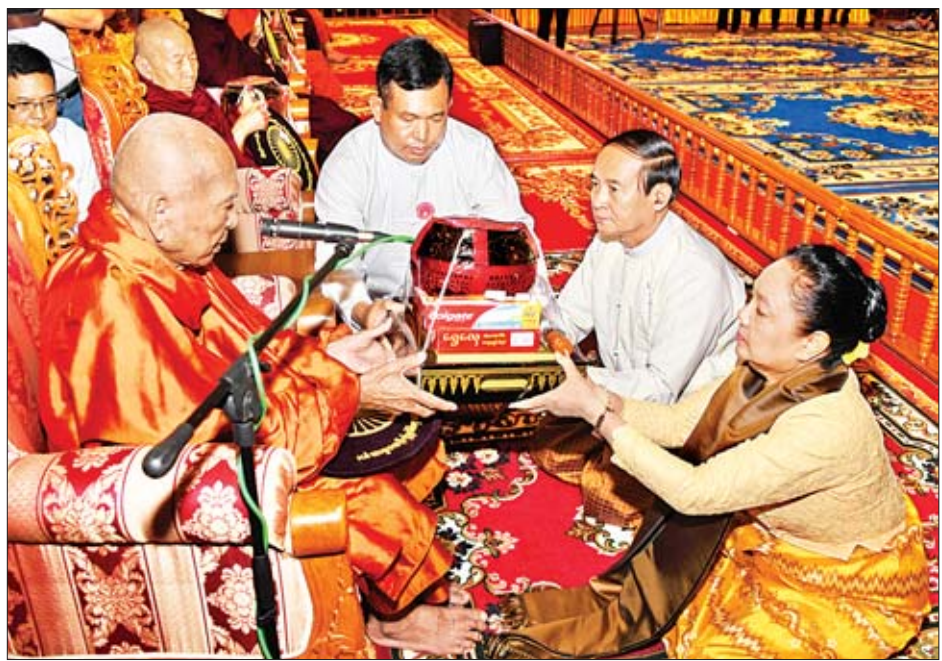
နိုင်ငံတော်သမ္မတ ဦးဝင်းမြင့်နှင့်ဇနီး ဒေါ်ချိုချို နိုင်ငံတော်သံဃမဟာနာယကအဖွဲ့ဥက္ကဋ္ဌ မန္တလေးမြို့ဗန်းမော်ကျောင်းတိုက် ပဓာနနာယကဆရာတော် ဒေါက်တာဘဒ္ဒန္တကုမာရာဘိဝံသထံ ဝါဆိုသင်္ကန်းနှင့် လှူဖွယ်ဝတ္ထုပစ္စည်းများ ဆက်ကပ်လှူဒါန်းစဉ်။