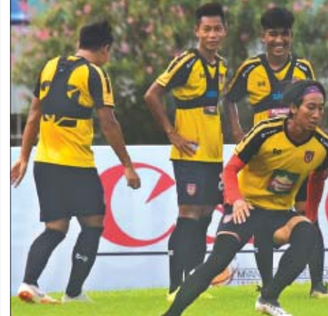
မြန်မာ ယူ-၂၂ အသင်း ဖွဲ့စည်းလေ့ကျင့်စဉ်။