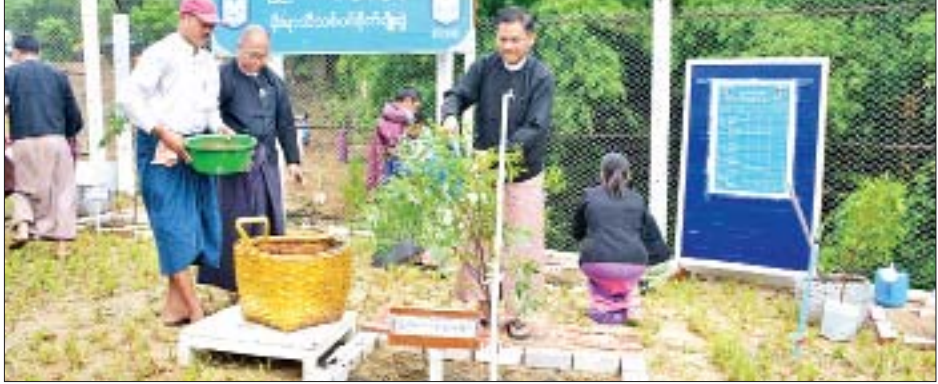
သီးပင်စားပင်များကို စုပေါင်းစိုက်ပျိုး ကြရာ ပြည်ထောင်စု ရှေ့နေချုပ်နှင့် အဖွဲ့ အဖွဲ့ က လှည့်လည်ကြည့်ရှု အားပေးကြသည်။ ယင်းနောက် ငါးကြင်းနှင့် ငါးခုံးမသားပေါက်ကောင် ရေ ၆၀၀၀ ကို ငါးမျိုးစိုက်ထည့် ခဲ့ကြောင်း သိရသည်။ သတင်းစဉ်

နေပြည်တော် ဇူလိုင် ၁၀ ပြည်ထောင်စုရှေ့နေချုပ်ရုံး မိုးရာသီ သစ်ပင်စိုက်ပျိုးပွဲနှင့် ငါးမျိုးစိုက်ထည့် ပွဲအခမ်းအနားကို ယနေ့ နံနက် ၉ နာရီက ပြည်ထောင်စုရှေ့နေချုပ်ရုံး ဝန်းကျင်၌ ကျင်းပသည်။ ရှေးဦးစွာ ပြည်ထောင်စုရှေ့နေချုပ် ဦးထွန်းထွန်းဦး၊ ဒုတိယရှေ့နေချုပ်၊ အမြဲတမ်းအတွင်းဝန်နှင့် ညွှန်ကြားရေး များချုပ်များက ကံကော်ပင်၊ အာဆီယံ သပြေပင်နှင့် ရွက်လှပင်များကို သတ် မှတ်နေရာများတွင်စိုက်ပျိုးခဲ့ကြသည်။ ထို့နောက် အရာထမ်း၊ အမှုထမ်း များက သရက်၊ ပိန္နဲ၊ မာလာကာ၊ ရှောက်၊ သံပရာ၊ မရမ်း၊ ဝွေးချိုပင် စသည့်