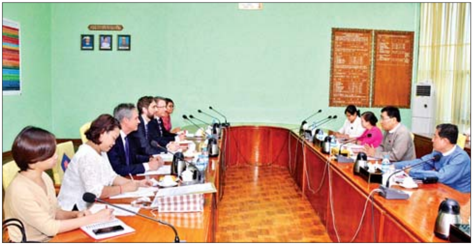
Social Work Institute ထူထောင်ရန် လိုအပ်မှုနှင့် နေမှုတို့ကို ရင်းနှီးပွင့်လင်းစွာ ဆွေးနွေးခဲ့ကြကြောင်း သိရ တစ်နိုင်လုံးအတိုင်းအတာဖြင့် မူကြိုကျောင်းများ လိုအပ် သည်။ သတင်းစဉ်

အလုပ်ရုံဆွေးနွေးပွဲကျင်းပရေးကိစ္စ၊ လာမည့် အောက်တို ဘာလတွင် လူမှုဝန်ထမ်း၊ ကယ်ဆယ်ရေးနှင့် ပြန်လည် နေရာချထားရေးဝန်ကြီးဌာနမှ အဓိကတာဝန်ယူ၍ အာဆီယံသဘာဝဘေးစီမံခန့်ခွဲမှုဆိုင်ရာ ဝန်ကြီးအဆင့် အစည်းအဝေးကို အိမ်ရှင်နိုင်ငံအဖြစ် ကျင်းပရမည်ကိစ္စ၊ နိုင်ငံတော်အဆင့် ကယ်ဆယ်ရေးစခန်းများပိတ်သိမ်းရေး မဟာဗျူဟာရေးဆွဲနိုင်ရေးအတွက် ဆွစ်ဇာလန်နိုင်ငံမှ နေရပ်စွန့်ခွာမှုဆိုင်ရာ ကျွမ်းကျင်ပညာရှင် Dr. Walter Kalin နှင့် ပူးပေါင်းဆောင်ရွက်မှု၊ ယင်းမဟာဗျူဟာအား အတည်ပြုနိုင်ရေးနှင့် ယခုအခါ ရှမ်းပြည်နယ်တောင်ပိုင်းရှိ မြို့နယ် ခုနစ်မြို့နယ်တွင် လူမှုရေးအခြေခံအဆောက်အအုံ နှင့် ရပ်ရွာဖွံ့ဖြိုးတိုးတက်ရေးအတွက် ပဋိပက္ခဒဏ်ခံရသော ကျေးလက်ဒေသများတွင် ကျန်းမာရေး၊ ပညာရေး၊ ရေနှင့် သန့်ရှင်းရေးဆိုင်ရာလုပ်ငန်းများ ဆောင်ရွက်နိုင်ရန် နားလည်မှုစာချွန်လွှာတစ်ရပ်ကို လက်ရှိလုပ်ထုံးလုပ်နည်း များနှင့်လျော်ညီစွာ ရေးထိုးနိုင်ရေးကိစ္စ၊ ဝန်ကြီးဌာနတွင်