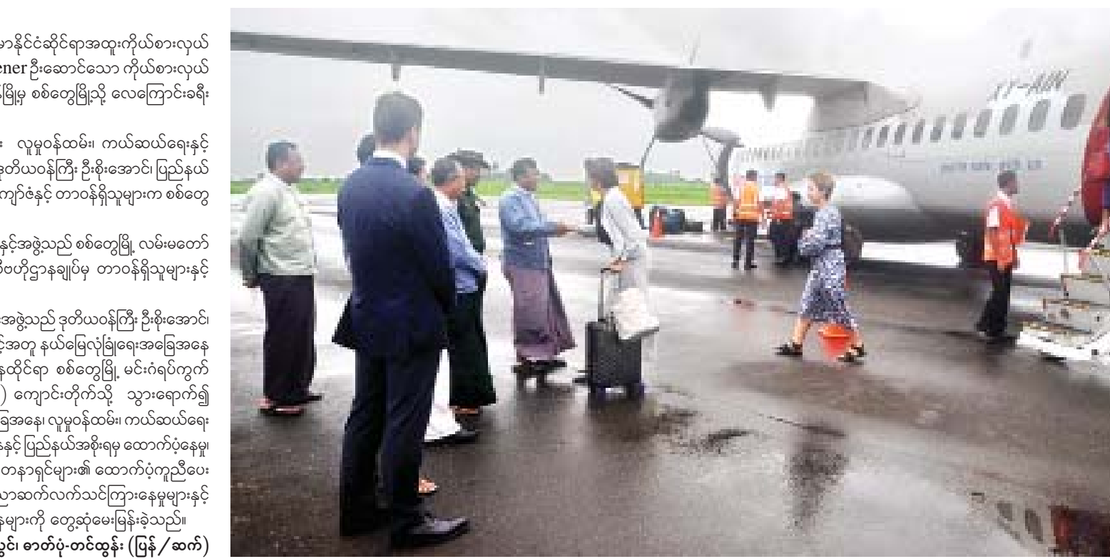
သတင်း-အောင်ရဲသွင်၊ ဓာတ်ပုံ-တင်ထွန်း (ပြန်/ဆက်)

ထို့နောက် အထူးကိုယ်စားလှယ်နှင့်အဖွဲ့သည် ဒုတိယဝန်ကြီး ဦးစိုးအောင်၊ ပြည်နယ်ဝန်ကြီး ဦးအောင်ကျော်ဇော်နှင့်အတူ နယ်မြေလုံခြုံရေးအခြေအနေ ကြောင့် နေရပ်စွန့်ခွာသူများ ခေတ္တနေထိုင်ရာ စစ်တွေမြို့ မင်းဂံရပ်ကွက် အကွက်(၁၃)ရှိ ဝိဘာဇွတ် (ပရဟိတ) ကျောင်းတိုက်သို့ သွားရောက်၍ လတ်တလောနေထိုင်စားသောက်မှုအခြေအနေ၊ လူမှုဝန်ထမ်း၊ ကယ်ဆယ်ရေး နှင့် ပြန်လည်နေရာချထားရေးဝန်ကြီးဌာနနှင့် ပြည်နယ်အစိုးရမှ ထောက်ပံ့နေမှု အရပ်ဘက်လူမှုအဖွဲ့အစည်းများနှင့် စေတနာရှင်များ၏ ထောက်ပံ့ကူညီပေး နေမှု၊ ကျောင်းသား ကျောင်းသူများ ပညာဆက်လက်သင်ကြားနေမှုများနှင့် ကျန်းမာရေးစောင့်ရှောက်မှုအခြေအနေများကို တွေ့ဆုံမေးမြန်းခဲ့သည်။