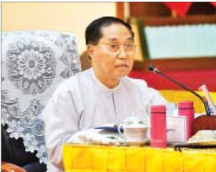
ဒုတိယသမ္မတ ဦးမြင့်ဆွေ ဆွေးနွေးပြောကြားစဉ်။

“ကျွန်မတို့ ရန်ကုန်တက္ကသိုလ်နဲ့ ပတ်သက်လို့ ပြန်လည်မွမ်းမံရေး၊ အဆင့်မြှင့်တင်ရေး မဟာစီမံကိန်းမှာဆိုရင် ဦးစီးကော်မတီ၊ ဦးစီးကော်မတီအောက်မှာဆိုရင် လုပ်ငန်းကော်မတီတွေလည်း ဖွဲ့ထားပါတယ်။ ပညာအရည်အသွေးမြှင့်တင်ရေး ကော်မတီ၊ ရုပ်ပိုင်းဆိုင်ရာဖြည့်ဆည်းရေး ကော်မတီ၊ ရန်ကုန်တက္ကသိုလ် ပဋိညာဉ်ရေးဆွဲရေး ကော်မတီ ဒါတွေနဲ့ပတ်သက်လို့ အသေးစိတ်ကို ဒေါက်တာမျိုးသိမ်းကြီး ပြောပါလိမ့်မယ်။