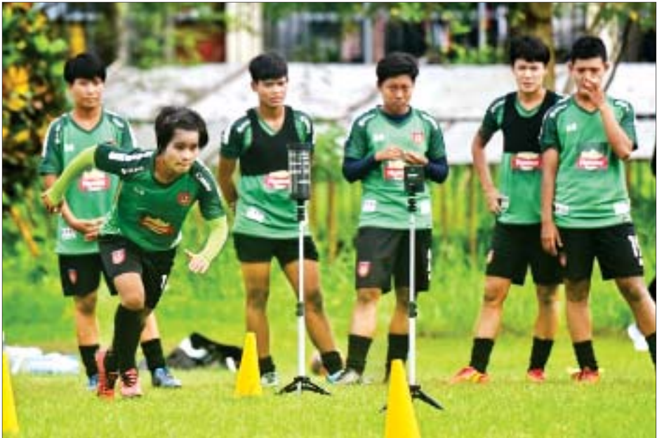
မြန်မာ့လက်ရွေးစင် အမျိုးသမီးအသင်း ဇူလိုင် ၁၀ ရက် နံနက်ပိုင်းက လေ့ကျင့်နေစဉ်။