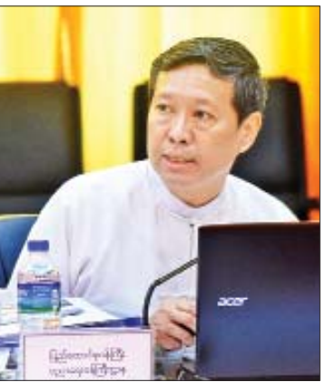
ပြည်ထောင်စုဝန်ကြီး ဒေါက်တာ မျိုးသိမ်းကြီး ရှင်းလင်းတင်ပြစဉ်။

“တက္ကသိုလ်ထဲမှာ ပညာသင်တယ် ဆိုတာဟာ အတန်းထဲက ပညာတင်မကပါ ဘူး။ အတန်းပြင်ပ ပညာတွေလည်း သင်ယူနိုင် တဲ့ ပတ်ဝန်းကျင်ကို ဖန်တီးပေးစေချင်ပါတယ်။ ဥပမာဆိုရင် အနုပညာတို့၊ အားကစားတို့ စသဖြင့်ပါ။ အနုပညာတို့၊ အားကစားတို့ကို ကျွန်မတို့ရဲ့ ပညာရေးစနစ်အတွင်းမှာကို အားပေးချင်တာ ဖြစ်တဲ့အတွက် နှစ်(၁၀၀) ပြည့် အခမ်းအနားတွေမှာလည်း အနုပညာတို့၊ အားကစားတို့ကို ထည့်စဉ်းစားပြီးတော့ ကျင်းပစေချင်ပါတယ်။ တက္ကသိုလ်တစ်ခုမှာ ဆိုရင် အမှတ်အများဆုံးရရေးဆိုတဲ့ စိတ်ဓာတ် ကိုပဲ မဖြစ်စေချင်ပါဘူး။ အနုပညာရှင်များ ဆိုတာကလည်း အတန်းပညာနဲ့ ပတ်သက်ရင် အမှတ်အများကြီးရချင်မှရမယ်။ ဒါပေမယ့် အနုပညာဘက်မှာ အင်မတန် ထူးချွန်တဲ့ပုဂ္ဂိုလ် တွေလည်း ရှိပါတယ်။ ဒီတော့ လူတိုင်း လူတိုင်းဟာ ကိုယ့်ရဲ့အားသာချက်တွေကို ဖော်ထုတ်နိုင်ဖို့အတွက်၊ ကိုယ့်ရဲ့အားသာ