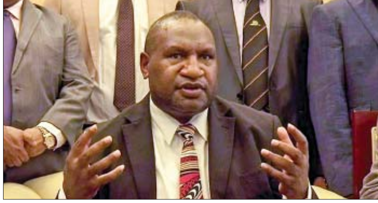
ပါပူဝါနယူးဂီနီ ဝန်ကြီးချုပ် ဂျိမ်းစ်မာရိတ်

အများအပြားသည် မသမာသူများ၏ လက်ချက်ဖြင့် အသတ်ခံခဲ့ရရာ ယနေ့သည် မိမိ၏ ဘဝတစ်လျှောက် ဝမ်းအနည်းဆုံး နေ့တစ်နေ့ ဖြစ်လာခဲ့သည်ဟု မာရိတ်က ပြောကြားသည်။ ကာရီဒါကျေးရွာ၌ နာရီဝက်ကြာ စီးနင်းတိုက်ခိုက်မှု အတောအတွင်း အမျိုးသမီး ခြောက်ဦး၊ ကလေးငယ် ရှစ်ဦး၊ ကိုယ်ဝန်ဆောင်မိခင်နှစ်ဦးနှင့်အတူ မမွေးရသေးသော ကလေးငယ်များကို ရိုက်နှက်ပြီး ပစ်သတ်ခဲ့သည်ဟု တိုက်ခိုက်ရေးသမားများက ဆိုသည်။ ကိုးကား - အေအက်စ်ပီ ဘာသာပြန် - ဂျေတီ