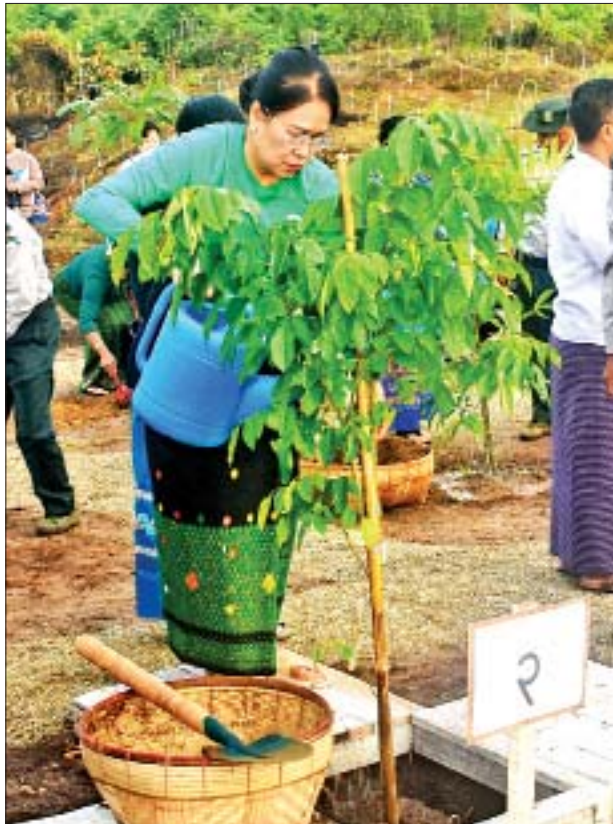
ဒုတိယသမ္မတ ဦးမြင့်ဆွေ၏ဇနီး ဒေါ်ခင်သက်ဌေး ပိတောက်ပင်ကို စိုက်ပျိုးပေးစဉ်။

ရုံးဥက္ကဋ္ဌ၏ဇနီးနှင့် ပြည်ထောင်စုရွေးကောက်ပွဲကော်မရှင်ဥက္ကဋ္ဌ၏ဇနီးတို့က ပိတောက်ပင်ကို လည်းကောင်း သတ်မှတ်နေရာများ၌ စိုက်ပျိုးပေးကြသည်။