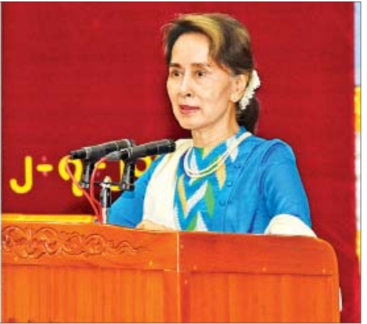
နိုင်ငံတော်၏အတိုင်ပင်ခံပုဂ္ဂိုလ် ဒေါ်အောင်ဆန်းစုကြည် နိုင်ငံတော်သမ္မတရုံးနှင့် ပြည်ထောင်စုအစိုးရအဖွဲ့ရုံးဝန်ကြီးဌာန ၂၀၁၈-၂၀၁၉ ပညာသင်နှစ် တက္ကသိုလ်ဝင်စာမေးပွဲတွင် ထူးချွန်စွာအောင်မြင်သူများအား ဂုဏ်ပြုဆုချီးမြှင့်ခြင်းနှင့် ၂၀၁၉-၂၀၂၀ ပညာသင်နှစ်တွင် တက်ရောက်ပညာသင်ကြားနေသည့် ကျောင်းသား ကျောင်းသူများအား ပညာသင်ထောက်ပံ့ကြေးပေးအပ်ခြင်း အခမ်းအနားတွင် အမှာစကားပြောကြားစဉ်။