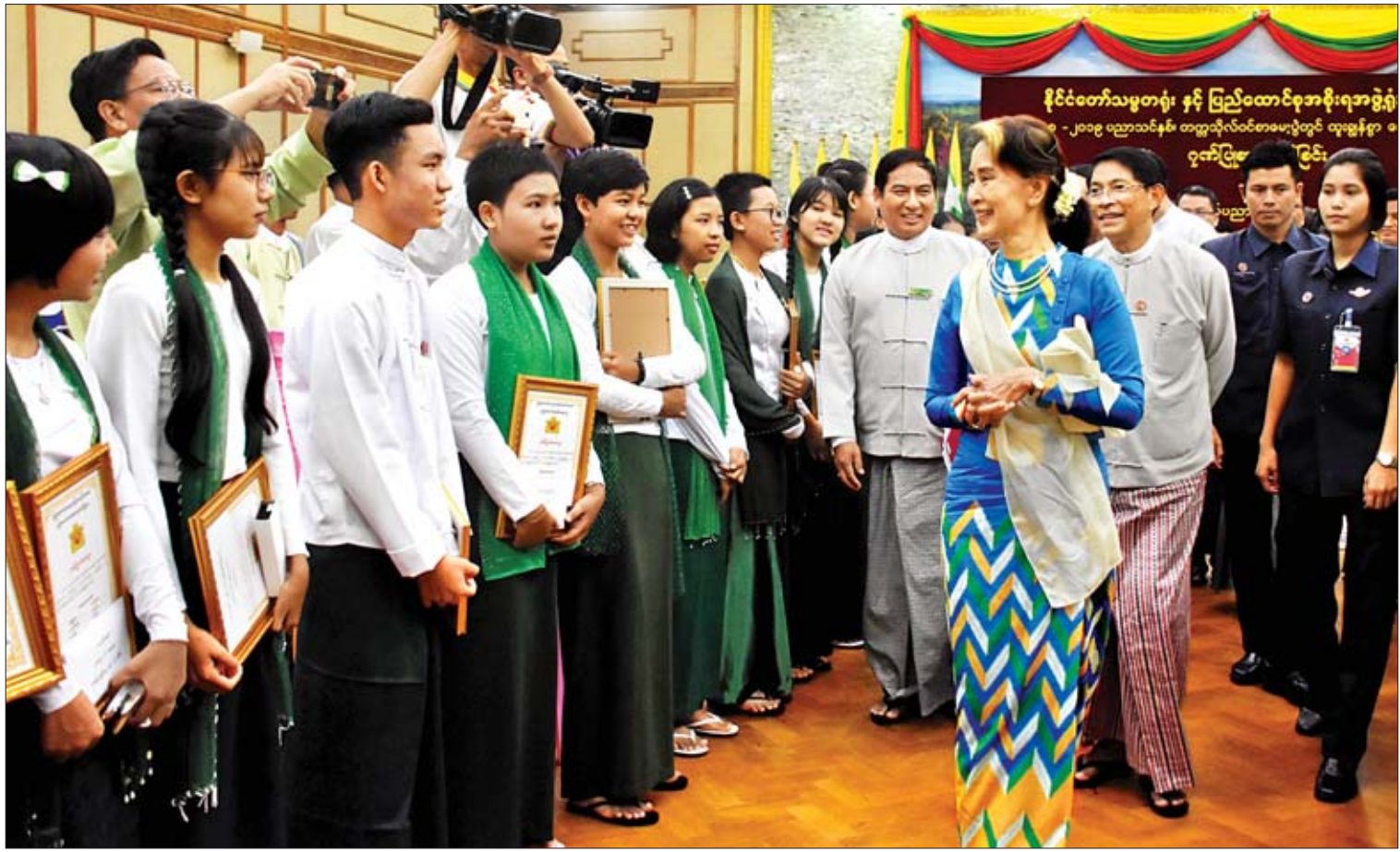
နိုင်ငံတော်၏အတိုင်ပင်ခံပုဂ္ဂိုလ် ဒေါ်အောင်ဆန်းစုကြည် တက္ကသိုလ်ဝင်စာမေးပွဲ ထူးချွန်စွာအောင်မြင်သူများနှင့် တက္ကသိုလ်ဝင်စာမေးပွဲအောင်မြင်သူများ ကို ရင်းရင်းနှီးနှီးနှုတ်ဆက်စဉ်။

ကိုယ့်တစ်ယောက်တည်းအတွက် မကြည့်ပါနဲ့။ ကိုယ့်မိသားစုအရေးအတွက်လည်း မကြည့်ပါနဲ့။ ကိုယ့်နိုင်ငံအတွက် ကြည့်ပါ။ အားလုံးအတွက် စုပြီးကြည့်မှသာ ကိုယ်ကနေပြီးတော့ ပြီးပြည့်စုံတဲ့ လူသားတစ်ယောက်ဖြစ်နိုင်မှာပါ။ ပြီးပြည့်စုံတဲ့ လူသားဆိုတာ ကိုယ့်အကျိုးပဲ ဆောင်နိုင်ရုံနဲ့ ဘယ်လိုမှမဖြစ်နိုင်ပါဘူး။ သူများအကျိုးဆောင်ဖို့ဆိုတာလည်း ပုထုဇဉ်လူသားတွေဖြစ်တဲ့အတွက် ဒါကတော့ လက်တွေ့မကျတဲ့ တောင်ဆိုမျိုး ဖြစ်ပါလိမ့်မယ်။ “ဒါကြောင့် ဘဝရဲ့မှတ်တိုင်တစ်ခုကို အောင်မြင်စွာဖြတ်သန်းပြီးတဲ့ ကျောင်းသား ကျောင်းသူများဟာ အခုဆက်ပြီးတော့ ပညာလိုက်စားဦးမှာလား။ ဘဝအတွက်၊ အသက်မွေးဝမ်းကျောင်းအတွက် လောကထဲကို ထွက်ပြေးရှာမှာလား။ ဘယ်လိုပဲသွားသွား၊ ဘယ်နေရာပဲသွားသွား၊ ကိုယ်ဟာ ကိုယ်တစ်ယောက်တည်းအတွက် လုပ်တာမဟုတ်ဘူး။ အများအတွက်ချည်းပဲ လုပ်လို့လည်း လက်တွေ့မကျဘူး။ အားလုံး ကိုယ့်အကျိုး၊ အများအကျိုးအတွက်လုပ်နေတဲ့ ပုဂ္ဂိုလ်တစ်ယောက်အနေနဲ့ စဉ်းစားပါ။ ဒီလောကကြီးရဲ့ပြောင်းလဲနေမှုတွေကိုလည်း သတိပြုပါ။ လူငယ်များကတော့ မာန်ရှိတတ်တယ်။ ငါတို့