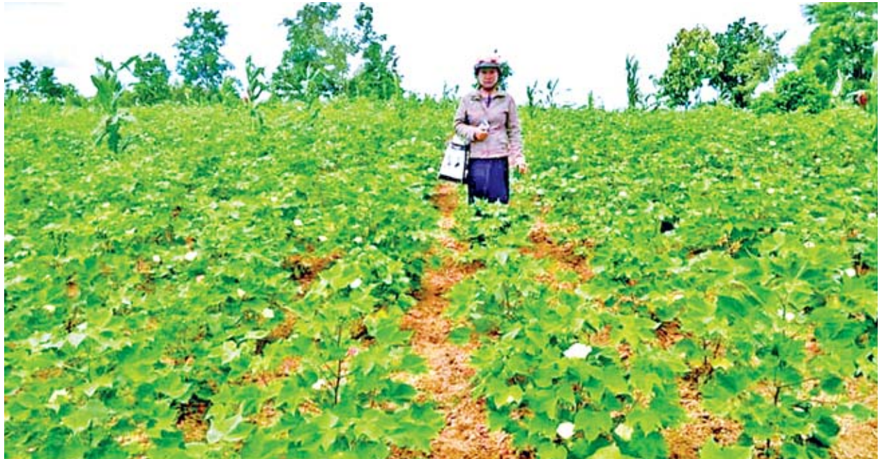
ယခင်နှစ်က မြို့သစ်မြို့နယ် မြေပြင်သာကျေးရွာရှိ ရွှေတောင်ချည်မျှင်ရှည်ဝါ-၈ စိုက်ခင်းကို တွေ့ရစဉ်။

ရာသီဥတုပြောင်းလဲမှုကြောင့် မိုးရေရရှိမှု မမှန်ခြင်းအတွက် ပဲစင်းငုံ သီးနှံမှာ ထွက်ရှိမှုနည်းပါးခြင်းနှင့် ဈေးတည်ငြိမ်မှုမရှိသဖြင့် တောင်သူများ၏ စိုက်ပျိုးစရိတ် မကုန်မီသည့်အတွက် ဝါသီးနှံကို အစားထိုး စိုက်ပျိုးလာကြခြင်း ဖြစ်သည်။ မကွေးတိုင်းဒေသကြီး စာမျက်နှာ ၁၁ ကော်လံ ၁ သို့