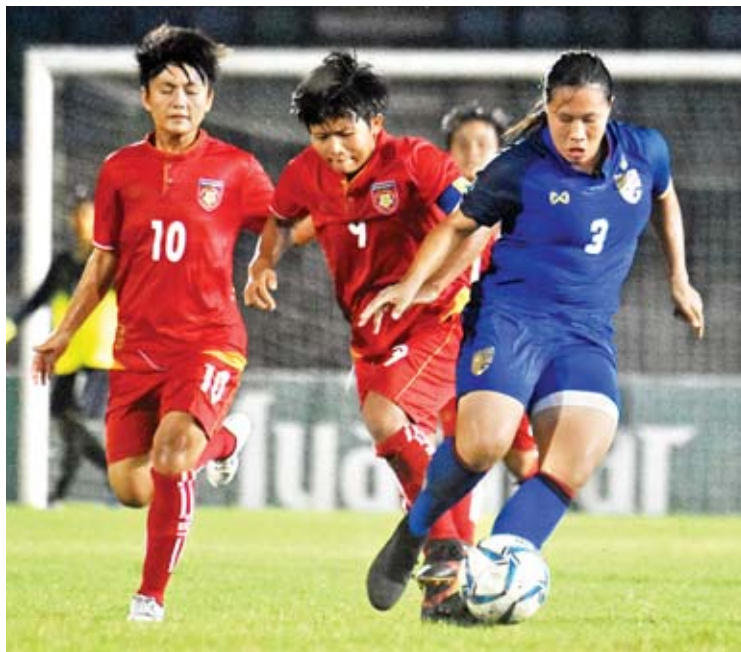
၂၀၁၈ ခုနှစ်က မြန်မာနှင့် ထိုင်း ယူ-၁၉ အမျိုးသမီးအသင်းတို့ ရန်ကုန်မြို့၌ ခြေစမ်းပွဲကစားစဉ်။