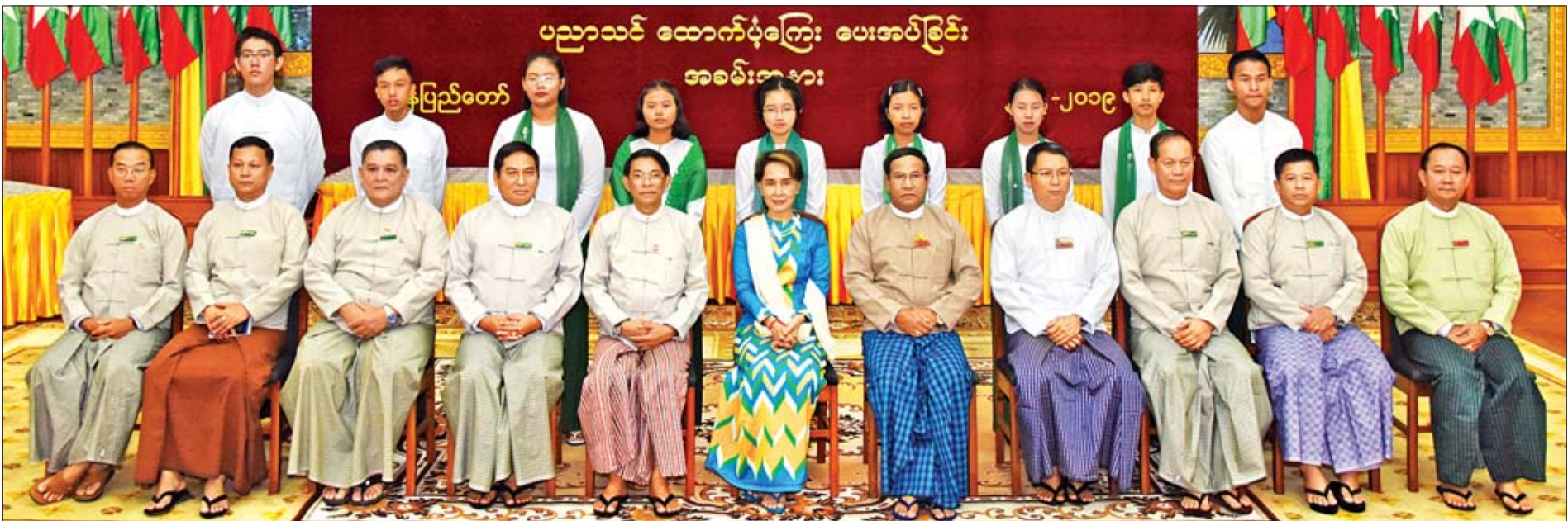
နိုင်ငံတော်၏အတိုင်ပင်ခံပုဂ္ဂိုလ် ဒေါ်အောင်ဆန်းစုကြည်၊ ပြည်ထောင်စုဝန်ကြီး ဦးမင်းသူ၊ ဒုတိယဝန်ကြီး ဦးတင်မြင့်နှင့် တာဝန်ရှိသူများ နိုင်ငံတော်သမ္မတရုံးမှ တက္ကသိုလ်ဝင်စာမေးပွဲ အောင်မြင်သူများနှင့်အတူ စုပေါင်းမှတ်တမ်းတင်ဓာတ်ပုံရိုက်စဉ်။

အစိုးရအဖွဲ့ရုံးဝန်ကြီးဌာနမှ ကျောင်းသားကျောင်းသူများအတွက် ထောက်ပံ့ငွေများ ပေးအပ်ချီးမြှင့်သည်။ ယင်းနောက် ကျောင်းသား ကျောင်းသူများကိုယ်စား ခြောက်ဘာသာဂုဏ်ထူးရှင် မောင်ဘုန်းသုတက ကျေးဇူးတင်စကား ပြန်လည်ပြောကြားသည်။ ထို့နောက် နိုင်ငံတော်၏အတိုင်ပင်ခံပုဂ္ဂိုလ် ဒေါ်အောင်ဆန်းစုကြည်၊ ပြည်ထောင်စုဝန်ကြီးနှင့် ဧည့်သည်တော်များသည် နိုင်ငံတော်သမ္မတရုံးမှ တက္ကသိုလ်ဝင်စာမေးပွဲအောင်မြင်သူများ၊ ပြည်ထောင်စုအစိုးရအဖွဲ့ရုံးတို့မှ တက္ကသိုလ်ဝင်စာမေးပွဲအောင်မြင်သူများ၊ ပြည်ထောင်စုအစိုးရအဖွဲ့ရုံး ဝန်ကြီးဌာနမှ တက္ကသိုလ်ဝင်စာမေးပွဲတွင် ထူးချွန်စွာအောင်မြင်သူများနှင့်အတူ စုပေါင်းမှတ်တမ်းတင်ဓာတ်ပုံရိုက်ကြသည်။ အခမ်းအနားအပြီးတွင် နိုင်ငံတော်၏အတိုင်ပင်ခံပုဂ္ဂိုလ် ဒေါ်အောင်ဆန်းစုကြည်သည် ကျောင်းသားမိဘများ၊ တက္ကသိုလ်ဝင်စာမေးပွဲ ထူးချွန်စွာ အောင်မြင်သူများနှင့် တက္ကသိုလ်ဝင်စာမေးပွဲအောင်မြင်သူများအား ရင်းရင်းနှီးနှီး တွေ့ဆုံနှုတ်ဆက်စကားပြောကြားသည်။ သတင်းစဉ်