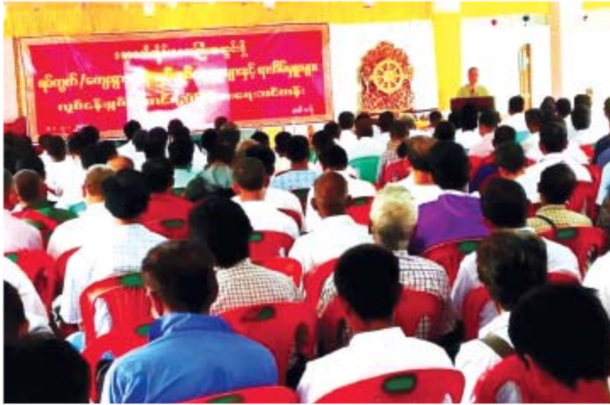
ကျေးရွာအုပ်ချုပ်ရေးမှူးများ၊ ရာအိမ်မှူးများအား လုပ်ငန်းစွမ်းဆောင်ရည်မြှင့်တင်ပေးခြင်းကို ဘိုကလေးမြို့၊ ချိုကြည်တန်ဆောင်၌ လည်းကောင်း၊ ဒုတိယအကြိမ် မြင်းကုန်းကျေးရွာ၌လည်းကောင်း ဖွင့်လှစ်ခဲ့ပြီး စတုတ္ထအကြိမ်ကို ကနဲကန်ကျေးရွာ၌ ဖွင့်လှစ်ပေးမည် ဖြစ်ကြောင်းသိရသည်။ သူဇာနွယ်(ဈာပုံ)

ဘိုကလေးမြို့နယ်အတွင်း၌ ပထမအကြိမ်ရပ်ကွက်၊