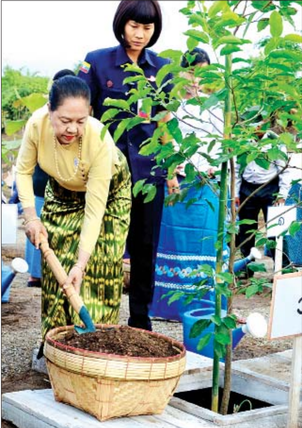
နိုင်ငံတော်သမ္မတ ဦးဝင်းမြင့်၏ဇနီး ဒေါ်ချိုချို ခရေပင်ကို စိုက်ပျိုးပေးစဉ်။

အလားတူ နိုင်ငံတော်သမ္မတ(ဟောင်း)၏ဇနီးက ခရေပင်ကို လည်းကောင်း၊ ဒုတိယသမ္မတ၏ဇနီးက ပိတောက်ပင်ကို လည်းကောင်း၊ ပြည်သူ့လွှတ်တော်ဥက္ကဋ္ဌ၏ဇနီးနှင့် အမျိုးသားလွှတ်တော်ဥက္ကဋ္ဌ၏ဇနီးတို့က ကံကော်ပင်ကို လည်းကောင်း၊ နိုင်ငံတော်ဖွဲ့စည်းပုံအခြေခံဥပဒေဆိုင်ရာ