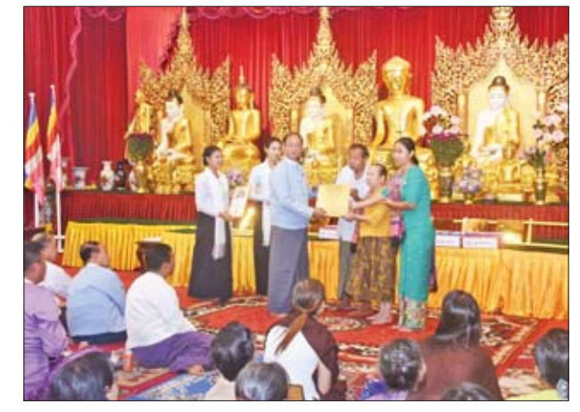
ရွှေသင်္ကန်းတော်(ရွှေပြား) အလှူရှင်အလှူရှင် ၁၂ ဦး အပါအဝင် လှူဒါန်း၁၆၄ ဦးထံမှ ရွှေပြားပေါင်း ၁၇၇ ချပ်၊ ရင်ပြင်တော်အခင်းကျောက်ပြားအလှူရှင် ၇၅၁ ဦးက ကျောက်ပြားချပ် ၂၂၅၃၇ ချပ်လှူဒါန်းခဲ့ကြပြီး ငွေသား သတင်းစဉ်

များက လက်ခံရယူပြီး ထုတ်အနုမောဒနာ ဂုဏ်ပြုမှတ်တမ်းလွှာများ ပြန်လည်ပေးအပ်သည်။ ရေစက်ချ ထို့နောက် ဘဏ္ဍာတော်ထိန်းဂေါပကအဖွဲ့၏ သြဝါဒါစရိယ နိုင်ငံတော် သံဃမဟာနာယကအဖွဲ့ဝင် အဂ္ဂမဟာပဏ္ဍိတ အဂ္ဂမဟာဂန္ထဝါစကပဏ္ဍိတ ဗဟန်းမြို့နယ်ညောင်တုန်းပါဠိတက္ကသိုလ် ကျောင်းတိုက်ဆရာတော် ဘဒ္ဒန္တပဝရာဘိဝံသ ထံမှ ဧည့်ပရိသတ်များက ငါးပါးသီလခံယူဆောက်တည်ကြပြီး ရေစက်ချအနုမောဒနာတရားနာယူကာ အခမ်းအနားကို ရုပ်သိမ်းခဲ့သည်။