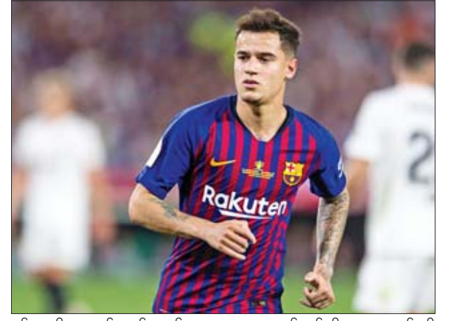
ရန်ဆန္ဒရှိနေသည့် ကွင်းလယ်ကစားသမား ကော်တင်ဟိုအား အသင်းသို့ ပြန်လည်ခေါ်ယူရန် ဆန္ဒရှိနေသည်ဟုဆိုသည်။

လီဗာပူးအသင်းသည် ဘာစီလိုနာအသင်းမှ ဘရာဇီးကွင်းလယ် ကစားသမား ကော်တင်ဟိုအား အန်ဖီလ်သို့ ပြန်လည်ခေါ်ယူမည်ဖြစ်ကြောင်း သိရသည်။ ကွင်းလယ်ကစားသမား ကော်တင်ဟိုသည် ၂၀၁၈ ခုနှစ် ဇန်နဝါရီအပြောင်းအရွှေ့ကာလအတွင်းက လီဗာပူးအသင်းမှ ဘာစီလိုနာအသင်းသို့ ပြောင်းရွှေ့ကြေးပေါင် ၁၄၂ သန်းဖြင့် ပြောင်းရွှေ့ခဲ့သူလည်းဖြစ်သည်။ လက်ရှိတွင် ကော်တင်ဟိုသည် ဘာစီလိုနာအသင်းတွင် ပျော်ရွှင်ခြင်းမရှိတော့သည့်အတွက် နူးကမ်မှထွက်ခွာရန် စီစဉ်နေသူလည်းဖြစ်သည်။ ၎င်းကို မန်ယူအသင်းအပါအဝင် ကလပ်အသင်းအတော်များများက ခေါ်ယူရန် စိတ်ဝင်စားလျက်ရှိပြီး အဆိုပါအသင်းများထဲတွင် ကော်တင်ဟိုကစားခဲ့သည့် လီဗာပူးအသင်းလည်း ပါဝင်လျက်ရှိကြောင်း သိရသည်။ မန်ယူအသင်းက ကော်တင်ဟိုအား ခေါ်ယူရန် စိတ်ဝင်စားခဲ့သော်လည်း မန်ယူအသင်းမှာ ချန်ပီယံလိဂ်ဝင်ခွင့်မရရှိခြင်းကြောင့် လက်ရှိထွက်ပေါ်နေသည့်သတင်းများအရ အသင်းဟောင်း လီဗာပူးအသင်းတွင် ပြန်လည်ကစားရန် ဆန္ဒရှိနေကြောင်း သိရသည်။ လီဗာပူးအသင်းဥက္ကဋ္ဌ တွမ်ပါနာကလည်း ဘာစီလိုနာအသင်းမှ ထွက်ခွာ