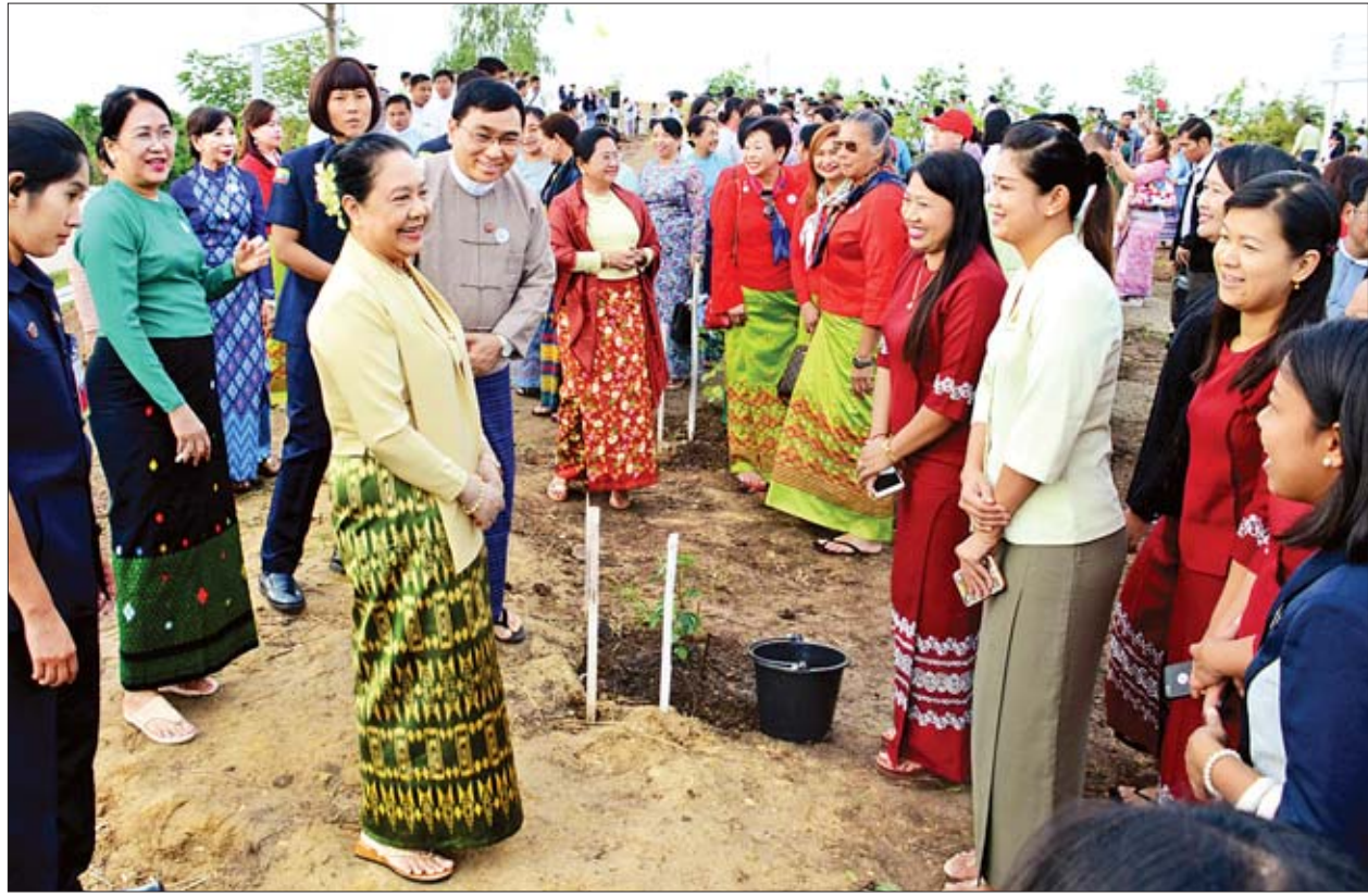
နိုင်ငံတော်သမ္မတ ဦးဝင်းမြင့်၏ဇနီး ဒေါ်ချိုချိုနှင့် အဖွဲ့ဝင်များ သစ်ပင်စိုက်ပျိုးမှုများကို လိုက်လံကြည့်ရှုအားပေးစဉ်။