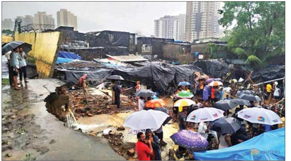
အမည်ရှိ ပုဂ္ဂလိက မိုးလေဝသအေဂျင်စီက ပြောကြားပြီး ယင်းမှာ ဆယ်စုနှစ်တစ်ခုအတွင်း အများဆုံးရွာသွန်းခဲ့သည့် မိုးရေချိန်ပမာဏဖြစ်သည်ဟု ဆိုသည်။ မွမ်ဘိုင်းမြို့ရှိ မီသီမြစ်ကမ်းပါးဒေသတွင် နေထိုင်သူ ၁၀၀၀ နီးပါးကို မြစ်ရေလျှံမည့် အခြေအနေများရှိသည့်အတွက်ကြောင့် ကုန်းမြင့်ဒေသများသို့ ရွှေ့ပြောင်းပေးထားကြောင်း သဘာဝဘေးစီမံခန့်ခွဲရေးအဖွဲ့ပြောရေးဆိုခွင့်ရှိသူက ပြောကြားသည်။ အေအက်စ်ပီ

ပေါင်း ၁၀၀ ကျော်ကို ဖျက်သိမ်းခြင်း သို့မဟုတ် အခြားလေဆိပ်များသို့ ပြောင်းလဲဆင်းသက်စေခဲ့ရသည်။ ဇူလိုင် ၁ ရက် ညသန်းခေါင်ယံကျော်အချိန်တွင် ခရီးသည်နှင့် လေယာဉ်အမှုထမ်း စုစုပေါင်း ၁၆၇ ဦး လိုက်ပါလာသည့် စပိုင်ဂျက်လေကြောင်းလိုင်းမှ ခရီးသည်တင်လေယာဉ်တစ်စင်း ပြေးလမ်းကျော်လွန်မှုဖြစ်ပွားပြီး နောက်တွင် မွမ်ဘိုင်းလေဆိပ်၏ အဓိကလေယာဉ်ပြေးလမ်းကို ပိတ်ထားခဲ့ရသည်။ လတ်တလောတွင် ယင်းလေဆိပ်ရှိ အရန်လေယာဉ်ပြေးလမ်းကို အသုံးပြုနေရပြီး လေဆိပ်မှလုပ်သားများ အဓိကလေယာဉ်ပြေးလမ်းအား ပြန်လည်အသုံးပြုနိုင်ရေးအတွက် လုပ်ဆောင်နေပြီး ယင်းလုပ်ငန်းမှာ ၄၈ နာရီကျော် ကြာမြင့်နိုင်ကြောင်း မွမ်ဘိုင်းလေဆိပ်၏ တွစ်တာစာမျက်နှာ၌ ဖော်ပြသည်။ ဇူလိုင် ၁ ရက် (တနင်္လာနေ့) ညတစ်ညလုံးနှင့် ဇူလိုင် ၂ ရက် နံနက်ပိုင်းအထိ မွမ်ဘိုင်းမြို့တွင် မိုးသည်းထန်စွာရွာသွန်းခဲ့မှုကြောင့် မိုးရေချိန် (၃၅၀ မီလီမီတာ) ၁၃ လက်မခန့်အထိ ရရှိခဲ့ကြောင်း စတင်မတ်