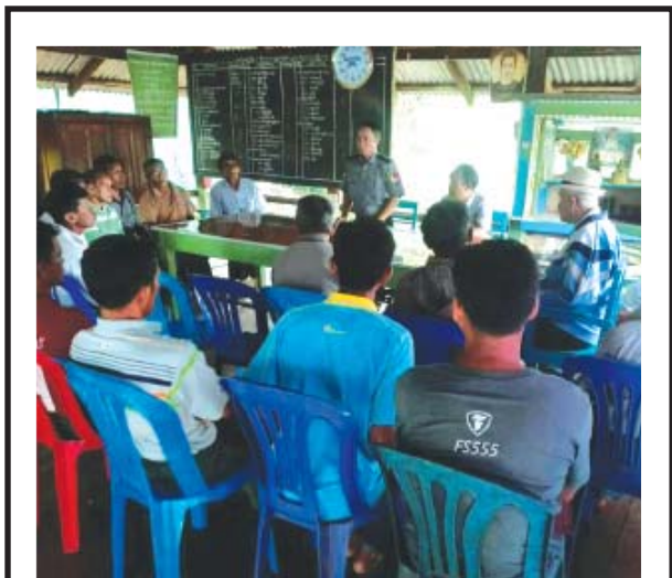
နေပြည်တော် ပုဗ္ဗသီရိမြို့နယ် ညောင်လုံးကျေးရွာအုပ်ချုပ်ရေးမှူးရုံး၌ ဇူလိုင် ၃ ရက် မွန်းလွဲ ၁ နာရီခွဲက ထုံးဖိုမြို့မရဲစခန်းမှူး၊ ဒုရဲမှူး၊ မြသောင်းက ဒေသခံများအား လူကုန်ကူးမှုနှင့် သက်ငယ်ပုဒ်မိမိမှု မဖြစ်ပွားစေရေးအတွက် အသိပညာပေးဟောပြောစဉ်။ ဆရာမင်း(ရူပဗေဒ)

အုန်းချော သီတဂူ စက္ကဝါဒနဆေးရုံကို သီတဂူဆရာတော်ကြီး အရှင်ဉာဏိဿရ၏ လမ်းညွှန်မှုနှင့်အညီ ၂၀၁၅ ခုနှစ် ဖေပြီ ၇ ရက်တွင် စတင်ဖွင့်လှစ်၍ မျက်စိကုသမှုများကို အခမဲ့ပြုလုပ်ပေးလျက်ရှိကာ ၂၀၁၅ ခုနှစ် အောက်တိုဘာ ၁ ရက်မှစ၍ အထွေထွေရောဂါများ အခမဲ့ကုသပေးခဲ့ပြီး သွားနှင့်ပတ်သက်သည့်ရောဂါများနှင့် သွားညှိခြင်းကို ၂၀၁၇ ခုနှစ် စက်တင်ဘာမှစတင်၍ ကုသပေးလျက်ရှိကြောင်း သိရသည်။ တင်ဇာလွင် (ပြန်/ဆက်)