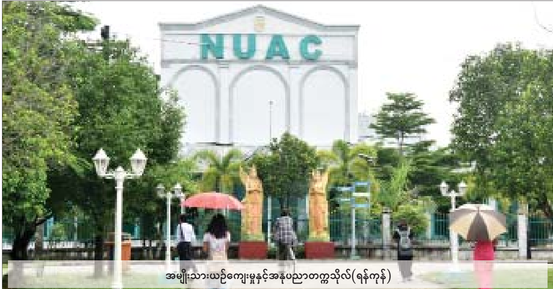
အမျိုးသားယဉ်ကျေးမှုနှင့်အနုပညာတက္ကသိုလ်(ရန်ကုန်)

(Yangon) အဖြစ် အမည်ပြောင်းလဲခဲ့သည်။ အမျိုးသားယဉ်ကျေးမှုနှင့် အနုပညာ တက္ကသိုလ်(မန္တလေး)ကိုလည်း ၂၀၁၁ ခုနှစ် တွင် ရွှေစာရတုရားလမ်း အနားချောကျေးရွာ ပုသိမ်ကြီးမြို့နယ် မန္တလေးတိုင်းဒေသကြီး၌ ထပ်မံဖွင့်လှစ်ခဲ့ရာ မြန်မာနိုင်ငံတွင် အမျိုးသား ယဉ်ကျေးမှုနှင့် အနုပညာတက္ကသိုလ်(ရန်ကုန်၊ မန္တလေး)ဟူ၍ တက္ကသိုလ်နှစ်ခု ပေါ်ပေါက် လာခဲ့ပြီဖြစ်သည်။ တခြားတက္ကသိုလ်များနည်းတူ သင်ကြား “ဒီတက္ကသိုလ်တွေက တခြားတက္ကသိုလ် တွေနဲ့ တစ်မူကွဲနေတယ်လို့ တချို့တွေက ထင်နေတယ်။ မဟုတ်ပါဘူး။ အတူတူပါပဲ။ တက္ကသိုလ်ပညာသင်ကြားမှုကာလကလည်း လေးနှစ်၊ တခြားတက္ကသိုလ်တွေလည်း လေးနှစ်ပါပဲ။ ဝင်ကြားတို့၊ ကျောင်းလခတို့ ဆိုလည်း တခြားတက္ကသိုလ်တွေ နှုန်းထား အတိုင်းပါပဲ။ ဒီကျောင်းက အနုပညာ ဘာသာရပ်တွေသင်ရတယ်။ ဒါပဲကွာတယ်” ဟု အမျိုးသားယဉ်ကျေးမှုနှင့် အနုပညာ တက္ကသိုလ်(ရန်ကုန်)မှ ပါမောက္ခချုပ်က ပြောသည်။ လေးနှစ်တက်ရောက်ပြီးပါက ဝိဇ္ဇာဘွဲ့ချီးမြှင့် အဆိုပါအမျိုးသားယဉ်ကျေးမှုနှင့် အနု ပညာတက္ကသိုလ်(ရန်ကုန်/မန္တလေး)တွင် အနုပညာအထူးပြု ဘာသာရပ်များဖြစ်သည့် ဂီတပညာအထူးပြု၊ သဘာဝပညာအထူးပြု၊ ပန်းချီပညာအထူးပြု၊ ပန်းပုပညာ အထူးပြု၊ ရုပ်ရှင်နှင့် ပြဇာတ်ပညာအထူးပြုဘာသာရပ်