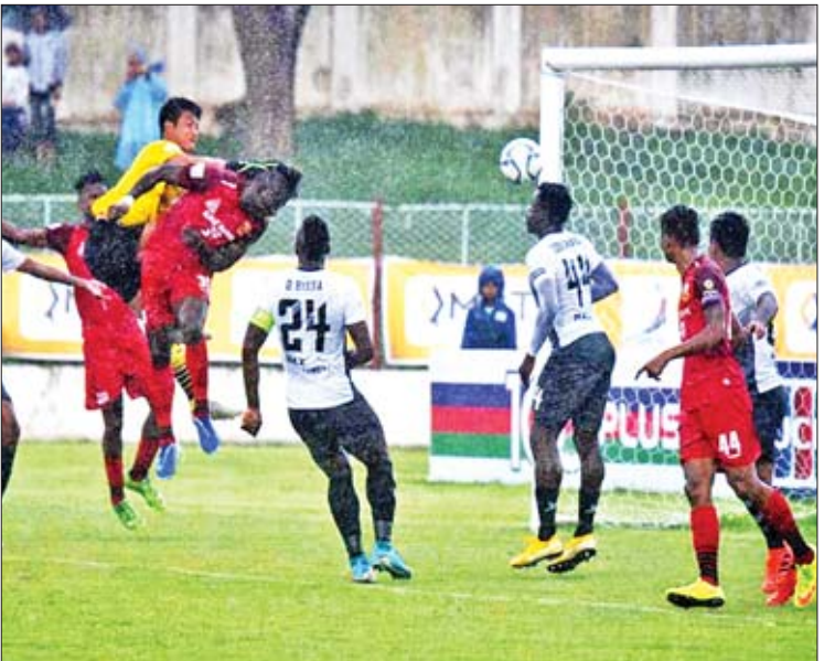
ရှမ်းယူနိုက်တက်အသင်းအတွက် ဒုတိယဂိုးကို ဝီလျံ ခေါင်းတိုက်သွင်းယူနေစဉ်။

ပွဲစဉ် (၁၄) အပြီးတွင် ရန်ကုန်အသင်းက ၂၇ မှတ်ဖြင့် ထိပ်ဆုံးမှ ဦးဆောင်နေပြီး ရှမ်းယူနိုက်တက်အသင်းက ၂၆ မှတ်၊ ဟံသာဝတီ အသင်းက ၂၅ မှတ်၊ ဧရာဝတီအသင်းက ၂၄ မှတ်၊ စစ်ကိုင်းအသင်းက ၂၃ မှတ်၊ ရတနာပုံအသင်းက ၂၁ မှတ်၊ ရခိုင်အသင်းက ၂၀၊ ဇွဲကပင်အသင်းက ၁၅ မှတ်၊ ဒဂုံအသင်းက ၁၃ မှတ်၊ Southern အသင်းက ၁၂ မှတ်၊ မကွေးအသင်းက ၁၁ မှတ်၊ Chinland အသင်းက ကိုးမှတ်ရထားသည်။ သတင်း-ရှိုင်းထက်ဇော်၊ ဇော်ပု-စိုးညွန့်