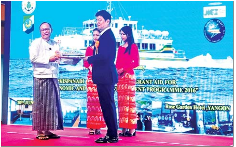
ပြည်ထောင်စုဝန်ကြီး ဦးသန့်စင်မောင်ထံ Mr.Masashi ADACHI က ရေယာဉ်ပုံစံငယ်ကို ပေးအပ်စဉ်။

အဆိုပါ ကစွပနဒီ(၃) ခရီးသည်တင်အမြန်ရေယာဉ်သည် အတိုင်းအတာအားဖြင့် ၃၄ ဒသမ ၇၁ မီတာ x ၆ ဒသမ ၀၀ မီတာ x ၂ ဒသမ ၇၀ မီတာရှိပြီး ရေစူးအနက် ၁ ဒသမ ၂၆ မီတာရှိကာ ကိုယ်ထည်အမျိုးအစားမှာ High-Tensile Strength Steel & Aluminium