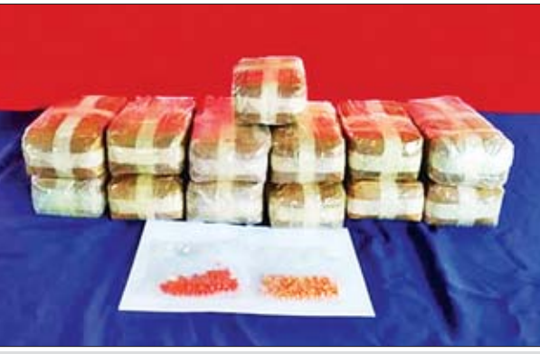
သိမ်းဆည်းရမိသည့် စိတ်ကြွေးသွပ်ဆေးပြားများအား တွေ့ရစဉ်။