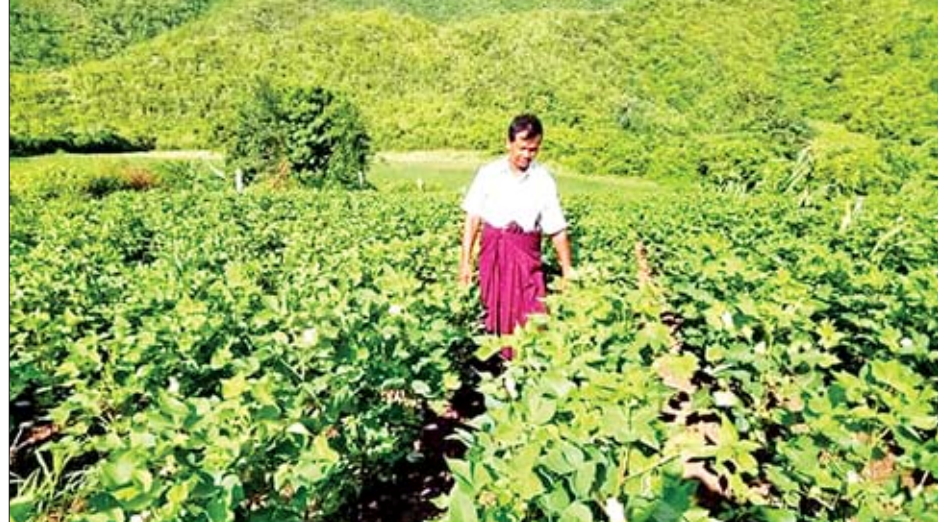
“ဒီစီမံကိန်းကြီးဟာ အကြီးကြီးဖြစ်ပါတယ်။ ဌာနပေါင်းစုံတွေ၊ ပုဂ္ဂလိကကဏ္ဍတွေရော၊ စိုက်ပျိုးရေးတောင်သူတွေရော၊ ရောင်းဝယ်ဖောက်ကားသူတွေရော အားလုံးပိုင်းဝန်းပူးပေါင်းဆောင်ရွက်ပေးဖို့ လိုပါတယ်။ အစိုးရကနေပြီးတော့ အာရှဖွံ့ဖြိုးရေးဘဏ်ချေးငွေယူပြီးဆောင်ရွက်ပေးတာပါ။ ချေးငွေပြန်ဆပ်တဲ့ကာလကတော့ ၃၂ နှစ် ပြန်လည်ပေးဆပ်ပေးရမှာပါ။ ခုလုပ်တဲ့ စီမံကိန်းရည်ရွယ်ချက်ကတော့ စိုက်ပျိုးစီးပွားရေးကွင်းဆက်

ယင်းတို့မှာ မန္တလေးတိုင်းဒေသကြီး၊ စစ်ကိုင်းတိုင်းဒေသကြီးနှင့် မကွေးတိုင်းဒေသကြီးတို့တွင် တောင်သူများနှင့် စားသုံးသူပြည်သူများအတွက် ရာသီဥတုနှင့် လိုက်လျောညီထွေဖြစ်စေမည့် စိုက်ပျိုးစီးပွားရေးလုပ်ငန်းဆိုင်ရာ တန်ဖိုးကွင်းဆက် ခုနစ်နှစ်စီမံကိန်းကို အကောင်အထည်ဖော်ဆောင်ရွက်သွားမည်ဖြစ်ကြောင်း သိရသည်။