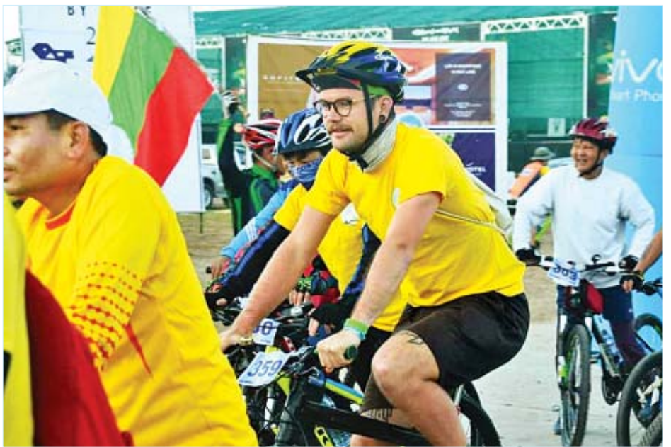
ရမ်းပြည်နယ်(တောင်ပိုင်း) ညောင်ရွှေမြို့တွင် ကျင်းပခဲ့သည့် "တောင်တက်လမ်းကြမ်းစက်ဘီးစီးနင်းပွဲ" မှ စက်ဘီးစီးဝါသနာရှင် နိုင်ငံခြားသားခရီးသွားများ ဝင်ရောက်ယှဉ်ပြိုင်နေကြသည်ကို တွေ့ရစဉ်။