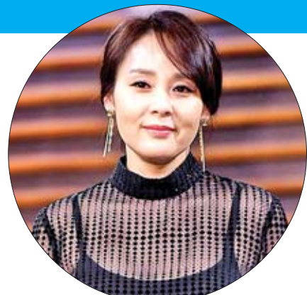
ဇွန် ၂၇ ရက်က ကျင်းပခဲ့သည့် ပါတီပွဲတွင် ဂျိုးဂျိုနက်စ်နှင့် ဆိုဖီယာတာနာတို့ကို တွေ့ရစဉ်။

အများရဲ့ စိတ်ဝင်စားမှုကိုရရှိထားတဲ့ ဟောလိဝုဒ်ကြယ်ပွင့်စုံတစ်တွဲဖြစ်တဲ့ မင်းသမီး ဆိုဖီယာတာနာနဲ့ တေးသံရှင် ဂျိုးဂျိုနက်စ်တို့ရဲ့ တရားဝင်မင်္ဂလာ အခမ်းအနားကို လတ်တလောမှာတော့ ပြင်သစ်မှာ ကျင်းပခဲ့တာ ဖြစ်ပါတယ်။ ဒီအခမ်းအနားဟာ ကြယ်ပွင့်စုံတို့ရဲ့ ဒုတိယမြောက် မင်္ဂလာပွဲဖြစ်ပြီး မိသားစုဝင်တွေပါဝင်တဲ့ တရားဝင်မင်္ဂလာပွဲလည်းဖြစ်ကြောင်း အီးအွန်လိုင်းဒေါ့ကွန်းရဲ့ ရေးသားဖော်ပြချက်တွေအရ သိရပါတယ်။ ဇွန် ၂၉ ရက်မှာတော့ အသက် ၂၉ နှစ်အရွယ်ရှိပြီဖြစ်တဲ့ ပေါ့ပ်ကြယ်ပွင့် ဂျိုးဂျိုနက်စ်နဲ့ ၂၃ နှစ်အရွယ် “Game of Thrones” ဇာတ်လမ်းတွဲတွေရဲ့ ဇာတ်ဆောင်မင်းသမီး ဆိုဖီယာတာနာတို့ရဲ့ မင်္ဂလာပွဲကို ပြင်သစ်နိုင်ငံတောင်ပိုင်းမှာ ပြုလုပ်ခဲ့တာဖြစ်ပါတယ်။ ဒီမင်္ဂလာအခမ်းအနားကိုတော့ နှစ်ဖက်မိသားစုတွေနဲ့ မိတ်ဆွေတွေ တက်ရောက်ခဲ့ကြပြီး အနုပညာအသိုင်းအဝိုင်းက မိတ်ဆွေတွေလည်း တက်ရောက်ခဲ့ကြတာကို တွေ့ရပါတယ်။ မင်္ဂလာအခမ်းအနားကိုတော့ ပန်းတွေ၊ ဖယောင်းတိုင်တွေနဲ့ ပြင်ဆင်ဖန်တီးထားပါတယ်။ သတို့သမီးကတော့ ဇာဂါဝန်ရှည်ကို ဝတ်ဆင်ခဲ့ပြီး သူ့ရဲ့ သတို့သမီးအရံတွေထဲမှာတော့ “Game of Thrones” ဇာတ်လမ်းတွဲမှာ အတူတူဖက်ပါဝင်ခဲ့ပြီး အခင်ဆုံးသော သူငယ်ချင်းတစ်ဦးလည်းဖြစ်တဲ့ မင်းသမီး မက်ဆီလီယမ် ပါဝင်ဆောင်ရွက်ပေးခဲ့တာကိုလည်း တွေ့ရပါတယ်။ ဂျိုးဂျိုနက်စ်နဲ့ ဆိုဖီယာတာနာတို့ဟာ မင်္ဂလာအခမ်းအနားမကျင်းပမီ ပြင်သစ်ကို တစ်ပတ်အလိုကတည်းက ရောက်ရှိနေခဲ့ကြ တာလည်း ဖြစ်ပါတယ်။ ရင်းနှီးတဲ့မိတ်ဆွေအချို့လည်း ကြိုတင်ရောက်ရှိနေပြီး မင်္ဂလာပွဲမကျင်းပမီ အကြို ပါတီပွဲတစ်ခုကိုလည်း ပြင်သစ်မှာ ပြုလုပ်ခဲ့ပါတယ်။ ဇွန် ၂၇ ရက်မှာတော့ ဂျိုးဂျိုနက်စ်နဲ့ ဆိုဖီယာတာနာတို့ဟာ ပြင်သစ်မှာ မိသားစု ဝင်တွေ၊ သူငယ်ချင်းတွေနဲ့အတူရှိနေခဲ့ပြီး သူတို့တွေဟာ ရေကန်တစ်ခုမှာ ပါတီပွဲကိုလည်း ဆင်နွှဲခဲ့ကြတာတွေ့ရပါတယ်။