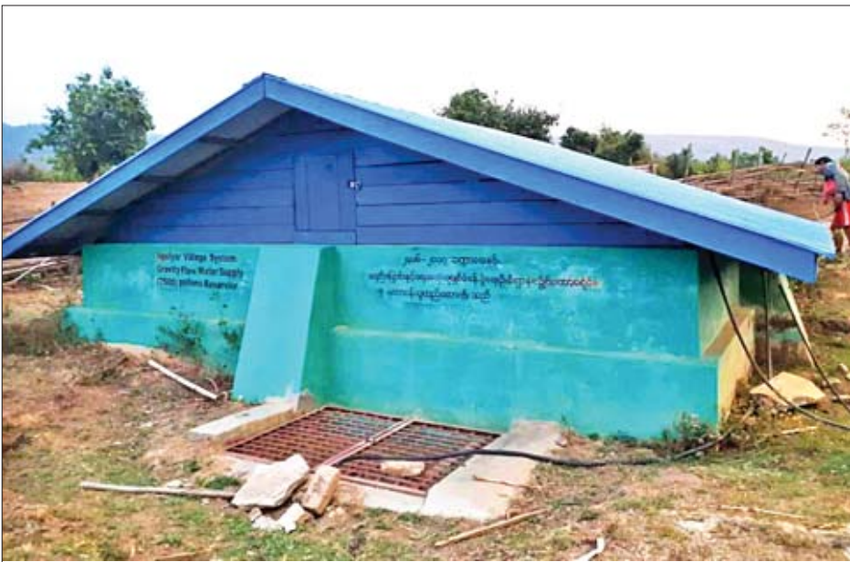
ဖဲလျားကျေးရွာ ဂါလန် ၇၅၀၀ ဆံ့ ရေလှောင်ကန်

အိမ်တိုင်း အိမ်တိုင်းတွင် စနစ်တကျ စီထားသော ထင်းခွဲခြမ်းများကို တွေ့ရပါသည်။ “လျှပ်စစ်မီးနဲ့ မချက်ပြုတ်ဘဲ၊ ဘာလို ထင်းမီးသုံးရတာလဲ”ဟု မေးရာ