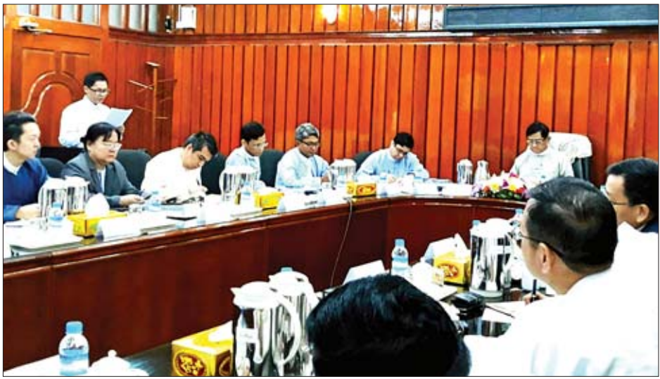
တင်ပြဆွေးနွေး ဆက်လက်၍ မြန်မာ့အာမခံလုပ်ငန်းဖွံ့ဖြိုးတိုးတက်ရေးဆွေးနွေးပွဲသို့ တက်ရောက်လာသော သက်ဆိုင်ရာတာဝန်ရှိသူများက ကဏ္ဍအလိုက် အသီးသီး တင်ပြဆွေးနွေးကြရာ အာမခံလုပ်ငန်းကြီးကြပ်ရေးအဖွဲ့မှ တာဝန်ရှိသူများက ပြန်လည်ရှင်းလင်းဆွေးနွေးကြကြောင်း သိရသည်။ မောင်စိန်လွင်(မြန်မာ့အလင်း)

ဝန်ကြီး ဦးမောင်မောင်ဝင်းက လက်ရှိအာမခံစီးပွားရေးသည် ဒေသအတွင်းတွင် အဆင့်နည်းပါးလျက်ရှိသေးကြောင်း၊ အသက်အာမခံအပါအဝင် အထွေထွေအာမခံအမျိုးအစားများကို ပြည်သူများစိတ်ဝင်စားမှု နည်းပါးဆဲဖြစ်၍ အာမခံအသိပညာပေးရန် အထူးလိုအပ်ပါကြောင်း၊ အာမခံနယ်ပယ်တွင် လုပ်ကိုင်သောဝန်ထမ်းများ၊ အာမခံကိုယ်စားလှယ်များကိုလည်း နိုင်ငံတကာအဆင့် အသိအမှတ်ပြုအာမခံပညာအဆင့်ရောက်အောင် သင်တန်းကျောင်းများ စနစ်တကျဖွင့်လှစ်သင်ကြားပေးရန် လိုအပ်ကြောင်း၊ မကြာမီဝင်ရောက်လာမည့် နိုင်ငံခြားအာမခံကုမ္ပဏီများကိုလည်း စိစစ်ခွင့်ပြုပြီး လုပ်ငန်းလိုင်စင်များ ချပေးတော့မည်ဖြစ်၍ ကောင်းသည့်နည်းပညာများ အတုယူခြင်းဖြင့် မြန်မာ့အာမခံလောကဖွံ့ဖြိုးတိုးတက်လာမည်ဟု ယုံကြည်ကြောင်း၊ အာမခံအသင်းကြီး၏ လက်ရှိလုပ်ဆောင်နိုင်စွမ်းကို အသိအမှတ်ပြုအားပေးပါကြောင်း ပြောကြားသည်။