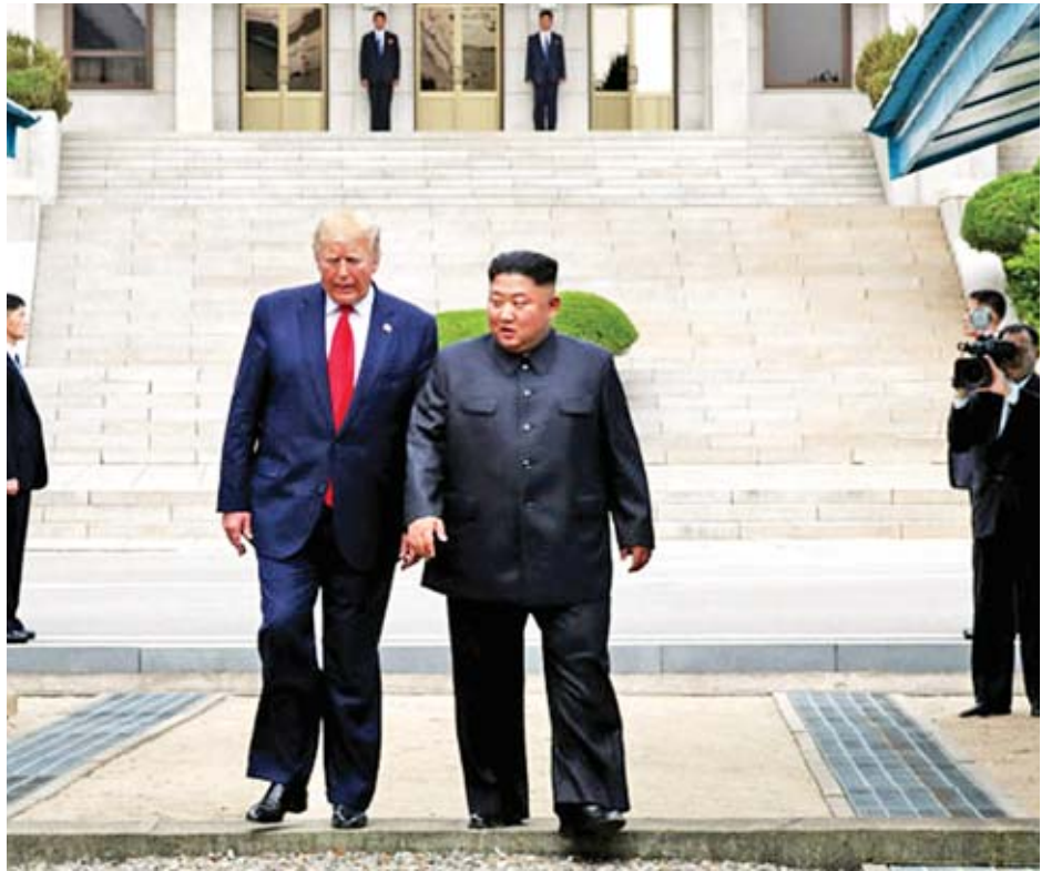
ထရန်နှင့် တိုက်ရိုက်တွေ့ဆုံကာ စေ့စပ်ညှိနှိုင်းခြင်းဖြင့် တိုးတက်ကောင်းမွန်စေရန် ကြိုးပမ်းလျက်ရှိသည်။ နိုင်ငံ၏ ရှေ့မှတိုးသော နောက်မဆုတ်သော အခြေအနေကို အေအက်မ်ပီ

ခေါင်းဆောင်ကင်က နိုင်ငံအပေါ် ချမှတ်ထားသည့် စီးပွားရေးပိတ်ဆို့မှုများ ပြန်လည်ရပ်သိမ်းနိုင်ရန် သမ္မတ