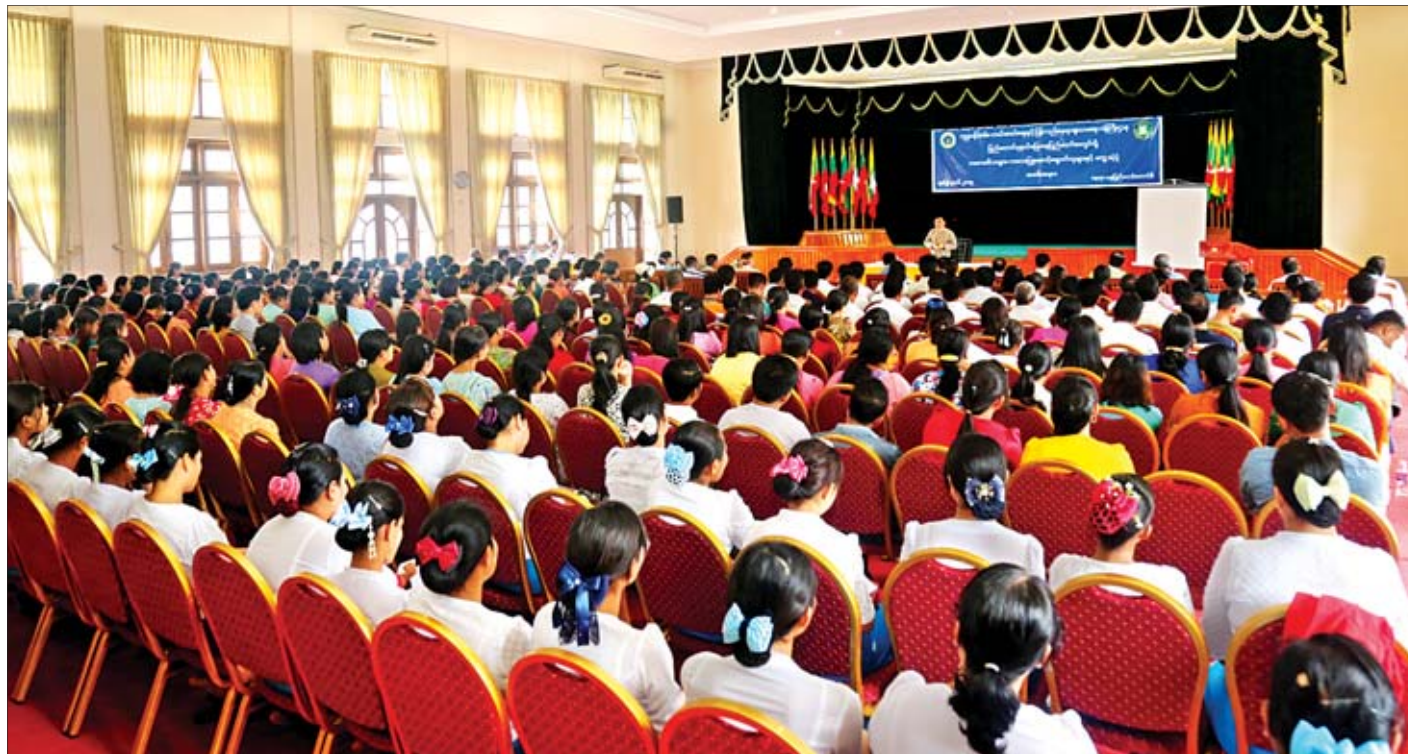
ပြည်ထောင်စုဝန်ကြီး ဒေါက်တာဝင်းမြတ်အေး ပြည်ထောင်စုနယ်မြေ နေပြည်တော်အတွင်းရှိ ကလေးမိဘများ၊ ကလေးပြုစောင့်ရှောက်သူများနှင့် တွေ့ဆုံပွဲအခမ်းအနားတွင် အမှာစကားပြောကြားစဉ်။