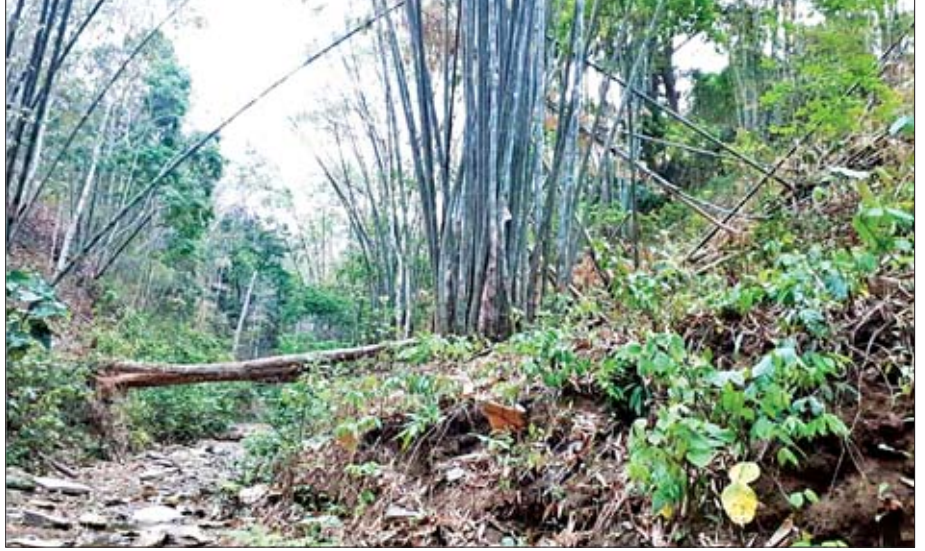
ဒီးမော့ဆိုမြို့နယ် ဖဲလျားနှင့် ထီးသဲကလို(၂)ရွာ (၂၀၁၆-၂၀၁၇ ခုနှစ် စိမ့်စမ်းရေသွယ်လုပ်ငန်း)

တောင်ပေါ်နေ ကယားတိုင်းရင်းသားတို့ ရေကြည်တစ်ပေါက် သောက်ကြရပေပြီ။ ။