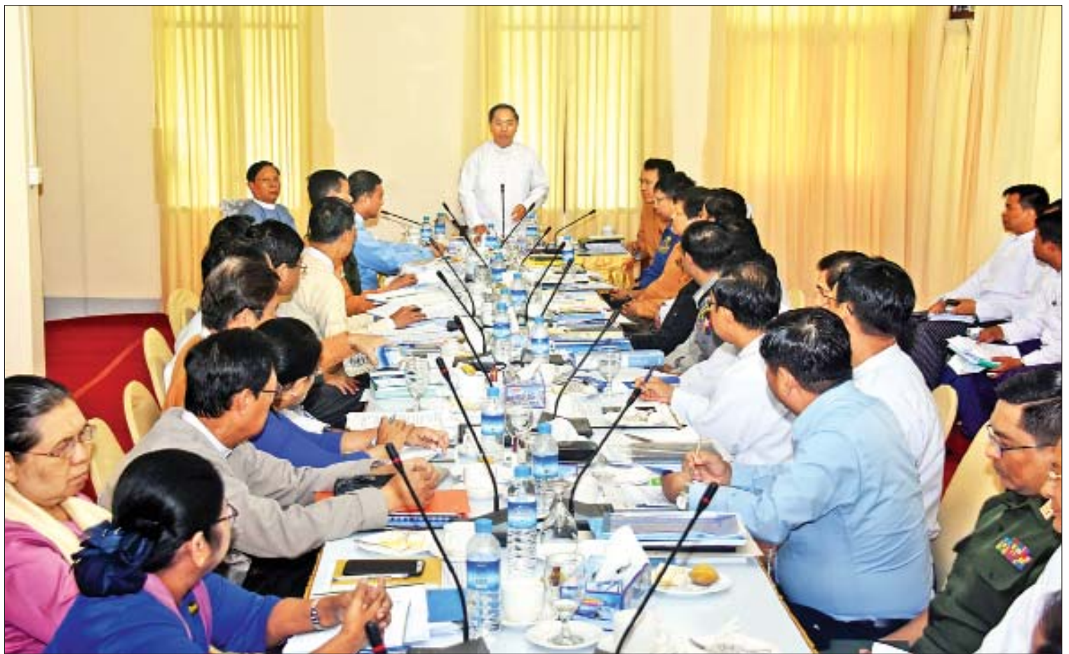
ဒုတိယသမ္မတ ဦးမြင့်ဆွေ ၂၀၁၉ ခုနှစ် (၇၂)နှစ်မြောက် အာဇာနည်နေ့ အခမ်းအနားကျင်းပရေး ဗဟိုကော်မတီ၏ ဒုတိယအကြိမ် လုပ်ငန်းညှိနှိုင်းအစည်းအဝေးတွင် အမှာစကား ပြောကြားစဉ်။

လည်း အာဇာနည်နေ့နှင့် သက်ဆိုင်သည့် အကြောင်းအရာများကို ပြည်သူများသိရှိနိုင်ရန်အတွက် ယခင်နှစ်များနည်းတူ သတင်းဆောင်းပါးများ၊ တွေ့ဆုံမေးမြန်းမှုအစီအစဉ်များ၊ ဗိုလ်ချုပ်အောင်ဆန်း၏ မိန့်ခွန်းများ၊ သီချင်းများ၊ လွတ်လပ်ရေးရရှိအောင် ကြိုးပမ်းခဲ့သည့် မှတ်တမ်းများ၊ ဓာတ်ပုံများ၊ ရုပ်ရှင်များ စသည်တို့ကို သတင်းစာ၊ ရုပ်မြင်သံကြားနှင့် ရေဒီယိုများတွင် ကြိုတင်ထုတ်လွှင့်နိုင်ရေး စီမံဆောင်ရွက်သွားရန်နှင့် ပညာရေးဝန်ကြီးဌာန အနေဖြင့်လည်း တက္ကသိုလ်၊ ကောလိပ်နှင့် အခြေခံပညာအဆင့် ကျောင်းများတွင် အာဇာနည်နေ့နှင့်သက်ဆိုင်သည့် စာစီစာကုံး ပြိုင်ပွဲများ၊ ဟောပြောပွဲများ၊ ကျပန်းစကားပြောပြိုင်ပွဲများနှင့် ပန်းချီပြိုင်ပွဲများကို ကျင်းပပြုလုပ်သွားကြရန် ညွှန်ကြားထားပြီးဖြစ်ပါကြောင်း။