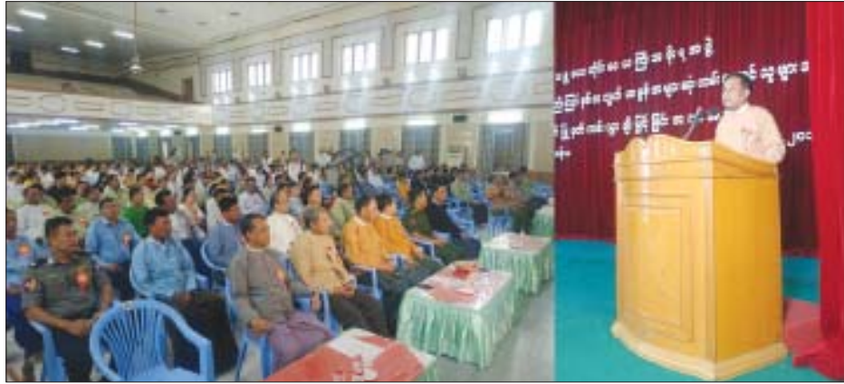
တိုင်းဒေသကြီးဝန်ကြီးချုပ် ဒေါက်တာဇော်မြင့်မောင်က နိုင်ငံတော်ဖွံ့ဖြိုးတိုးတက်ရေးအတွက် လိုအပ်သည့် ဘတ်ဂျက်ငွေအထောက်အပံ့အား လုပ်ငန်းရှင် အခွန်ထမ်းဆောင်သူများထံမှ ရရှိနေခြင်းဖြစ်သည်အတွက်

အခမ်းအနားသို့ တိုင်းဒေသကြီး ဝန်ကြီးချုပ် ဒေါက်တာ ဇော်မြင့်မောင်၊ တိုင်းဒေသကြီး လွှတ်တော်ဥက္ကဋ္ဌ ဦးအောင်ကျော်ဦး၊ တိုင်းဒေသကြီးတရားသူကြီးချုပ် ဦးစိုးသိန်း၊ တိုင်းဒေသကြီးလွှတ်တော် ဒုတိယဥက္ကဋ္ဌ ဒေါက်တာခင်မောင်ဌေး၊ တိုင်းဒေသကြီး ဝန်ကြီးများ၊ ဌာနဆိုင်ရာ တာဝန်ရှိသူများ၊ အခွန်အထောက်အကူ ပြုအဖွဲ့များနှင့် ဂုဏ်ပြုခံအခွန်ထမ်းများ တက်ရောက်ခဲ့ ကြသည်။