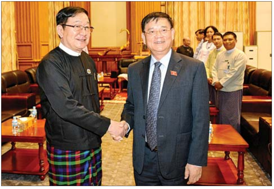
လှယ်များ ရွေးကောက်တင်မြှောက် ခြင်းဆိုင်ရာ ကိစ္စရပ်များအပြင် ရင်းနှီး မြှုပ်နှံမှု တိုးမြှင့်ရေးဆိုင်ရာကိစ္စရပ် များနှင့်စပ်လျဉ်း၍ ရင်းနှီးပွင့်လင်းစွာ ဒုတိယဥက္ကဋ္ဌ ဦးထွန်းထွန်းတိန်နှင့် အမြင်ချင်းဖလှယ် ဆွေးနွေးခဲ့ကြသည်။ ပြည်သူ့လွှတ်တော်မှ တာဝန်ရှိသူများ တက်ရောက်ခဲ့ကြသည်။ သတင်းစဉ်

နေပြည်တော် ဇွန် ၂၈ ပြည်သူ့လွှတ်တော်ဥက္ကဋ္ဌ ဦးတီ ခွန်မြတ်သည် ဗီယက်နမ်ကွန်မြူနစ် ပါတီ၊ ဗဟိုကော်မတီအဖွဲ့ဝင်နှင့် ဝန်ထမ်းရေးရာနှင့် အဖွဲ့အစည်း ရေးရာကော်မတီ ဒုတိယအကြီးအကဲ အမျိုးသားလွှတ်တော် အမြဲတမ်း ကော်မတီအဖွဲ့ဝင်နှင့် ကိုယ်စားလှယ် များရေးရာကော်မရှင် အကြီးအကဲ Mr. Tran Van Tuy အား ယနေ့ နံနက် ၁၁ နာရီတွင် နေပြည်တော်ရှိ လွှတ်တော်အဆောက်အအုံ ပြည်သူ့ လွှတ်တော်ဆောင် ဧည့်ခန်းမ၌ လက်ခံတွေ့ဆုံသည်။