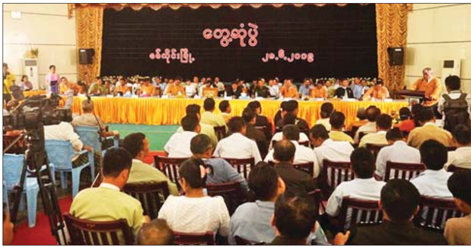
ရရှိရေး၊ မြို့တော်ခန်းမအဆင့် မြှင့်တင်ပေးနိုင်မှု အခြေအနေများ စသည်ဒေသဖွံ့ဖြိုးရေးလုပ်ငန်းများနှင့် ပတ်သက်သည့်များကို ဆွေးနွေးမေးမြန်းခဲ့ကြရာ

စစ်ကိုင်း ဇွန် ၂၀ စစ်ကိုင်းတိုင်းဒေသကြီးဝန်ကြီးချုပ် ဒေါက်တာမြင့်နိုင်၊ တိုင်းဒေသကြီးလွှတ်တော်ဥက္ကဋ္ဌ၊ တိုင်းဒေသကြီးဝန်ကြီးများ၊ တိုင်းဒေသကြီးဥပဒေချုပ်၊ စာရင်းစစ်ချုပ်၊ တိုင်းဒေသကြီး လွှတ်တော်ကိုယ်စားလှယ်များ၊ တိုင်းဒေသကြီး ဌာနဆိုင်ရာတာဝန်ရှိသူများနှင့် စစ်ကိုင်းခရိုင်အတွင်းရှိ ခရိုင်၊ မြို့နယ်အဆင့် ဌာနဆိုင်ရာများ၊ ဒေသခံပြည်သူများ တွေ့ဆုံပွဲကို ယနေ့နံနက် ၉ နာရီက စစ်ကိုင်းမြို့ရှိ မြို့တော်ခန်းမ၌ ကျင်းပသည်။