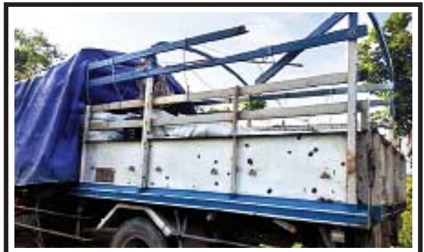
AA အဖွဲ့ မိုင်းဖောက်ခွဲတိုက်ခိုက်ခဲ့သည့် အပြည်ပြည်ဆိုင်ရာ ကြက်ခြေနီ (ICRC)အဖွဲ့မှ ထောက်ပံ့ရေးပစ္စည်းများ တင်ဆောင်လာ သည့်ယာဉ်အား တွေ့ရှိရစဉ်။