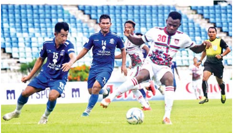
Chinland နှင့် Southern အသင်း ယှဉ်ပြိုင်နေစဉ်။

နှစ်သင်းစလုံး အမာခံကစားသမားအစုံအလင်ဖြင့် ပွဲထွက်ခဲ့ပြီး Chinland အသင်းက နိုင်ငံခြားသားကစားသမားသုံးဦးစလုံး စာမျက်နှာ ၁၃ ကော်လံ ၁ သို့ ❖