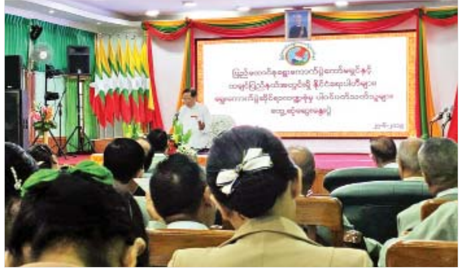
ရွေးကောက်ပွဲအတွက် အခြေခံမဲဆန္ဒရှင်စာရင်း ပြုစုရေးလုပ်ငန်းများနှင့်ပတ်သက်၍ ဆန္ဒမဲပေးပိုင်ခွင့်ရှိသည့် နိုင်ငံသားများအားလုံး မဲပေးပိုင်ခွင့် မဆုံးရှုံးစေရေးအတွက် မဲဆန္ဒရှင်စာရင်းတွင် ပါဝင်စေရေးနှင့် မှန်ကန်တိကျသော