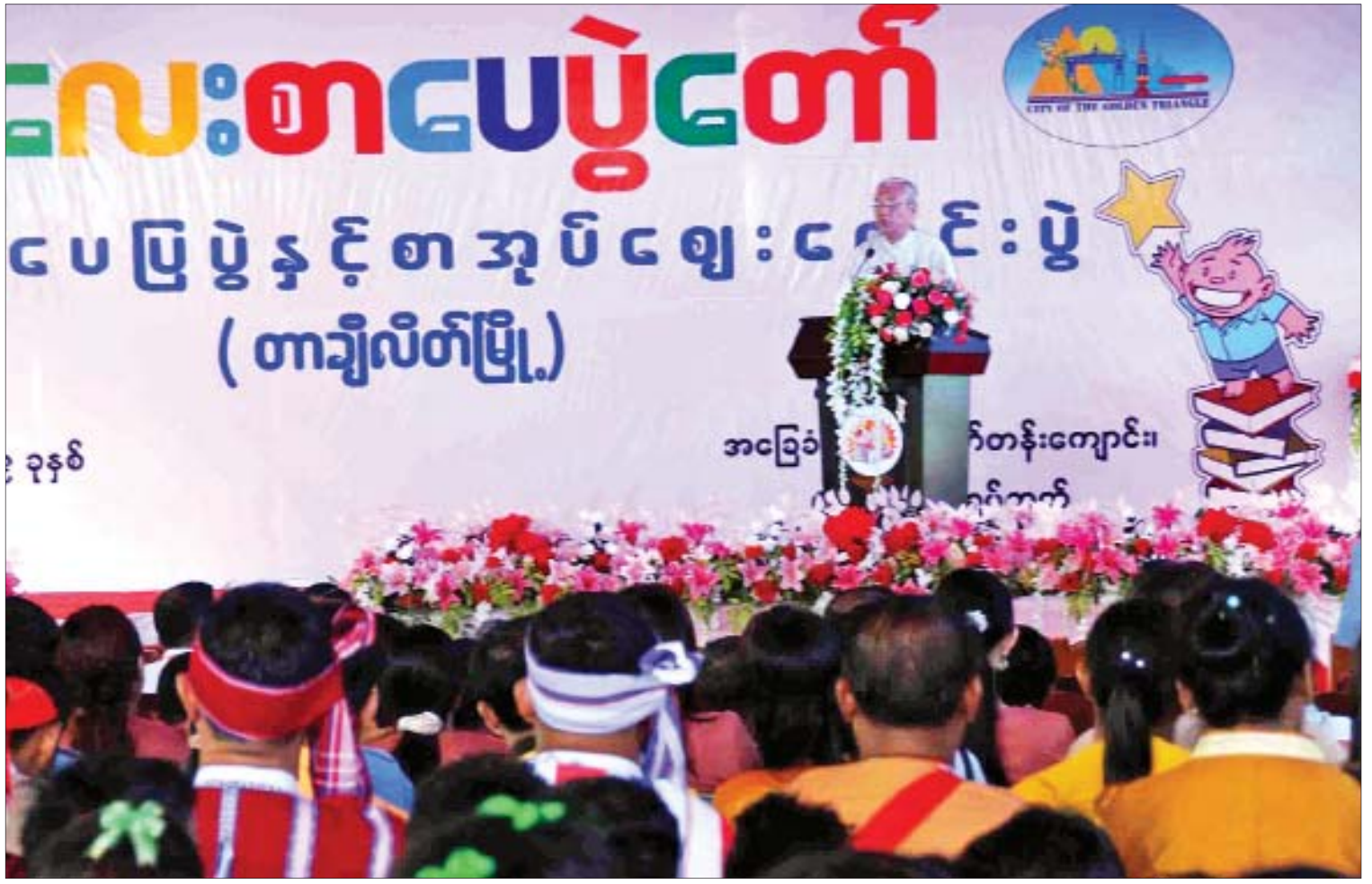
နိုင်ငံတော်သမ္မတ(ငြိမ်း) ဦးထင်ကျော် ကလေးစာပေပွဲတော်၊ စာအုပ်ပြပွဲနှင့် စာအုပ်ဈေးရောင်းပွဲ(တာချီလိတ်) ဖွင့်ပွဲအခမ်းအနားတွင် အမှာစကားပြောကြားစဉ်။