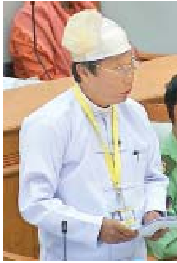
ဒုတိယဝန်ကြီး ဦးလှကျော်