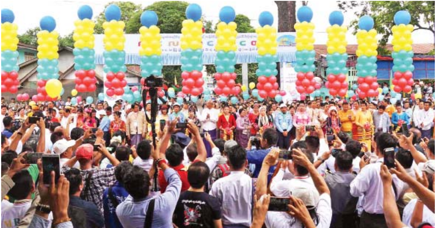
ကလေးစာပေပွဲတော်၊ စာအုပ်စာပေပြပွဲနှင့် စာအုပ်ဈေးရောင်းပွဲ (တာချီလိတ်) ဖွင့်ပွဲကျင်းပစဉ်။

ယခုဆိုလျှင် ကလေးစာပေပွဲတော်များ ကျင်းပခဲ့သည်မှာ နိုင်ငံတော်အဆင့် ၉ နေရာ၊ တိုင်းဒေသကြီး၊ ပြည်နယ်အဆင့် ၄၈ နေရာရှိ ပြီးဟု သိရှိရပါကြောင်း၊ ကလေးစာပေပွဲတော်သည် အဓိကအားဖြင့် ကလေးများပျော်ရွှင်ရန်၊ ကလေးများစာဖတ်ခြင်းတွင် နှစ်သက်ပျော်မွေ့ပြီး ဘဝတစ်သက်တာပညာရှာဖွေပညာဆည်းပူးလိုသည့်စိတ်များ ဖြစ်ပေါ်လာရန် ဖြစ်ပါကြောင်း၊ ကလေးစာပေပွဲတော်တွင် ပါဝင်ဆင်နွှဲကြရင်းဖြင့် စုပေါင်းလုပ်ဆောင်ခြင်း၏ အကျိုးကျေးဇူးများ၊ အနှစ်သာရများ သဘောပေါက်စေရန် လုပ်ဆောင်ပေးခြင်း