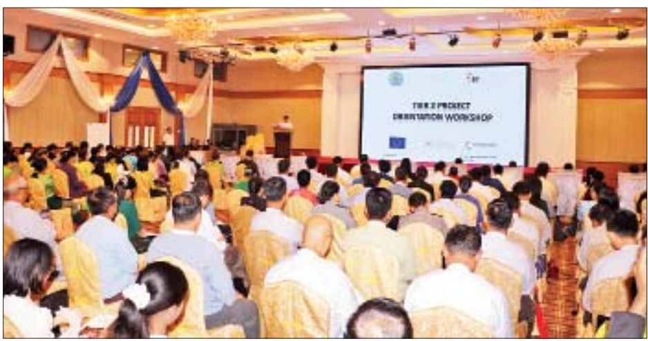
ထိုပြင် ဒုတိယဝန်ကြီးသည် ယနေ့တွင် ILO Liaison Office in Myanmar မှ Liaison Officer Mr. Rory Mungoven နှင့် အဖွဲ့အား စီးပွားရေးနှင့်ကူးသန်းရောင်းဝယ်ရေးဝန်ကြီးဌာန၌ တွေ့ဆုံခဲ့ပြီး ကုန်သွယ်မှုကဏ္ဍဖွံ့ဖြိုးတိုးတက်ရေးအတွက် ILO နှင့် ပူးပေါင်းဆောင်ရွက်လျက်ရှိသည့် စီမံကိန်းများ အဆင်ပြေ

အလုပ်အကိုင်ရရှိနိုင်စွမ်းကို အထောက်အကူပြုရန် အလားအလာကောင်းများရှိသည့် ဝန်ဆောင်မှုကဏ္ဍအား ရွေးချယ်ခဲ့ခြင်းဖြစ်ကြောင်း၊ ယခုစီမံကိန်းသည် မြန်မာနိုင်ငံ၏ ရေရှည်တည်တံ့ခိုင်မြဲပြီး ဟန်ချက်ညီသော ဖွံ့ဖြိုးတိုးတက်မှုစီမံကိန်း (Myanmar Sustainable Development Plan-MSDP) (၂၀၁၈-၂၀၃၀) တို့ နှင့်ချိတ်ဆက်နေပြီး စီးပွားရေးနှင့် ကူးသန်းရောင်းဝယ်ရေး ဝန်ကြီးဌာနက တာဝန်ယူဆောင်ရွက်ရသည့် အလုပ်အကိုင်ဖန်တီးပေးရေးလုပ်ငန်းစဉ်များကိုလည်း အထောက်အကူပြုနေပါကြောင်း။ စီမံကိန်းပါ အခန်းကဏ္ဍနှင့် အကြောင်းအရာများသည် တစ်ချိန်တည်းဖြစ်ပေါ်တိုးတက်ရန် လိုအပ်သည့်အတွက် သတ်မှတ်ချိန်အတွင်း အောင်မြင်စွာ အကောင်အထည်ဖော်နိုင်ရေး သက်ဆိုင်ရာအစိုးရဌာနများ၊ ပုဂ္ဂလိကလုပ်ငန်းရှင် အဖွဲ့အစည်းများ၊ နီးကပ်စွာပူးပေါင်းဆောင်ရွက်သွားရမည်ဖြစ်ကြောင်း၊ ယခုစီမံကိန်းမှာ Tier 2 အဆင့်အတွက် ဆောင်ရွက်ခြင်းဖြစ်ပြီး Tier 1 အဆင့်တွင် ဝန်ထမ်းစွမ်းဆောင်ရည် မြှင့်တင်ခြင်းဆိုင်ရာ စီမံကိန်းကို ၂၀၁၅ ခုနှစ်မှ ၂၀၁၈ ခုနှစ်အထိ ဆောင်ရွက်ခဲ့ပြီး ဖြစ်ပါကြောင်း ပြောကြားသည်။