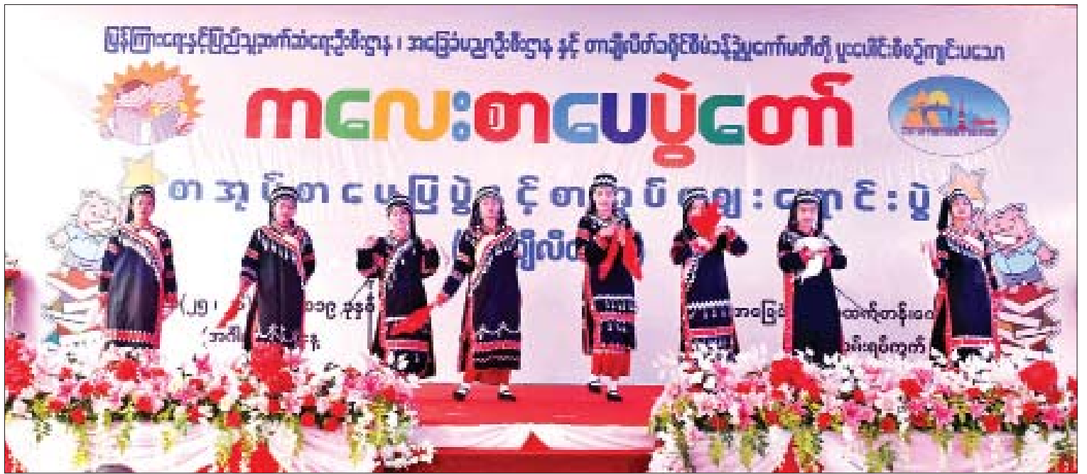
ကလေးစာပေပွဲတော်၊ စာအုပ်စာပေပြပွဲနှင့် စာအုပ်ဈေးရောင်းပွဲ (တာချီလိတ်) ဖွင့်ပွဲတွင် တိုင်းရင်းသူလေးများက ရိုးရာအကဖြင့် ဖျော်ဖြေတင်ဆက်ကြစဉ်။

တော်သည်၊ ထူးချွန်သည့်ကလေးများကို နိုင်ငံတကာနှင့် ယှဉ်ပြိုင်နိုင်စွမ်းရှိသည်