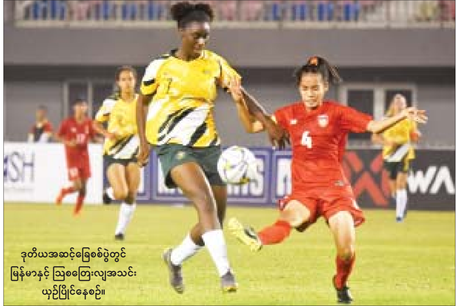
ဒုတိယအဆင့်ခြေစစ်ပွဲတွင် မြန်မာနှင့် ဩစတြေးလျအသင်း ယှဉ်ပြိုင်နေစဉ်။

ရန်ကုန် ဇွန် ၂၅ မြန်မာ ယူ-၁၉ အမျိုးသမီးအသင်း သည် ၂၀၁၉ အာရှ ယူ-၁၉ အမျိုးသမီး ပြိုင်ပွဲ နောက်ဆုံးအဆင့် ယှဉ်ပြိုင်ရန် ဇူလိုင် ၁ ရက်တွင် စတင်လေ့ကျင့်မည် ဖြစ်သည်။