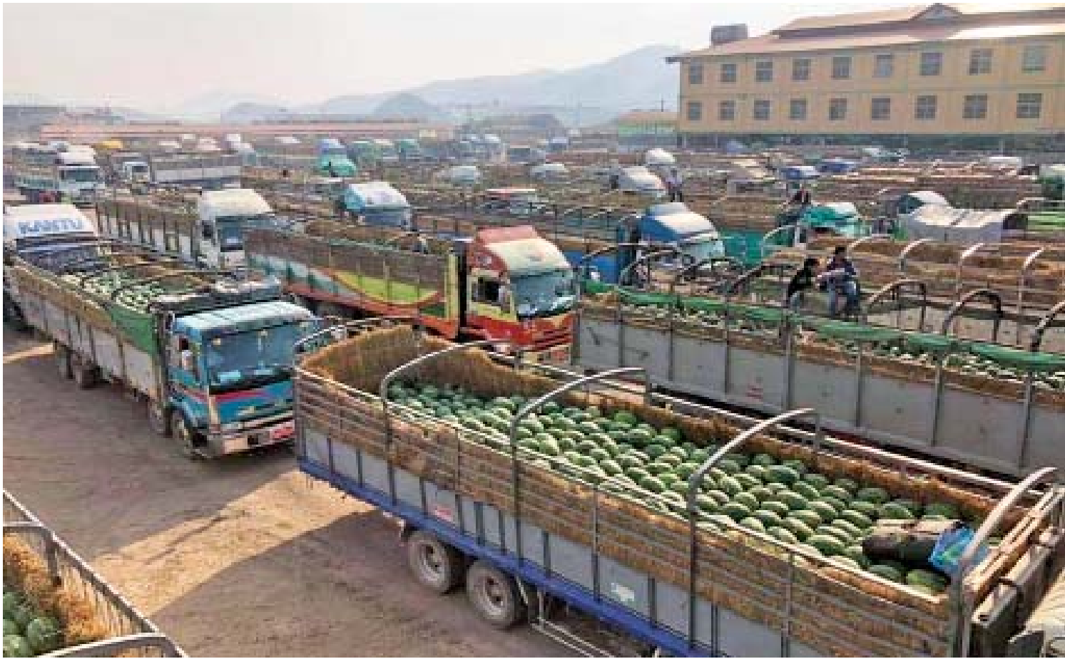
မူဆယ်ဈေးကွက်တွင် တရုတ်နိုင်ငံသို့ တင်ပို့မည့် ဓရသီးကားများကို တွေ့ရစဉ်။

လယ်ယာကဏ္ဍကို အခြေခံထားသည့် မြန်မာနိုင်ငံအနေဖြင့် ပြည်ပသို့ ဆန်အများ အပြား တင်ပို့နေသည့်အပြင် ပဲမျိုးစုံကို