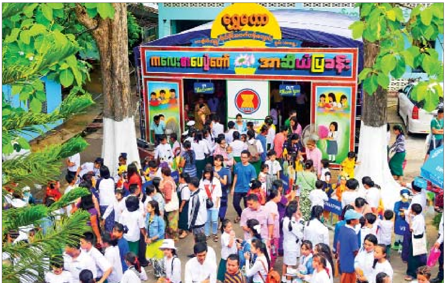
ကလေးစာပေပွဲတော်၊ စာအုပ်စာပေပြပွဲနှင့် စာအုပ်ဈေးရောင်းပွဲ (တာချီလိတ်) တွင် အာဆီယံပြခန်း၌ ကြည့်ရှုလေ့လာကြသူများကို တွေ့ရစဉ်။

ကလေးများဖြစ်အောင် ပြုစုပျိုးထောင် ပေးနိုင်ရန်၊ ကလေးများ သူတို့ဝါသနာပါသည့် ဘာသာရပ်များကို ဆက်လက်သင်ယူသည့် အခါ အားကောင်းရန်နှင့် အထူးသဖြင့်ယနေ့ (၂၁) ရာစုတွင် အထူးအားကောင်းမှ ဖြစ် သည့်အတွက် ၎င်းကလေးများကို အဆိုပါ ဘာသာရပ်များတွင် ထူးချွန်ထက်မြက်ရန် အရေးကြီးပါကြောင်း၊ ယင်းဘာသာရပ်များ တွင် သူတို့ထူးချွန်ထက်မြက်ပြီးဆိုလျှင် နိုင်ငံ တကာနှင့် ယှဉ်ပြိုင်နိုင်စွမ်းရှိအောင် အင်္ဂလိပ် ဘာသာစကားတတ်ကျွမ်းရန်လည်း အရေး ကြီးပါကြောင်း။ အင်္ဂလိပ်ဘာသာစကား ရေးတတ်၊