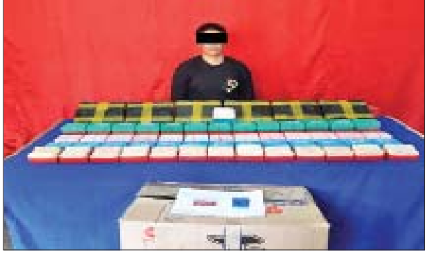
မနန်းအုန်းရီအား သိမ်းဆည်းရမိသည့် မူးယစ်ဆေးဝါးများနှင့်အတူ တွေ့ရစဉ်။