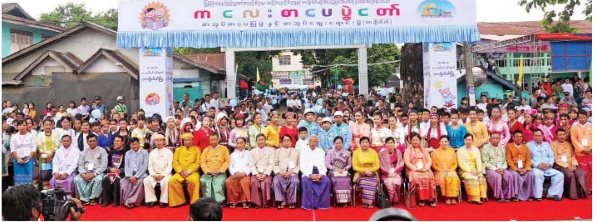
နိုင်ငံတော်သမ္မတ(မြိမ်း) ဦးထင်ကျော်၊ ပြည်ထောင်စုဝန်ကြီးများ၊ ပြည်နယ်ဝန်ကြီးချုပ်နှင့်တာဝန်ရှိသူများ၊ ကျောင်းသား ကျောင်းသူများ ကလေးစာပေပွဲတော်၊ စာအုပ်စာပေပြပွဲနှင့် စာအုပ်ဈေးရောင်းပွဲ (တာချီလိတ်) ဖွင့်ပွဲအခမ်းအနားတွင် စုပေါင်းမှတ်တမ်းတင်ဓာတ်ပုံပိုက်ကြစဉ်။

ဟောပြောဖူးပါကြောင်း။ ယနေ့ ပွဲတော်ကျင်းပရာတွင်လည်း ရပ်မိရပ်ဖများအပါအဝင် အားလုံးက တက်တက်ကြွကြွပါဝင်လှုပ်ရှားနေသည်ကို တွေ့ရှိရပါကြောင်း၊ လူကြီးမိဘများအနေဖြင့် နှစ်ရက်တာကျင်းပမည့် ကလေးစာပေပွဲတော်တွင် ကလေးများပါဝင်နိုင်အောင် ဆောင်ရွက်ပေးစေလိုပါကြောင်း၊ တိုက်တွန်း