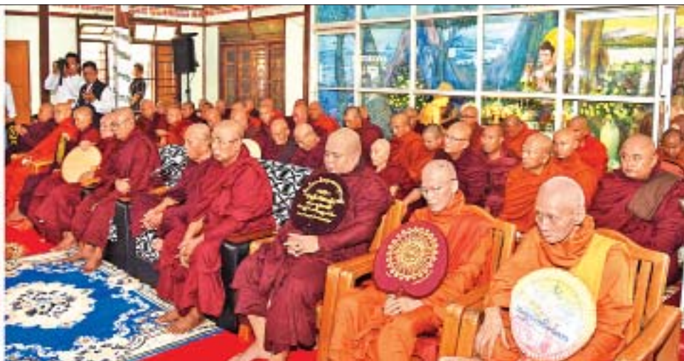
နိုင်ငံတော်သမ္မတ ဦးဝင်းမြင့်နှင့်ဇနီး ဒေါ်ချိုချိုနှင့် ဧည့်ပရိသတ်များ ပဲခူးတိုင်းဒေသကြီး ရေတာရှည်မြို့နယ် ဆွာမြို့စက်ရုံကျောင်းတိုက်ပဓာနနာယက ဆရာတော် အဂ္ဂမဟာပဏ္ဍိတ ဘဒ္ဒန္တသာသနထံမှ ငါးပါးသီလခံယူဆောင်တည်ကြစဉ်။