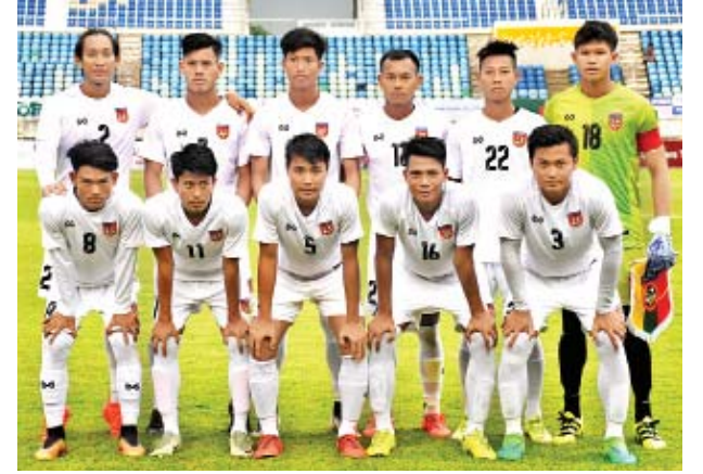
ဆီးဂိမ်းပြိုင်ပွဲအတွက် ရည်ရွယ်ခွဲစည်းထားသည့် မြန်မာ ယူ-၂၂ အသင်း။

ရန်ကုန် ဇွန် ၂၄ ဖိလစ်ပိုင်နိုင်ငံက အိမ်ရှင်အဖြစ် လက်ခံကျင်းပမည့် အကြိမ် (၃၀) မြောက် ဆီးဂိမ်းပြိုင်ပွဲ ယှဉ်ပြိုင်မည့် မြန်မာ ယူ-၂၂ အသင်းသည် စက်တင်ဘာလတွင် နိုင်ငံတကာခြေစမ်းပွဲများ စတင်ကစားမည်ဖြစ်သည်။ ဩဂုတ် ၁၉ ရက်တွင် စတင်လေ့ကျင့် မြန်မာ ယူ-၂၂ အသင်းသည် ဩဂုတ် ၁၉ ရက်တွင် စတင်လေ့ကျင့်ရန် စီစဉ်ထားပြီး နိုင်ငံတကာ ရက်သတ္တပတ်ကြောင့် လိဂ်ပြိုင်ပွဲရပ်နားမည့် စက်တင်ဘာလဆန်းတွင် နိုင်ငံတကာခြေစမ်းပွဲများ စတင်ကစားရန် ကြိုးပမ်း နေခြင်းဖြစ်သည်။ မြန်မာ ယူ-၂၂ အသင်းသည် အာရှခြေစမ်းပွဲပြီးကတည်းက လေ့ကျင့်မှု ရပ်နားခဲ့ပြီး မေလနောက်ဆုံးပတ်တွင် နိုင်ငံတကာခြေစမ်းပွဲနှစ်ပွဲ ကစားရန် ကာလတိုလေ့ကျင့်ပြင်ဆင်ခဲ့သော်လည်း ဗီယက်နမ် ယူ-၂၂ အသင်းနှင့် ခြေစမ်းပွဲအပြီးတွင် စာမျက်နှာ ၉ ကော်လံ ၁ သို့ ■