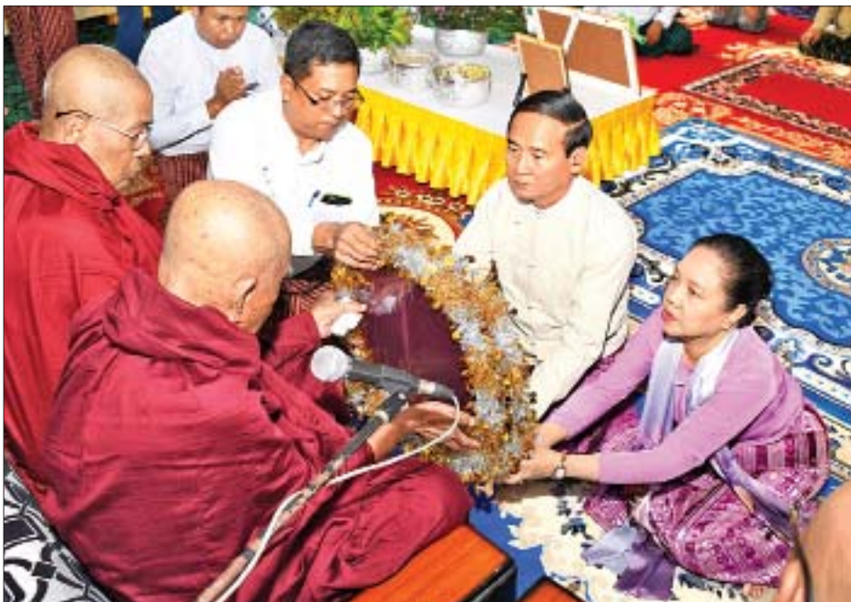
နိုင်ငံတော်သမ္မတ ဦးဝင်းမြင့်နှင့်ဇနီး ဒေါ်ချိုချို ဆရာတော်၊ သံဃာတော်များအား လှူဖွယ်ပစ္စည်းများ ဆက်ကပ်လှူဒါန်းစဉ်။

နိုင်ငံတော်သမ္မတက ထာဝရငြိမ်းချမ်းရေးစေတီတော်မြတ်ကြီးအတွက် ငွေကျပ် သိန်း ၁၀၀၀ ကို ထာဝရငြိမ်းချမ်းရေးစေတီတော် တည်ဆောက်ရေးဦးစီးကော်မတီ ဒုတိယဥက္ကဋ္ဌ သာသနာရေးနှင့် ယဉ်ကျေးမှုဝန်ကြီးဌာန ဒုတိယဝန်ကြီး ဦးကြည်မင်းထံ လွှဲပြောင်းပေးအပ်သည်။ ယင်းနောက် နိုင်ငံတော်သမ္မတနှင့် ဇနီး၊ ဧည့်ပရိသတ်များက နေပြည်တော် ပုဗ္ဗသီရိမြို့နယ် ဝဲကြီးကျောင်းတိုက် ပဓာနနာယက ဆရာတော် အဂ္ဂမဟာပဏ္ဍိတ ဘဒ္ဒန္တအာဒိစ္စဝံသထံမှ အနုမောဒနာတရားနာကြားကြပြီး လှူဒါန်းမှုအစုစုတို့အတွက် ရေစက်သွန်းလောင်း အမှုပေးကြသည်။