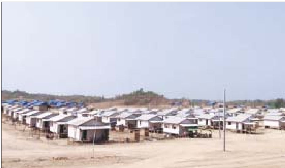
ကျွန်းတောစု ရွာသစ်ကျေးရွာ၌ဆောက်လုပ်ထားသော မကြာမီအပ်နှံတော့မည့်နေအိမ်များကို တွေ့ရစဉ်။

ရေတာရှည် ဇွန် ၂၄ ပဲခူးတိုင်းဒေသကြီး ရေတာရှည်မြို့နယ်ရှိ ရေဘေးသင့်ပြည်သူများအတွက် လူမှုဝန်ထမ်း၊ ကယ်ဆယ်ရေးနှင့် ပြန်လည်နေရာချထားရေးဝန်ကြီးဌာန၏ ထောက်ပံ့ပေးပေးဆောင်ရွက်မှုဖြင့် မြန်မာနိုင်ငံဆောက်လုပ်ရေးဆိုင်ရာလုပ်ငန်းရှင်များအသင်းချုပ်က တာဝန်ယူဆောက်လုပ်လှူဒါန်းသော နေအိမ်များမှာ ယခုအခါ