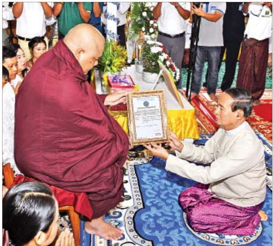
နိုင်ငံတော်သမ္မတ ဦးဝင်းမြင့် ထာဝရငြိမ်းချမ်းရေးစေတီတော်မြတ်ကြီးအတွက် ငွေကျပ် သိန်း ၁၀၀၀ လှူဒါန်း သည့် “အေးမေတ္တာစံ” တောင်နီလေးပရဟိတကျောင်းတိုက် ပဓာနနာယကဆရာတော် ဘဒ္ဒန္တစန္ဒိမာအား ဂုဏ်ပြု မှတ်တမ်းလွှာ ပြန်လည်ဆက်ကပ်စဉ်။

နေပြည်တော် ဇွန် ၂၄ နိုင်ငံတော်သမ္မတ ဦးဝင်းမြင့်နှင့် ဇနီး ဒေါ်ချိုချိုတို့သည် ယနေ့နံနက် ၉ နာရီတွင် နေပြည်တော် ပုဗ္ဗသီရိမြို့နယ် ဆင်ဖြူရှင် ရပ်ကွက်ရှိ “အေးမေတ္တာစံ” တောင်နီလေးပရဟိတကျောင်းတိုက်၌ ကျင်းပသည့် “အေးမေတ္တာစံ” တောင်နီလေး ပရဟိတကျောင်းတိုက် ပဓာနနာယက ဆရာတော် ဘဒ္ဒန္တစန္ဒိမာ၏ ဝိဇာတမွေးနေ့မင်္ဂလာတွင် ထာဝရငြိမ်းချမ်းရေး စေတီတော်မြတ်ကြီးအတွက် ငွေကျပ် သိန်း ၁၀၀၀ လှူဒါန်းပွဲအခမ်းအနားသို့ တက်ရောက်ကြည်ညိုကြသည်။ စာမျက်နှာ ၃ ကော်လံ ၁ သို့