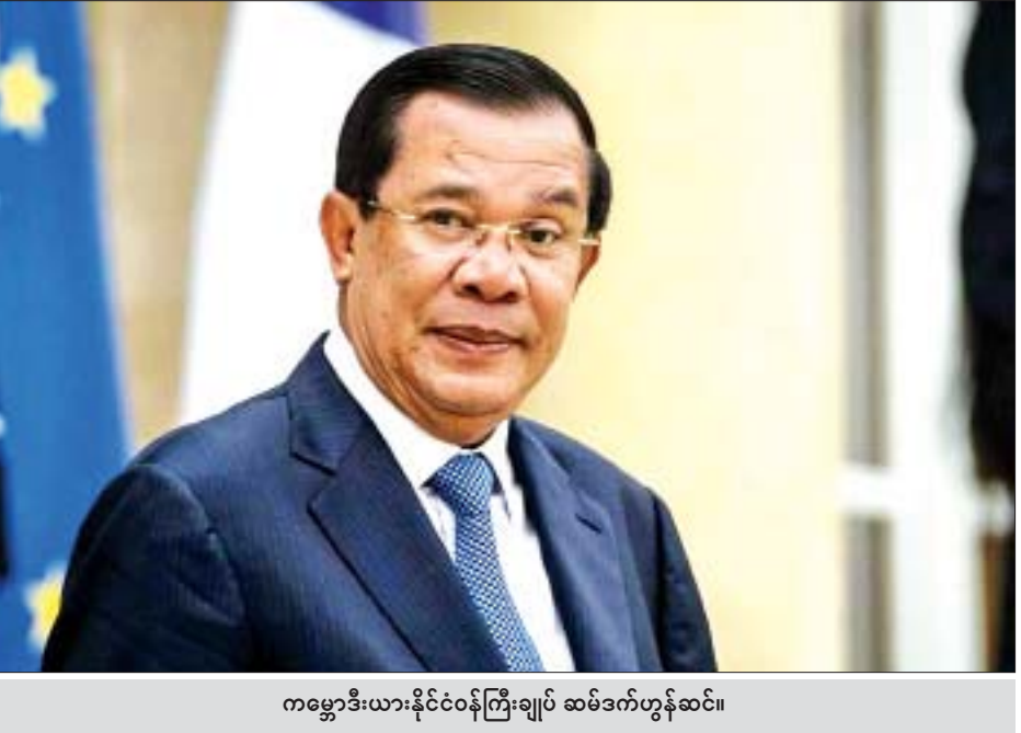
ကမ္ဘောဒီးယားနိုင်ငံဝန်ကြီးချုပ် ဆမ်ဒက်ဟွန်ဆင်။