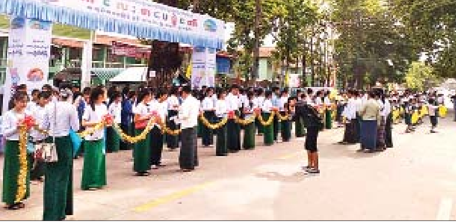
တွင်ပါဝင်မည့် အခြေခံပညာကျောင်းများ၊ ကိုယ်ပိုင်ကျောင်းသူများ၊ ဌာနဆိုင်ရာ တာဝန်ရှိသူများ တက်ရောက်ကျောင်းများမှ ဆရာ ဆရာမများ ကျောင်းသား ခွဲကြပြီး ကဏ္ဍအလိုက် လေ့ကျင့်မှုများဆောင်ရွက်ခဲ့

ကလေးစာပေပွဲတော် (တာချီလိတ်) အောင်မြင်စွာကျင်းပနိုင်ရေး အစမ်းလေ့ကျင့်မှုများ ကျင်းပရာသို့ ရှမ်းပြည်နယ် ဗမာတိုင်းရင်းသားလူမျိုးရေးရာဝန်ကြီး ဒေါက်တာအောင်သန်းမောင်၊ ပြန်ကြားရေးနှင့် ပြည်သူ့ဆက်ဆံရေးဦးစီးဌာနမှ တာဝန်ရှိသူများ ပွဲတော်