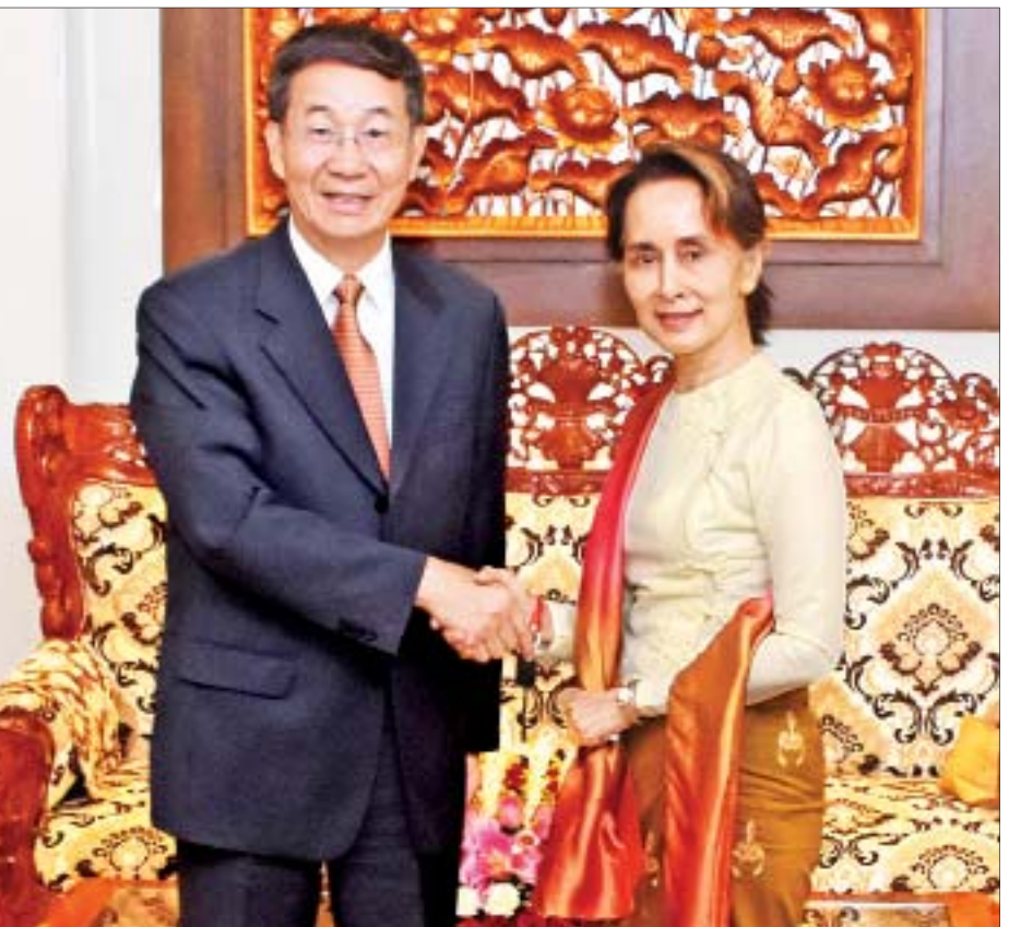
နိုင်ငံတော်၏အတိုင်ပင်ခံပုဂ္ဂိုလ် ဒေါ်အောင်ဆန်းစုကြည် တရုတ်ပြည်သူ့သမ္မတနိုင်ငံ နိုင်ငံခြားရေးဝန်ကြီးဌာန အာရှရေးရာ အထူးကိုယ်စားလှယ် မစ္စတာ ဇွန်းဂေါ်ရှန်းအား လက်ခံတွေ့ဆုံစဉ်။

နေပြည်တော် ဇွန် ၂၄ နိုင်ငံတော်၏အတိုင်ပင်ခံပုဂ္ဂိုလ်၊ နိုင်ငံခြားရေးဝန်ကြီးဌာန ပြည်ထောင်စုဝန်ကြီး ဒေါ်အောင်ဆန်းစုကြည်သည် တရုတ်ပြည်သူ့သမ္မတနိုင်ငံ နိုင်ငံခြားရေးဝန်ကြီးဌာန အာရှရေးရာ အထူးကိုယ်စားလှယ် မစ္စတာ ဇွန်းဂေါ်ရှန်း အား ယနေ့ညနေ ၄ နာရီတွင် နေပြည်တော်ရှိ နိုင်ငံခြား ရေးဝန်ကြီးဌာန၌ လက်ခံတွေ့ဆုံခဲ့သည်။ တွေ့ဆုံစဉ် မြန်မာနိုင်ငံ၏ ပြည်တွင်းငြိမ်းချမ်းရေးနှင့် အမျိုးသားပြန်လည်သင့်မြတ်ရေးလုပ်ငန်းစဉ်၊ ရခိုင် ပြည်နယ်အရေးကိစ္စတို့နှင့်ပတ်သက်၍ မြန်မာအစိုးရ၏ ကြိုးပမ်းဆောင်ရွက်နေမှုများတွင် တရုတ်နိုင်ငံမှ အပြု သဘော ဆက်လက်ကူညီဆောင်ရွက်ပေးသွားမည့် ကိစ္စရပ်များနှင့်စပ်လျဉ်း၍ ရင်းနှီးပွင့်လင်းစွာ ဆွေးနွေး အမြင်ချင်းဖလှယ်ခဲ့သည်။ သတင်းစဉ်