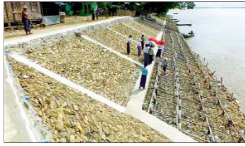
(၅) မှ ဒုတိယညွှန်ကြားရေးမှူး ဦးဆောင်ခိုင်းနှင့် တာဝန်ရှိသူများက ကွင်းဆင်းကြည့်ရှုစစ်ဆေးခဲ့ကြောင်း သိရသည်။ သက်နောင်ဦး (ငါးဦးကွန်)

မန္တလေးတိုင်းဒေသကြီး ငါးဦးကွန်မြို့နယ် ဆင်တပ်ကျေးရွာအုပ်စု ရဲပခိုင်းကျေးရွာ၌ တိုင်းဒေသကြီး ရေအရင်းအမြစ်နှင့် မြစ်ချောင်းများဖွံ့ဖြိုးတိုးတက်ရေးဦးစီးဌာန ဒေသ(၅)မှ တာဝန်ယူတည်ဆောက်လျက်ရှိသော ကွန်ကရစ်ပိုင်အခြေပြု ကျောက်စိတမံ ရာနှုန်းပြည့်ဆောက်လုပ်ပြီးစီးမှုကို ဇွန် ၂၁ရက် မွန်းလွဲပိုင်းက တာဝန်ရှိသူများကွင်းဆင်းကြည့်ရှုသည်။ ယင်းသို့ ကွင်းဆင်းကြည့်ရှုရာတွင် ၂၀၁၈-၂၀၁၉ ဘဏ္ဍာနှစ် မန္တလေးတိုင်းဒေသကြီး အစိုးရအဖွဲ့၏ ငွေလုံးငွေရင်းရန်ပုံငွေကျပ် ၈၄ ဒသမ ၆ သန်းဖြင့် ကွန်ကရစ်ပိုင်အခြေပြု ကျောက်စိတမံ အလျား ၃၇၅ ပေနှင့် ပေ ၄၀ ပြုပြင်ခြင်းလုပ်ငန်းများကို တိုင်းဒေသကြီး ရေအရင်းအမြစ်နှင့် မြစ်ချောင်းများ ဖွံ့ဖြိုးတိုးတက်ရေးဦးစီးဌာန ဒေသ