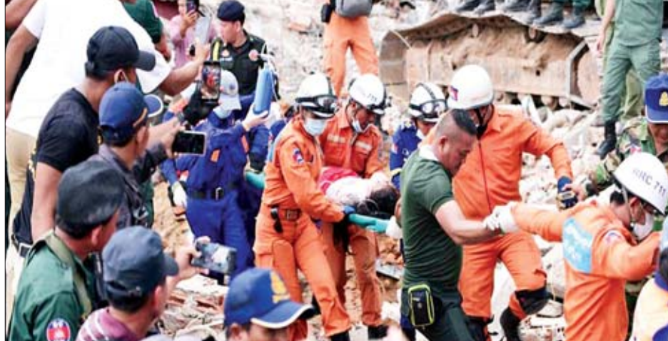
လှူဒါန်းမည်ဖြစ်ကြောင်း ကြေညာခဲ့သည်။ အဆောက်အအုံပြိုကျချိန်တွင် ဆောက်လုပ်ရေး လုပ်သား ၄၀ နှင့် ၅၀ ကြားမှာ အိပ်ပျော်နေသည်ဟု ယူဆရကြောင်း ပြည်နယ်အုပ်ချုပ်ရေးမှူး ယွန်မင်းက

ဖနောင့်ပင် ဇွန် ၂၃ ကမ္ဘောဒီးယားနိုင်ငံ အနောက်တောင်ပိုင်း ပရီဆီဟာ နောက်ခံပြည်နယ်ရှိ ဆောက်လုပ်ဆဲ ခုနစ်ထပ်အဆောက် အအုံတစ်လုံး ပြိုကျမှုတွင် သေဆုံးသူအရေအတွက်မှာ ၁၇ ဦးအထိ ရှိလာခဲ့ပြီဟု ကယ်ဆယ်ရေးအဖွဲ့၏ ယနေ့ ထုတ်ပြန်သည့် သေဆုံးသူစာရင်းအရ သိရသည်။ ၂၄ ဦး ဒဏ်ရာရရှိ အပျက်အစီးများအောက်တွင် လူ ၁၇ ဦးကို သေဆုံး လျက်တွေ့ရှိခဲ့ပြီး လူ ၂၄ ဦး ဒဏ်ရာရရှိခဲ့သည်။ ယမန်နေ့ နေ့င်းပိုင်းကတင်ခဲ့သည့် Facebook ပိုစ်တစ်ခုတွင် ကမ္ဘောဒီးယားဝန်ကြီးချုပ် ဆမ်ဒက်ဟွန်ဆင်က ကျန်ရစ်သူ မိသားစုများ၊ ဒဏ်ရာရရှိသူများထံ ဝမ်းနည်း စကားများ ပြောကြားခဲ့ပြီး အစိုးရက သေဆုံးသူများ၏ ကျန်ရစ်သူမိသားစုများကို အမေရိကန်ဒေါ်လာ ၁၀၀၀၀ စီနှင့် ဒဏ်ရာရရှိသူများကို အမေရိကန်ဒေါ်လာ ၁၂၅၀ စီ