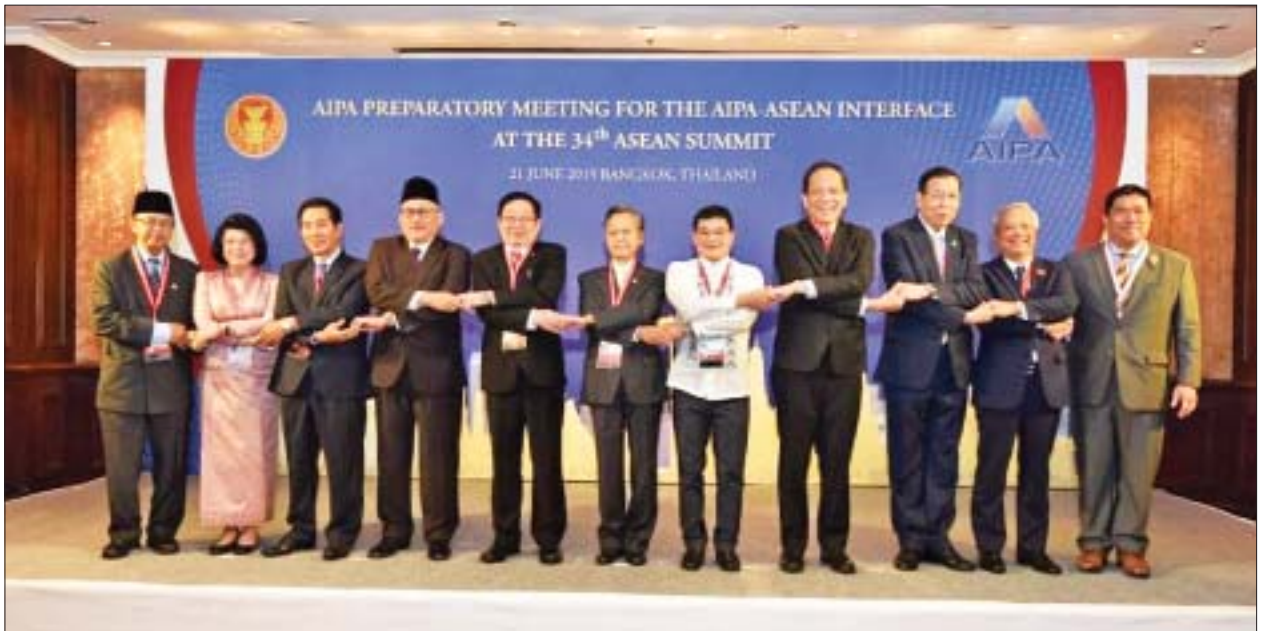
ပြည်ထောင်စုလွှတ်တော်နာယက ပြည်သူ့လွှတ်တော်ဥက္ကဋ္ဌ ဦးတီခွန်မြတ် အာဆီယံပါလီမန်များညီလာခံ ကိုယ်စားလှယ်များ မျက်နှာစုံညီတွေ့ဆုံပွဲ၏ အကြံပြုညှိနှိုင်းအစည်းအဝေးတွင် အဖွဲ့ဝင်နိုင်ငံများမှ ပါလီမန်ခေါင်းဆောင်များ၊ ကိုယ်စားလှယ်များနှင့်အတူ စုပေါင်းမှတ်တမ်းတင်ဓာတ်ပုံရိုက်စဉ်။

ထိုသို့တွေ့ဆုံရာတွင် နှစ်နိုင်ငံပြည်သူ့အချင်းချင်း၊ လွှတ်တော်အချင်းချင်း ဆက်ဆံရေးဆိုင်ရာတိုးတက်လာစေရေးအတွက် နှစ်နိုင်ငံလွှတ်တော်ခေါင်းဆောင်များအကြား အပြန်အလှန် ချစ်ကြည်ရေးခရီးစဉ်များ လာရောက်