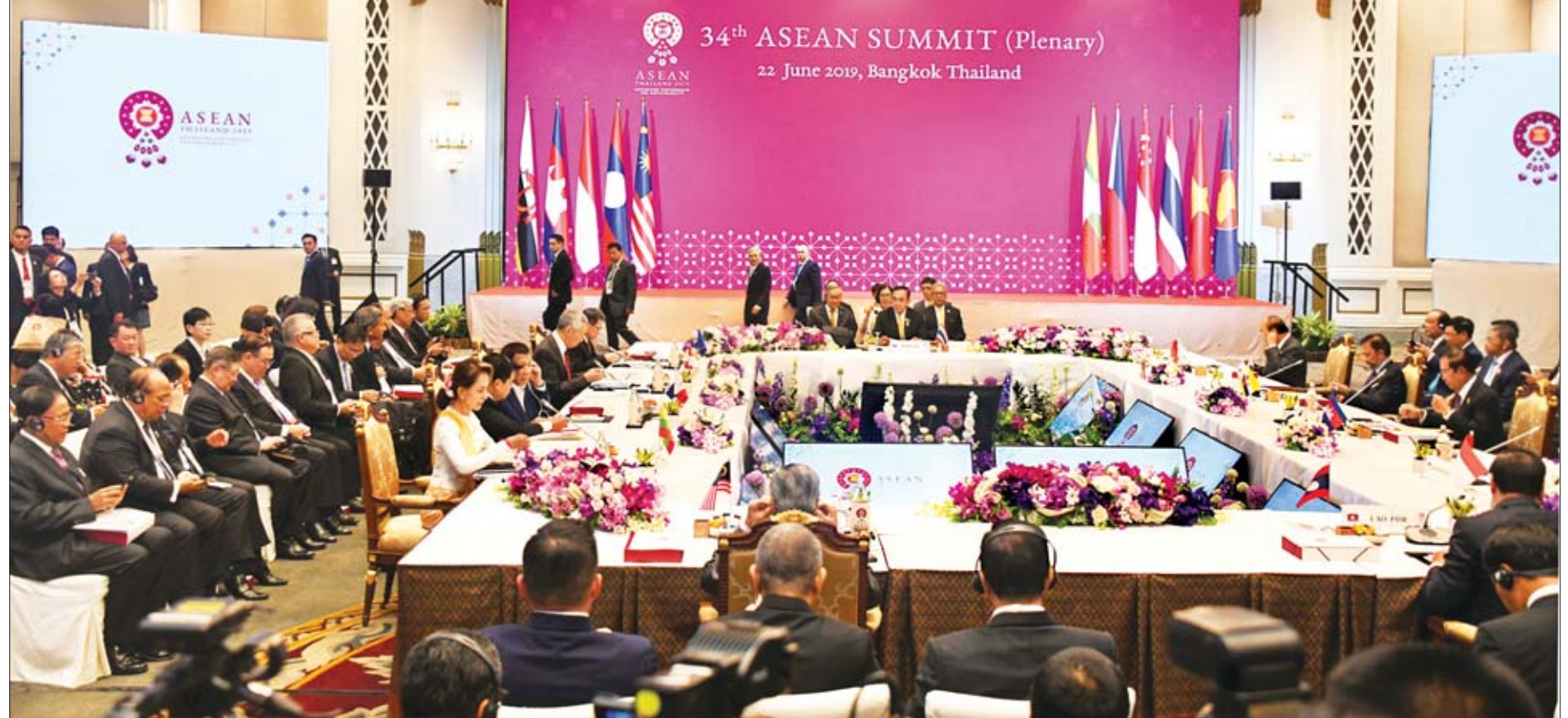
နိုင်ငံတော်၏အတိုင်ပင်ခံပုဂ္ဂိုလ် ဒေါ်အောင်ဆန်းစုကြည် (၃၄) ကြိမ်မြောက် အာဆီယံထိပ်သီး (မျက်နှာစုံညီ) အစည်းအဝေးတက်ရောက်စဉ်။

နိုင်ငံတော်၏အတိုင်ပင်ခံပုဂ္ဂိုလ် ဒေါ်အောင်ဆန်းစုကြည် ခေါင်းဆောင် သည့်မြန်မာကိုယ်စားလှယ်အဖွဲ့သည် ထိုင်းနိုင်ငံ၊ ဗန်ကောက်မြို့၌ ၂၀၁၉ ခုနှစ်၊ ဇွန်လ ၂၂ ရက်နေ့မှ ၂၃ ရက်နေ့အထိ ကျင်းပသည့် (၃၄)ကြိမ်မြောက် အာဆီယံထိပ်သီးအစည်းအဝေးသို့ တက်ရောက်ခဲ့ပြီးနောက် မြန်မာနိုင်ငံ သို့ ယနေ့တွင် အထူးလေယာဉ်ဖြင့် ပြန်လည်ရောက်ရှိသည်။