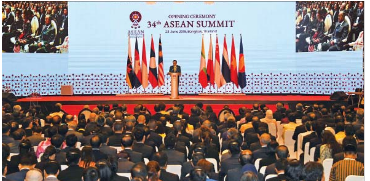
(၃၄)ကြိမ်မြောက် အာဆီယံထိပ်သီးအစည်းအဝေးဖွင့်ပွဲအခမ်းအနား ကျင်းပစဉ်။

အစည်းအဝေးသို့ နိုင်ငံတော်၏အတိုင်ပင်ခံပုဂ္ဂိုလ်နှင့်အတူ ပြည်ထောင်စု