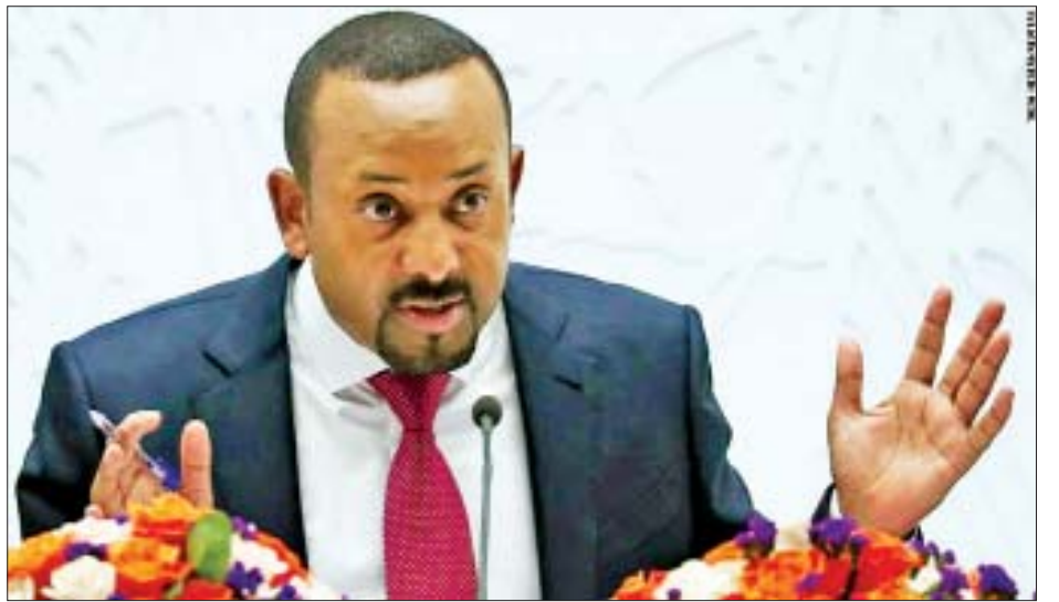
အိသီယိုးပီးယားဝန်ကြီးချုပ် အာဘီအာမက်