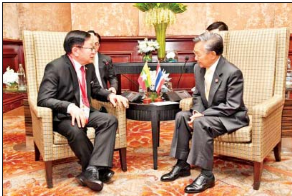
ပြည်ထောင်စုလွှတ်တော်နာယက ပြည်သူ့လွှတ်တော်ဥက္ကဋ္ဌ ဦးတီခွန်မြတ် ထိုင်းနိုင်ငံဥပဒေပြု လွှတ်တော်ဥက္ကဋ္ဌ မစ္စတာ ချန်လီပိုင်အား တွေ့ဆုံစဉ်။

မြန်မာကိုယ်စားလှယ်အဖွဲ့သည် ဇွန် ၂၃ ရက်နံနက်ပိုင်းတွင် ထိုင်းနိုင်ငံ ဗန်ကောက်မြို့ Athenee Tower ရှိ Crystal Hall ၌ ကျင်းပသည့် (၃၄) ကြိမ်မြောက် အာဆီယံထိပ်သီးအစည်းအဝေး ဖွင့်ပွဲအခမ်းအနား (Opening