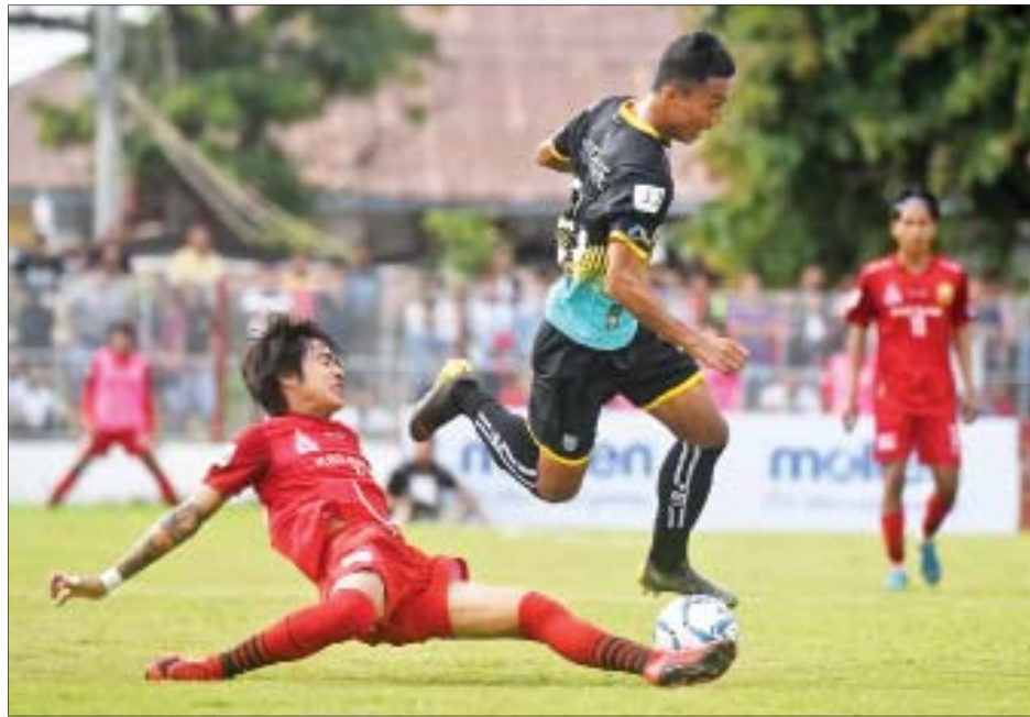
ရှမ်းယူနိုက်တက်နှင့် ရန်ကုန်အသင်း ယှဉ်ပြိုင်နေစဉ်။