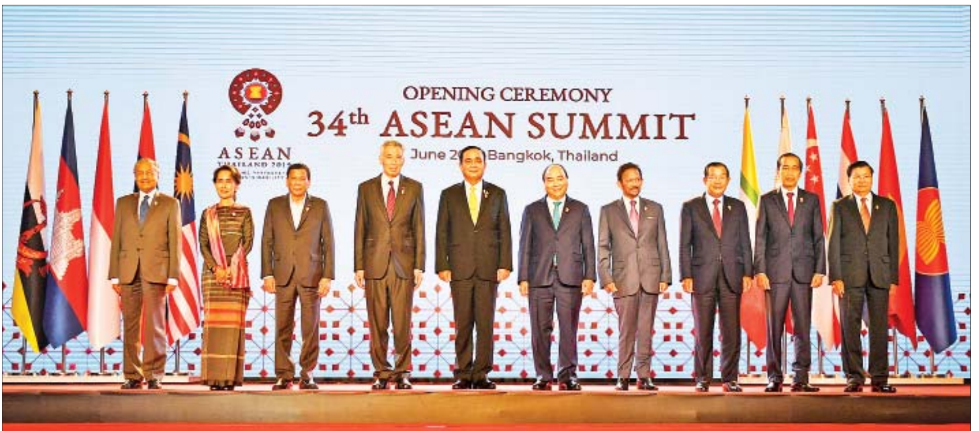
နိုင်ငံတော်၏အတိုင်ပင်ခံပုဂ္ဂိုလ် ဒေါ်အောင်ဆန်းစုကြည် (၃၄) ကြိမ်မြောက် အာဆီယံထိပ်သီးအစည်းအဝေးဖွင့်ပွဲအခမ်းအနားတွင် အာဆီယံနိုင်ငံများမှ နိုင်ငံခေါင်းဆောင်များ၊ အစိုးရအဖွဲ့အကြီးအကဲများနှင့်အတူ စုပေါင်း မှတ်တမ်းတင်ဓာတ်ပုံရိုက်စဉ်။