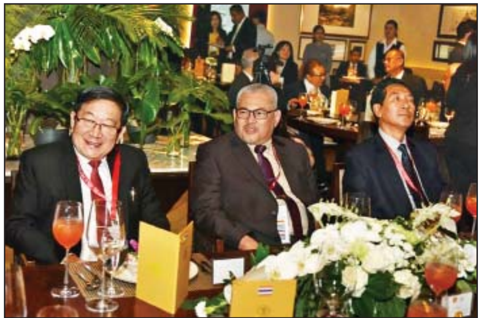
ပြည်ထောင်စုလွှတ်တော်နာယက ပြည်သူ့လွှတ်တော်ဥက္ကဋ္ဌ ဦးတီခွန်မြတ် ထိုင်းနိုင်ငံ ဥပဒေပြုလွှတ်တော်ဥက္ကဋ္ဌနှင့် အာဆီယံပါလီမန်များညီလာခံဥက္ကဋ္ဌက တည်ခင်းသော ဂုဏ်ပြုညစာစားပွဲသို့ တက်ရောက်စဉ်။

လည်ပတ်ရေး၊ လွှတ်တော်အချင်းချင်းဆက်ဆံရေးကိစ္စများ ပိုမိုမြှင့်တင်ဆောင်ရွက်သွားရေးတို့ကို ဆွေးနွေးခဲ့ကြသည်။