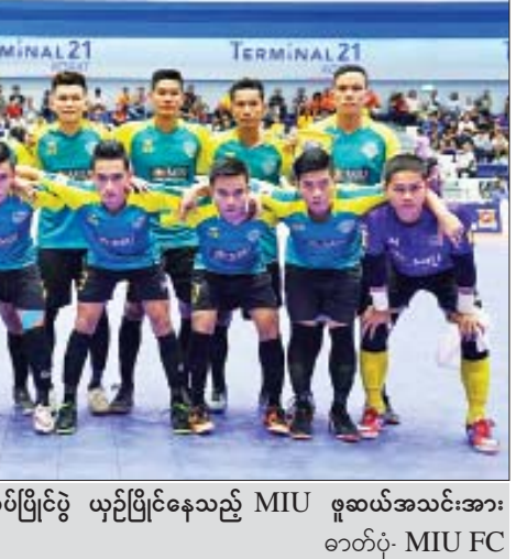
၂၀၁၉ အာဆီယံ ဖူဆယ်ကလပ်ပြိုင်ပွဲ ယှဉ်ပြိုင်နေသည့် MIU ဖူဆယ်အသင်းအား ဓာတ်ပုံ- MIU FC တွေ့ရစဉ်။

ခဲ့သောကြောင့် အုပ်စုဒုတိယနေရာသာ ရခဲ့ခြင်းဖြစ်သည်။ MIU အသင်းသည် နှစ်ပွဲစလုံး ဂိုးပြတ်အနိုင်ရခဲ့ပြီး ဆီမီးဖိုင်နယ်တွင် တွေ့ဆုံနေသည့် ဝီယက်နမ်ကလပ်အသင်းမှာ ယင်းနှစ်သင်းထက် ကစားပုံပိုကောင်းသောကြောင့် ပိုမိုအားထုတ်ရဖွယ်ရှိနေသည်။ MIU အသင်းနှင့် ဆန်နာတက်အသင်းသည် ယင်းပြိုင်ပွဲတွင် ပထမဆုံးတွေ့ဆုံခြင်းဖြစ်ပြီး ဝီယက်နမ်ကလပ်အသင်းက အနိုင်ရရှိခဲ့ပြီး ဝီယက်နမ်ကလပ်အသင်းသည် အာဆီယံဖူဆယ်ကလပ်ပြိုင်ပွဲတွင် ၂၀၁၈ ခုနှစ်က ဝင်ရောက်ယှဉ်ပြိုင်ခဲ့သော်လည်း အုပ်စုအဆင့်မှ ထွက်ခဲ့ရသည်။ နှိုင်းထက်ဇော်