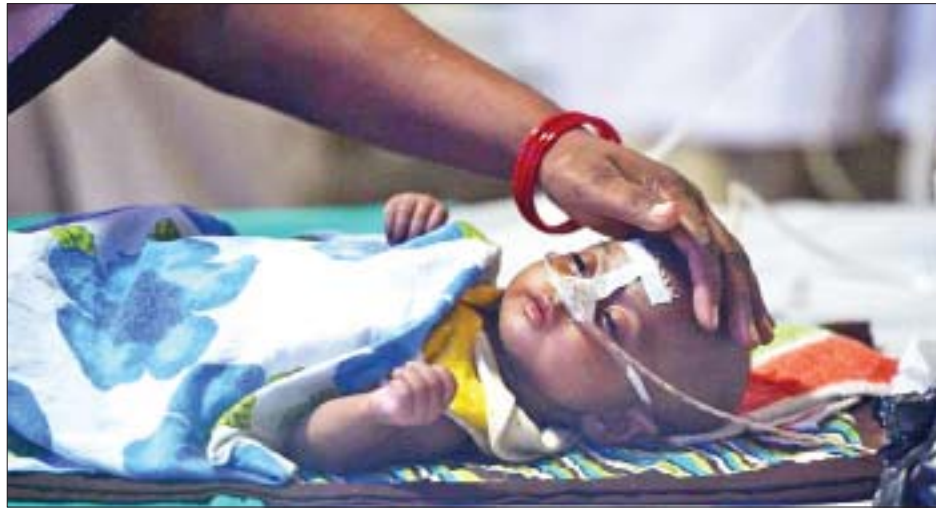
ရင်းကို စုံစမ်းစစ်ဆေးရန်အတွက် ရောဂါဖြစ်ပွားလျက်ရှိ များ၏ နောက်ခံစီးပွားရေးနှင့် ပတ်သက်၍ အချက်အလက် ရှာဖွေရာမှ သွားရောက်ပြီး ဒေသခံများနှင့် တွေ့ဆုံ စုဆောင်းမှုများကိုလည်း လုပ်ဆောင်သွားမည်ဖြစ်သည်။ ထို့အပြင် အိန္ဒိယအဆင့်မြင့် အထူးကုဆရာဝန်အသင်း ကာ လူမှုရေးဆိုင်ရာစစ်ဆေးမှုများ၊ ဒေသခံမိသားစုဝင်

နယူးဒေလီ ဇွန် ၂၁ အိန္ဒိယနိုင်ငံ အရှေ့ဘက် ဘီဟာပြည်နယ်တွင် ဦးနှောက် အမြှေးရောင်ရောဂါကြောင့် ကလေး ၁၆၁ ဦး သေဆုံးခဲ့ကြောင်း နိုင်ငံပိုင်ရုပ်သံလွှင့်ဌာနက ဇွန် ၂၁ ရက်တွင် ကြေညာသည်။