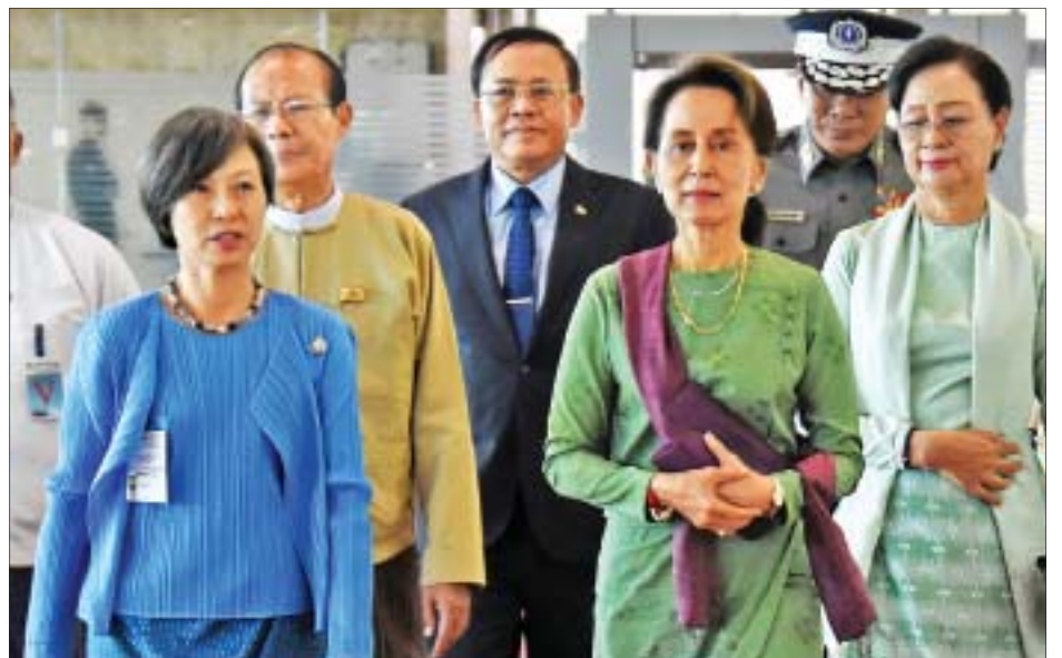
နိုင်ငံတော်၏အတိုင်ပင်ခံပုဂ္ဂိုလ် ဒေါ်အောင်ဆန်းစုကြည်အား နေပြည်တော်ကောင်စီဥက္ကဋ္ဌ ဒေါက်တာမျိုးအောင်နှင့်ဇနီး၊ မြန်မာနိုင်ငံဆိုင်ရာ ထိုင်းနိုင်ငံသံအမတ်ကြီး Mrs. Suphatra Srimaitreephithak နှင့် တာဝန်ရှိသူများက နေပြည်တော် အပြည်ပြည်ဆိုင်ရာလေဆိပ်၌ ပို့ဆောင်နှုတ်ခတ်ကြစဉ်။

နေပြည်တော် ဇွန် ၂၁ နိုင်ငံတော်၏အတိုင်ပင်ခံပုဂ္ဂိုလ် ဒေါ်အောင်ဆန်းစုကြည်သည် ထိုင်းနိုင်ငံဝန်ကြီးချုပ် ဝိုလ်ချုပ်ကြီး ပရာယုဒ်ချန်အိုချာ (ငြိမ်း)၏ ဖိတ်ကြားချက်အရ (၃၄)ကြိမ်မြောက် အာဆီယံထိပ်သီးအစည်းအဝေးသို့ တက်ရောက်ရန် ယနေ့ မွန်းလွဲပိုင်းတွင် နေပြည်တော်မှ အထူးလေယာဉ်ဖြင့် ထိုင်းနိုင်ငံ ဗန်ကောက်မြို့သို့ ထွက်ခွာသွားသည်။ နိုင်ငံတော်၏အတိုင်ပင်ခံပုဂ္ဂိုလ်နှင့် အဖွဲ့အား နေပြည်တော်ကောင်စီဥက္ကဋ္ဌ ဒေါက်တာမျိုးအောင်နှင့်ဇနီး၊ မြန်မာနိုင်ငံရဲတပ်ဖွဲ့ စာမျက်နှာ ၃ ကော်လံ ၁ သို့ ၀