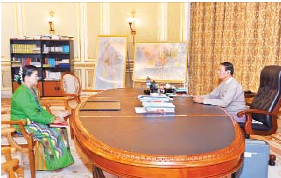
နိုင်ငံတော်သမ္မတ ဦးဝင်းမြင့် ချက်သမ္မတနိုင်ငံဆိုင်ရာ မြန်မာသံအမတ်ကြီးအဖြစ် တာဝန်ထမ်းဆောင်မည့် ဒေါ်ကေသီစိုးအား လမ်းညွှန်မှာကြားစဉ်။

နေပြည်တော် ဇွန် ၂၁ ပြည်ထောင်စုသမ္မတမြန်မာနိုင်ငံတော် နိုင်ငံတော်သမ္မတ ဦးဝင်းမြင့်သည် ချက်သမ္မတနိုင်ငံဆိုင်ရာ မြန်မာသံအမတ်ကြီးအဖြစ် တာဝန်ထမ်းဆောင်မည့် ဒေါ်ကေသီစိုးအား ယနေ့ နံနက် ၁၀ နာရီတွင် နိုင်ငံတော်သမ္မတအိမ်တော် သမ္မတရုံးခန်း၌ တွေ့ဆုံပြီး လိုအပ်သည့်မူဝါဒများကို လမ်းညွှန်မှာကြားသည်။