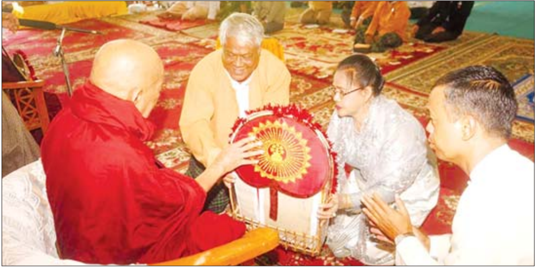
ဆွမ်းဆန်စိမ်းလောင်းလှူပွဲ စစ်ကိုင်းတိုင်းဒေသကြီး ဝန်ကြီးချုပ်ဒေါက်တာမြင့်နိုင် တက်ရောက်

ထို့နောက် လုပ်ငန်းညှိနှိုင်းအစည်းအဝေးသို့ တက်ရောက်လာသော တက္ကသိုလ်ကျောင်းအုပ်ဆရာကြီး များ၊ ဆရာမကြီးများ၊ ဌာနဆိုင်ရာတာဝန်ရှိသူများ၊ သတင်းမီဒီယာများ၊ လူမှုရေးအသင်းအဖွဲ့များ၊ ရပ်ကွက်အုပ်ချုပ်ရေးမှူးများက အကြံပြုဆွေးနွေးကြပြီး သက်ဆိုင်ရာတာဝန်ရှိသူများက ပြန်လည် သုံးသပ်ဆွေးနွေးခဲ့ကြကြောင်း သိရသည်။ တိုင်းဒေသကြီး (ပြန်/ဆက်)