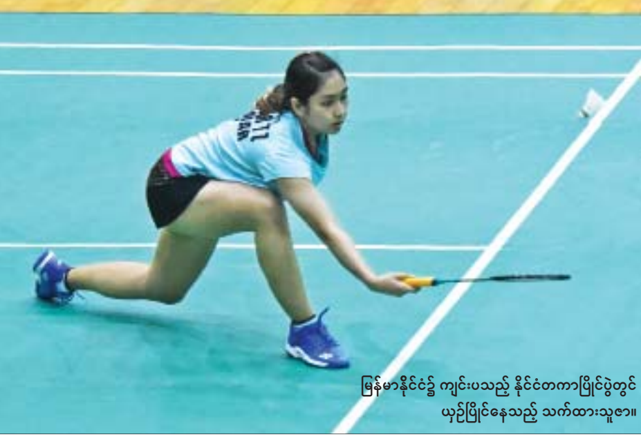
မြန်မာနိုင်ငံ၌ ကျင်းပမည့် နိုင်ငံတကာပြိုင်ပွဲတွင် ယှဉ်ပြိုင်နေမည့် သက်ထားသူဇာ။

ရန်ကုန် ဇွန် ၂၁ ယခုနှစ်အနည်းငယ်အတွင်း နိုင်ငံတကာပြိုင်ပွဲများတွင် အောင်မြင်မှုများရလာသည့် မြန်မာကြက်တောင်အားကစားမယ် သက်ထားသူဇာသည် ၂၀၂၀ အိုင်ဗစ် ပြိုင်ပွဲဝင်ခွင့်ရရန် မျှော်လင့်ချက်အတွက် ဘီနင်နှင့် အိုင်ဗရီကိုစ်နိုင်ငံ၌ ကျင်းပမည့် International Series ကြက်တောင်ရိုက်ပြိုင်ပွဲတွင် ဝင်ရောက်ယှဉ်ပြိုင်မည်ဖြစ်သည်။