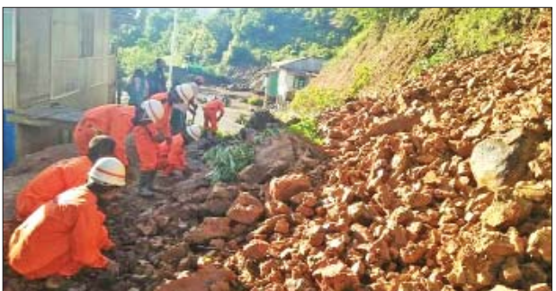
လိုင် ကံကောင်းတယ်” ဟု မြေပြိုကျသည့် လမ်းဘေးနားနေအိမ်မှ အိမ်ရှင်တစ်ဦးက ပြောသည်။ အဆိုပါ လမ်းပေါ်မြေပြိုကျမှုအား မြို့နယ်မီးသတ်တပ်ဖွဲ့၊ ဌာနဆိုင်ရာများနှင့် ပြည်သူများပူးပေါင်း၍ ပြိုကျသည့် မြေစာများကို ဝိုင်းဝန်းဖယ်ရှားခဲ့ကြကြောင်း သိရသည်။ မြန်မာ(ပြန်/ဆက်)

လိုင်လင်းပိ ဇွန် ၂၁ ချင်းပြည်နယ် မင်းတပ်ခရိုင် လိုင်လင်းပိမြို့၌ မိုးအဆက်မပြတ် ရွာသွန်းမှုကြောင့် ဇွန် ၂၁ ရက်တွင် လိုင်လင်းပိ အထက ကျောင်းသွားသည့် အဓိကလမ်းမပေါ်သို့ မြေပြိုကျမှုဖြစ်ပွားသဖြင့် ကျောင်းသားကျောင်းသူများ သွားလာရေး ခက်ခဲအခြေအနေဖြစ်လျက်ရှိသည်။