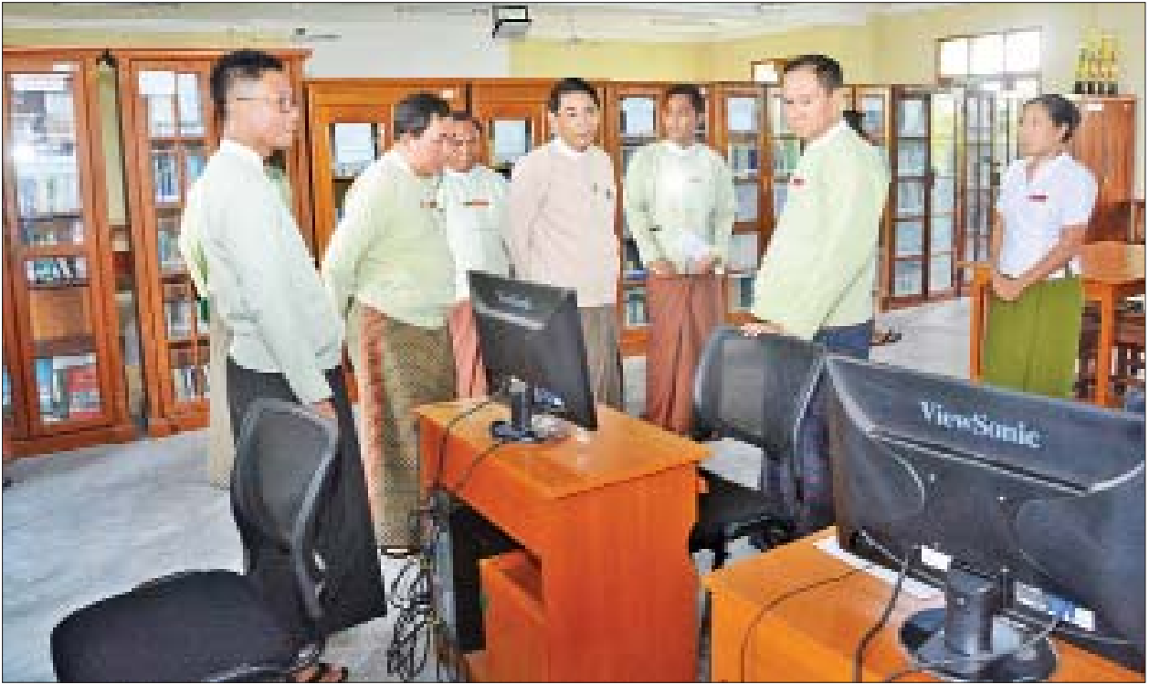
ပြည်ထောင်စုဝန်ကြီး ဦးမင်းသူ အုပ်ချုပ်ရေးပညာဖွံ့ဖြိုးမှု သင်တန်းကျောင်းရှိ စာကြည့်တိုက်အား ကြည့်ရှုစစ်ဆေးစဉ်။

သင်တန်းဆင်းသွားကြပြီဖြစ်သည့် ဝန်ထမ်း ၁၈ ဦးကို မေးမြန်းချက်အရ ဖက်ဒရယ်တည်ဆောက်ရေးနှင့် ပတ်သက်၍ ၁၈ ဦးအနက် ၃ ဦးသာ သေသေချာချာနားလည်ပြီး ကျန်သူများမှာသေသေချာချာ နားမလည်သည်ကို တွေ့ရှိရ၍ အဆိုပါလေ့လာချက်အပါအဝင် လေ့လာချက်များမှနေ၍ မိမိတို့ သင်တန်းကျောင်းအနေဖြင့် နိုင်ငံတော်က ဦးတည်လျှောက်လှမ်းနေသည့် နိုင်ငံရေးစနစ်ကို အထောက်အကူပြုနိုင်ရေးအတွက် ကြိုးစားထမ်းဆောင်ကြရန် လိုအပ်နေသေးသည်ကို ပြောကြားလိုကြောင်း၊ ကမ္ဘာကြီးပြောင်းလဲနေ