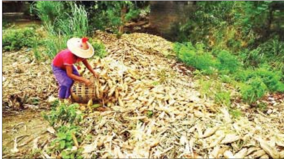
ကုန်သည်တစ်ဦးက ပြောသည်။ ပြောင်းစိုက်ပျိုးသည့် တောင်သူများအနေဖြင့် ဝယ်ရေးပြုပြင်ခြင်း၊ ရေသွင်းခြင်း၊ စိုက်ပျိုးခြင်း၊ မျိုးစရိတ်၊ စက်သုံးဆီဖိုး၊ ရိတ်သိမ်းခများကို တွက်ချက်ကြည့်ပါက

တောင်ငူ ဇွန် ၂၁ တောင်ငူခရိုင်အတွင်းရှိ ထန်းတပင်မြို့နယ်နှင့် အုတ်တွင်းမြို့နယ်များတွင် စစ်တောင်းမြစ်ရေတင်စနစ်ဖြင့် စိုက်ပျိုးထားသည့် ပြောင်းစိုက်ခင်းများမှ ပြောင်းဖူးများ ပျက်စီးမှုများပြားသည့်အတွက် ရောင်းသူရော ဝယ်ယူသူပါ တွက်ခြေမကိုက်ဖြစ်ကာအရှုံးပေါ်လျက်ရှိကြောင်း အဆိုပါ အဝယ်ခိုင်များမှ ယနေ့စုံစမ်းသိရှိရသည်။