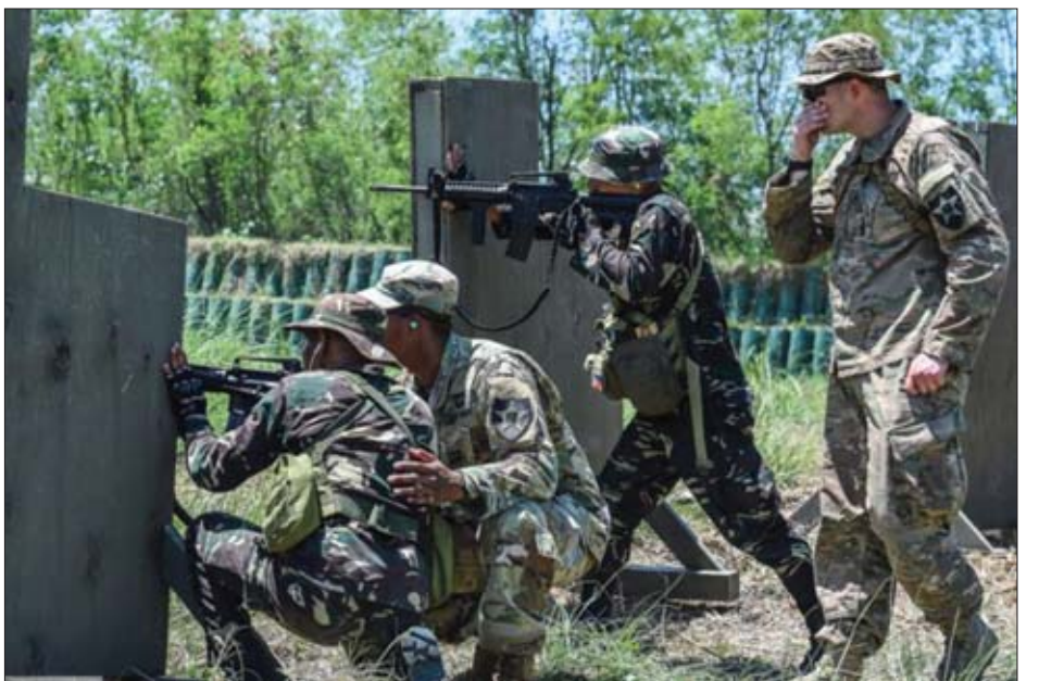
Balikatan 2017 စစ်ရေးလေ့ကျင့်မှု ပြုလုပ်စဉ်က ဖိလစ်ပိုင်တပ်ဖွဲ့ဝင်များကို အမေရိကန်တပ်ဖွဲ့ဝင်များနှင့်အတူ တွေ့ရစဉ်။

ဖြစ်ရာ နိုင်ငံတကာနှင့် ပူးပေါင်းဆောင်ရွက်မှု လိုအပ် ကြောင်း၊ ယခုအခါ ပြည်တွင်းဖြစ် အကြမ်းဖက်သမားများ သည် နိုင်ငံတကာ အကြမ်းဖက်အုပ်စုများနှင့် ချိတ်ဆက် ထားပြီးဖြစ်ရာ မိမိတို့အနေဖြင့် တန်ပြန်အကြမ်းဖက် နှိမ်နင်းရေးနယ်ပယ်တွင် နိုင်ငံတကာနှင့် ပူးပေါင်း ဆောင်ရွက်ရန် လိုအပ်ကြောင်း ဇာဂလာက ဆက်လက် ပြောကြားသည်။ ဖိလစ်ပိုင်အထူးတပ်ဖွဲ့သည် အစွဲရေး ကျွမ်းကျင်သူများထံမှ လေ့လာသင်ယူထားသည့် ကျွမ်းကျင်မှုများနှင့် အသိအမြင်ဗဟုသုတများကို ၎င်းတို့၏ လုပ်ဖော်ကိုင်ဖက်များသို့ မျှဝေကြမည်ဖြစ်ကြောင်း ၎င်းက ဆက်လက်ပြောကြားသည်။