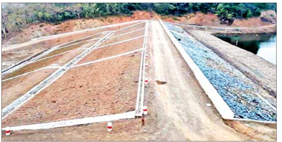
မြေပုံမြို့နယ် ကမ်းထောင့်ကြီးမြို့၊ တမန်းဒူးဆည် တာပေါင်မြင့်တင်ခြင်းလုပ်ငန်း ဆောင်ရွက်ထားမှုကို တွေ့ရစဉ်။

ရခိုင်ပြည်နယ်သည် တစ်နှစ်လျှင် မိုးရေချိန်လက်မ ၂၀၀ ခန့် ရွာသွန်းသော်လည်း ရာသီဥတုပြောင်းလဲမှုဒဏ် ကြောင့် နွေရာသီရောက်တိုင်း မြို့နယ်များတွင် ရေရှားပါး မှုပြဿနာဖြစ်ပေါ်လျက်ရှိရာ ဒေသခံများအနေဖြင့်