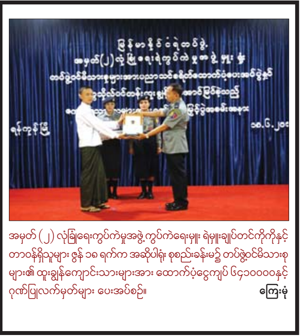
အမှတ် (၂) လုံခြုံရေးကွက်ကုမ္ပဏီအဖွဲ့ကွပ်ကဲရေးမှူး၊ ရဲမှူးချုပ်တင်ကိုကိုနှင့် တာဝန်ရှိသူများ ဇွန် ၁၈ ရက်က အဆိုပါရုံး စုစည်းခန်းမ၌ တပ်ဖွဲ့ဝင်မိသားစုများ၏ ထူးချွန်ကျောင်းသားများအား ထောက်ပံ့ငွေကျပ် ၆၄၀၀၀၀နှင့် ဂုဏ်ပြုလက်မှတ်များ ပေးအပ်စဉ်။