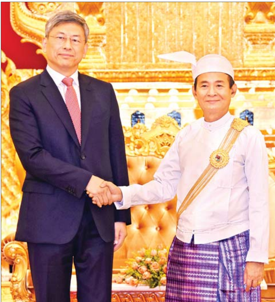
နိုင်ငံတော်သမ္မတ ဦးဝင်းမြင့် တရုတ်ပြည်သူ့သမ္မတနိုင်ငံ သံအမတ်ကြီး မစ္စတာ ချန်းဟိုင်အား ရင်းရင်းနှီးနှီး နှုတ်ဆက်စဉ်။