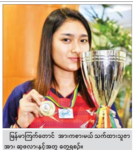
မြန်မာကြက်တောင် အားကစားမယ်သက်ထားသူ့အား ဆုဖလားနှင့်အတူ တွေ့ရစဉ်။