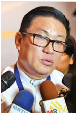
ဦးကိုကို(ဥက္ကဋ္ဌ) မြန်မာနိုင်ငံရုပ်မြင်သံကြားနှင့် အသံထုတ်လွှင့်သူများအသင်း

ဒီဆွေးနွေးပွဲဟာ ထိန်းချုပ်ခြင်း၊ ပိတ်ပင်ခြင်းအတွက် လုပ်တဲ့ဆွေးနွေးပွဲ မဟုတ်ပါဘူး။ ဆိုလိုချင်တာက ကျွန်တော်တို့နိုင်ငံမှာ လက်ရှိဖြစ်ပေါ်နေတဲ့ အနေအထားအရ တရားဥပဒေနဲ့အညီ ဆောင်ရွက်နေတဲ့ လုပ်ငန်းတွေ ရှိသလို တရားဥပဒေပြင်ပမှာ ဆောင်ရွက်နေကြတဲ့ လုပ်ငန်းတွေလည်း ရှိပါတယ်။ တရားဥပဒေနဲ့အညီ ဆောင်ရွက်နေကြတဲ့ သူတွေကို အကာအကွယ် ပေးရမှာဖြစ်တဲ့ အတွက် တရားဥပဒေပြင်ပမှာရှိနေတဲ့ သူတွေကိုလည်း ဘယ်လိုနည်းနဲ့ တရားဥပဒေ ဘောင်အတွင်းကို ရောက်ရှိအောင် ဆောင်ရွက်ကြမလဲ ဆိုတဲ့ နည်းလမ်းတွေကို ရှာသွားမှာ ဖြစ်ပါတယ်။