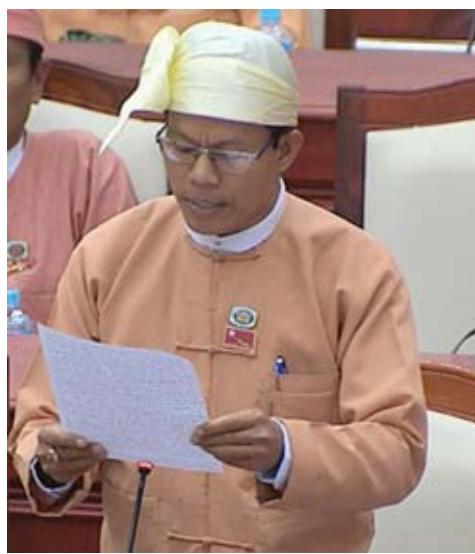
ပြည်သူ့လွှတ်တော်ကိုယ်စားလှယ် ဦးကျော်အောင်လွင်

လူ့ကိုယ်ခန္ဓာတွင် ဆဲလ်များ၊ ကလာပ်စည်းများသည် ပုံမှန်နေ့စဉ်ပွားများနေပြီး ခန္ဓာကိုယ်ရှိ ဆဲလ်များကို ပုံမှန်ဖြစ်အောင် ထိန်းချုပ်ပေးထားသည်မှာ ကိုယ်ခံအားစနစ်ဖြစ်သည်။ ဆဲလ်တစ်ခုသည် ပုံမှန်မှ ကင်ဆာဆဲလ်ဖြစ်သွားပါက ခန္ဓာကိုယ်၏ ကိုယ်ခံအားစနစ်ဖြစ်သော ဆဲလ်များက တိုက်ထုတ်လိုက်သည်။ ထို့ကြောင့် ကိုယ်ခံအားကောင်းသည် သူများတွင် ကင်ဆာဆဲလ်များ သေဆုံးသွားသဖြင့် ကင်ဆာရောဂါမဖြစ်ပွားခြင်းဖြစ်သည်။ ကိုယ်ခံအားကျဆင်းသွားပါက ခန္ဓာကိုယ်၏ ခုခံအားစနစ်ချို့တဲ့သွားပြီး ကင်ဆာဆဲလ်များ တဖြည်းဖြည်းပွားလာကာ နောက်ဆုံးတွင် ထိန်းမနိုင်၊ သိမ်းမရ အကျိတ်၊ အခဲများဖြစ်လာကာ ကင်ဆာရောဂါဟူ၍ ဖြစ်လာသည်။ ကင်ဆာရောဂါကို ဖြစ်ပွားနာဟုလည်း ခေါ်ကြသည်။