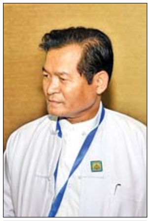
ဦးစိုးနိုင် (ဒုတိယညွှန်ကြားရေးမှူးချုပ်) ဆက်သွယ်ရေးညွှန်ကြားမှုဦးစီးဌာန

တရားမဝင် စလောင်းတွေကိစ္စက အခုမှဖြစ်တဲ့ ကိစ္စမဟုတ်ပါဘူး။ နက်နဲပါတယ်။ အတိတ်က အကြောင်း အရာတွေ အများကြီးပါပါတယ်။ ပြီးတော့ ဒီဟာမှာ ဆိုင်ရာဆိုင်ရာ အကျိုးစီးပွားတွေ ရှိပါတယ်။