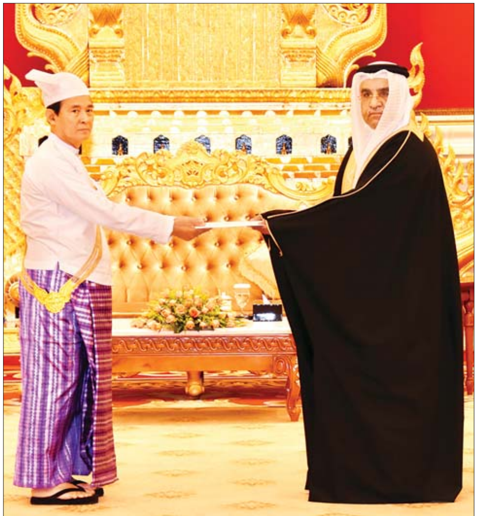
နိုင်ငံတော်သမ္မတ ဦးဝင်းမြင့်ထံ ဘာရိန်းနိုင်ငံ သံအမတ်ကြီး မစ္စတာ အာမတ် အဘတ်ဒူလာ အာမတ်အယ်လ်ဟာ မာစီ အယ်လ်ဟာ ဂျယ်ရီကုတ် သံအမတ်ခန့်အပ်လွှာ ပေးအပ်စဉ်။