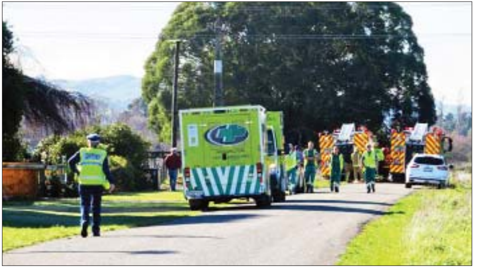
လေယာဉ်ငယ်နှစ်စင်း တိုက်မိဖြစ်ပွားသည့်နေရာသို့ ရောက်ရှိလာသည့် ကယ်ဆယ်ရေးယာဉ်များကို တွေ့ရစဉ်။