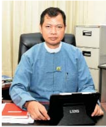
ဦးမျိုးဆွေ (ညွှန်ကြားရေးမှူးချုပ်) ဆက်သွယ်ရေးညွှန်ကြားမှုဦးစီးဌာန