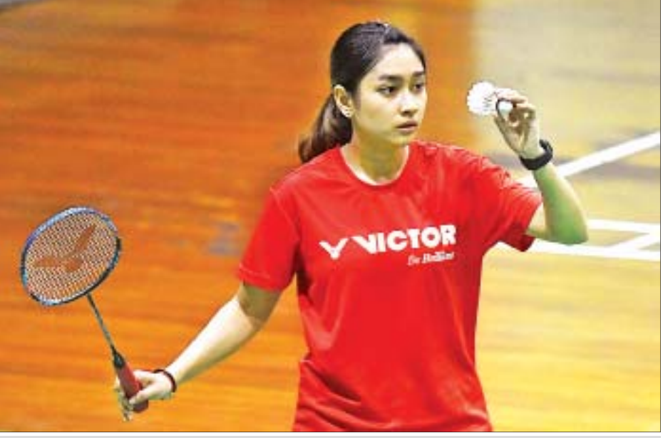
International Series ကြက်တောင်ရိုက်ပြိုင်ပွဲတွင် ဝိုလ်စွဲခဲ့သည့် သက်ထားသူဇာအား မြန်မာနိုင်ငံတွင် လေ့ကျင့်စဉ်က တွေ့ရစဉ်။

နည်းပညာတက္ကသိုလ် ကျောင်းသားများ တီထွင်ထားသည့် စက်ရုပ် Clash of Robots ပြိုင်ပွဲကျင်းပ စာမျက်နှာ >> ၁၈