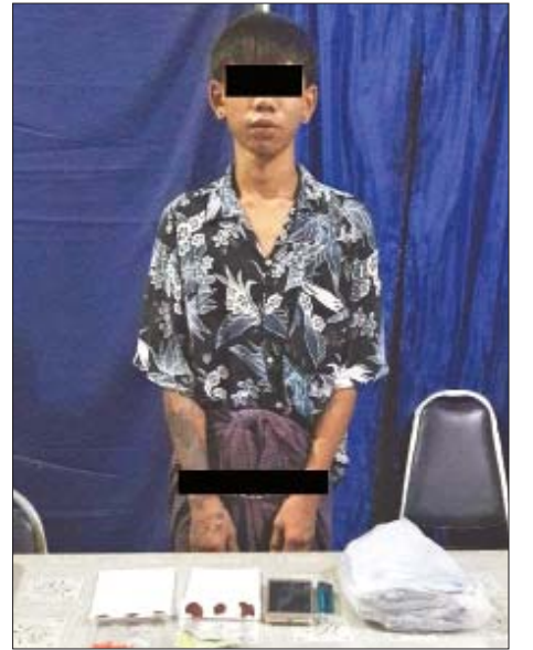
ထိုင်းနိုင်ငံသား အာကလပ်ဖုန်း(ခ)ချေးဂိုအား သိမ်းဆည်းရမိသည့် စိတ်ကြွေးသွပ်ဆေးပြားများနှင့် အတူ တွေ့ရစဉ်။