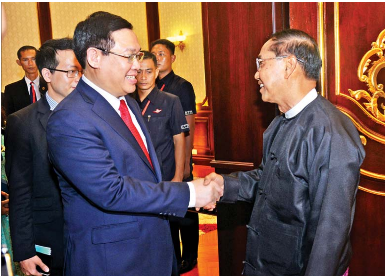
ဒုတိယသမ္မတ ဦးမြင့်ဆွေ ဝိယက်နမ်ဆိုရှယ်လစ်သမ္မတနိုင်ငံ ဒုတိယဝန်ကြီးချုပ်နှင့် ပေါလစ်ဗျူရိုကော်မတီအဖွဲ့ဝင် Mr. Vuong Dinh Hue အား ရင်းရင်းနှီးနှီး နှုတ်ဆက်စဉ်။