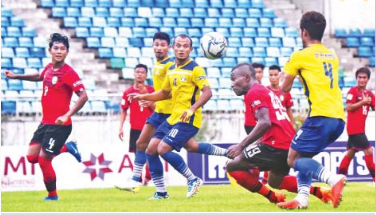
မကွေးအသင်းနှင့် ဒဂုံအသင်း ယှဉ်ပြိုင်နေစဉ်။

နောက်နှစ်ရက်အတွက် ခန့်မှန်းချက် ပဲခူးတိုင်းဒေသကြီး၊ ရန်ကုန်တိုင်းဒေသကြီးနှင့် ရောဝတီတိုင်းဒေသကြီးတို့တွင် မိုးပိုလာနိုင်သည်။ မိုး/လေ