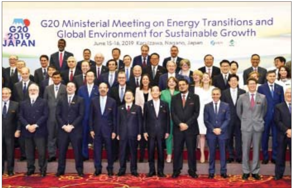
ဖြင့်လည်း သဘာဝပတ်ဝန်းကျင်ဆိုင်ရာ ပြဿနာများကို ကြိုးပမ်းသွားမည်ဖြစ်ကြောင်း ပြောကြားခဲ့သည်။ ဖြေရှင်းရာတွင် ကမ္ဘာ့နိုင်ငံများနှင့်ပူးပေါင်းကာ အစွမ်းကုန် အင်န်အိတ်ချ်ကေ

ဂျပန်ပတ်ဝန်းကျင်ထိန်းသိမ်းရေးဝန်ကြီး ယိုရှိယာကီ ဟာရာဒါက ယခုကျင်းပသော ဂျီ-၂၀ အစည်းအဝေးမှ ရလဒ်ကောင်းများထွက်ပေါ်ခဲ့ကြောင်းနှင့် ဂျပန်နိုင်ငံအနေ