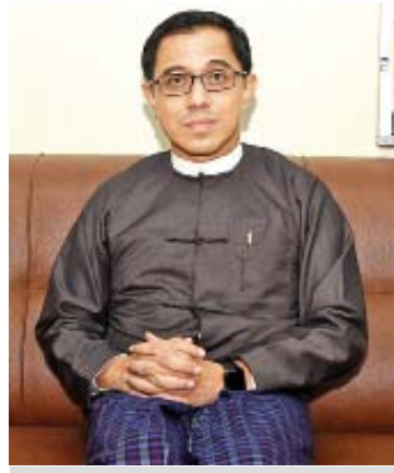
ဒေါက်တာထွန်းသူရသက် (ဒုတိယဥက္ကဋ္ဌ) မြန်မာနိုင်ငံကွန်ပျူတာအသင်းချုပ်

သတင်းအချက်အလက်တွေကို စနစ်တကျသိမ်းဆည်းနိုင်ခြင်း၊ လွယ်ကူတိကျစွာ ပြန်လည်ရှာဖွေနိုင်ခြင်း၊ မြန်မာစာစနစ်အတိုင်း အလွယ်တကူ အကွရာစဉ်နိုင်ခြင်း၊ ဘာသာပြန်ဆိုမှုမှာလည်း အခြားဘာသာတစ်ခုက မြန်မာဘာသာသို့ အပြန်အလှန် ပြန်ဆိုမှုကို ပိုမို အဆင်ပြေချောမွေ့စေခြင်း၊ မြန်မာဘာသာစကားကို ကွန်ပျူတာစနစ်မှာ အပြည့်အဝအသုံးပြုလာနိုင်ခြင်း၊ တိုင်းရင်းသားဘာသာစကားတွေကိုလည်း ယူနီကုဒ်စနစ်မှာ အလွယ်တကူ အသုံးပြုနိုင်ခြင်း စတဲ့ အကျိုးကျေးဇူးတွေကြောင့် ယူနီကုဒ်စနစ်သုံး မြန်မာစာစနစ်ကို စံချိန်စံညွှန်းအဖြစ် ပြောင်းလဲအသုံးပြုခြင်းဖြစ်ပါတယ်။