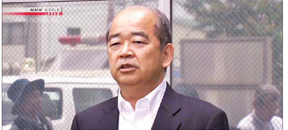
ဂျပန်နိုင်ငံ အိုဆာကာမြို့အုပ်ချုပ်ရေးမှူး ဟိယိုဖူမီ ရိုရှိမူရာ

ကြောင်း သိရသည်။ ရိုရှိမူရာက ပြစ်မှုကျူးလွန်သူတွင် သေနတ်ပါရှိကြောင်း မီဒီယာသို့ပြောကြားခဲ့သည်။ အကယ်၍ ပြစ်မှုကျူးလွန်သူသည် ဇွန် ၁၇ရက် နံနက် ၆ နာရီအထိ လာရောက်ဖမ်းဆီးခြင်းမခံသေးပါက အနီးဝန်းကျင်ရှိ စာသင်ကျောင်း ၅၁ ကျောင်းအား ယာယီပိတ်သိမ်းထားမည်ဖြစ်သည်။ ဒေသခံပြည်သူများအား မိမိတို့နေထိုင်ရာနေအိမ်အတွင်း၌နေကြပြီး တံခါးများခိုင်းမြဲစွာ ပိတ်ထားရန် တိုက်တွန်းပြောကြားခဲ့သည်။ ထို့ပြင် သင်္ဘောကင်းဖြစ်သူများတွေ့ရှိပါက ရဲစခန်းသို့ ဖုန်းဆက်အကြောင်းကြားပေးရန် ဒေသခံများအား တိုက်တွန်းပြောကြားခဲ့သည်။ အင်န်အိတ်ချ်ကေ