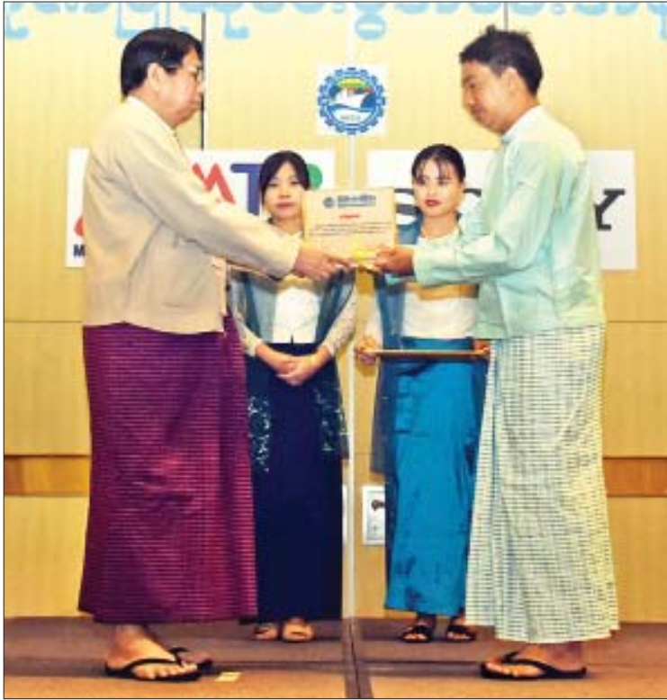
ပြည်ထောင်စုဝန်ကြီး ဒေါက်တာဖေမြင့် ပျော်ရွှင်ဆင်နွှဲ တိုင်းရင်းသားရိုးရာပွဲ ရောင်စုံဓာတ်ပုံပြိုင်ပွဲတွင် ပထမဆုရရှိသော ဝဏ္ဏ(မန်းတက္ကသိုလ်) အား ဆုပေးအပ်ချီးမြှင့်စဉ်။

ပျော်ရွှင်ဆင်နွှဲ တိုင်းရင်းသားရိုးရာပွဲ ဓာတ်ပုံပြိုင်ပွဲကို တိုင်းရင်းသားယဉ်ကျေးမှု