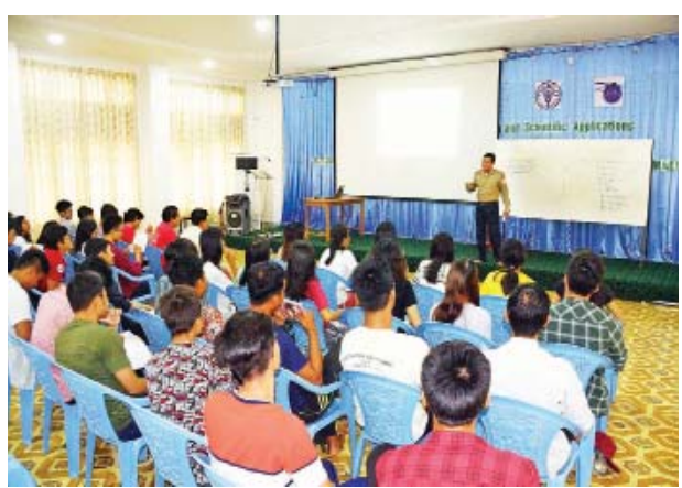
လူနာသယ်ဆောင်နည်း စသည့် သင်ခန်းစာများကို ခရိုင်ကြက်ခြေနီတပ်ဖွဲ့မှူးနှင့် နည်းပြများက စာတွေ့၊ လက်တွေ့သင်ကြားပို့ချပေးသွားမည်ဖြစ်ကြောင်း သိရသည်။ ချမ်းသာ (မိတ္ထီလာ)

အဆိုပါ ကြက်ခြေနီ အခြေခံရေးဦးပြုစုခြင်းသင်တန်းတွင် မြန်မာနိုင်ငံ လေကြောင်းနှင့် အာကာသပညာတက္ကသိုလ်မှ သင်တန်းသား သင်တန်းသူ စုစုပေါင်း ၄၂ ဦး တက်ရောက်ပြီး သင်တန်းတွင် ကြက်ခြေနီအကြောင်း သိကောင်းစရာ၊ ခန္ဓာဗေဒနှင့် အပူလောင်ခြင်းအကြောင်း၊ ဇီဝကမ္မဗေဒ၊ လက်နက်မဲ့စစ်ရေးပြ