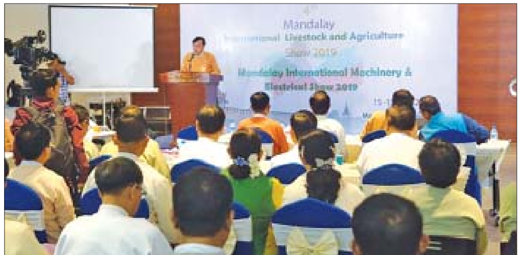
မန္တလေးမြို့၌ စတုတ္ထအကြိမ် နိုင်ငံတကာ မွေးမြူရေးနှင့် စိုက်ပျိုးရေးပြပွဲ၊ တတိယအကြိမ် စက်ပစ္စည်းနှင့် လျှပ်စစ်ပစ္စည်းပြပွဲကျင်းပစဉ်။