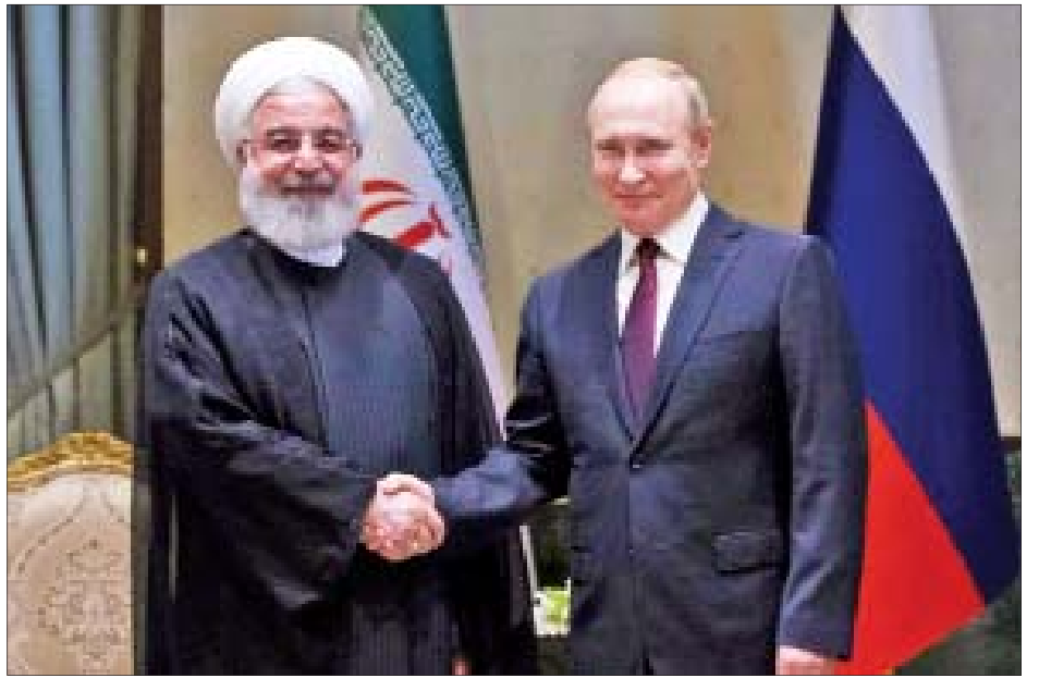
ဆန္ဒရှိကြောင်း သမ္မတ ရှီကျင့်ဖျင်က ဆိုသည်။ အီရန်သမ္မတ ရိုဟာနီက တရုတ်နိုင်ငံနှင့် ဆက်ဆံမှု များကို မြှင့်တင်ပြီး ကဏ္ဍစုံပူးပေါင်းဆောင်ရွက်ရေးအတွက် လုပ်ဆောင်သွားမည်ဖြစ်ပါကြောင်း ပြောကြားခဲ့သည်။

သမ္မတ ရှီကျင့်ဖျင်က ၂၀၁၅ ခုနှစ် အီရန် နျူကလီးယား သဘောတူညီစာချုပ်ကို ဆက်လက် ထိန်းသိမ်းထားမည်ဖြစ်ပြီး အီရန်နိုင်ငံအား ထောက်ခံ လျက်ရှိပါကြောင်း ပြောကြားခဲ့သည်။ ထို့ပြင် အီရန်နိုင်ငံနှင့် ပူးပေါင်းဆောင်ရွက်မှုများ တိုးမြှင့်လုပ်ဆောင်သွားရန်