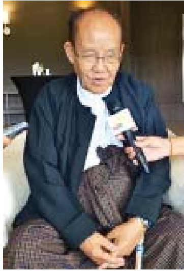
ဦးအုန်းကြိုင်

ဦးအုန်းကြိုင်(ဟံသာဝတီ-ဦးအုန်းကြိုင်) မြန်မာနိုင်ငံ သတင်းမီဒီယာကောင်စီဥက္ကဋ္ဌ ဒီမိုကရေစီနိုင်ငံတွေမှာ အုပ်ချုပ်ရေး စနစ်ကို ဖော်ဆောင်တဲ့နေရာမှာ အဓိက မဏ္ဍိုင်ကြီး သုံးရပ်ရှိတယ်။ အဲဒီမဏ္ဍိုင်ကြီး သုံးရပ်ဟာ တိုင်းပြည်တစ်ခုကို အုပ်ချုပ်တဲ့ နေရာမှာ နည်းစနစ်ကျ၊ မကျ၊ မှန်ကန်မှုရှိ၊ မရှိ၊ ဟုတ်၊ မဟုတ်ဆိုတာကို မျက်စိဒေါက်ထောက် ကြည့် လေ့လာမှတ်တမ်းတင်ပြီး ပြည်သူကို ပြန်အစီရင်ခံပေးရတာက သတင်းမီဒီယာ သမားတွေပဲ ဖြစ်ပါတယ်။