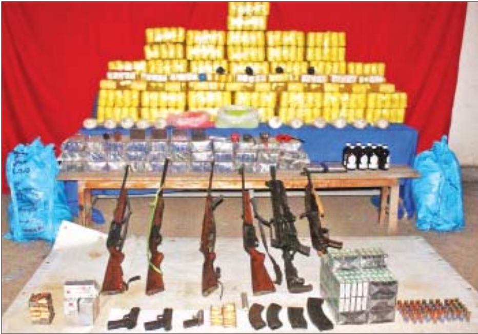
တာချီလိတ်မြို့နယ် ပါခါးကျေးရွာအနီး ဆာလာအိတ် ၂၁ အိတ်အတွင်းမှ သိမ်းဆည်းရမိသည့် မူးယစ်ဆေးဝါးများနှင့် လက်နက်ခဲယမ်းများကို တွေ့ရစဉ်။