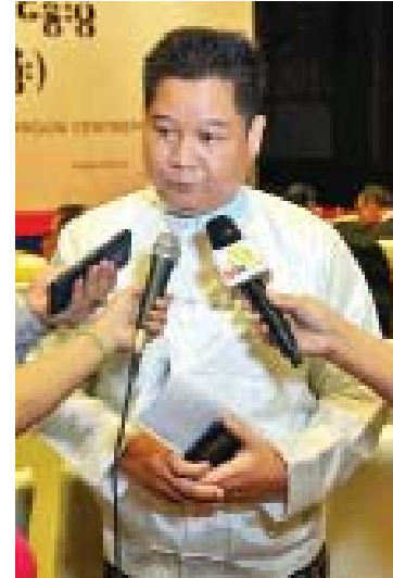
ဦးကျော်စွာမင်း

စည်းကမ်းတကျ သတင်းမီဒီယာသမားတွေဟာ ပြည်သူ့ ကိုယ်စား ပြည်သူတွေက ရွေးချယ်တင်မြှောက် လိုက်တဲ့ ပြည်သူ့ကိုယ်စားလှယ်တွေ ဘာတွေ လုပ်နေပါတယ်။ အစိုးရက တိုင်းပြည်အကျိုး အတွက် ဘာတွေဖန်တီးနေပါတယ်။ ဘာတွေ ဖော်ဆောင်နေပါတယ်။ ဒီဟာကို တင်ပြ အစီရင်ခံတဲ့နေရာမှာ စည်းကမ်းတကျဖြစ်ဖို့ ထိန်းသိမ်းပြီးတော့သွားတာ စတုတ္ထမဏ္ဍိုင်ပဲ ဖြစ်ပါတယ်။