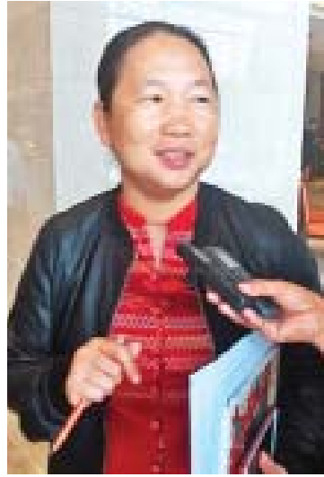
နော်ပန်းသဉ္ဇာမျိုး