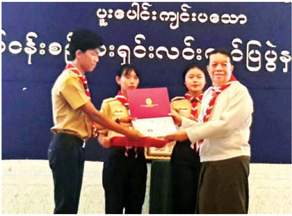
ငြိမ်းချမ်းရေးကော်မရှင်ဥက္ကဋ္ဌ၊ မြန်မာနိုင်ငံကင်းထောက်အဖွဲ့နာယက ဒေါက်တာတင်မျိုးဝင်းက လူမှုအကျိုးပြု ပရဟိတလုပ်ငန်း စွမ်းဆောင်မှုထူးချွန်ဆုရ ကင်းထောက်လူငယ်တစ်ဦးအား ဂုဏ်ပြုဆုချီးမြှင့်စဉ်။

အခမ်းအနားတွင် ငြိမ်းချမ်းရေးကော်မရှင်ဥက္ကဋ္ဌ၊ မြန်မာနိုင်ငံကင်းထောက်အဖွဲ့နာယက ဒေါက်တာ တင်မျိုးဝင်းက မြန်မာနိုင်ငံကင်းထောက်အဖွဲ့နှင့် အာရှ-ပစိဖိတ်ဒေသဆိုင်ရာ ကင်းထောက်အဖွဲ့ချုပ်တို့ ပူးပေါင်းပြီး နိုင်ငံတွင်း ငြိမ်းချမ်းရေးသံတမန်ညှိနှိုင်းရေးမှူးများ သင်တန်းနှင့် မြန်မာနိုင်ငံကိုယ်စားပြု လူငယ်ကိုယ်စား လှယ်များ၊ ကမ္ဘာ့ကင်းထောက်အဖွဲ့ချုပ်နှင့် အာရှ-ပစိဖိတ် ဒေသဆိုင်ရာ နိုင်ငံ ၁၃ နိုင်ငံမှ ကင်းထောက်လူငယ် ကိုယ်စားလှယ်များ စုပေါင်း၍ "Dialogue for Peace Facilitators' Training" နိုင်ငံတကာအဆင့်မီ သင်တန်းတစ်ခုကို မြန်မာနိုင်ငံတွင် ဖွင့်လှစ်ခဲ့ရာ နိုင်ငံတကာလူငယ်များက မြန်မာနိုင်ငံ၏ ငြိမ်းချမ်းရေး အတွက် ကြိုးပမ်းအားထုတ်မှုကို ပကတိတွေ့မြင်ခံစားခွင့် ရပြီး အပြန်အလှန် ချစ်ကြည်မှု၊ နားလည်မှု၊ ယုံကြည်မှုများ တည်ဆောက်နိုင်ခဲ့ခြင်းနှင့် နိုင်ငံကိုယ်စားပြု မြန်မာ ကင်းထောက်လုပ်ငန်းများ စွမ်းဆောင်မှုကို ဂုဏ်ပြုပါ ကြောင်း၊ မြန်မာနိုင်ငံ ငြိမ်းချမ်းရေး၏ အဓိက အရင်းအမြစ် ဖြစ်သည့် နိုင်ငံစီးပွားဖွံ့ဖြိုးတိုးတက်မှုကို လက်တွေ့ကျကျ ကူညီဆောင်ရွက်နေသည့် စီးပွားရေး စွမ်းဆောင်ရည်ကြီး