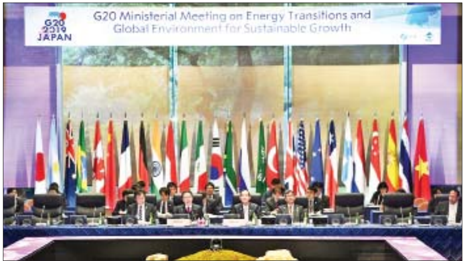
ဂျီ-၂၀ အဖွဲ့တွင် ပါဝင်သောနိုင်ငံများမှာ အာဂျင်တီးနား၊ ဩစတြေးလျ၊ ဘရာဇီး၊ ဗြိတိန်၊ ကနေဒါ၊ တရုတ်၊ ပြင်သစ်၊ ဂျာမနီ၊ အိန္ဒိယ၊ အင်ဒိုနီးရှား၊ အီတလီ၊ ဂျပန်၊ မက္ကဆီကို၊ ရုရှား၊ ဆော်ဒီအာရေဗျ၊ တောင်အာဖရိက၊

ကမ္ဘာပေါ်တွင် ပလတ်စတစ်စွန့်ပစ်ပစ္စည်း တန်ချိန် သန်း ၃၀၀ ခန့် စွန့်ပစ်ထွက်ပေါ်လျက်ရှိပြီး ယင်းတို့အနက် တန်ချိန် သန်း ၈၀ ခန့်သည် သမုဒ္ဒရာထဲတွင် စုပုံလျက်ရှိ ကြောင်း ကုလသမဂ္ဂပတ်ဝန်းကျင်အစီအစဉ်မှ ထုတ်ပြန်ချက်အရ သိရသည်။ ပလတ်စတစ်စွန့်ပစ်ပစ္စည်း ပြဿနာသည် တစ်ကမ္ဘာလုံးနှင့်ဆိုင်သောပြဿနာဖြစ်ရာ အများပြည်သူနှင့် ပုဂ္ဂလိကကဏ္ဍများမှ ကိုင်တွယ်ဖြေရှင်းရန် လိုအပ်ကြောင်း ဂျပန်စက်မှုဝန်ကြီး ဟာရိုရှိဂိုဝယ်ဆေကို က ပြောကြားသည်။