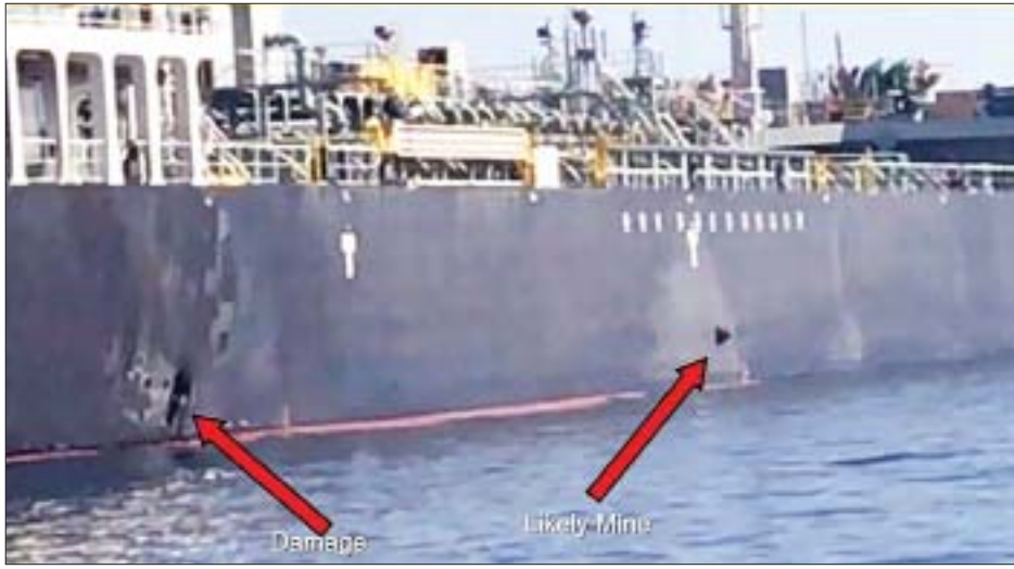
ဦးတည်မောင်းနှင်လျက်ရှိသည်ဟု ၎င်းက ဆက်လက်ပြောကြားခဲ့သည်။ အီရန်က သင်္ဘောကိုယ်ထည်အား ပဲ့ထိန်းနိုင်သော မိုင်းဖုံးများအသုံးပြုကာ ကျူးလွန်ခဲ့သည်ဟု အမေရိကန်က စွပ်စွဲထားသည်။ သို့သော် အီရန်အစိုးရက အဆိုပါ တိုက်ခိုက်မှုတွင် ပါဝင်ပတ်သက်ခြင်းမရှိပါကြောင်း ငြင်းဆန်ခဲ့သည်။ အမေရိကန်အနေဖြင့် တိုက်ခိုက်မာသေချာသော အထောက်အထားများ ပြသနိုင်ခြင်းမရှိဘဲ စွပ်စွဲမှုများ ပြုလုပ်လျက်ရှိကြောင်းနှင့် ယင်းသို့ပြုမူပြောဆိုခြင်းသည်

ရေမျက်နှာပြင်ပေါ်တွင် ထောင်ထားသော ရေမြှုပ်မိုင်းများနှင့် ထိမိခြင်းမဟုတ်ကြောင်း ဥက္ကဋ္ဌယူတာကာ ကာတာဒါက ပြောကြားခဲ့သည်။ တိုက်ခိုက်ခံရသည့် သင်္ဘောနှစ်စင်းပေါ် လိုက်ပါလာသူများအား ကယ်ဆယ်နိုင်ခဲ့သည်။ ၎င်းတို့အနက် တစ်ဦးထိခိုက်ဒဏ်ရာရရှိခဲ့သည်။ ယင်းတိုက်ခိုက်ခံရသော ဂျပန်ပိုင်ရေနံတင်သင်္ဘောသည် အာရပ်စော်ဘွားများနိုင်ငံသို့ ယခုအချိန်တွင်