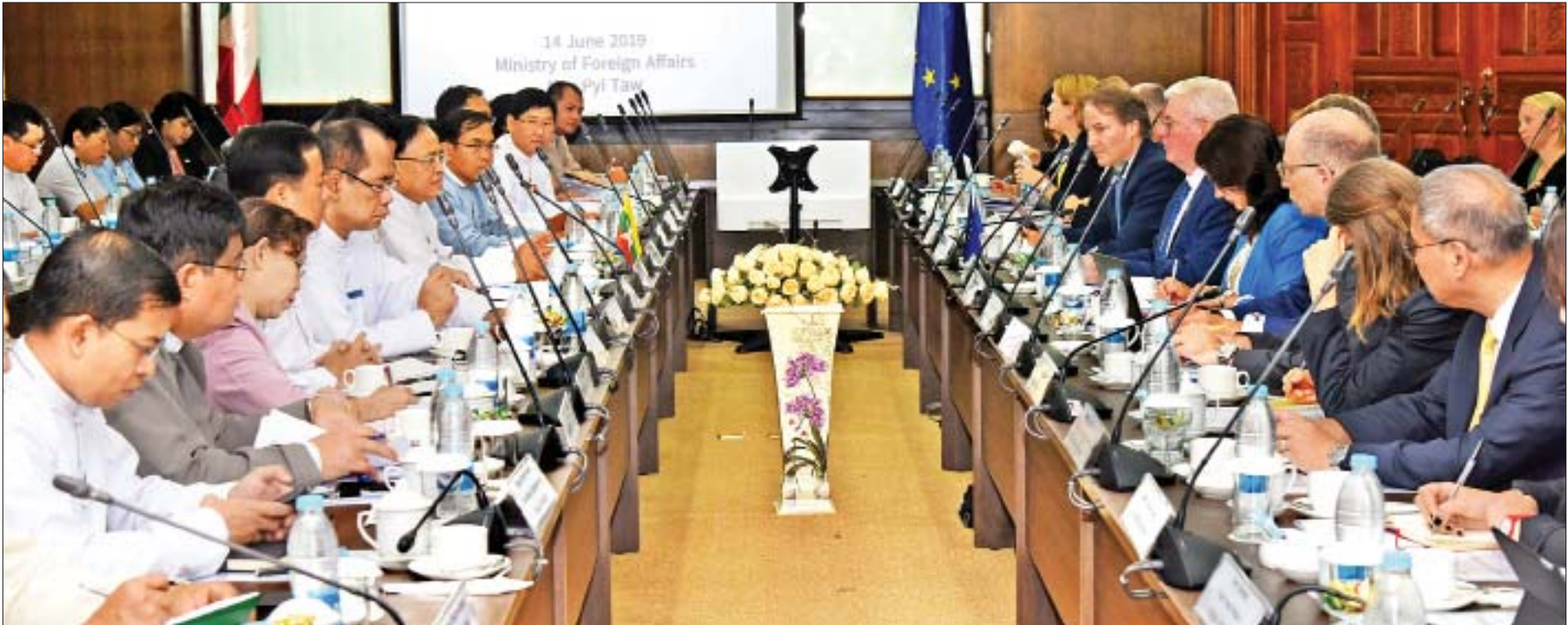
ပဉ္စမအကြိမ်မြောက် မြန်မာ-အီးယူလူ့အခွင့်အရေးဆွေးနွေးပွဲ ကျင်းပစဉ်။

နေပြည်တော် ဇွန် ၁၄ ပဉ္စမအကြိမ်မြောက် မြန်မာ-အီးယူလူ့အခွင့်အရေးဆွေးနွေးပွဲကို ယနေ့နံနက်ပိုင်းတွင် နေပြည်တော်ရှိ နိုင်ငံခြားရေးဝန်ကြီးဌာန၌ ကျင်းပသည်။ ဆွေးနွေးပွဲသို့ အပြည်ပြည်ဆိုင်ရာပူးပေါင်းဆောင်ရွက်ရေးဝန်ကြီးဌာန ပြည်ထောင်စုဝန်ကြီး ဦးကျော်တင်နှင့် ယခင် အိုင်ယာလန်နိုင်ငံ ဒုတိယဝန်ကြီးချုပ်နှင့် နိုင်ငံခြားရေးဝန်ကြီးအဖြစ် ဆောင်ရွက်ခဲ့သူ ဥရောပသမဂ္ဂ၏ လူ့အခွင့်အရေးဆိုင်ရာ အထူးကိုယ်စားလှယ် Mr. Eamon Gilmore တို့က ပူးတွဲသဘာပတိများအဖြစ် ဆောင်ရွက်ခဲ့ကြသည်။ စာမျက်နှာ ၃ ကော်လံ ၁ သို့