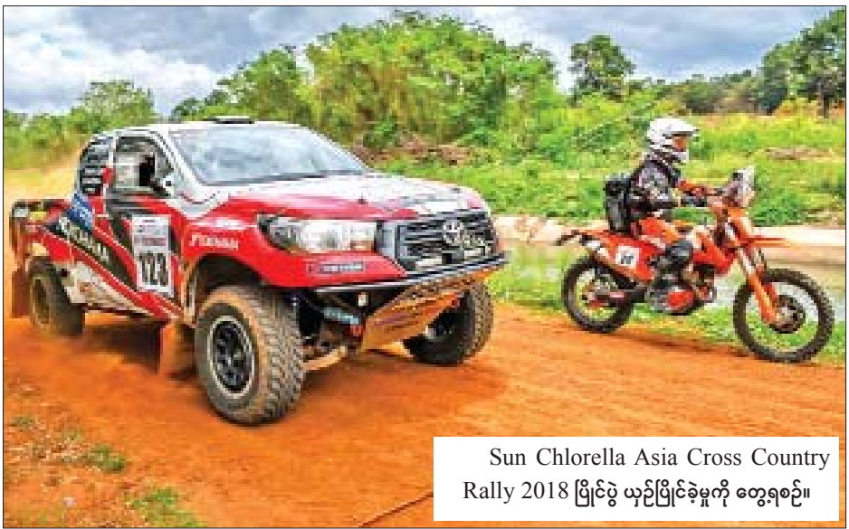
Sun Chlorella Asia Cross Country Rally 2018 ပြိုင်ပွဲ ယှဉ်ပြိုင်ခဲ့မှုကို တွေ့ရစဉ်။