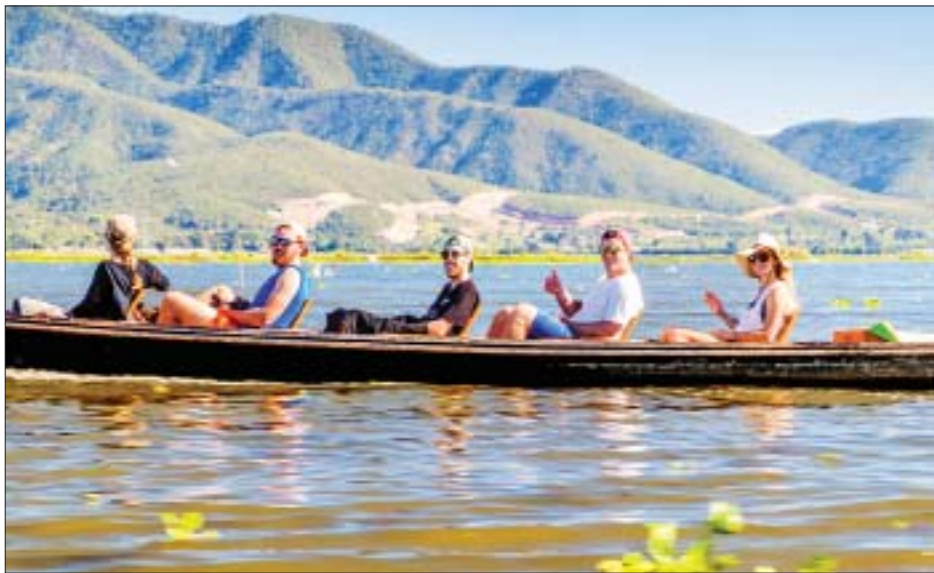
အင်းလေးဒေသသို့ လာရောက်လည်ပတ်ကြသည့် ကမ္ဘာလှည့်ခရီးသွားများကို တွေ့ရစဉ်။