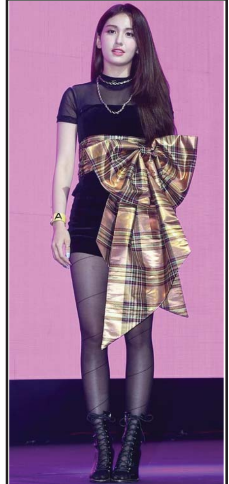
တောင်ကိုရီးယားအမျိုးသမီးတေးဂီတအဖွဲ့တစ်ဖွဲ့ ဖြစ်သည့် “I.O.I” ၏ အဖွဲ့ဝင်တစ်ဦးဖြစ်သူ ဝျန်ဆိုးမီကို ပြီးခဲ့သည့် ကြာသပတေးနေ့က ဆိုးလ်တွင်ပြုလုပ်ခဲ့သော သူ၏ တစ်ကိုယ်တော် တေးအယ်လ်ဘမ်မိတ်ဆက်ပွဲ၌ တွေ့ရစဉ်။

ဖြစ်နေပါတယ်။ တေလာဆွစ်ရဲ့ ပရိသတ်တွေ သိခဲ့ကြပြီးတဲ့အတိုင်း ပေါ့ပ်ကြယ်ပွင့်ဟာ ၁၃ ဆိုတဲ့ ဂဏန်းကို အကြိုက်ဆုံးဖြစ်ပြီး သူ့ရဲ့ ကံကောင်းစေတဲ့ ဂဏန်းအဖြစ်လည်း စွဲမှတ်ထားသူဖြစ်ပါတယ်။ ဒါကြောင့် သူ့ရဲ့တေးသီချင်းသစ်ကို ဇွန် ၁၃ ရက်မှာ စတင်ထုတ်လွှင့်ခဲ့တာ ဖြစ်ဟန်ရှိပါတယ်။ အဲဒီနေ့မှာပင် သူ့ရဲ့တေးအယ်လ်ဘမ်သစ် “Lover” ကို စတင်ထုတ်လွှင့်ပေးသွားမယ့်နေ့ကိုလည်း ကြေညာခဲ့ပါသေးတယ်။ တေးအယ်လ်ဘမ်သစ်တစ်ခုလုံးကိုတော့ လာမယ့် ဩဂုတ် ၂၃ ရက်မှာ စတင်ထုတ်လွှင့်ပေးသွားမှာဖြစ်ကြောင်း တေလာဆွစ်က သူ့ရဲ့အင်စတာဂရမ်စာမျက်နှာပေါ်ကနေ တိုက်ရိုက်ထုတ်လွှင့်မှုအတွင်း ပရိသတ်တွေကို အသိပေးခဲ့တယ်လို့လည်း သိရပါတယ်။