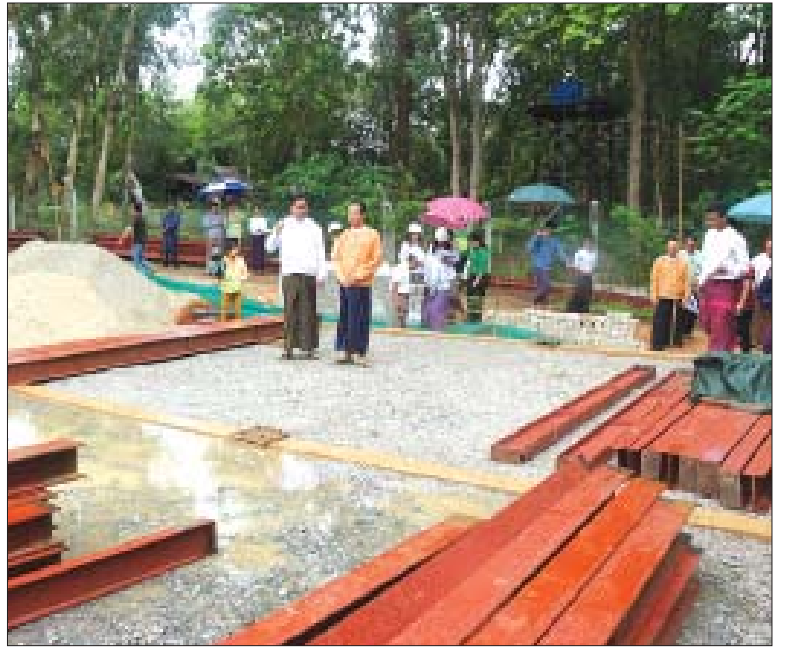
အရည်အသွေးပြည့်မီအောင် ဆောင်ရွက်ရ လိုက်နာဆောင်ရွက်သွားရန် မှာကြားခဲ့ မည်ဖြစ်ပြီး အရည်အသွေးထိန်းသိမ်းရေး ကြောင်း သိရသည်။ ဇွဲများ၏ အကြံပြုချက်များကိုလည်း ရီရယ်(ဒီးမော့ဆို)

ဆက်လက်၍ တိုင်းရင်းသား စာပေနှင့် ယဉ်ကျေးမှုကော်မတီရုံး တည်ဆောက်ရေး လုပ်ငန်းများ ဆောင်ရွက်နေမှုကို ကြည့်ရှုခဲ့ပြီး