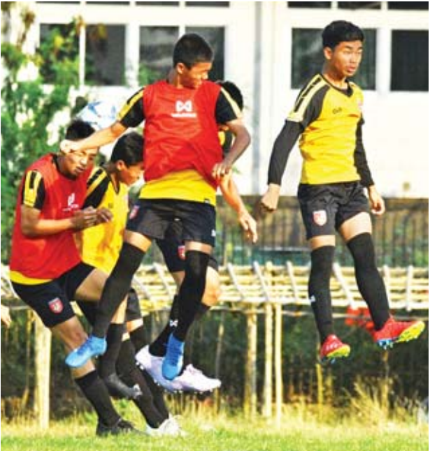
မြန်မာ ယူ-၁၅ အသင်း လေ့ကျင့်နေစဉ်။