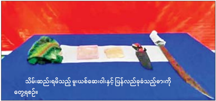
သိမ်းဆည်းရမိသည့် မူးယစ်ဆေးဝါးနှင့် ပြန်လည်ရန်ပစ္စည်းများကို တွေ့ရစဉ်။ မောင်နှင့်ထွက်ပြေးသဖြင့် သတိပေးပစ်ခတ် ဖမ်းဆီးခဲ့ရာ ၎င်းတို့နှစ်ဦးလုံး မစိုးရိမ်ရ ဒဏ်ရာရရှိခဲ့ကြောင်း။ ၎င်းတို့လွယ်အိတ်များအတွင်းမှ ဘိန်းစိမ်း သူညီ ဒသမ ၃၀၂၆၆ ကီလိုနှင့် ဖုန်းနှစ်လုံးတို့ အား သိမ်းဆည်းရမိခဲ့သောကြောင့် သပိတ် ကျင်းမြို့မရဲစခန်းက အမှုဖွင့်စစ်ဆေးပြီး ကွင်းဆက်တရားခံဖမ်းဆီးရမိရေး ဆောင်ရွက် လျက်ရှိကြောင်း မြန်မာနိုင်ငံရဲတပ်ဖွဲ့မှ သတင်းရရှိသည်။ သတင်းစဉ်