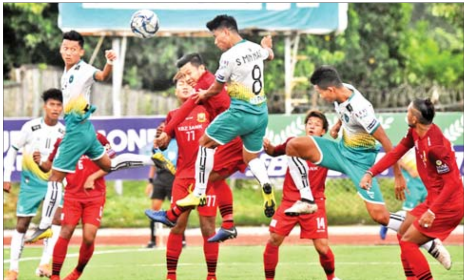
ပထမအကျော့တွင် ပြိုင်ပွဲဝင်အသင်းများ ယှဉ်ပြိုင်နေစဉ်။

ပထမအကျော့အပြီးတွင် ရှမ်းယူ နိုက်တက်နှင့် ဟံသာဝတီအသင်းက စာမျက်နှာ ၅ ကော်လံ ၁ သို့