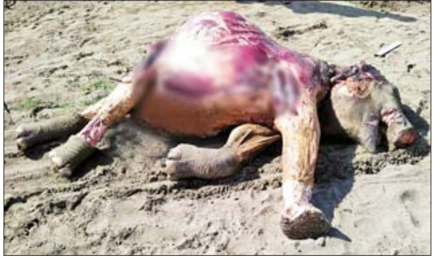
သေဆုံးခြင်းဖြစ်ကြောင်း သိရသည်။ ရဲပြန်ကြား