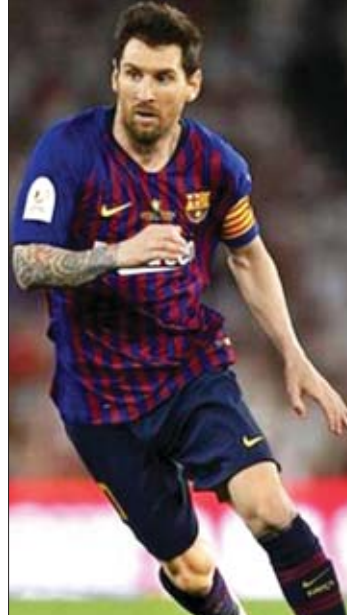
ငွေကြယ် - ရေးသားသည်

လက်ရှိတွင် ထုတ်ပြန်ထားသည့် ဝင်ငွေအများဆုံး အားကစားသမားစာရင်းတွင် တင်းနစ်ကစားသမား ဖက်ဒီရော့က ပေါင် ၉၃ ဒသမ ၄ သန်းဖြင့် အဆင့် ၅ နေရာတွင် ရပ်တည်လျက်ရှိကြောင်း သိရသည်။