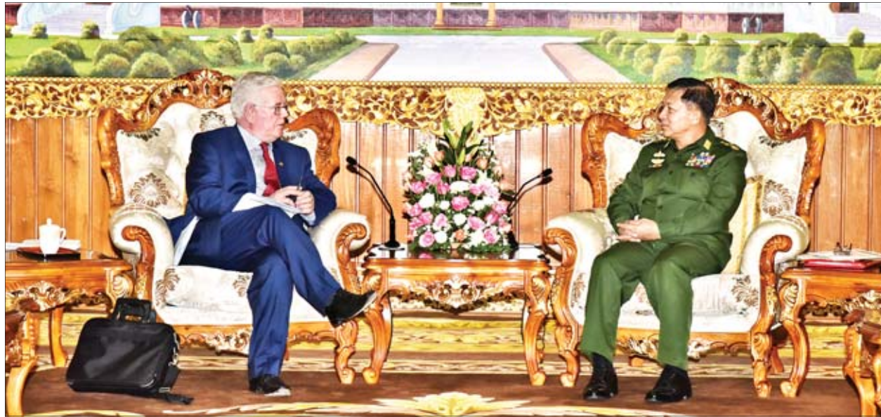
တပ်မတော်ကာကွယ်ရေးဦးစီးချုပ် ဗိုလ်ချုပ်မှူးကြီးမင်းအောင်လှိုင် ဥရောပသမဂ္ဂ၏ လူ့အခွင့်အရေးဆိုင်ရာအထူးကိုယ်စားလှယ် Mr. Eamon Gilmore အား လက်ခံတွေ့ဆုံစဉ်။

တပ်မတော်ကာကွယ်ရေးဦးစီးချုပ် ဗိုလ်ချုပ်မှူးကြီးမင်းအောင်လှိုင်သည် ဖိလစ်ပိုင်လေတပ်ဦးစီးချုပ် Lt. Gen. Rozzano D Briguez AFP အား ယနေ့နံနက်ပိုင်းတွင် နေပြည်တော်ရှိ ဗေယျာသီရိမိမာန် ဧည့်ခန်းမဆောင်၌ လက်ခံတွေ့ဆုံသည်။