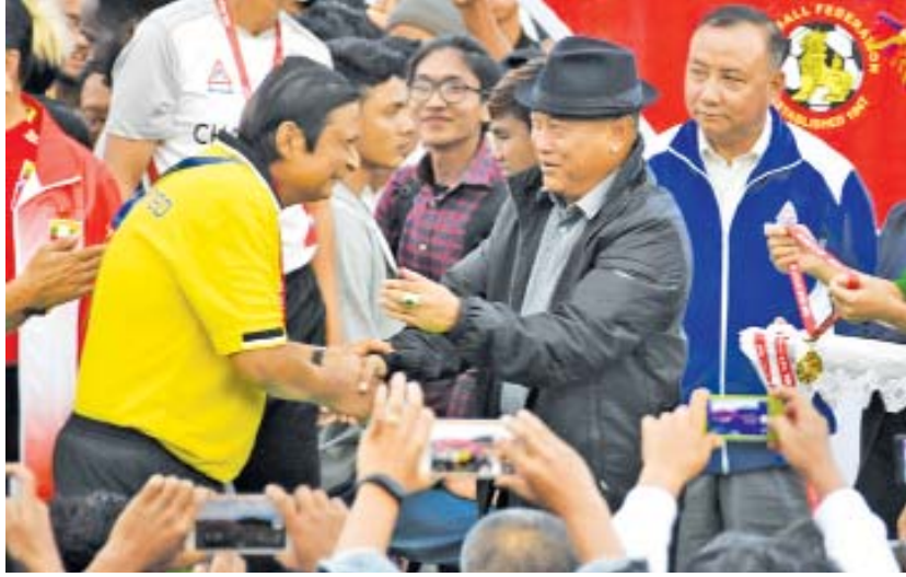
ရန်ကုန် ဇွန် ၁၃