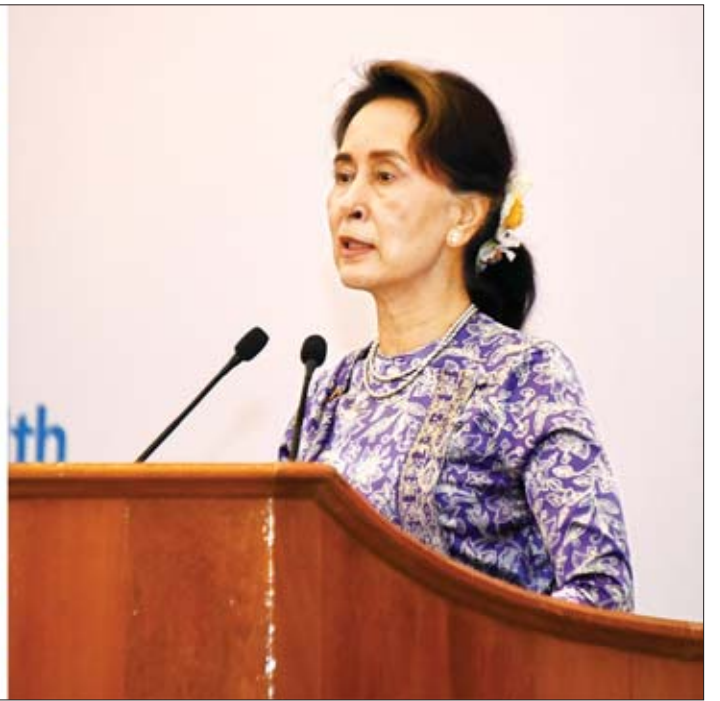
နိုင်ငံတော်၏အတိုင်ပင်ခံပုဂ္ဂိုလ် ဒေါ်အောင်ဆန်းစုကြည် ကျန်းမာရေးအဆင့်မြှင့် ကျောင်းလုပ်ငန်းများ အရှိန်အဟုန်မြှင့်တင်ရေး အမျိုးသားအဆင့် နီးနှောဖလှယ်ပွဲတွင် မိန့်ခွန်းပြောကြားစဉ်။

★ ရှေ့မှ တက္ကသိုလ်များတွင် လုပ်ငန်းများ လက်တွေ့ အကောင်အထည်ဖော်နိုင်ရေး သက်ဆိုင် သူများအားလုံး၊ အထူးသဖြင့် ပညာရေးဝန်ကြီးဌာနက အလေးထား ဆောင်ရွက်သွားကြမည်ဟု မျှော်လင့်ပါ ကြောင်း၊ ၂၀၁၄ ခုနှစ် သန်းခေါင်စာရင်းအရ မြန်မာနိုင်ငံတွင် အသက် ၁၅ နှစ်အောက် ဆယ်ကျော်သက်အရေအတွက် ၁၄ ဒသမ ၄ သန်းရှိပြီး ၁၅ နှစ်မှ ၂၄ နှစ်အကြားရှိ လူငယ် အရေအတွက် ကိုးသန်းရှိသည်အတွက်ကြောင့် ဆယ်ကျော်သက် လူငယ်အရေအတွက်သည် တစ်နိုင်ငံလုံးရှိ လူဦးရေ၏ ၄၆ ဒသမ ၅ ရာခိုင် နှုန်းရှိပါကြောင်း၊ ယခုနှစ်အတွက် ခန့်မှန်းချက် သည် အသက် ၁၅ နှစ်အောက် ၁၅ ဒသမ ၀၆ သန်း၊ ၁၅ နှစ်မှ ၂၄ နှစ်ကြား ၉ ဒသမ ၄၁ သန်းရှိသည်အတွက် ဆယ်ကျော်သက် လူငယ်အရေအတွက် ၄၅ ရာခိုင်နှုန်းရှိ ကြောင်း။