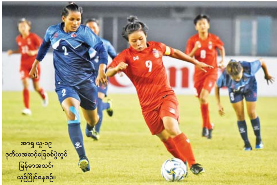
အာရှ ယူ-၁၉ ဒုတိယအဆင့်ခြေစစ်ပွဲတွင် မြန်မာအသင်း ယှဉ်ပြိုင်နေစဉ်။