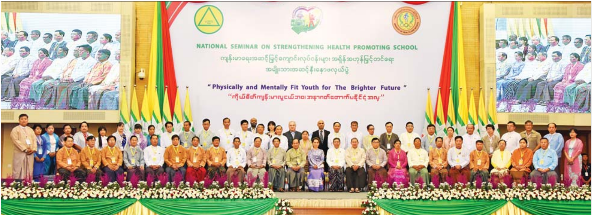
နိုင်ငံတော်၏အတိုင်ပင်ခံပုဂ္ဂိုလ် ဒေါ်အောင်ဆန်းစုကြည် ပြည်ထောင်စုဝန်ကြီးများ၊ ဒုတိယဝန်ကြီးများ၊ လွှတ်တော်ကိုယ်စားလှယ်များ၊ နေပြည်တော်ကောင်စီဝင်များ၊ တိုင်းဒေသကြီးနှင့် ပြည်နယ်လူမှုရေးဝန်ကြီးများ၊ နီးနောဖလှယ်ပွဲတွင် သဘာပတိအဖြစ် ဆောင်ရွက်ကြမည့် ပုဂ္ဂိုလ်များ၊ ဌာနဆိုင်ရာအကြီးအကဲများ၊ ဟောပြောပို့ချမည့် ကျွမ်းကျင်ပညာရှင်များ၊ နိုင်ငံတကာအဖွဲ့အစည်းများမှ တာဝန်ရှိသူများနှင့် စုပေါင်းမှတ်တမ်းတင်ဓာတ်ပုံရိုက်စဉ်။