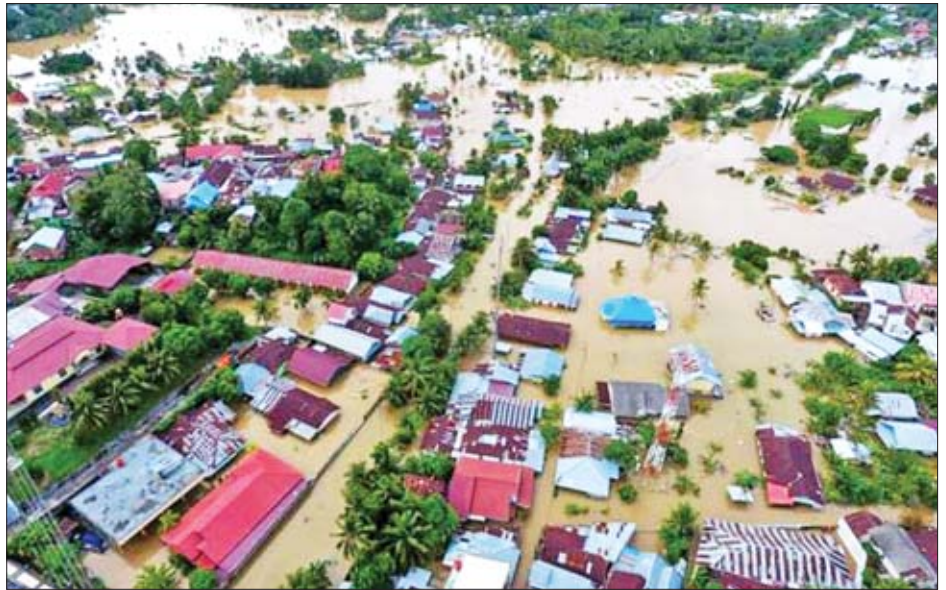
ဆေးဘက်ဝန်ဆောင်မှုများ၊ အစားအစာ၊ ကလေးအစား ထံတွင်ပါဝင်ကြောင်း အမျိုးသားဘေးအန္တရာယ် စီမံအစာ၊ ရွက်ဖျင်တံများ၊ မွေရာများသည် ရေဘေးသင့် ခန့်ခွဲရေးအေဂျင်စီက ပြောသည်။ ပြည်သူများအတွက် အရေးပေါ်လိုအပ်သည့် အရာများ ကိုးကား- ဆင်ဟွာ၊ ဘာသာပြန်- ဂျေတီ

သို့သော် အင်ဒိုနီးရှားအစိုးရသည် ရေဘေးသင့်ပြည်သူများ၏ အခက်အခဲများကို ကိုင်တွယ်ဖြေရှင်းပေးရန် ရဟတ်ယာဉ်တစ်စင်းနှင့် လေယာဉ်တစ်စင်းကို ရေဘေးသင့်ဒေသသို့ စေလွှတ်ထားကြောင်း သိရသည်။