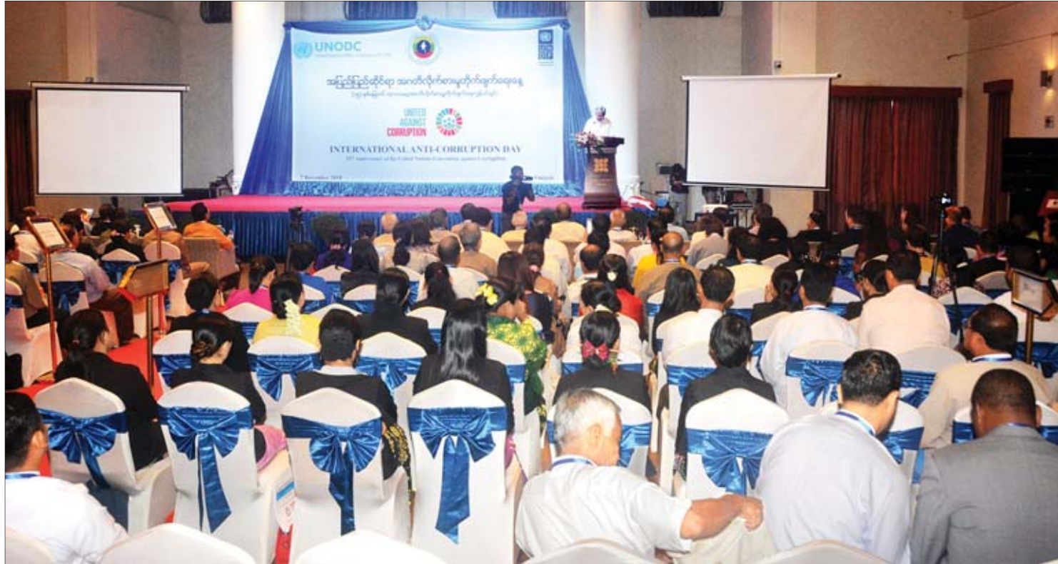
အဂတိတရားမှုတိုက်ဖျက်ရေးကော်မရှင်ဥက္ကဋ္ဌ ဦးအောင်ကြည် အပြည်ပြည်ဆိုင်ရာအဂတိတရားမှုတိုက်ဖျက်ရေးနေ့ အခမ်းအနားတွင် အမှာစကားပြောကြားစဉ်။

သည့် တိုင်ကြားစာ ၁၇၉၅ စောင်၊ ပြည်သူများထံ အကြံပြုချက်ဖြင့် အသိပေးပြန်ကြားသည့်တိုင်ကြားစာ ၅၂၆၈ စောင်၊ အရေးယူဆောင်ရွက်ပေး၍ မရသော တိုင်ကြားစာ ၂၉၄ စောင်နှင့် စိစစ်ဆောင်ရွက်ဆဲ ၆၁၀ ရှိကြောင်း အစီရင်ခံစာအရ သိရသည်။ အဂတိတရားမှု တိုက်ဖျက်ရေး ကော်မရှင်၏ ကြိုးပမ်းဆောင်ရွက်နေမှုကို အားရမိသော်လည်း လုပ်ထုံးလုပ်နည်းများအရ အမှုတွဲများကို ဆိုင်ရာဌာနများသို့ ပြန်လွှဲပေးနေခြင်း၊ တိုင်ကြားမှုမရှိ၍ ဝင်ရောက်စစ်ဆေးအရေးယူမှုများ မလုပ်နိုင်သေးသောကြောင့် ဌာနဆိုင်ရာများမှ ဝန်ထမ်းအချို့အပြားပျက်နှင့် ဆက်လက် အလွဲသုံးစားနေကြခြင်းကို ဝိုင်းဝန်းဖော်ထုတ်ကြမူသော နိုင်ငံတော်သမ္မတကြီး၏ မိန့်ခွန်းတွင်ပါရှိသည့် အဂတိတရားမှုတိုက်ဖျက်ရေးဆိုသည့် အောင်မြင်အောင် အကောင်အထည်ဖော်နိုင်မည်ဖြစ်သောကြောင့် အားလုံးက လက်ပိုက်ကြည့်မနေဘဲ ဆက်တိုက်မိအောင် တိုင်ကြား ဖော်ထုတ်ပေးကြပါရန် တိုက်တွန်းကြောင်း ကချင်ပြည်နယ် မဲဆန္ဒနယ်အမှတ် (၁၀) မှ ဒေါက်တာ ခွန်ဝင်းသောင်းက ကော်မရှင်၏ နှစ်ပတ်လည်လုပ်ငန်း ဆောင်ရွက်မှု အစီရင်ခံစာနှင့်စပ်လျဉ်း၍ လွှတ်တော်အတွင်း ဆွေးနွေးခဲ့သည်။ အဆင့် ၂ ဆင့်ကျဆင်း နိုင်ငံတကာပွင့်လင်းမြင်သာမှုအဖွဲ့ (Transparency International-IT) က သတ်မှတ်သည့် အဂတိတရားမှု အညွှန်းကိန်း (Corruption Perception Index-CPI) အရ ၂၀၁၈ ခုနှစ်တွင် မြန်မာနိုင်ငံသည် ရမှတ် ၁ မှတ်နှင့် အဆင့် ၂ ဆင့်ကျဆင်းသွားကြောင်း သိရသည်။ အဂတိတရားမှုသည် လက်ရှိ အစိုးရအဖွဲ့၏ ဒီမိုကရေစီအသွင်ကူးပြောင်းရေး၊ ခေတ်မီဖွံ့ဖြိုးသည့် နိုင်ငံတော် တည်ဆောက်ရေးတို့အတွက် ခလုတ်တံသင်း ဖြစ်နေသည်။ စာမျက်နှာ ၁၇ သို့ ၀