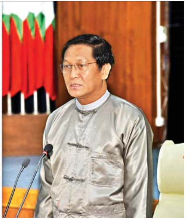
ဒုတိယသမ္မတ ဦးဟင်နရီပန်ထီးယူ မသန်စွမ်းသူများ၏အခွင့်အရေးများဆိုင်ရာ အမျိုးသားကော်မတီ စတုတ္ထအကြိမ် အစည်းအဝေး (၁/၂၀၁၉)တွင် အမှာစကားပြောကြားစဉ်။

အစည်းအဝေးတွင် ကော်မတီဥက္ကဋ္ဌ ဒုတိယသမ္မတက မသန်စွမ်းသူများအနေဖြင့် မသန်စွမ်းမဟုတ်သူ အခြားနိုင်ငံသားများနည်းတူ တန်းတူညီမျှအခွင့်အရေးရရှိစေရေးရည်ရွယ်ပြီး မသန်စွမ်းသူများ၏အရေးကိစ္စတို့ကို ကမ္ဘာတစ်ဝန်း မြှင့်တင်ဆောင်ရွက်လျက်ရှိကြောင်း၊ သို့သော်လည်း နိုင်ငံတကာနှင့် မြန်မာနိုင်ငံတွင် ပြုလုပ်ခဲ့သည့် သုတေသနဆန်းစစ်ချက်များအရ မသန်စွမ်းသူများသည် မညီမျှမှု အခြေအနေတို့ကို ဆက်လက်ကြုံတွေ့နေဆဲဖြစ်သည်ဟု သိရှိရပါကြောင်း၊ အထူးသဖြင့် မသန်စွမ်းသူများသည် ပညာသင်ကြားမှုနှင့် အလုပ်အကိုင်အခွင့်အလမ်းများ ရရှိနိုင်မှုအားနည်းခြင်းတို့ကြောင့် ဆင်းရဲနွမ်းပါးမှုဒဏ်ကို ခံစားရနိုင်ခြေရှိပါကြောင်း၊ တွေ့ရှိရပါကြောင်း။