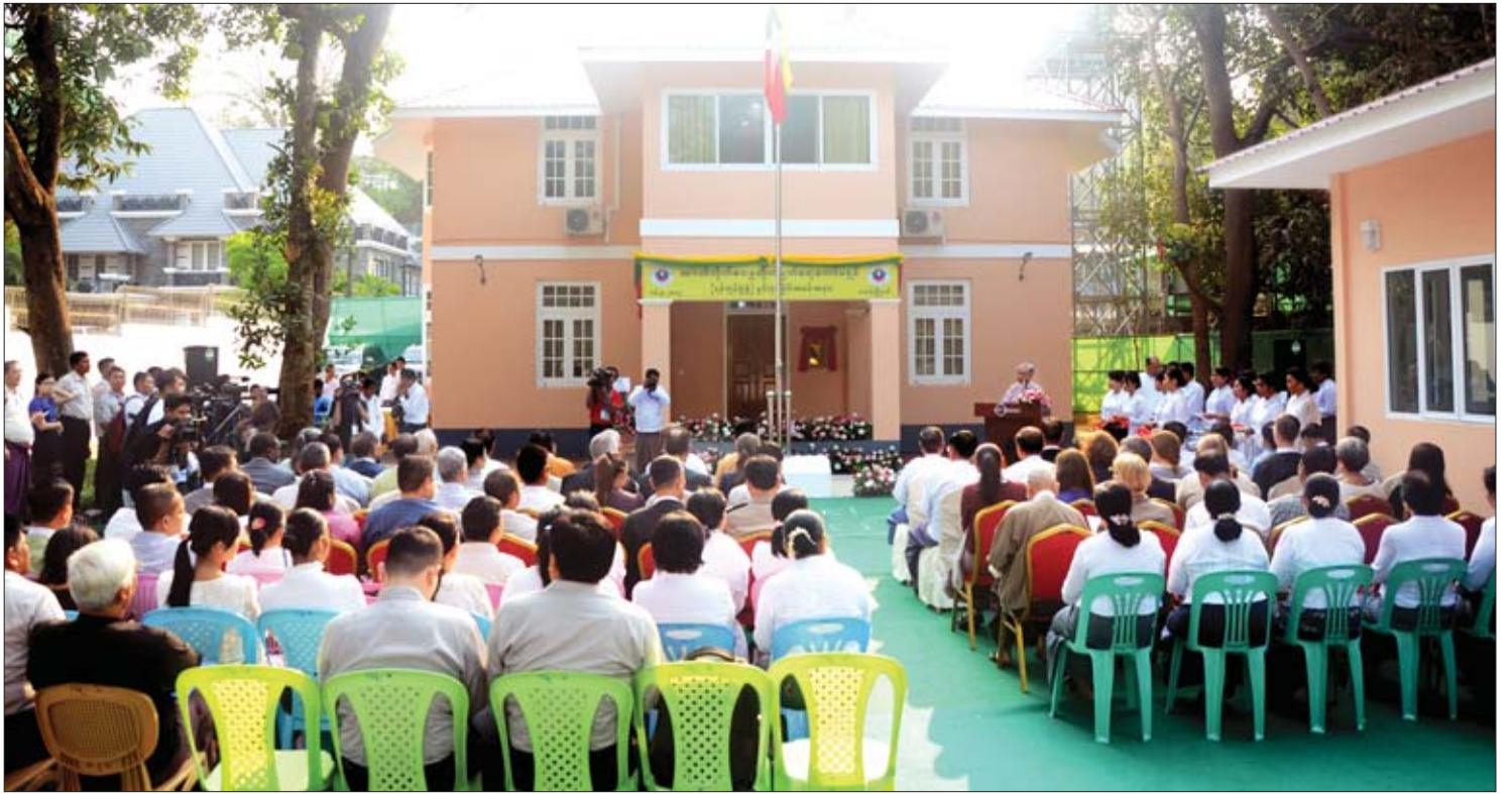
အဂတိလိုက်စားမှုတိုက်ဖျက်ရေးကော်မရှင် (ရန်ကုန်ရုံးခွဲ) ဖွင့်ပွဲအခမ်းအနား ကျင်းပစဉ်။

“ထင်သာမြင်သာရှိတဲ့ အဂတိ လိုက်စားမှုတွေကို ဖော်ထုတ်အရေးယူနိုင် တယ်။ ဒါပေမယ့် ဖုံးကွယ်နေတဲ့ အဂတိ လိုက်စားမှုတွေကို ဖော်ထုတ်အရေးယူ နိုင်သေးတာရှိတယ်။ အဂတိလိုက်စားမှု ကြောင့် မြန်မာနိုင်ငံမှာ ဆုံးရှုံးမှုတစ်နှစ်ကို ဒေါ်လာသန်း နှစ်ထောင်ကျော်လောက် ရှိတယ်လို့ အဂတိလိုက်စားမှုကို စောင့်ကြည့်တဲ့ နိုင်ငံတကာအဖွဲ့အစည်း တစ်ခုက ပြောပါတယ်။ အဂတိလိုက်စားမှု ကို လျော့နည်းကင်းစင်အောင် လုပ်နိုင်ရင် တိုင်းပြည်ဖွံ့ဖြိုးရေးကို အများကြီးဖြစ်စေ