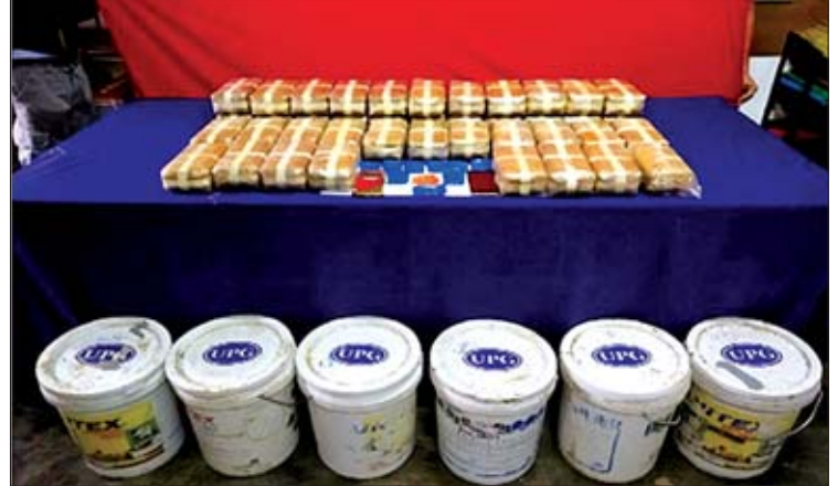
သိမ်းဆည်းရမိသည့် မှူးယစ်ဆေးဝါးများကို တွေ့ရစဉ်။

ကနဦးစစ်ဆေးချက်များအရ ၎င်းသည် ၂၀၁၄ ခုနှစ်ခန့်က မောင်တောမြို့နယ် ကင်းချောင်း ကျေးရွာနှင့် ဗောဓိကုန်းကျေးရွာကြား မေယု တောင်ခြေတွင် ARG (ရခိုင်မျိုးစောင့်အုပ်စု) အား စတင်ဖွဲ့စည်းခဲ့ကြောင်း၊ ၂၀၁၇ ခုနှစ်ခန့်မှ စ၍ အဆိုပါအဖွဲ့၏ ဥက္ကဋ္ဌအဖြစ် ဆောင်ရွက် ခဲ့ပြီး အဖွဲ့ဝင်ဦးရေ ၂၆၀ ခန့်ရှိကြောင်း၊ မြောက်ဦးမြို့၌လည်း ARG (ရခိုင်မျိုးစောင့် အုပ်စု)အား တည်ထောင်ထားကြောင်း သိရ