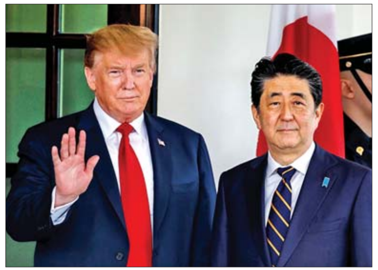
အမေရိကန်သမ္မတ ဒေါ်နယ်ထရန်နှင့် ဂျပန်ဝန်ကြီးချုပ် ရှင်ဇီအာဘေးတို့ ဝါရှင်တန်ဒီစီရှိ အိမ်ဖြူတော်တွင် ဧပြီ ၂၆ ရက်က တွေ့ဆုံစဉ်။

ဆုံးဖြတ်ချက်ချမှတ် ဂျပန်ဝန်ကြီးချုပ် ရှင်ဇီအာဘေးသည် အောက်လွှတ်တော်ပွဲကိုင်ကော်မတီ အဖွဲ့ဝင်များနှင့် ပြုလုပ်သည့် အစည်းအဝေးတစ်ရပ်တွင် အီရန်နိုင်ငံသို့ သွားရောက်ရန် ယခုကဲ့သို့ ဆုံးဖြတ်ချက် ချမှတ်လိုက်ခြင်းဖြစ်သည်။