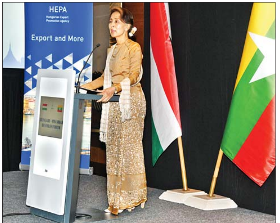
နိုင်ငံတော်၏အတိုင်ပင်ခံပုဂ္ဂိုလ် ဒေါ်အောင်ဆန်းစုကြည် မြန်မာ-ဟန်ဂေရီ နှစ်နိုင်ငံစီးပွားရေးဖိုရမ် ဖွင့်ပွဲတွင် အမှာစကားပြောကြားစဉ်။

ထို့နောက် နိုင်ငံတော်၏အတိုင်ပင်ခံပုဂ္ဂိုလ်က National University of Public Service ပါမောက္ခချုပ်အား အမှတ်တရလက်ဆောင်ပစ္စည်းပေးအပ် သည်။ စာမျက်နှာ ၃ ကော်လံ ၃ သို့ ❖