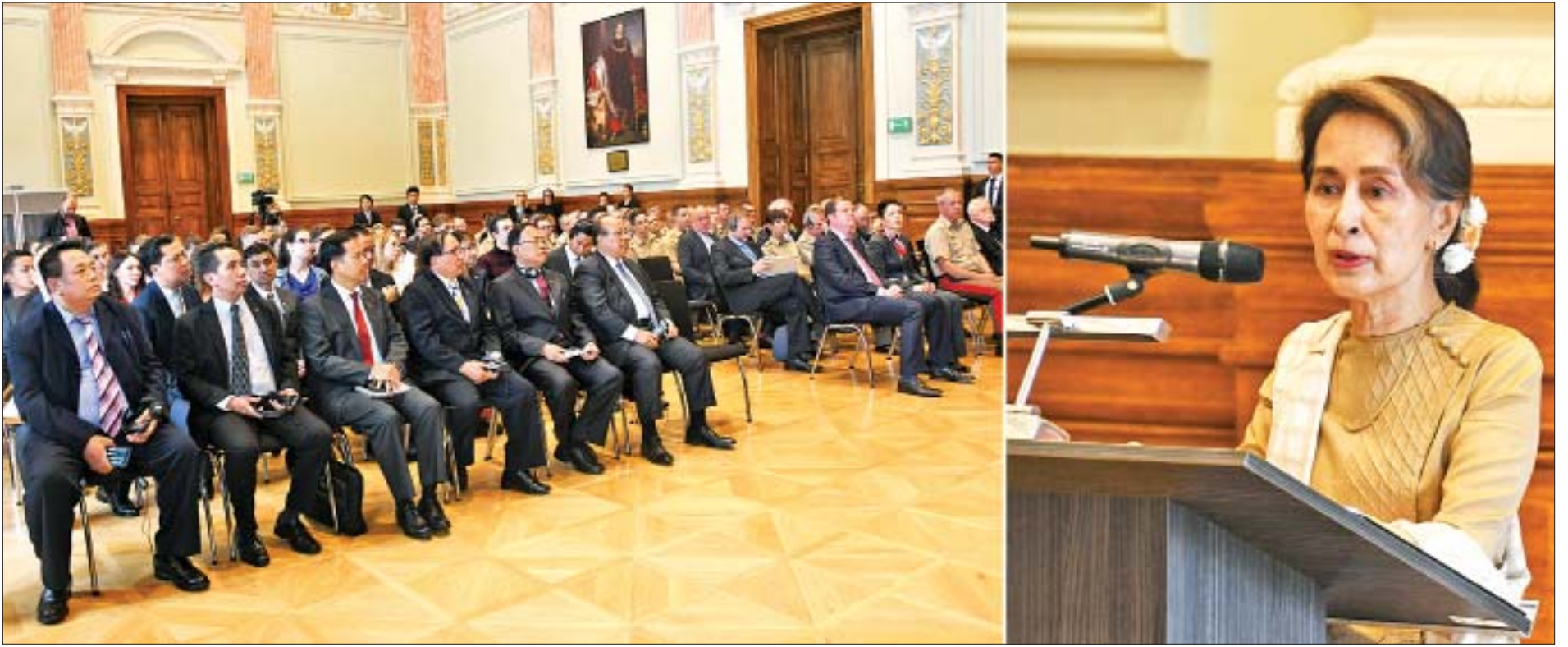
နိုင်ငံတော်၏အတိုင်ပင်ခံပုဂ္ဂိုလ် ဒေါ်အောင်ဆန်းစုကြည် ဟန်ဂေရီနိုင်ငံ National University of Public Service ၌ မြန်မာနိုင်ငံ၏ ပြုပြင်ပြောင်းလဲရေးလုပ်ငန်းစဉ်များနှင့်ပတ်သက်၍ ဟောပြောပို့ချစဉ်။