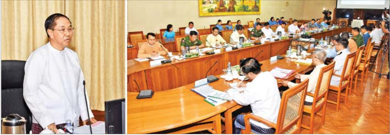
ဒုတိယသမ္မတ ဦးမြင့်ဆွေ ၂၀၁၉ ခုနှစ် (၇၂)နှစ်မြောက် အာဇာနည်နေ့အခမ်းအနားကျင်းပရေးပဟိုက်မတ်စ် ပထမအကြိမ် ညှိနှိုင်းအစည်းအဝေးတွင် အမှာစကားပြောကြားစဉ်။

နေပြည်တော် ဇွန် ၆ ၂၀၁၉ ခုနှစ် (၇၂)နှစ်မြောက် အာဇာနည်နေ့အခမ်းအနား ကျင်းပရေးပဟိုက်မတ်စ် ပထမအကြိမ် ညှိနှိုင်းအစည်းအဝေးကို ယနေ့နံနက် ၉ နာရီတွင် နေပြည်တော်ရှိ နိုင်ငံတော်သမ္မတရုံး အစည်းအဝေးခန်းမ၌ ကျင်းပရာ ပဟိုက်မတ်စ် နာယက ဒုတိယသမ္မတ ဦးမြင့်ဆွေ တက်ရောက်အမှာစကား ပြောကြားသည်။ အစည်းအဝေးသို့ (၇၂)နှစ်မြောက် အာဇာနည်နေ့အခမ်းအနား ကျင်းပရေးပဟိုက်မတ်စ်ဥက္ကဋ္ဌ သာသနာရေးနှင့် ယဉ်ကျေးမှုဝန်ကြီးဌာန ပြည်ထောင်စုဝန်ကြီး သုရဦးအောင်ကို စာမျက်နှာ ၇ ကော်လံ ၁ သို့ ○