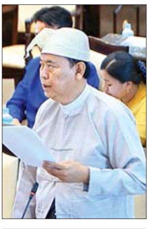
ဒုတိယဝန်ကြီး ဦးဝင်းမော်ထွန်း