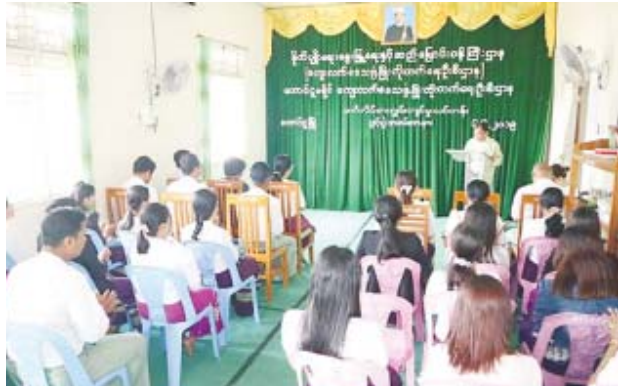
ဝန်ထမ်းများ အင်္ဂလိပ်စာကျွမ်းကျင်ရေး သင်တန်းဖွင့်

တောင်ငူ ဇွန် ၆ တောင်ငူခရိုင် ကျေးလက်ဒေသဖွံ့ဖြိုးတိုးတက်ရေးဦးစီးဌာနက အင်္ဂလိပ်စာကျွမ်းကျင်မှုသင်တန်းကို ဇွန် ၆ ရက် နံနက် ၉ နာရီက ကျင်းပသည်။ တောင်ငူခရိုင် ကျေးလက်ဦးစီးဌာန ခရိုင်ဦးစီးမှူး ဦးဘသိန်းက အမှာစကားပြောကြားပြီး သင်တန်းနည်းပြ ဆရာမဒေါ်ယုညိုမေသန်းက နိုင်ငံတကာနှင့်ရင်ပေါင်တန်းနိုင်ရန် အင်္ဂလိပ်စာကျွမ်းကျင်မှုရှိရန် လိုအပ်မည်ဖြစ်ကြောင်း ပြောကြားသည်။ သင်တန်းသို့ တောင်ငူ၊ ထန်းတပင်၊ ရေတောရှည်၊ အုတ်တွင်း၊ ဖြူ၊ ကျောက်ကြီးမြို့နယ် ကျေးလက်ဦးစီးဌာနများမှ ဝန်ထမ်း ၂၀ တက်ရောက်ပြီး သင်တန်းကာလမှာ ၂၁ ရက်ဖြစ်ကြောင်း သိရသည်။ ကိုလွင်(ဆွာ)