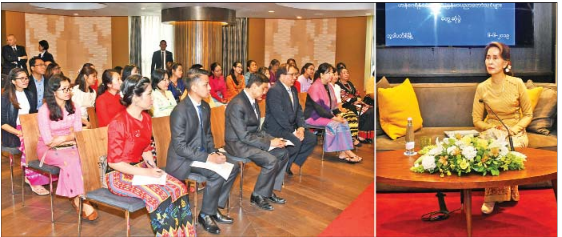
နိုင်ငံတော်၏အတိုင်ပင်ခံပုဂ္ဂိုလ် ဒေါ်အောင်ဆန်းစုကြည် မြန်မာသံအမတ်ကြီး ဦးမျိုးအေး၊ သံရုံးဝန်ထမ်းများ၊ ဟန်ဂေရီနိုင်ငံရောက် မြန်မာပညာတော်သင်များနှင့် တွေ့ဆုံစဉ်။