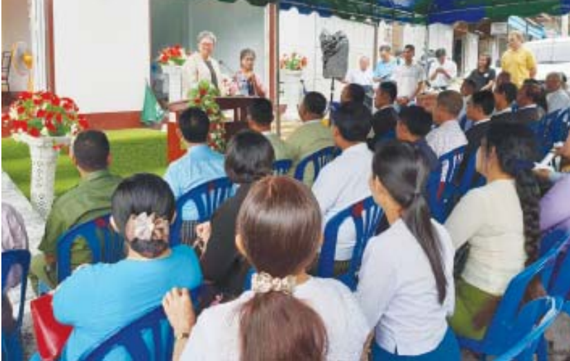
ဖွံ့ဖြိုးတိုးတက်ရေးဖောင်ဒေးရှင်း (FED) အဖွဲ့နှင့် အပြည်ပြည်ဆိုင်ရာအလုပ်သမားရေးရာအဖွဲ့ (ILO) တို့ ပူးပေါင်းတာဝန်ယူကာ ရွှေ့ပြောင်းအလုပ်သမားများ ဝင်ထွက်သွားလာမှုများပြားရာ ထိုင်း-မြန်မာ နယ်စပ်ဒေသတစ်ခုဖြစ်သည့် ကျေးသောင်းမြို့တွင် ရွှေ့ပြောင်းအလုပ်သမားများဘဝ ဖွံ့ဖြိုးတိုးတက်လာရေး ဆောင်ရွက်ပေးနိုင်ရန်ဖွင့်လှစ်ခြင်းဖြစ်ကြောင်း သိရသည်။ ကျော်စိုး (ကျေးသောင်း)

ကျေးသောင်း ဇွန် ၆ အပြည်ပြည်ဆိုင်ရာ အလုပ်သမားရေးရာအဖွဲ့ (ILO) နှင့် ပညာရေးနှင့် ဖွံ့ဖြိုးတိုးတက်ရေးဖောင်ဒေးရှင်း၊ Foundation for Education and Development (FED) မြန်မာတို့ ပူးပေါင်းဖွင့်လှစ်သည့် ရွှေ့ပြောင်းအလုပ်သမားအရင်းအမြစ်စင်တာ Migrant Worker Resource Center (MRC) ရုံးခန်းသစ်ဖွင့်ပွဲကို ကျေးသောင်းမြို့ ရွှေ့ပြောင်းအလုပ်သမားအဖွဲ့ဝင်များနှင့် ပူးပေါင်းဖွင့်လှစ်ပွဲကို (၄၉၂) တွင် ဇွန် ၅ ရက် ညနေပိုင်းက ကျင်းပသည်။ အဆိုပါ ရွှေ့ပြောင်းအလုပ်သမားအရင်းအမြစ်စင်တာအား ထိုင်းနိုင်ငံအတွင်း အလုပ်လုပ်ကိုင်လျက်ရှိသည့် မြန်မာရွှေ့ပြောင်းအလုပ်သမား မိသားစုများ၏ အလုပ်သမားအခွင့်အရေးများ၊ ကျန်းမာရေး၊ ပညာရေး၊ ကလေးသူငယ်အခွင့်အရေးနှင့် အမျိုးသမီးများအခွင့်အရေးစွဲများကို စနစ်တကျ ကူညီဆောင်ရွက်ပေးနိုင်ရန် ထိုင်းနိုင်ငံအစိုးရထံတွင် ပထမဦးဆုံး မှတ်ပုံတင်ထားသော မြန်မာအဖွဲ့အစည်းတစ်ခုဖြစ်သည့် ပညာရေးနှင့်