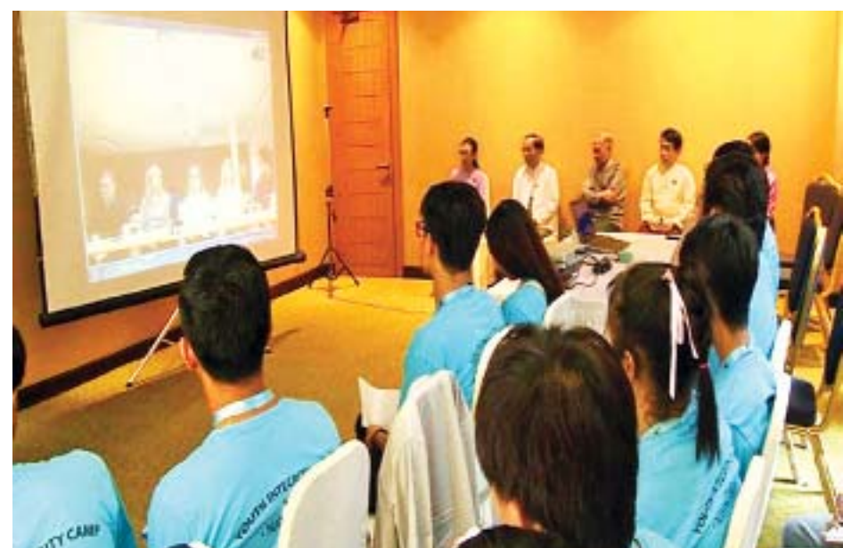
ferencing ဖြင့် တွေ့ဆုံဆွေးနွေးရာသို့ ကော်မရှင်ဥက္ကဋ္ဌ ဦးအောင်ကြည်နှင့် ကော်မရှင်အဖွဲ့ဝင်များ တက်ရောက်အားပေးခဲ့ပြီး လူငယ်စခန်းအား ဇွန် ၇ ရက်အထိ

နှစ်နိုင်ငံ ကျောင်းသားလူငယ်များ Video Con-