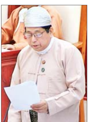
ပြည်ထောင်စုဝန်ကြီး ဒေါက်တာဖေမြင့်

အမျိုးသားလွှတ်တော်ကိုယ်စားလှယ် ဦးစောစိန်ထွန်း၏ မေးခွန်းကို ပြန်လည်ဖြေကြားခဲ့ရာတွင် လက်ရှိပြန်ကြားရေးဝန်ကြီးဌာန၏ ဘဏ္ဍာငွေ ခွင့်ပြုမှုအနေအထားနှင့် လုပ်ငန်းများဆောင်ရွက်ရသည့်ပမာဏ၊ မြန်မာနိုင်ငံ