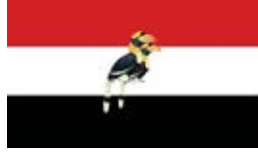
ချင်းတိုင်းရင်းသားများပါတီ [Chin National Party (CNP)] ၏ တံဆိပ်ပုံစံ

ချင်းတိုင်းရင်းသားများပါတီ [Chin National Party (CNP)] ၏ အလံပုံစံ