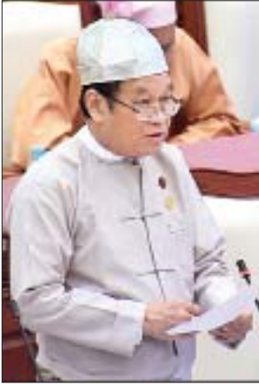
ပြည်ထောင်စုဝန်ကြီး ဒေါက်တာမြင့်ထွေး

ထို့နောက် ကလေးမဲဆန္ဒနယ်မှ ဒေါ်အေးအေးမူ (ခ)ဒေါ်ရှားမီး၏ လစာခံစားခွင့်မရှိသေးသော ဝန်ထမ်းသစ်ဆရာဝန်များအားလုံးကို ပဟိုဝန်ထမ်း တက္ကသိုလ်တက်ရောက်စေခြင်းအစား အုပ်ချုပ်ရေးနှင့် စီမံခန့်ခွဲရေးတာဝန် ယူမည့်သူများကိုသာ တက်ရောက်စေရန် အစီအစဉ်ရှိ မရှိ မေးခွန်းနှင့်စပ်လျဉ်း၍ ကျန်းမာရေးနှင့် အားကစားဝန်ကြီးဌာန ပြည်ထောင်စုဝန်ကြီး ဒေါက်တာ မြင့်ထွေးက လစာခံစားခွင့်မရှိသေးသော ဝန်ထမ်းဆရာဝန်များအားလုံးကို ပဟိုဝန်ထမ်းတက္ကသိုလ်တက်ရောက်စေခြင်းအစား ဝန်ထမ်းဆရာဝန်များထံမှ