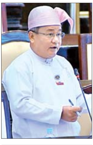
ရခိုင်ပြည်နယ် မဲဆန္ဒနယ် အမှတ်(၅)မှ ဦးမြင့်နိုင်

အထက်တန်းကျောင်းအဖြစ် အဆင့်တိုးမြှင့်ပေးရန် အစီအစဉ် ရှိ၊ မရှိ မေးခွန်း၊ ဧရာဝတီတိုင်းဒေသကြီး မဲဆန္ဒနယ်အမှတ်(၈)မှ ဒေါ်အိအိပြုံး၏ ပညာရေး ဝန်ကြီးဌာနလက်အောက်ရှိ နေ့စားဝန်ထမ်းများအား အမြဲတမ်းဝန်ထမ်းအဖြစ် ခန့်အပ်ထားရှိနိုင်ရေးအခြေအနေနှင့် တက္ကသိုလ်အသီးသီးတွင် တာဝန်ထမ်းဆောင်နေသော ဆရာ ဆရာမများအား အိမ်ခန်း၊ အဆောင်များချထားပေးရာတွင် သတ်မှတ်ထားသောမူဝါဒများနှင့် လိုအပ်လျက်ရှိသော အိမ်ခန်း၊ အဆောင်များ ရရှိရန် မည်သို့စီမံထားသည်ကို သိရှိလိုခြင်း မေးခွန်းနှင့် မွန်ပြည်နယ် မဲဆန္ဒနယ် အမှတ်(၉)မှ ဒေါက်တာဇော်လင်းထွဋ်၏ မွန်ပြည်နယ် သထုံမြို့နယ် နောင်ဘို ကျေးရွာအုပ်စု ကသဖကျေးရွာ အခြေခံပညာအထက်တန်းကျောင်း(ခွဲ) တွင် အန္တရာယ်ရှိ ကျောင်းဆောင်ဟောင်းအား ဖျက်သိမ်း၍ (၁၀၀ x ၃၀)ပေ RC နှစ်ထပ်ဆောင်အဖြစ် ၂၀၁၉-၂၀၂၀ ဘဏ္ဍာနှစ်တွင် တည်ဆောက်ပေးရန် အစီအစဉ် ရှိ၊ မရှိ မေးခွန်းနှင့်စပ်လျဉ်း၍ ပညာရေးဝန်ကြီးဌာန ဒုတိယဝန်ကြီး ဦးဝင်းမော်ထွန်းကလည်းကောင်း ပြန်လည်ရှင်းလင်းဖြေကြားကြသည်။