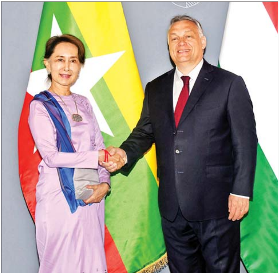
နိုင်ငံတော်၏အတိုင်ပင်ခံပုဂ္ဂိုလ် ဒေါ်အောင်ဆန်းစုကြည်အား ဟန်ဂေရီနိုင်ငံ ဝန်ကြီးချုပ် Mr. Viktor Orbán က ရင်းရင်းနှီးနှီး နှုတ်ဆက်စဉ်။

ဘူဒါပတ်စ် ၆ နေ့ ဟန်ဂေရီနိုင်ငံ ဘူဒါပတ်စ်မြို့တွင် ရောက်ရှိနေသည့် နိုင်ငံတော်၏အတိုင်ပင်ခံပုဂ္ဂိုလ် ဒေါ်အောင်ဆန်းစုကြည်သည် ဟန်ဂေရီနိုင်ငံ ဝန်ကြီးချုပ် Mr. Viktor Orbán နှင့် ယနေ့ ဒေသစံတော်ချိန် နံနက် ၉ နာရီတွင် ဘူဒါပတ်စ်မြို့ရှိ ဟန်ဂေရီနိုင်ငံ ဝန်ကြီးချုပ်ရုံး၌ တွေ့ဆုံသည်။ နိုင်ငံတော်၏အတိုင်ပင်ခံပုဂ္ဂိုလ်သည် ဟန်ဂေရီနိုင်ငံ ဝန်ကြီးချုပ်ရုံးသို့ ရောက်ရှိရာ ဝန်ကြီးချုပ်က ရင်းရင်းနှီးနှီး ကြိုဆိုနှုတ်ဆက်ပြီး ဝန်ကြီးချုပ်ရုံးအတွင်းနှင့် ဝန်ကြီးချုပ်ရုံးအပေါ်မှနေ၍ ဒေသဖြစ်ရပ်အားလှိုက်လှိုက်ပြသသည်။ ထို့နောက် နိုင်ငံတော်၏အတိုင်ပင်ခံပုဂ္ဂိုလ်က ၎င်းနှင့်အတူ အဖွဲ့ဝင်အဖြစ်လိုက်ပါလာကြသည့် ပြည်ထောင်စုဝန်ကြီး ဦးသောင်းထွန်းနှင့် ဦးကျော်တင်၊ စာမျက်နှာ ၃ ကော်လံ ၁ သို့ ❖