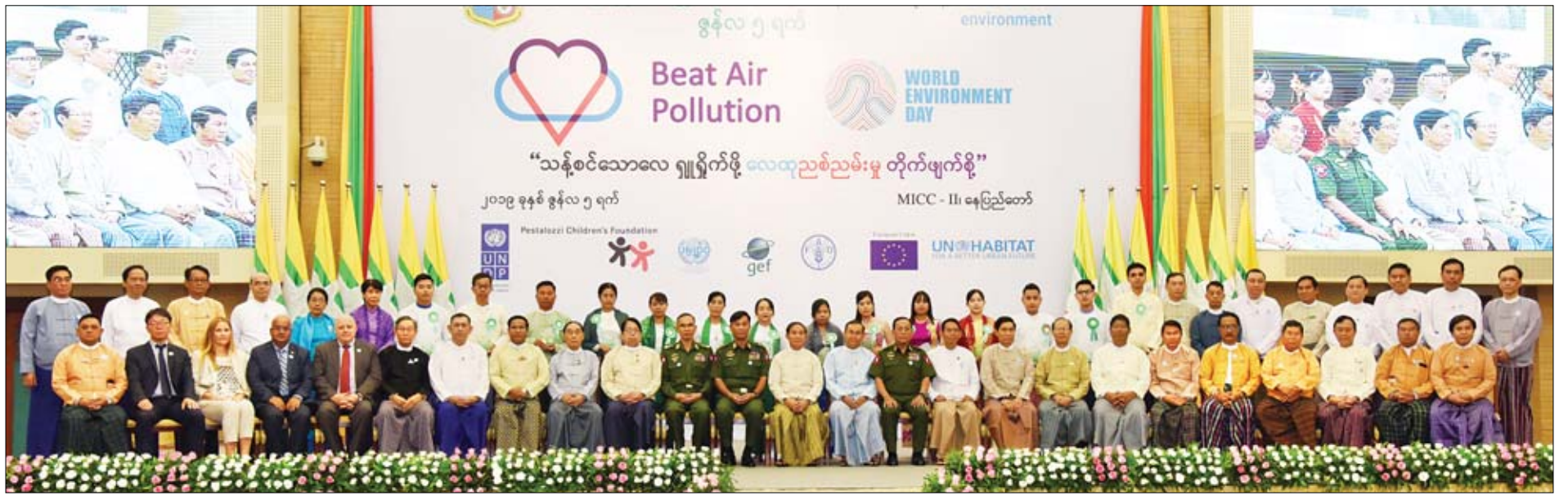
နိုင်ငံတော်သမ္မတ ဦးဝင်းမြင့် ကမ္ဘာ့ပတ်ဝန်းကျင်ထိန်းသိမ်းရေးနေ့ အထိမ်းအမှတ်အခမ်းအနားသို့ တက်ရောက်လာသည့် ပြည်ထောင်စုဝန်ကြီးများ၊ ဧည့်သည်တော်များ၊ ဆရာရှိကြသူများနှင့်အတူ စုပေါင်းမှတ်တမ်းတင်ဓာတ်ပုံရိုက်စဉ်။