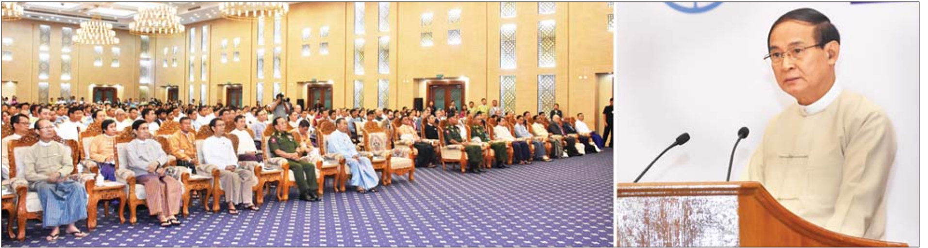
နိုင်ငံတော်သမ္မတ ဦးဝင်းမြင့် ၂၀၁၉ ခုနှစ် ကမ္ဘာ့ပတ်ဝန်းကျင်ထိန်းသိမ်းရေးနေ့ အထိမ်းအမှတ်အခမ်းအနားတွင် မိန့်ခွန်းပြောကြားစဉ်။

❖ ရှေ့စုံမှ သံအမတ်ကြီးများ၊ ပြည်တွင်း ပြည်ပမှ အစိုးရ မဟုတ်သော အဖွဲ့အစည်းများမှ ကိုယ်စား လှယ်များ၊ ကျောင်းသား ကျောင်းသူများ၊ ဖိတ်ကြားထားသည့် စည်သူတော်များနှင့် တာဝန်ရှိသူများ တက်ရောက်ကြသည်။