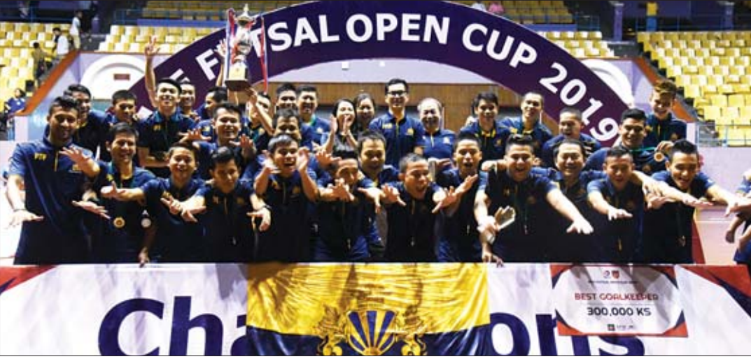
ချန်ပီယံ MIU အသင်း အောင်ပွဲခံနေစဉ်။

ရန်ကုန် ဇွန် ၅ မြန်မာနိုင်ငံဘောလုံးအဖွဲ့ချုပ်က ကြီးမှူးကျင်းပသည့် 2019 MFF Open Cup ဖူဆယ်ပြိုင်ပွဲ တတိယနေရာလုပွဲနှင့် ဗိုလ်လုပွဲကို ယနေ့ ညနေပိုင်းက အမျိုးသားအားကစားပြိုင်ပွဲခုံ-၁ သုဝဏ္ဏံ ကျင်းပရာ MIU အသင်းက VUC အသင်းကို သုံးဂိုး-နှစ်ဂိုးဖြင့် အနိုင်ယူပြီး ချန်ပီယံဆု ဆက်လက်ထိန်းသိမ်းသွားသည်။ စာမျက်နှာ ၉ ကော်လံ ၁ သို့ ✪