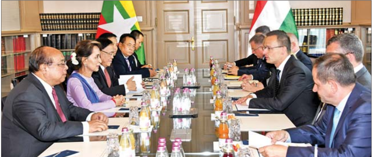
နိုင်ငံတော်၏အတိုင်ပင်ခံပုဂ္ဂိုလ် ဒေါ်အောင်ဆန်းစုကြည် ဦးဆောင်သော ကိုယ်စားလှယ်အဖွဲ့နှင့် ဟန်ဂေရီ နိုင်ငံခြားရေးနှင့် ကုန်သွယ်ရေးဝန်ကြီး Mr. Peter Szijjarto ဦးဆောင်သော ကိုယ်စားလှယ်အဖွဲ့တို့ ဆွေးနွေးပွဲ ကျင်းပစဉ်။

တွေ့ဆုံပွဲတွင် မြန်မာနိုင်ငံနှင့် ဟန်ဂေရီနိုင်ငံအကြားဆက်ဆံရေးနှင့် ပူးပေါင်းဆောင်ရွက်မှု တိုးမြှင့်သွားရန် နှစ်နိုင်ငံဆက်ဆံရေးရှိသည်နှင့်အညီ လုပ်ငန်းစဉ်များကို အရှိန်အဟုန်မြှင့်တင် ဆောင်ရွက်သွားရေးကိစ္စရပ်များ၊ ဟန်ဂေရီနိုင်ငံမှ မြန်မာနိုင်ငံ၏ ဖွံ့ဖြိုးတိုးတက်ရေးလုပ်ငန်းများအတွက် အထောက်အကူပြုနိုင်ရန် Tied Aid Credit ချေးငွေပေးအပ်ရေးကိစ္စရပ်များ၊ နှစ်နိုင်ငံအကြားကုန်သွယ်ရေး၊ ရင်းနှီးမြှုပ်နှံမှုကဏ္ဍတွင်သာမက လူမှုရေး၊ ယဉ်ကျေးမှုနှင့် ပြည်သူ့အချင်းချင်း ထိတွေ့ဆက်ဆံမှု တိုးမြှင့်ရေးကိစ္စရပ်များ၊ အာဆီယံဒေသတွင်းနှင့် ကုလသမဂ္ဂအပါအဝင် နိုင်ငံတကာမျက်နှာစာတွင်