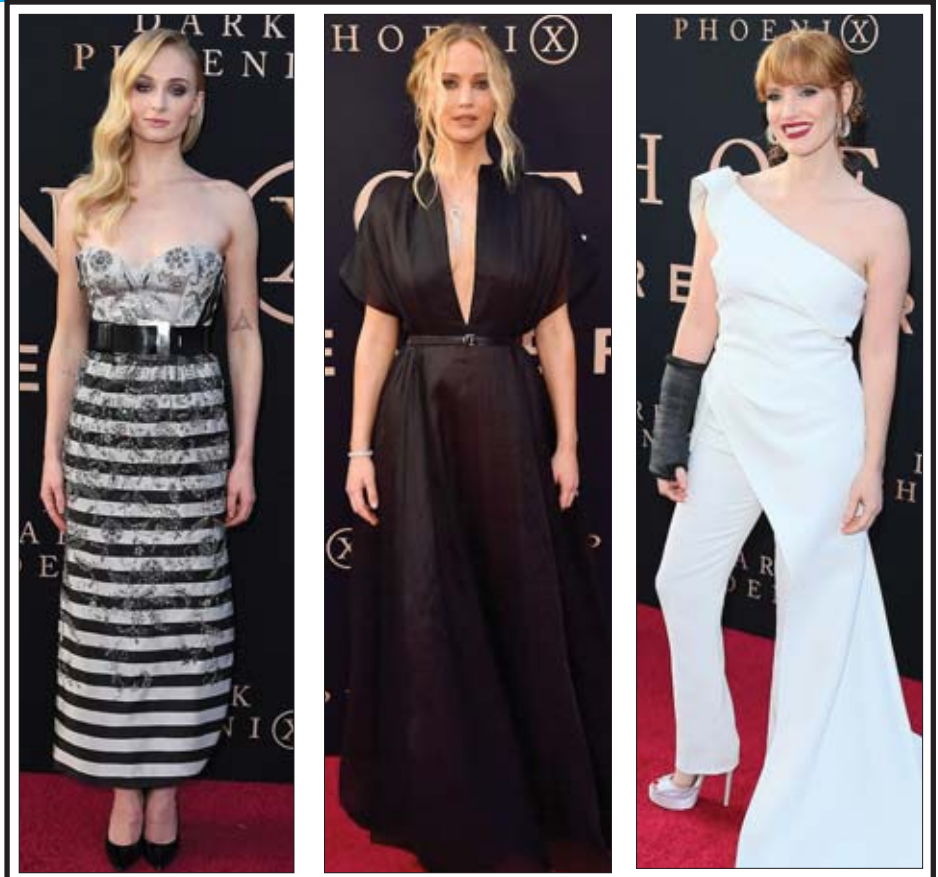
ဇွန် ၄ ရက်က ပြုလုပ်ခဲ့တဲ့ “Dark Phoenix” ရုပ်ရှင်အထူးပွဲပြသမှုကို တက်ရောက်အားပေးခဲ့ကြသော ဆိုဖီယာတာနာ၊ ဂျန်ဇာလောရန်စ်၊ ဂျက်ဆီကာချက်စတီနား (ဝဲမုယာ) တို့ ကော်ဇောနီပေါ် လျှောက်လှမ်းစဉ်။

ဒီအကြောင်းကိုတော့ လေဒီဂါဂါက ဇွန် ၂ ရက်က လာ့စ်ဗီးဂတ်စ်မှာ ပြုလုပ်ခဲ့တဲ့ တေးဂီတဖျော်ဖြေပွဲမှာ ပရိသတ်တွေကို ပြောကြားခဲ့တာ ဖြစ်ပါတယ်။ လေဒီဂါဂါက သူ့ရဲ့ ကျော်ကြားတဲ့ တေးသီချင်းတစ်ပုဒ်ဖြစ်တဲ့ “Someone to Watch Over Me” ကို သီဆိုဖျော်ဖြေခဲ့ရာမှာတော့ လေဒီဂါဂါက “ဒီတေးသီချင်းကို နောက်ဆုံးဖျော်ဖြေခဲ့တဲ့အချိန်က ကျွန်မ လက်မှာ လက်စွပ်ဝတ်ထားခဲ့ပါတယ်။ ဒီတစ်ကြိမ်မှာတော့ ခြားနားသွားခဲ့ပါပြီ” လို့ ပြောကြားခဲ့ပါတယ်။