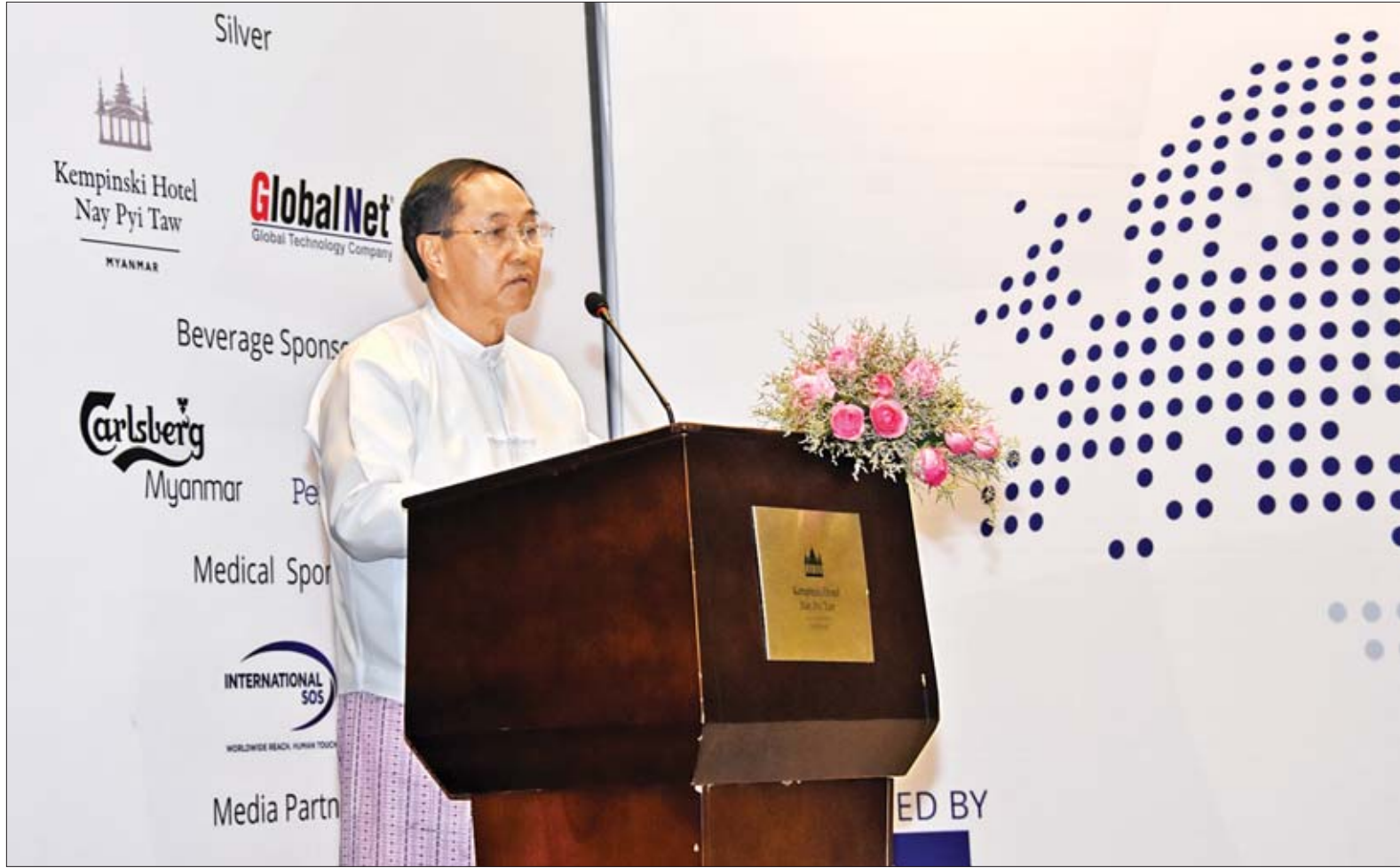
ဒုတိယသမ္မတ ဦးမြင့်ဆွေ တတိယအကြိမ်မြောက် မြန်မာ-အီးယူစီးပွားရေးဗိုလ်ချုပ် ဖွင့်ပွဲအခမ်းအနားတွင် မိန့်ခွန်းပြောကြားစဉ်။

တတိယအကြိမ်မြောက် မြန်မာ-အီးယူစီးပွားရေးဗိုလ်ချုပ် ဖွင့်ပွဲအခမ်းအနားကို ယနေ့နံနက် ၉ နာရီတွင် နေပြည်တော်ရှိ Kempinski ဟိုတယ်၌ ကျင်းပရာ ဒုတိယသမ္မတ ဦးမြင့်ဆွေ တက်ရောက်မိန့်ခွန်းပြောကြားသည်။