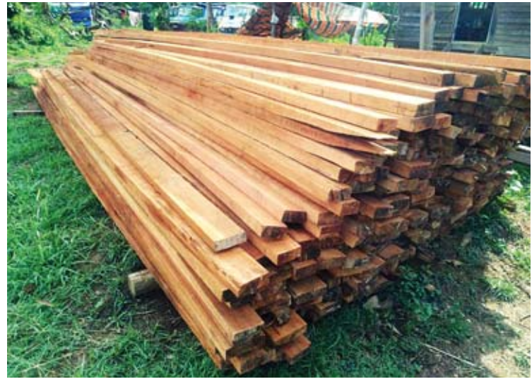
အား ပိုင်ရှင်မှ သိမ်းဆည်းရမိခဲ့ပြီး ဆက်စပ် အရေးယူနိုင်ရေး စီစဉ်ဆောင်ရွက်လျက် သော တရားခံများအား စုံစမ်းရှာဖွေ ရှိကြောင်း သစ်တောဦးစီးဌာနမှ သိရ ဖော်ထုတ်၍ ဥပဒေနှင့်အညီ ထိရောက်စွာ သည်။ မောင်လူမော်

ယာဉ်ပေါ်မှ အင်ဒိုသား ၇ ဒသမ ၁၀၉၈ တန်နှင့် ရှေးဦးမြို့နယ် ရွှေပြည်သာရပ်ကွက် မြို့အဝင် မောင်းတံတိုက်ကားလမ်းမပေါ်ရှိ ယာဉ် နှစ်စီးပေါ်မှ တစ်လက်မခွဲသား ၁ ဒသမ ၂၉၈၈ တန်တို့ကို သိမ်းဆည်းရမိခဲ့ကြောင်း သိရသည်။ ထို့အတူ ဧရာဝတီတိုင်းဒေသကြီး ပုသိမ်ခရိုင် ပုသိမ်မြို့နယ်အတွင်းမှ တောင်သရက်/ဘောင်ဆန် ၃၆ ဒသမ ၂၈၂၄ တန်၊ ရန်ကုန်မြောက်ပိုင်းခရိုင် လှည်းကူးမြို့နယ် ရန်ကုန်-မန္တလေး အမြန်လမ်းမကြီးအနီးရှိ ယာဉ်ပေါ်မှ ကျွန်းတံခါးချပ် ၁၀၅ ချပ် (၁ ဒသမ ၇၀၇၀ တန်)နှင့် ရှမ်းပြည်နယ်(မြောက်ပိုင်း) ကျောက်မဲခရိုင် မလှပင်ချောင်းဘေးမှ ပျဉ်းကတိုး၊ သစ်ရာ၊ အင်ကြင်းသစ် စုစုပေါင်း ၉ ဒသမ ၉၀၄ တန်