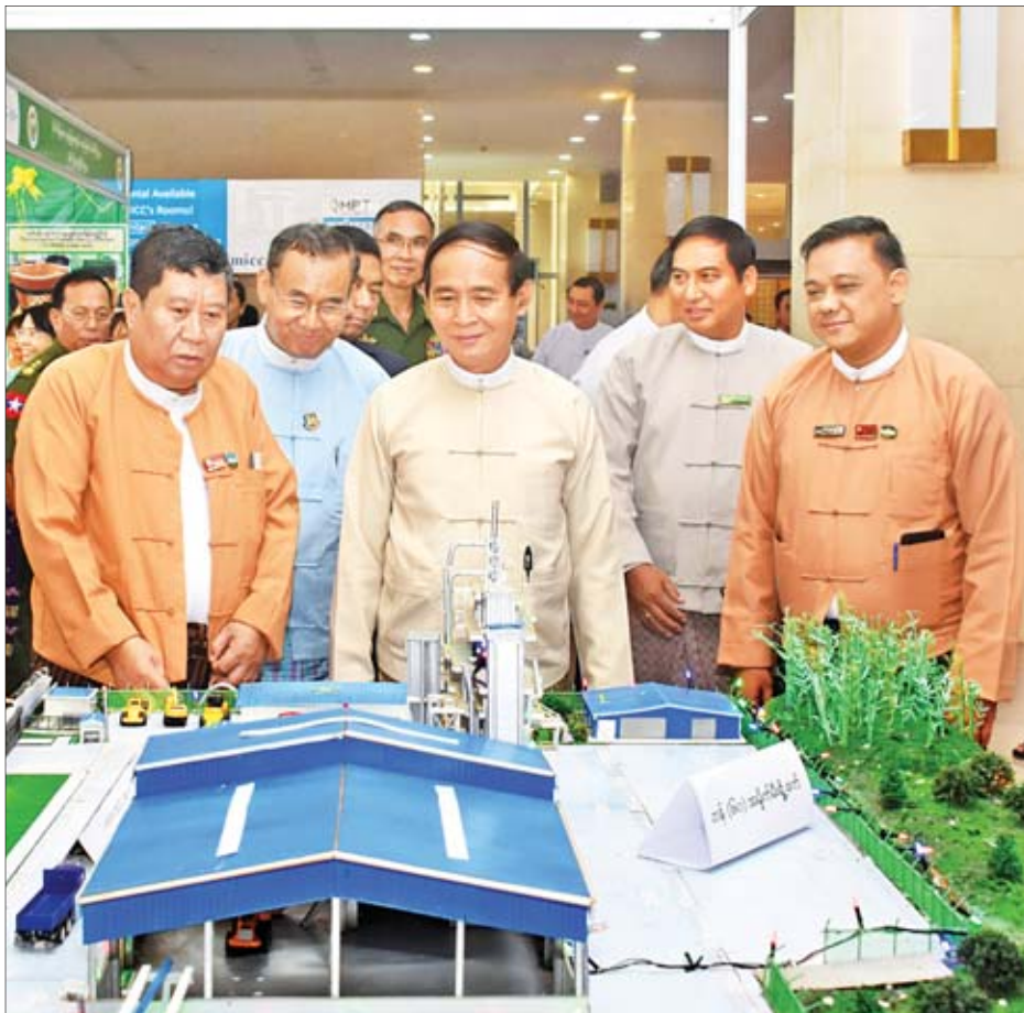
နိုင်ငံတော်သမ္မတ ဦးဝင်းမြင့် ကမ္ဘာ့ပတ်ဝန်းကျင်ထိန်းသိမ်းရေးနေ့ အခမ်းအနားတွင် ခင်းကျင်းပြသထားသော ပတ်ဝန်းကျင်ထိန်းသိမ်းရေးဆိုင်ရာ ဆောင်ရွက်မှုပြကွက်များကို လှည့်လည်ကြည့်ရှုစဉ်။

နေပြည်တော် ၆ နေ့ ၂၀၁၉ ခုနှစ် ကမ္ဘာ့ပတ်ဝန်းကျင်ထိန်းသိမ်းရေးနေ့ အထိမ်းအမှတ် အခမ်းအနားကို ယနေ့နံနက် ၉ နာရီတွင် နေပြည်တော်ရှိ မြန်မာအပြည်ပြည်ဆိုင်ရာကွန်ဗင်းရှင်းဗဟိုဌာန-၂ ၌ ကျင်းပရာ နိုင်ငံတော်သမ္မတ ဦးဝင်းမြင့် တက်ရောက်၍ မိန့်ခွန်းပြောကြားသည်။ အခမ်းအနားသို့ ပြည်ထောင်စုဝန်ကြီးများ၊ နေပြည်တော်ကောင်စီ ဥက္ကဋ္ဌ၊ ဒုတိယဝန်ကြီးများ၊ ဒုတိယ