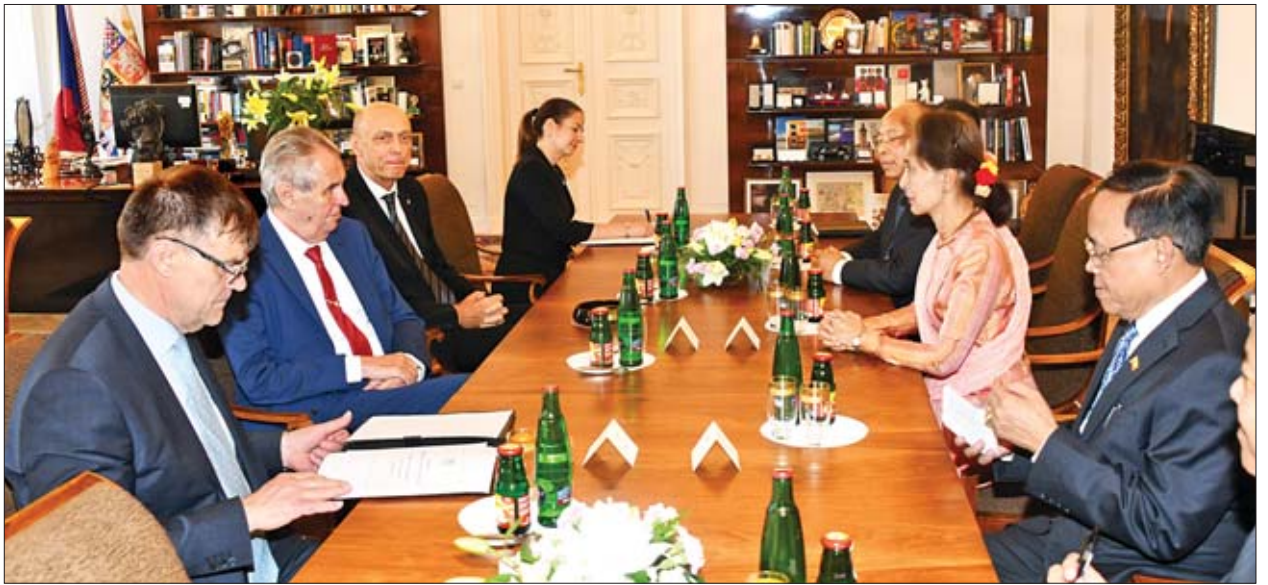
နိုင်ငံတော်၏အတိုင်ပင်ခံပုဂ္ဂိုလ် ဒေါ်အောင်ဆန်းစုကြည်နှင့် ချက်သမ္မတနိုင်ငံသမ္မတ Mr. Milos Zeman တို့ တွေ့ဆုံဆွေးနွေးစဉ်။

ထို့နောက် နိုင်ငံတော်၏အတိုင်ပင်ခံပုဂ္ဂိုလ်သည် ပရဂျက်မြို့ရှိ အမျိုးသားပြတိုက်၌ ကျင်းပသည့် “မြန်မာ့အလှ” ဓာတ်ပုံပြပွဲနှင့်ပွဲသို့ တက်ရောက်၍ အမှာစကားပြောကြားပြီး ဓာတ်ပုံပြပွဲတွင် ပြသထားသည့် မြန်မာနိုင်ငံ၏ သဘာဝတောတောင်အလှဓာတ်ပုံများနှင့် တိုင်းရင်းသားရိုးရာယဉ်ကျေးမှုနှင့် ဓလေ့ထုံးစံများအား ရိုက်ကူးထားသည့် ဓာတ်ပုံများကို လိုက်လံကြည့်ရှုသည်။