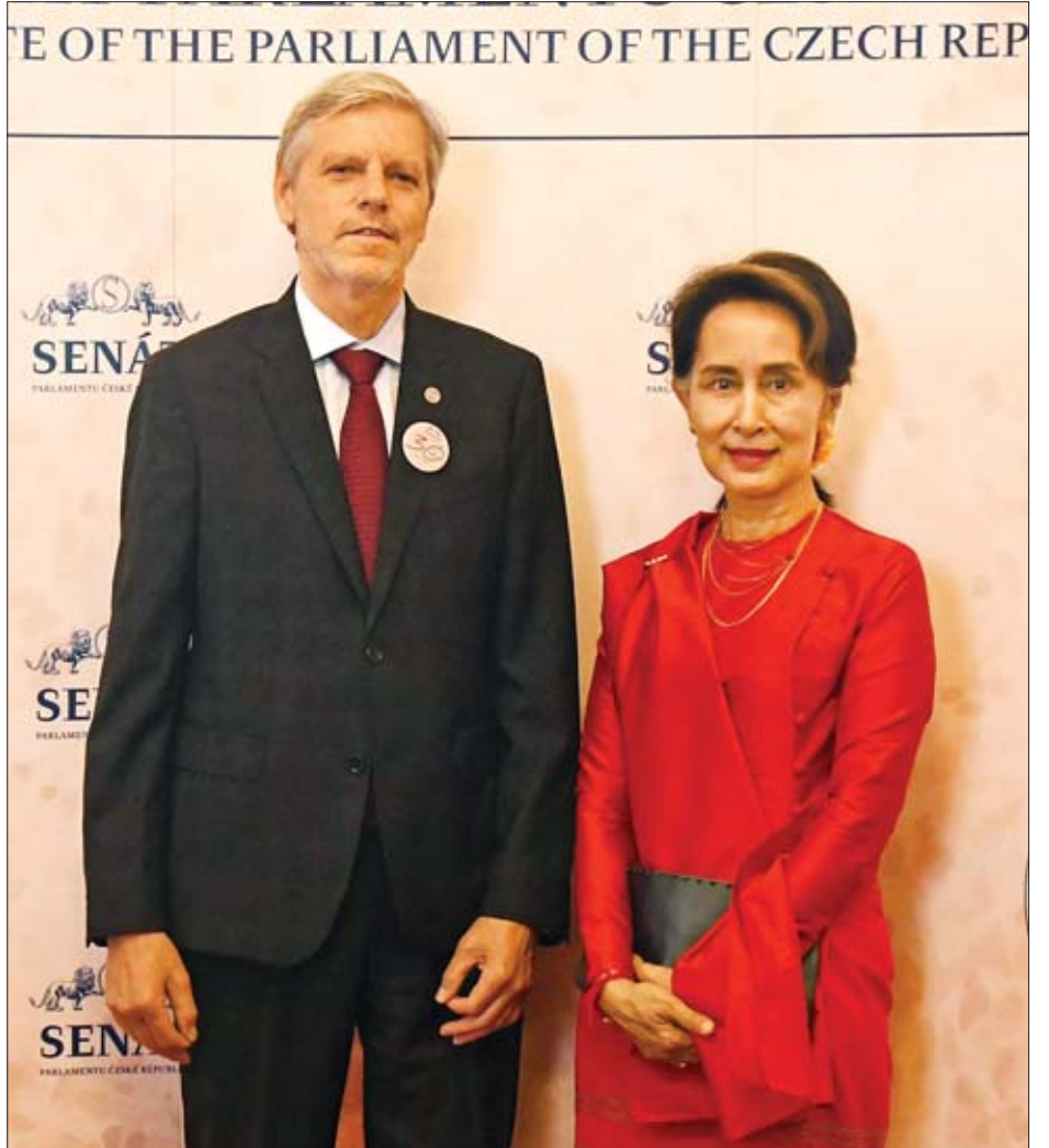
နိုင်ငံတော်၏အတိုင်ပင်ခံပုဂ္ဂိုလ် ဒေါ်အောင်ဆန်းစုကြည်နှင့် ချက်သမ္မတနိုင်ငံ အောက်လွှတ်တော်ဥက္ကဋ္ဌ Mr. Radek Vondracek တို့ တွေ့ဆုံစဉ်။