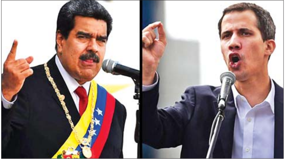
ရွေးကောက်ပွဲတစ်ရပ် ကျင်းပစေရန်ပြောကြားခဲ့သည်။ အလားတူ သမ္မတ မာဒူရိုက လာမည့်ရွေးကောက်ပွဲ အတွင်း မည်သည့်အစီအစဉ်မျှ ရေးဆွဲထားခြင်းမရှိကြောင်း နှင့် လွန်ခဲ့သောနှစ်က ရွေးကောက်ပွဲတွင် ၎င်းအနိုင် ရရှိခဲ့ကြောင်းကို ပြောကြားခဲ့ကြောင်း သိရသည်။ အင်န်အိတ်ချ်က

ပီရူးနိုင်ငံခြားရေးဝန်ကြီး နီစတာ ပိုပိုလီဇီအိုက အဆိုပါအစည်းအဝေး၌ လွတ်လပ်ပြီး တရားမျှတသော