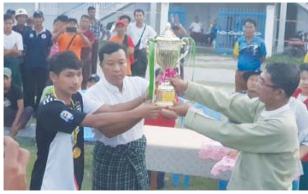
ရွှေဘို ဇွန် ၄ စစ်ကိုင်းတိုင်းဒေသကြီး ရွှေဘိုမြို့တွင် ဇွန် ၂ ရက် ညနေ ၄ နာရီက အမှတ် (၃) ရပ်ကွက် ဘိုကုန်းရပ်ရှိ ရန်ကြီး