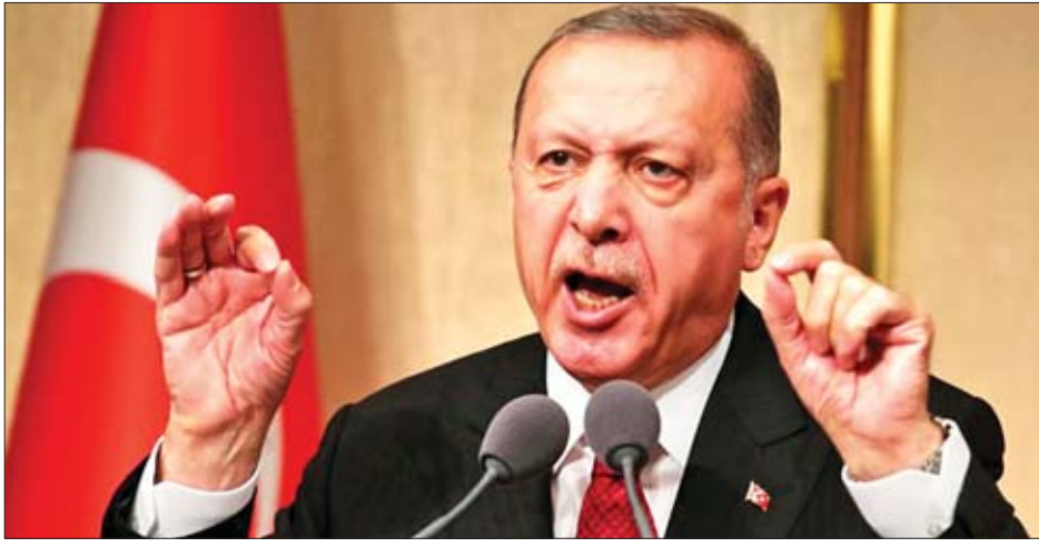
လအတန်ကြာကောင် သတိပေးခဲ့သည်။ လုပ်ခဲ့ပြီးဖြစ်ကြောင်း၊ မိမိတို့ဆုံးဖြတ်ချက်ချခဲ့ပြီးဖြစ် ကြောင်း တူရကီသမ္မတ အာဒိုဂန်၏ပြောကြားမှုကို

တူရကီနိုင်ငံအနေဖြင့် အက်စ်-၄၀၀ အမျိုးအစား ခုံးကျည်စနစ်အား ဝယ်ယူရန် ဆန္ဒရှိနေမှုသည် နေတိုး မဟာမိတ် တူရကီနိုင်ငံနှင့် အမေရိကန်ပြည်ထောင်စု အကြားတွင် အချေအတင်ပြင်းခုံမှုများဖြစ်ပွားစေသည့် ရင်းမြစ်တစ်ခုဖြစ်သည်။ ယင်းခုံးကျည်စနစ် ဝယ်ယူသည့် ကိစ္စနှင့်ပတ်သက်၍ တူရကီနိုင်ငံအား ဒဏ်ခတ်ပိတ်ဆို့မှု များ ချမှတ်မည်ဟု အမေရိကန်ပြည်ထောင်စုက