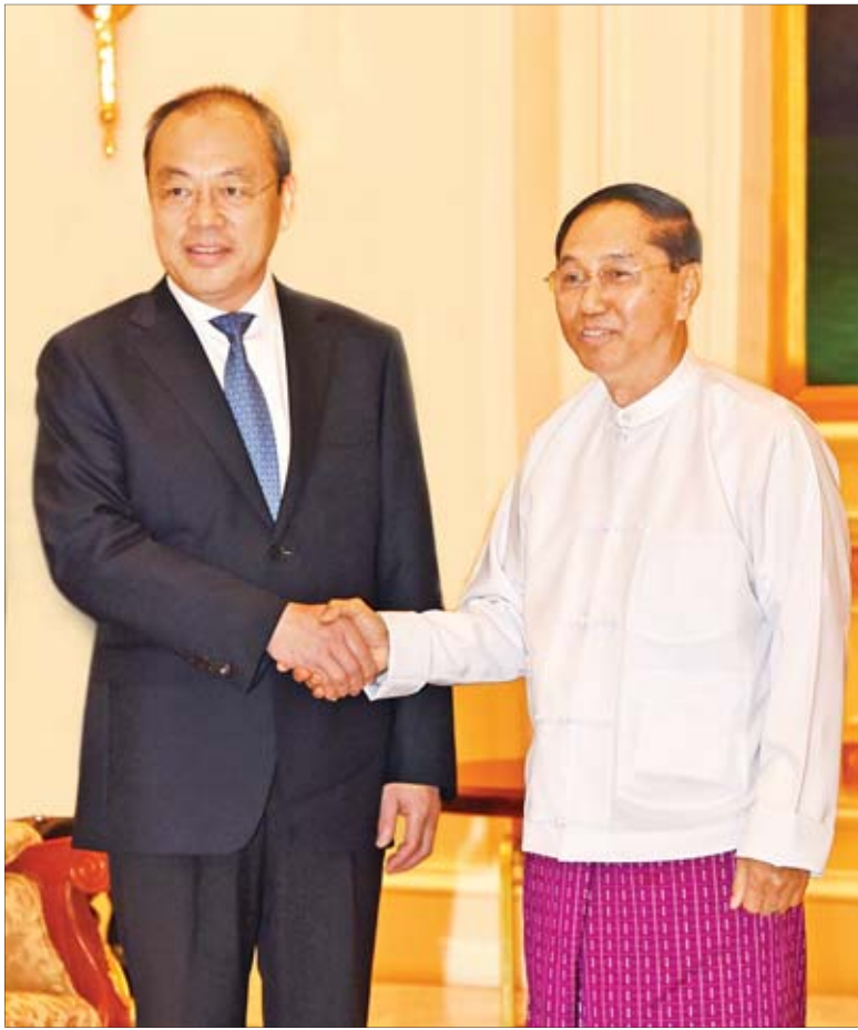
ဒုတိယသမ္မတ ဦးမြင့်ဆွေ တရုတ်ပြည်သူ့သမ္မတနိုင်ငံ ယူနန်ပြည်နယ်အုပ်ချုပ်ရေးမှူး Mr. Ruan Chengfa အား ရင်းရင်းနှီးနှီး နှုတ်ဆက်စဉ်။

တွေ့ဆုံပွဲသို့ စီးပွားရေးနှင့်ကူးသန်းရောင်းဝယ်ရေးဝန်ကြီးဌာန ပြည်ထောင်စုဝန်ကြီး ဒေါက်တာသန်းမြင့်၊ စီမံကိန်းနှင့်ဘဏ္ဍာရေးဝန်ကြီးဌာန ပြည်ထောင်စုဝန်ကြီး ဦးစိုးဝင်းနှင့် တာဝန်ရှိသူများ တက်ရောက်ကြသည်။