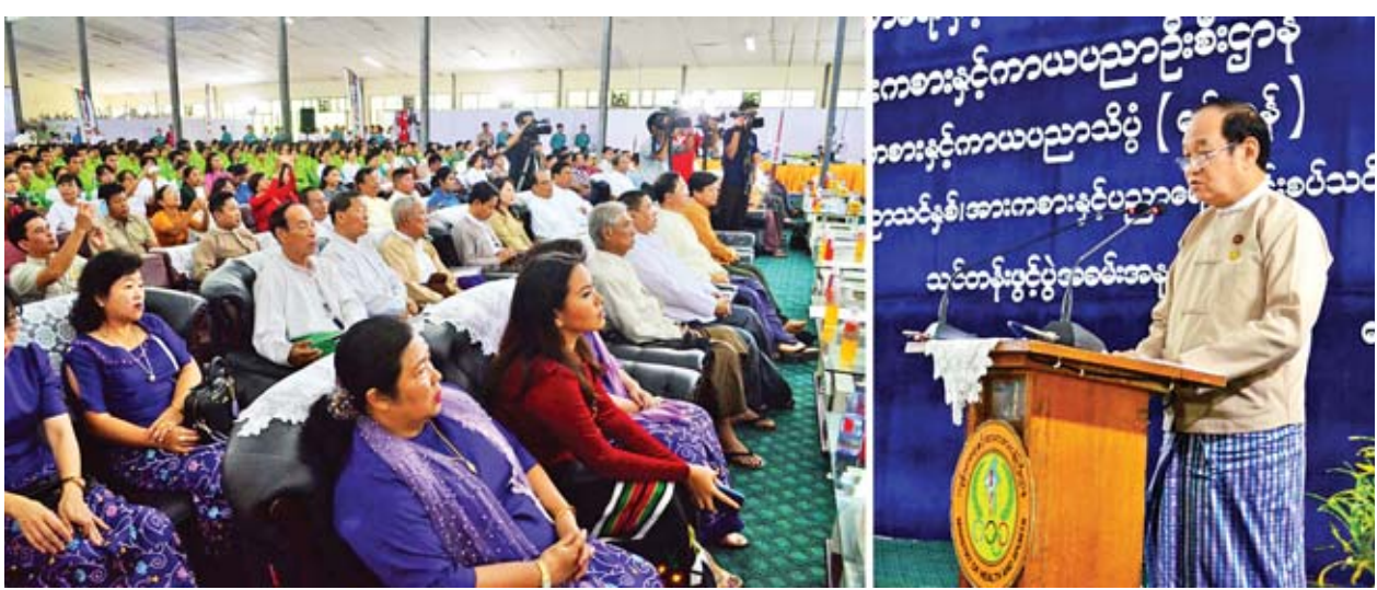
အရည်အချင်း တိုးတက်မှုရှိအောင် သင်ကြားနိုင်စွမ်းရှိသော နည်းပြများအား ရွေးချယ်တာဝန်ပေးအပ်ရမည်ဖြစ်ပါကြောင်း။

သက်ဆိုင်ရာအားကစားနည်းအလိုက် ပြောင်းလဲလာသော နည်းစနစ်၊ နည်းဥပဒေများအရ နည်းပြများသည် ခေတ်နှင့်အညီသင်ကြားမှုပုံစံ ပြောင်းရန်လည်း လိုအပ်ပါကြောင်း၊ နည်းပြများ၏ သင်ကြားမှုစွမ်းရည်ကို လည်း သုံးသပ်ရန်လိုအပ်ပြီး အားကစားနည်းအလိုက် အားကစားသမားများ