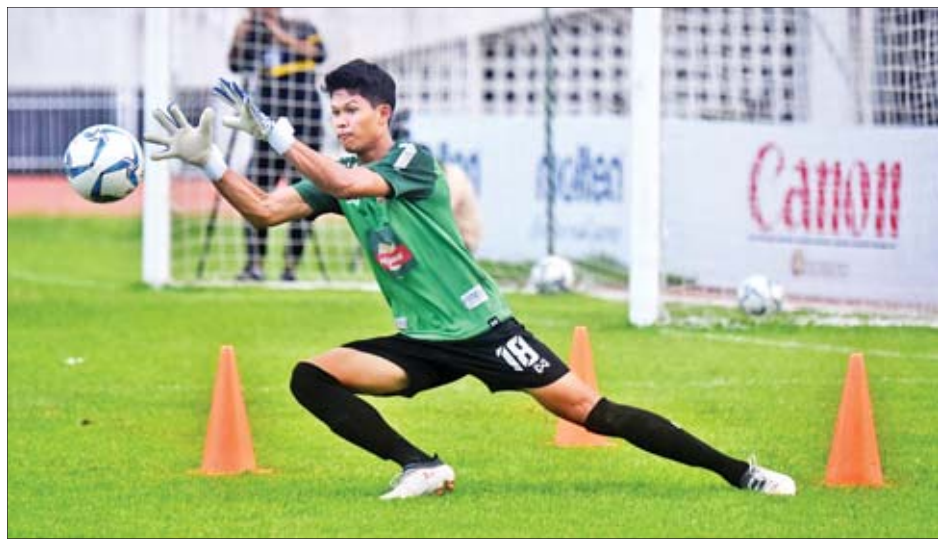
ဇွန် ၄ ရက်က မြန်မာ ယူ-၂၂ အသင်း လေ့ကျင့်နေစဉ်။

ရန်ကုန် ဇွန် ၄ မြန်မာနိုင်ငံဘောလုံးအဖွဲ့ချုပ်နှင့် ဝီယက်နမ်ဘောလုံးအဖွဲ့ချုပ်တို့ ညှိနှိုင်းမှုအရ မြန်မာ ယူ-၂၂ အသင်းနှင့် ဝီယက်နမ် ယူ-၂၂ အသင်းသည် ဇွန် ၇ ရက်တွင် ဝီယက်နမ်နိုင်ငံ၌ ခြေစမ်းပွဲယှဉ်ပြိုင်ကစားမည်ဖြစ်သည်။