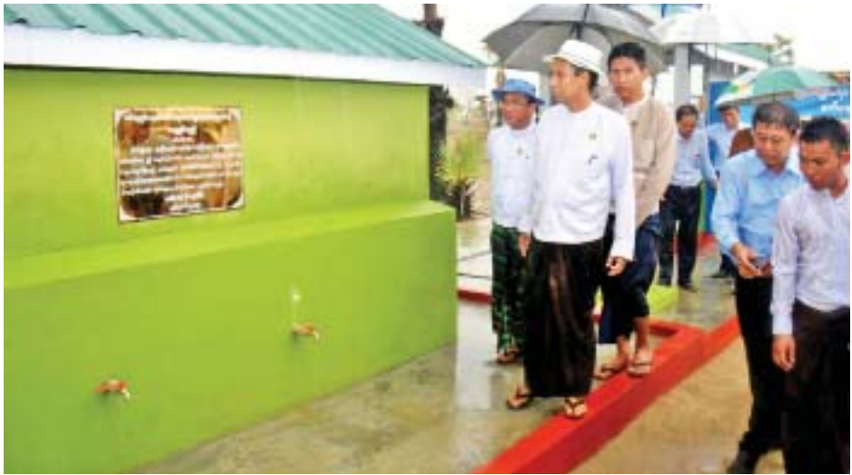
ပြည်ထောင်စုဝန်ကြီး ဒေါက်တာအောင်သူ ဥယျာဉ်စုကျေးရွာတွင် ဆောင်ရွက်ပြီးစီးသော လေးလက်မစက်ရေတွင်းနှင့် ဂါလန် ၁၆၀၀ဆံ့ ရေစုကန်တို့အား ကြည့်ရှုစစ်ဆေးစဉ်။

နေပြည်တော် ၄ ဇွန် ၄ စိုက်ပျိုးရေး၊ မွေးမြူရေးနှင့် ဆည်မြောင်း ဝန်ကြီးဌာန ပြည်ထောင်စုဝန်ကြီး ဒေါက်တာအောင်သူသည် ၄ ဇွန် ၁ ရက် ညနေပိုင်းက မကွေးတိုင်းဒေသကြီး ပခုက္ကူမြို့နယ် အရှေ့ကမ်းခြေအုပ်စု ဥယျာဉ်စုကျေးရွာတွင် စိုက်ပျိုးရေး၊ မွေးမြူရေးနှင့် ဆည်မြောင်းဝန်ကြီး ဌာန မျှဝေခြင်းအစီအစဉ်ဖြင့် ဆောင် ရွက်ပြီးစီးသော လေးလက်မစက်ရေ တွင်းနှင့် ဂါလန် ၁၆၀၀ ဆံ့ ရေစုကန် လွှဲပြောင်းပေးအပ်ပွဲသို့ တက်ရောက် ခဲ့သည်။