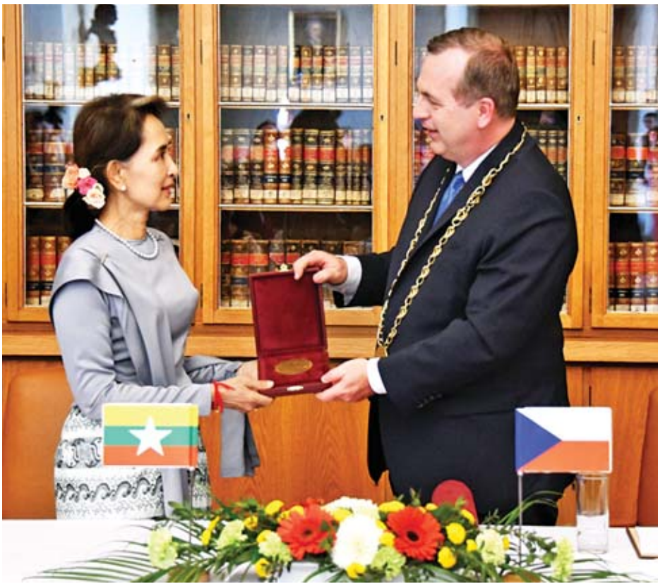
နိုင်ငံတော်၏အတိုင်ပင်ခံပုဂ္ဂိုလ် ဒေါ်အောင်ဆန်းစုကြည်အား Charles University ပါမောက္ခချုပ်က Historical Medal Charles University ဆုတံဆိပ်ကို ဂုဏ်ပြုပေးအပ်စဉ်။

နိုင်ငံတော်၏အတိုင်ပင်ခံပုဂ္ဂိုလ်မှ ၂၀၁၂ ခုနှစ် ကြားဖြတ်ရွေးကောက်ပွဲမှစတင်၍ အမျိုးသား ဒီမိုကရေစီအဖွဲ့ချုပ်ပါတီ ပါဝင်ယှဉ်ပြိုင်ခဲ့ပြီး ၂၀၁၅ ခုနှစ် တွင် အများစုအနိုင်ရရှိကာ အစိုးရဖွဲ့စည်းနိုင်ခဲ့ကြောင်း၊ သို့ရာတွင် ဖွဲ့စည်းပုံအခြေခံဥပဒေမှာ ဒီမိုကရေစီစနစ်များဖြင့် ကိုက်ညီမှုမရှိသည့်အတွက် ပြင်ဆင်ရေးဆွဲနိုင်ရန် ကြိုးပမ်းဆောင်ရွက်လျက်ရှိကြောင်း။