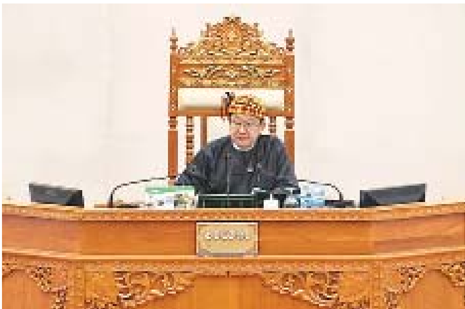
ပြည်ထောင်စုလွှတ်တော် နာယက ဦးတီခွန်မြတ်

ယင်းနောက် ပြည်ထောင်စုလွှတ်တော် နာယကက အဆိုပါ ဥပဒေကြမ်းနှင့်စပ်လျဉ်း၍ လွှတ်တော်က ဆုံးဖြတ်ထားသည့်အတိုင်း ဥပဒေကြမ်းတစ်ရပ်လုံးကို အတည်