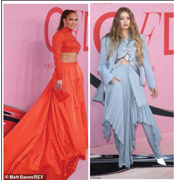
ဇွန် ၃ ရက် ညပိုင်းက နယူးယောက်မှာ ပြုလုပ်ခဲ့တဲ့ 2019 CFDA Fashion Awards ကို တက်ရောက်လာသော ဂျန်ဇာလီမက်စ် (၆) နဲ့ ဂျီဂျီဟာဒစ် (ယာ) တို့ကိုတွေ့ရစဉ်။

လတ်တလောမှာတော့ တောင်ကိုရီးယားရဲ့ ကျော်ကြားတဲ့မင်းသမီးတစ်ဦး ဖြစ်သူ အိုင်ယူဆီကိုကွင်းကို လက်ဆောင်တွေ ရုတ်တရက် ရောက်ရှိလာပါ တယ်။ လက်ဆောင်တွေကတော့ ကော်ဖီနဲ့ အချိုပွဲတွေ၊ အခြားသော စား သောက်ဖွယ်ရာတွေ ဖြစ်ပါတယ်။ လက်ဆောင်တွေကြောင့်အဲဒါအားသင့်ခဲ့ရပြီး ဒီလက်ဆောင်တွေကိုတော့ မင်းသမီး ဆောင်းဟေကိုက ပေးပို့ခဲ့တာ ဖြစ်ပါ တယ်လို့ ကိုရီးယားဘိုးဒေါက်ကွန်းရဲ့ ရေးသားဖော်ပြချက်တွေအရ သိရပါတယ်။ အိုင်ယူဟာ “Hotel Deluna” ရုပ်ရှင်ကို ရိုက်ကူးနေတာဖြစ်ပြီး ညဘက်တွေမှာ နောက်ကျတဲ့အထိ အလုပ်လုပ်ကြရတဲ့ ရိုက်ကူးရေးသမားတွေ အတွက်ပါ ဆောင်းဟေကိုက စားစရာတွေ ပေးပို့ခဲ့တာဖြစ်တယ်လို့လည်း သိရပါတယ်။ ဆောင်းဟေကိုဟာ သူ့ရဲ့ပတ်ဝန်းကျင်ကလူတွေကို ဂရုစိုက် တတ်သူတစ်ဦးဖြစ်ပြီး ခင်မင်ရတဲ့ သူငယ်ချင်းတစ်ဦးဖြစ်သူ အိုင်ယူအတွက် လည်း ယခုလို လက်ဆောင်တွေ ပေးပို့ခဲ့တာပါ။ ဒီလို လက်ဆောင်တွေ လက်ခံရရှိခဲ့တာကြောင့် ကျေးဇူးတင်ကြောင်း အိုင်ယူက သူ့ရဲ့ လူမှုကွန်ရက်စာမျက်နှာပေါ်မှာ ရေးသားဖော်ပြတာ ဆောင်းဟေကိုဆီ ပြန်လည်ပေးပို့ခဲ့တယ်လို့လည်း သိရပါတယ်။ အေးပြည့်-စုစည်းသည်