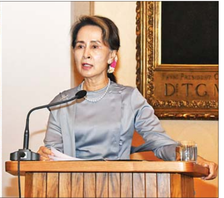
နိုင်ငံတော်၏အတိုင်ပင်ခံပုဂ္ဂိုလ် ဒေါ်အောင်ဆန်းစုကြည် Charles University ၌ “ဒီမိုကရေစီစနစ်သို့ အသွင်ကူးပြောင်းမှုတွင် ကြံ့တော့ရသော စိန်ခေါ်မှုများ” ခေါင်းစဉ်ဖြင့် ဟောပြောပို့ချစဉ်။