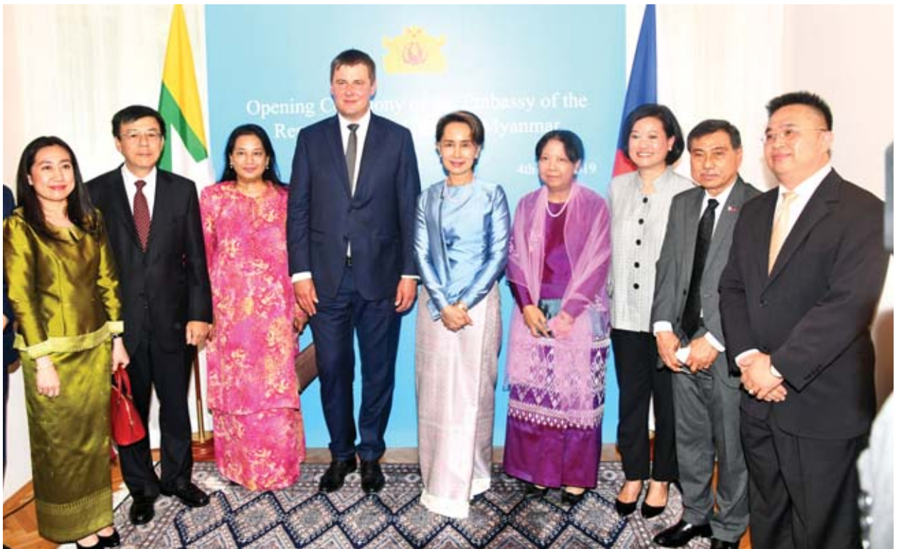
နိုင်ငံတော်၏အတိုင်ပင်ခံပုဂ္ဂိုလ် ဒေါ်အောင်ဆန်းစုကြည်နှင့် ချက်သမ္မတနိုင်ငံ နိုင်ငံခြားရေးဝန်ကြီး Mr. Tomas Petricek တို့ ချက်သမ္မတနိုင်ငံ ဆိုင်ရာ မြန်မာနိုင်ငံသံရုံးဖွင့်ပွဲတွင် အာဆီယံနိုင်ငံများမှ သံအမတ်ကြီးများနှင့်အတူ မှတ်တမ်းတင်ဓာတ်ပုံရိုက်စဉ်။

ယင်းနောက် နိုင်ငံတော်၏အတိုင်ပင်ခံပုဂ္ဂိုလ်နှင့် ချက်နိုင်ငံခြားရေးဝန်ကြီး Mr. Tomas Petricek တို့သည် အမှာစကားပြောကြားကြပြီး သံရုံးဖွင့်ပွဲသို့ တက်ရောက်လာကြသည့် အာဆီယံနိုင်ငံများမှ သံအမတ်ကြီးများနှင့်အတူ မှတ်တမ်းတင်ဓာတ်ပုံရိုက်သည်။