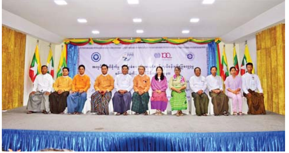
မန္တလေးတိုင်းဒေသကြီး သယံဇာတနှင့် သဘာဝပတ်ဝန်းကျင်ထိန်းသိမ်းရေးနှင့် အလုပ်သမားရေးရာဝန်ကြီး ဦးမျိုးသစ် အခမ်းအနားတက်ရောက်လာသူများနှင့်အတူ မှတ်တမ်းတင်ဓာတ်ပုံရိုက်စဉ်။

လူမှုဖူလုံရေးအဖွဲ့အနေဖြင့် အလုပ်တွင်ထိခိုက်မှုအကျိုးခံစားခွင့်အာမခံစနစ်လုပ်ငန်း ဖြေလျှော့မှု