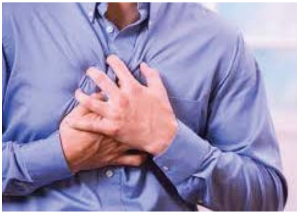
ရုံမက သွေးတိုးရောဂါကိုပါ ဖြစ်လွယ်စေသည်။

သုံးဆယ်လေးစက္ကန့်တိုင်း တစ်ဦးနှုန်း သေဆုံးနေသောရောဂါ ထိတ်လန့်ဖွယ် သတင်းတစ်ပုဒ်။ နှလုံးနှင့်သွေးကြောဆိုင်ရာရောဂါများကြောင့် ကမ္ဘာပေါ်တွင် အချိန် ၃၄ စက္ကန့်တိုင်း လူတစ်ဦးနှုန်း အသက်ဆုံးရှုံးလျက်ရှိပြီး ယင်းသေဆုံးသူများ အနက် နှလုံးသွေးကြောကျဉ်းရောဂါကြောင့် သေဆုံးမှုသည် အများဆုံးဖြစ်ကြောင်း ဧပြီလ ၂၉ ရက်နေ့ထုတ် ကြေးမုံသတင်းစာတွင် ဖော်ပြခဲ့သည်။