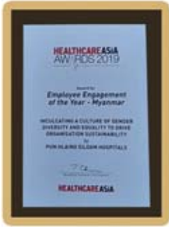
Employee Engagement of the Year - Myanmar