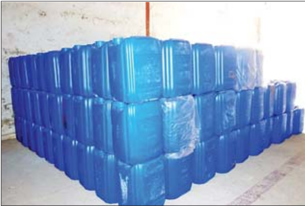
အဆိပ်ပြင်းသည့် ဓာတ်ပေါင်းပစ္စည်းအရည်များဟု ယူဆရသော ဓာတု ပစ္စည်းများအား စစ်ဆေးတွေ့ရှိပြီး တာဝန်ရှိသူများက ဆက်လက်စစ်ဆေး ဆောင်ရွက်လျက်ရှိကြောင်း သိရသည်။

ဖြစ်စဉ်မှာ မေ ၂၈ ရက်တွင် မူဆယ်မှ မန္တလေးသို့ ထွက်ခွာလာ သည့်(ယာဉ်မောင်းနှင့် နေရပ်လိပ်စာ စုံစမ်းစစ်ဆေးနေဆဲ) ယာဉ်သည် မူဆယ်မြို့မှ မန္တလေးသို့ ပြည်ထောင်စုလမ်းမကြီးအတိုင်း မောင်းနှင်လာစဉ် ကုန်သွယ်ရေးဇုန် လားရှိုးမောင်းတံအနီးတွင် တာဝန်ကျပ်ဝန်ထမ်းများက ရပ်တန့်စစ်ဆေးရာ ယာဉ်မောင်းဖြစ်သူမှာ ထွက်ပြေးတိမ်းရှောင်သွားခဲ့ကြောင်း သိရသည်။ ကုန်သွယ်ရေးဇုန်အတွင်း တာဝန်ကျပ်အကောက်ခွန်ဝန်ထမ်းများ နှင့် မြန်မာနိုင်ငံရဲတပ်ဖွဲ့ဝင်များဦးစီး၍ ကုန်တင်၊ ကုန်ချလုပ်သားများဖြင့် ယာဉ်၏အပေါ်အဖုံးကို ဖွင့်ဖောက်ကြည့်ရှုစစ်ဆေးခဲ့ရာ အတွင်းအခွက်များထဲ၌ ပလတ်စတစ်ကော်ပုံး(အပြာရောင်)များဖြင့် ထည့်ထားသည့် ဆိုင်ယာနိုက်