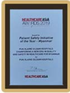
Patient Safety Initiative of the Year - Myanmar