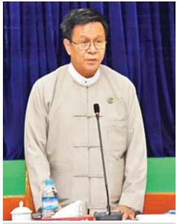
ဒုတိယဝန်ကြီး ဦးအောင်ထူး ရှင်းလင်းပြောကြားစဉ်။

လုပ်ငန်းများ ဖွံ့ဖြိုးတိုးတက်ရေးအတွက် E-Trade Readiness Survey ကို UNCTAD အကူအညီဖြင့် ဆောင်ရွက်ခဲ့ပြီး E-Commerce ထူထောင်ရေး၊ ဆိုက်ဘာလုံခြုံရေးဥပဒေတွင် အီးကောမတ်ဆိုင်ရာ ပြဋ္ဌာန်းချက်များ ပါဝင်နိုင်ရေးကို ပူးပေါင်းဆောင်ရွက်လျက်ရှိပါကြောင်း၊ ပုဂ္ဂလိကကဏ္ဍအနေဖြင့်လည်း Digital Economy Association အဖွဲ့တစ်ရပ် ဖွဲ့စည်းနိုင်ရေး