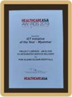
ICT Initiative of the Year - Myanmar

လူနာများ၏ ကျန်းမာရေး ဘေးကင်းလုံခြုံစိတ်ချရမှုကို ဦးစားပေးဆောင်ရွက်နေသည့် မြန်မာနိုင်ငံ၏ တစ်ခုတည်းသော နိုင်ငံတကာအသိအမှတ်ပြု JCI (Joint Commission International) လက်မှတ်ရ ပန်းလှိုင်စီလုံဆေးရုံကြီးသည် ၂၀၁၉ ခုနှစ် မေလ (၂၅) ရက်နေ့တွင် Healthcare Asia အဖွဲ့မှ စင်ကာပူနိုင်ငံတွင် ကျင်းပခဲ့သော Healthcare Asia Awards 2019 ဆုပေးပွဲအခမ်းအနားကြီးတွင် ဆုကြီး (၄) ဆုကို ထိုက်ထိုက်တန်တန် ဂုဏ်ပြုချီးမြှင့်ခြင်းခံရသည့်အတွက် အထူးဂုဏ်ယူဝမ်းမြောက်မိပါကြောင်းနှင့် မြန်မာနိုင်ငံနှင့် မြန်မာ ပြည်သူများအတွက် နိုင်ငံတကာ အဆင့်မီ ကျန်းမာရေးစောင့်ရှောက်မှုများကို ဆက်ထမ်းပိုးဆောင်ရွက်နိုင်ပါစေကြောင်း ဆုမွန်ကောင်းပေးပို့အပ်ပါသည်။