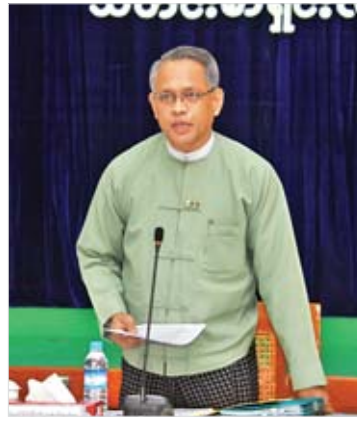
အမြဲတမ်းအတွင်းဝန် ဦးအောင်နိုင်ဦး ရှင်းလင်းပြောကြားစဉ်။

ကြီးကြပ်ရေးကော်မရှင်းအနေဖြင့် ရန်ကုန် စတော့အိတ်ချိန်း စာရင်းဝင်ကုမ္ပဏီများ တိုးပွားလာစေရန်နှင့် စာရင်းဝင်ရောက်ရန် စိတ်ဝင်စားသည့် ကုမ္ပဏီများကို ကူညီ ဆောင်ရွက်ရန် အထူးလုပ်ငန်းအဖွဲ့ (Special Task Force for Listing Promotion -STF) ကို ဖွဲ့စည်းနိုင်ခဲ့ပါကြောင်း။