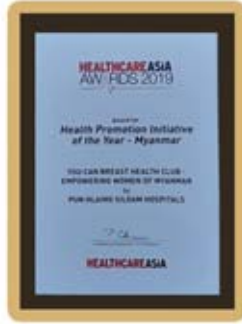
Health Promotion Initiative of the Year - Myanmar