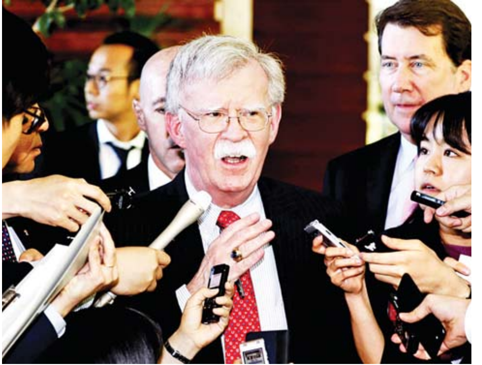
ဆော်ဒီအာရေဗျနိုင်ငံ၏ အရှေ့နှင့် အနောက်အရပ်ဒေသများအား ဆက်သွယ်ထားသည့် ယင်းရေနံပိုက်လိုင်းသည် တစ်နေ့လျှင် ရေနံစည်ငါးသန်း ပို့လွှတ်နိုင်ပြီး ဆော်ဒီအာရေဗျနိုင်ငံအရှေ့ပိုင်းရှိ ရေနံမြေမှ ပင်လယ်နိမ့်ကမ်းခြေ ပင်လယ်ဆိပ်ကမ်းသို့ သွယ်တန်းထားခြင်းဖြစ်သည်။ ဟူသီသူပုန်တို့၏ မောင်းသွပ်လေယာဉ်ဖြင့် တိုက်ခိုက်မှုကြောင့် ယင်းရေနံပိုက်လိုင်းမှ ရေနံပို့လွှတ်မှုကို နှစ်ရက်ကြာရပ်နားခဲ့သည်။

ရေနံတင်သင်္ဘောများ တိုက်ခိုက်ခံရပြီး နှစ်ရက်အကြာတွင် ဆော်ဒီအာရေဗျနှင့် အာရပ်စော်ဘွားများ ပြည်ထောင်စု(ယူအေအီး)တို့က အီရန်၏ ရုပ်သေးရုပ်အဖြစ် စွပ်စွဲထားသည့် ယီမင်နိုင်ငံတွင်းရှိ ဟူသီသူပုန်များက ဆော်ဒီအာရေဗျနိုင်ငံအတွင်းရှိ မဟာဗျူဟာကျသည့်ရေနံပိုက်လိုင်းကို မောင်းသွပ် လေယာဉ်နှစ်စင်းအသုံးပြု၍ တိုက်ခိုက်ခဲ့သည်ဟု ပြောကြားခဲ့သည်။