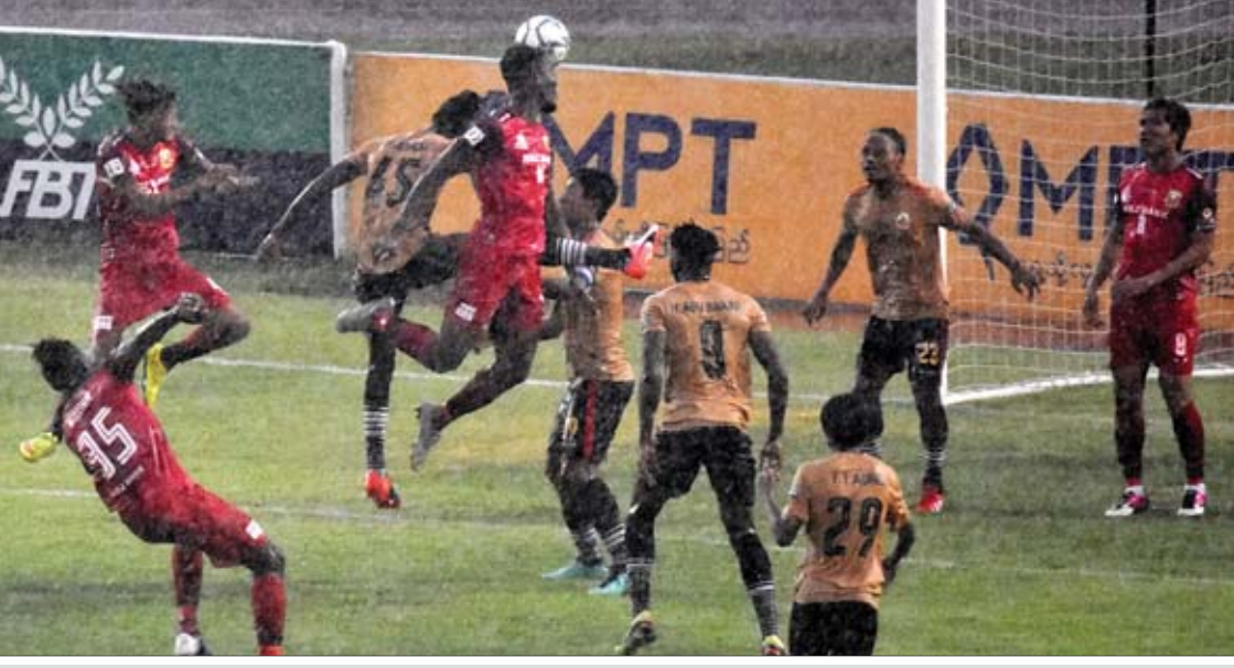
ရှမ်းယူနိုက်တက်နှင့် ရခိုင်အသင်း ပထမအကျော့ တွေ့ဆုံခဲ့စဉ်။

ရန်ကုန် မေ ၂၉ ၂၀၁၉ ရာသီ ဗိုလ်ချုပ်အောင်ဆန်းဒိုင်း ရှမ်းထွက်ပြိုင်ပွဲ ဆီမီးဖိုင်နယ် ဒုတိယအကျော့ပွဲစဉ်များကို ဇွန် ၁ ရက်နှင့် ၂ ရက်တို့တွင် ကျင်းပမည်ဖြစ်ပြီး ဗိုလ်လှပွဲတက်ရောက်ရေးအတွက် အားကုန်ထုတ်ကစားရမည်ဖြစ်သည်။ ဒုတိယအကျော့ပွဲစဉ်များအဖြစ် ဇွန် ၁ ရက်တွင် ရခိုင်အသင်း၏ အိမ်ကွင်းဖြစ်သော ဝေသာလီကွင်း၌ ရခိုင်အသင်းနှင့် ရှမ်းယူနိုက်တက်တက်အသင်း၊ ဇွန် ၂ ရက်တွင် ရန်ကုန်အသင်း၏ အိမ်ကွင်းဖြစ်သည့် YUSC ကွင်း၌ ရန်ကုန်အသင်းနှင့် စစ်ကိုင်းအသင်းတို့ ယှဉ်ပြိုင်ကစားမည်ဖြစ်သည်။ ပထမအကျော့တွင် ရှမ်းယူနိုက်တက်အသင်းက ရခိုင်အသင်းကို လေးဂိုးဂိုးမရှိဖြင့် အနိုင်ရရှိခဲ့ပြီး စစ်ကိုင်းနှင့် ရန်ကုန်အသင်းတို့ တစ်ဂိုးစီသာ ရေကျခဲ့သည်။ စာမျက်နှာ ၁၃ ကော်လံ ၅ သို့ >>>