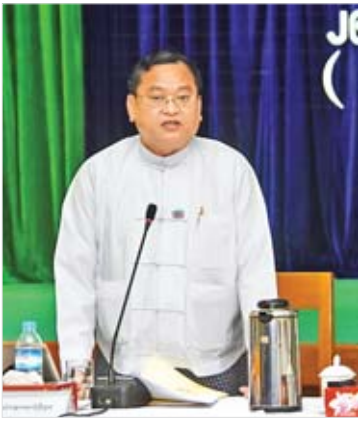
အမြဲတမ်းအတွင်းဝန် ဦးထွန်းထွန်းနိုင် ရှင်းလင်းပြောကြားစဉ်။

အကောက်ခွန်ဦးစီးဌာနအနေဖြင့် သွင်း ကုန်၊ ပို့ကုန်လုပ်ငန်းများကို ယခင် Manual