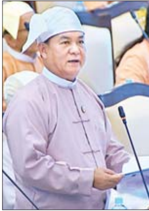
ဒုတိယဝန်ကြီး ဦးကြည်မင်း

ချင်းပြည်နယ် မဲဆန္ဒနယ်အမှတ် (၁၂) မှ ဦးမျိုးထင်(ခ) ဆလင်းမျိုးထိုက်၏ ချင်းပြည်နယ်၊ ပလက်ဝမြို့နယ်၌ ၂၀၁၈ခုနှစ်၊ ဇွန်လတွင် မူလတန်းပြ (နေ့စားလပေး) လျှောက်လွှာခေါ်ယူပြီး မြို့နယ်အတွင်းရှိ နေထိုင်နေသူများအား တက္ကသိုလ်ဝင်တန်းအောင်နှင့် ဘွဲ့ရများ (၃၅၀၀)ကျော် လျှောက်ထားဖြေဆိုခဲ့ကြသော်လည်း ၂၀၁၉ ခုနှစ် ဖေဖော်ဝါရီ ၂၀ ရက်အထိ ခန့်ထားခြင်းမရှိသည့် အတွက် ၂၀၁၉-၂၀၂၀ ပညာသင်နှစ်မတိုင်မီ ခန့်ထားပေးရန် အစီအစဉ် ရှိ၊ မရှိ မေးခွန်းနှင့်စပ်လျဉ်း၍ ဒုတိယဝန်ကြီး ဦးဝင်းမော်ထွန်းက ချင်းပြည်နယ်၊ ပလက်ဝမြို့နယ်အတွင်း အခြေခံပညာကျောင်းများတွင် မူလတန်းပြ ဆရာလိုအပ်မှုရှိခြင်းကြောင့် သင်ကြားရေးအထောက်အကူပြု နေ့စားလပေးများ