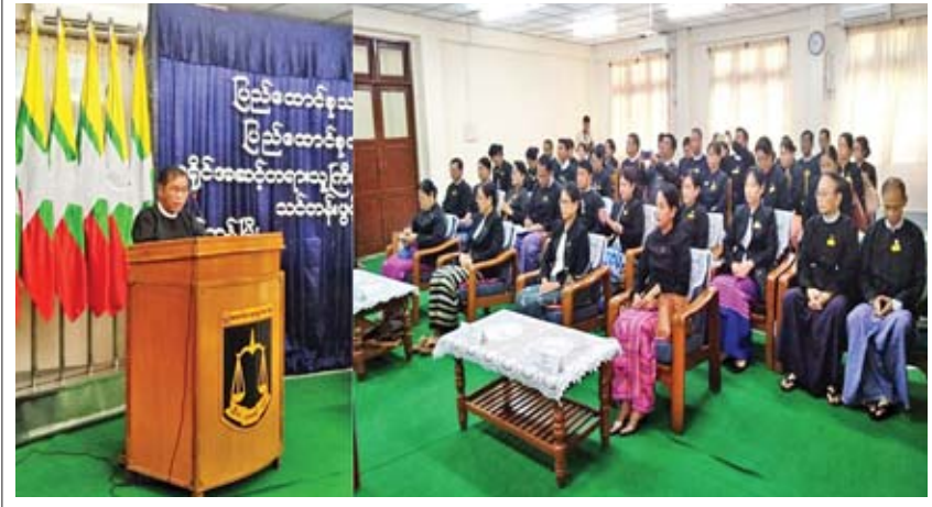
ရန်ကုန် မေ ၂၇ ခရိုင်အဆင့် တရားသူကြီးများ မွမ်းမံသင်တန်း