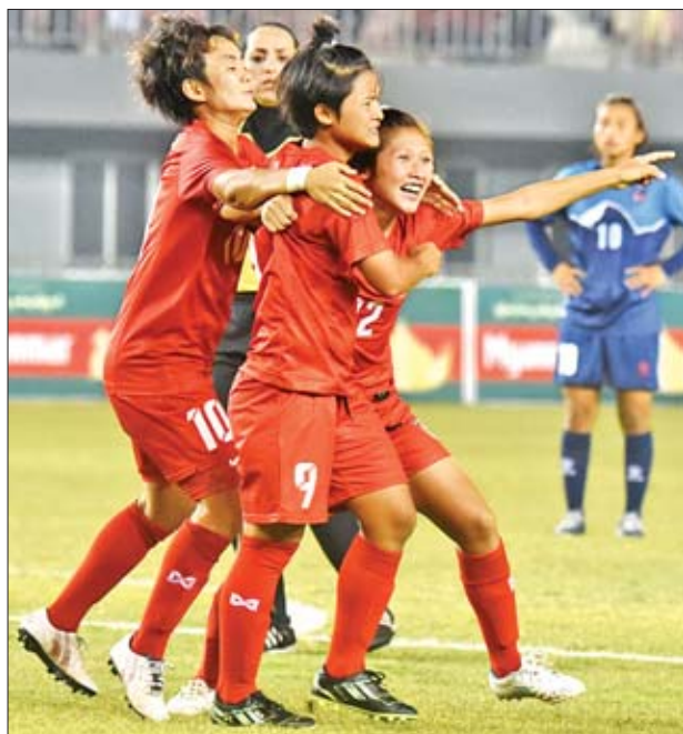
၂၀၁၉ အာရှ ယူ-၁၉ အမျိုးသမီးပြိုင်ပွဲ ယှဉ်ပြိုင်ခွင့်ရထားသည့် မြန်မာ အမျိုးသမီးအသင်းကို တွေ့ရစဉ်။