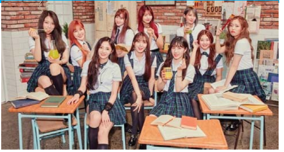
အေးပြည့် - စုစည်းသည်

တောင်ကိုရီးယားအမျိုးသမီးတေးဂီတအဖွဲ့တစ်ဖွဲ့ဖြစ်တဲ့ “PRISTIN” ဟာ လတ်တလောမှာတော့ အဖွဲ့ဖျက်သိမ်းလိုက်ပြီဖြစ်ကြောင်း တရားဝင်ကြေညာခဲ့တာ ဖြစ်ပါတယ်။ အဖွဲ့ဖျက်သိမ်းလိုက်ကြောင်းကိုတော့ မေ ၂၄ ရက်မှာ ဒေသတွင်းမီဒီယာတစ်ခုက စတင်ရေးသားဖော်ပြခဲ့တာဖြစ်ကြောင်း စွန်ပီဒေါ့ကွန်းရဲ့ ရေးသားဖော်ပြချက်တွေအရ သိရပါတယ်။ “PRISTIN” အဖွဲ့ဝင်တွေနဲ့ အဖွဲ့ခွဲအေဂျင်စီဟာ ဆွေးနွေးမှုတွေပြုလုပ်ခဲ့ပြီးနောက်မှာတော့ အဖွဲ့ဖျက်သိမ်းဖို့ရာ ဆုံးဖြတ်ခဲ့ကြတာဖြစ်တယ်လို့လည်း သိရပါတယ်။ အဖွဲ့ခွဲ ဖျော်ဖြေရေးအေဂျင်စီဖြစ်တဲ့ ဘက်အိအန်တာတီနီးမန်ကလည်း အဖွဲ့ဖျက်သိမ်းလိုက်ကြောင်း၊ သတင်းတွေမှန်ကန်ကြောင်း အတည်ပြုပြောကြားခဲ့တာ ဖြစ်ပါတယ်။ အေဂျင်စီရဲ့ ပြောကြားချက်အရ အဖွဲ့ဝင် ၁၀ ဦးပါဝင်တဲ့ “PRISTIN” မှ အဖွဲ့ဝင်ခုနစ်ဦးဟာ အေဂျင်စီနဲ့ စာချုပ်သစ်ထပ်မံချုပ်ဆိုခြင်းမရှိဘဲ လမ်းခွဲခွဲပြီဖြစ်ပါတယ်။ ကျန်အဖွဲ့ဝင်သုံးဦးကတော့ လက်ရှိအေဂျင်စီနဲ့ လက်တွဲကာ အနုပညာလှုပ်ရှားမှုတွေ ဆက်လက်လုပ်ဆောင်သွားမှာဖြစ်တယ်လို့ သိရပါတယ်။ “PRISTIN” ဟာ ၂၀၁၇ ခုနှစ်အတွင်း အနုပညာလှုပ်ရှားမှုတွေကို စတင်လုပ်ဆောင်ခဲ့တာဖြစ်ပါတယ်။ အဖွဲ့ရဲ့ အနုပညာသက်တမ်းတစ်လျှောက် မိနီတေးအယ်လ်ဘမ်နှစ်ခုကို ထုတ်လွှင့်ခဲ့ပြီး ပွဲဦးထွက်တေးအယ်လ်ဘမ်ဖြင့်ပင် ထူးချွန်ဆုတွေကိုလည်း ဆွတ်ခူးနိုင်ခဲ့ပါတယ်။