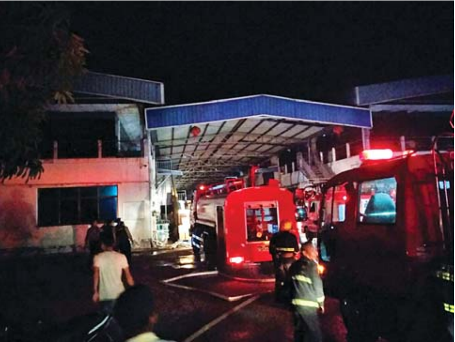
စက်ရုံ၏ မီးကြွင်းမီးကျန်များကို မီးလောင်ရခြင်း အကြောင်းရင်းကို ကြောင်း ကနဦးသတင်းအရ သိရ ပြည်သူ့အထိ ငြိမ်းသတ်ခဲ့ပြီး ဆက်လက်စုံစမ်းစစ်ဆေးလျက်ရှိ သည်။ သတင်းနှင့်စာတတ်ပုံ-သစ္စာ

ရန်ကုန် မေ ၂၇ ရန်ကုန်မြောက်ပိုင်းခရိုင် လှိုင်သာယာ စက်မှုဇုန်(၄)ရှိ ကျွန်စစ်သားလမ်းမ ပေါ်ရှိ အထည်ချုပ်စက်ရုံတစ်ရုံ မီးလောင်မှုဖြစ်ပွားကြောင်း သိရ သည်။ မေ ၂၇ ရက် ညနေပိုင်းက လှိုင်သာယာမြို့နယ်တွင် မိုးရွာသွန်း ခဲ့ပြီး ည ၉ နာရီ ၅ မိနစ်ခန့်တွင် စက်မှုဇုန် (၄) ကျွန်စစ်သားလမ်းမကြီး ပေါ်ရှိ ROO HSING အထည်ချုပ် စက်ရုံ မီးလောင်မှုဖြစ်ပွားခဲ့ခြင်း ဖြစ်သည်။ အဆိုပါမီးလောင်ရာသို့ မီးငြိမ်း သတ်ယာဉ် ၂၆ စီး၊ အထောက် အကူပြုယာဉ် ရှစ်စီး၊ ကွပ်ကဲမှု ယာဉ် ခုနစ်စီးဖြင့် မြန်မာနိုင်ငံမီးသတ် တပ်ဖွဲ့ ညွှန်ကြားရေးမှူး ဦးသိန်းထွန်း ဦးစီး၍ ငြိမ်းသတ်ခဲ့ရာ ည ၉ နာရီ ၃၅ မိနစ်တွင်မီးငြိမ်းခဲ့ပြီး Level-2 ဖြင့် ငြိမ်းသတ်နိုင်ခဲ့ခြင်းဖြစ်သည်။