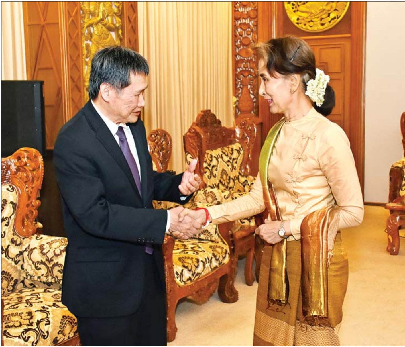
နိုင်ငံတော်၏အတိုင်ပင်ခံပုဂ္ဂိုလ် ဒေါ်အောင်ဆန်းစုကြည် အာဆီယံအတွင်းရေးမှူးချုပ် ဒါတိုလင်ကျောက်ဟိုင်အား ရင်းရင်းနှီးနှီး နှုတ်ဆက်စဉ်။