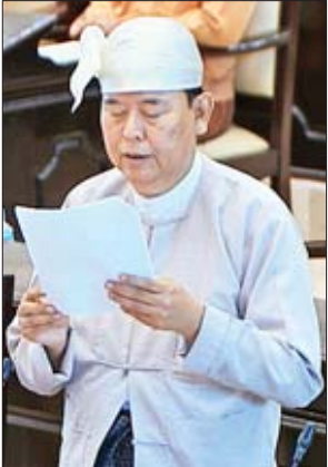
ဒုတိယဝန်ကြီး ဦးဝင်းမော်ထွန်း