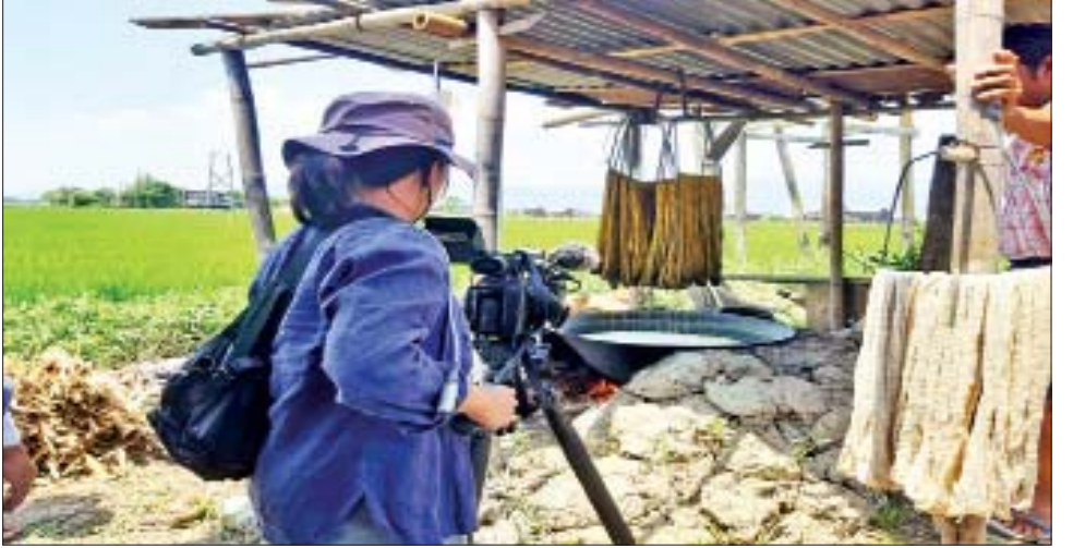
ဂျပန်ရိုက်ကူးရေးအဖွဲ့ မိုင်းပျိုးရွာ၌ ချည်ထည်များ ဆေးဆိုးလုပ်ငန်းလုပ်ကိုင်နေမှုကို သတင်းမှတ်တမ်းရိုက်ကူးစဉ်။

၁၉၉၆ ခုနှစ်မှာ MTA အဖွဲ့အကြွင်းမဲ့ လက်နက်စွန့်ချိန်၊ အထူးအုပ်ချုပ်ရေးအဖွဲ့မှာ နတလအဖွဲ့ဝင်တစ်ဦးအနေဖြင့် စတင်ရောက်ခဲ့ဖူးသော ရှမ်းပြည်နယ် (တောင်ပိုင်း)ဒေသက ဟိုမိန်း၊ ထိုမှ ၁၈ နှစ်ခန့်အကြာ ၂၀၁၄ ခုနှစ်မှာ လုပ်ငန်းညွှန်ပေးအနေဖြင့် ထပ်မံရောက်ခဲ့သော ဟိုမိန်း၊ အဲဒီ ဟိုမိန်းမြို့လေးကိုပဲ ၂၀၁၇ ခုနှစ်မှာ တတိယအကြိမ်မြောက်ထပ်မံရောက်ခဲ့ပါသေးတယ်။ ဟိုမိန်းမြို့ကို ဘယ်အချိန် ဘယ်ကာလမှာ သတိအရဆုံးလဲလို့မေးလာခဲ့ရင် သင်္ကြန်ရောက်တိုင်း မေ့မရတဲ့ဒေသတစ်ခုလို့ပဲ ဖြေချင်ပါတယ်။ ၁၉၉၆ ခုနှစ်မှာ ကျွန်တော်တို့ အုပ်ချုပ်ရေးအဖွဲ့ရယ်၊ MTA တပ်ဖွဲ့