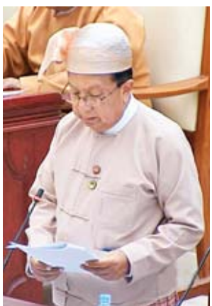
ပြည်ထောင်စုဝန်ကြီး ဦးဟန်ဇော်

ပွင့်ဖြူမဲဆန္ဒနယ်မှ ဦးထွန်းထွန်း၏ ပွင့်ဖြူမြို့နယ်အတွင်းရှိ ကလေးသူငယ် ပြုစုပျိုးထောင်ရေးဌာနမှ ဆောင်ရွက်ခဲ့သော ကိုယ့်အားကိုယ်ကိုး မူကြို ကျောင်းများကို လွှဲပြောင်းလက်ခံရန် အစီအစဉ်ရှိ၊ မရှိမေးခွန်းနှင့်စပ်လျဉ်း၍ လူမှုဝန်ထမ်း၊ ကယ်ဆယ်ရေးနှင့် ပြန်လည်နေရာချထားရေးဝန်ကြီးဌာန ဒုတိယ