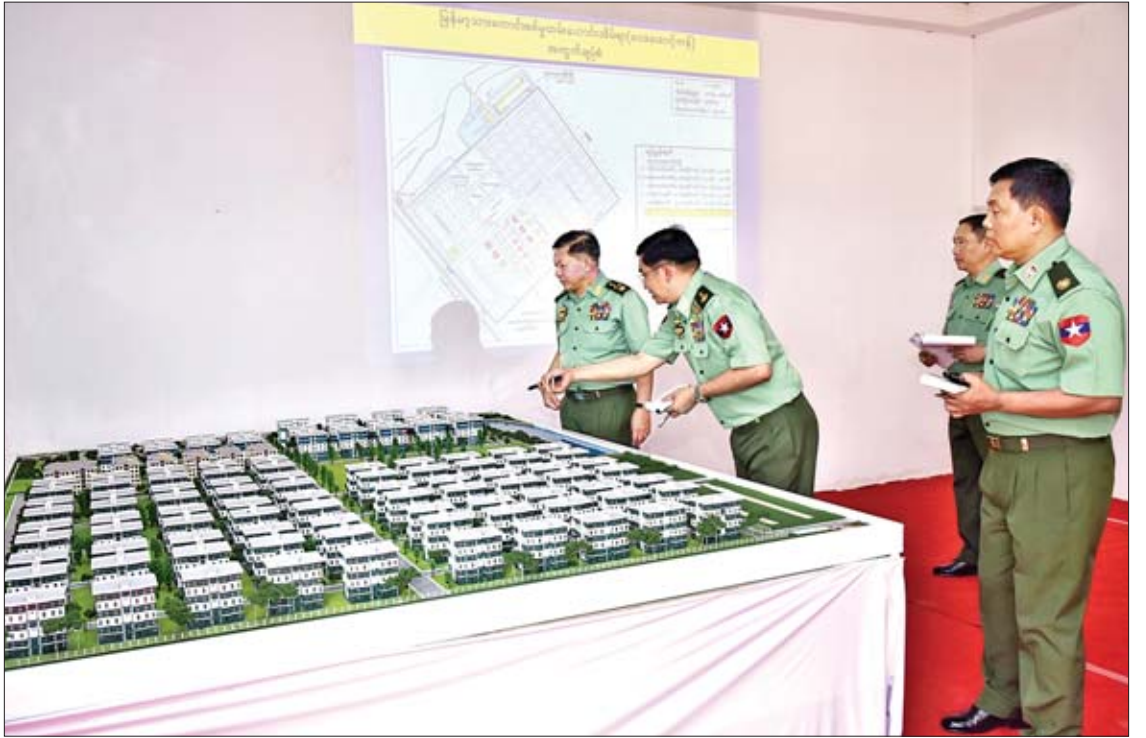
တပ်မတော်ကာကွယ်ရေးဦးစီးချုပ် ပိုလ်ချုပ်မှူးကြီး မင်းအောင်လှိုင် ရန်ကုန်တိုင်းဒေသကြီး အုပ်စိုက်ကမ်းမြို့နယ် မြန်မာ့သားကောင်း စစ်မှုထမ်းဟောင်းအိမ်ရာ (လေးထောင်ကန်)၏ စီမံကိန်းပုံစံငယ်ကို ကြည့်ရှုစစ်ဆေးစဉ်။

အဆိုပါ အခြေခံပညာအထက်တန်းကျောင်းရှိ ယခင်ကျောင်းဆောင်မှာ နှစ်ကာလကြာ မြင့်၍ ယိုယွင်းပျက်စီးကာ အန္တရာယ်ရှိသည့် အဆောက်အအုံတစ်ခုဖြစ်သဖြင့် တပ်မတော် (ကြည်း၊ ရေ၊ လေ) မိသားစုများ၏ လှူဒါန်းမှုဖြင့် ၂၀၁၈ ခုနှစ်တွင် အသစ်ပြန်လည်တည်ဆောက် ခဲ့ခြင်းဖြစ်ပြီး ၉၄ ရာခိုင်နှုန်းခန့် ဆောက်လုပ်ပြီးစီးပြီဖြစ်သည်။ ယခု ကျောင်းဆောင်သစ် ဆောက်လုပ်ပြီးစီးပါက ၂၀၁၉-၂၀၂၀ ပညာသင်နှစ်တွင် ကျောင်းသား ကျောင်းသူ ၁၈၅၀ အထိ လက်ခံသင်ကြားပေးနိုင်မည်ဖြစ်ကြောင်း တပ်မတော်ကာကွယ်ရေးဦးစီးချုပ်မှူးကြီး သတင်း ထုတ်ပြန်ချက်အရ သိရသည်။