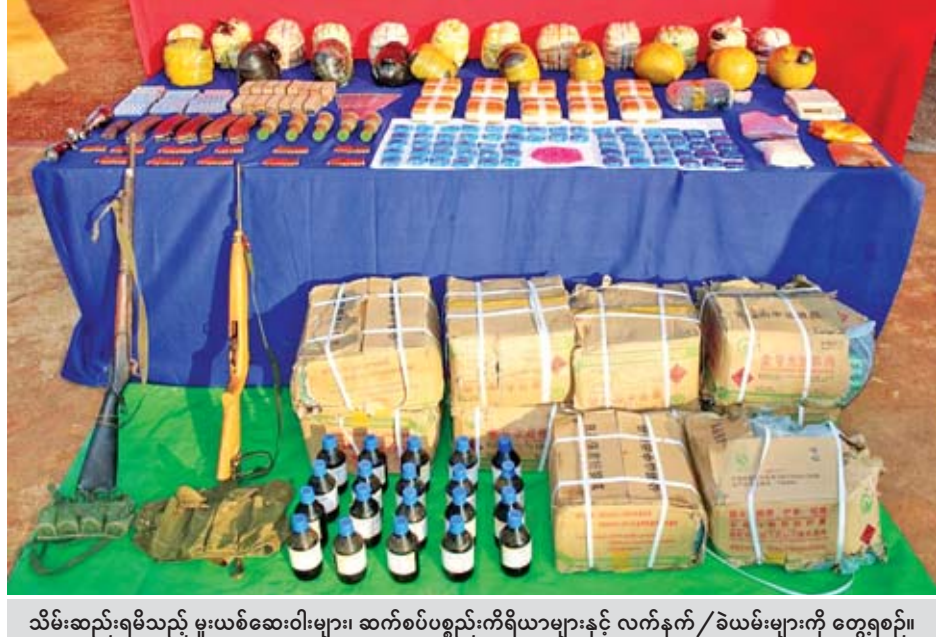
သိမ်းဆည်းရမိသည့် မူးယစ်ဆေးဝါးများ၊ ဆက်စပ်ပစ္စည်းကိရိယာများနှင့် လက်နက်/ခဲယမ်းများကို တွေ့ရစဉ်။

(၂)ရပ်ကွက် မီးစက်လမ်းကြားတွင် ၎င်းမော်တော်ယာဉ်ကို တွေ့ရှိရပြီး စစ်ဆေးရှာဖွေရာ ယာဉ်နောက်ခန်းရှိ ဆာလာအိတ်အတွင်းမှ စိတ်ကြွ ဆေးပြား ၉၇၅၀၀၀ သိမ်းဆည်းရမိ ခဲ့ပြီး တွင်းဆက်ဖော်ထုတ်ချက်အရ ယနေ့နံနက်ပိုင်းက အမျိုးသားနှစ်ဦး အား ဖမ်းဆီးရမိခဲ့သဖြင့် ၎င်းတို့အား မူးယစ်ဆေးဝါးနှင့် စိတ်ကြွပြောင်းလဲ စေသောဆေးဝါးများဆိုင်ရာဥပဒေ အရ အရေးယူထားကြောင်း သိရ သည်။ ကိုရဲ