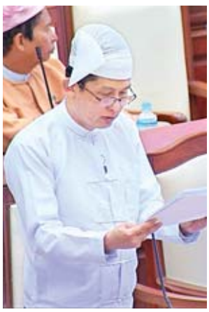
ဒုတိယဝန်ကြီး ဒေါက်တာထွန်းနိုင်