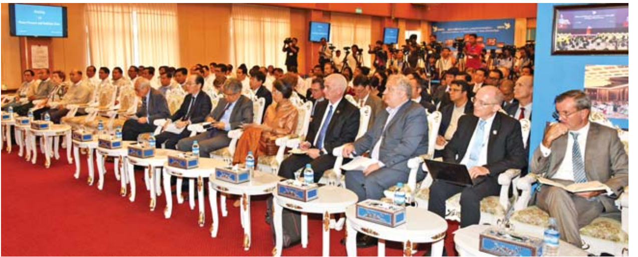
ငြိမ်းချမ်းရေးလုပ်ငန်းစဉ်နှင့် ပြန်လည်လက်ခံရေးလုပ်ငန်းစဉ်ဆိုင်ရာ ဖြစ်ပေါ်တိုးတက်မှုအခြေအနေများအား ရှင်းလင်းပြောကြားမှုအခမ်းအနားသို့ တက်ရောက်လာသည့် ရန်ကုန်မြို့အခြေစိုက်သံရုံးများမှ သံတမန်များနှင့် ကုလသမဂ္ဂအဖွဲ့အစည်းများမှ ကိုယ်စားလှယ်များအား တွေ့ရစဉ်။

ယင်းနေ့က ပြည်ထောင်စုဝန်ကြီးများနှင့် အမြဲတမ်းအတွင်းဝန်တို့က သံတမန်များနှင့် ကုလသမဂ္ဂအေဂျင်စီများမှ မေးမြန်းချက်များကို ပြန်လည်