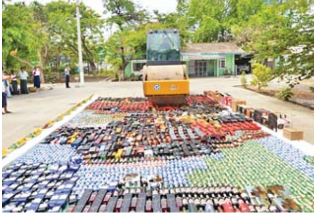
မန်း(ကိုယ်ပွား)

မန္တလေးမြို့နယ်အကောက်ခွန်ဦးစီးဌာနသို့ မြို့နယ်ပြည်တွင်းအခွန်များ ဦးစီးဌာနများက ဖမ်းဆီး၍ လွှဲပြောင်းအပ်နှံခဲ့သော အများပြည်သူသုံးစွဲရန်နှင့် စားသုံးရန်မသင့်သည့် အမှုတွဲ ၁၁ မှု (ခန့်မှန်းတန်ဖိုးငွေကျပ် ၃၃၄၀၂၅၂၀ ခန့်)ရှိ အရက်၊ ဘီယာ၊ ဝိုင်၊ စီးကရက်များကို မေ ၂၃ ရက် နံနက် ၁၀ နာရီ တွင် မန္တလေးတိုင်းဒေသကြီး အကောက်ခွန်ဦးစီးဌာနမှ တိုင်းဒေသကြီး ဦးစီးမှူး၊ ဒုတိယတိုင်းဒေသကြီးဦးစီးမှူး၊ မြို့နယ်အကောက်ခွန်ဦးစီးဌာနမှူး၊ မန္တလေးတိုင်းဒေသကြီး ပြည်တွင်းအခွန်များဦးစီးဌာနမှ ကိုယ်စားလှယ်တစ်ဦး၊ ခရိုင်အထွေထွေအုပ်ချုပ်ရေးဦးစီးဌာနမှ ကိုယ်စားလှယ်တစ်ဦးတို့ပါဝင်သော ဖျက်ဆီးရေးအဖွဲ့ဖြင့် မန္တလေးတိုင်းဒေသကြီး အကောက်ခွန်ဦးစီးဌာန ရုံးဝင်းအတွင်း၌ လမ်းကြိုတစ်ဖက်ဖြင့်ကြို၍ ဖျက်ဆီးခဲ့ကြောင်း သိရသည်။