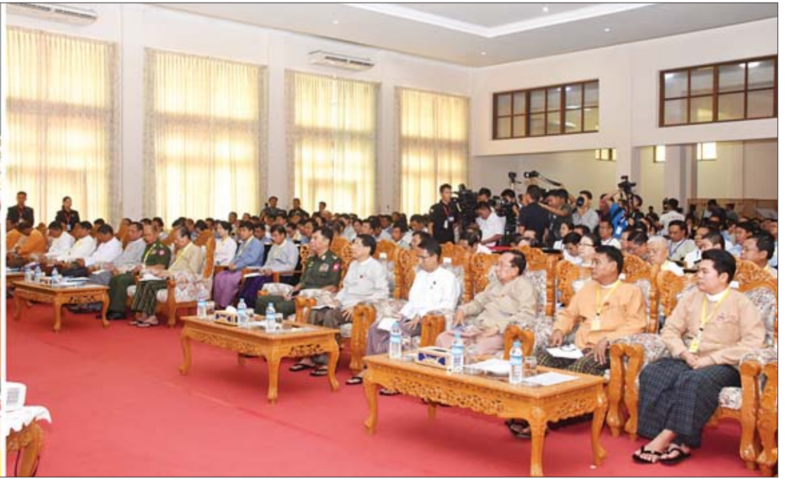
နိုင်ငံတော်သမ္မတ ဦးဝင်းမြင့် နေပြည်တော်ကောင်စီဥက္ကဋ္ဌ၊ နေပြည်တော်ကောင်စီဝင်များ၊ နေပြည်တော် စည်ပင်သာယာရေးကော်မတီဝင်များ၊ လွှတ်တော်ကိုယ်စားလှယ်များ၊ နေပြည်တော်ကောင်စီ၊ ခရိုင်နှင့် မြို့နယ်အဆင့် ဌာနဆိုင်ရာတာဝန်ရှိသူများနှင့် တွေ့ဆုံပွဲ အခမ်းအနားတွင် လမ်းညွှန်အမှာစကားပြောကြားစဉ်။