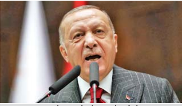
တူရကီ သမ္မတ ရီဇ်ဝဲဒ်တေယက်အာဒိုဂန်

တူရကီနိုင်ငံသို့ အက်စ်-၅၀၀ လေကြောင်းရန်ကာကွယ်ရေးစနစ် ပေးပို့ပြီးလျှင် တူရကီနှင့် ရုရှားတို့ သည် အက်စ်-၅၀၀ လေကြောင်းရန် ကာကွယ်ရေးစနစ် ပူးတွဲထုတ်လုပ် ရေးကို ဆွေးနွေးမည်ဟု တူရကီ သမ္မတ ရီဇ်ဝဲဒ်တေယက်အာဒိုဂန်က ပြောကြားခဲ့သည်ဟု ဒေသန္တရ မီဒီယာများက ဖော်ပြခဲ့သည်။