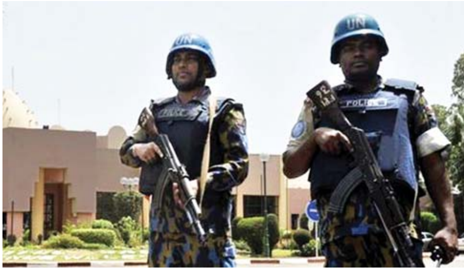
၎င်းတို့က ရဲတပ်ဖွဲ့ဝင်များ၊ အကောက်ခွန်အရာရှိနှင့် ကုန်တင်ယာဉ်မောင်းများကို သေနတ်များဖြင့် ပစ်ခတ် ခဲ့ကြကြောင်းနှင့် ၎င်းတို့မှာ မည်သည့်အဖွဲ့အစည်းမှ ဖြစ်မည်ကို လတ်တလောတွင် အတည်ပြုနိုင်ခြင်း မရှိ

တိုက်ခိုက်ရေးသမားများသည် မော်တော်ဆိုင်ကယ် သုံးစီး၊ မော်တော်ယာဉ်တစ်စီးတို့ဖြင့် ရောက်ရှိလာကြောင်း၊