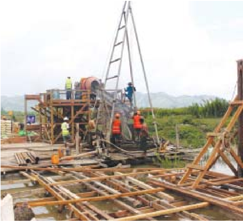
၂၉၅ ပေ၊ အကျယ် ၁၈ ပေရှိပြီး တိုင်းဒေသကြီး ရန်ပုံငွေကျပ်သန်းပေါင်း ၁၀၅၀ ဖြင့် ဘိုးပိုင်အုတ်မြစ် သံကူကွန်ကရစ်ကိုယ်ထည် သံကူကွန်ကရစ်ရက်မကြမ်းခင်းအမျိုးအစားဖြင့် တံတားဦးစီးဌာန တည်ဆောက်ရေးအဖွဲ့(၃) တံတားအထူးအဖွဲ့ (၉) မှ တည်ဆောက်လျက်ရှိကြောင်း သိရသည်။