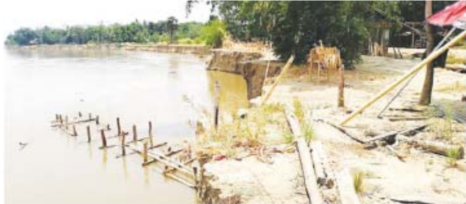
ရေတာရှည် မေ ၂၀ ပဲခူးတိုင်းဒေသကြီး တောင်ငူခရိုင် ရေတာရှည်မြို့နယ် ဆွာမြို့အရှေ့ လေးမိုင်ခန့်အကွာရှိ ရွှေကလေးကျေးရွာ သည် စစ်တောင်းမြစ်ရေတိုက်စား၍ ကမ်းပြိုမှုများကြောင့်

မြစ်ထိန်းတာတစ်မြောက်ဘက်ခြမ်းရှိ လူနေအိမ်များ အားလုံးနီးပါး ရွှေပြောင်းခံကြရပြီး မြစ်တစ်ဖက်ကမ်းရှိ သောင်ကျွန်းအား ဖယ်ရှားနိုင်ခြင်းမရှိပါက ယခုနှစ်မိုး ရာသီတွင် မြစ်ကမ်းထိန်းတာတစ်အထိ ကမ်းပါးများပဲ့နိုင် ကြောင်း ရွှေကလေးကျေးရွာဒေသသမားက ပြောကြား သည်။ “မြစ်ကမ်းပါးတွေပြိုတာတော့ ပြောမနေပါတော့နဲ့ ဗျာ၊ တစ်ရွာလုံးလည်း ဟိုရောက်ဒီရောက်တွေဖြစ်ကုန်ပြီ ကျွန်တော်တို့ကတော့ ပြေးစရာလည်းမရှိပေမယ့်လည်း ငွေမရှိလို့မြစ်ကမ်းဘေးမှာ ဖြစ်သလိုတိုင်းပြီးနေရတာသာ ကြည့်ပါတော့။ ဟိုးမှာမြင်ရတဲ့ သောင်ကျွန်းကို ဖယ်ရှားနိုင်ရင် ရေစီးကြောင်းပြောင်းသွားမှာ သေချာတယ်။ ဒီလိုမှမဟုတ်ရင်တော့ အခိုးရာသီကို မြစ် ကမ်းထိန်းတဲ့ ဒီတာပေါင်အထိရောက်နိုင်တယ်” ဟု