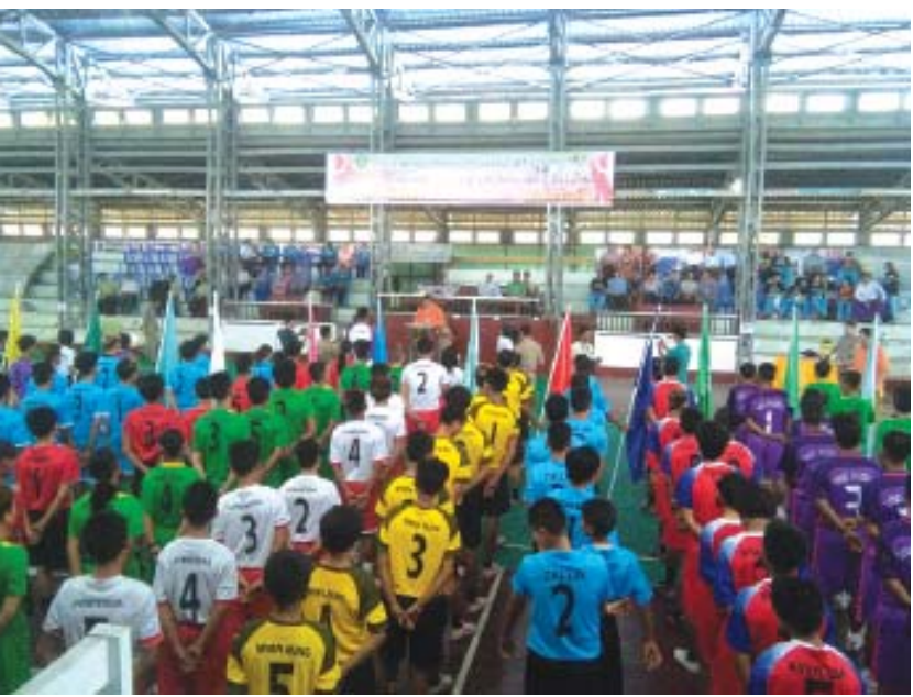
တိုင်းဒေသကြီးဝန်ကြီးချုပ်ဖလား ပိုက်ကျော်ခြင်းပြိုင်ပွဲ ဖွင့်ပွဲကျင်းပ

ပုသိမ် မေ ၂၀ ဧရာဝတီတိုင်းဒေသကြီး ပုသိမ်မြို့တွင် ၂၀၁၉ ခုနှစ် တိုင်းဒေသကြီးဝန်ကြီးချုပ်ဖလား ၂၆ မြို့နယ် အသက် ၂၅ နှစ်နှင့်အောက် အမျိုးသား အမျိုးသမီး ပိုက်ကျော်ခြင်းပြိုင်ပွဲ ဖွင့်ပွဲကို မေ ၂၀ ရက် နံနက်ပိုင်း က ကိုးသိန်း မိုးလုံလေလုံအားကစားခန်းမ၌ ကျင်းပ သည်။ တိုင်းဒေသကြီးဝန်ကြီးချုပ် ဦးလှစိုးအောင်က