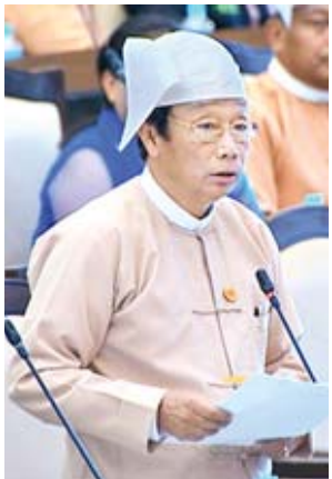
ဒုတိယဝန်ကြီး ဦးလှကျော်

အလားတူ ရှမ်းပြည်နယ် မဲဆန္ဒနယ်အမှတ်(၈)မှ ဒေါ်မမလေး၏