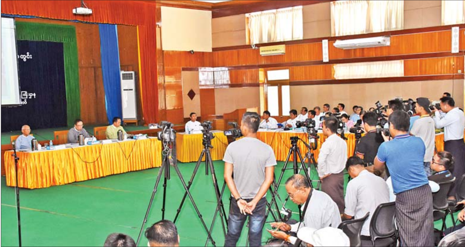
ဆောက်လုပ်ရေးဝန်ကြီးဌာန၊ မြန်မာနိုင်ငံတော်ပဟိုဘဏ်နှင့် ပြည်ထောင်စုအစိုးရအဖွဲ့ရုံးဝန်ကြီးဌာနတို့၏ ပြည်သူ့အတွက် တတိယ(၁)နှစ်တာကာလအတွင်း ဆောင်ရွက်ခဲ့မှုများနှင့်စပ်လျဉ်း၍ သတင်းစာရှင်းလင်းပွဲပြုလုပ်စဉ်။