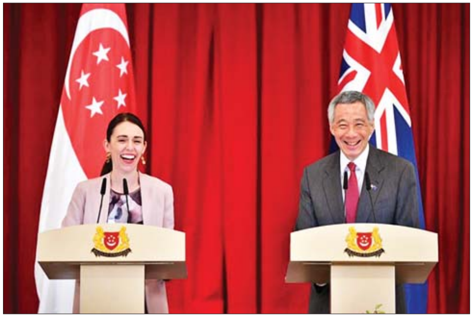
နယူးဇီလန်ဝန်ကြီးချုပ် ဂျာဆင်ဒါအာဒန်နှင့် စင်ကာပူဝန်ကြီးချုပ် လီရှန်လွန်းတို့ကို တွေ့ရစဉ်။

တီထွင်မှုအစီအစဉ်၊ ကာကွယ်ရေးဆိုင်ရာ ပူးပေါင်းဆောင်ရွက်မှု၊ ဆိုက်ဘာလုံခြုံရေး၊ အနုပညာ၊ ယဉ်ကျေးမှု ဆိုင်ရာ ပူးပေါင်းဆောင်ရွက်မှု တိုးမြှင့်ရေးတို့ ပါဝင်သည်။ “ကုန်စည်တွေတင်ပို့ရေးအတွက် နယူးဇီလန်ရဲ့ စီးပွားရေးလုပ်ငန်း ချောမွေ့ရေးသည် အစိုးရရဲ့ စီးပွားရေးဆိုင်ရာစီမံကိန်းရဲ့ အဓိကအချက်ပါ။ ယခုလို နှစ်နိုင်ငံ ဆက်ဆံရေး တိုးမြှင့်ခြင်းကနေ စင်ကာပူနိုင်ငံနဲ့ စီးပွားရေး တိုက်ရိုက်လုပ်ဆောင်တဲ့အခါ လုပ်ငန်းတွေ လွယ်ကူချောမွေ့စေမှာပါ။ အစိုးရအနေနဲ့လည်း နယူးဇီလန် ကုန်စည်နှင့် ဝန်ဆောင်မှုတွေကို အာရှဈေးကွက်နှင့် ချိတ်ဆက်နိုင်ရန်အတွက် ဆောင်ရွက်ပေးသွားမှာပါ” ဟု နယူးဇီလန်ဝန်ကြီးချုပ် အာဒန်က ပြောကြားသည်။ စင်ကာပူနိုင်ငံသည် အရှေ့တောင်အာရှတွင် နယူးဇီလန်နိုင်ငံ၏ အနီးစပ်ဆုံးနှင့် အရေးပါဆုံး နိုင်ငံ ဖြစ်သလို ကမ္ဘာ့အတိုင်းအတာဖြင့်ကြည့်ပါက နယူးဇီလန် နိုင်ငံ၏ သတ္တမအကြီးမားဆုံး ကုန်သွယ်ဖက်နိုင်ငံ ဖြစ်ကြောင်း နယူးဇီလန်ဝန်ကြီးချုပ်က ပြောကြားသည်။ ကိုးကား- ဆင်ဟွာ ဘာသာပြန်- ဂျေတီ