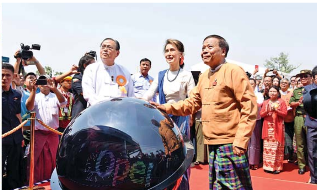
နိုင်ငံတော်၏အတိုင်ပင်ခံပုဂ္ဂိုလ် ဒေါ်အောင်ဆန်းစုကြည်၊ ပြည်ထောင်စုဝန်ကြီး ဦးဝင်းခိုင်နှင့် မန္တလေးတိုင်းဒေသကြီးဝန်ကြီးချုပ် ဒေါက်တာဇော်မြင့်မောင်တို့က ကျောက်ဆည်မြို့နယ် ဘဲလင်းသဘာဝဓာတ်ငွေ့သုံး ဓာတ်အားပေးစက်ရုံမှထုတ်လုပ်သည့် လျှပ်စစ်ဓာတ်အား ၁၄၅ ဒေမ ၄၉ မဂ္ဂါဝပ်ကို မဟာဓာတ်အားလိုင်းပေါ်သို့ ပို့လွှတ်နိုင်ရန် စက်လုပ်တံနှိပ် ဖွင့်လှစ်ပေးစဉ်။

အခမ်းအနားသို့ ပြည်ထောင်စုဝန်ကြီး ဒုတိယဗိုလ်ချုပ်ကြီးကျော်ဆွေ၊ ဦးမင်းသူနှင့် ဦးဝင်းခိုင်၊ မန္တလေးတိုင်းဒေသကြီးဝန်ကြီးချုပ် ဒေါက်တာဇော်မြင့်မောင်၊ တိုင်းဒေသကြီးလွှတ်တော်ဥက္ကဋ္ဌ၊ တိုင်းဒေသကြီးဝန်ကြီးများ၊ လွှတ်တော်ကိုယ်စားလှယ်များ၊ တာဝန်ရှိသူများ၊ ဘဲလင်းသဘာဝဓာတ်ငွေ့သုံး ဓာတ်အားပေးစက်ရုံ တည်ဆောက်ခဲ့ကြသည့် Powergen Kyaukse Co.,Ltd မှ ဥက္ကဋ္ဌနှင့် တာဝန်ရှိသူများ၊ ပညာရှင်များ၊ ဝန်ထမ်းများ၊ ဖိတ်ကြားထားသူများနှင့် ဒေသခံပြည်သူများ တက်ရောက်ကြသည်။