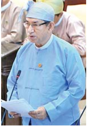
ဒုတိယဝန်ကြီး ဒေါက်တာရဲမြင့်ဆွေ

ရှမ်းပြည်နယ်တောင်ပိုင်း၊ ပင်းတယမြို့နယ်နှင့် ရွာငါးမြို့နယ်အတွင်းရှိ အော်ဂဲနစ် သီးနှံစိုက်ပျိုးသည့် တောင်သူများအား နိုင်ငံတော်မှ ပြည်တွင်း၊ ပြည်ပဈေးကွက် ချိတ်ဆက်ပေးနိုင်ရန်နှင့် လိုအပ်ချက်များကို မည်သို့ကူညီထောက်ပံ့ပေးနိုင် မည်ကို သိရှိလိုခြင်း မေးခွန်းနှင့်စပ်လျဉ်း၍ စီးပွားရေးနှင့် ကူးသန်းရောင်းဝယ်ရေး ဝန်ကြီးဌာန ဒုတိယဝန်ကြီး ဦးအောင်ထူးကလည်းကောင်း၊ ရခိုင်ပြည်နယ် မဲဆန္ဒနယ်အမှတ်(၄)မှ ဦးကျော်ကျော်၏ ရခိုင်ပြည်နယ် မြောက်ဦးမြို့နယ်ရှိ ကုလားပုန်းနတ်ချောင်း ရေခဲတားတစ်ခုတွင် ဆည်ဖို့ရန် ကျန်နေသည့် အရှည်ပေ (၂၀၀၀)ကို ဆက်လက်ဆည်ဖို့ပေးရန်နှင့် လုံလောက်သော ရေနုတ်ပေါက်များကို ပြုလုပ်ပေးရန် အစီအစဉ် ရှိ၊ မရှိ မေးခွန်းနှင့် မန္တလေး တိုင်းဒေသကြီး မဲဆန္ဒနယ်အမှတ်(၇)မှ ဦးကျော်တုတ်၏ မန္တလေးတိုင်းဒေသ ကြီး၊ ညောင်ဦးခရိုင်၊ ပုဂံ - ညောင်ဦးမြို့နယ်အတွင်းရှိ လွန်ခဲ့သောနှစ်ပေါင်း ၉၀၀ခန့် ပုဂံခေတ် ကျန်စစ်သားမင်းကြီး တည်ဆောက်ခဲ့သော မြကန်တစ် ကြီးအား ဘက်စုံပြုပြင်ထိန်းသိမ်းဆောင်ရွက်ခြင်းလုပ်ငန်းများ ဆောင်ရွက် ပေးရန် အစီအစဉ် ရှိ၊ မရှိ မေးခွန်းနှင့်စပ်လျဉ်း၍ ဒုတိယဝန်ကြီး ဦးလှကျော် ကလည်းကောင်း ပြန်လည်ရှင်းလင်းဖြေကြားခဲ့ကြသည်။