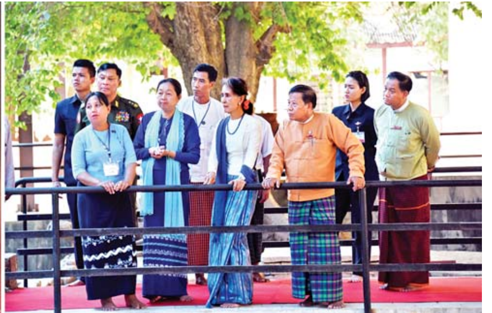
နိုင်ငံတော်၏အတိုင်ပင်ခံပုဂ္ဂိုလ် ဒေါ်အောင်ဆန်းစုကြည် သမိုင်းဝင် တမုတ်ရှင်ပင်ရွှေဂူဘုရားတွင် ပြုပြင်ထိန်းသိမ်းထားမှုအခြေအနေများကို ကြည့်ရှုစဉ်။