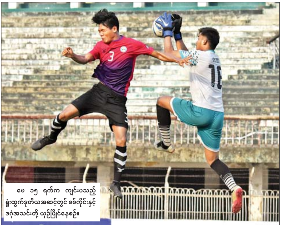
မေ ၁၅ ရက်က ကျင်းပသည့် ရှုံးထွက်ဒုတိယအဆင့်တွင် စစ်ကိုင်းနှင့် ဒဂုံအသင်းတို့ ယှဉ်ပြိုင်နေစဉ်။

ဒုတိယအဆင့်ပွဲစဉ်များကို မေ ၁၂၊ ၁၃၊ ၁၅ ရက်က ကျင်းပခဲ့ပြီး စစ်ကိုင်းအသင်းက ဒဂုံအသင်းကို တစ်ဂိုး-ဂိုးမရှိ၊ Southern အသင်းက ငွေကြယ်ပွင့်အသင်းကို လေးဂိုး-ဂိုးမရှိ၊ မကွေးအသင်းက အား/ကာသိပွဲအသင်းကို သုံးဂိုး-ဂိုးမရှိ၊ ရှမ်းယူနိုက်တက်အသင်းက မြဝတီအသင်းကို နှစ်ဂိုး-ဂိုးမရှိ၊ ရတနာပုံအသင်းက ဧရာဝတီအသင်းကို နှစ်ဂိုး-တစ်ဂိုး၊ ဟံသာဝတီအသင်းက တက္ကသိုလ်အသင်းကို ငါးဂိုး-တစ်ဂိုးဖြင့် အနိုင်ရခဲ့ကြသည်။ ရခိုင်နှင့် ဇွဲကပင်အသင်းပွဲတွင် နှစ်ဂိုးစီသရေကျနေ၍ ပင်နယ်တီဖြင့် ဆုံးဖြတ်ရာ ရခိုင်အသင်းက လေးဂိုး-သုံးဂိုး၊ စုစုပေါင်းခြောက်ဂိုး-ငါးဂိုးဖြင့် အနိုင်ရခဲ့သည်။ ကွာတားဖိုင်နယ်ရောက်ရှိလာသည့် အသင်းများတွင် စာမျက်နှာ ၁၆ ကော်လံ ၅ သို့ ၀