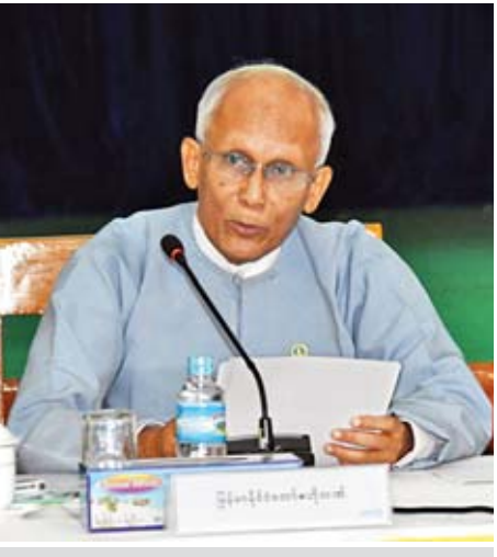
မြန်မာနိုင်ငံတော်ဗဟိုဘဏ် ဒုတိယဥက္ကဋ္ဌ ဦးစိုးသိန်း ရှင်းလင်းပြောကြားစဉ်။

အိမ်ရာဝယ်ယူသူ ၂၇၂၀ ဦးကို ငွေကျပ် ၃၅ ဒသမ ၁၇ ဘီလီယံ ထုတ်ချေးဆောင်ရွက်ပေးနိုင်ခဲ့ပါကြောင်း။ ယခင် စုဆောင်းငွေ ၃၀ ရာခိုင်နှုန်းရှိသူများကို အတိုးနှုန်း ၁၂ ရာခိုင်နှုန်း ချေးငွေကာလ ၁၅ နှစ်အထိ ထုတ်ချေးပေးခဲ့ပြီး ယခု JICA ချေးငွေအရင်းအမြစ်ဖြင့် အတိုးနှုန်း ၈ ဒသမ ၅ ရာခိုင်နှုန်း အနည်းဆုံး ၁၅ နှစ်ဖြင့် ထုတ်ချေးပေးနိုင်ရန် ဆောင်ရွက်နေပြီဖြစ်ပါကြောင်း။ အခြေခံအဆောက်အအုံဖွံ့ဖြိုးရေးလုပ်ငန်းများကိုပါ အထောက်အကူပြုနိုင်ရေးအတွက် ရည်ရွယ်၍ ဆောက်လုပ်ရေး၊ အိမ်ရာနှင့် အခြေခံအဆောက်အအုံ ဖွံ့ဖြိုးရေးဘဏ် CHID Bank (Construction, Housing and Infrastructure Development Bank) အဖြစ် ရည်မှန်းချက်၊ မျှော်မှန်းချက်များ တိုးမြှင့်ပြီး ဆောင်ရွက်လျက်ရှိပါကြောင်း။ မြို့ပေါင်း ကိုးမြို့တွင် ဘဏ်ခွဲပေါင်း ၁၂ ဘဏ်အထိ တိုးချဲ့ဖွင့်လှစ်ပြီး ပြည်သူများ နေရေးအဆင်ပြေစေရန်အတွက် ဝန်ဆောင်မှုများ ဆောင်ရွက်ပေးလျက်ရှိပါကြောင်း။