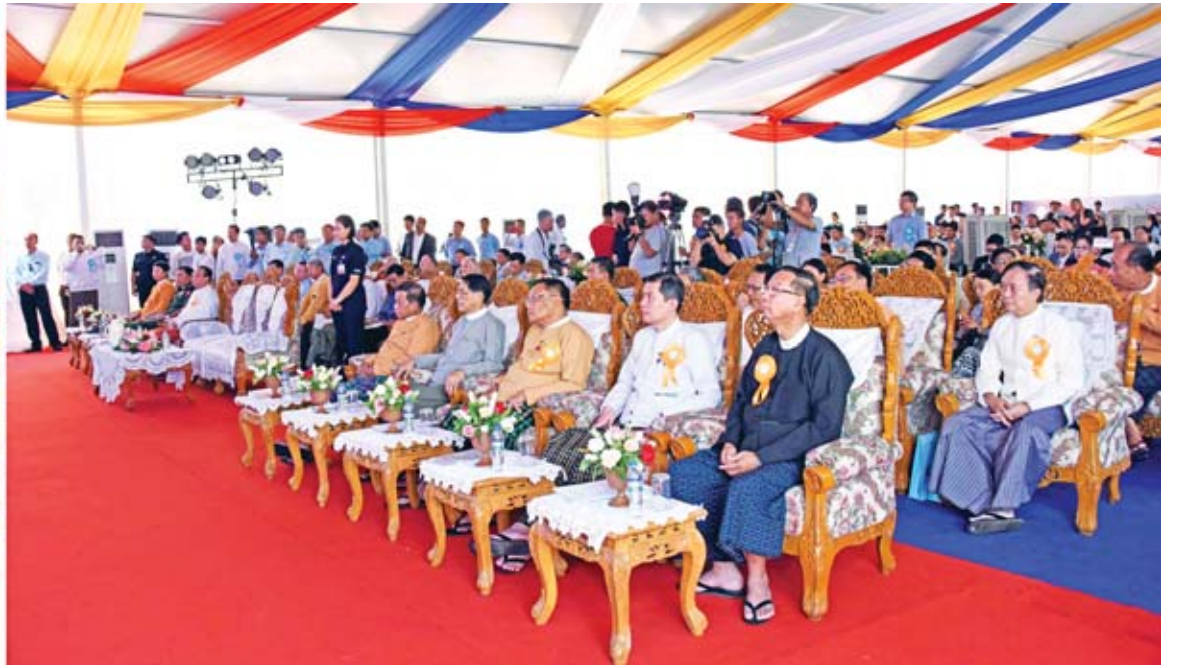
နိုင်ငံတော်၏အတိုင်ပင်ခံပုဂ္ဂိုလ် ဒေါ်အောင်ဆန်းစုကြည် ကျောက်ဆည်မြို့နယ် ဘဲလင်း ၁၄၅ မဂ္ဂါဝပ် သဘာဝဓာတ်ငွေ့သုံး ဓာတ်အားပေးစက်ရုံဖွင့်ပွဲအခမ်းအနားတွင် အမှာစကားပြောကြားစဉ်။