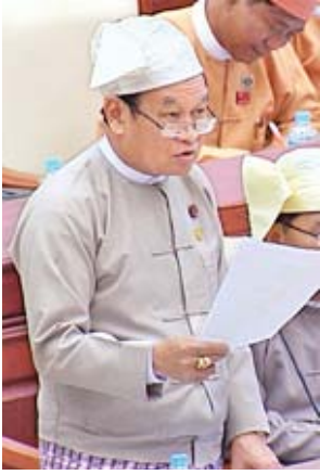
ပြည်ထောင်စုဝန်ကြီး ဒေါက်တာမြင့်ထွေး

ထို့နောက် အမျိုးသားလွှတ်တော်မှ ပြင်ဆင်ချက်ဖြင့် ပြန်လည်ပေးပို့သော ကလေးသူငယ်အခွင့်အရေးများ ဆိုင်ရာ ဥပဒေကြမ်းနှင့်စပ်လျဉ်း၍ ဥပဒေကြမ်းကော်မတီဝင် ဦးနေမျိုးထွန်းက အမျိုးသားလွှတ်တော်၏ ပြင်ဆင်ချက်များ၊ ပြည်သူ့လွှတ်တော်ဥပဒေကြမ်းကော်မတီ၏ ပြင်ဆင်ချက်များနှင့် အမျိုးသားလွှတ်တော်၏ ပြင်ဆင်ချက်များအတိုင်း သဘောမတူဘဲ ပြည်သူ့လွှတ်တော်