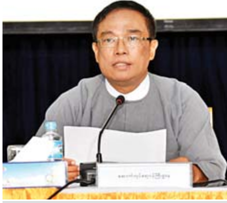
ဆောက်လုပ်ရေးဝန်ကြီးဌာန ဒုတိယဝန်ကြီး ဦးကျော်လင်း ရှင်းလင်းပြောကြားစဉ်။

စစ်ကိုင်းတိုင်းဒေသကြီး၌ ၂၀၁၈ ခုနှစ် (ဧပြီလမှစက်တင်ဘာလအထိ)တွင် မုံရွာ-ပုလဲ-ဂန့်ဂေါလမ်းတွင် ၁၈