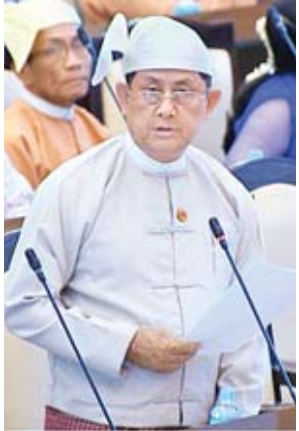
ဒုတိယဝန်ကြီး ဦးမောင်မောင်ဝင်း