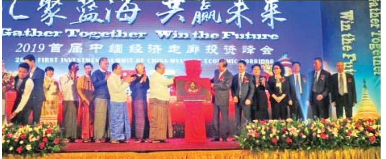
ဖွံ့ဖြိုးမှုမြှင့်တင်ရေးအသင်း၏ ရည်ရွယ်ချက်နှင့်အညီ ကုန်သွယ်မှုနှင့် ရင်းနှီးမြှုပ်နှံမှု အခွင့်အလမ်းများ ဖွံ့ဖြိုးတိုးတက်မှုမှတစ်ဆင့် တရုတ်-မြန်မာ နှစ်နိုင်ငံ ချစ်ကြည်ရင်းနှီးမှု ပိုမိုတိုးတက်ခိုင်မာလာမည်ဟု ယုံကြည်ကြောင်း ပြောကြားသည်။ သတင်းစဉ်