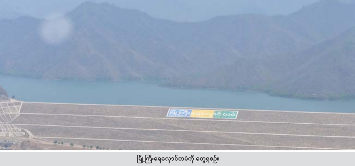
မြို့ကြီးရေလှောင်တံခွန်ကို တွေ့ရစဉ်။

ထို့နောက် နိုင်ငံတော်၏အတိုင်ပင်ခံပုဂ္ဂိုလ်နှင့်အဖွဲ့သည် ရဟတယာဉ် များဖြင့် ရွာ (ပင်းတယ)၊ တီကျစ်၊ ပင်လောင်း၊ ပေါင်းလောင်းဒေသများ၏ သဘာဝပတ်ဝန်းကျင်အခြေအနေများကို လှည့်လည်ကြည့်ရှုစစ်ဆေးပြီး ဆက်လက်ထွက်ခွာခဲ့ရာ ညနေပိုင်းတွင် နေပြည်တော်သို့ ပြန်လည်ရောက်ရှိ ကြသည်။