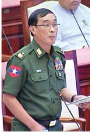
ဒုတိယဝန်ကြီး ဝိုလ်ချုပ်သန်းထွဋ်