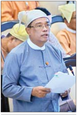
ဒုတိယဝန်ကြီး ဦးကျော်လင်း

ဧရာဝတီတိုင်းဒေသကြီး မဲဆန္ဒနယ်အမှတ်(၄)မှ ဦးထိန်ဝင်း၏ “ဧရာဝတီတိုင်းဒေသကြီး ဟင်္သာတမြို့နယ်အတွင်းရှိ ပဲကြီးကျွန်း-ပေါက်တပင်-ဆိပ်သာ-ကြက်ကျွန်း လမ်းကြောင်းအား လွန်ခဲ့သည့် နှစ်နှစ်ခန့်က World Bank အကူအညီဖြင့် ဖောက်လုပ်ရန် ကွင်းဆင်း၍ Survey တိုင်းထွာခဲ့သော်လည်း ယနေ့တိုင် အကောင်အထည်ဖော်ဆောင်ရွက်မှု မရှိသေးသဖြင့် မည်သို့ဆောင်ရွက်ပေးသွားမည်ကို သိရှိလိုခြင်း” မေးခွန်း၊ ကချင်ပြည်နယ် မဲဆန္ဒနယ်အမှတ်(၆)မှ ဦးမင်းဆွေနိုင်၏ “ကချင်ပြည်နယ် ဝါဒီမြို့နယ် နန်းမားကျေးရွာအုပ်စု နန်းမားကျေးရွာနှင့် လယ်ဖီးကျေးရွာအုပ်စု ကျွန်းပင်သာကျေးရွာသို့ ချိတ်ဆက်ထားသော ကျေးရွာချင်းဆက်(ကုန်ထုတ်) မြေသားလမ်းအား ကျောက်ချောလမ်းအဖြစ် အဆင့်မြှင့်တင်ပေးနိုင်ခြင်း ရှိမရှိ သိရှိလိုခြင်း” မေးခွန်း၊ ချင်းပြည်နယ် မဲဆန္ဒနယ်အမှတ်(၁၂)မှ ဦးမျိုးထပ်(ခ)ဆလိုင်းမျိုးထိုက်၏ “ချင်းပြည်နယ် ပလက်ဝမြို့နယ်အတွင်းရှိ ကယက်-ဆားဒီ-ဝါဒီကုန်း-ဝါလောင်ကုန်း-ရွှေပြည်ကုန်း-စင်လီ-ပါဆင်း ကျေးရွာများကြား ၂၀၁၉-၂၀၂၀ ဘဏ္ဍာနှစ်တွင် ကားလမ်းဖောက်လုပ်ပေးရန် အစီအစဉ်ရှိ မရှိ” မေးခွန်းနှင့် ချင်းပြည်နယ် မဲဆန္ဒနယ်အမှတ်(၈)မှ