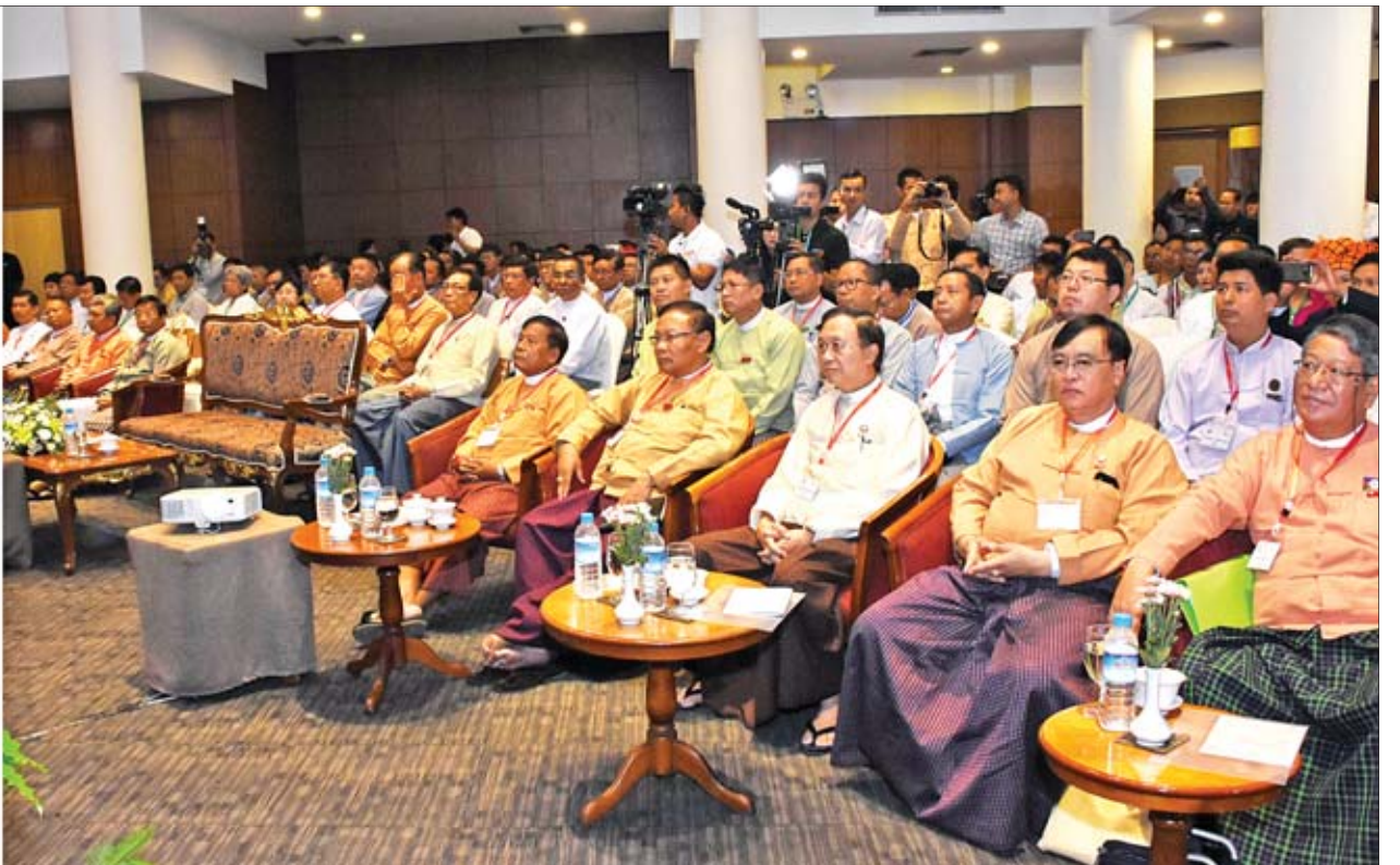
ဒုတိယသမ္မတ ဦးဟင်နရီဖန်ထီးယူ Myanmar Coffee Forum 2019 ဖွင့်ပွဲအခမ်းအနားတွင် အမှာစကားပြောကြားစဉ်။

အခမ်းအနားသို့ မန္တလေးတိုင်းဒေသကြီး ဝန်ကြီးချုပ် ဒေါက်တာဇော်မြင့် မောင်၊ တိုင်းဒေသကြီးလွှတ်တော်ဥက္ကဋ္ဌ ဦးအောင်ကျော်ဦး၊ စိုက်ပျိုးရေး၊ မွေးမြူရေးနှင့် ဆည်မြောင်းဝန်ကြီးဌာန ဒုတိယဝန်ကြီး ဦးလှကျော်၊ လှုပ်စစ်နှင့် စွမ်းအင်ဝန်ကြီးဌာန ဒုတိယဝန်ကြီး ဒေါက်တာထွန်းနိုင်၊ မြို့တော်ဝန် ဒေါက်တာရဲလွင်၊ တိုင်းဒေသကြီးအစိုးရအဖွဲ့ဝင်ဝန်ကြီးများ၊ လွှတ်တော် ကိုယ်စားလှယ်များ၊ ဌာနဆိုင်ရာတာဝန်ရှိသူများ၊ မြန်မာနိုင်ငံ ကော်ဖီစိုက်ပျိုး ထုတ်လုပ်သူများအသင်း၊ ကော်ဖီစိုက်ပျိုးထုတ်လုပ်သူ လုပ်ငန်းရှင်များ၊ ပြည်တွင်း ပြည်ပမှ ကော်ဖီဆိုင်ရာပညာရှင်များ၊ ဖိတ်ကြားထားသူများနှင့် တာဝန်ရှိသူများ တက်ရောက်ကြသည်။