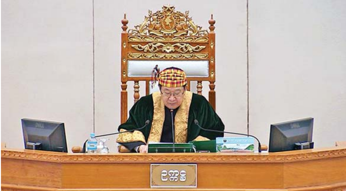
ပြည်သူ့လွှတ်တော်ဥက္ကဋ္ဌ ဦးတီခွန်မြတ်။