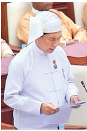
ပြည်ထောင်စုဝန်ကြီး ဦးခင်မောင်ချို

သဘာဝဘေးအန္တရာယ်များ အရေးပေါ်ဖြစ်ပေါ်လာပါက အသုံးပြုနိုင်ရန်အတွက် လူ ၂၀ ဆံ့ Speed Boat နှစ်စင်းနှင့် လူ ၅၀ ဆံ့ စက်လှေသံခွဲ နှစ်စင်း ခွင့်ပြုပေးနိုင်ရေးအတွက် ပြည်ထောင်စုအစိုးရအဖွဲ့မှည့် တင်ပြတောင်းခံခဲ့ပြီးဖြစ်ပါကြောင်း၊ လူမှုဝန်ထမ်း၊ ကယ်ဆယ်ရေးနှင့် ပြန်လည်နေရာချထားရေး ဝန်ကြီးဌာနက အသုံးပြုမည့် စက်လှေများ၏ အရွယ်အစား၊ အမြန်နှုန်း၊ အင်ဂျင်အမျိုးအစား၊ ဒေသတွင်းဝယ်ယူနိုင်မှု ရှိ၊ မရှိ စသည့်လိုအပ်ချက်များကို သက်ဆိုင်ရာမြို့နယ်မှ ထပ်မံတောင်းခံခဲ့ပြီး ခွင့်ပြုချထားပေးနိုင်ရေးအတွက် ဆောင်ရွက်လျက်ရှိပါကြောင်း၊ မြိတ်ခရိုင်အတွင်း သဘာဝဘေးအန္တရာယ်များ ကျရောက်ပါက ပြည်သူလူထု၏ အသက်အိုးအိမ်စည်းစိမ်နှင့် အရင်းအမြစ်များ မခံစားရစေရေးအတွက် အရေးပေါ်ခိုလှုံနိုင်ရန် Cyclone Shelter ငါးလုံးကို ထောက်ပံ့ပေးနိုင်ပါရန် ပြည်ထောင်စုအစိုးရအဖွဲ့မှည့် တင်ပြခဲ့ပြီးဖြစ်သည်။