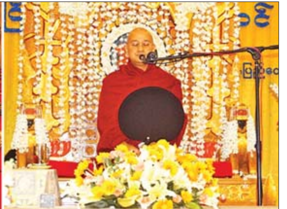
မဏ္ဍပ်သို့ ပင့်ဆောင်ကြသည်။ မေ ၁၆ ရက် နံနက်ပိုင်းတွင် ဗုဒ္ဓရုပ်ပွားတော်နှစ်ဆူ၊ ရွှေထီးတော်၊ ငှက်မြတ်နားတော်နှင့် ရတနာစိန်ဖူးတော်များအား လယ်ဝေးမြို့မှ ဥပ္ပါတသန္တိ စေတီတော်မြတ်ကြီးသို့ ပင့်ဆောင်၍ ပူဇော်ခံသွားမည်ဖြစ်ပြီး ညပိုင်းတွင် ဆရာတော်အရှင်ဆန္ဒာဓိက က ငြိမ်းချမ်းရေးတရားတော်အား ဥပ္ပါတသန္တိ စေတီတော်ရင်ပြင်တွင် ဟောကြားချီးမြှင့်သွားမည်ဖြစ်ကြောင်း သိရသည်။

ထိုနောက် လယ်ဝေးမြို့သို့ရောက်ရှိရာ ဒက္ခိဏအရိုင်အုပ်ချုပ်ရေးမှူးနှင့် ဌာနဆိုင်ရာများ၊ ဒေသခံပြည်သူများ၊ ဘာသာရေး၊ လူမှုရေးအသင်းအဖွဲ့များက ဖူးမြော်ကြည်ညိုကြပြီး အပူဇော်ခံထားရုံမည့် သီရိမင်္ဂလာခန်းမရှိ မင်္ဂလာ