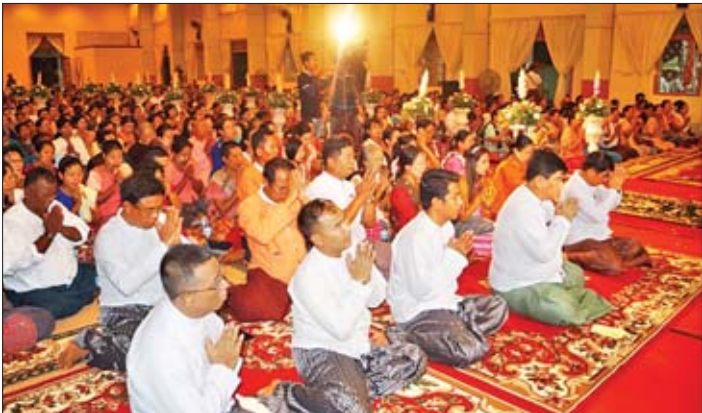
ဆရာ ဆရာမများ၊ ဒေသခံပြည်သူများ၊ ကျောင်းသား ကျောင်းသူများ၊ ဘာသာရေး၊ လူမှုရေးအသင်းအဖွဲ့များက ဖူးမြော်ကြည်ညိုကာ စေတီတော် တည်ထားကိုးကွယ်ရေးအတွက် အလှူငွေများ လှူဒါန်းကြသည်။

စကျင်ဗုဒ္ဓရုပ်ပွားတော်နှစ်ဆူ၊ ရတနာစိန်ဖူးတော်၊ ငှက်မြတ်နားတော်နှင့် ရွှေထီးတော်တို့အား ယနေ့နံနက်ပိုင်းက တပ်ကုန်းမြို့ပျဉ်းမနားမြို့မှတစ်ဆင့် လယ်ဝေးမြို့သို့ ပင့်ဆောင်ပူဇော်ရာ လမ်းဘေးဝဲယာတွင် ဌာနဆိုင်ရာများ၊