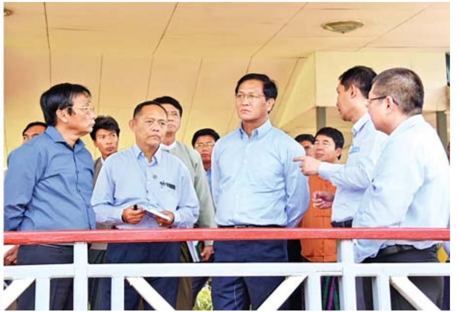
ဒုတိယသမ္မတ ဦးဟင်နရီဗန်ထီးယူ ရဲရွာရေအားလျှပ်စစ်ဓာတ်အားပေးစက်ရုံကို ကြည့်ရှုစစ်ဆေးစဉ်။