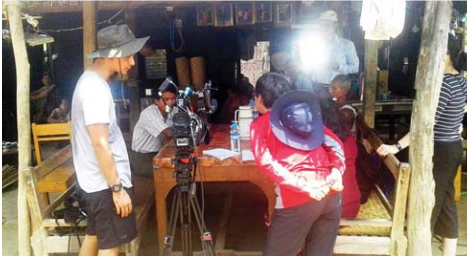
စင်ကာပူရိုက်ကူးရေးအဖွဲ့ မုံရွာမြို့ အမှတ် (၁၀)ရပ်ကွက်ရှိ ဒေသခံများအား တွေ့ဆုံမေးမြန်းနေစဉ်။

ထိုသို့ မှတ်တမ်းရိုက်ကူးခြင်းကို ကျေးလက်ဒေသ မီးလင်းရေးဆောင်ရွက်လျက်ရှိသော စစ်ကိုင်းတိုင်းဒေသ ကြီးအတွင်းရှိ ရပ်ရွာများအပြင် နေပြည်တော်နှင့် ရန်ကုန် တိုင်းဒေသကြီးအတွင်းရှိ ကျေးရွာများတွင်လည်း ယခုလ ၁၃ ရက်မှ ၁၆ ရက်အတွင်း ရိုက်ကူးနေခြင်းဖြစ်ကြောင်း၊ မှတ်တမ်းရုပ်ရှင်အပါအဝင် ရုပ်ရှင်ဇာတ်ကားရိုက်ကူးရေး ဆိုင်ရာ ဖြေလျှော့မှုများကို ပြန်ကြားရေးဝန်ကြီးဌာနနှင့် သက်ဆိုင်ရာဝန်ကြီးဌာနများ ပေါင်းစပ်ညှိနှိုင်းပြီး ယခုနှစ် ဧပြီ ၁ ရက်မှ စတင်ဆောင်ရွက်ပေးခဲ့ရာ ယခုအခါ ပြည်ပ မှ ကုန်ပစ္စည်းထုတ်လုပ်မှု ကြော်ငြာရိုက်ကူးမှုများ အပါအဝင် မှတ်တမ်းရိုက်ကူးမှုများနှင့် ရုပ်ရှင်ဇာတ်ကား ကြီးများ လာရောက်ရိုက်ကူးမှုအရေအတွက်မှာ ပိုမို များပြားလာကြောင်း သိရသည်။