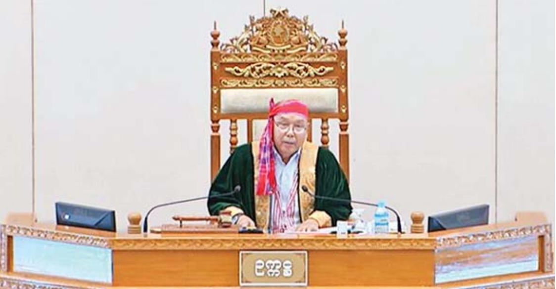
အမျိုးသားလွှတ်တော်ဥက္ကဋ္ဌ မန်းဝင်းခိုင်သန်း။

ရှမ်းပြည်နယ် မဲဆန္ဒနယ်အမှတ်(၁၁)မှ ဦးကျော်နိုင်၏ “ရန်ကုန်-မန္တလေး အမြန်လမ်းမကြီး လမ်းလယ်ကျွန်းများ ပြုပြင်မွမ်းမံခြင်း” မေးခွန်းနှင့်စပ်လျဉ်း၍ ဆောက်လုပ်ရေးဝန်ကြီးဌာန ဒုတိယဝန်ကြီး ဦးကျော်လင်းက ရန်ကုန်-မန္တလေး အမြန်လမ်းမကြီးကဲ့သို့ လေးလမ်းသွားဆိုပါက လမ်းလယ်ကျွန်းအနိမ့် Depressed Median ကို တည်ဆောက်အသုံးပြုရမည်ဖြစ်ကြောင်း၊ လက်ရှိ လမ်းလယ်ကျွန်း၏ အမြင့်သည် Raised Median ဖြစ်နေခြင်းကြောင့် အရေးပေါ် ယာဉ်များ ဝင်ရောက်ရန်ခက်ခဲခြင်း၊ မိုးရာသီတွင် လမ်းပေါ်၌ရေစီးခြင်း၊ သတ်မှတ်သည့်လမ်းပန်း များ ထည့်သွင်းတည်ဆောက်ထားမှုမရှိခြင်းကြောင့် စာမျက်နှာ ၅ ကော်လံ ၁ သို့