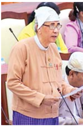
ဒုတိယဝန်ကြီး ဦးကျော်မျိုး