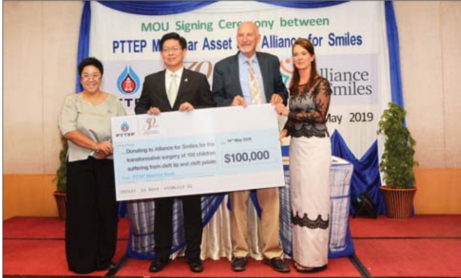
မာမာဖြင့် ကြီးထွားဖွံ့ဖြိုးမှုကို ထိခိုက်စေနိုင်ကြောင်း ၎င်းက ဆက်လက်ပြောကြားသည်။

ကလေးငယ်များ ယခုကဲ့သို့ ဖြစ်ရခြင်းအကြောင်းရင်းကို မသိရှိနိုင်ကြသေးသော်လည်း မျိုးရိုးဗီဇ၊ ကိုယ်ဝန်ဆောင် မိခင်၏ လက်ရှိဆေးဝါးကုသမှုအခြေအနေ၊ အဟာရချို့တဲ့ခြင်းနှင့် အန္တရာယ်ဖြစ်စေနိုင်သည့် ပတ်ဝန်းကျင်၌ရှိသည့် အရာဝတ္ထုများက ကလေးငယ်တစ်ယောက်၏ ကျန်းကျန်း