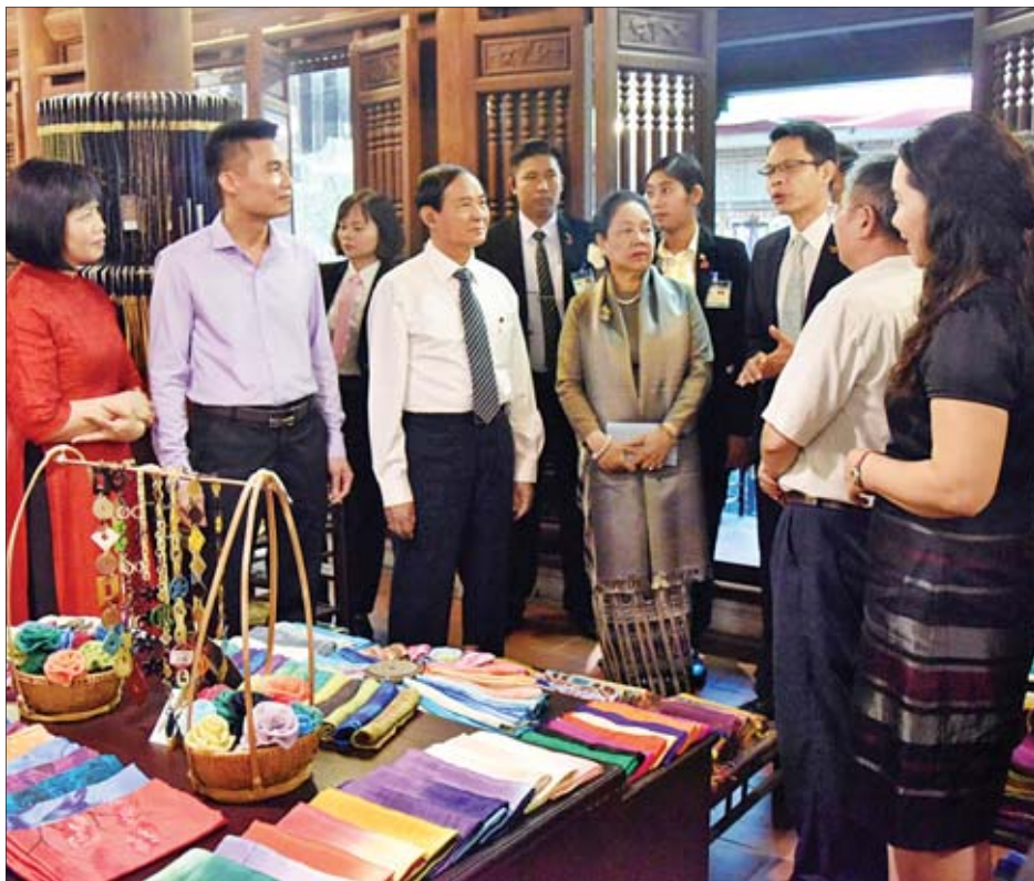
နိုင်ငံတော်သမ္မတ ဦးဝင်းမြင့်နှင့်ဇနီး ဒေါ်ချိုချို ဟာဒွန်းပိုးရွာတွင် ပိုးထည်ရက်လုပ်နေမှုနှင့် အဝတ်အထည်နှင့် လူသုံးကုန်ပစ္စည်းများ ရောင်းချနေမှုတို့ကို ကြည့်ရှုလေ့လာကြစဉ်။