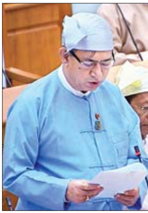
ဒုတိယဝန်ကြီး ဒေါက်တာရဲမြင့်ဆွေ