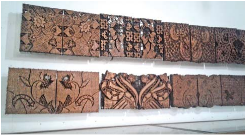
ပါတီအထည်လုပ်ငန်း