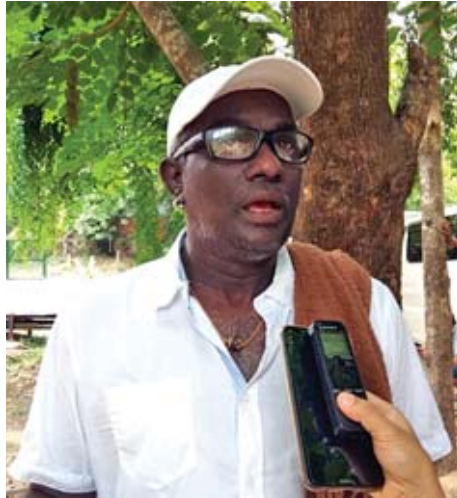
ဒါရိုက်တာ စတီးလ်

“ရုပ်ရှင်လောကကို ဒီထက် ပိုပြီးတိုးတက်အောင် နိုင်ငံတော်က လည်း ပံ့ပိုးသထက် ပံ့ပိုးနေပါတယ်။ နေပြည်တော်ကလည်း ရိုက်လို့ ကောင်းတဲ့နေရာ ဖြစ်တဲ့အတွက် ကြိုက်ပါတယ်။ မြို့ပေါ်၊ လမ်းပေါ်မှာ