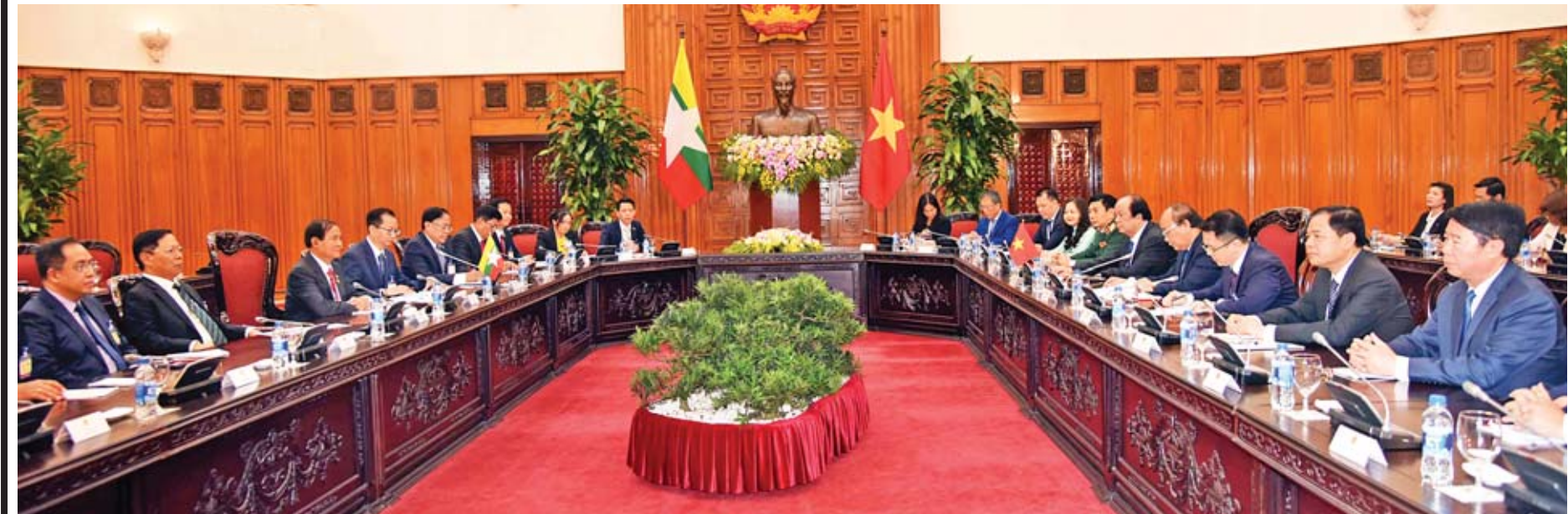
နိုင်ငံတော်သမ္မတ ဦးဝင်းမြင့် ဦးဆောင်သော ကိုယ်စားလှယ်အဖွဲ့နှင့် ဝိယက်နမ်နိုင်ငံဝန်ကြီးချုပ် မစ္စတာ ငုယင်စွမ်းဖု ဦးဆောင်သော ကိုယ်စားလှယ်အဖွဲ့တို့ တွေ့ဆုံဆွေးနွေးစဉ်။

နိုင်ငံတော်သမ္မတသည် ယင်းနေ့ နေ့လယ်ပိုင်းတွင် တည်းခိုရာဟိုတယ် ၌ ဝိယက်နမ်-မြန်မာ ပါလီမန်ချစ်ကြည်ရေးအသင်းဥက္ကဋ္ဌနှင့် အဖွဲ့ဝင်များ အား လက်ခံတွေ့ဆုံခဲ့သည်။ ယင်းသို့ တွေ့ဆုံစဉ် မြန်မာ-ဝိယက်နမ် လွှတ်တော်နှစ်ရပ်အကြား ထူထောင်ထားရှိသည့် ချစ်ကြည်ရေးအသင်းများ အကြား အပြန်အလှန်ခရီးစဉ်များ စာမျက်နှာ ၅ သို့ □