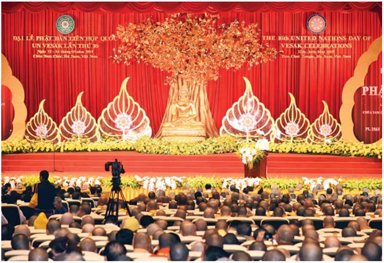
နိုင်ငံတော်သမ္မတ ဦးဝင်းမြင့် (၁၆)ကြိမ်မြောက် ကုလသမဂ္ဂပုဒ္ဒေန အခမ်းအနားတွင် မိန့်ခွန်းပြောကြားစဉ်။

အလှည့်ကျပြုစုမှုအဖြစ် တာဝန်ထမ်းဆောင်ရာတွင် နီးကပ်စွာ ညှိနှိုင်း ဆောင်ရွက်သွားရေး ကိစ္စရပ်များနှင့် ၂၀၂၀-၂၀၂၁ ကာလအတွက် ကုလသမဂ္ဂ လုံခြုံရေးကောင်စီ၏ အမြဲတမ်းမဟုတ်သော အဖွဲ့ဝင်အဖြစ် အရွေးချယ်ခံမည့် ဝိယက်နမ်နိုင်ငံအား မြန်မာနိုင်ငံမှ ထောက်ခံမှုပေးရေးကိစ္စများကို ဆွေးနွေး ခဲ့ကြသည်။