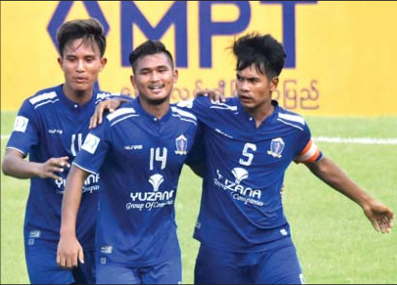
ရှုံးထွက်ပွဲကစားမည့် Southern အသင်း။