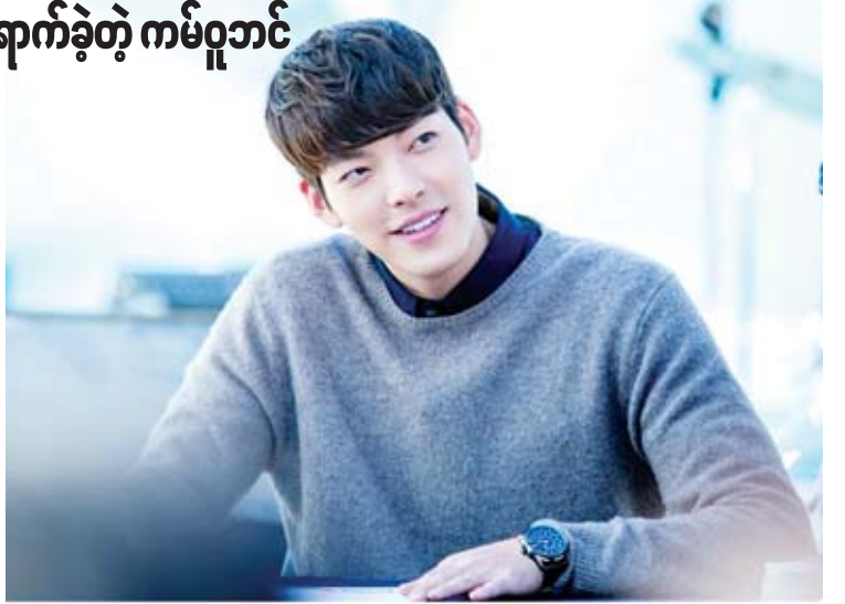
တာတွေကို ပုံမှန်လုပ်ဆောင်နေကြောင်း၊ နောင်တစ်ချိန်မှာတော့ အနုပညာလုပ်ရမှာမို့တွေကို ပြန်လည်လုပ်ဆောင်မှာဖြစ်ကြောင်း ပြောကြားခဲ့တယ်လို့လည်း သိရပါတယ်။

မင်းသားရဲ့ဖျော်ဖြေရေးအေဂျင်စီက ကိုးကွယ်ယုံကြည်မှုဟာ ပုဂ္ဂိုလ်ရေးဖြစ်တာကြောင့် အေဂျင်စီအနေနဲ့ တစ်စုံတစ်ရာ ဝေဖန်ပြောကြားမှာမဟုတ်ဘဲ ကမ်ဂျာနအနေနဲ့ သူယုံကြည်ရာ ဘာသာတရားကို ကိုးကွယ်နိုင်တယ်လို့ အေဂျင်စီက ပြောကြားခဲ့ပါတယ်။