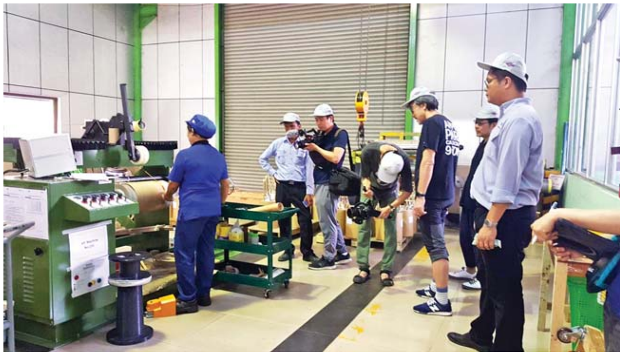
စက်ရုံအတွင်း ဝန်ထမ်းများ အလုပ်လုပ်နေမှုကို ရိုက်ကူးစဉ်။

ရန်ကုန် မေ ၁၄ ဂျပန်နိုင်ငံမှ ရှစ်ဦးပါ ရိုက်ကူးရေးအဖွဲ့သည် ယနေ့တွင် ရန်ကုန်တိုင်းဒေသကြီး တောင်ဒဂုံ စက်မှုဇုန်ရှိ Transformer ထုတ်လုပ်မှုလုပ်ငန်းခွင်သို့ လာရောက်ပြီး သတင်းမှတ်တမ်းရိုက်ကူးသည်။