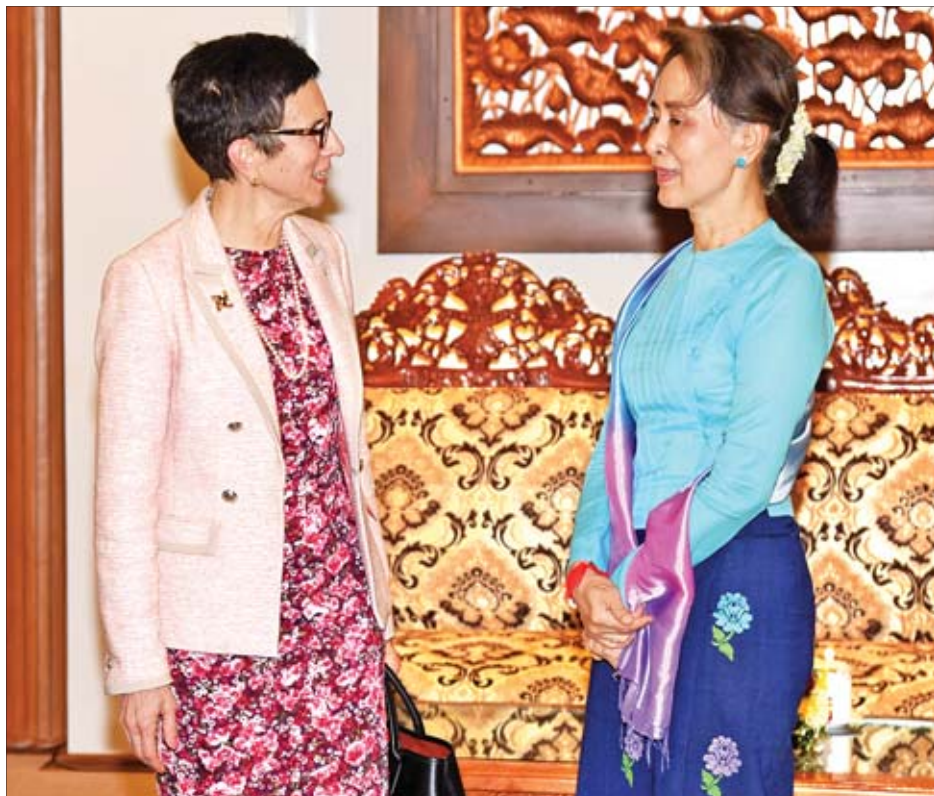
နိုင်ငံတော်၏အတိုင်ပင်ခံပုဂ္ဂိုလ် ဒေါ်အောင်ဆန်းစုကြည် လူသားချင်းစာနာထောက်ထားမှုရေးရာ လက်ထောက် အတွင်းရေးမှူးချုပ်နှင့် ကုလသမဂ္ဂ လူသားချင်းစာနာထောက်ထားမှုရေးရာ ညှိနှိုင်းရေးရုံး(UNOCHA)၏ အရေး ပေါ်ကယ်ဆယ်ရေးဆိုင်ရာ ဒုတိယညှိနှိုင်းရေးမှူး Ms. Ursula Mueller အား လက်ခံတွေ့ဆုံစဉ်။

လက်ထောက်အတွင်းရေးမှူးချုပ်အား လက်ခံတွေ့ဆုံ