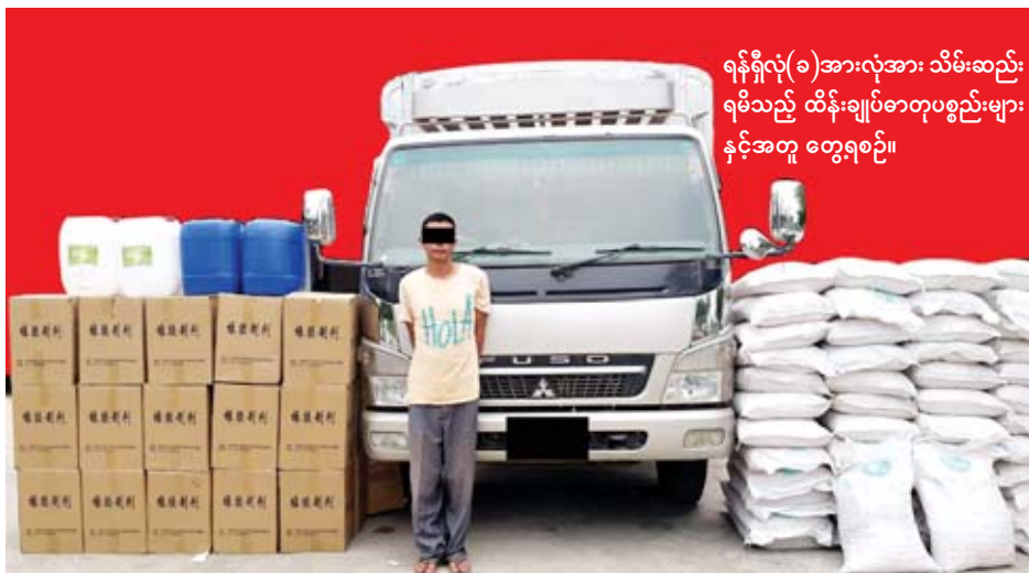
ရန်ကင်း(ခ)အားလုံးအား သိမ်းဆည်းရမိသည့် ထိန်းချုပ်စာတုပစ္စည်းများနှင့်အတူ တွေ့ရစဉ်။