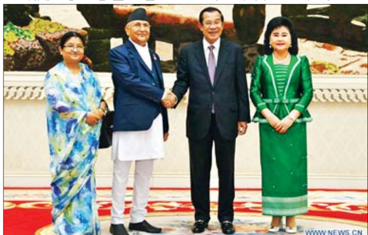
ကမ္ဘောဒီးယားဝန်ကြီးချုပ် ဆမ်ဒက် တွန်ဆမ် (ဒုတိယကနေ) နှင့် နီပေါဝန်ကြီးချုပ် ဂေပီရှာမာအိုလီ (တတိယကနေ) တို့သည် ဖနောင်ပင်မြို့တော်၌ ကုန်သွယ်မှုနှင့် ရင်းနှီးမြှုပ်နှံမှုဆိုင်ရာ သဘောတူညီချက်များ လက်မှတ်ရေးထိုးပွဲအခမ်းအနားကို သဘာဝပတ်ဝန်းကျင်နှင့် ရင်းနှီးမြှုပ်နှံမှုမဟာဏ္ဍာများတွင် နှစ်နိုင်ငံကြား ပူးပေါင်းဆောင်ရွက်မှု တိုးမြှင့်ရေး အတွက်လက်တွဲဆောင်ရွက်ရန် အစည်းအဝေးအတွင်း နှစ်နိုင်ငံစလုံးက သဘောတူညီခဲ့သည်ဟု ၎င်းက ပြောကြားသည်။

ကမ္ဘောဒီးယားဝန်ကြီးချုပ် ဆမ်ဒက် တွန်ဆမ်နှင့် အလည်အပတ်ရောက်ရှိနေသော နီပေါဝန်ကြီးချုပ် ဂေပီရှာမာအိုလီတို့သည် ဖနောင်ပင်မြို့တော်၌ နှစ်နိုင်ငံကြား အစည်းအဝေးတစ်ရပ် ကျင်းပပြီးနောက် လက်မှတ်ရေးထိုးပွဲအခမ်းအနားကို သဘာ