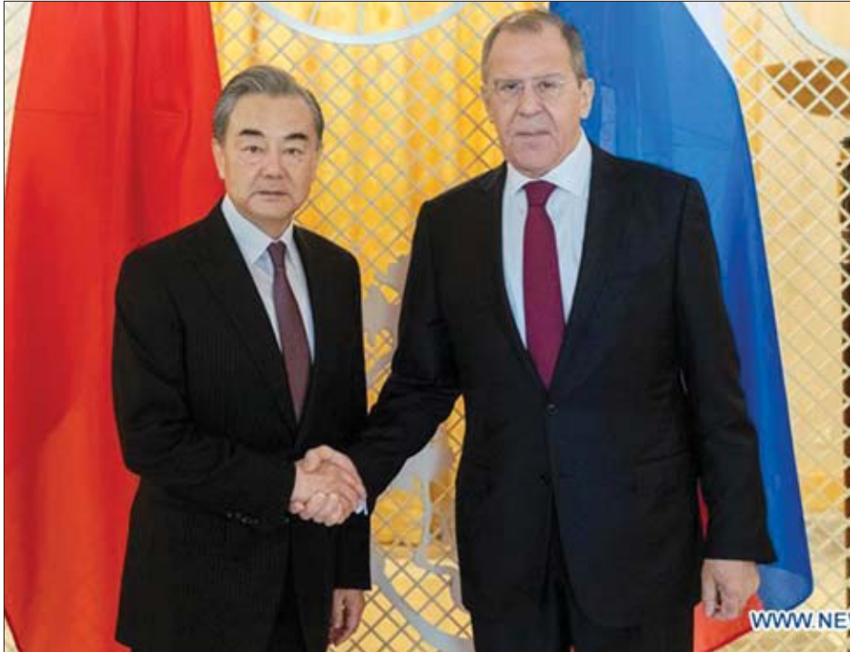
တရုတ်နိုင်ငံခြားရေးဝန်ကြီး ဝမ်ယီနှင့် ရုရှားနိုင်ငံခြားရေးဝန်ကြီး ဆာဂျီလက်ဗရော့ပ်တို့ ရုရှားနိုင်ငံ ဆိုချီမြို့၌ မေ ၁၃ ရက်က တွေ့ဆုံစဉ်။