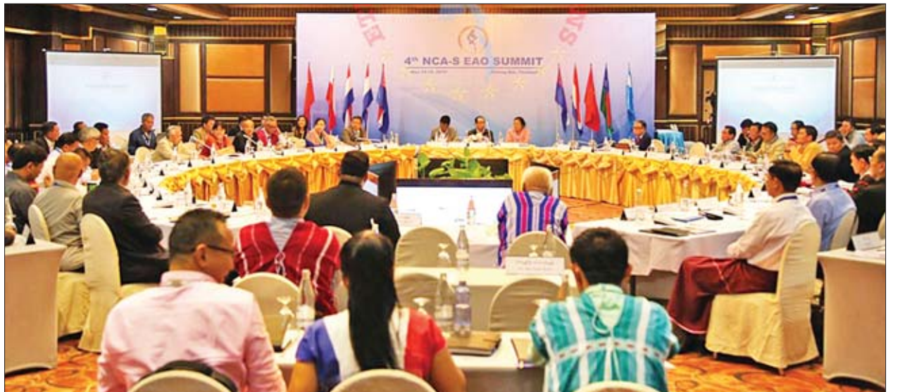
NCA လက်မှတ်ရေးထိုးထားသည့် တိုင်းရင်းသားလက်နက်ကိုင်အဖွဲ့အစည်းများ၏ ထိပ်သီးခေါင်းဆောင်များ စတုတ္ထအကြိမ် အစည်းအဝေး ပထမနေ့ ကျင်းပစဉ်။

“NCA စာချုပ် လက်မှတ်ရေးထိုးထားတဲ့ ညီနောင်အဖွဲ့အစည်းအချို့နဲ့ တပ်မတော်တို့အကြား တိုက်ပွဲဖြစ်နေတာဟာ ပြည်ထောင်စုအတွက် ကြီးမားတဲ့ပြဿနာပဲ ဖြစ်ပါတယ်။ ပြဿနာအရပ်ရပ်ကို ဖြေရှင်းဖို့ဟာ ငြိမ်းချမ်းရေးက အခရာဖြစ်ပါတယ်။ ငြိမ်းချမ်းရေးလုပ်ငန်းစဉ် ပျက်ပြားရင်