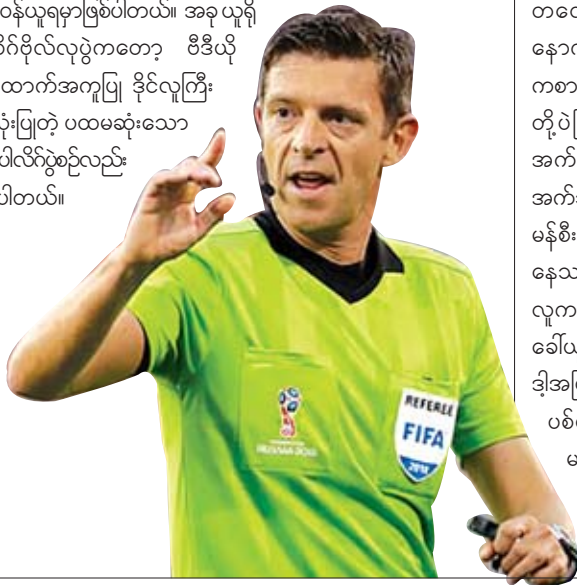
ရလဒ် ခုနှစ်ဂိုး-သုံးဂိုးနဲ့ အနိုင်ရရှိခဲ့တာ ဖြစ်ပြီး ချယ်လ်ဆီးအသင်း