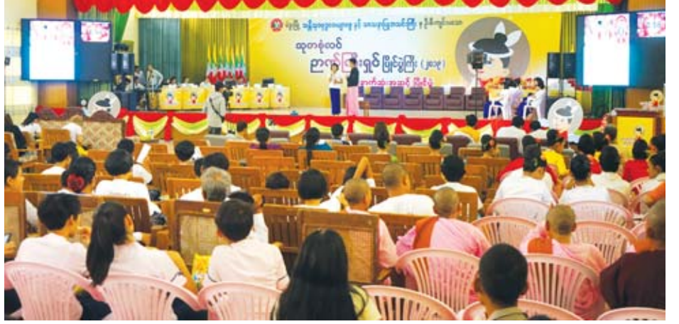
အောင် ဆောင်ရွက်ခြင်းများဖြင့် အစွမ်းကုန်ကြိုးစား အားထုတ်ကြရန်၊ သင်ကြားပေးသော ဘာသာရပ်များကို စနစ်တကျ လေ့လာသင်ကြားပြီး ကြိုးစားဖြေဆိုနိုင်ကြရန်

သုတစုံလင်ဉာဏ်ကြီးရှင်ပြိုင်ပွဲကြီးကို ကလေးငယ်များ ပညာရည်ပြည့်ဝစေရန်နှင့် လိမ္မာရေးခြားရှိစေရန် နိုင်ငံတကာသုံး အင်္ဂလိပ်ဘာသာစကား ကျွမ်းကျင်မှုမှတစ်ဆင့် အခြားပညာရပ်များအား လွယ်လင့်တကူ လေ့လာဆည်းပူးနိုင်စေရန်၊ အနာဂတ်တွင် စည်းကမ်းပြည့်ဝသော နိုင်ငံသားကောင်းရတနာများ ဖြစ်လာစေရန်၊ ငြိမ်းချမ်းရေး၏ အခြေခံသဘောတရားများကို သိရှိနားလည်ပြီး ငြိမ်းချမ်းရေးကို အလေးထား တန်ဖိုးထားဖော်ဆောင်တတ်သူများ ဖြစ်လာစေရန်၊ ဗဟုသုတပြည့်စုံပြီး တွေးခေါ်မြော်မြင်တတ်သော အနာဂတ်တိုင်းပြည်အကျိုးပြု နိုင်ငံသားကောင်းများ ဖြစ်ထွန်းပေါ်ပေါက်လာစေရန် ရည်ရွယ်ကျင်းပခြင်းဖြစ်ပြီး လူငယ်များသည် နိုင်ငံတော်၏ အနာဂတ်ဖြစ်ကြောင်း၊ ကျောင်းသူ ကျောင်းသားများ အနေဖြင့် မိမိကျောင်း၊ မြို့နယ်၏ ဝန်ထမ်းကွက် မြှင့်တင်သောအားဖြင့် ကာယဗလ၊ ဉာဏဗလ၊ ဖြိုးတိုးတက်