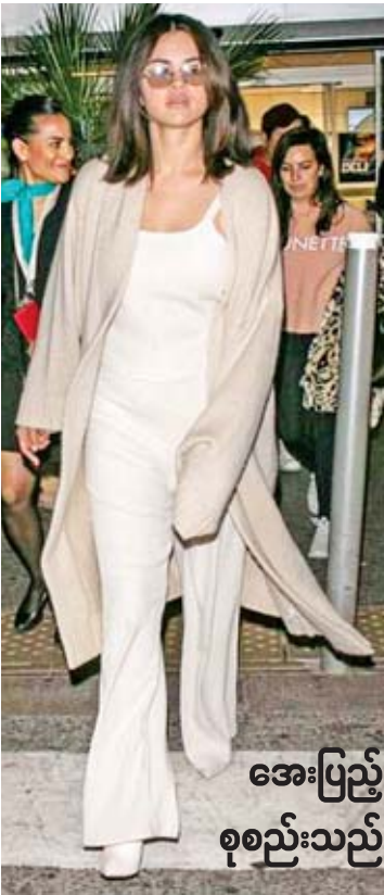
အေးပြည် စုစည်းသည်