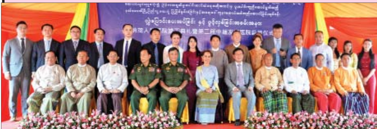
နိုင်ငံတော်၏အတိုင်ပင်ခံပုဂ္ဂိုလ် ဒေါ်အောင်ဆန်းစုကြည်၊ ပြည်ထောင်စုဝန်ကြီးများ၊ တိုင်းဒေသကြီးဝန်ကြီးချုပ်၊ တရုတ်သံအမတ်ကြီး မစ္စတာ ဟုန်လျန်နှင့် တရုတ်- မြန်မာ ချစ်ကြည်ရေးဆေးရုံ တည်ဆောက်ရေးလုပ်ငန်းတွင် ပါဝင်လှူဒါန်းခဲ့ကြသူများ စုပေါင်းမှတ်တမ်းတင်ဓာတ်ပုံရိုက်စဉ်။