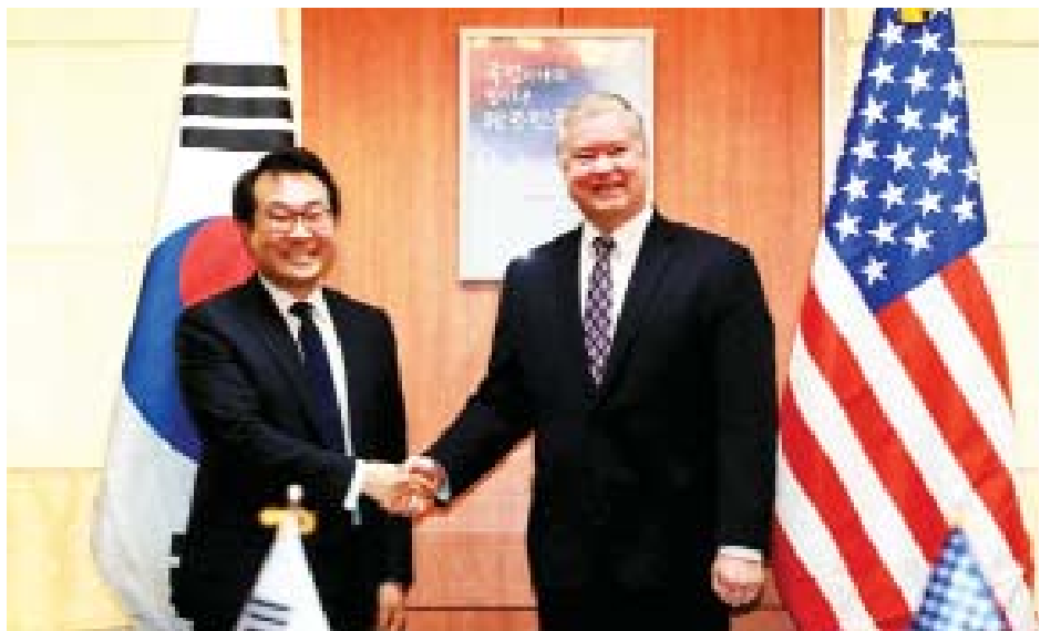
တောင်ကိုရီးယား အထူးကိုယ်စားလှယ် လီဒိုဟွန်