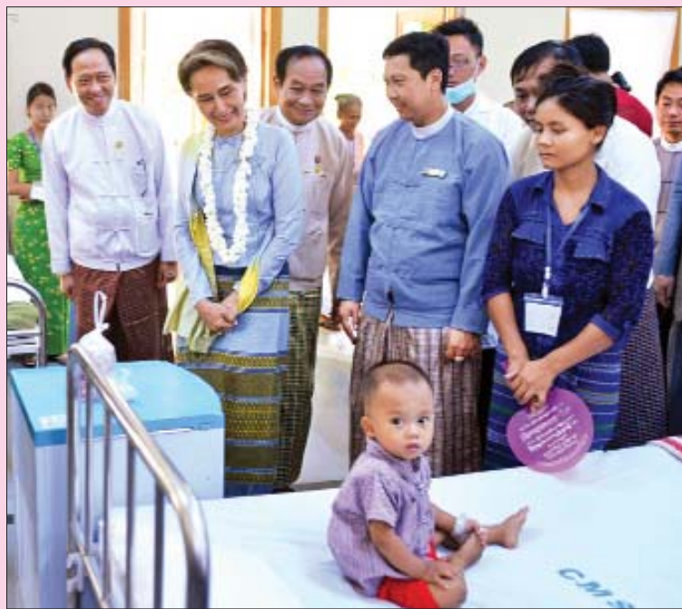
နတ်မောက်ပြည်သူ့ဆေးရုံတွင် လှည့်လည်ကြည့်ရှုစဉ်။