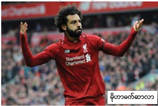
မိုဟာမက်ဆာလာ

ချယ်လ်ဆီအသင်းဟာ ဖရန့်ဖက်အသင်းနဲ့ ပထမအကျောမှာ တစ်ဖက်တစ်ဂိုးစီ သရေရလဒ်ထွက်ပေါ်ခဲ့ပြီး ဒုတိယအကျောမှာလည်း သာမန်ပွဲကစားချိန်အတွင်း တစ်ဖက်တစ်ဂိုးစီသရေရလဒ်သာ ထွက်ပေါ်ခဲ့တာကြောင့် ပင်နယ်တီအဆုံးအဖြတ်ခံယူခဲ့ရာမှာ လေးဂိုး-သုံးဂိုးနဲ့ ချယ်လ်ဆီအသင်းက အနိုင်ရရှိပြီး နှစ်ကျောပေါင်းခြောက်ဂိုး-ငါးဂိုးနဲ့ နောက်ဆုံးဗိုလ်လုပွဲတက်လှမ်းနိုင်ခဲ့တာဖြစ်ပါတယ်။