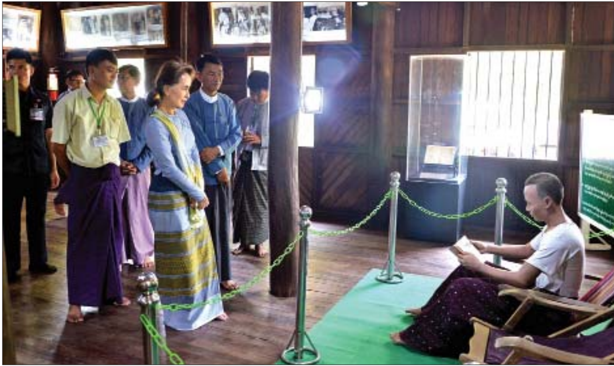
နိုင်ငံတော်၏အတိုင်ပင်ခံပုဂ္ဂိုလ် ဒေါ်အောင်ဆန်းစုကြည် ဝိုလ်ချုပ်အောင်ဆန်းနေအိမ်ပြတိုက်၌ လှည့်လည်ကြည့်ရှုစဉ်။

များကို ပြည်ထောင်စုဝန်ကြီး ဒေါက်တာမြင့်ထွေးထံ လွှဲပြောင်းပေးအပ်သည်။ ယင်းနောက် မကွေးတိုင်းဒေသကြီး ဝန်ကြီးချုပ်က နတ်မောက်မြို့ပြည်သူ့ဆေးရုံ အရေးပေါ်နှင့် ပြင်ပလူနာဌာန အဆောက်အအုံသစ်ဆောက်လုပ်ရာတွင် ပူးပေါင်းကူညီ ဆောင်ရွက်ပေးခဲ့သည့် မြန်မာ-တရုတ် ပူးပေါင်းဆက်ဆံရေး ဗဟိုအသင်း၊ အရည်အသွေးကောင်းမွန်စွာ တာဝန်ယူတည်ဆောက်ပေးခဲ့သည့် Art Wave Co., Ltd.၊ ဆေးရုံသုံးပစ္စည်းကိရိယာများတပ်ဆင်ပေးသော China Sinopharm International Corporation၊ အမျိုးသားခေါင်းဆောင်ကြီး ဝိုလ်ချုပ်အောင်ဆန်း၏ပုံတူရုပ်တုအား ထုလုပ်လှူဒါန်းသော Fujian Nanshan Group နှင့် ဆေးရုံအတွက် ရေစင်လျှော့ဒါနိုင်းသော ၁၉၇၆-၁၉၈၂ ဆေးတက္ကသိုလ်(၁)ကျောင်းသား ကျောင်းသူဟောင်းများအဖွဲ့တို့အား ဂုဏ်ပြုမှတ်တမ်းလွှာများပေးအပ်ပြီး ကျေးဇူးတင်စကားပြောကြားသည်။