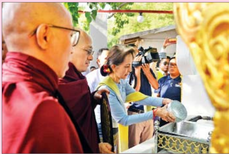
မဟာဗောဓိပင်အား ရေစင်သွန်းလောင်းပူဇော်စဉ်။