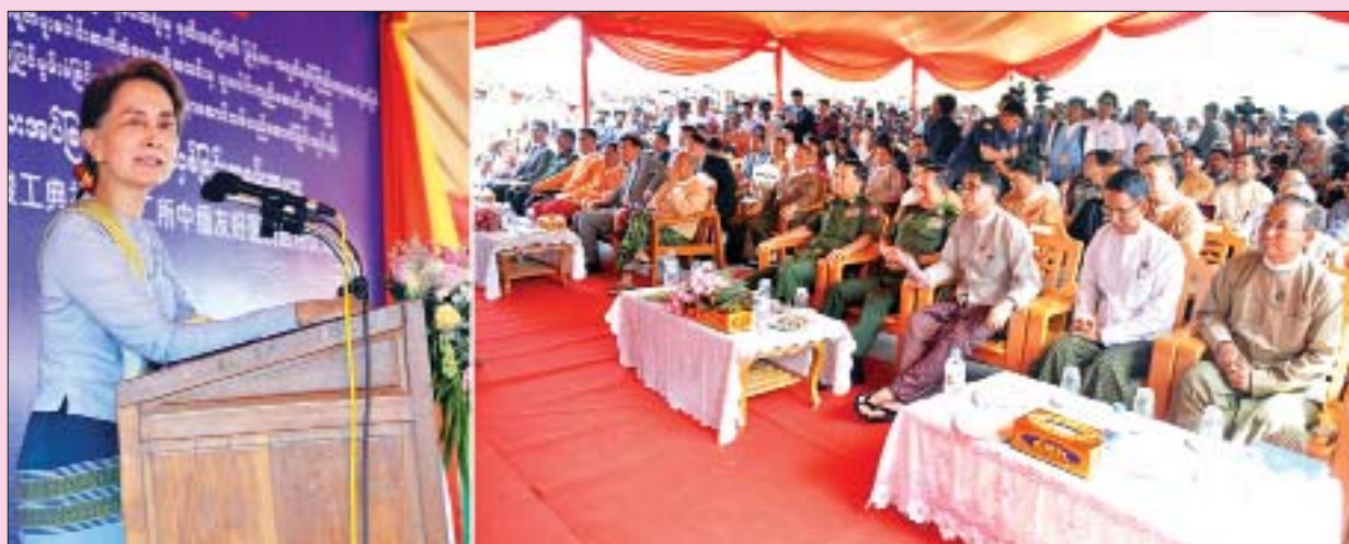
နိုင်ငံတော်၏အတိုင်ပင်ခံပုဂ္ဂိုလ် ဒေါ်အောင်ဆန်းစုကြည် နတ်မောက်မြို့ပြည်သူ့ဆေးရုံ အရေးပေါ်နှင့် ပြင်ပလူနာ အဆောက်အအုံသစ် လှူပြောင်းပေးအပ်ခြင်း အခမ်းအနားတွင် အမှာစကားပြောကြားစဉ်။