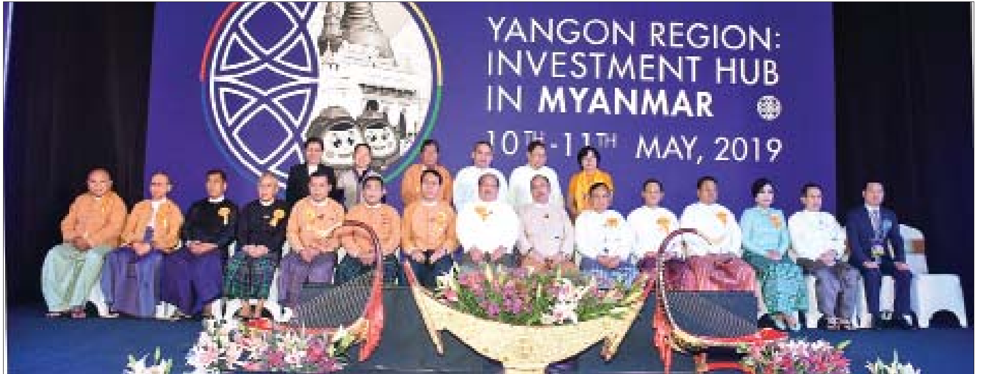
ရန်ကုန်ရင်းနှီးမြှုပ်နှံမှုဖိုရမ် ၂၀၁၉ ဖွင့်ပွဲအခမ်းအနားသို့ တက်ရောက်သူများ စုပေါင်းမှတ်တမ်းတင်ဓာတ်ပုံရိုက်ကြစဉ်။