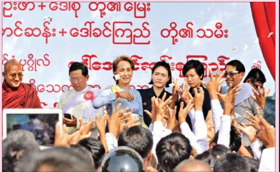
နတ်မောက်မြို့ဒီပက်ရာကျောင်းတိုက်၌ ကျင်းပသည့် အလှူပွဲ။