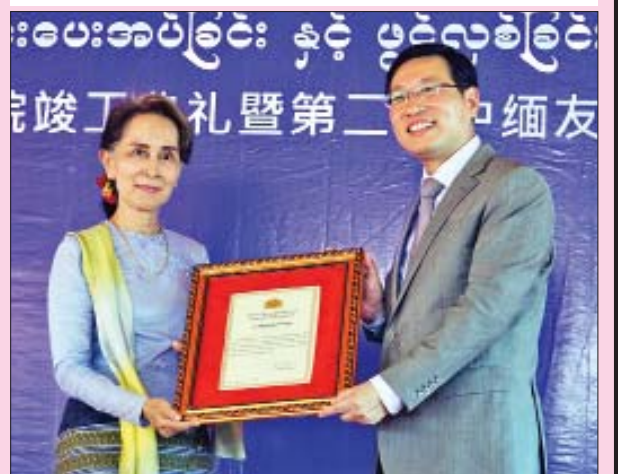
နိုင်ငံတော်၏အတိုင်ပင်ခံပုဂ္ဂိုလ် ဒေါ်အောင်ဆန်းစုကြည် တရုတ်သံအမတ်ကြီး မစ္စတာ ဟုန်လျန်အား ဂုဏ်ပြုမှတ်တမ်းလွှာ ပေးအပ်စဉ်။