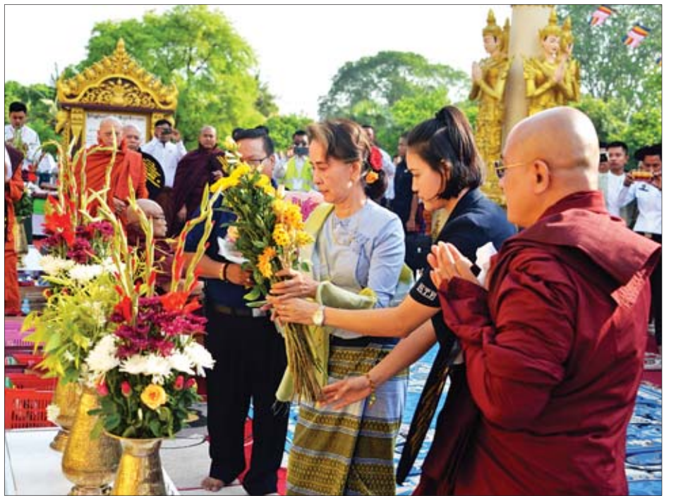
နိုင်ငံတော်၏အတိုင်ပင်ခံပုဂ္ဂိုလ် ဒေါ်အောင်ဆန်းစုကြည် ပိုလ်ချုပ်အောင်ဆန်း၏ ဘိုးဘွား မိဘများ တည်ထား ကိုးကွယ်ခဲ့ကြသည့် သစ္စာအောင်၊ မေတ္တာအောင်၊ ပညာအောင် စေတီတော်များအား ပန်း၊ ရေချမ်း၊ ဆီမီး ကပ်လှူ ပူဇော်စဉ်။