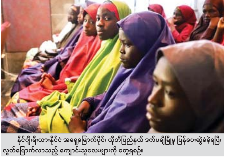
နိုင်ငံခြားရေးများနိုင်ငံ အရှေ့မြောက်ပိုင်း ယိုဘီပြည်နယ် ဒက်ပချိုမြို့မှ ပြန်ပေးဆွဲခဲ့ရပြီး လွတ်မြောက်လာသည့် ကျောင်းသူလေးများကို တွေ့ရစဉ်။

ပေးရန် ၂၀၁၃ ခုနှစ်က ဖွဲ့စည်းထူထောင်ခဲ့သော်လည်း ယင်းအဖွဲ့သည် ရာခိုင်နှုန်းချာသာ ကလေးများကို လူသစ်စုဆောင်းထားကြောင်း ယူနီဆက်၏ပြောကြားချက်အရ သိရသည်။ အရပ်ဘက် ပူးတွဲအထူးတာဝန်တပ်ဖွဲ့သည် လူသစ်စုဆောင်းမှု အဆုံးသတ်ရန်နှင့် ယခင်က ဖမ်းဆီးခံထားရသည့် ကလေးများအား ပြန်လည်လွှတ်ပေးရေးဆိုင်ရာ ကတိကဝတ်စာချုပ်ကို ၂၀၁၇ ခုနှစ်တွင် လက်မှတ်ရေးထိုးခဲ့သည်။ ထိုအချိန်မှစ၍ စုဆောင်းထားသည့် ကလေး ၁၇၂ ယောက်ကို လွတ်မြောက်ခွင့် ပေးခဲ့သော်လည်း လောလောဆယ်ထိန်းသိမ်းထားဆဲ ကလေးဦး ရေကိုမူ အတိအကျ မသိရသေးကြောင်း သို့သော် မေ ၁၀ ရက်က ကလေး ၈၉၄ ယောက် လွတ်မြောက်ခွင့်ပေးမှုအပေါ် ကုလသမဂ္ဂက ကြိုဆိုကြောင်း ယူနီဆက်က ပြောကြားသည်။ နိုင်ငံခြားရေးများနိုင်ငံအရှေ့မြောက်ဘက်တွင် အစွလာမစ်နိုင်ငံတော် ထူထောင်ရန် ဘိုကိုဟာရမ်စစ်သွေးကြွအုပ်စု၏ ဆယ်စုနှစ်ကြာ အကြံပေးသည့် ယခုအခါ အိမ်နီးချင်းနိုင်ငံများဖြစ်သည့် နိုင်ဂျာ၊ ချာဒ်နှင့် ကင်မရွန်းနိုင်ငံတို့သို့ ကူးစက်ပျံ့နှံ့သွားကြောင်း သိရသည်။ ကိုးကား-အေအက်ဖ်ပီ ဘာသာပြန်-ဂျေတီ