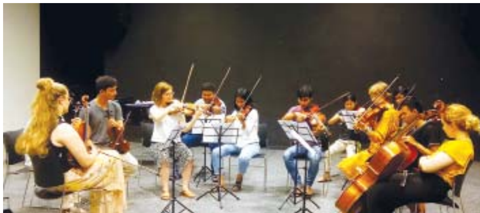
၂၀၁၉ ဥရောပနေ ဂီတဖျော်ဖြေပွဲအတွက် လေ့ကျင့်တီးခတ် ပြင်ဆင်နေကြစဉ်။

ရန်ကုန် မေ ၁၀ ၂၀၁၉ ဥရောပနေအထိမ်းအမှတ် အဖြစ် ဥရောပနှင့် မြန်မာတွေ့ဆုံခြင်း (EU Meets Myanmar) ဂီတဖျော်ဖြေပွဲကို မြန်မာနိုင်ငံဆိုင်ရာ ဥရောပ သမဂ္ဂကိုယ်စားလှယ်အဖွဲ့က ကြီးမှူး၍ မေ ၁၀ ရက် ညနေပိုင်းတွင် ရန်ကုန်