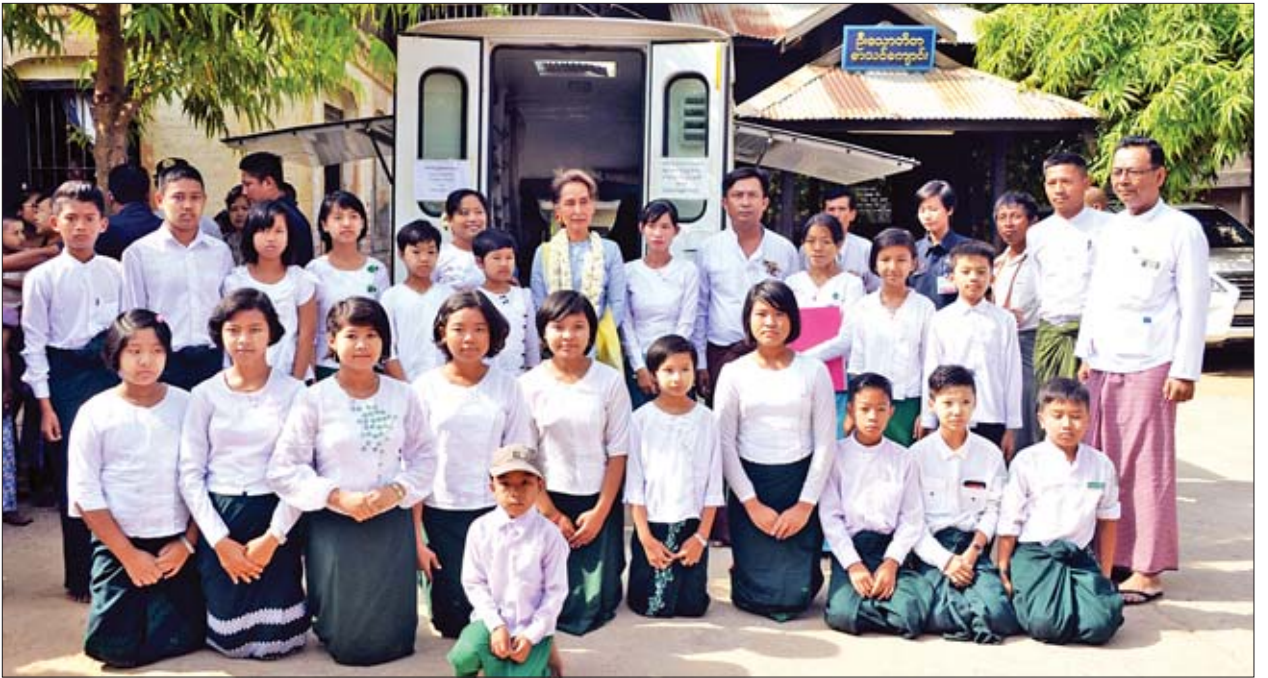
နိုင်ငံတော်၏အတိုင်ပင်ခံပုဂ္ဂိုလ် ဒေါ်အောင်ဆန်းစုကြည် ဒေါ်ခင်ကြည်ဖောင်ဒေးရှင်း ရွှေလျားစာကြည့်တိုက်ယာဉ်ရှေ့ ကျောင်းသား ကျောင်းသူများနှင့် စုပေါင်းမှတ်တမ်းတင်ဓာတ်ပုံရိုက်စဉ်။

ယင်းနောက် နိုင်ငံတော်၏အတိုင်ပင်ခံပုဂ္ဂိုလ်နှင့် ပရိသတ်များက ရွှေပါရမီတောရဆရာတော် အရှင်ဆန္ဒာဓိကထံမှ ငါးပါးသီလခံယူဆောက်တည်