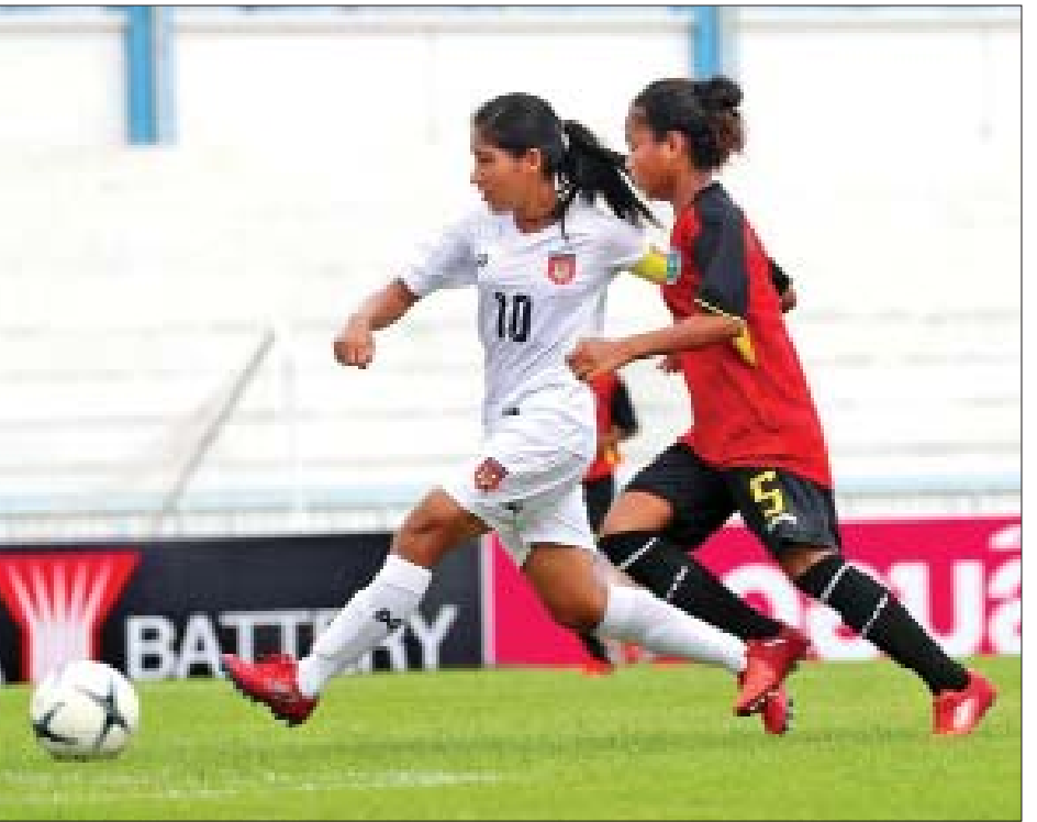
မြန်မာနှင့် တီမောအသင်း ယှဉ်ပြိုင်နေစဉ်။

နေပြည်တော် မေ ၁၀ ၂၀၁၉ အာဆီယံ ယူ-၁၅ အမျိုးသမီး ပြိုင်ပွဲ အုပ်စု (က) ပထမနေ့ကို ယနေ့ညနေပိုင်းက ထိုင်းနိုင်ငံ ချောင်ဘူရီ မြို့၌ ကျင်းပရာ မြန်မာအသင်း ဂိုးပြတ်အနိုင်ရခဲ့သည်။ မြန်မာ ယူ-၁၅ - ၂၆ ဂိုး တီမော ယူ-၁၅ - ဂိုးမရှိ မြန်မာအသင်းသည် တီမောအသင်းကို ခြေစွမ်းပြကစားကာ ဂိုးပြတ်သွင်းယူပြီး အဖွင့်လှသွားခဲ့သည်။ မြန်မာအသင်းသည် တီမောကို အဘက်ဘက်က အသာစီးရခဲ့ပြီး ဂိုးနှစ်ဒါဇင်ကျော် သွင်းယူနိုင်ခဲ့ခြင်း ဖြစ်သည်။ မြန်မာအသင်းသည် ပထမပိုင်းတွင် ၁၅ ဂိုး၊ ဒုတိယပိုင်းတွင် ၁၁ ဂိုးသွင်းခဲ့ပြီး ဆုမြတ်နိုးက တစ်ဦးတည်း ခုနစ်ဂိုးသွင်းကာ ဂိုးအများဆုံး သွင်းပေးခဲ့သည်။ မြန်မာအသင်းသည် ယခုပွဲ ဂိုးပြတ်အနိုင်ရလဒ်ကြောင့် စာမျက်နှာ ၁၀ ကော်လံ ၁ သို့ ❖