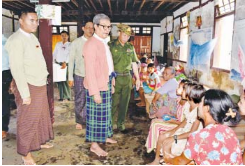
စစ်တွေ မေ ၁၀

ရခိုင်ပြည်နယ်ဝန်ကြီးချုပ် ဦးညီပုသည် ပြည်နယ် လုံခြုံရေးနှင့် နယ်စပ်ရေးရာဝန်ကြီး ဝိုလ်မျိုးကြီး ဖုန်းတင့်၊ ဌာနဆိုင်ရာတာဝန်ရှိသူများနှင့်အတူ မေ ၁၀ ရက် နံနက်ပိုင်းတွင် စစ်တွေမြို့လမ်းမတော် တောင်ရပ်ကွက်ရှိ အမျိုးသားဘုန်းတော်ကြီး