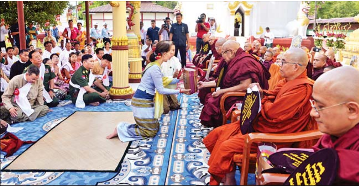
နိုင်ငံတော်၏အတိုင်ပင်ခံပုဂ္ဂိုလ် ဒေါ်အောင်ဆန်းစုကြည် ဆရာတော်၊ သံဃာတော်များအား လှူဖွယ်ပစ္စည်းများ ဆက်ကပ်လှူဒါန်းစဉ်။