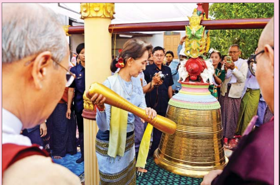
ငြိမ်းချမ်းရေးခေါင်းလောင်းတော်အား ကိုးချက်ထိုးခတ်စဉ်။