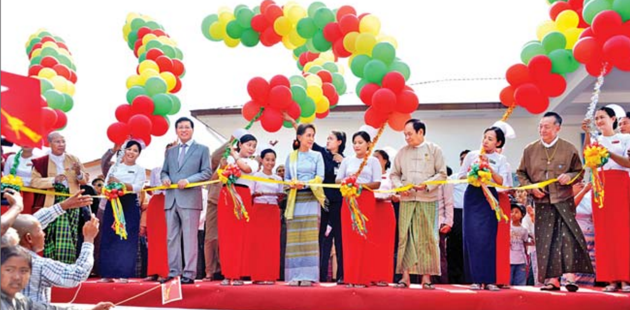
နိုင်ငံတော်၏အတိုင်ပင်ခံပုဂ္ဂိုလ် ဒေါ်အောင်ဆန်းစုကြည်၊ ပြည်ထောင်စုဝန်ကြီး ဒေါက်တာမြင့်ထွေး၊ မကွေးတိုင်းဒေသကြီး ဝန်ကြီးချုပ် ဒေါက်တာ အောင်မိုးညို၊ တရုတ်သံအမတ်ကြီး မစ္စတာဟုန်လျန်၊ မြန်မာ-တရုတ်ပူးပေါင်းဆက်ဆံရေးဗဟိုအသင်းမှ ဂုဏ်ထူးဆောင်ဥက္ကဋ္ဌ ဦးချောင်တို့က နတ်မောက်ပြည်သူ့ ဆေးရုံ အရေးပေါ်နှင့် ပြင်ပလူနာဌာန အဆောက်အအုံသစ်ကို ဖွင့်ပွဲဖြတ်ဖွင့်လှစ်ပေးစဉ်။

အခမ်းအနားတွင် နိုင်ငံတော်၏အတိုင်ပင်ခံပုဂ္ဂိုလ်က မိမိတို့ပြည်သူများ အရည်အချင်းရှိရန် လိုအပ်သလို ကျန်းမာရန်လည်း လိုအပ်ပါကြောင်း၊ ထို့အတွက် ပြည်သူများအနေဖြင့် ကျန်းမာရေးကို အလေးထားရန်လိုအပ်ပါကြောင်း၊ ယခု ဆေးရုံဖြူပြင်မွမ်းမံနိုင်သည့်အတွက် နတ်မောက်မြို့နယ်မှ ပြည်သူများ သာမက မကွေးတိုင်းဒေသကြီးမှ ပြည်သူများ၏ စာမျက်နှာ ၅ သို့