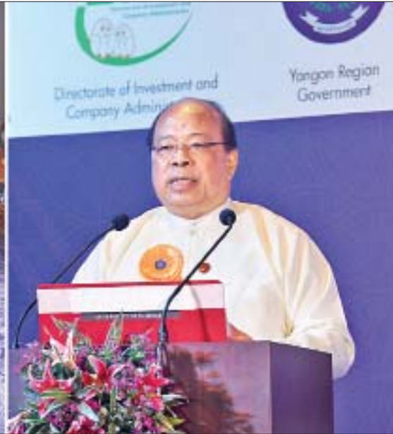
ပြည်ထောင်စုဝန်ကြီး ဦးသောင်းထွန်း ရန်ကုန်ရင်းနှီးမြှုပ်နှံမှုဖိုရမ် ၂၀၁၉ ဖွင့်ပွဲအခမ်းအနားတွင် အမှာစကားပြောကြားစဉ်။

ရန်ကုန် မေ ၁၀ ရန်ကုန်တိုင်းဒေသကြီး အစိုးရအဖွဲ့နှင့် ရန်ကုန်တိုင်းဒေသကြီး ရင်းနှီးမြှုပ်နှံမှု ကော်မတီတို့၏ ကမကထဖြင့် မြန်မာနိုင်ငံ ရင်းနှီးမြှုပ်နှံမှုကော်မရှင်နှင့် ရင်းနှီးမြှုပ်နှံမှုနှင့် နိုင်ငံခြားစီးပွား ဆက်သွယ်ရေးဝန်ကြီးဌာန ရင်းနှီးမြှုပ်နှံမှုနှင့် ကုမ္ပဏီများညွှန်ကြားမှု ဦးစီးဌာနတို့၏ ပူးပေါင်းဆောင်ရွက်မှု Myanmar Investors Development Association (MIDA) နှင့် Pricewaterhouse Coopers Co. တို့၏ ပံ့ပိုးကူညီမှု တို့ဖြင့် Yangon Investment Forum 2019 ကို Lotte Hotel Yangon ၌ မေ ၁၀ ရက်နှင့် ၁၁ ရက် တို့တွင် ကျင်းပသည်။ စာမျက်နှာ ၁၀ ကော်လံ ၁ သို့ ○