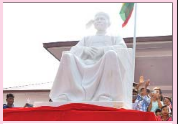
နတ်မောက်မြို့ပြည်သူ့ဆေးရုံရှေ့တွင်ထားရှိသည့် ဝိလ်ချပ်အောင်ဆန်းရုပ်တု။