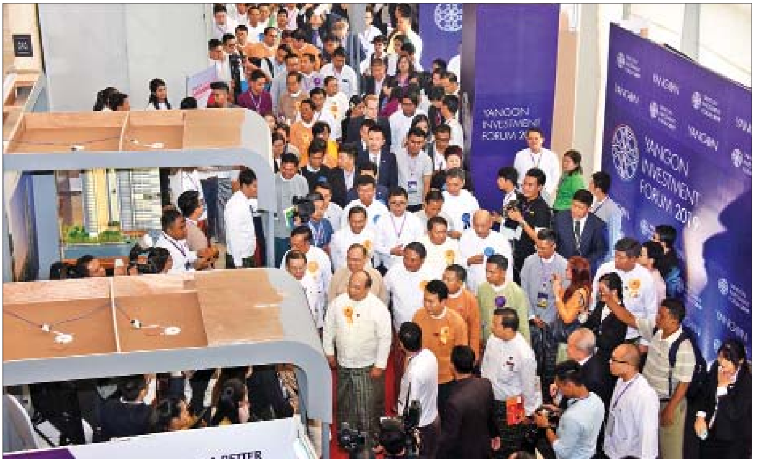
မြန်မာနိုင်ငံရင်းနှီးမြှုပ်နှံမှုကော်မရှင်ဥက္ကဋ္ဌ ပြည်ထောင်စုဝန်ကြီး ဦးသောင်းထွန်းနှင့် ပြည်ထောင်စုဝန်ကြီးများ၊ တိုင်းဒေသကြီး/ပြည်နယ်ဝန်ကြီးချုပ်များ ရန်ကုန်ရင်းနှီးမြှုပ်နှံမှုဖိုရမ် ၂၀၁၉ ဖွင့်ပွဲအခမ်းအနားတွင် ခင်းကျင်းပြသထားသော ပြခန်းများကို လှည့်လည်ကြည့်ရှုစဉ်။

ယင်းနောက် ရင်းနှီးမြှုပ်နှံမှုနှင့် နိုင်ငံခြား စီးပွားဆက်သွယ်ရေးဝန်ကြီးဌာန ပြည်ထောင်စုဝန်ကြီး မြန်မာနိုင်ငံရင်းနှီးမြှုပ်နှံမှုကော်မရှင်ဥက္ကဋ္ဌ ဦးသောင်းထွန်းက ရင်းနှီးမြှုပ်နှံမှုနှင့် နိုင်ငံခြားစီးပွားဆက်သွယ်