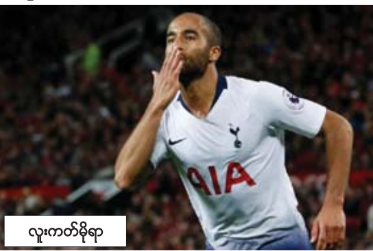
လူးကတ်မိုရာ