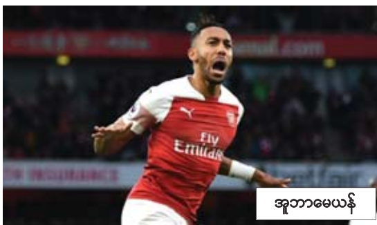
အဘာမေယန်