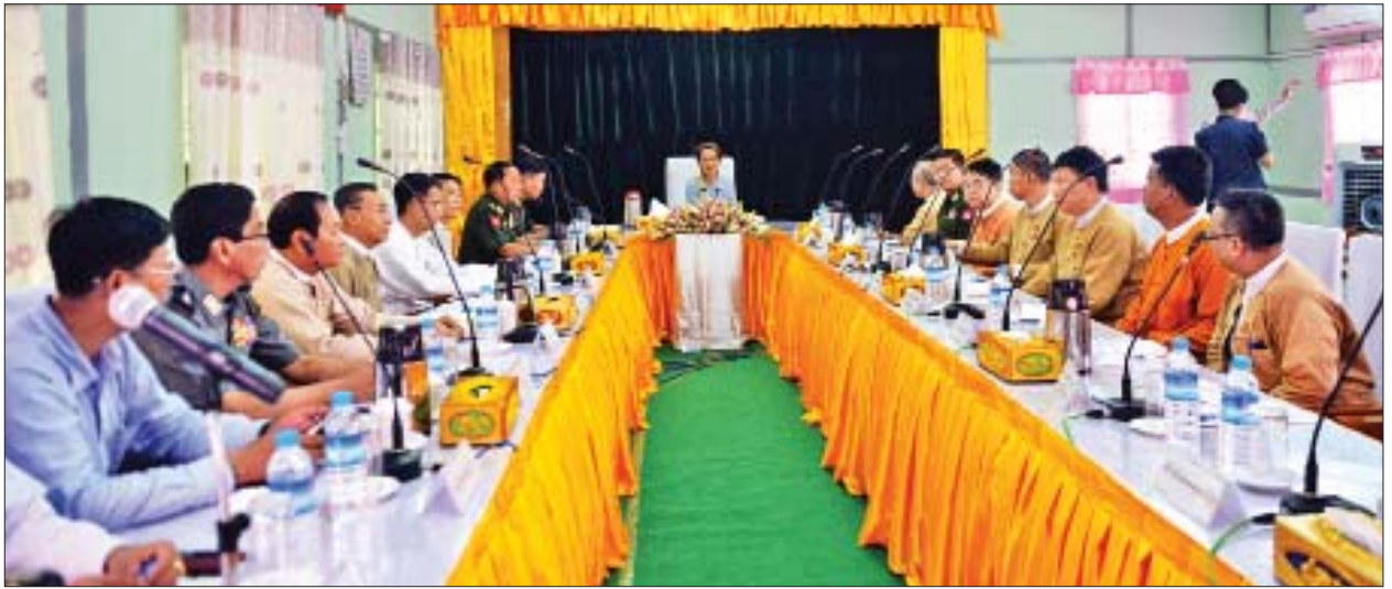
နိုင်ငံတော်၏အတိုင်ပင်ခံပုဂ္ဂိုလ် ဒေါ်အောင်ဆန်းစုကြည် မကွေးတိုင်းဒေသကြီး ဝန်ကြီးချုပ် ဒေါက်တာအောင်မိုးညို၊ တိုင်းဒေသကြီးဝန်ကြီးများနှင့် တာဝန်ရှိသူများအား တွေ့ဆုံစဉ်။

ထို့နောက် တရုတ်သံအမတ်ကြီးက နတ်မောက်မြို့ ပြည်သူ့ဆေးရုံ အရေးပေါ်နှင့် ပြင်ပလူနာဌာန အဆောက်အအုံသစ်၊ မူလအဆောင်များ ပြုပြင်မွမ်းမံမှုနှင့် ဝိုလ်ချုပ်အောင်ဆန်းပုံတူရုပ်တုတို့နှင့် စပ်လျဉ်းသည့် စာရွက်စာတမ်း