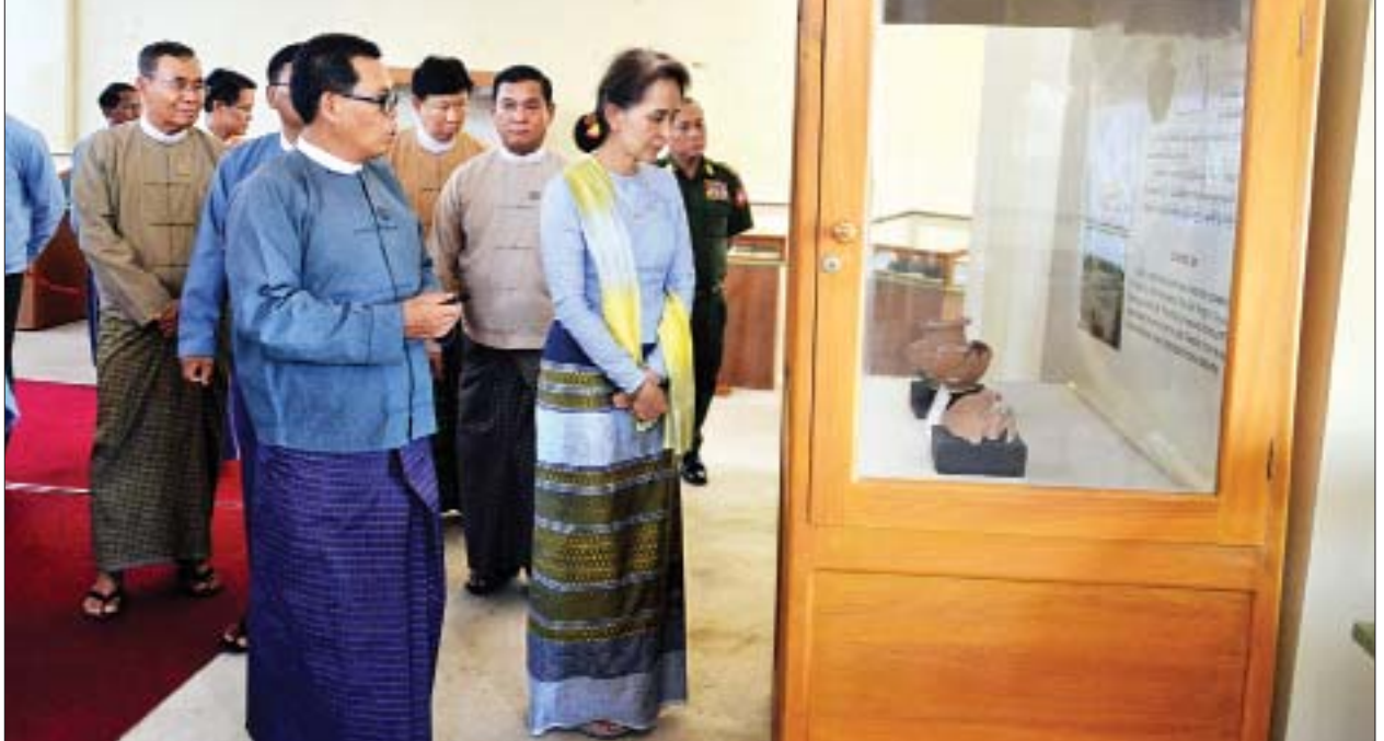
နိုင်ငံတော်၏အတိုင်ပင်ခံပုဂ္ဂိုလ် ဒေါ်အောင်ဆန်းစုကြည် ဝိဿနန်းရှေးဟောင်းယဉ်ကျေးမှုပြတိုက်အတွင်း လှည့်လည်ကြည့်ရှုစဉ်။