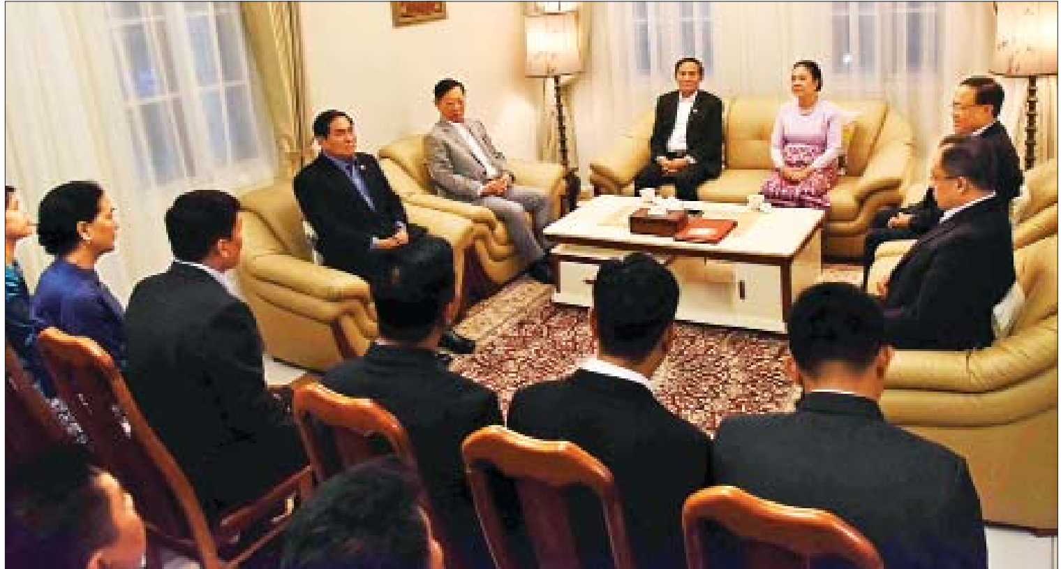
နိုင်ငံတော်သမ္မတ ဦးဝင်းမြင့်နှင့်ဇနီး ဒေါ်ချိုချိုတို့ ဟန့်ဇိုင်းမြို့ရှိ မြန်မာသံရုံးနှင့် စစ်သံရုံးတို့မှ သံရုံးဝန်ထမ်းများ၊ မိသားစုဝင်များနှင့် တွေ့ဆုံစဉ်။