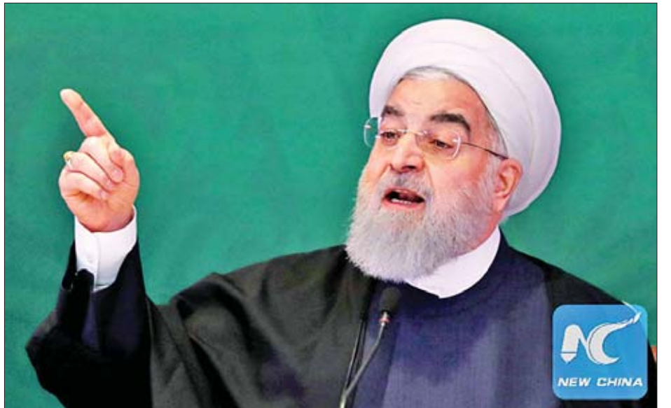
အီရန်သမ္မတ ဟတ်ဆန်ရီဟာနီ

အဆိုပါလုပ်ဆောင်ချက်မှာ အမေရိကန်နိုင်ငံက စစ်သင်္ဘောအုပ်စု စေလွှတ်ရသည့်ဆုံးဖြတ်ချက်ကို ဖြစ်ပေါ်စေခဲ့သည့်အကြောင်းများအနက် တစ်ချက်ဖြစ်ကြောင်း တာဝန်ရှိသူများကိုကား၍ မီဒီယာများက ပြောကြားသည်။ ကိုးကား- အင်န်အိတ်ချ်ကေ ဘာသာပြန်- ကျော်ထိုက်စိုး