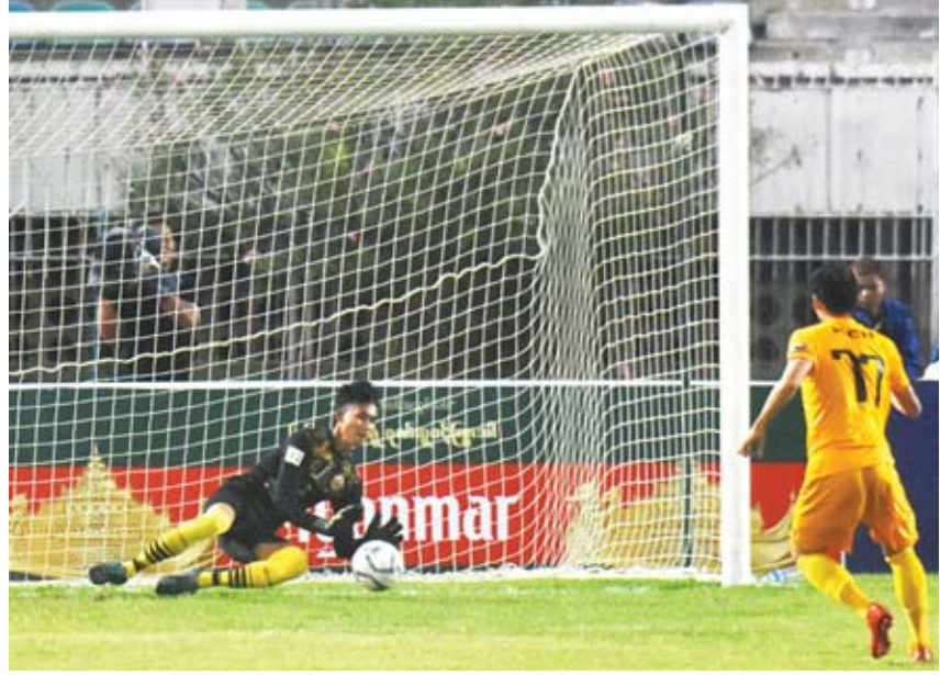
ရခိုင်နှင့် ဇွဲကပင်ပွဲတွင် ပင်နယ်တီဖြင့် အဆုံးအဖြတ်ခံယူနေစဉ်။

ရန်ကုန် မေ ၈ ၂၀၁၉ ဘောလုံးရာသီ ဝိုလ်ချုပ်အောင်ဆန်းခိုင်း ရှုံးထွက်ပြိုင်ပွဲ ဒုတိယအဆင့် (ဒုတိယနေ့)ကို ယနေ့ညနေပိုင်းက ကျင်းပရာ ရခိုင်၊ ရှမ်းယူနိုက် တက်နှင့် မကွေးအသင်း နိုင်ပွဲရပြီး ကွာတားဗိုလ်နယ် တက်ရောက်သွားသည်။