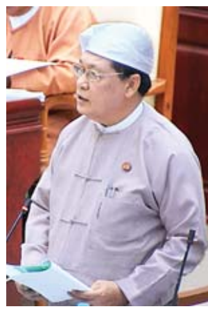
ပြည်ထောင်စုဝန်ကြီး ဦးသိန်းဆွေ

ဖလမ်းမဲဆန္ဒနယ်မှ ဒေါက်တာဆလင်းရီယန်းဗဲလ်၏ ဖလမ်းမြို့နယ် သီးဆင်အုပ်စု ဗားလုံး (ဝေဠုဝန်စခန်း) ကျေးရွာတွင် ရဲကင်း သို့မဟုတ် ရဲစခန်းဖွင့်လှစ်ပေးရန် အစီအစဉ် ရှိ မရှိ မေးခွန်းနှင့်စပ်လျဉ်း၍ ပြည်ထဲရေးဝန်ကြီးဌာန ဒုတိယဝန်ကြီး ဗိုလ်ချုပ်အောင်သူက ဖလမ်းမြို့နယ် သီးဆင်ကျေးရွာအုပ်စု ဗားလုံး (ဝေဠုဝန်စခန်း) ကျေးရွာသည် မူဝင်းမြစ်ပွားမူနည်ပါးခြင်း၊ Myanmar Post and Telecommunications (MPT) နှင့် Telenor တို့၏ ဆက်သွယ်မှုကွန်ရက်ရှိပြီး လမ်းပန်းဆက်သွယ်ရေးကောင်းမွန်ခြင်း၊ လုံခြုံရေးနှင့် တရားဥပဒေ