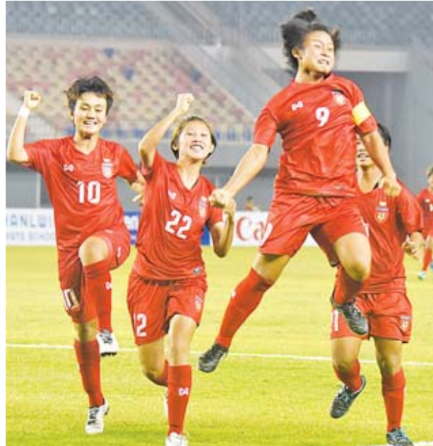
ခြေစစ်ပွဲအောင် မြန်မာ ယူ-၁၉ အမျိုးသမီးအသင်း