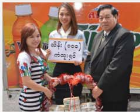
မသန္တာအောင်