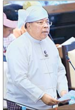
ပြည်ထောင်စုဝန်ကြီး ဦးသောင်းထွန်း