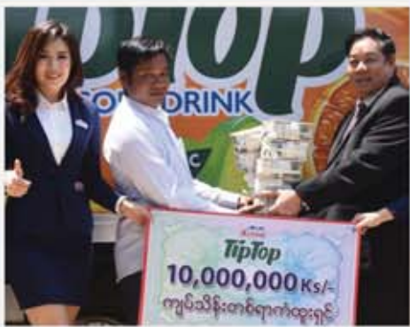
ကိုမင်းစောဦး

ကံစမ်းမဲအစီအစဉ်မှ သိန်း ၁၀၀ ကံထူးရှင်များ ပေါ်ထွက်လာပါပြီ