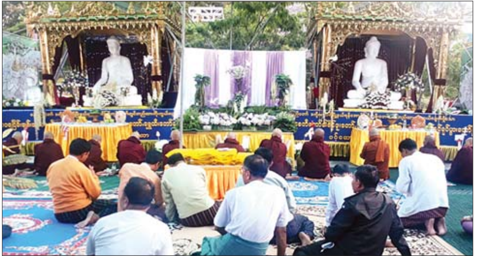
ယနေ့နံနက်ပိုင်းက ကျောက်ဆည်မြို့တွင် ဆရာတော်၊ သံဃာတော်များက စကျင်ဗုဒ္ဓရုပ်ပွားတော်များအား ဘုရားအနေကတင် ရွတ်ဖတ်ပူဇော်စဉ်။

ယနေ့ည ၇ နာရီခွဲတွင် ရွှေပါရမီတောရေစာတော်အရှင်ဆန္ဒာဓိက က ပြည်ထောင်စုကြီး ထာဝရငြိမ်းချမ်းသာယာမှုရရှိစေရန် ငြိမ်းချမ်းရေးတရားတော်ကို ဟောကြားချီးမြှင့်ရာ ဒေသခံတရားချစ်ခင်သူတော်စင်များက တရားတော်ကို ရိုသေစွာနာယူ ကြည့်ညိုကြသည်။ သတင်းစဉ်