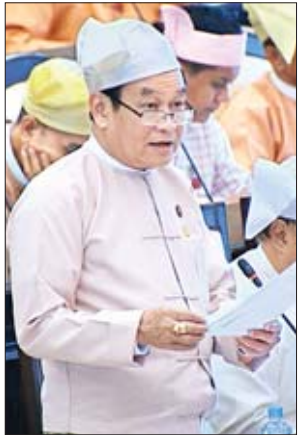
ပြည်ထောင်စုဝန်ကြီး ဒေါက်တာမြင့်ထွေး

ဖော်ပြပါစီမံကိန်းအရ တန်ချိန်နှစ်သိန်းမှ သုံးသိန်းတင်ဆောင်နိုင်သည့် အလွန်ကြီးမားသော ရေနံစိမ်းတင်သင်္ဘောကြီးများ တစ်နှစ်လျှင် အစင်းရေ ၇၀ ကျော်ခန့်၊ တစ်နှစ်အားဖြင့် တစ်လလျှင် ခြောက်စင်း၊ ခုနစ်စင်းခန့် အဆိုပါ မဒေးကျွန်းရေနက်ဆိပ်ကမ်းကို ရေနံစိမ်းကုန်ချရန်အတွက် ဆိုက်ကပ်ရမည်ဖြစ်ပါကြောင်း၊ မြန်မာ့ရေပိုင်နက်အတွင်းသို့ သင်္ဘောများဝင်လာစဉ်ဖြစ်စေ၊ ဆိပ်ကမ်းဝင်/ထွက်စဉ်တွင်ဖြစ်စေ၊ ကမ်းနားကပ်ထားပြီး ကုန်ချနေစဉ်ဖြစ်စေ၊ လူကြောင့်သော်လည်းကောင်း၊ စက်ပစ္စည်းကြောင့်သော်လည်းကောင်း၊ သဘာဝဘေးအန္တရာယ်ကြောင့်သော်လည်းကောင်း ရေနံနှင့် ရေနံထွက်ပစ္စည်းများ ယိုဖိတ်ကာ ပင်လယ်တွင်းသို့ ကျရောက်မှုများ အချိန်မရွေး ဖြစ်ပေါ်လာနိုင်ပါကြောင်း ပြောကြားသည်။