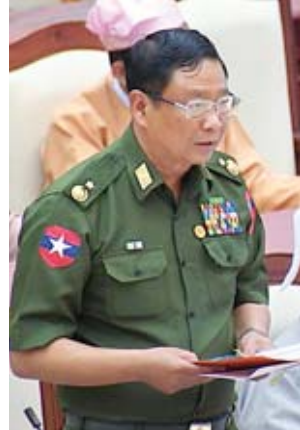
ဒုတိယဝန်ကြီး ဗိုလ်ချုပ်အောင်သူ