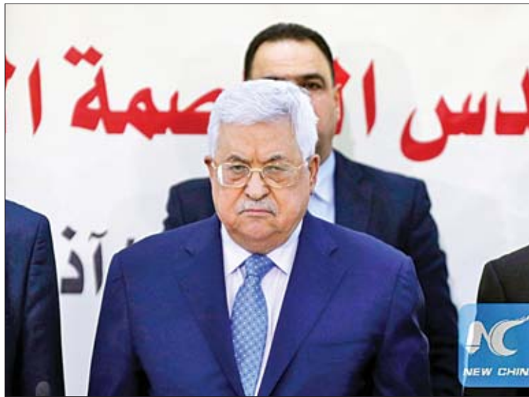
ပါလက်စတိုင်းသမ္မတ မာမူတ်အဘတ်စ်