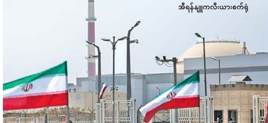
အီရန်နျူကလီးယားစက်ရုံ