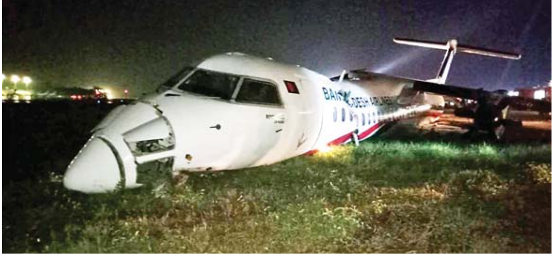
ရန်ကုန်အပြည်ပြည်ဆိုင်ရာလေဆိပ်၌ ပြေးလမ်းချော်မှုဖြစ်ပွားသည့် ဘင်္ဂလားဒေ့ရှ်ခရီးသည်တင်လေယာဉ်ကို တွေ့ရစဉ်။

ရန်ကုန်အပြည်ပြည်ဆိုင်ရာလေဆိပ်မှ တာဝန်ရှိသူတစ်ဦးက “အဆင်းမှာ ပြေးလမ်း ချော်သွားတာပါ။ အသေအပျောက်တော့ မရှိပါဘူး။ ထိခိုက်ဒဏ်ရာရတဲ့သူတွေတော့ ရှိတယ်။ လေယာဉ်တော့ ပျက်စီးသွားတယ်။ လောလောဆယ် ဖြစ်ပွားတဲ့နေရာမှာ လေယာဉ်ဆီတွေ ယိုစိမ့်နေလို့ အနားလည်း ကပ်လို့ မရသေးဘူး။ မီးသတ်က အသင့် စောင့်နေရတယ်။ သတိထားပြီး လုပ်နေရ တယ်”ဟု ည ၇ နာရီ ၁၀ မိနစ်ခန့်က ပြောသည်။