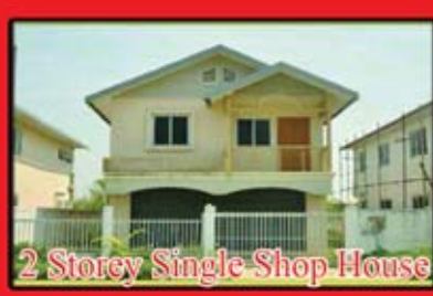
2 Storey Single Shop House