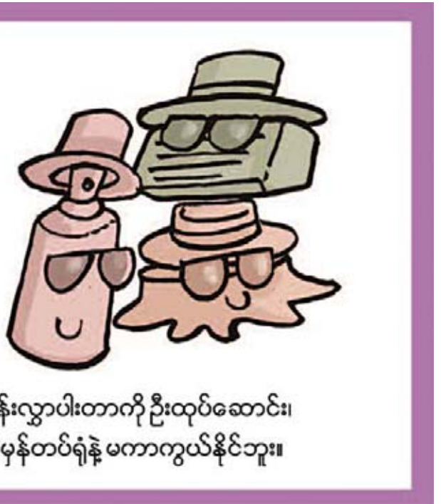
အိုရန်းလွှာပါးတာကို ဦးထုပ်ဆောင်း၊ မျက်မှန်တပ်ရုံနဲ့ မကာကွယ်နိုင်ဘူး။

အမှတ်များ၊ နေအိမ်များ ပါဝင်မည်ဖြစ်ကြောင်း၊ Business Zone တွင် တိုင်းရင်းသားများ၏ ရိုးရာအမှတ်တရပစ္စည်းအရောင်းဆိုင်များ၊ တိုင်းရင်းသားရိုးရာ အစားအသောက်ဆိုင်များ၊ Shopping Mall များ၊ ဖျော်ဖြေရေးနှင့် အပန်းဖြေအနားယူရန်နေရာများ ပါဝင်မည် ဖြစ်ကြောင်း သိရသည်။ ရန်ကုန်တိုင်းဒေသကြီးသည် တိုင်းရင်းသားအများစု လာရောက်နေထိုင်ရာ ဒေသဖြစ်သည့်အလျောက် ပြည်ထောင်စုတိုင်းရင်းသားကျေးရွာရှိ ကချင်၊ ကရင်၊ ကယား၊ ချင်း၊ မွန်၊ ဗမာ၊ ရခိုင်၊ ရှမ်း တိုင်းရင်းသား ရှစ်မျိုး၏ နေအိမ်များနှင့် ဓလေ့ထုံးစံများ၊ အစားအသောက်များကိုလည်း အစစ်အမှန်မြင်တွေ့ရမည်ဖြစ်သည်။ ပြည်ထောင်စုတိုင်းရင်းသားကျေးရွာကို ၂၀၀၂ ခုနှစ်က နယ်စပ်ဒေသနှင့် တိုင်းရင်းသားလူမျိုးများ ဖွံ့ဖြိုးတိုးတက်ရေးနှင့် စည်ပင်သာယာရေးဝန်ကြီးဌာနက တာဝန်ယူတည်ဆောက်ဖွင့်လှစ်ခဲ့ပြီး ယခုအခါ ပြည်တွင်းခရီးသွားများသာမက ပြည်ပခရီးသွားများလည်း အပန်းဖြေ လာရောက်ရာနေရာတစ်ခုအဖြစ် တိုးတက်ပြောင်းလဲလာလျက်ရှိကြောင်း၊ အကျယ်အဝန်းအားဖြင့် ၁၁၇ ဧက ရှိပြီး ပိတောက်၊ စိန်ပန်းနှင့် ခရောင်ကြီးများ၊ ရေကန်ငယ်များကဲ့သို့ သဘာဝရှုခင်းများဖြင့်လည်း လှပလျက်ရှိကြောင်း သိရသည်။ မြင့်မောင်စိုး