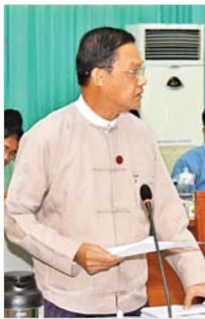
ပြည်ထောင်စုရှေ့နေချုပ် ဦးထွန်းထွန်းဦး

ထို့နောက် အမျိုးသားမြေအသုံးချမှုကောင်စီအတွင်းရေးမှူး၊ ပြည်ထောင်စုဝန်ကြီး ဦးအုန်းဝင်းက အမျိုးသားမြေအသုံးချမှုကောင်စီ၏ ဒုတိယအကြိမ်အစည်းအဝေးဆုံးဖြတ်ချက်များအပေါ် ဆောင်ရွက်ပြီးစီးမှုအခြေအနေများ