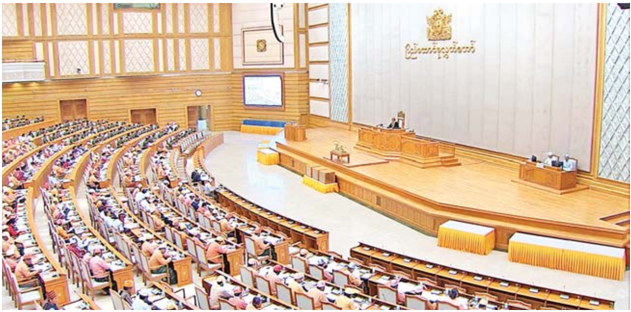
ဒုတိယအကြိမ် ပြည်ထောင်စုလွှတ်တော် (၁၂)ကြိမ်မြောက် ပုံမှန်အစည်းအဝေး စတုတ္ထနေ့ ကျင်းပစဉ်။

ပြည်ထောင်စုလွှတ်တော်နာယကက အထက်ပါဥပဒေကြမ်းနှင့် စပ်လျဉ်း ၍ ပြည်သူ့လွှတ်တော်နှင့် အမျိုးသားလွှတ်တော်က အတည်ပြုခဲ့သည့် အပိုဒ်၊