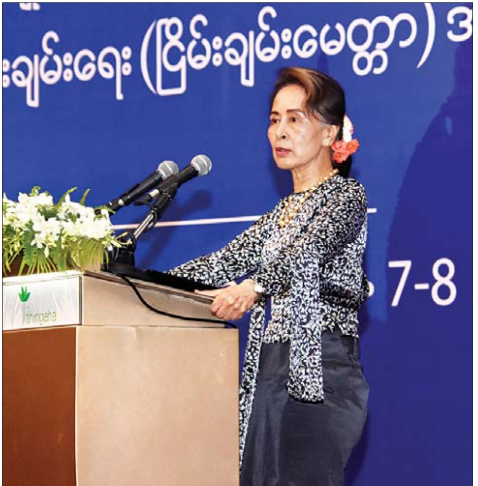
နိုင်ငံတော်၏အတိုင်ပင်ခံပုဂ္ဂိုလ် ဒေါ်အောင်ဆန်းစုကြည် မြန်မာနိုင်ငံတွင် အမျိုးသားပြန်လည်သင့်မြတ်ရေး နှင့် ငြိမ်းချမ်းရေးအတွက် ဘာသာပေါင်းစုံ ငြိမ်းချမ်းရေး(ငြိမ်းချမ်းမေတ္တာ) အဖွဲ့၏ ဒုတိယအကြိမ် အကြံပြုဆွေးနွေး ပိုင်းတွင် အမှာစကားပြောကြားစဉ်။