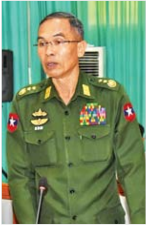
ပြည်ထောင်စုဝန်ကြီး ဒုတိယဗိုလ်ချုပ်ကြီး စိန်ဝင်း