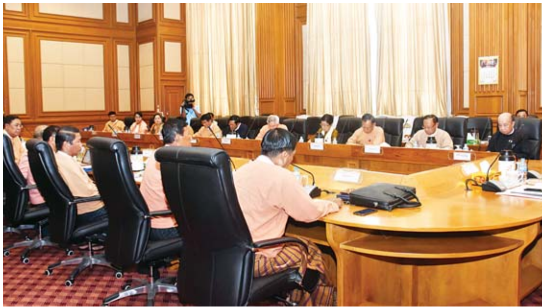
ပြည်သူ့လွှတ်တော်ဥက္ကဋ္ဌ ဦးတီခွန်မြတ် ပြည်သူ့လွှတ်တော်ဥက္ကဋ္ဌနှင့် ကော်မတီဥက္ကဋ္ဌများ၏ လုပ်ငန်းညှိနှိုင်းအစည်းအဝေး (၁/၂၀၁၉)တွင် အမှာစကားပြောကြားစဉ်။

ရှေးဦးစွာ ပြည်သူ့လွှတ်တော်ဥက္ကဋ္ဌ ဦးတီခွန်မြတ်က အမှာစကားပြောကြားရာတွင် ယခုအစည်းအဝေးကျင်းပခြင်းမှာ စိစစ်ရေး ပူးပေါင်းအဖွဲ့များအနေဖြင့် ရငွေ၊ သုံးငွေများ နှင့်စပ်လျဉ်း၍ စိစစ်ရန်ရှိသည်များကို ဆောင်ရွက်နိုင်ရန်ဖြစ်ပါကြောင်း၊ မိမိတို့အနေ ဖြင့် ဒုတိယအကြိမ် လွှတ်တော်သက်တမ်း သုံးနှစ်ကျော်ကာလအတွင်း နိုင်ငံတော်နှင့် ပြည်သူများ၏ အကျိုးစီးပွားဖြစ်ထွန်းစေမည့် ဥပဒေပေါင်း(၉၀)ကျော်ကို ပြဋ္ဌာန်းဆောင် ရွက်နိုင်ခဲ့ပါကြောင်း၊ လွှတ်တော်၏ အဓိက တာဝန်ဖြစ်သည့် ဥပဒေပြုရေးကိစ္စရပ်များ ဆောင်ရွက်ရာတွင် ဥပဒေကြမ်းကော်မတီ တစ်ခုတည်းသာမက သက်ဆိုင်ရာကော်မတီ တစ်ခုချင်းစီကလည်း ပူးပေါင်းပါဝင်ဆောင် ရွက်ကြရမည်ဖြစ်ပါကြောင်း ပြောကြားသည်။