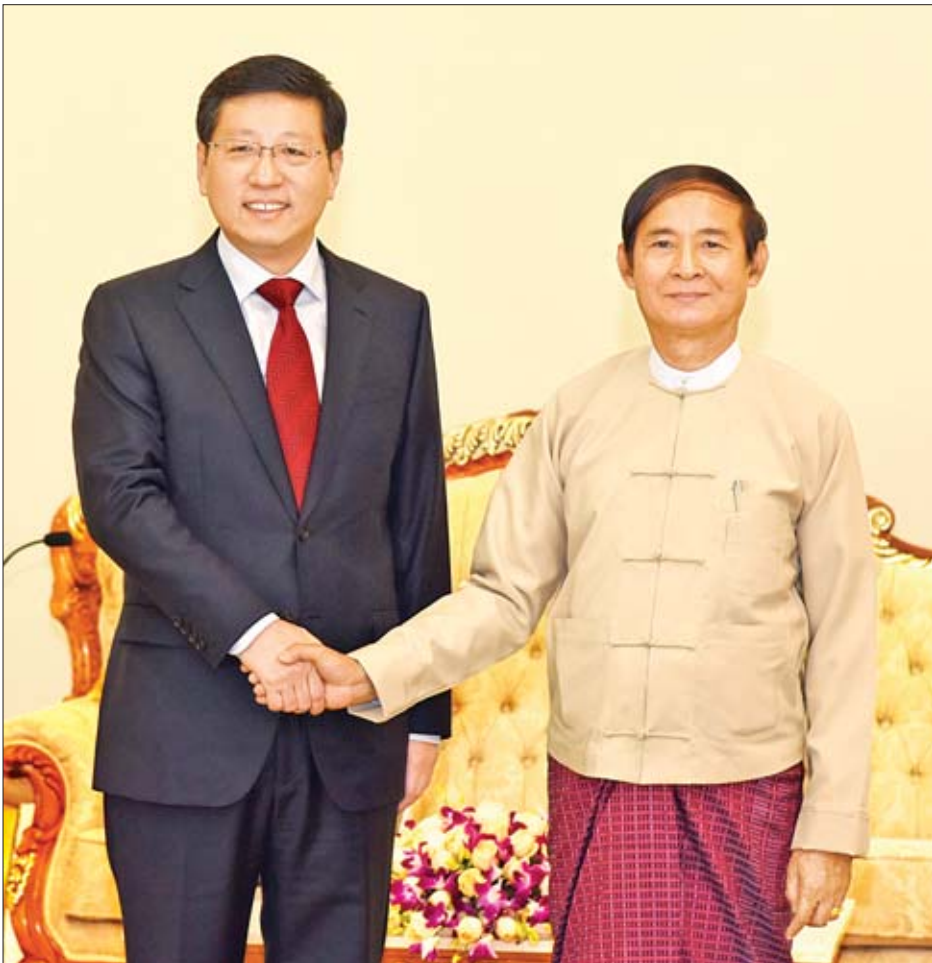
နိုင်ငံတော်သမ္မတ ဦးဝင်းမြင့် မြန်မာနိုင်ငံဆိုင်ရာ တရုတ်ပြည်သူ့သမ္မတနိုင်ငံ သံအမတ်ကြီး မစ္စတာ ဟုန်လျန် အား ရင်းရင်းနှီးနှီး နှုတ်ဆက်စဉ်။