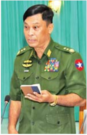
ပြည်ထောင်စုဝန်ကြီး ဒုတိယဗိုလ်ချုပ်ကြီး ကျော်ဆွေ