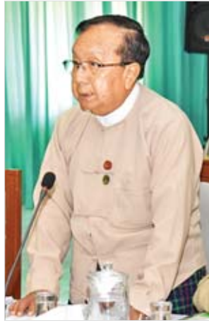
ပြည်ထောင်စုဝန်ကြီး ဦးဟန်ဇော်