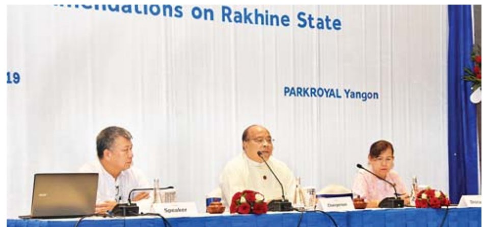
ပြည်ထောင်စုဝန်ကြီး ဦးသောင်းထွန်း သဘာပတိအဖြစ်ဆောင်ရွက်သော လူမှုသဟဇာတမှုတရားရေးအတွက် အရေးပါမှု ကဏ္ဍအစီအစဉ် ဆွေးနွေးပွဲပြုလုပ်စဉ်။

အတူတကွ ပေါင်းစုံစုစည်းသုံးသပ်ဆွေးနွေးကြသည့် ယခုလို ဆွေးနွေးပွဲမျိုးမှာ ပထမဦးဆုံးဖြစ်ပါကြောင်း၊ ဆွေးနွေးပွဲတွင် ပါဝင်တက်ရောက်သူများက ရင်းရင်းနှီးနှီး ပွင့်ပွင့်လင်းလင်း ပါဝင်ဆွေးနွေးကြသည့်အတွက် ဆွေးနွေးပွဲမှရရှိ လာသည့် အကြံပြုဆွေးနွေးချက်များသည် ရှေ့ဆက်ဆောင်ရွက်ရမည့်