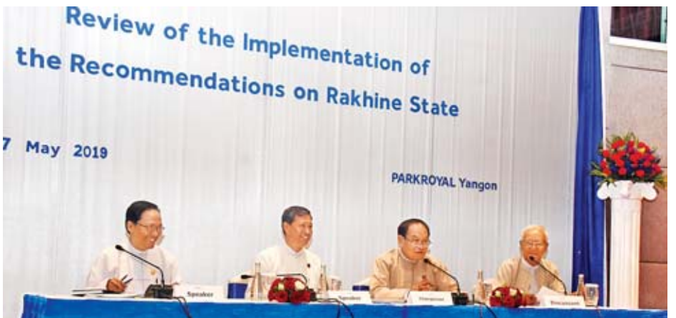
ပြည်ထောင်စုဝန်ကြီး ဒေါက်တာမြင့်ထွေး သဘာပတိအဖြစ်ဆောင်ရွက်သော ရခိုင်ပြည်နယ်အတွင်း ပညာရေးကဏ္ဍ နှင့် ကျန်းမာရေးကဏ္ဍအစီအစဉ် ဆွေးနွေးပွဲပြုလုပ်စဉ်။

ရေးအဖွဲ့ (CDNH) ညွှန်ကြားရေးမှူး၊ ဒေါက်တာကျော်ရင်လှိုင်၊ ပြန်လည် ဆွေးနွေးသူအဖြစ် လူမှုဝန်ထမ်းဦးစီးဌာန ညွှန်ကြားရေးမှူးချုပ် ဒေါက်တာ စန်းစန်းအေးတို့က ဆောင်ရွက်ကြသည်။ ထို့နောက် ရခိုင်ပြည်နယ်အတွင်းပညာရေးကဏ္ဍနှင့် ကျန်းမာရေးကဏ္ဍ