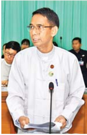
ပြည်ထောင်စုဝန်ကြီး ဒေါက်တာအောင်သူ