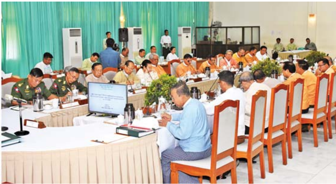
ဒုတိယသမ္မတ ဦးဟင်နရီဗန်ထီးယူ အမျိုးသားမြေအသုံးချမှုကောင်စီ တတိယအကြိမ်အစည်းအဝေးတွင် အမှာစကားပြောကြားစဉ်။

နေပြည်တော် မေ ၇ အမျိုးသားမြေအသုံးချမှုကောင်စီ တတိယအကြိမ် အစည်းအဝေးကို ယနေ့ နံနက် ၉ နာရီခွဲတွင် နေပြည်တော်ရှိ သယံဇာတနှင့် သဘာဝပတ်ဝန်းကျင်ထိန်းသိမ်းရေး ဝန်ကြီးဌာန သစ်တောဦးစီးဌာန အင်ကြင်းခန်းမ၌ကျင်းပရာ အမျိုးသား မြေအသုံးချမှုကောင်စီဥက္ကဋ္ဌ ဒုတိယသမ္မတ ဦးဟင်နရီဗန်ထီးယူ တက်ရောက်အမှာစကား ပြောကြားသည်။ အစည်းအဝေးတွင် ဒုတိယသမ္မတက နိုင်ငံတော်၏ မြေသယံဇာတများကို စဉ်ဆက်မပြတ် စီမံအုပ်ချုပ် အသုံးချနိုင်ရေးအတွက် လိုအပ်နေသည့် အမျိုးသား စာမျက်နှာ ၅ ကော်လံ ၁ သို့ >>>