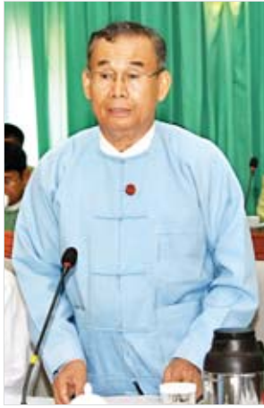
ပြည်ထောင်စုဝန်ကြီး ဦးအုန်းဝင်း