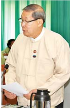
ပြည်ထောင်စုဝန်ကြီး ဦးစိုးဝင်း