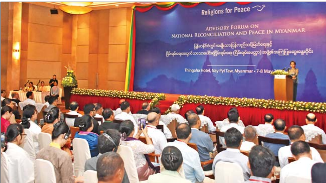
နိုင်ငံတော်၏အတိုင်ပင်ခံပုဂ္ဂိုလ် ဒေါ်အောင်ဆန်းစုကြည် မြန်မာနိုင်ငံတွင် အမျိုးသားပြန်လည်သင့်မြတ်ရေးနှင့် ငြိမ်းချမ်းရေးအတွက် ဘာသာပေါင်းစုံ ငြိမ်းချမ်းရေး(ငြိမ်းချမ်းမေတ္တာ)အဖွဲ့၏ ဒုတိယအကြိမ် အကြံပြုဆွေးနွေးပွဲတွင် အမှာစကားပြောကြားစဉ်။

ကမ္ဘာပေါ်တွင် ဘာသာရေးအစွန်းရောက်အဖွဲ့များကြောင့် ဖြစ်ပွားနေ သည့် အကြမ်းဖက်မှုများ၊ စစ်မက်ရေးရာများနှင့် ရာသီဥတုပြောင်းလဲမှုများ ကြောင့် ပေါ်ပေါက်လာရသည့် ဘေးဒုက္ခများအကြောင်းကို အသိပညာပေး နိုင်ရန်အတွက် အာရှနှင့်ပစိဖိတ် ဘာသာပေါင်းစုံလူငယ်ကွန်ရက်နီးနော