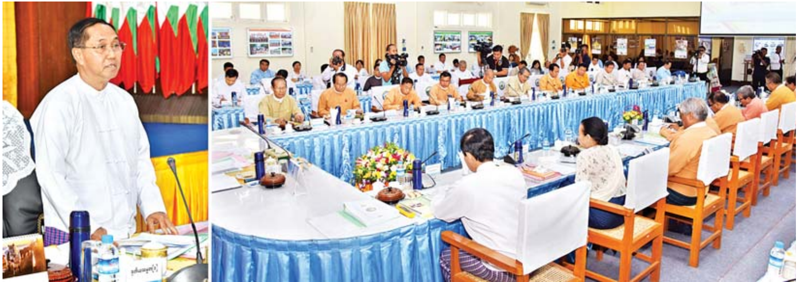
ဒုတိယသမ္မတ ဦးမြင့်ဆွေ အသေးစား၊ အငယ်စားနှင့်အလတ်စားစီးပွားရေးလုပ်ငန်းများ ဖွံ့ဖြိုးတိုးတက်ရေးလုပ်ငန်းကော်မတီ၏ (၁/၂၀၁၉) ကြိမ်မြောက် အစည်းအဝေးတွင် အမှာစကား ပြောကြားစဉ်။

နေပြည်တော် မေ ၇ အသေးစား၊ အငယ်စားနှင့်အလတ်စား စီးပွားရေးလုပ်ငန်းများ (MSMEs) ဖွံ့ဖြိုးတိုးတက်ရေး လုပ်ငန်းကော်မတီ၏ (၁/၂၀၁၉) ကြိမ်မြောက် အစည်းအဝေးကို ယနေ့ မွန်းလွဲ ၂ နာရီတွင် နေပြည်တော်ရှိ စက်မှုဝန်ကြီးဌာန အစည်းအဝေးခန်းမ၌ ကျင်းပရာ အသေးစား၊ အငယ်စားနှင့် အလတ်စားစီးပွားရေးလုပ်ငန်းများ ဖွံ့ဖြိုးတိုးတက်ရေး လုပ်ငန်းကော်မတီဥက္ကဋ္ဌ ဒုတိယသမ္မတ ဦးမြင့်ဆွေ တက်ရောက်အမှာစကား ပြောကြားသည်။ အစည်းအဝေးသို့ အသေးစား၊ အငယ်စားနှင့်အလတ်စား စီးပွားရေးလုပ်ငန်းများ ဖွံ့ဖြိုးတိုးတက်ရေး စာမျက်နှာ ၄ ကော်လံ ၁ သို့ ❖