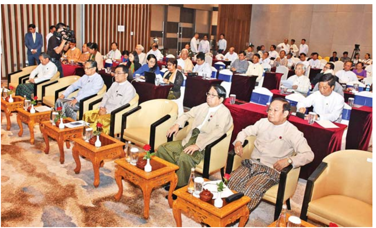
ရခိုင်ပြည်နယ်ဆိုင်ရာ အကြံပြုချက်များအပေါ် အကောင်အထည်ဖော်ဆောင်ရွက်နေမှုများနှင့်စပ်လျဉ်းပြီး ပြန်လည်သုံးသပ်ခြင်းဆိုင်ရာ အလုပ်ရုံဆွေးနွေးပွဲသို့ တက်ရောက်ကြသူများကို တွေ့ရစဉ်။

အလုပ်ရုံဆွေးနွေးပွဲ ဒုတိယနေ့တွင် ကဏ္ဍအလိုက်ဆွေးနွေးပွဲများကို ကျင်းပရာ လူမှုသဟဇာတမှုတရားရေးအတွက် အရေးပါမှုကဏ္ဍအစီအစဉ်၏ သဘာပတိအဖြစ် ပြည်ထောင်စုဝန်ကြီး ဦးသောင်းထွန်း၊ ဦးဆောင်ဆွေးနွေးသူ အဖြစ် ကွဲပြားခြားနားမှုနှင့် အမျိုးသားရေး သဟဇာတဖြစ်မှုဆိုင်ရာ လေ့လာ