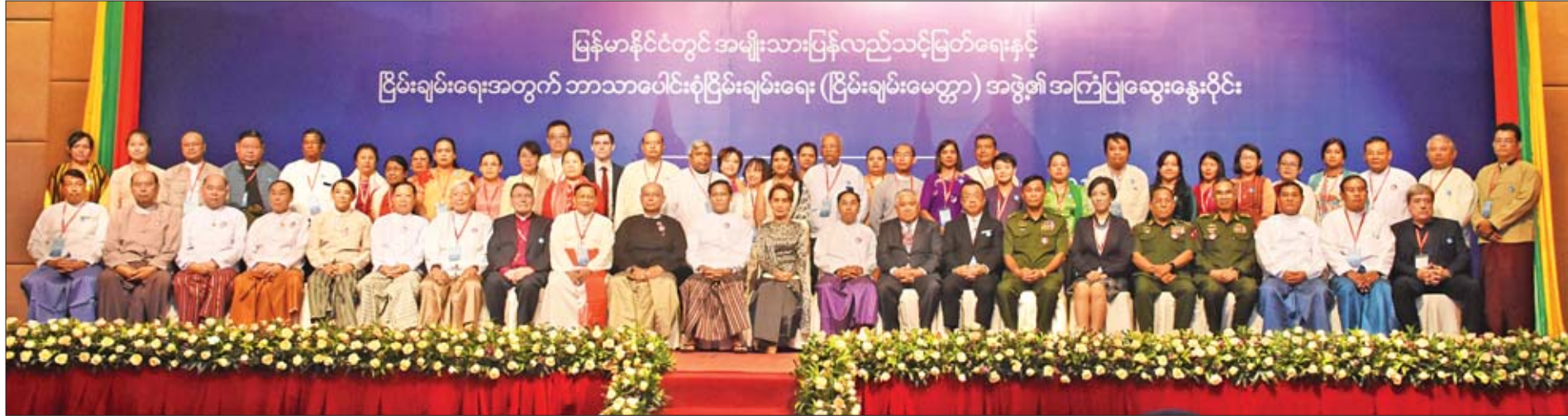
နိုင်ငံတော်၏အတိုင်ပင်ခံပုဂ္ဂိုလ် ဒေါ်အောင်ဆန်းစုကြည်၊ ဒုတိယသမ္မတ ဦးမြင့်ဆွေနှင့် ဦးဟင်နရီဇန်ထီးယူ၊ အမျိုးသားလွှတ်တော်ဥက္ကဋ္ဌ မန်းဝင်းခိုင်သန်းတို့ မြန်မာနိုင်ငံတွင် အမျိုးသားပြန်လည်သင့်မြတ်ရေးနှင့် ငြိမ်းချမ်းရေးအတွက် ဘာသာပေါင်းစုံငြိမ်းချမ်းရေး(ငြိမ်းချမ်းမေတ္တာ)အဖွဲ့၏ ဒုတိယအကြိမ် အကြံပြုဆွေးနွေးပွဲသို့ တက်ရောက်လာကြသူများနှင့်အတူ စုပေါင်းမှတ်တမ်းတင်ဓာတ်ပုံရိုက်စဉ်။

ယင်းနောက် ငြိမ်းချမ်းမေတ္တာအဖွဲ့နာယက ကာဒီနယ်ချားလ်ဘို ငြိမ်းချမ်း မေတ္တာအဖွဲ့ ဥက္ကဋ္ဌ ဦးမြင့်ဆွေ၊ အပြည်ပြည်ဆိုင်ရာငြိမ်းချမ်းမေတ္တာအဖွဲ့ ဂုဏ်ထူးဆောင်နာယကကြီး ဘီရောဂွန်နာစတော့ဆက်တို့က အမျိုးသား ပြန်လည်သင့်မြတ်ရေး၊ ငြိမ်းချမ်းရေးတို့နှင့် စပ်လျဉ်းသည့် အမှာစကား ပြောကြားကြပြီး မေတ္တာဆရာတော် အရှင်ဆေကိန္ဒနှင့် အောက်စ်ဖိုးဒိ ဆရာတော် ပါမောက္ခ ဒေါက်တာဘဒ္ဒန္တဓမ္မသာမိတို့က မေတ္တာနှင့် ငြိမ်းချမ်းရေး