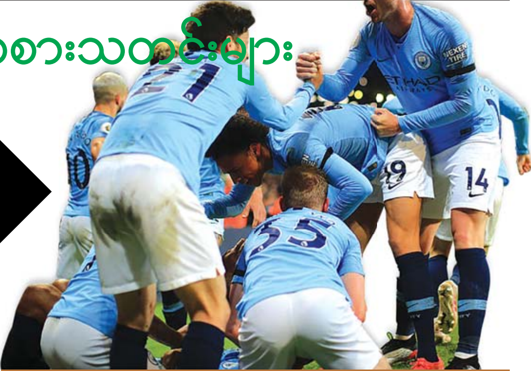
နိုင်လင်းကြည်

လီဗာပူးအသင်းဟာ အေဂျက်တိုက်စစ်မှူး ဒေးဗစ်နီရက်စ်ကို ခေါ်ယူဖို့ပြင်ဆင်နေတာဖြစ်ပြီး လက်ရှိအချိန်မှာ ဒေးဗစ်နီရက်စ်ကို ခေါ်ယူမယ့် အသင်းတွေထဲမှာ လီဗာပူးအသင်းနည်းပြ ကလော့လည်းပါဝင်လာတာဖြစ်ပါတယ်။ ဒေးဗစ်နီရက်စ်ကို ခေါ်ယူဖို့အတွက် ချယ်လ်ဆီးအသင်းနဲ့ အာဆင်နယ်အသင်းတို့က စိတ်ဝင်စားနေတာဖြစ်ပြီး ရီးယဲလ်မက်ဒရစ်အသင်းကလည်း ခေါ်ယူဖို့ပစ်မှတ်ထားလျက်ရှိပါတယ်။ အေဂျက်အသင်းဟာ အခုနှစ်ဘောလုံးရာသီမှာ ဖလားသုံးလုံးလမ်းကြောင်းပေါ်ရှိနေတာကြောင့် အေဂျက်ကစားသမား ဒီဂျော့ကို ဘာစီလိုနာအသင်းက ခေါ်ယူဖို့ ချိတ်ဆက်ထားသလို နောက်ထပ်ကစားသမားတစ်ဦးဖြစ်တဲ့ ဒီလစ်ကိုလည်း ထိပ်တန်းအဆင့်ရှိကလပ်အသင်းအတော်များများက ပစ်မှတ်ထားနေတာဖြစ်ပါတယ်။ လက်ရှိမှာတော့ ဒေးဗစ်နီရက်စ်ကို ခေါ်ယူမယ့် အသင်းတွေက ပိုမိုများပြားနေပြီး လီဗာပူးအသင်းကတော့ ဒေးဗစ်နီရက်စ်ကို ခေါ်ယူဖို့ ပေါင် ၃၅ သန်း သုံးစွဲသွားမယ်လို့ဆိုပါတယ်။