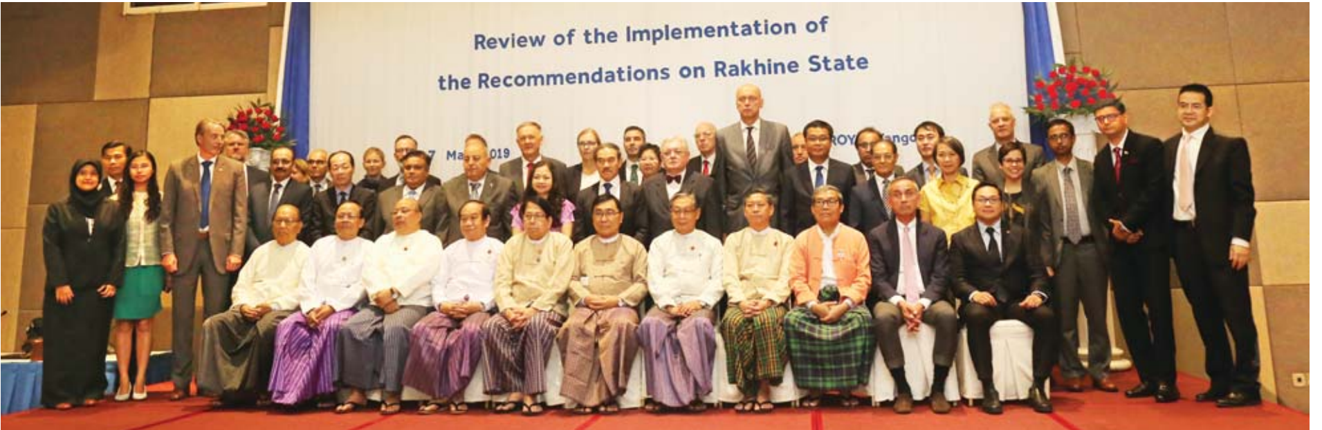
ရခိုင်ပြည်နယ်ဆိုင်ရာ အကြံပြုချက်များအပေါ် အကောင်အထည်ဖော် ဆောင်ရွက်ရေးကော်မတီဝင်များနှင့် စပ်လျဉ်းပြီး ပြန်လည်သုံးသပ်ခြင်းဆိုင်ရာ အလုပ်ရုံဆွေးနွေးပွဲသို့ တက်ရောက်ကြသူများ စုပေါင်းမှတ်တမ်းတင်ဓာတ်ပုံရိုက်စဉ်။