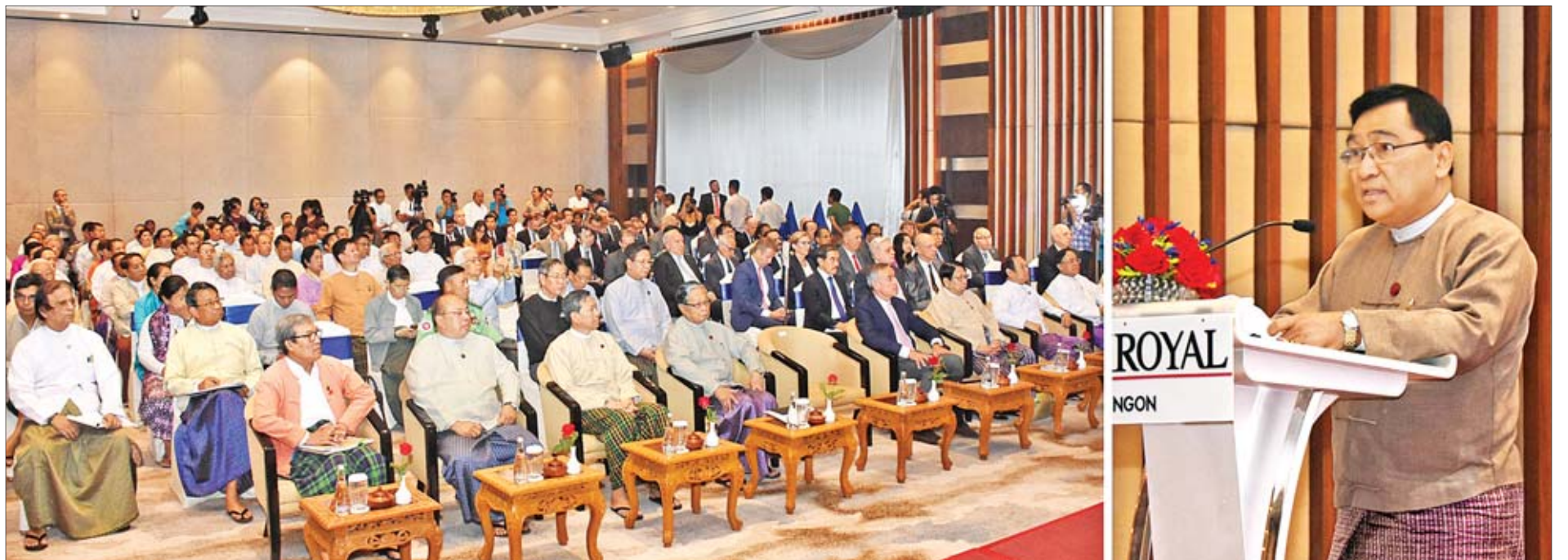
ရခိုင်ပြည်နယ်ဆိုင်ရာ အကြံပြုချက်များအပေါ် အကောင်အထည်ဖော်ဆောင်ရွက်နေမှုများနှင့်စပ်လျဉ်းပြီး ပြန်လည်သုံးသပ်ခြင်းဆိုင်ရာ အလုပ်ရုံဆွေးနွေးပွဲတွင် ရခိုင်ပြည်နယ်ဆိုင်ရာအကြံပြုချက်များအပေါ် အကောင်အထည် ဖော်ဆောင်ရွက်ရေးကော်မတီဥက္ကဋ္ဌ ပြည်ထောင်စုဝန်ကြီး ဒေါက်တာဝင်းမြတ်အေး ကြိုဆိုနှုတ်ခွန်းဆက်စကား ပြောကြားစဉ်။