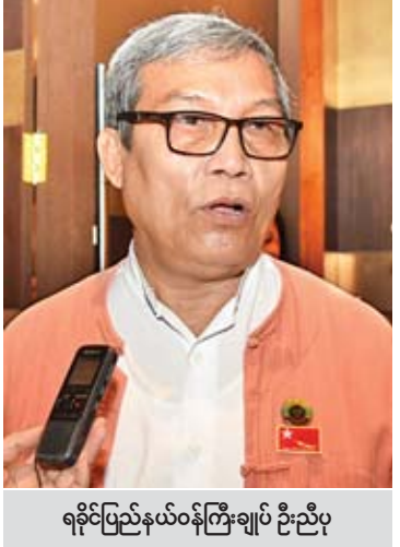
ရခိုင်ပြည်နယ်ဝန်ကြီးချုပ် ဦးညီပု