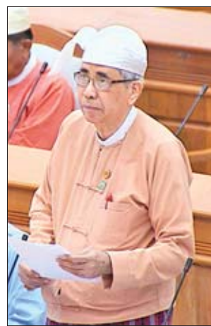
ဒုတိယဝန်ကြီး ဦးကျော်မျိုး