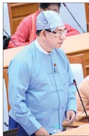
ဒုတိယဝန်ကြီး ဒေါက်တာရဲမြင့်ဆွေ