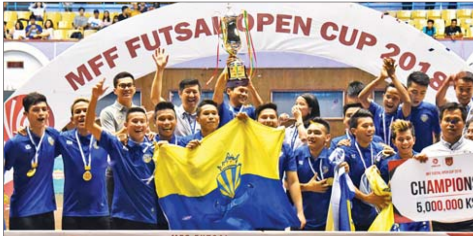
၂၀၁၉ ရာသီ ဖူဆယ်လိဂ်ပြိုင်ပွဲတွင် ဝိုက်ခွဲခဲ့သည့် MIU အသင်း။