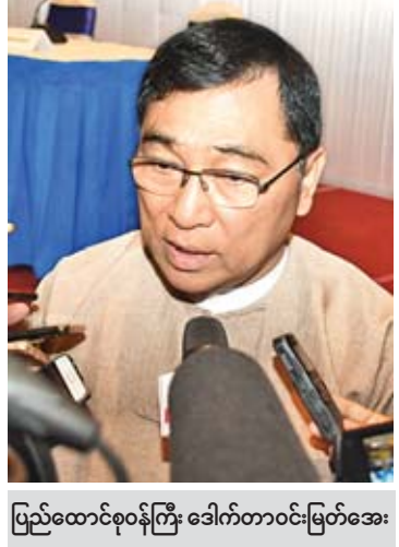
ပြည်ထောင်စုဝန်ကြီး ဒေါက်တာဝင်းမြတ်အေး

တွေ့ဆုံမေးမြန်း-ဝင်းစန္ဒီ၊ ဇော်ကြီး