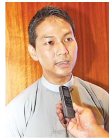
ဦးညိုငြိမ်းအေး

မြန်မာနဲ့ ဘင်္ဂလားဒေ့ရှ် သံတမန် ဆက်ဆံရေးဟာ ၁၉၇၂ ခုနှစ် ဘင်္ဂလားဒေ့ရှ်နိုင်ငံ လွတ်လပ်ရေးရခဲ့တဲ့ အချိန်ကတည်းက စခဲ့တာပါ။ မြန်မာက ဘင်္ဂလားဒေ့ရှ်နိုင်ငံ လွတ်လပ်ရေးကို အသိအမှတ်ပြုတဲ့ အစောဆုံး ငါးနိုင်ငံထဲမှာပါတယ်။ မြန်မာနဲ့ ဘင်္ဂလားဒေ့ရှ် နှစ်နိုင်ငံဆက်ဆံရေးဟာ နှစ်နိုင်ငံမိတ်ဝတ် မပျက်ဆက်ဆံရေးနဲ့ သမိုင်းစဉ်တစ်လျှောက် တောက်လျှောက် ရင်းနှီးမှုရှိခဲ့တဲ့ မိတ်ဆွေနိုင်ငံတွေဖြစ်ပါတယ်။ ဒါကြောင့် နှစ်ဖက်စလုံးက နှစ်နိုင်ငံဆက်ဆံရေးကောင်းမွန်စေဖို့ ကြိုးစားနေကြတယ်။ ဒီဆွေးနွေးပွဲကတော့ အခြားတစ်ဖက်ကလည်း အဓိကရှိနေတဲ့ စိန်ခေါ်မှုတွေ၊ အခက်အခဲတွေကို ဘယ်လို နှစ်ဦးနှစ်ဖက် အကျိုးရှိစွာနဲ့ ချောချော မောမော ကျော်ဖြတ်နိုင်မလဲဆိုတာကို အဖြေရှာတာဖြစ်လို့ အထူးကို အကျိုးရှိလိမ့် မယ်လို့ ယူဆပါတယ်။ ဘင်္ဂလားဒေ့ရှ်နိုင်ငံမှာ တာဝန်ထမ်းဆောင်နေတဲ့ မြန်မာသံအမတ်ကြီး တစ်ဦးအနေနဲ့လည်း နှစ်နိုင်ငံ သံတမန် ဆက်ဆံရေးကောင်းမွန်ပြီးတော့ ဒီထက်ပိုပြီး ကူးလူးဆက်ဆံမှုတွေရှိဖို့ အမြဲတမ်းကြိုးစား သွားမှာဖြစ်ပါတယ်။