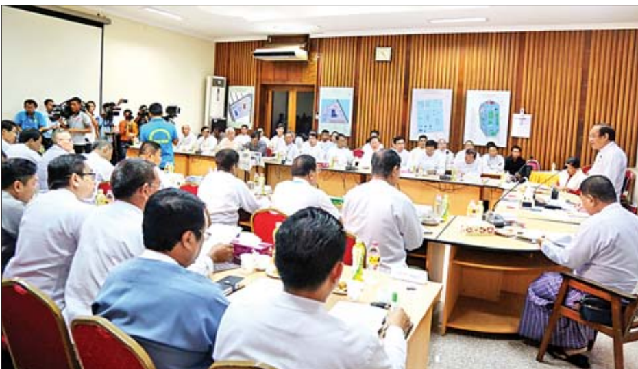
ကြရန်ဖြစ်ပါကြောင်း။

ရှေးဦးစွာ မြန်မာနိုင်ငံအမျိုးသားအိုလံပစ်ကော်မတီဥက္ကဋ္ဌ ကျန်းမာရေးနှင့်အားကစားဝန်ကြီးဌာန ပြည်ထောင်စုဝန်ကြီးက မိမိတို့ဝန်ကြီးဌာနအနေဖြင့် ကျန်းမာရေးကဏ္ဍတွင် ကုသရေးဆိုင်ရာနှင့် တိုင်းရင်းဆေးပညာဆိုင်ရာ၊ ကျွမ်းကျင်မှုပိုင်းဆိုင်ရာ အကြံပေးအဖွဲ့များ ဖွဲ့စည်းထားရှိကာ အကြံဉာဏ်များ ရယူဆောင်ရွက်လျက်ရှိသကဲ့သို့ အားကစားကဏ္ဍတွင်လည်း မြန်မာနိုင်ငံ အိုလံပစ်ကော်မတီဖွဲ့စည်းကာ မြန်မာနိုင်ငံအားကစားလောကကြီးတစ်ခုလုံး ဘက်စုံပိုမိုဖွံ့ဖြိုးတိုးတက်ရေးအတွက် အကြံဉာဏ်များ ရယူဆောင်ရွက်သွားမည် ဖြစ်ပါကြောင်း။