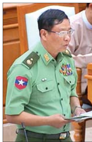
ဒုတိယဝန်ကြီး ဝိုလ်ချုပ်အောင်သူ

ဗဟိုမဲဆန္ဒနယ်မှ ဦးထွန်းမြအောင် (ခေါ်) ဦးစော ထွန်းမြအောင်၊ အုတ်တွင်းမဲဆန္ဒနယ်မှ ဒေါ်ချိုချို၊ ပဲခူးတိုင်း ဒေသကြီး မဲဆန္ဒနယ်အမှတ်(၅)မှ ဒေါက်တာတင်တင် ဝင်း၊ သံဖြူဇရပ်မဲဆန္ဒနယ်မှ ဦးဉာဏ်ဟိန်း၊ ကရင်ပြည်နယ် မဲဆန္ဒနယ်အမှတ်(၇)မှ နော်ခရစ္စထွန်း(ခေါ်) ဒေါက်တာ အာကာမိုး၊ သံတောင်ကြီးမဲဆန္ဒနယ်မှ ဦးစောစစ်တာခ