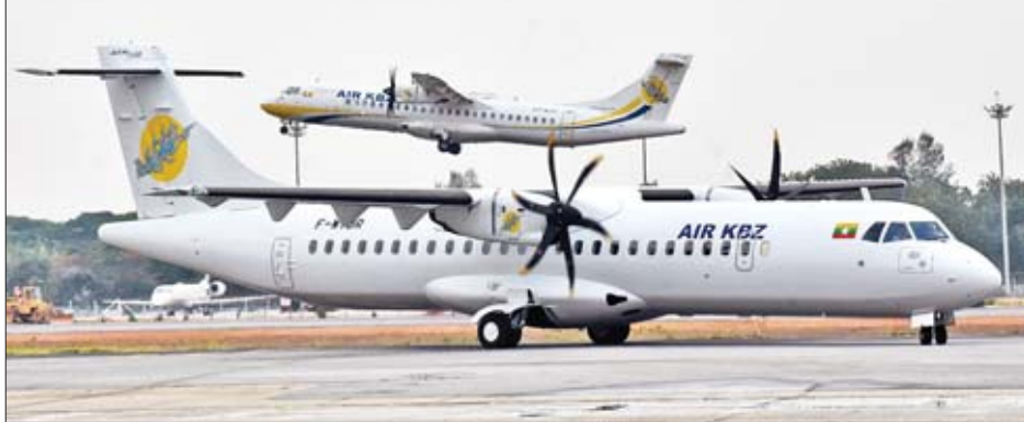
AIR KBZ လေကြောင်းလိုင်းမှ ဝယ်ယူထားသည့် ATR-72-600 လေယာဉ်သစ်များ ရန်ကုန်အပြည်ပြည် ဆိုင်ရာလေဆိပ်သို့ ရောက်ရှိလာစဉ်။

AIR KBZ Ltd. သည် ATR-72-600 (2019 Model) လေယာဉ်လေးစင်း မှာယူထားခြင်းဖြစ်ပြီး ကျန်ရှိသည့် လေယာဉ်အသစ်နှစ်စင်းမှာ ဇွန်လတွင် ထပ်မံ ရောက်ရှိမည်ဖြစ်သည်။ ယခုမှာယူထားသည့် လေယာဉ်