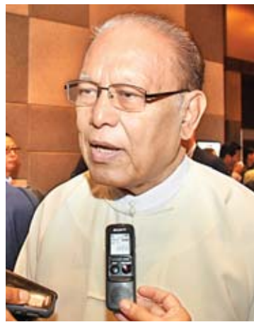
ဦးဝင်းမြ

ဒီနေ့မနက်ပိုင်းမှာတော့ ကျွန်တော်တို့ ပြည်ထောင်စုဝန်ကြီး ဦးဆောင်ပြီးတော့ ကိုဖီအာနန်ကော်မရှင်ရဲ့အကြံပြုချက်တွေကို အကောင်အထည်ဖော်မှုနဲ့ ပတ်သက်ပြီး ပြန်လည်သုံးသပ်ဆွေးနွေးတာပါ။ ကျွန်တော်အနေနဲ့ကတော့ ခြုံငုံသုံးသပ်မှုအနေနဲ့ ဆွေးနွေးတယ်။ ကိုဖီအာနန်အစီရင်ခံစာမှာပါတဲ့ ၈၈ ချက်ထဲက ဘာတွေလုပ်နိုင်ခဲ့သလဲ။ ဘယ်အဆင့်အထိ ရောက်နေသလဲ။ ဒါတွေကို ကျွန်တော်အနေနဲ့ ခြုံငုံသုံးသပ်ဆွေးနွေးခဲ့ပါတယ်။ ဒါတွေဟာလည်း ရှေ့ဆက်ပြီးတော့ လုပ်ဆောင်သွားရမယ့်အလုပ်တွေပါ။ အကုန်လုံးကတော့ လက်ရှိဆောင်ရွက်