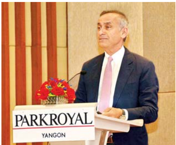
ရခိုင်ပြည်နယ်ဆိုင်ရာအကြံပြုချက်များအပေါ် အကောင်အထည်ဖော် ဆောင်ရွက်ရေးကော်မတီ၏ အကြံပေးဘုတ်အဖွဲ့ဝင် Rt. Hon. Lord Darzi of Denham ရှင်းလင်းပြောကြားစဉ်။

ထို့နောက် ရခိုင်ပြည်နယ်ဆိုင်ရာအကြံပြုချက်များအပေါ် အကောင် အထည်ဖော်ဆောင်ရွက်ရေးကော်မတီ၏အကြံပေးဘုတ်အဖွဲ့ဝင် Rt. Hon. Lord Darzi of Denham က ရခိုင်ပြည်နယ်ဆိုင်ရာ အကြံပြုချက်များအပေါ် အကောင်အထည်ဖော်ဆောင်ရွက်မှု တိုးတက်မှုများကို မြင်တွေ့နေရပါကြောင်း။