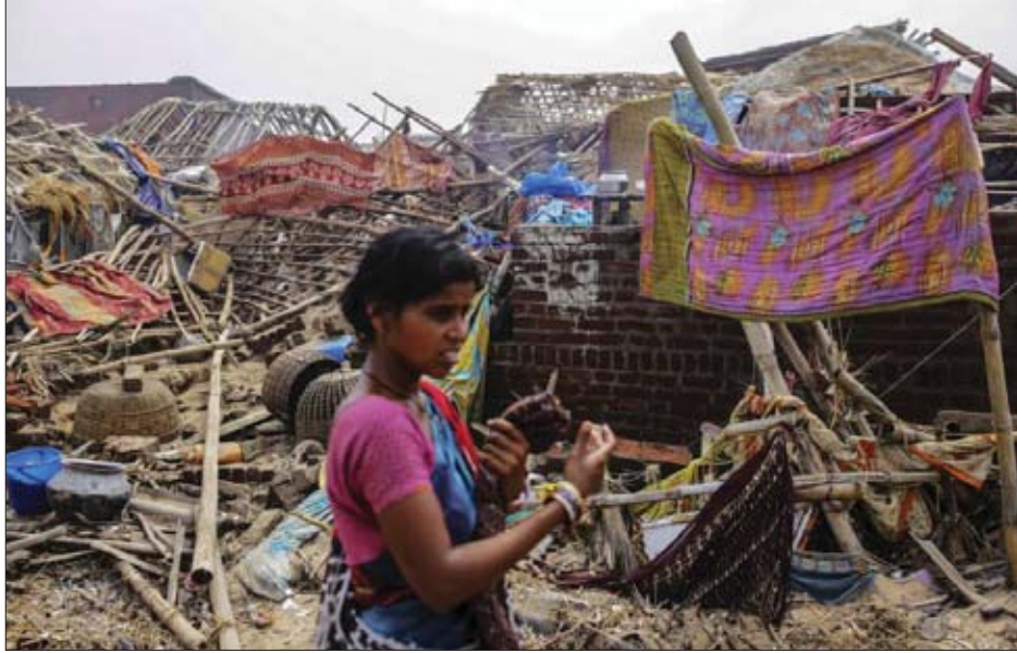
မေလ ၄ ရက်က အိန္ဒိယနိုင်ငံ အိန္ဒိရာပြည်နယ် ပူရီခရိုင်တွင် ဆိုင်ကလုန်းမုန်တိုင်း “ဖန်နီ” ကြောင့် ပျက်စီးသွားသည့် အိမ်များအကြား အမျိုးသမီးတစ်ဦး လမ်းလျှောက်နေစဉ်။

ကြိုတင်အချက်ပေးစနစ်များ ဆောလျင်စွာထုတ်ပြန်မှုနှင့် ပြည်သူတစ်သန်းကျော်ကို ဘေးကင်းရာသို့ ပြောင်းရွှေ့မှု လျင်လျင်မြန်မြန် လုပ်ဆောင်ခဲ့ခြင်းကြောင့် ကုလသမဂ္ဂ အဖွဲ့နှင့် အခြားပညာရှင်များက အိန္ဒိယနိုင်ငံအား ချီးကျူး ခဲ့ပြီး ထိုသို့ဆောင်ရွက်ခြင်းကြောင့် အိန္ဒိယနိုင်ငံအရှေ့ပိုင်း ကမ်းရိုးတန်းတစ်လျှောက် တိုက်ခတ်ခဲ့သည့် အင်အား ပြင်းထန်သော ဆိုင်ကလုန်းမုန်တိုင်း “ဖန်နီ” ကြောင့် ဆုံးရှုံးရမည့် လူအသက်ပေါင်းများစွာကို ကယ်တင်နိုင်ခဲ့ ကြောင်း ၎င်းတို့က ပြောကြားခဲ့သည်။