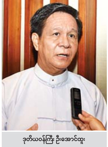
ဒုတိယဝန်ကြီး ဦးအောင်ထူး