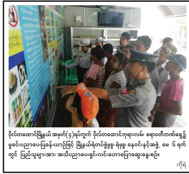
ဗိုလ်တထောင်မြို့နယ်အမှတ်(၄)ရပ်ကွက် ဗိုလ်တထောင်ဘုရားလမ်း ရောဂါတစ်ခုခုနှင့် မှုခင်းပညာပေးပြခန်းယာဉ်ဖြင့် မြို့နယ်ရဲတပ်ဖွဲ့မှူး၊ ရဲမှူး၊ နေဝင်းနှင့်အဖွဲ့ မေ ၆ ရက် တွင် ပြည်သူများအား အသိပညာပေးရှင်းလင်းဟောပြောဆွေးနွေးစဉ်။