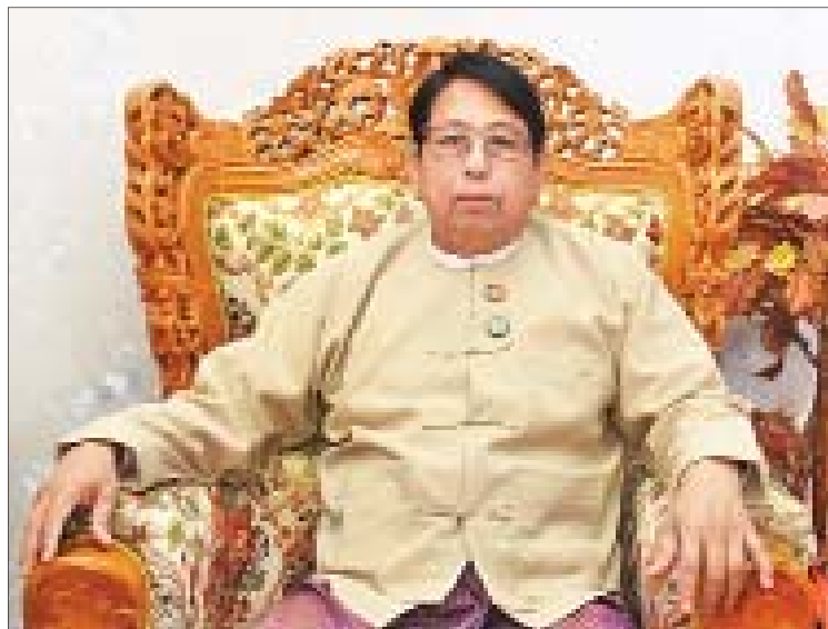
ပြည်ထောင်စုဝန်ကြီး ဒေါက်တာစေမြင့်

ဒေါက်တာစေမြင့် (ပြည်ထောင်စုဝန်ကြီး) ပြန်ကြားရေးဝန်ကြီးဌာန မေး။ အများပြည်သူနှင့် မထွိုင်ကြီးသုံးရပ် အကြား ဆက်ဆံပေါင်းကူးလျက်ရှိတဲ့ ပြန်ကြားရေးဝန်ကြီးဌာနရဲ့ ဦးတည်ချက်၊ ရည်မှန်းချက်များနှင့် ဝန်ကြီးဌာနအကြောင်း မိတ်ဆက်ပြောကြားပေးစေလိုပါတယ်ရှင်။ ဖြေ။ ပြန်ကြားရေးဝန်ကြီးဌာန ဆိုတာကတော့ အစိုးရနှင့် ပြည်သူ့ကြားမှာ ဆက်သွယ်ပေါင်းကူးပေးနေတဲ့ ဌာနဖြစ်ပါတယ်။ အဓိကဆောင်ရွက်တဲ့ လုပ်ငန်းတာဝန်တွေက အများပြည်သူကို သတင်းအချက်အလက်ပေးတယ်။