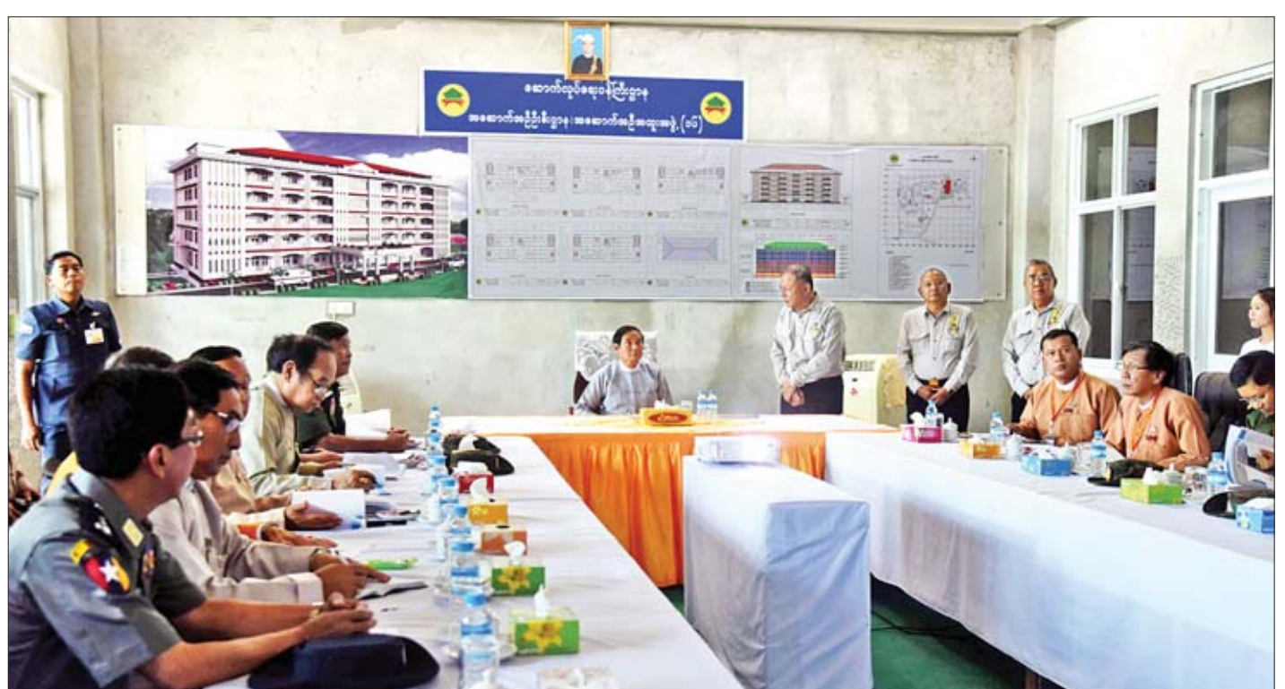
နိုင်ငံတော်သမ္မတ ဦးဝင်းမြင့်အား ဆောက်လုပ်ရေးဝန်ကြီးဌာန အဆောက်အဦဦးစီးဌာနမှ တာဝန်ရှိသူများက ထားဝယ်မြို့ပြည်သူ့ဆေးရုံကြီး ငါးထပ်ဆောင်ဆောက်လုပ်နေမှု အခြေအနေများကို ရှင်းလင်းတင်ပြစဉ်။

တင်ပြချက်များအပေါ် နိုင်ငံတော်သမ္မတက သိမ်းဆည်းခံလယ်ယာမြေများနှင့်ပတ်သက်ပြီး နိုင်ငံတော် က ချမှတ်ထားသည့် မူဝါဒများရှိပါကြောင်း၊ ယင်းမူဝါဒ များနှင့်အညီ သိမ်းဆည်းလယ်ယာမြေများကို မှန်မှန် ကန်ကန် စိစစ်ဆောင်ရွက်ပေးရမည်ဖြစ်ပါကြောင်း၊