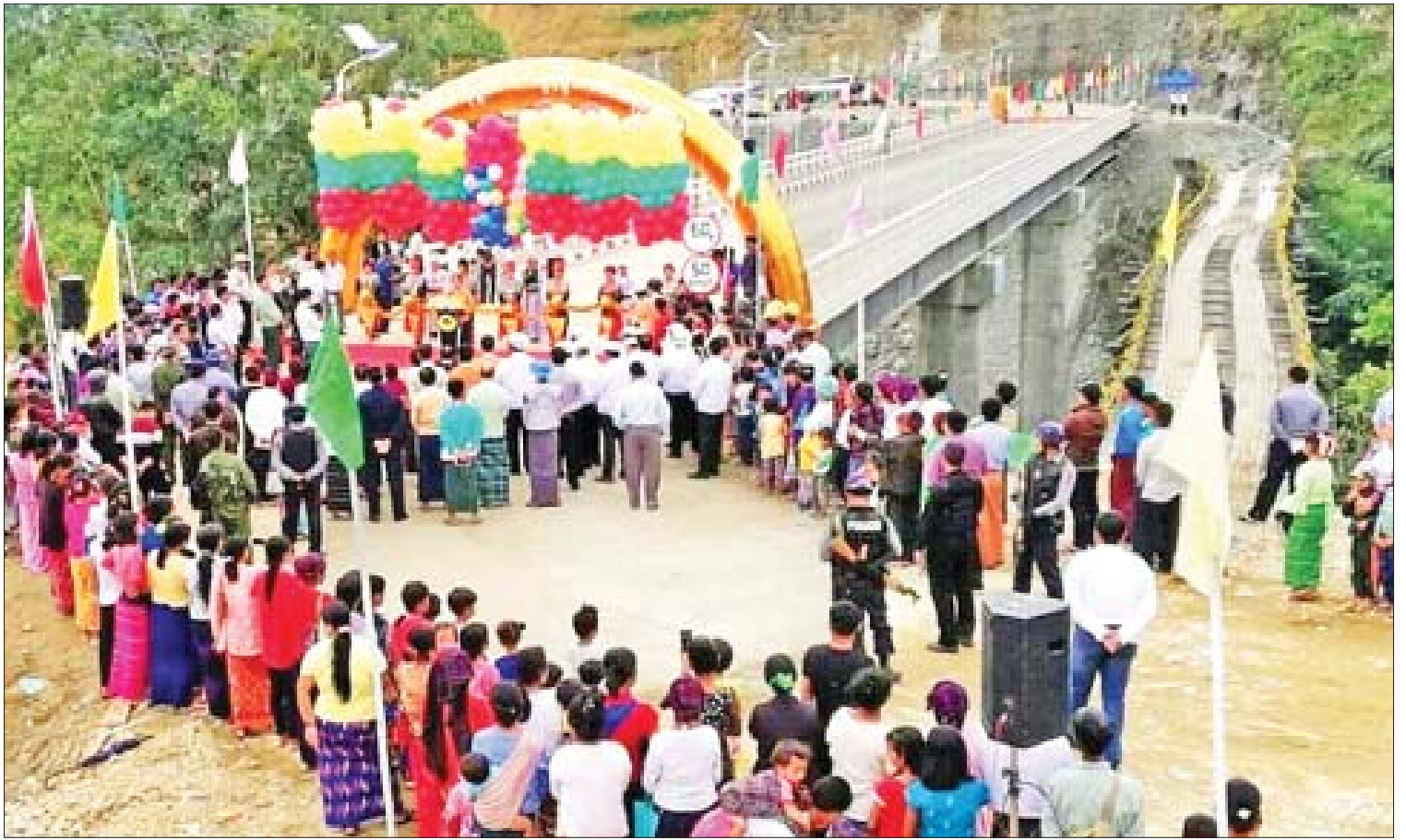
မြစ်ကြီးနား-ဆွမ်ပရာဘွမ်-ပူတာအိုလမ်းပေါ်ရှိ တီယာန့်ဇွပ်တံတားဖွင့်ပွဲအခမ်းအနား ကျင်းပစဉ်။

နိုင်ငံတော်အတိုင်ပင်ခံရုံးဝန်ကြီးဌာနက ကချင်ပြည်နယ် ဖွံ့ဖြိုးတိုးတက်ရေးအတွက်