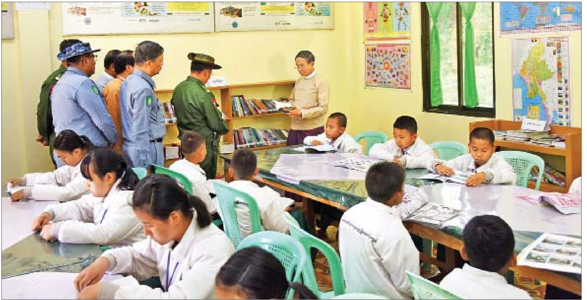
နိုင်ငံတော်သမ္မတ ဦးဝင်းမြင့် မြစ်ကြီးနားမြို့၊ နယ်စပ်ဒေသတိုင်းရင်းသားလူငယ်များဖွံ့ဖြိုးရေးသင်တန်းကျောင်းတွင် ကြည့်ရှုစစ်ဆေးစဉ်။