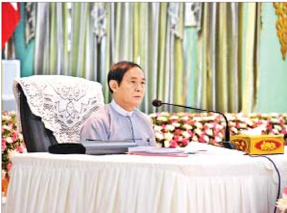
နိုင်ငံတော်သမ္မတ ဦးဝင်းမြင့် ထားဝယ်မြို့တော်ခန်းမ၌ တိုင်းဒေသကြီးအစိုးရအဖွဲ့၊ တိုင်းဒေသကြီးလွှတ်တော်၊ တိုင်းဒေသကြီးတရားလွှတ်တော်နှင့် တိုင်းဒေသကြီး၊ ခရိုင်၊ မြို့နယ်များမှ ဌာနဆိုင်ရာ တာဝန်ရှိသူများနှင့် တွေ့ဆုံပွဲတွင် လမ်းညွှန်အမှာစကားပြောကြားစဉ်။

ထားဝယ် မေ ၃ နိုင်ငံတော်သမ္မတ ဦးဝင်းမြင့်သည် ပြည်ထောင်စုဝန်ကြီးများဖြစ်ကြသည့် ဒုတိယဗိုလ်ချုပ်ကြီးကျော်ဆွေ၊ ဒုတိယဗိုလ်ချုပ်ကြီးရဲအောင်၊ ဒေါက်တာမြင့်ထွေး၊ ဦးဟန်ဇော်၊ ဦးအုန်းမောင်၊ မြန်မာနိုင်ငံရဲတပ်ဖွဲ့ရဲချုပ် ဒုတိယဗိုလ်ချုပ်ကြီး အောင်ဝင်းဦး၊ တာဝန်ရှိသူများနှင့်အတူ ယနေ့နံနက်ပိုင်းတွင် နေပြည်တော်မှ တပ်မတော်အထူးလေယာဉ်ဖြင့် ထွက်ခွာရာ တနင်္သာရီတိုင်းဒေသကြီး ထားဝယ်မြို့သို့ ရောက်ရှိကြသည်။