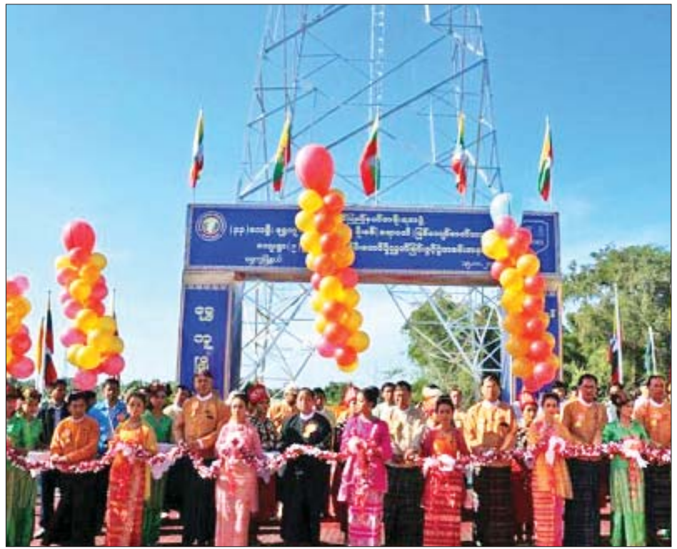
ရွှေကျမြို့နယ်ရှိ ရောဝတီမြစ်ကျော်ဓာတ်အားလိုင်းနှင့် ကျေးရွာ ကိုးရွာသို့ လျှပ်စစ်မီးစတင်ပို့လွှတ်ခြင်း ဖွင့်ပွဲအခမ်းအနား ကျင်းပစဉ်။