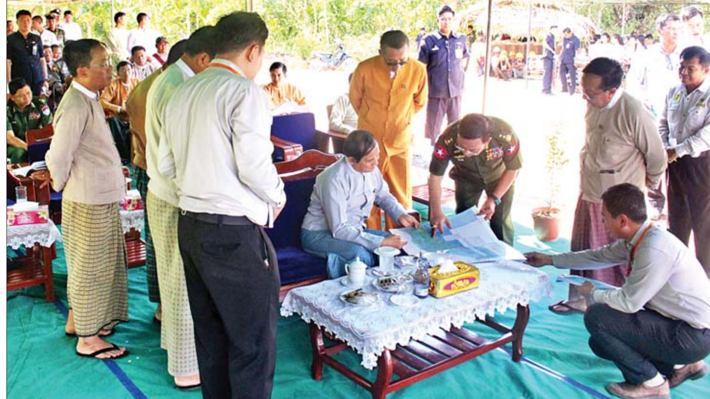
နိုင်ငံတော်သမ္မတ ဦးဝင်းမြင့်အား ပြည်ထောင်စုဝန်ကြီး ဒုတိယဗိုလ်ချုပ်ကြီးရဲအောင်က ထားဝယ်အထူးစီးပွားရေးဇုန်နှင့် ထိုင်းနိုင်ငံနယ်စပ် ထီးခီးသို့ဆက်သွယ်သည့် နှစ်လမ်းသွား ကားလမ်း အဆင့်မြှင့်တင်ခြင်းစီမံကိန်းဆိုင်ရာအချက်အလက်များကို ရှင်းလင်းတင်ပြစဉ်။

စွန့်လွှတ်သည့်မြေများကို မူလပိုင်ရှင်များလက်ဝယ်သို့ မြန်မြန်ဆန်ဆန်ရောက်ရှိအောင် ဆောင်ရွက်ပေးကြရမည် ဖြစ်ပါကြောင်း။