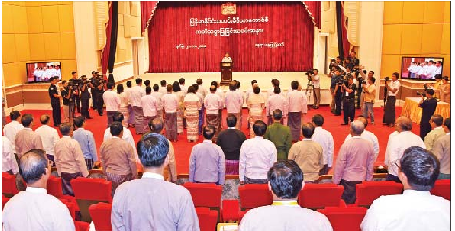
နိုင်ငံတော်သမ္မတ ဦးဝင်းမြင့်၏ရှေ့မှောက်၌ မြန်မာနိုင်ငံသတင်းမီဒီယာကောင်စီဥက္ကဋ္ဌနှင့် ကောင်စီဝင်များ တတိယစွာပြုကြစဉ်။

ပြည်သူ့အတွက် ပြန်ကြားရေးဝန်ကြီးဌာန၊ ပညာပေးရန်၊ ဖျော်ဖြေပေးရန်ဟူသည့် ဆောင်ပုဒ်နှင့်အညီ ပြည်သူများအတွက် သတင်းအချက်အလက်များ ပေးအပ်ခြင်း၊ အသိပညာများ ဖြန့်ဝေခြင်းနှင့် ပြည်သူများစိတ်အပန်းပြေစေရေးရည်ရွယ်၍ ဦးတည်ဆောင်ရွက်လျက်ရှိသည့် ပြန်ကြားရေးဝန်ကြီးဌာန၏ အစိုးရသက်တမ်း တတိယ(၁)နှစ်တာအတွင်း ဆောင်ရွက်ချက်များကို သိရှိနိုင်ရန်အတွက် ပြည်ထောင်စုဝန်ကြီး ဒေါက်တာစေမြင့်နှင့် ဒုတိယဝန်ကြီး ဦးအောင်လှထွန်းတို့အား တွေ့ဆုံမေးမြန်းထားပါသည်။