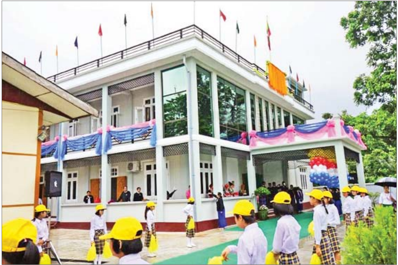
ကချင်ပြည်နယ် ဥပဒေချုပ်ရုံးအဆောက်အအုံသစ်ဖွင့်ပွဲ ကျင်းပစဉ်။

ပြည်နယ်အစိုးရအဖွဲ့အနေဖြင့် ပြည်သူများအတွက် ဖွံ့ဖြိုးတိုးတက်ရေး ဆောင်ရွက်ရာတွင် လိုအပ်ချက်များ တည်ရှိနေနိုင်သော်လည်း ၎င်းတို့ တာဝန်ယူဆောင်ရွက်သည့် (၃)နှစ်တာကာလကို ကောင်းစွာဖြတ်ကျော်ခဲ့ပြီးဖြစ်သည်။ ထို့အတူ ကျန်ရှိနေသည့် အစိုးရသက်တမ်းကာလအတွင်း ပြည်သူ့မှူးချယ်ထားသည့် ပြည်သူ့အစိုးရဖြစ်သည်နှင့်အားလျော်စွာ ပြည်သူတို့၏ လိုအပ်ချက်များကို ဆတက်တိုး၍ ကြိုးစားဆောင်ရွက်သွားမည်ဖြစ်ကြောင်း ရေးသားတင်ပြလိုက်ပါသည်။