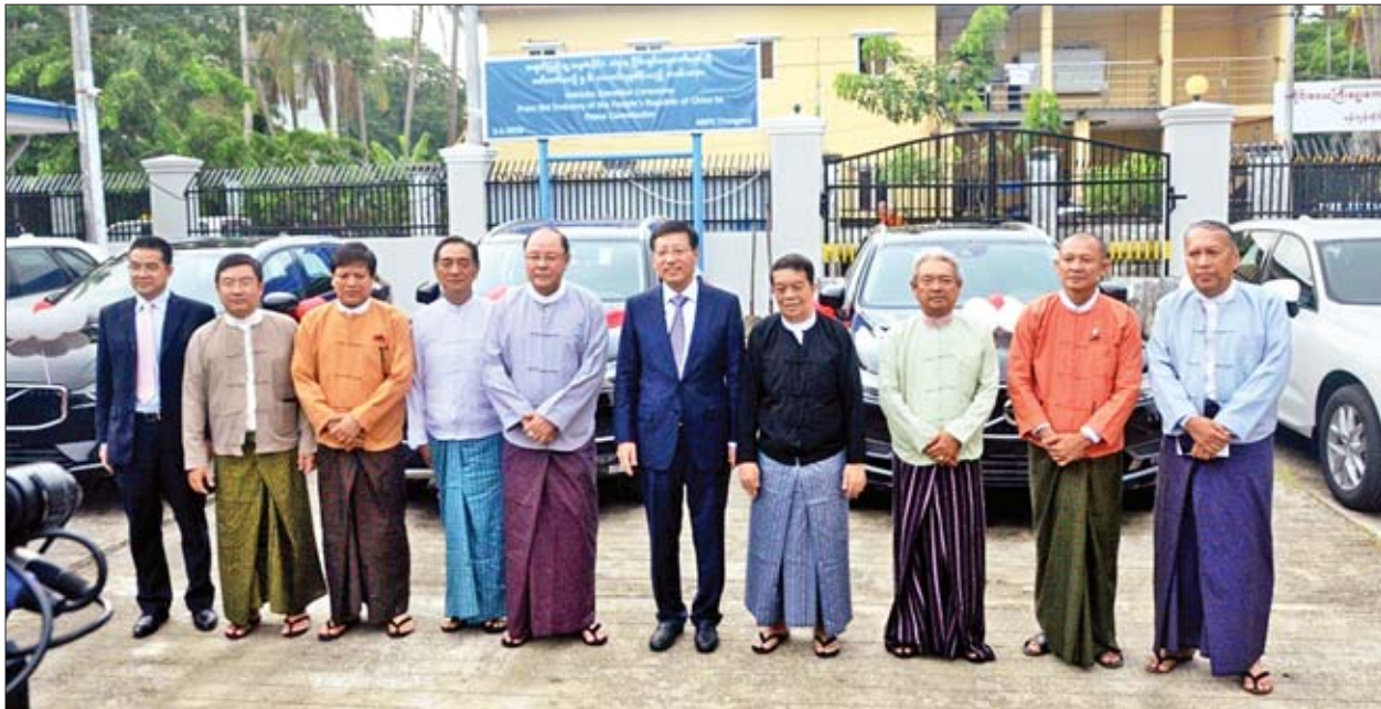
ပြည်ထောင်စုငြိမ်းချမ်းရေးကော်မရှင်သို့ မော်တော်ယာဉ်ငါးစီးပေးအပ်လှူဒါန်းပွဲတွင် တက်ရောက်သူများကို တွေ့ရစဉ်။