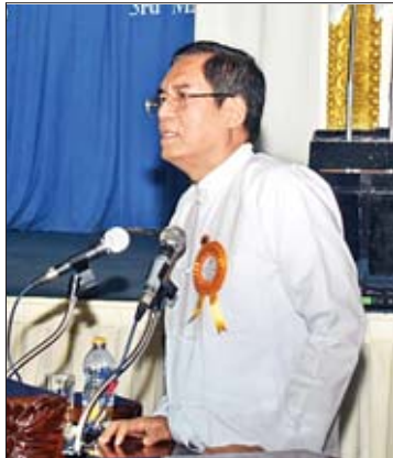
ဒုတိယဝန်ကြီး ဦးအောင်လှထွန်း

ကြောင်း။ အမှန်ကိုလွန်တယ်ဆိုပြီး Post Truth ဆိုတာ စဉ်းစားကြည့်လျှင် နာမည်လှလှလေး ပေးလိုက်ခြင်းဖြစ်ပြီး တကယ်တော့ အမှန် ကို လွန်သွားပြီးသည့်နောက်တွင် မှန်တာ မရှိတော့ပါကြောင်း၊ အမှန်တရားက သေဆုံး သွားသည့် သဘောဖြစ်ပါကြောင်း၊ Post Truth နောက်တွင် ပေါ်လာသည်က Fake News ဟူ၍ ဖြစ်ပါကြောင်း၊ Fake News