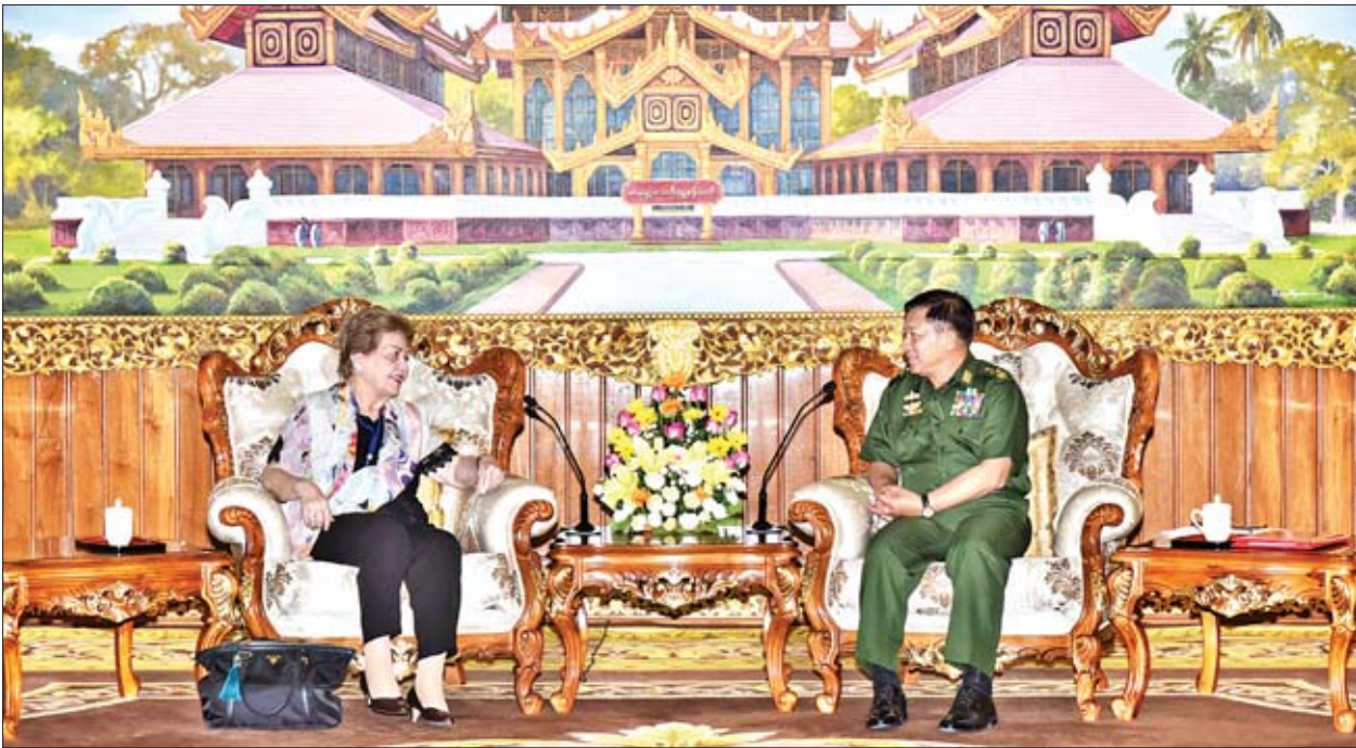
သည်ဖြစ်ရာ ရခိုင်ပြည်နယ် မောင်တောဒေသတွင် ဖြစ်ပွားခဲ့သော ပြဿနာ သည် ဘာသာရေးပြဿနာမဟုတ်ဘဲ ဒေသတွင်းနေထိုင်ကြသူအချင်းချင်း၏ ပဋိပက္ခနှင့် တရားမဝင်လူဝင်၊ ထွက်မှုကြောင့် ဖြစ်ပေါ်ခဲ့သော ပြဿနာသာ ဖြစ်ကြောင်း သိရှိနိုင်သည့်အခြေအနေ၊ ICOE မှ သိရှိလိုသောအချက်များ ရရှိနိုင်ရေး တပ်မတော်က ပူးပေါင်းကူညီဆောင်ရွက်ပေးသွားမည့် အခြေအနေ တို့ကို ရင်းနှီးပွင့်လင်းစွာ ဆွေးနွေးခဲ့ကြကြောင်း တပ်မတော်ကာကွယ်ရေး ဦးစီးချုပ်မှူး၏ သတင်းထုတ်ပြန်ချက်အရ သိရသည်။

ထိုသို့တွေ့ဆုံစဉ် ၂၀၁၇ ခုနှစ် ဩဂုတ်လ၊ စက်တင်ဘာလများတွင် ဖြစ်ပွားခဲ့သည့် ARSA အကြမ်းဖက်အဖွဲ့၏ တိုက်ခိုက်မှုများသည် ရုတ်ခြည်း ဖြစ်ပေါ်ခြင်းမဟုတ်ဘဲ လတ်တလောအားဖြင့် ၂၀၁၂ ခုနှစ်၊ ၂၀၀၆ ခုနှစ်တို့တွင် ဖြစ်ပေါ်ခဲ့သည့် နောက်ခံအကြောင်းအရာများနှင့် ဆက်စပ်နေသည့် အခြေအနေ၊ နိုင်ငံတကာမှ စွပ်စွဲချက်များ၊ တစ်ဖက်သတ်ဖော်ပြချက်များကိုသာ မကြည့်ဘဲ သက်သေအထောက်အထား ခိုင်ခိုင်လုံလုံဖြင့် အဖြစ်မှန်ပေါ်ပေါက် သည့်ထိ စုံစမ်းစစ်ဆေးရန်လိုအပ်သည့် အခြေအနေ၊ ယင်းဖြစ်စဉ်များနှင့် ပတ်သက်၍ တပ်မတော်က ဒုတိယဗိုလ်ချုပ်ကြီးအေးဝင်း ဦးဆောင်သည့် စုံစမ်းစစ်ဆေးရေးအဖွဲ့ ဖွဲ့စည်း၍ စုံစမ်းစစ်ဆေးခဲ့ပြီး အပြစ်ရှိသူများကို အရေးယူ ခဲ့သည့်အခြေအနေ၊ ယင်းစုံစမ်းစစ်ဆေးမှုအပြင် နောက်ထပ်ပြစ်မှုကျူးလွန် သူများ ရှိ မရှိ ထပ်မံ၍စစ်ဆေးဖော်ထုတ်အရေးယူနိုင်ရန်အတွက် တပ်မတော် အက်ဥပဒေနှင့်အညီ စုံစမ်းစစ်ဆေးရေးခုံရုံးနှင့် ယင်းစုံစမ်းစစ်ဆေးရေးခုံရုံးကို အထောက်အကူပြုရန် ဥပဒေအကြံပေးအဖွဲ့ ဖွဲ့စည်းဆောင်ရွက်လျက်ရှိသည် အခြေအနေ၊ စုံစမ်းစစ်ဆေးရေးခုံရုံးက စစ်ဆေးတွေ့ရှိချက်များအရ ပြစ်မှု ကျူးလွန်သူများရှိပါက ဥပဒေနှင့်အညီ ထိရောက်စွာအရေးယူဆောင်ရွက်မည့် အခြေအနေ၊ မြန်မာနိုင်ငံအနှံ့တွင် ဗုဒ္ဓဘာသာ၊ ခရစ်ယာန်ဘာသာ၊ အစ္စလာမ် ဘာသာ ကိုးကွယ်သူများအားလုံး ယခုအချိန်ထိ အေးချမ်းစွာနေထိုင်နေကြ