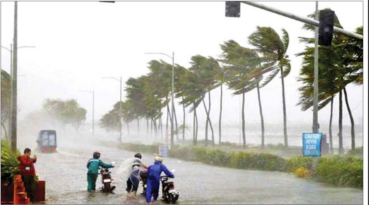
မုန်တိုင်းတိုက်ခတ်စဉ်တွင် လေတိုက်နှုန်းပြင်းထန်ခဲ့သည့်အတွက် မော်တော်ယာဉ်တစ်စီး တိမ်းမှောက်သွားသည်ကို ကိုယ်တိုင်တွေ့မြင်ခဲ့ကြောင်း မျက်မြင်တွေ့ရှိသူတစ်ဦးက ဆိုသည်။

အိန္ဒိယနိုင်ငံ အနောက်ဘင်္ဂလားပြည်နယ်အတွင်းရှိ ပြည်သူထောင်ပေါင်း များစွာကို ဘေးလွတ်ရာသို့တိမ်းရှောင်ကြရန် အာဏာပိုင်များက သတိပေးထားသည်။ ပြည်တွင်းလေဆိပ်များ၊ ရထားပြေးဆွဲမှုများနှင့် မော်တော်ယာဉ်သွားလာမှုများ ယာယီပိတ်ထားကြောင်း သိရသည်။