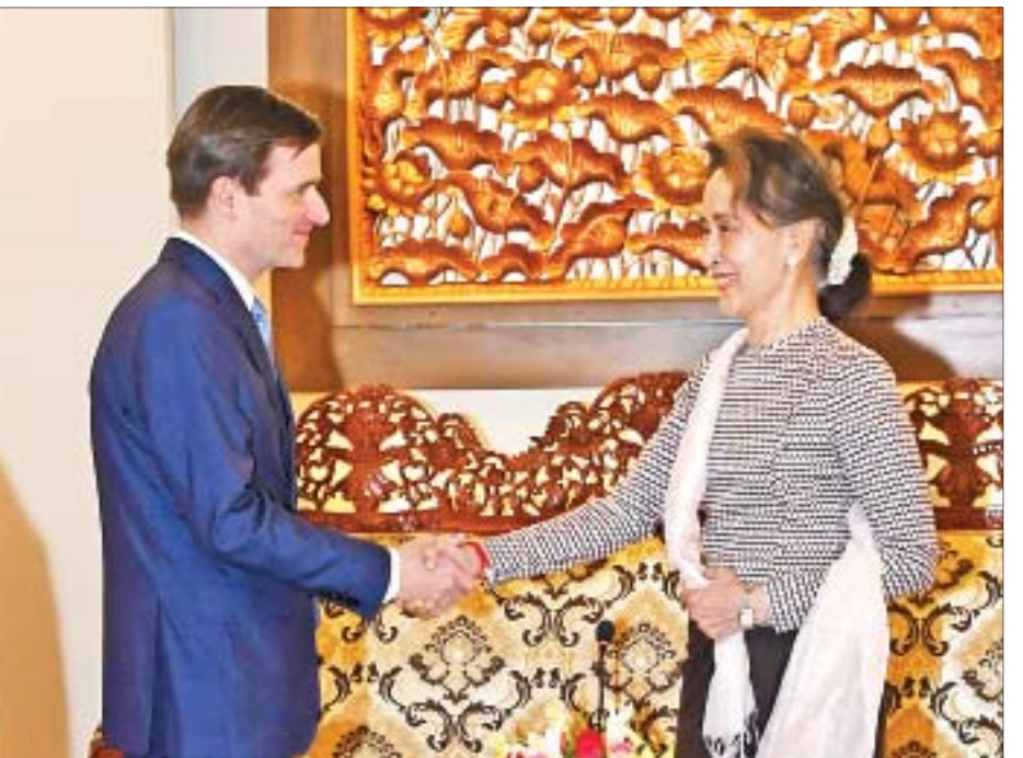
နိုင်ငံတော်၏အတိုင်ပင်ခံပုဂ္ဂိုလ် ဒေါ်အောင်ဆန်းစုကြည် အမေရိကန်ပြည်ထောင်စု နိုင်ငံခြားရေးဝန်ကြီးဌာန ဒုတိယဝန်ကြီး Mr. David Hale အား ရင်းရင်းနှီးနှီး နှုတ်ဆက်စဉ်။

နေပြည်တော် မေ ၃ နိုင်ငံတော်၏အတိုင်ပင်ခံပုဂ္ဂိုလ် ဒေါ်အောင်ဆန်းစုကြည်သည် အမေရိကန်ပြည်ထောင်စု နိုင်ငံခြားရေးဝန်ကြီးဌာန ဒုတိယဝန်ကြီး Mr. David Hale အား ယနေ့ နံနက် ၁၀ နာရီတွင် နေပြည်တော်ရှိ နိုင်ငံခြားရေးဝန်ကြီးဌာန၌ လက်ခံတွေ့ဆုံသည်။ အမြင်ချင်းဖလှယ်ဆွေးနွေး တွေ့ဆုံစဉ်အတွင်း နှစ်နိုင်ငံဆက်ဆံရေးနှင့် ပူးပေါင်းဆောင်ရွက်မှုဖြင့်တင်ရေးနှင့် ရခိုင်ပြည်နယ်အရေးကိစ္စအပါအဝင် မြန်မာနိုင်ငံ၏ ဒီမိုကရေစီအသွင်ကူးပြောင်းရေးတွင် ကြံ့တော့နေရသည့် စိန်ခေါ်မှုများအား ကျော်လွှားနိုင်ရေးအတွက် ကူညီထောက်ပံ့ပေးရေးကိစ္စရပ်များအပေါ် အမြင်ချင်းဖလှယ် ဆွေးနွေးခဲ့ကြသည်။ သတင်းစဉ်