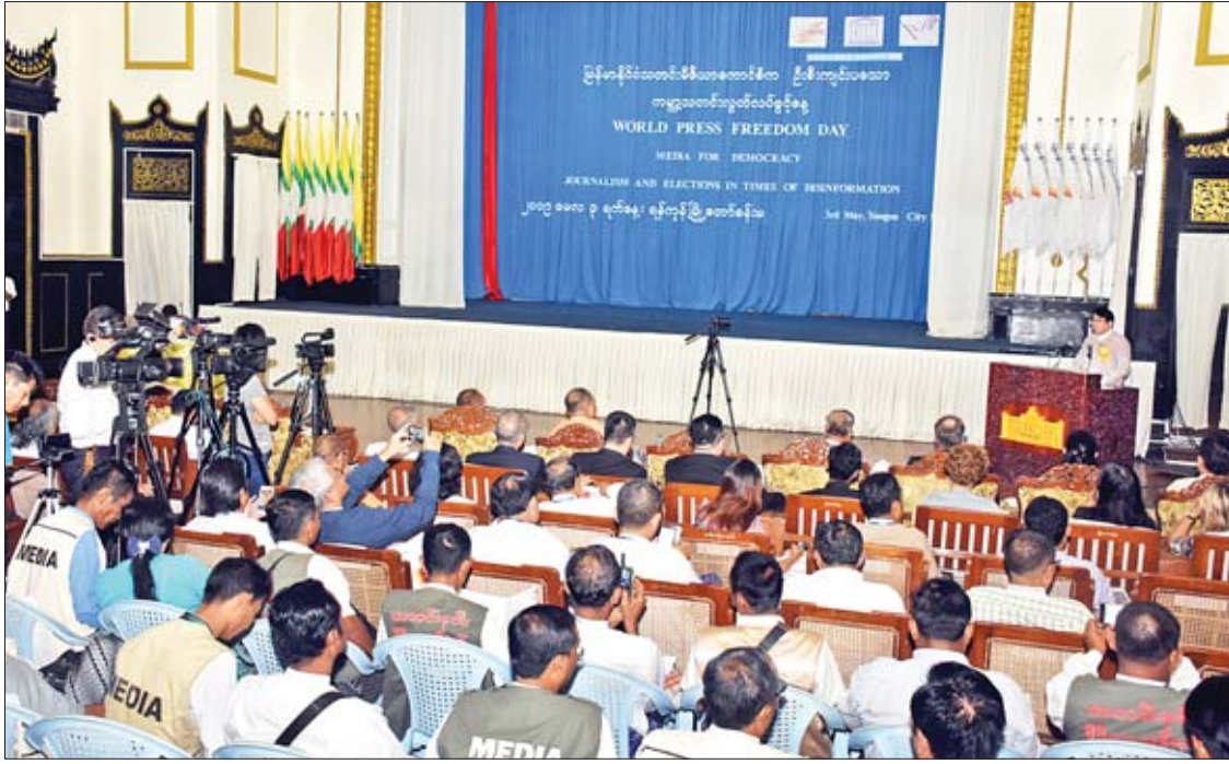
ပြည်ထောင်စုဝန်ကြီး ဒေါက်တာဖေမြင့် ကမ္ဘာ့သတင်းလွတ်လပ်ခွင့်နေ့ အခမ်းအနားတွင် အမှာစကားပြောကြားစဉ်။

တကယ်လည်း ဒီမိုကရေစီနှင့် သတင်း မီဒီယာများ၊ ဒီမိုကရေစီနိုင်ငံနှင့် လွတ်လပ် သော စာနယ်ဇင်းသမားများသည် အမြဲခွန်တွဲ တည်ရှိလျက်ရှိပါကြောင်း၊ အားလုံးသိကြသည့်