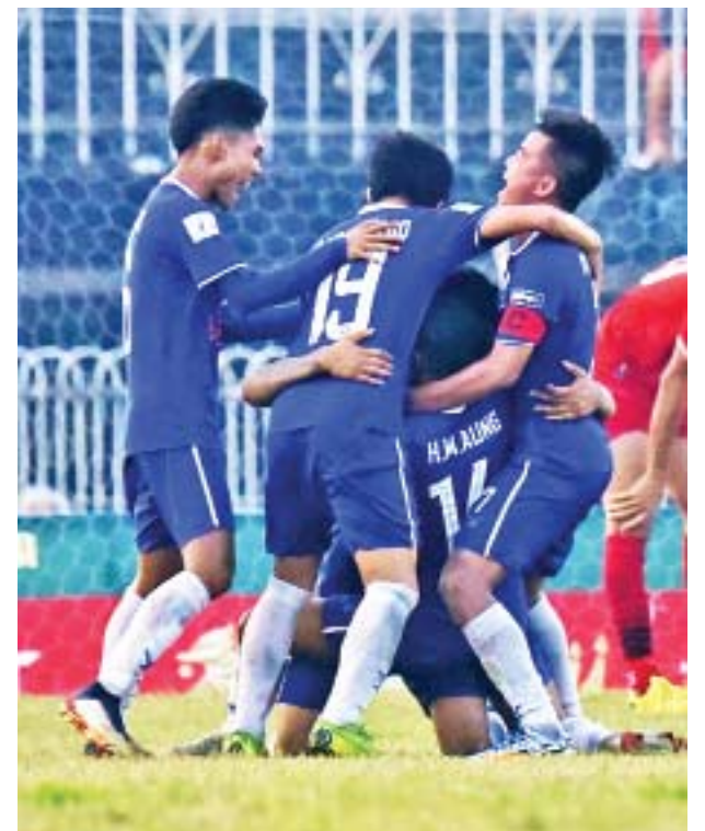
ထိပ်ဆုံးမှ ဦးဆောင်နေသည့် ရတနာပုံအသင်း။