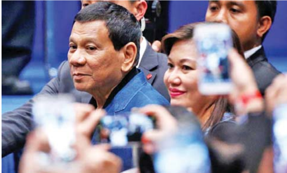
၂၀၁၈ ခုနှစ် ဧပြီလ ၁၂ ရက်က ဟောင်ကောင်ရှိ ဖိလစ်ပိုင်အသိုင်းအဝိုင်းကကျင်းပသော အခမ်းအနားတစ်ခုသို့ တက်ရောက်လာသည့် ဖိလစ်ပိုင်သမ္မတ ရိုဒရီဂိုဒူတာတေး။

ငွေကြေးဖောင်းပွမှုမြင့်တက်လာခြင်း၊ ဆင်းရဲမွဲတေမှု မြင့်မားခြင်း၊ အခြေခံအဆောက်အအုံမပြည့်စုံခြင်းနှင့် ပိုင်နက်အငြင်းပွားမှုများမှာ လာမည့် မေလ ၁၃ ရက်တွင် ကျင်းပမည့် သက်တမ်းဝက်ရွေးကောက်ပွဲများအတွင်း ဖိလစ်ပိုင်မဲဆန္ဒရှင်များ ရင်ဆိုင်နေရသည့် ပြဿနာများ ဖြစ်သည်။ ထိုကိစ္စများနှင့်ပတ်သက်၍ ကိုယ်စားလှယ် လောင်းများအပေါ် ဝေဖန်ဆန်းစစ်မှုများ ရှိနေပြီး ဖိလစ်ပိုင်နိုင်ငံသားအားလုံးက သူ၏မူဝါဒများကို ကြိုက်နှစ် သက်ခြင်းမရှိသော်လည်း စစ်တမ်းကောက်ယူမှုများတွင် လူကြိုက်များနေဆဲ ခေါင်းဆောင်တစ်ဦးဖြစ်သည့် သမ္မတ ရိုဒရီဂိုဒူတာတေး၏ ထောက်ခံချက် ရရှိမှု အပေါ် အခြေခံ၍ ဖိလစ်ပိုင်မဲဆန္ဒရှင်များက မဲပေးမည်ဖြစ်သည်။