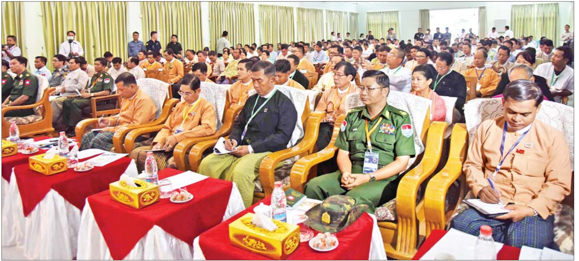
ထားဝယ်မြို့တော်ခန်းမ၌ ကျင်းပသည့် နိုင်ငံတော်သမ္မတနှင့် တိုင်းဒေသကြီးအစိုးရအဖွဲ့၊ တိုင်းဒေသကြီး လွှတ်တော်၊ တိုင်းဒေသကြီးတရားလွှတ်တော်နှင့် တိုင်းဒေသကြီး၊ ခရိုင်၊ မြို့နယ်များမှ ဌာနဆိုင်ရာ တာဝန်ရှိသူများနှင့် တွေ့ဆုံပွဲ အခမ်းအနားသို့ တက်ရောက်သူများကို တွေ့ရစဉ်။

★ ရှေ့မှ လွှတ်တော်ကိုယ်စားလှယ်များ၊ တိုင်းဒေသကြီးအဆင့် ဌာနဆိုင်ရာများမှ တာဝန်ရှိသူများ၊ ဒေသခံများနှင့် ယဉ်ကျေးမှုအဖွဲ့များက ထားဝယ်လေဆိပ်၌ ကြိုဆို နှုတ်ဆက်ကြသည်။