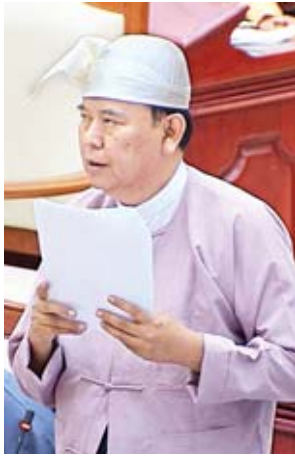
ဒုတိယဝန်ကြီး ဦးဝင်းမော်ထွန်း

စာရင်းဦးစီးဌာနတွင် The World Bank နှင့် MDTF တို့၏ အကူအညီဖြင့် ပစ္စည်းဝယ်ယူမှုဆိုင်ရာအကြံပေး တစ်ဦးအား ပြည်သူ့ဘဏ္ဍာစီမံခန့်ခွဲမှု ခေတ်မီဖွံ့ဖြိုးရေးစီမံကိန်းအောက်မှ USD ၃၀၉၆၀၀ ဖြင့် ငှားရမ်းခနှုန်းအပေးဆောင်ရွက်ခဲ့ပါကြောင်း၊ အကောက်ခွန်ဦးစီးဌာနတွင် ၂၀၁၇ ခုနှစ်မှစ၍ ဂျပန်နိုင်ငံ JICA ၏ ကူညီထောက်ပံ့မှုဖြင့် ဂျပန်နိုင်ငံသား သုံးဦးကို JICA ထောက်ပံ့ပေးငွေဖြင့် ငှားရမ်းခနှုန်းအပေးဆောင်ရွက်ခဲ့ပါကြောင်း။