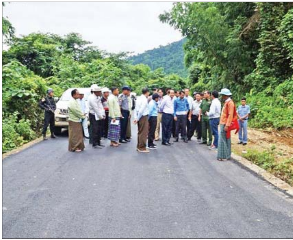
ဝန်ကြီးချုပ် ဒေါက်တာခက်အောင်နှင့် တာဝန်ရှိသူများ ဗန်းမော်-မြစ်ကြီးနား ခရိုင်ချင်းဆက်လမ်းပိုင်း ကတ္တရာ ခင်းခြင်းလုပ်ငန်းဆောင်ရွက်နေမှုကို ကြည့်ရှုစစ်ဆေးစဉ်။