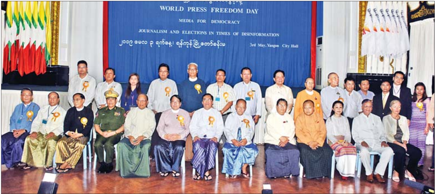
ပြည်ထောင်စုဝန်ကြီး ဒေါက်တာဖေမြင့်၊ ဒုတိယဝန်ကြီး ဦးအောင်လှထွန်းနှင့် အခမ်းအနားတက်ရောက်သူများ စုပေါင်းမှတ်တမ်းတင်ဓာတ်ပုံရိုက်ကြစဉ်။

တစ်ချိန်တည်းမှာ သတင်းအမှားများ သည် ဒီမိုကရေစီစနစ်ကို နိုင်ငံ၏ တည်ငြိမ်မှု