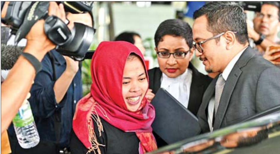
အင်ဒိုနီးရှားအမျိုးသမီးတစ်ဦးတို့သည် ကင်ဂျုံနမ်အား အာရုံကြောထိခိုက်ပျက်စီးစေသည့် အဆိပ်ရည်တစ်မျိုးကို အသုံးပြုကာ လုပ်ကြံသတ်ဖြတ်ခဲ့သည်ဟု စွပ်စွဲပြီး ၎င်းတို့အား အာဏာပိုင်များက ဖမ်းဆီးခဲ့သည်။

၂၀၁၇ ခုနှစ် ဖေဖော်ဝါရီ ၁၃ ရက်က ကွာလာလမ်ပူ နိုင်ငံတကာ လေဆိပ်၌ ခေါင်သီဟောင်နှင့်