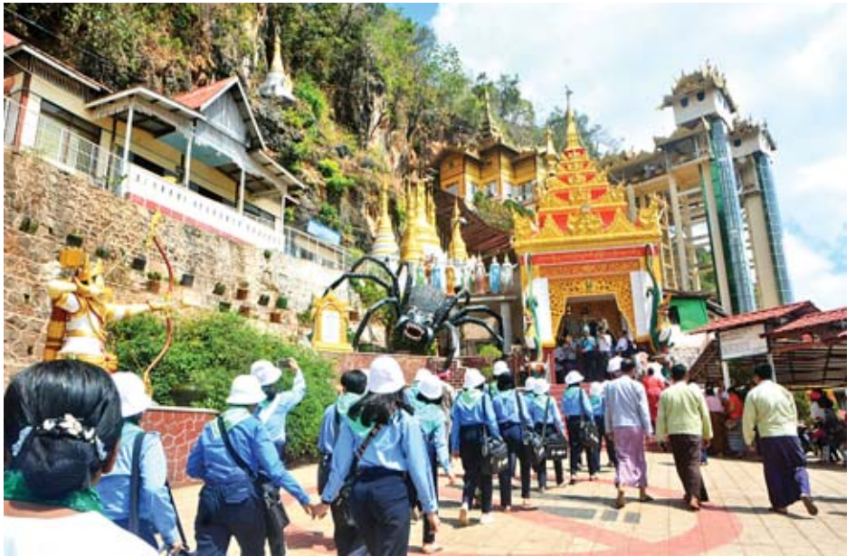
သည် ယနေ့ညနေပိုင်းတွင် တောင်ကြီးမြို့ အထက(၁) တွင် ညအိပ်ရပ်နားကြပြီး မေ ၄ ရက် နံနက်တွင် ပအိုဝ်းရိုးရာယဉ်ကျေးမှုနှင့် ဓလေ့ထုံးတမ်းများ၊ ရှေးဟောင်း

အင်းလေးခေါင်တိုင်လူရည်ချွန်စခန်းမှ လူရည်ချွန်များ