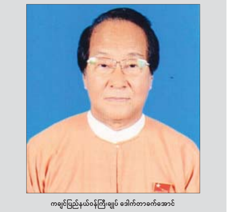
ကချင်ပြည်နယ်ဝန်ကြီးချုပ် ဒေါက်တာခက်အောင်

လျှပ်စစ်ကဏ္ဍ ပြည်နယ်အတွင်းရှိ ပြည်သူများ