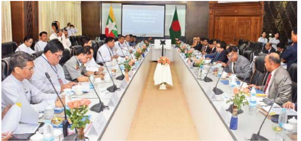
မြန်မာနိုင်ငံနှင့် ဘင်္ဂလားဒေ့ရှ်နိုင်ငံတို့အကြား နေရပ်စွန့်ခွာသွားသူများ ပြန်လည်စိစစ်လက်ခံရေး ပူးတွဲလုပ်ငန်းအဖွဲ့၏ စတုတ္ထအကြိမ် အစည်းအဝေးကျင်းပစဉ်။

မြန်မာကိုယ်စားလှယ်အဖွဲ့က နေရပ်စွန့်ခွာသွားသူများကို ပြန်လည်စိစစ်