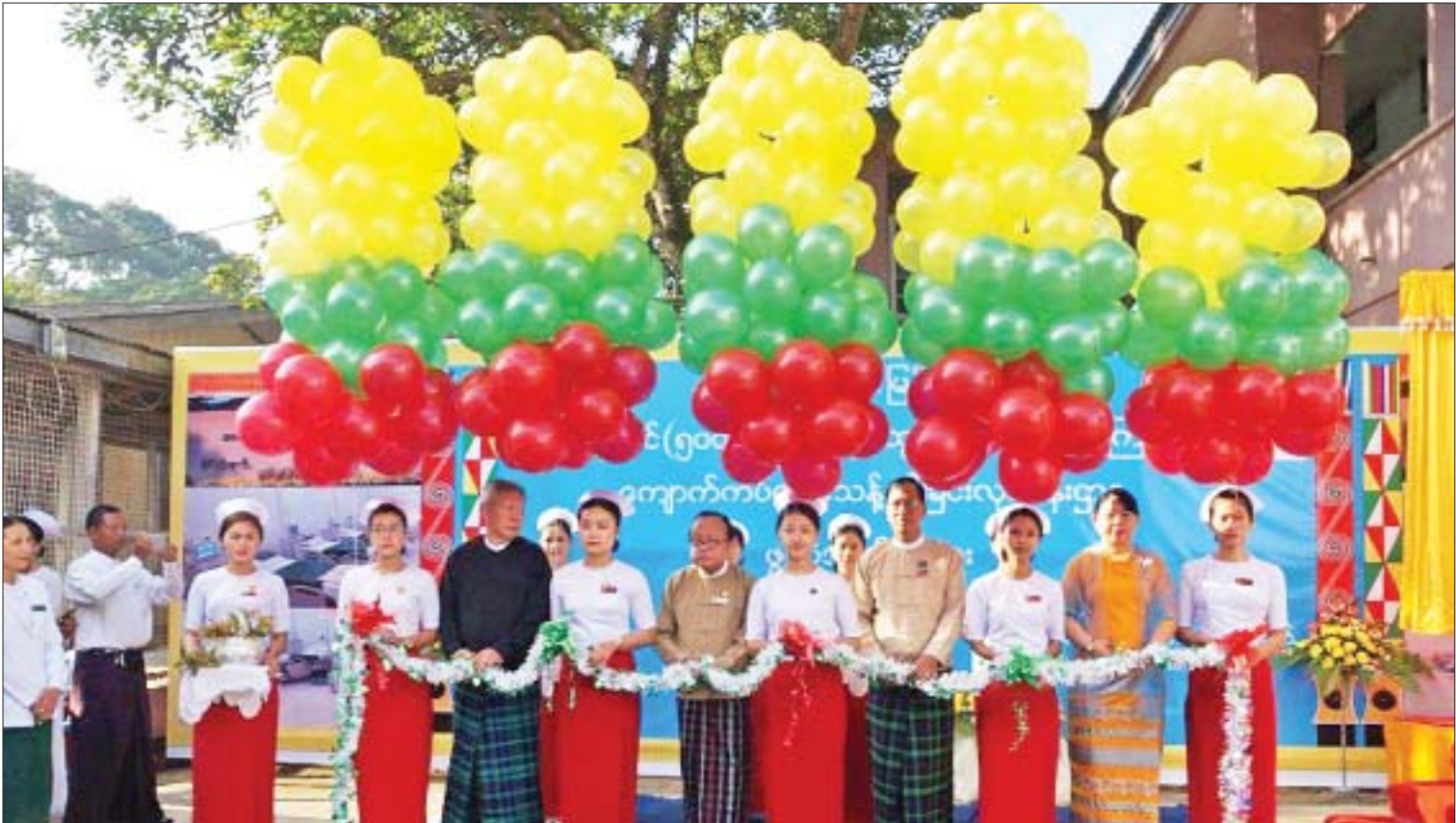
မြစ်ကြီးနားပြည်သူ့ဆေးရုံကြီး ကျောက်ကပ်သွေးသန့်စင်ခြင်းလုပ်ငန်းဌာနဖွင့်ပွဲကျင်းပစဉ်။

ပြည်သူများ၏ လူမှုစီးပွား ဖွံ့ဖြိုးတိုးတက်ရေးအတွက် ပြည်နယ်အစိုးရအဖွဲ့မှ အကောင်အထည်ဖော်ဆောင်ရွက်ရာတွင် လယ်ယာကဏ္ဍ အဆင့်မြှင့်တင်ရေးနှင့် ဖွံ့ဖြိုးတိုးတက်မှု ရရှိရေးအတွက် ဆောင်ရွက်လျက်ရှိသည်။ ထိုသို့ဆောင်ရွက်ရာတွင် တောင်သူလယ်သမားများအတွက် စက်မှုလယ်ယာဦးစီးဌာနမှ ပြည်နယ်အတွင်းရှိ လယ်ယာမြေ ၆၁၅ ဧကကို ဖော်ထုတ်ပေးနိုင်ခဲ့ပြီး ဧက ၃၀၀ ကျော်ကို ခွင့်ပြုရန်ပုံငွေကျပ် ၃၄၇ သန်းဖြင့် သိပ္ပံနည်းကျ စနစ်တကျလယ်ယာမြေ ဖော်ထုတ်ပေးနိုင်ခဲ့သည်။