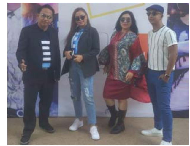
ကိုရိုင်းကိုကိုက ပြောသည်။

“ကိုယ်တိုင်ရေးစပ်ထားတဲ့ မန္တလေးသူလို့အမည်ပေးထားတဲ့ သီချင်းကို ကိုယ်တစ်တီးပြီးပြိုင်တာ အရွေးခံရပါတယ်။ ကပြခိုင်းတော့လည်း ကပြတာ သူတို့သဘော ကျကြတယ်လေ” ဟု မန္တလေးမြို့မှလာရောက်ယှဉ်ပြိုင်သူ