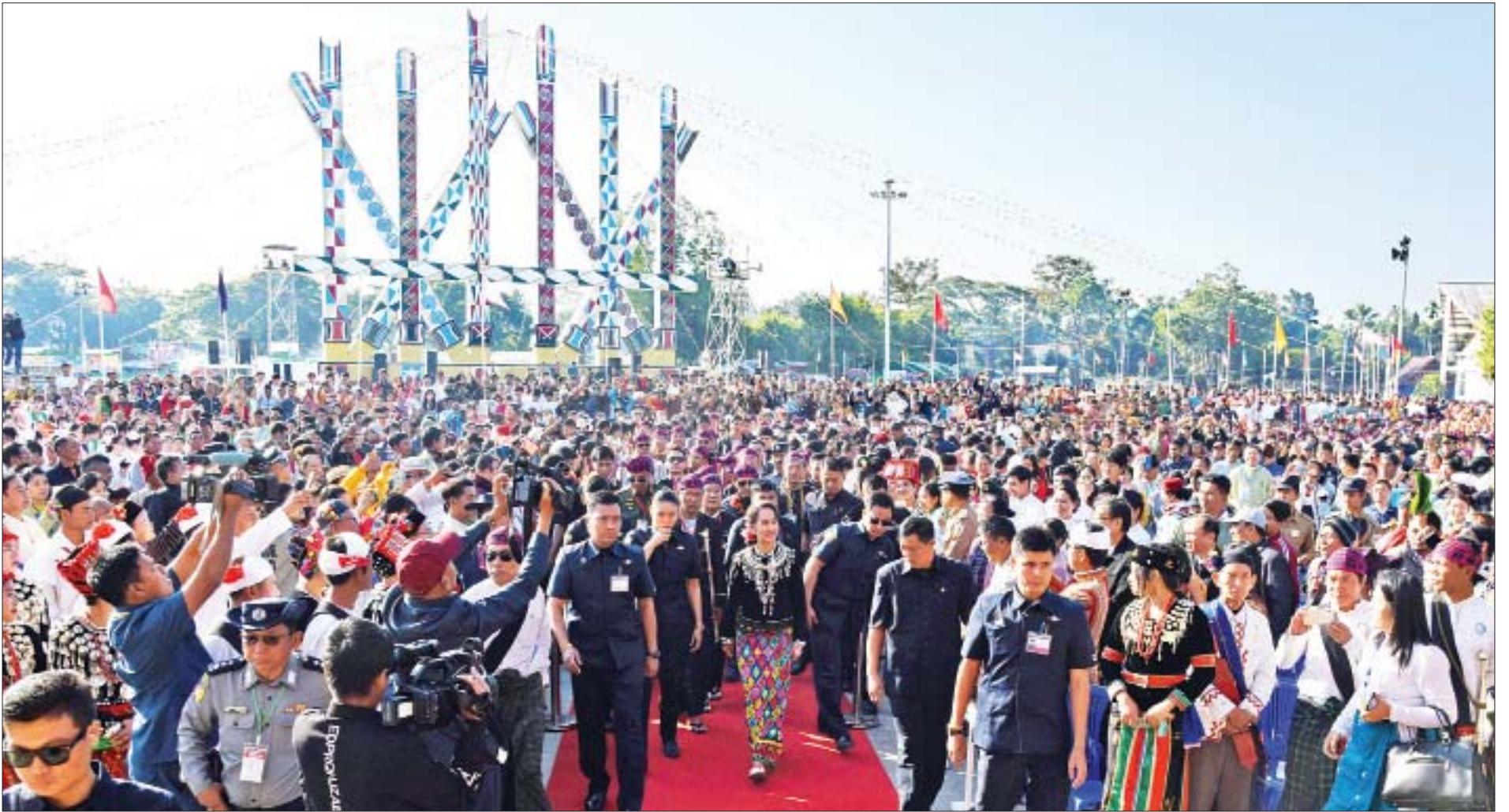
နိုင်ငံတော်၏အတိုင်ပင်ခံပုဂ္ဂိုလ် ဒေါ်အောင်ဆန်းစုကြည် (၇၁)နှစ်မြောက် ကချင်ပြည်နယ်နေ့အခမ်းအနားသို့ တက်ရောက်စဉ်။