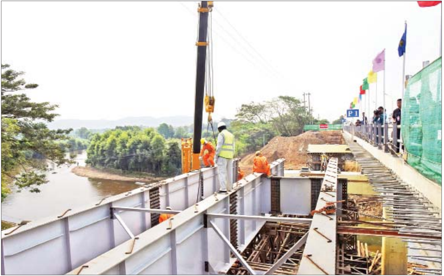
နန်မြစ်ခတ်တားတည်ဆောက်ရေးလုပ်ငန်းခွင်ကို တွေ့ရစဉ်။

“တရားမဝင် ကျွန်းသစ်နဲ့ အခြားသစ်တွေ ဖမ်းဆီးရရှိမှုအနေနဲ့ ကျွန်းသစ် ၉၅၂ တန်၊ သစ်မာ ၄၅ တန်၊ အခြားသား ၃၇၂ တန် စုစုပေါင်း ၁၃၆၉ တန် ဖမ်းဆီးနိုင်ခဲ့ပါတယ်။ ဒါ့အပြင် ကျောက်စိမ်း ၂၂၅၃၆ ပိဿာကို ဖမ်းဆီးရရှိခဲ့ပါတယ်”ဟု ပြည်နယ်ဝန်ကြီးချုပ် က ပြောသည်။