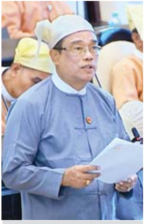
ဒုတိယဝန်ကြီး ဦးကျော်လင်း