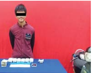
စိန်လှအား သိမ်းဆည်းရမိသည့် စိတ်ကြွေးသွပ်ဆေးပြားများ၊ ခဲယမ်းများနှင့်အတူ တွေ့ရစဉ်။