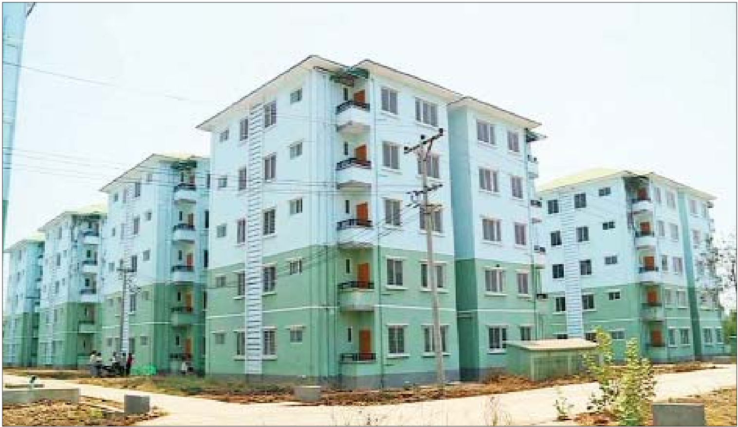
မုံရွာမြို့ နန္ဒာဝန်ရပ်ကွက်တွင် တန်ဖိုးနည်းအိမ်ရာများ ဆောက်လုပ်ထားမှုကို တွေ့ရစဉ်။

ဖြေ။ တိုင်းဒေသကြီးအတွင်း မြို့နယ် ၃၇ မြို့နယ်မှာ မြို့မ၊ နယ်မြေနဲ့ ရဲကင်းစခန်း ပေါင်း ၁၂၅ ခု၊ နယ်မြေလှုပ်ရှား တံတားလုံခြုံ ရေး ရဲကင်းပေါင်း ၇၆ ခုတို့မှာ ရဲတပ်ဖွဲ့ဝင်