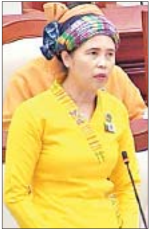
နမူတုမဲဆန္ဒနယ်မှ ဒေါ်နန်းခမ်းအေး

ယင်းနောက် ပြည်သူ့လွှတ်တော်ဥက္ကဋ္ဌက ရေကြည်မဲဆန္ဒနယ်မှ ဒေါက်တာ ဦးစံရွှေဝင်း၏ ၂၀၁၉ ခုနှစ် မတ် ၁၇ ရက် မှ ၂၀ ရက်အထိ နီပေါနိုင်ငံ အမျိုးသားကျန်းမာရေးအာမခံစနစ် ကျင့်သုံးနေမှုများအား လေ့လာရေး သွားရောက်ခဲ့သည့် ခရီးစဉ်၊ သာကေတမဲဆန္ဒနယ်မှ ဒေါက်တာဦးဝေဖြိုးအောင် ၏ ၂၀၁၉ ခုနှစ် မတ် ၁၈ ရက်မှ ၁၉ ရက်အထိ ထိုင်းနိုင်ငံ Strengthening Legal Frameworks to Protect Children from Sexual Exploitation in Travel and Tourism ဒုတိယအကြိမ် ဒေသတွင်း အလုပ်ရုံဆွေးနွေးပွဲသို့ သွားရောက်ခဲ့သည့်ခရီးစဉ်၊ ရန်ကင်းမဲဆန္ဒနယ်မှ ဒေါ်ဇင်မာအောင်၏ ၂၀၁၉ ခုနှစ် မတ် ၂၃ ရက်မှ ၂၄ ရက်အထိ ဂျပန်နိုင်ငံ (၅) ကြိမ်မြောက် ကမ္ဘာ့အမျိုးသမီးညီလာခံသို့ သွားရောက်ခဲ့သည့် ခရီးစဉ်၊ ပဲခူးမဲဆန္ဒနယ်မှ ဒေါက်တာဒေါ်ရွှေပွင့်နှင့် ပန်းတောင်းမဲဆန္ဒနယ်မှ ဒေါ်ခင်နင်းသစ် တို့၏ ၂၀၁၉ ခုနှစ် ဧပြီ ၆ ရက်မှ ၁၀ ရက်အထိ ကာတာနိုင်ငံ (၁၄၀) ကြိမ်မြောက် နိုင်ငံတကာ ဝါလီမန်များ ညီလာခံသို့ သွားရောက်ခဲ့သည့် ခရီးစဉ်၊ ဇေယျာသီရိမဲဆန္ဒနယ်မှ ဦးဖြိုးဇေယျာသော်(ခ) ဦးဇေယျာသော်၏ ၂၀၁၉ ခုနှစ် ဧပြီ ၁၅ ရက်မှ ၁၈ ရက်အထိ ဘယ်လ်ဂျီယံနိုင်ငံ European Union Visitors Programme- EUVP 2019 သို့ လေ့လာရေး သွားရောက်ခဲ့သည့် ခရီးစဉ်၊ အမျိုးသားလွှတ်တော်ကိုယ်စားလှယ် ဒေါ်နော်မြစေး ခေါင်းဆောင်၍ ပြည်သူ့လွှတ်တော်ကိုယ်စားလှယ် ၁၀ ဦးပါဝင်သည့် မြန်မာ့ကိုယ်စားလှယ်အဖွဲ့၏ ၂၀၁၉ ခုနှစ် ဧပြီ ၂၀ ရက်မှ ၂၇ ရက်အထိ တောင်အာဖရိကနိုင်ငံ Western Cape ပြည်နယ်လွှတ်တော် လေ့လာရေးသွားရောက်ခဲ့သည့် ခရီးစဉ်၊ ကော့ကရိတ် မဲဆန္ဒနယ်မှ ဦးစိုးဌေးနှင့် ကမာရွတ်မဲဆန္ဒနယ်မှ ဦးကျော်မင်းတို့၏ ၂၀၁၉ ခုနှစ် ဧပြီ ၂၃ ရက်မှ ၂၇ ရက်အထိ နယ်သာလန်နိုင်ငံ ဖွဲ့စည်းပုံအခြေခံ ဥပဒေဆိုင်ရာ အသွင်ကူးပြောင်းမှုများနှင့် ဖက်ဒရယ်နိုင်ငံများရှိ လုံခြုံရေးကဏ္ဍ