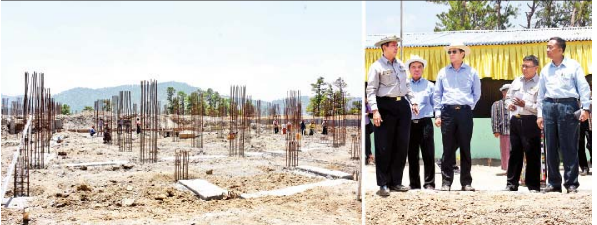
ဒုတိယသမ္မတ ဦးဟင်နရီဗန်ထီးယူ ဟားခါးကောလိပ်ဝင်းအတွင်း ဘွဲ့နှင့်သဘင်ခန်းမ တည်ဆောက်ရေးလုပ်ငန်းခွင်ကို ကြည့်ရှုစစ်ဆေးစဉ်။