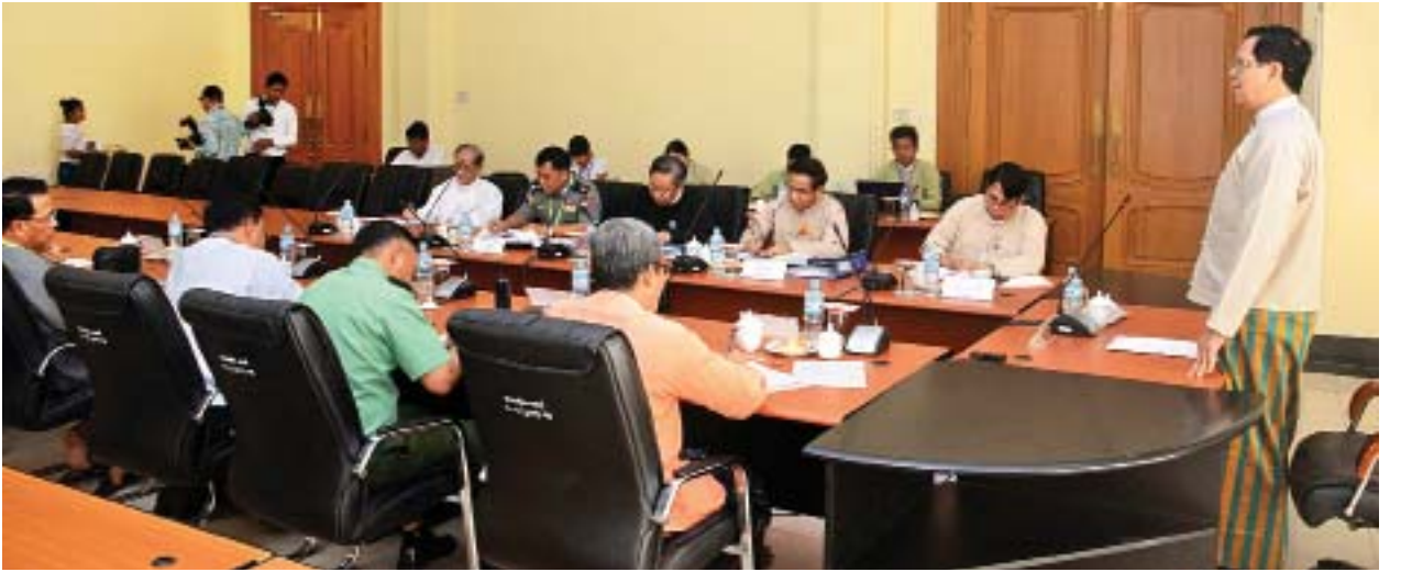
ကြောင်း ပြောကြားသည်။

တွေ့ဆုံမှုများမှ ရရှိလာသည့် အကြံပြုချက်၊ တင်ပြချက်များသည် ကော်မတီအတွက်သော်လည်းကောင်း၊ နိုင်ငံတော်အစိုးရအတွက်သော် လည်းကောင်း များစွာအကျိုးရှိသည့်အချက်များပါဝင်သည်ကို တွေ့ရပါ ကြောင်း၊ ဒုတိယအကြိမ် ခရီးစဉ်သွားရောက်သည့်အခါတွင် ပညာရှင်များ နှင့် တွေ့ဆုံဆွေးနွေးသွားမည်ဖြစ်ကြောင်း၊ ယခုတက်ရောက်လာကြသူများ အနေဖြင့် ပထမအကြိမ်ခရီးစဉ်နှင့်စပ်လျဉ်း၍ ဝိုင်းဝန်းဆွေးနွေးပေးကြစေလို