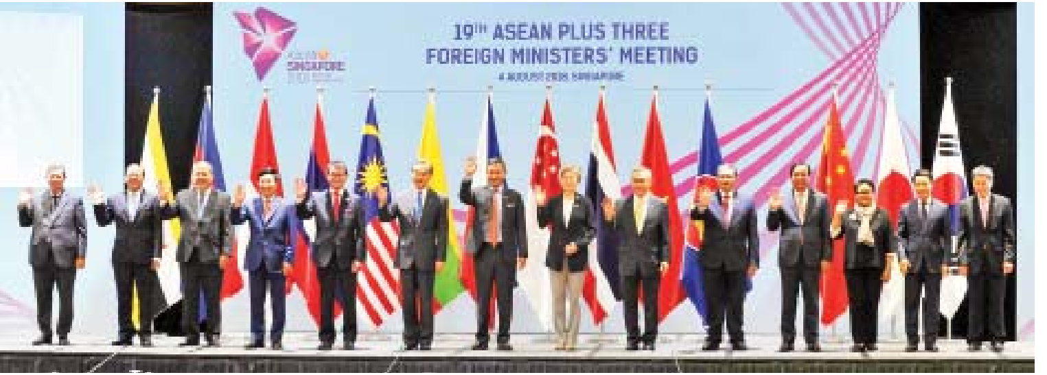
အပြည်ပြည်ဆိုင်ရာပူးပေါင်းဆောင်ရွက်ရေးဝန်ကြီးဌာန ပြည်ထောင်စုဝန်ကြီး ဦးကျော်တင် (၁၉)ကြိမ်မြောက် အာဆီယံ+၃ နိုင်ငံခြားရေးဝန်ကြီးများ အစည်းအဝေးတွင် အာဆီယံ နိုင်ငံခြားရေးဝန်ကြီးများနှင့် စုပေါင်းမှတ်တမ်းတင် ဓာတ်ပုံရိုက်စဉ်။

ACMECS ပူးပေါင်းဆောင်ရွက်မှု လုပ်ငန်းအစီအစဉ် စီမံကိန်းတွေအတွက် စိုက်ပျိုးရေးကဏ္ဍရဲ့ ညှိနှိုင်းရေးမှူးတာဝန်၊ စီအယ်လ်အမ်စီရဲ့ဖွံ့ဖြိုးတိုးတက်ရေး ပူးပေါင်း ဆောင်ရွက်မှု မူဘောင်ရေးဆွဲရေးအတွက် လုပ်ငန်းစဉ်တွေချမှတ်ရာမှာ စိုက်ပျိုးရေးနဲ့ စက်မှုကဏ္ဍများ ညှိနှိုင်းရေးမှူးတာဝန်တွေ ထမ်းဆောင်လျက်ရှိပါတယ်။ ဘင်းမိစတက် အဖွဲ့မှာ စိုက်ပျိုးရေးနဲ့ စွမ်းအင်ကဏ္ဍတို့တွင် ဦးဆောင်နိုင်ငံအဖြစ်ပါဝင်ပြီး နိုင်ငံတော် သမ္မတက စတုတ္ထအကြိမ်မြောက် ဘင်းမိစတက် ထိပ်သီးအစည်းအဝေးသို့ တက်ရောက်ခဲ့ပါတယ်။