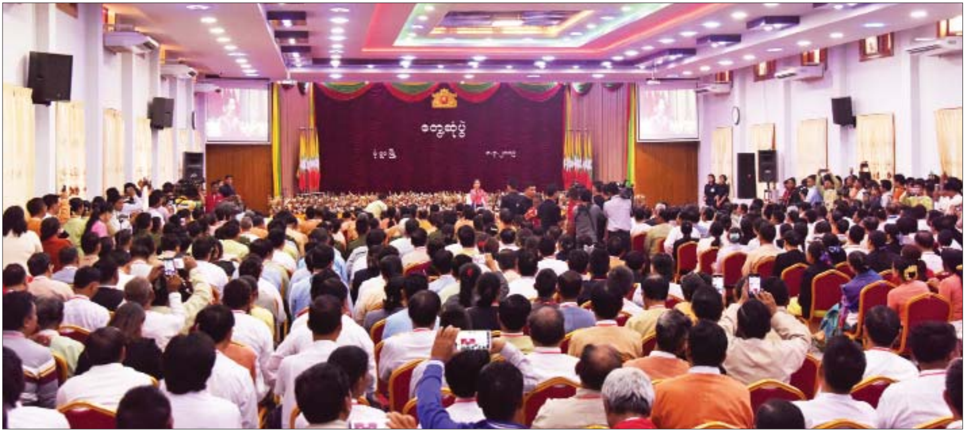
နိုင်ငံတော်၏အတိုင်ပင်ခံပုဂ္ဂိုလ် ဒေါ်အောင်ဆန်းစုကြည် ၈-၃-၂၀၁၉ ရက်က မုံရွာမြို့ဒေသခံပြည်သူများနှင့် တွေ့ဆုံပွဲအခမ်းအနားတွင် အမှာစကားပြောကြားစဉ်။