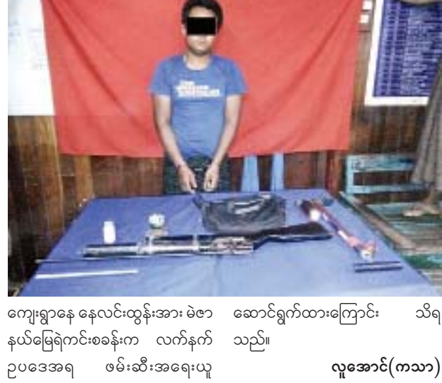
ကျေးရွာနေ နေလင်းထွန်းအား မဲဇာ ဆောင်ရွက်ထားကြောင်း သိရ နယ်မြေရဲကင်းစခန်းက လက်နက် သည်။ ဥပဒေအရ ဖမ်းဆီးအရေးယူ လူအောင်(ကသာ)