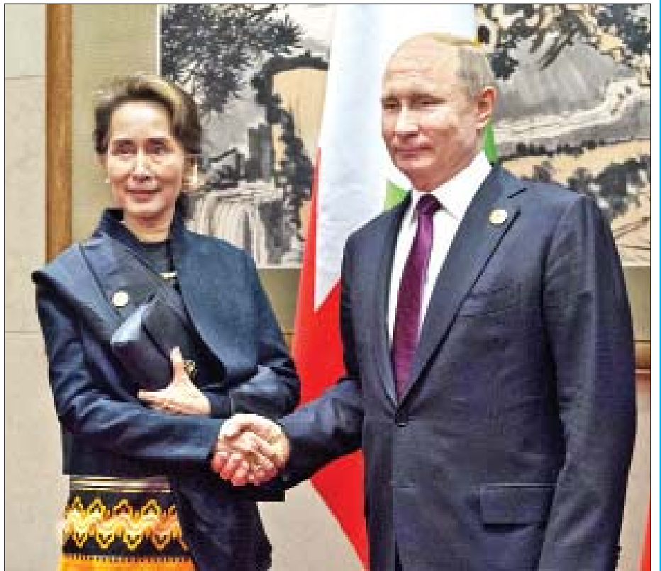
နိုင်ငံတော်၏အတိုင်ပင်ခံပုဂ္ဂိုလ် ဒေါ်အောင်ဆန်းစုကြည်အား တရုတ်ပြည်သူ့သမ္မတနိုင်ငံ သမ္မတ မစ္စတာ ရှီကျင့်ဗျင်က ရင်းရင်းနှီးနှီးနှုတ်ဆက်စဉ်။