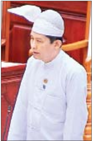
ဒုတိယဝန်ကြီး ဒေါက်တာထွန်းနိုင်