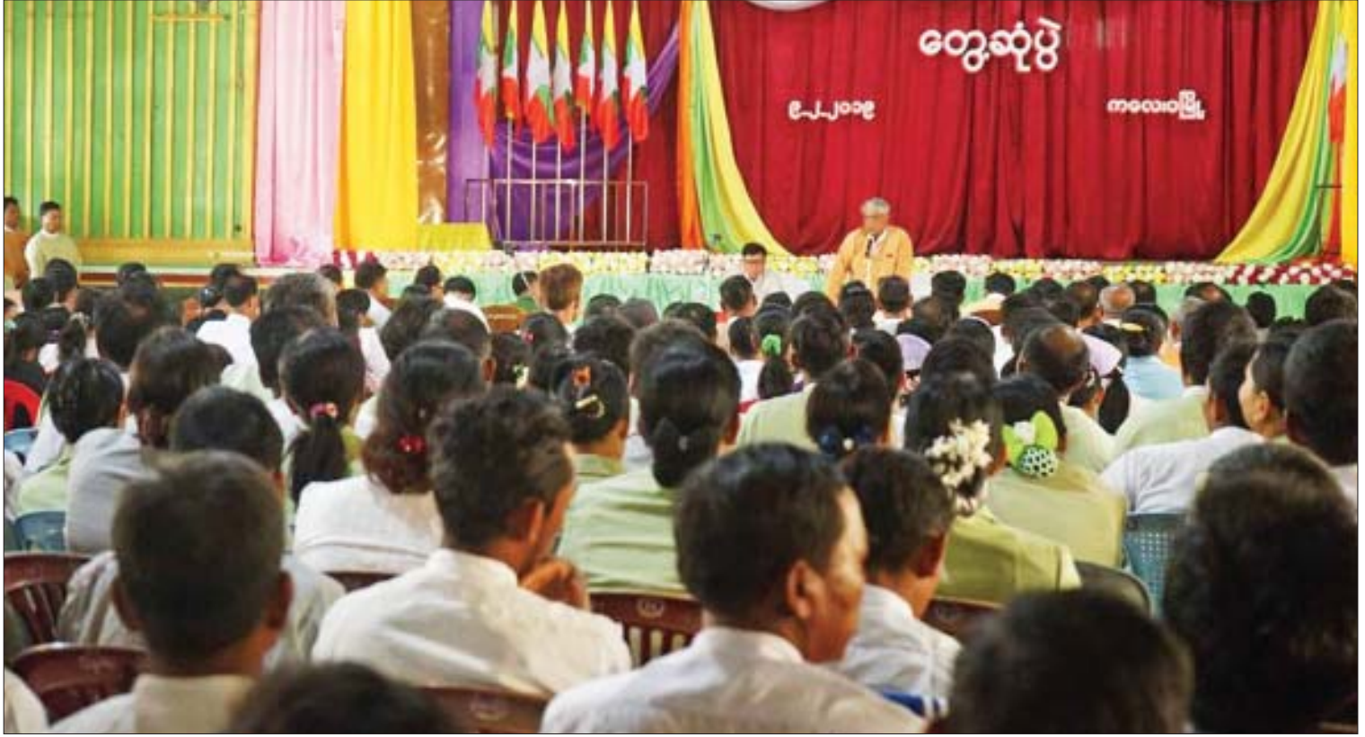
စစ်ကိုင်းတိုင်းဒေသကြီးဝန်ကြီးချုပ် ဒေါက်တာမြင့်နိုင် ၉-၂-၂၀၁၉ ရက်က ကလေးဝမြို့ ဒေသပြည်သူများနှင့်တွေ့ဆုံပွဲတွင် အမှာစကားပြောကြားစဉ်။

MSMEs လုပ်ငန်းတွေ ဖွံ့ဖြိုးတိုးတက်ဖို့အတွက် တိုင်းဒေသကြီး MSMEs အေဂျင်စီနဲ့ မုံရွာ၊ ရွှေဘို၊ စစ်ကိုင်းနဲ့ ကလေးစက်မှုဇုန်တွေက လုပ်ငန်းရှင်တွေ၊ ပြင်ပလုပ်ငန်းရှင်တွေကို တွေ့ဆုံပြီး လိုအပ်ချက်တွေကို ညှိနှိုင်းပေါင်းစပ် ဖြေရှင်းဆောင်ရွက်ပေးခဲ့ပါတယ်။ လုပ်ငန်းရှင်ပေါင်း ၄၆၁ ဦးကို လုပ်ငန်းရှင်ဖြစ်ကြောင်း ထောက်ခံချက်ထုတ်ပေးထားပြီး ၅၉ ဦးကို ချေးငွေကျပ်သန်းပေါင်း ၁၇၇၀ ရရှိအောင် ဆောင်ရွက်ပေးနိုင်ခဲ့ပါတယ်။