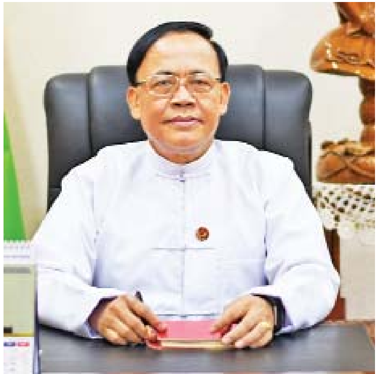
အပြည်ပြည်ဆိုင်ရာ ပူးပေါင်းဆောင်ရွက်ရေး ဝန်ကြီးဌာန ပြည်ထောင်စုဝန်ကြီး ဦးကျော်တင်