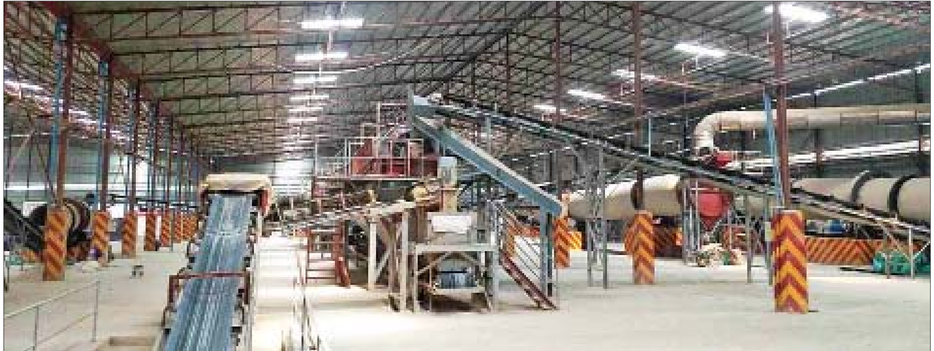
စစ်ကိုင်းမြို့ရှိ ဘီလပ်မြေစက်ရုံကို တွေ့ရစဉ်။