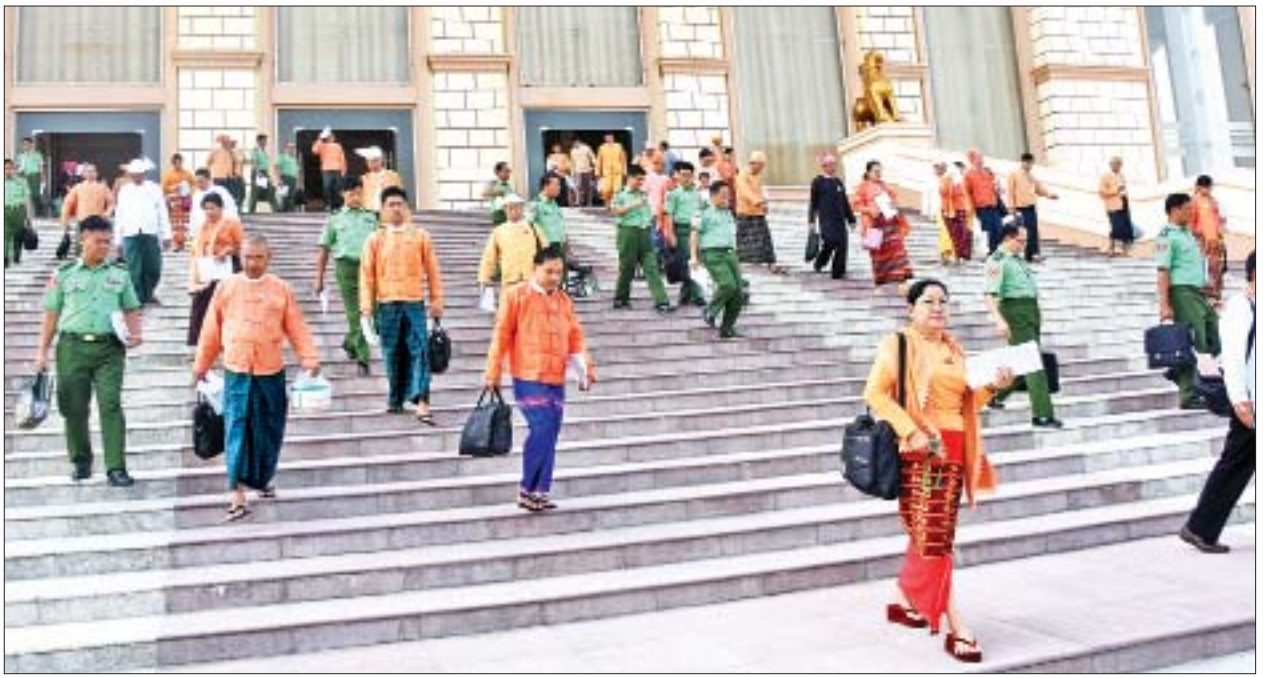
ဒုတိယအကြိမ် ပြည်ထောင်စုလွှတ်တော်(၁၂) ကြိမ်မြောက် ပုံမှန်အစည်းအဝေး ပထမနေ့တက်ရောက်ကြသည့် လွှတ်တော်ကိုယ်စားလှယ်များကို တွေ့ရစဉ်။