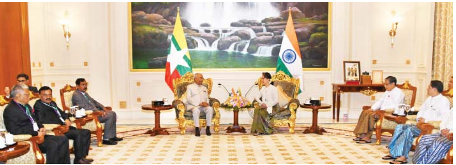
နိုင်ငံတော်၏အတိုင်ပင်ခံပုဂ္ဂိုလ် ဒေါ်အောင်ဆန်းစုကြည်နှင့် အိန္ဒိယနိုင်ငံသမ္မတ ရမ်နက်သ်ကိုပင့်ခိုက် တွေ့ဆုံစဉ်။

ဥပမာ၊ လက်တင်အမေရိကနိုင်ငံအချို့ ဘင်္ဂလားဒေ့ရှ်နဲ့ မလေးရှားနိုင်ငံတို့ အပါအဝင် အာရှနိုင်ငံအချို့ကို အထူးသံတမန် ကိုယ်စားလှယ်တွေ စေလွှတ်စဉ်းစားတာတွေ ပြုလုပ်ခဲ့ပါတယ်။ ရခိုင်ပြည်နယ် အရေးနဲ့ပတ်သက်တဲ့ စိန်ခေါ်မှုတွေကို နိုင်ငံတကာမျက်နှာစာကနေ တုံ့ပြန်ဖြေရှင်းခြင်းကို အဓိကဆောင်ရွက်နေတဲ့အပြင် မြေပြင်မှာလည်း ပတ်ဝန်းကျင်ကောင်းဖြစ်မယ့် လက်တွေ့တိုးတက်မှုတွေကို ပြသနိုင်ဖို့အတွက် သက်ဆိုင်တဲ့ဌာနတွေနဲ့ ကြိုးပမ်းညှိနှိုင်းဆောင်ရွက်နေပါတယ်။