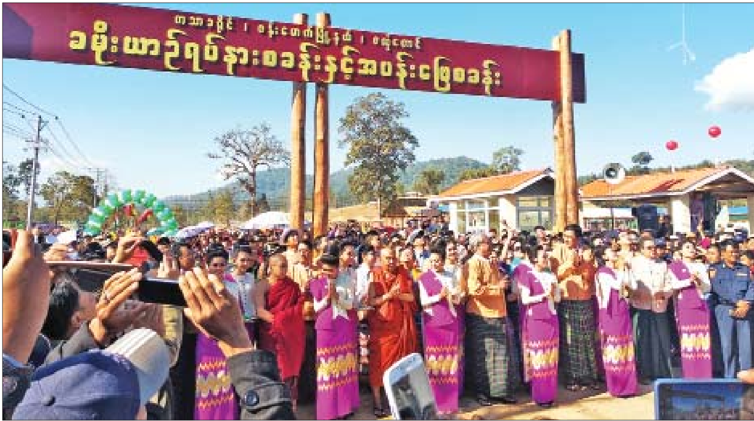
ဇေယျာဉ်ရပ်နားစခန်းနှင့် အပန်းဖြေစခန်း ဖွင့်ပွဲအခမ်းအနား ကျင်းပစဉ်။