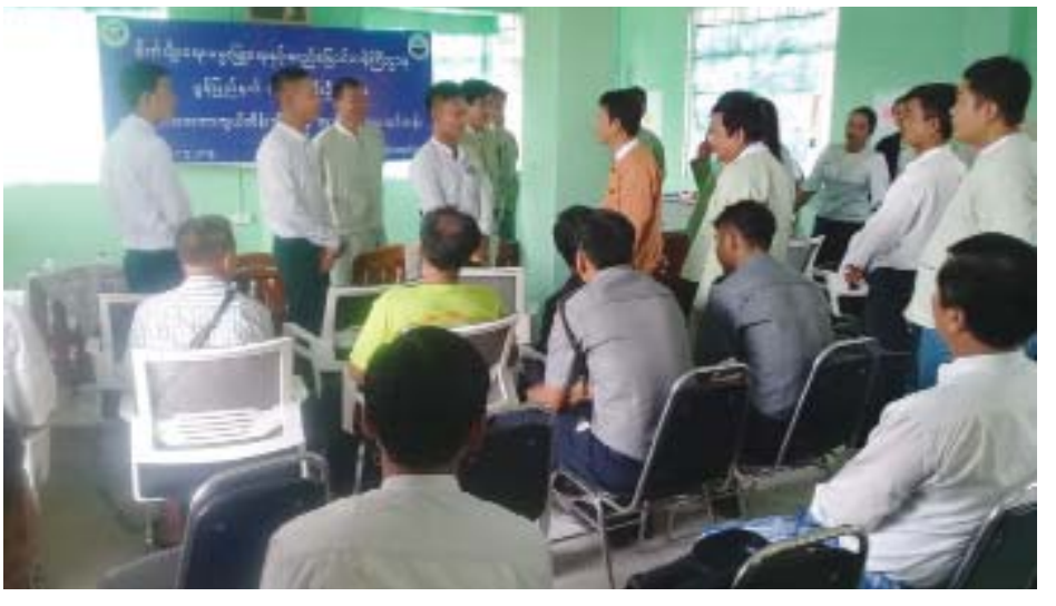
ခွန်(ဝင်းပ)

ဇာတထိန်းသိမ်းစောင့်ရှောက်ရာတွင် သက်ဆိုင်ရာ အဖွဲ့အစည်းတစ်ခု၊ တစ်ဦးတစ်ယောက်ဖြင့် ဆောင်ရွက်ရန် မဖြစ်နိုင်သကဲ့သို့ ယခုတက်ရောက်သင်ကြားသူများအားလုံးက ဆင့်ပွားအသိပညာပေး၍ စုပေါင်းဆောင်ရွက်ကြရန် လိုအပ်ကြောင်း ပြောကြားသည်။ အဆိုပါသင်တန်းကို ဧပြီ ၂၉ ရက်မှ မေ ၁ ရက်အထိ ငါးလုပ်ငန်းဦးစီးဌာနမှ သင်တန်းဆရာ ဆရာမများက ရေသယံဇာတထိန်းသိမ်းရေးအသိပညာများကို သင်တန်းသား သင်တန်းသူ ၃၂ ဦးအား နေထိုင်၊ စားသောက်၊ စားရိတ်ငြိမ်း(အခမဲ့)ဖြင့် သင်ကြားပေးမည်ဖြစ်ကြောင်း သိရသည်။