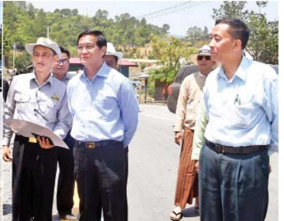
ဒုတိယသမ္မတ ဦးဟင်နရီဗန်ထီးယူ ထန်တလန်မြို့တွင်းအပိုင်း၌ ကတ္တရာကွန်ကရစ်ခင်းခြင်းနှင့် ကတ္တရာလမ်းခင်းရန် လျာထားသည့် အခြေအနေများကို ကြည့်ရှုစစ်ဆေးစဉ်။