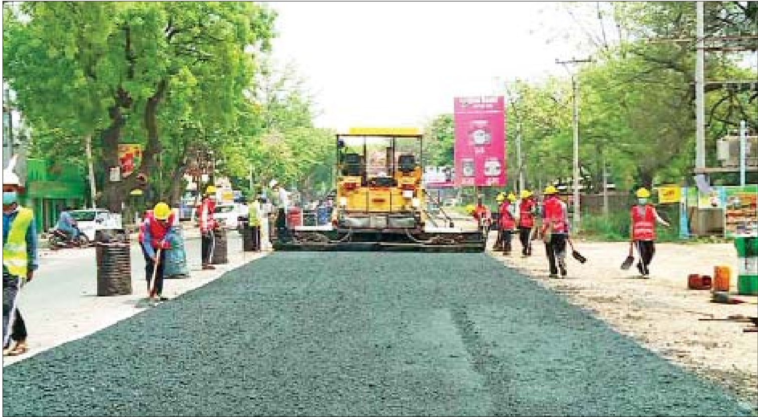
မုံရွာမြို့၊ ကျောက်လမ်း အဆင့်မြှင့်တင်နေမှုကို တွေ့ရစဉ်။

ဖြေ။ ကျွန်တော်တို့ အစိုးရအဖွဲ့အနေနဲ့ ကိုယ်စွမ်းညာဏ်စွမ်းရှိသမျှကို အင်တိုတရားကင်းကင်းနဲ့ အားထုတ်ကြိုးပမ်းဆောင်ရွက်နေပါတယ်။ ပြီးတော့ အစိုးရအဖွဲ့ တစ်ခုတည်းအားနဲ့ ဆောင်ရွက်လို့မရပါဘူး။ ဒါကြောင့် ပြည်သူတွေ၊ အသင်းအဖွဲ့တွေ၊ ဌာနဆိုင်ရာတွေအားလုံးက တက်ညီလက်ညီ ပူးပေါင်းပါဝင် ဆောင်ရွက်ပေးစေလိုပါတယ်။ အခုလို ပြည်ပြည်စုံစုံ ဖြေကြားပေးတဲ့ အတွက် ကျေးဇူးတင်ပါတယ်ရှင်။ ။