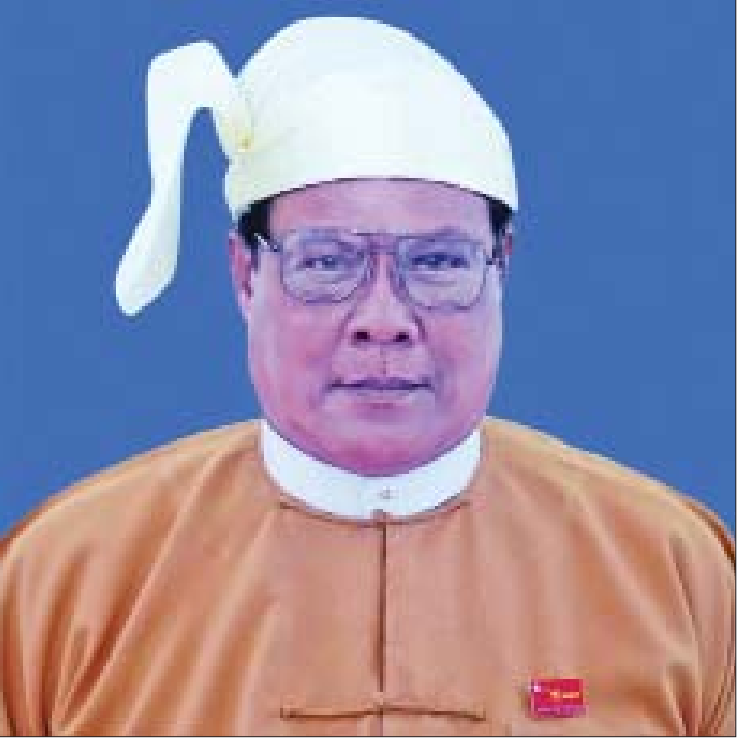
စစ်ကိုင်းတိုင်းဒေသကြီးဝန်ကြီးချုပ် ဒေါက်တာမြင့်နိုင်

မြစ်ရေတင်စီမံကိန်း လုပ်ငန်းအသစ် ခြောက်ခု၊ တွင်းနက် ၁၇ တွင်းနဲ့ တွင်းတိမ် ၄၂၁ တွင်း တူးဖော်တည်ဆောက်ခဲ့ပြီး စိုက်ပျိုးမြေဧက ၄၃၉၅ ကို အကျိုးပြုနိုင်ခဲ့ပါတယ်။ မျိုးစေ့ထုတ်လုပ်သူတွေ အသင်းဖွဲ့စည်းခြင်း၊ မျိုးစေ့ထုတ် ပုဂ္ဂလိကကုမ္ပဏီတွေနဲ့ ပူးပေါင်းဆောင်ရွက်ပြီး အရည်အသွေးနဲ့ အထွက်နှုန်းကောင်းမွန်တဲ့ စပါး၊ ပဲအမျိုးမျိုးနဲ့ ဆီထွက်