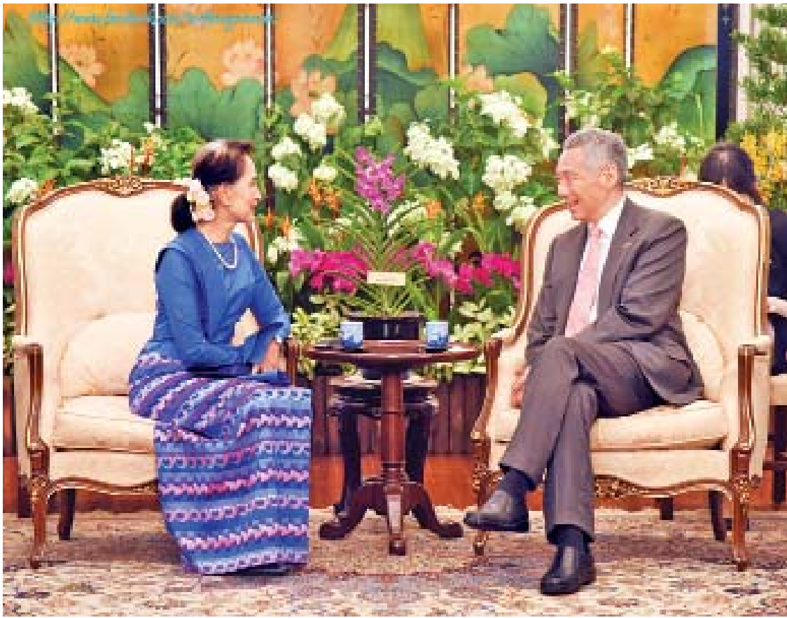
နိုင်ငံတော်၏အတိုင်ပင်ခံပုဂ္ဂိုလ် ဒေါ်အောင်ဆန်းစုကြည်နှင့် စင်ကာပူဝန်ကြီးချုပ် လီရှန်လုံးတို့ တွေ့ဆုံဆွေးနွေးစဉ်။

မေး။ ။ ပထမဦးစွာ နိုင်ငံခြားရေးဝန်ကြီးဌာနအနေနဲ့ ဘယ်လိုမူဝါဒတွေကို ချမှတ်ပြီး ဘယ်လိုမျှော်မှန်းချက်တွေနဲ့ ကြိုးပမ်းဆောင်ရွက်နေတယ်ဆိုတာ သိပါရစေရဲ့။