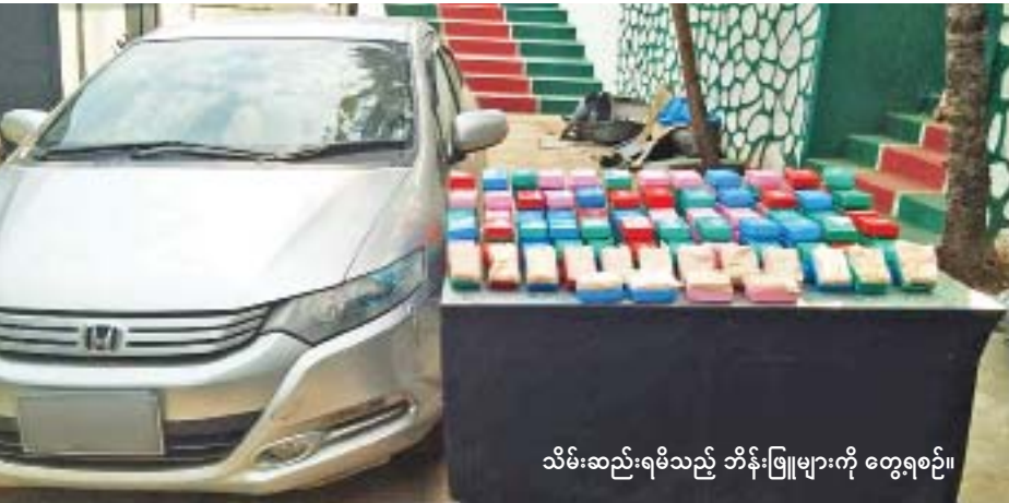
သိမ်းဆည်းရမိသည့် ဘိန်းဖြူများကို တွေ့ရစဉ်။