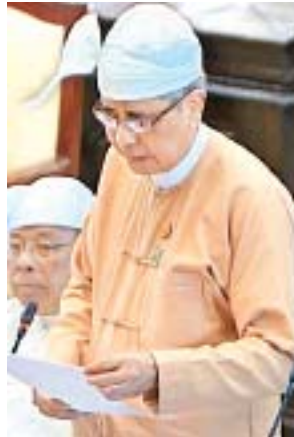
ဒုတိယဝန်ကြီး ဦးကျော်မျိုး

ပေးရန် လုပ်ထုံးလုပ်နည်း၊ ညွှန်ကြားချက်များအား ထုတ်ပြန်ထားရှိပြီးဖြစ်ပါသဖြင့် သတ်မှတ်ချက်နှင့် ကိုက်ညီသူများကို အိမ်ထောင်စုလူဦးရေစာရင်းနှင့် ၎င်းတို့ တင်ပြသည့် အထောက်အထားများအရ ကိုင်ဆောင်သည့် လက်မှတ် တစ်မျိုးမျိုး ထုတ်ပေးနိုင်ရေးဆောင်ရွက်ပေးသွားမည်ဖြစ်ကြောင်းကို အလုပ် သမား၊ လူဝင်မှုကြီးကြပ်ရေးနှင့် ပြည်သူ့အင်အားဝန်ကြီးဌာနက ဖြေကြား ထားပါကြောင်း။