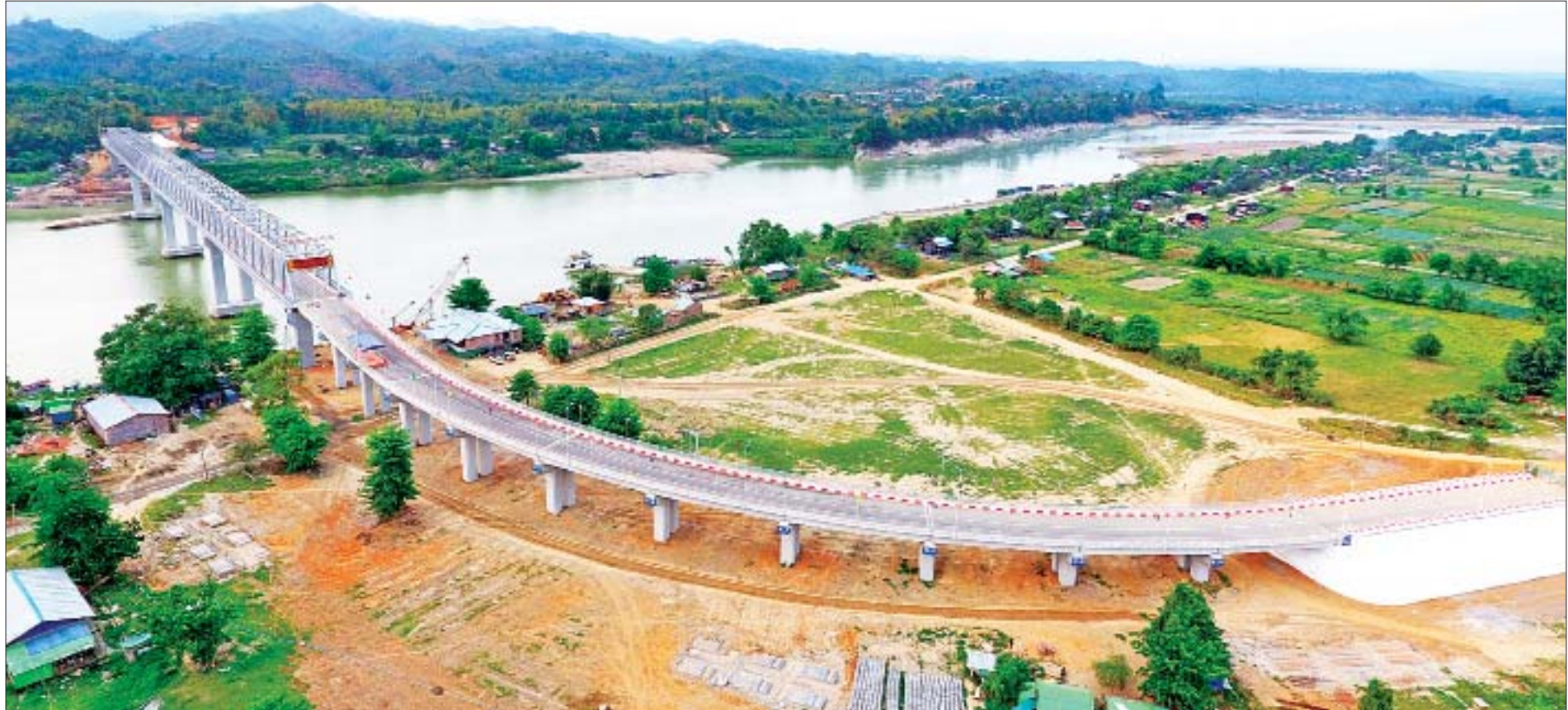
စစ်ကိုင်းတိုင်းဒေသကြီး ခန္တီး-ဆင်သေ-လဟယ်လမ်းပေါ်ရှိ ချင်းတွင်းတံတား(ခန္တီး)ကို တွေ့ရစဉ်။