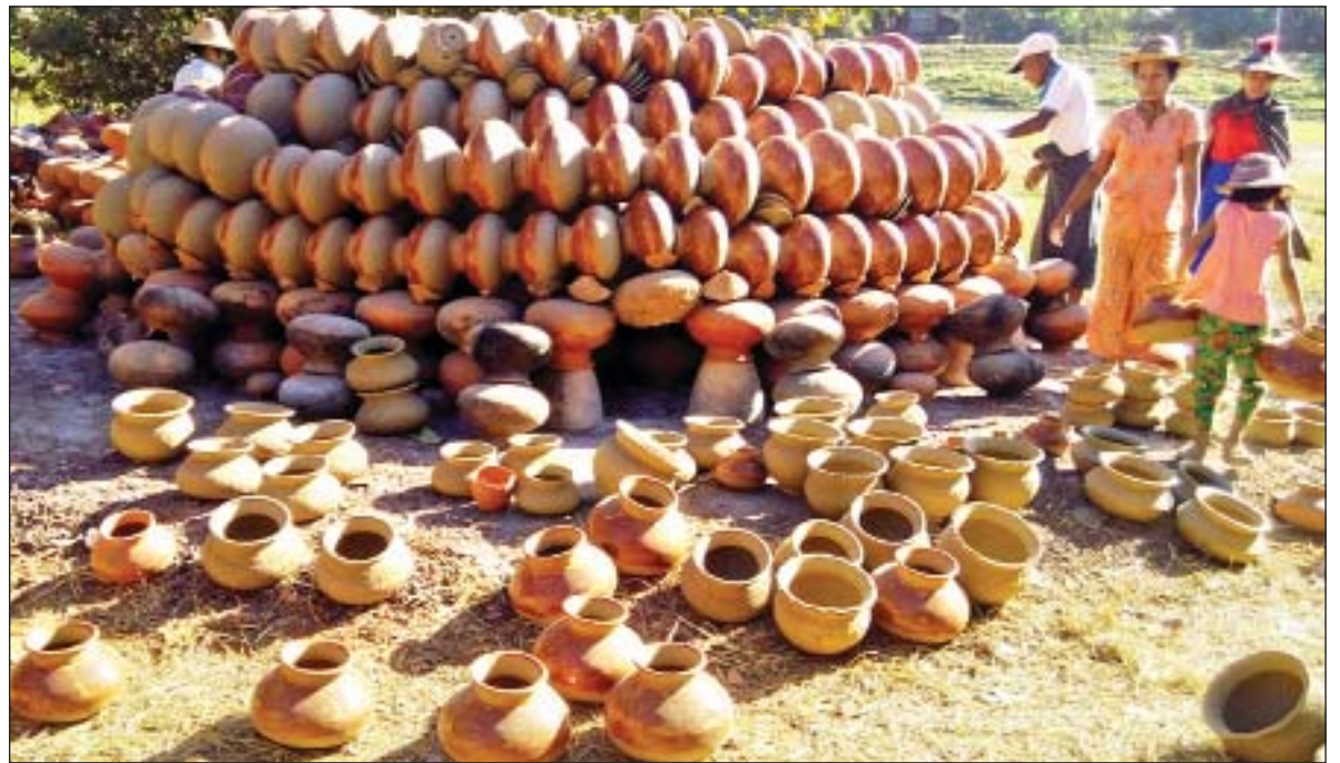
ရဲမြန်မာ(ညောင်လေးပင်)

ပုဇွန်မြောင်းကျေးရွာထွက် မြေအိုးများသည် ခိုင်ခံ့ခြင်း၊ အသုံးပြုရအဆင်ပြေခြင်းတို့ကြောင့် အလွန်လူကြိုက်များသည်။ သဲအိုး၊ ရေအိုးနီ၊ ဘုံပိုင်ခေါင်းပါရေအိုး၊ သောက်တော်ရေအိုး၊ ဘုရားပန်းအိုး၊ ပေါင်းချောင်အိုး၊ ပန်းစိုက်အိုး၊ ဈာန်အိုး၊ ခွက်ဝင်အိုး၊ မယ်ဒန်အိုး၊ မော်ဒယ်အိုး (ပန်းရိုက်အိုး)၊ နှင်းပုလဲအိုး၊ သပိတ်၊ စုဘူး၊ ရေတကောင်နှင့် ကလေးကစားစရာ အိုးပုတ်များ ထွက်ရှိကာ အနီးအနားမြို့များအပြင် ရန်ကုန်၊ မန္တလေးမြို့ကြီးများနှင့် ဒေသအသီးသီးက မှာယူသူများပြားလျက်ရှိသည်။