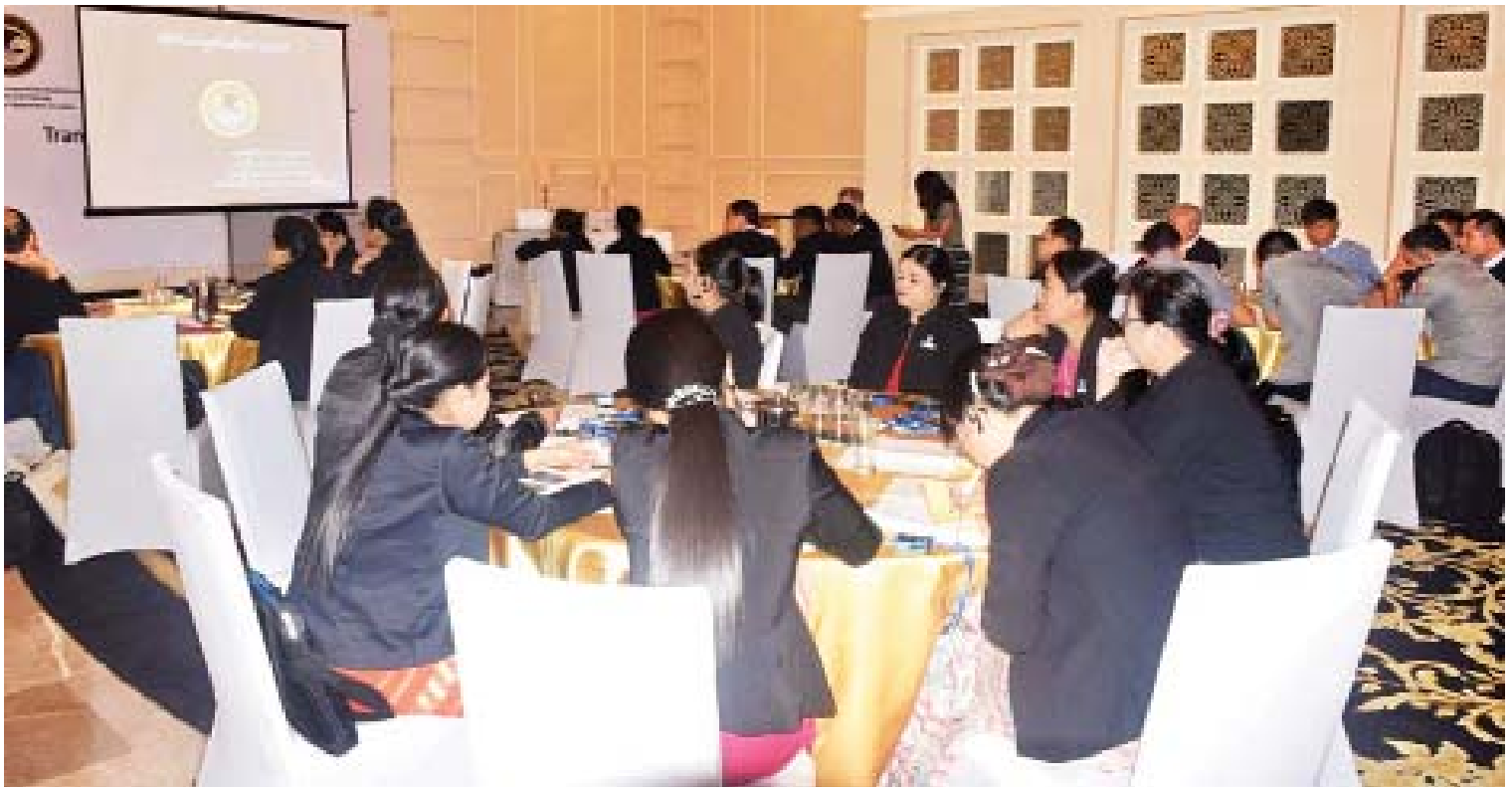
ဥပဒေအရာရှိများ ဆိုက်ဘာမူဝင်ဆိုင်ရာ အလုပ်ရုံဆွေးနွေးပွဲသို့ တက်ရောက်ကြစဉ်။