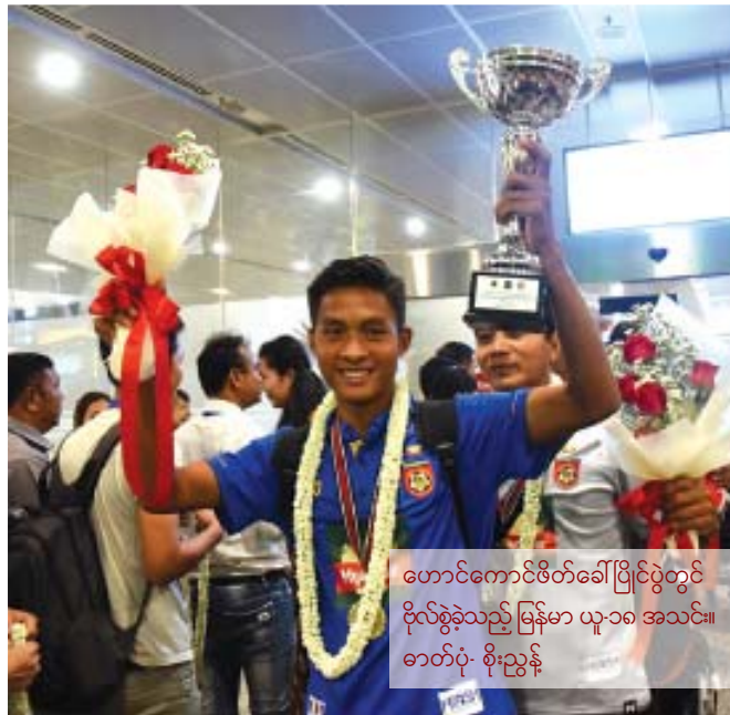
ဟောင်ကောင်ဖိတ်ခေါ်ပြိုင်ပွဲတွင် ဗိုလ်စွဲခဲ့သည့် မြန်မာ ယူ-၁၈ အသင်း၊