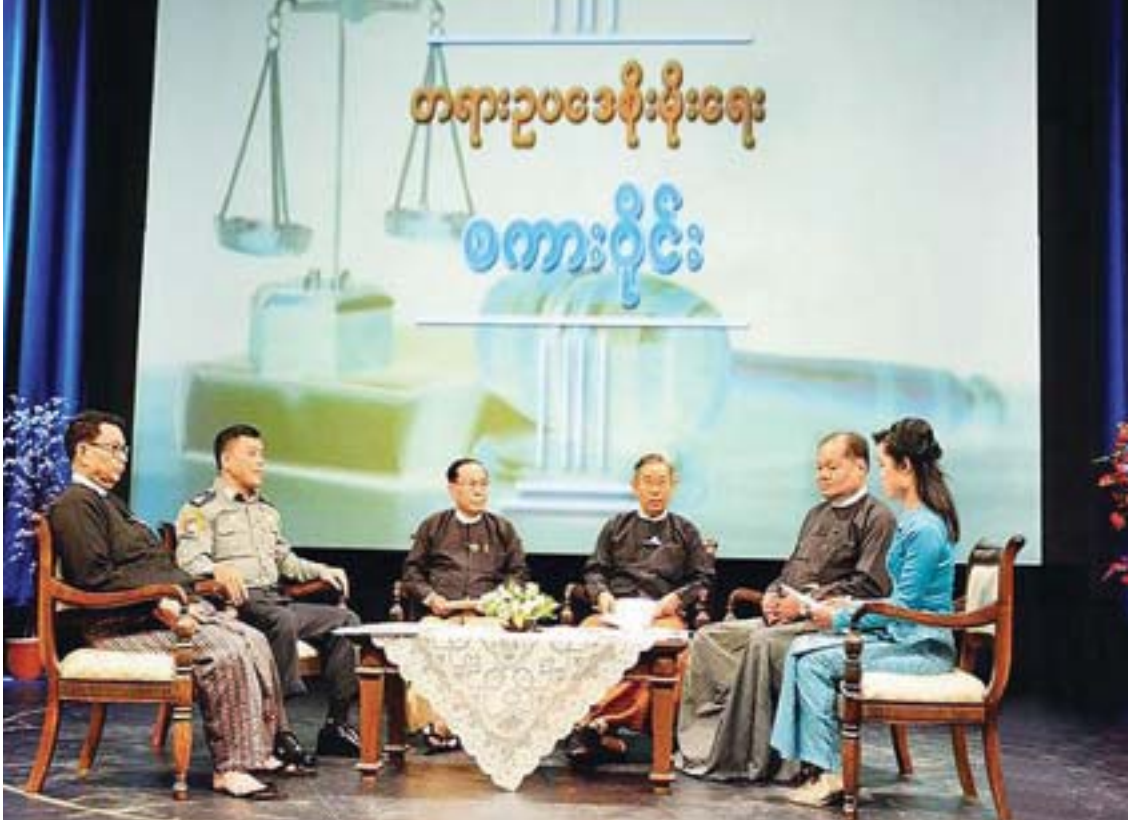
ဒုတိယရှေ့နေချုပ် ဦးဝင်းမြင့်နှင့် ဥပဒေပညာရှင်များ မြန်မာ့အသံနှင့် ရုပ်မြင်သံကြားတွင် တရားဥပဒေစိုးမိုးရေးစကားပိုင်း ဆွေးနွေးကြစဉ်။

ဖြေ။ ပုံမှန်အလုပ်တွေအပြင် ထူးခြားချက် အနေနဲ့ ဥပဒေအကြံဉာဏ်ပေးရေး ဦးစီးဌာနအနေနဲ့ ဥပဒေအရာရှိများ ကျင့်ဝတ် စာအုပ်ထုတ်ဝေရာတွင် ပါဝင်ဆောင်ရွက်ခြင်း၊ လူ့အခွင့်အရေးနဲ့ တရားဥပဒေစိုးမိုးရေး အတွက် ပြည်ထောင်စုရှေ့နေချုပ်ရုံးနဲ့ ဒိန်းမတ်သံရုံးတို့အကြား ချုပ်ဆိုခဲ့တဲ့ နားလည်မှုစာချုပ်လွှာအရ လူ့အခွင့်အရေးနဲ့ တရားဥပဒေစိုးမိုးရေးဆိုင်ရာ သင်တန်းတွေ ပူးပေါင်းဖွင့်လှစ်ခဲ့ခြင်း၊ International Covenant on Economic, Social and Cultural Rights (ICESCR) နဲ့ Universal Periodic Review (UPR) ဆိုင်ရာ အသိပညာပေးသင်တန်းတွေနဲ့