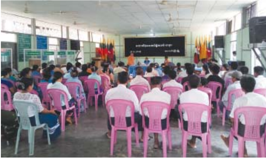
ဝင်များအား တစ်ဦးလျှင် ငွေကျပ် အတွက် ငွေကျပ် ၂၂ သိန်းကို ဝန်ကြီးကြီးနှင့် တာဝန်ရှိသူများက ပေးအပ်ချုပ်၏ဇနီး၊ စည်ပင်သာယာရေးဝန် ခဲ့သည်။ ဦးငယ် (ဆားလင်းကြီး)

ဆားလင်းကြီး ဧပြီ ၂၅ ဧပြီ ၁၅ ရက်က ချင်းတွင်းမြစ်အတွင်း စက်လှေနှစ်မြုပ်၍ သေဆုံးခဲ့ကြသော ဆားလင်းကြီးမြို့နယ်အတွင်း မှ မိသားစုဝင်များအား ထောက်ပံ့ငွေပေးအပ်ပွဲအခမ်းအနားကို ဧပြီ ၂၄ ရက် နံနက် ၈ နာရီက ဆားလင်းကြီးမြို့နယ် အထွေထွေအုပ်ချုပ်ရေးဦးစီးဌာန ငွေသားခန်းမ၌ ကျင်းပသည်။ စစ်ကိုင်းတိုင်းဒေသကြီး ဝန်ကြီးချုပ် ဒေါက်တာမြင့်နိုင်၏ဇနီး ဒေါ်တင်တင်နှင့် စည်ပင်သာယာရေးဝန်ကြီးဦးမြင့်ကြည်တို့က ထောက်ပံ့ငွေပေးအပ်ခြင်းနှင့်ပတ်သက်၍ ရှင်းလင်းပြောကြားခဲ့သည်။