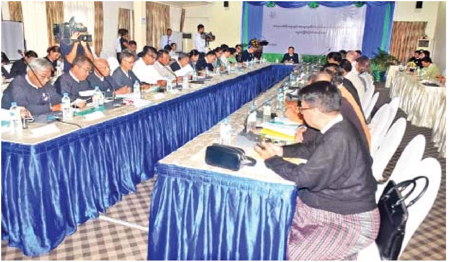
ပြည်ထောင်စုရှေ့နေချုပ် ဦးထွန်းထွန်းဦး တရားဥပဒေစိုးမိုးရေးဌာနနှင့် တရားမျှတမှုဆိုင်ရာ ပေါင်းစပ်ညှိနှိုင်းရေးအဖွဲ့၏ ဆဋ္ဌမအကြိမ်မြောက် အစည်းအဝေးတွင် လမ်းညွှန်အမှာ စကား ပြောကြားစဉ်။

အပြည်ပြည်ဆိုင်ရာဥပဒေနှင့် အာဆီယံ ဥပဒေရေးရာဌာနခွဲက ပြည်ထောင်စုရှေ့နေ ချုပ်ဥပဒေပုဒ်မ ၁၂ ပုဒ်မခွဲ ၂(င)၊ (၅) တို့အရ အပြည်ပြည်ဆိုင်ရာကွန်ဗင်းရှင်းတွေနဲ့ ဒေသ ဆိုင်ရာစာချုပ်စာတမ်းတွေ၊ လူ့အခွင့်အရေး ဆိုင်ရာစာချုပ်စာတမ်းတွေ၊ နယ်နိမိတ် သတ်မှတ်ရေး၊ နယ်ခြားဒေသ စီမံခန့်ခွဲရေး ဆိုင်ရာစာချုပ်တွေ၊ နှစ်နိုင်ငံ လေကြောင်း ပျံသန်းရေး စာချုပ်တွေ၊ စီးပွားရေးနဲ့ သက်ဆိုင်ခြင်းမရှိတဲ့ စာချုပ်တွေ၊ နားလည်မှုမှတ်တမ်းတွေ၊ အထောက်အပံ့ စီမံကိန်းမှတ်တမ်းတွေ၊ ကလေးသူငယ်တွေ နဲ့ အမျိုးသမီးတွေရဲ့ အခွင့်အရေးဆိုင်ရာ စာချုပ်တွေ၊ မူးယစ်ဆေးဝါးတားဆီးနှိမ်နင်း ရေးဆိုင်ရာစာချုပ်တွေ၊ နှစ်နိုင်ငံအကြား ချုပ်ဆိုမယ့် ကုန်သွယ်ရေး၊ ရင်းနှီးမြုပ်နှံရေး၊