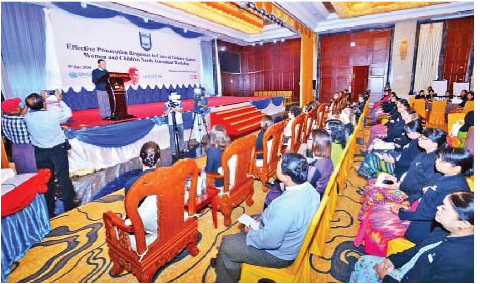
ပြည်ထောင်စုရှေ့နေချုပ် ဦးထွန်းထွန်းဦး အမျိုးသမီးများနှင့် ကလေးသူငယ်များအပေါ် အကြမ်းဖက်မှုများနှင့်စပ်လျဉ်း၍ ထိရောက်စွာ တရားစွဲဆိုနိုင်ရေး အလုပ်ရုံဆွေးနွေးပွဲတွင် အမှာစကား ပြောကြားစဉ်။

ဖြေ။ ပြည်ထောင်စုရှေ့နေချုပ်ရုံးရဲ့အဓိက လုပ်ငန်းရည်မှန်းချက်က အများ ပြည်သူတွေအနေနဲ့ ဥပဒေရဲ့ ကာကွယ်စောင့်