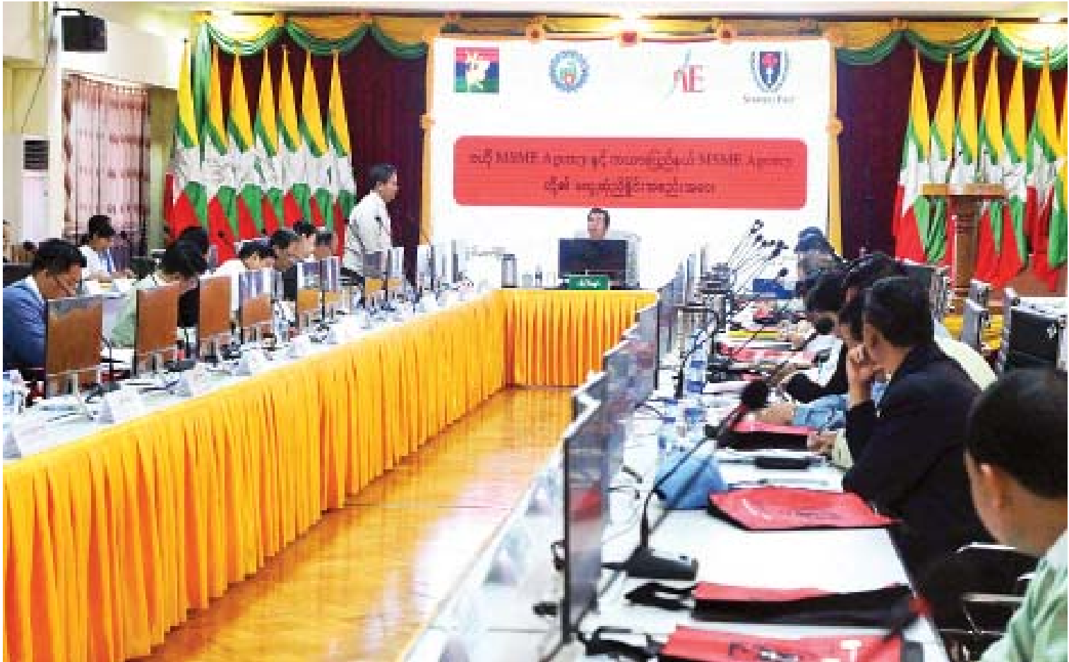
လွိုင်ကော်မြို့၌ ဝဟို MSME Agency နှင့် ကယားပြည်နယ် MSME Agency တို့ တွေ့ဆုံညှိနှိုင်းအစည်းအဝေး ကျင်းပစဉ်။