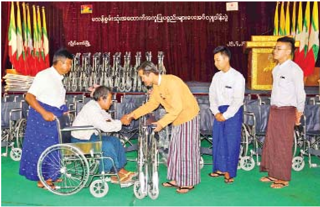
ကယားပြည်နယ်ဝန်ကြီးချုပ် ဦးအယ်လ်ဖောင်းရှိ မသန်စွမ်းသူများအတွက် မသန်စွမ်းသုံးအထောက်အကူပြုပစ္စည်းများ ထောက်ပံ့ပေးအပ်စဉ်။

သုံးနှစ်တာကာလအတွင်း ကယားပြည်နယ်လွှတ်တော်တွင် ပြည်နယ်လွှတ်တော်ကိုယ်စားလှယ် ၁၄ ဦး၊ တိုင်းရင်းသား