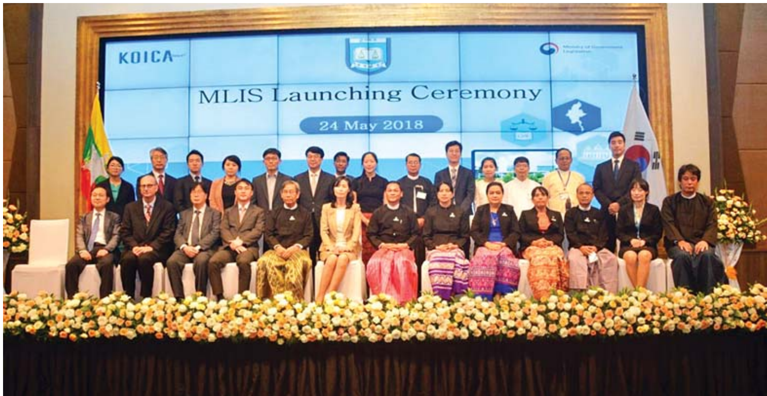
ပြည်ထောင်စုရှေ့နေချုပ် ဦးထွန်းထွန်းဦး မြန်မာဥပဒေ သတင်းအချက်အလက်စနစ် Launching Ceremony အခမ်းအနားသို့ တက်ရောက်လာကြသူများနှင့်အတူ စုပေါင်းမှတ်တမ်းဓာတ်ပုံရိုက်စဉ်။

ပြည်ထောင်စုရှေ့နေချုပ်ရုံးရဲ့ မဟာဗျူဟာစီမံကိန်းကို အကောင်အထည်ဖော်ဆောင်ရွက်ရာမှာ ဒုတိယပန်းတိုင်ဖြစ်တဲ့ အမှုကိစ္စစီမံခန့်ခွဲခြင်းကို USAID ရဲ့ ပံ့ပိုးမှုနဲ့ ရှေ့ပြေးဥပဒေရုံးတွေ သတ်မှတ်ဆောင်ရွက်လျက်ရှိပါတယ်။ ရှေ့ပြေးဥပဒေရုံးတွေ ဆောင်ရွက်ရခြင်းက တရားဥပဒေစိုးမိုးရေးအတွက် အဓိက လုပ်ဆောင်နေခြင်းဖြစ်ပြီး ရုံးတွေမှာ စာရင်းဇယားတွေကို ကွန်ပျူတာနဲ့ ဆောင်ရွက်ခြင်း၊ သက်သေကို တရားရုံးတွင် မစစ်ဆေးမီ ကြိုတင်ပြင်ဆင်ခြင်းနဲ့ တရားစွဲအဖွဲ့အစည်းက အမှုစုံစမ်းစစ်ဆေးဆဲကာလတွင် လိုအပ်ပါက ဥပဒေအရာရှိတွေ ပါဝင်ပူးပေါင်းဆောင်ရွက်နိုင်ခြင်းတို့ကို ပြုလုပ်လျက်ရှိပါတယ်။ ယခုအချိန်တွင် ရှေ့ပြေးဥပဒေရုံး ရှစ်ရုံး ထူထောင်ပြီး ဥပဒေအရာရှိ