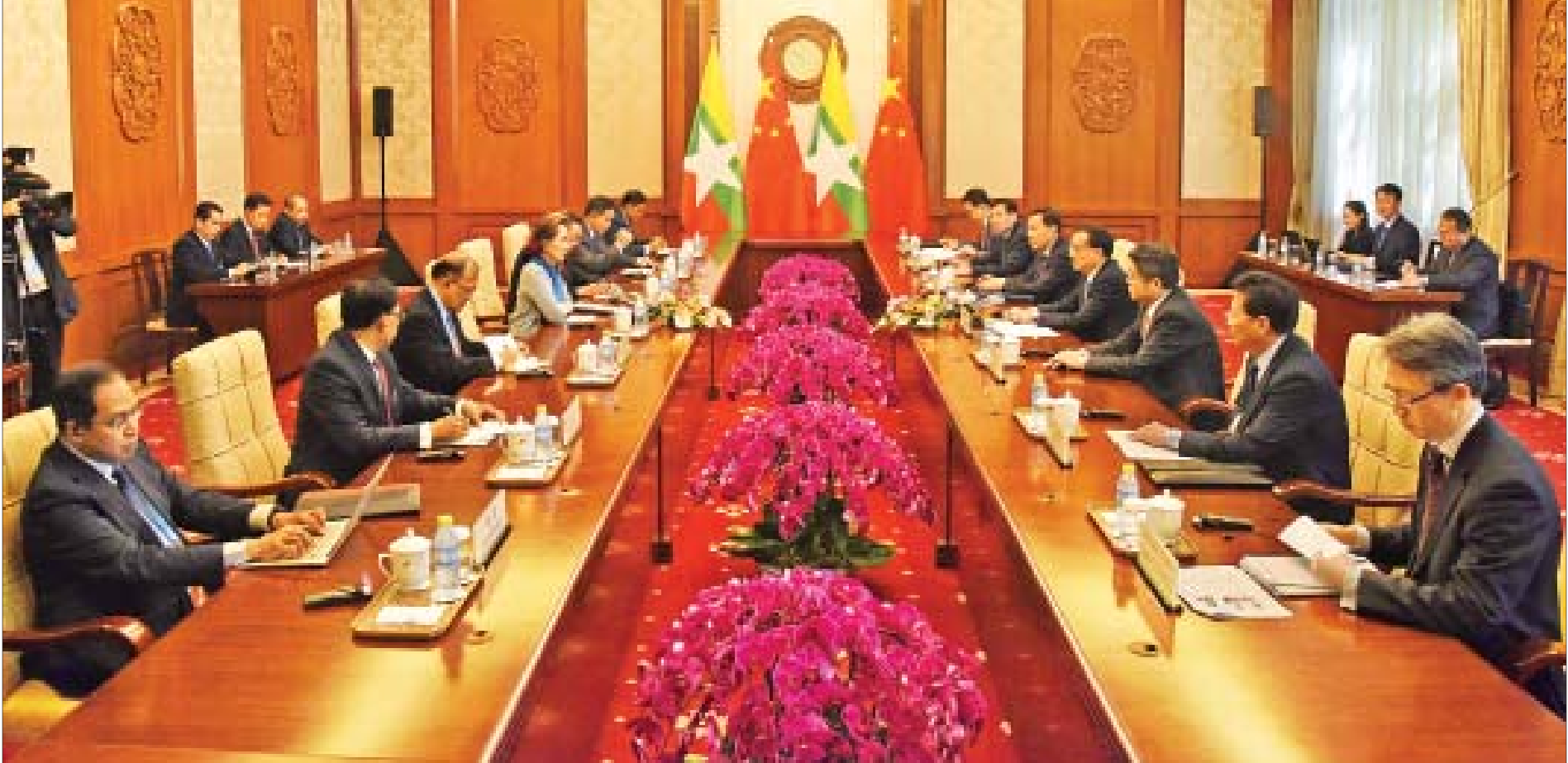
နိုင်ငံတော်၏အတိုင်ပင်ခံပုဂ္ဂိုလ် ဒေါ်အောင်ဆန်းစုကြည် ဦးဆောင်သောကိုယ်စားလှယ်အဖွဲ့နှင့် တရုတ်ပြည်သူ့သမ္မတနိုင်ငံ ဝန်ကြီးချုပ် မစ္စတာ လီခချန်း ဦးဆောင်သောကိုယ်စားလှယ်အဖွဲ့တို့ တွေ့ဆုံဆွေးနွေးစဉ်။

ပေကျင်း ဧပြီ ၂၅ ဒုတိယအကြိမ်မြောက် ရပ်ဝန်းနှင့် ပိုးလမ်းမအပြည်ပြည်ဆိုင်ရာ ပူးပေါင်းဆောင်ရွက်ရေးစီရမ်သို့ တက်ရောက်ရန် တရုတ်ပြည်သူ့သမ္မတနိုင်ငံ ပေကျင်းမြို့၌ ရောက်ရှိနေသည့် နိုင်ငံတော်၏အတိုင်ပင်ခံပုဂ္ဂိုလ် ဒေါ်အောင်ဆန်းစုကြည်သည် ယနေ့ ဒေသစံတော်ချိန် နံနက် ၉ နာရီ ၁၅ မိနစ်တွင် တရုတ်အမျိုးသားကွန်ပင်ရှင်းစင်တာ၌ ကျင်းပသည့် People to People Connectivity Thematic Forum ဖွင့်ပွဲအခမ်းအနားသို့ တက်ရောက်မိန့်ခွန်းပြောကြားသည်။