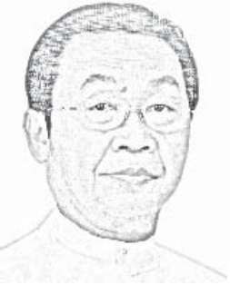
မောင်စာက

“ဥပဒေကို ပြည်သူများကနားလည်ကျင့်သုံးလာစေရန် ပညာပေးရေးနှင့် ပြည်သူများက ဥပဒေကို လိုက်နာသော အလေ့အကျင့် ပျိုးထောင်ပေးရေး” ဟူသည့် တရားရုံးများက တရားစီရင်ရာတွင် လိုက်နာရမည့် ပစ္စည်းအခြေခံဖြစ်သည်။ အခြေခံမူတွင် အပိုင်း နှစ်ပိုင်းတွေ့ရသည်။ ပထမအပိုင်းသည် ဥပဒေကို ပြည်သူများက နားလည်ကျင့်သုံးလာစေရန် ပညာပေးရေးဖြစ်သည်။ ဒုတိယအပိုင်းသည် ပြည်သူများက ဥပဒေကို လိုက်နာသောအလေ့အကျင့် ပျိုးထောင်ပေးရေးဖြစ်သည်။ အပိုင်းနှစ်ပိုင်းစလုံးသည် တစ်ခုနှင့်တစ်ခု ဆက်စပ် ခွန်တွဲနေသော်လည်း အသွင်သဏ္ဍာန် အနှစ်သာရခြင်း မတူညီပါ။ အနှစ်ချုပ်မျှဝေပါရစေ။