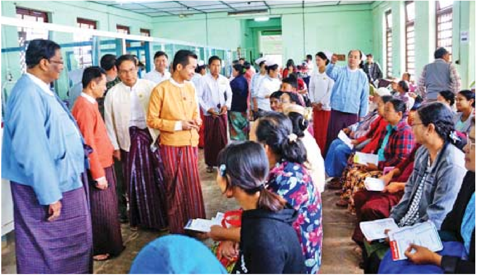
ကယားပြည်နယ်ဝန်ကြီးချုပ် ဦးအယ်လ်ဖောင်းရှိနှင့် တာဝန်ရှိသူများ ဆေးဝါးကုသမှုခံယူမည့်သူများအား ကြည့်ရှုအားပေးကြစဉ်။

ကယားပြည်နယ်တွင် ၂၀၁၆ ခုနှစ်မှစ၍ သုံးနှစ်တာကာလအတွင်း ကတ္တရာလမ်း၊