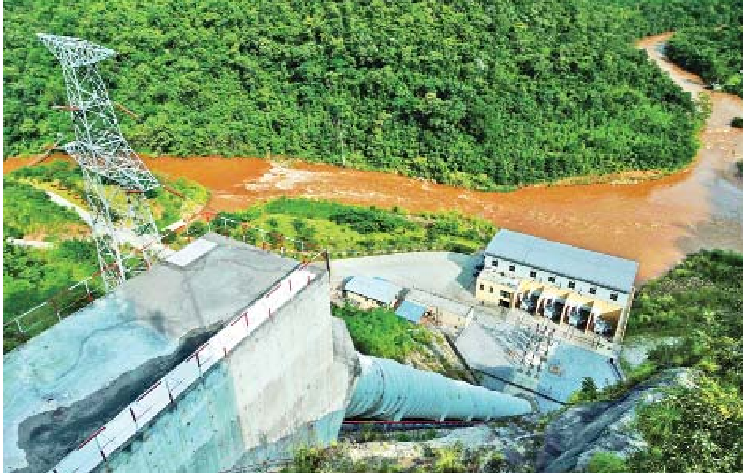
ကယားပြည်နယ်ရှိ ဘီလူးချောင်း အမှတ်(၃) ရေအားလျှပ်စစ်ဓာတ်အားပေးစက်ရုံကို တွေ့ရစဉ်။

ဖွံ့ဖြိုးတိုးတက်မှု အသီးအပွင့်များကို ပြည်နယ်သူ ပြည်နယ်သားများ ပိုမိုရရှိစေရေး နိုင်ရန် သုံးနှစ်တာကာလကို ကြိုးပမ်းကျော်လွန်ခဲ့ပြီး ဆက်လက်၍ ပြည်သူ့အတွက် ပြည်သူ့အစိုးရကောင်းဖြစ်ရန် ကြိုးပမ်းသွားမည်ဖြစ်ကြောင်း တင်ပြရေးသားအပ်ပါသည်။ ။