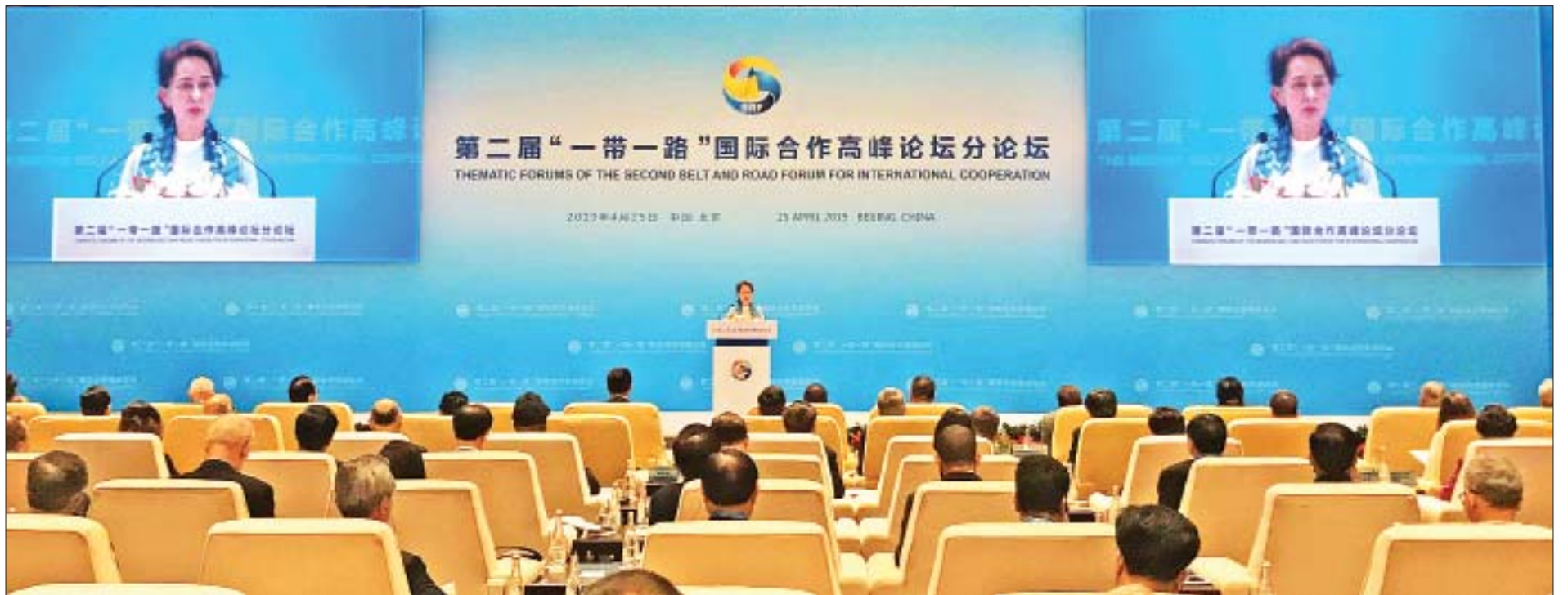
နိုင်ငံတော်၏အတိုင်ပင်ခံပုဂ္ဂိုလ် ဒေါ်အောင်ဆန်းစုကြည် တရုတ်အမျိုးသားကွန်ဂရက်ရင်းစင်တာ၌ ကျင်းပသည့် People to People Connectivity Thematic Forum ဖွင့်ပွဲအခမ်းအနားတွင် မိန့်ခွန်းပြောကြားစဉ်။

★ ရှေ့မှ မိမိတို့နိုင်ငံသည် ဖွံ့ဖြိုးဆဲနိုင်ငံဖြစ်ပြီး ဖွံ့ဖြိုးတိုးတက်ရေးလုပ်ငန်းများတွင် ကူညီပေးကြသည်။ မိမိတို့နှင့်အတူ ရပ်တည်ခဲ့ကြသည့် မိတ်ဆွေများကို အခွင့်အလမ်းပေးရန် ကျေးဇူးတင်စကားပြောကြားလိုပါကြောင်း၊ မိမိတို့အနေဖြင့် ကြုံတွေ့ရမည့် စိန်ခေါ်မှုများရှိလင့်ကစား ယုံကြည်နားလည်ပေးသူများနှင့် အပြန်အလှန်လေးစားမှုကို ယုံကြည်ကြသူများ၏ အကူအညီဖြင့် သာယာဝပြောရေးအတွက် ရှေ့ဆက်သွားနိုင်မည်ဟု ယုံကြည်ပါကြောင်း၊ စိန်ခေါ်မှုများကို ကျော်လွှားရာတွင် မိမိတို့ပြည်သူများ၏ သန္နိဋ္ဌာန်ခိုင်မာမှုနှင့် အလုပ်ကြိုးစားမှုများအပေါ်တွင်လည်း မူတည်နေပါကြောင်း၊ စိန်ခေါ်မှုများမည်သို့ပင်ရှိစေကာမူ ငြိမ်းချမ်းမှုနှင့် ဖွံ့ဖြိုးမှုလမ်းကြောင်းအား မိမိတို့အနေဖြင့် ဆက်လက်လျှောက်လှမ်းသွားမည်ဖြစ်ကြောင်း ပြောကြားခဲ့သည်။