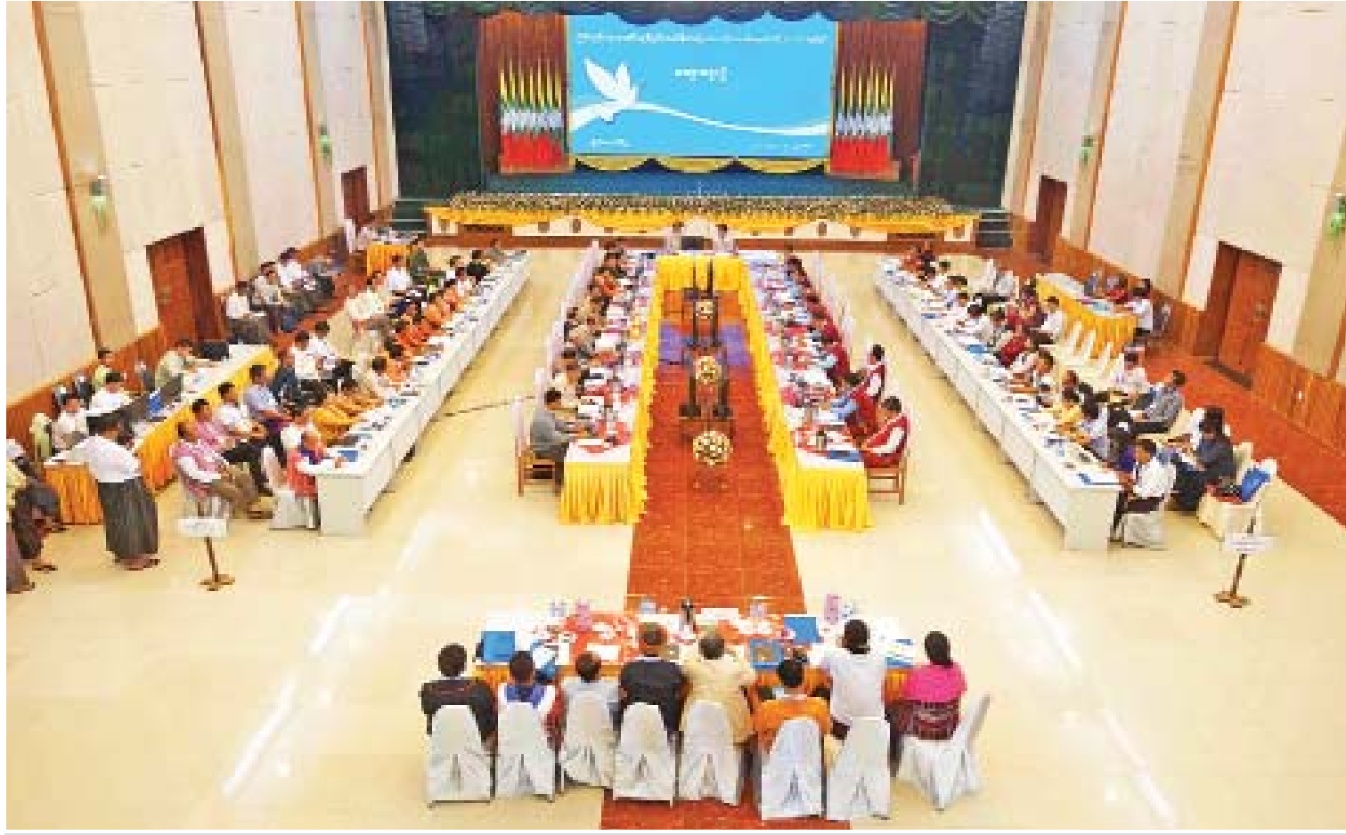
လျှင်ကော်မြို့၌ ငြိမ်းချမ်းရေးကော်မရှင်နှင့် ကရင်နီအမျိုးသားတိုးတက်ရေးပါတီ (KNPP) တို့ ၂၆-၄-၂၀၁၈ ရက်တွင် တွေ့ဆုံဆွေးနွေးစဉ်။

လူငယ်များအကြား အားကစား လိုက်စားမှု စိတ်ပါဝင်စားမှုများ မြှင့်တက်လာ ၍ ပြည်သူများလည်း လူထုအားကစား လှုပ်ရှားမှုများကို ကိုယ်တိုင်ကိုယ်ကျ တက်ကြွစွာ အားပေးလျက်ရှိသည်။