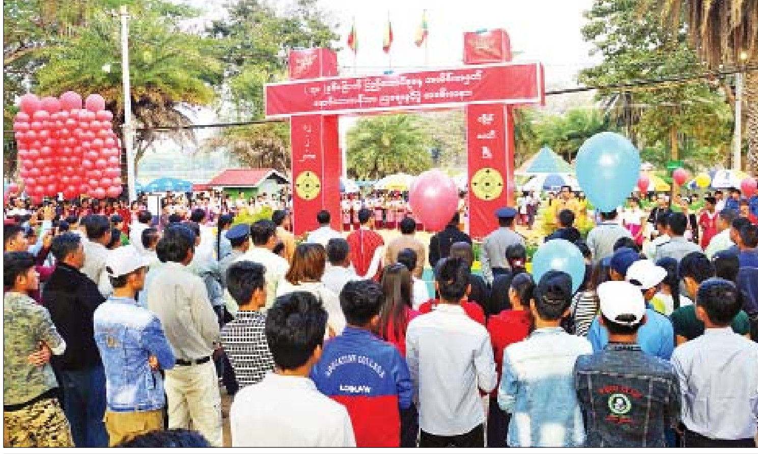
လှိုင်ကော်မြို့၌ (၇၁)နှစ်မြောက် ပြည်ထောင်စုနေ့အထိမ်းအမှတ် နောင်ယားကန်သာ ညဈေးဖွင့်ပွဲအခမ်းအနား ကျင်းပစဉ်။

ခြင်းလုပ်ငန်းများ ဆောင်ရွက်ပေးလျက် ရှိသည်။ ကုသရေးဘက်တွင် အထူးကုဆရာဝန် အပါအဝင် ဆရာဝန်ပေါင်း ၇၉ ဦး၊ သူနာပြု ပေါင်း ၃၇၅ ဦး၊ အခြားဝန်ထမ်းပေါင်း ၃၉၆ ဦး စုစုပေါင်းဝန်ထမ်း ၈၅၀ ရှိသည်။ သုံးနှစ် တာကာလအတွင်း ဝန်ထမ်း ၉၃ ဦး အသစ် ထပ်မံခန့်ထားနိုင်ခဲ့၍ စုစုပေါင်း ၉၄၃ ဦး တို့ဖြင့် ကုသရေးလုပ်ငန်းများ ဆောင်ရွက် လျက်ရှိသည်။ သုံးနှစ်တာကာလအတွင်း အတွင်း လူနာ ၇၀၃၈၇ ဦး၊ ပြင်ပလူနာ ၄၅၇၃၆၁ ဦး အသေးစားခွဲစိတ်ကုသမှု ၆၅၄၀၀ အကြီးစား ခွဲစိတ်ကုသမှု ၇၆၄၈ ခု စုစုပေါင်း ၁၄၁၈၈ ခု တို့ကို ဆောင်ရွက်ပေးခဲ့သည်။ လှိုင်ကော် ဆေးရုံကြီးတွင် ကျောက်ကပ်တုသွေးသန့်စင် စက်သုံးလုံး ထပ်မံတပ်ဆင်ခဲ့ပြီး ကျောက်ကပ် လူနာများအား ၃၉၀၉ ကြိမ် သန့်စင် ဆောင်ရွက်ပေးခဲ့သည်။ သုံးနှစ်တာအတွင်း ငွေကျပ် ၈၄၂ ဒသမ ၁၀၇ သန်း သုံးစွဲကုသပေး ခဲ့ပြီး ဆေးရုံနှင့် ဆက်စပ်အဆောက်အအုံများ အတွက် ငွေကျပ် ၄၀၆၈ သန်း ကုန်ကျခံ ဆောက်လုပ်ခဲ့သည်။