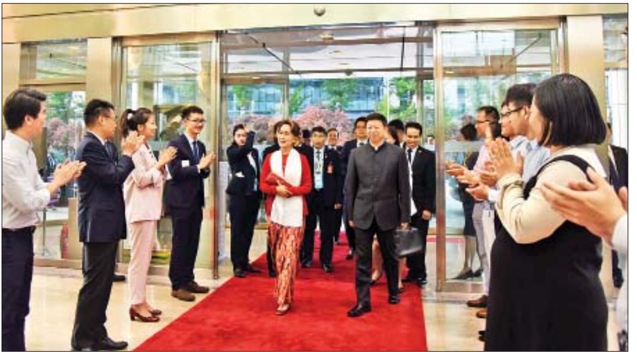
နိုင်ငံတော်၏အတိုင်ပင်ခံပုဂ္ဂိုလ် ဒေါ်အောင်ဆန်းစုကြည် တရုတ်ကွန်မြူနစ်ပါတီ နိုင်ငံတကာဆက်ဆံရေးဝန်ကြီး H.E. Mr. Song Tao က တည်ခင်း ဧည့်ခံသည့် ညစာစားပွဲသို့ တက်ရောက်လာစဉ်။

ယင်းနောက် နိုင်ငံတော်၏အတိုင်ပင်ခံပုဂ္ဂိုလ် ဦးဆောင်သည့်အဖွဲ့ဝင်များ