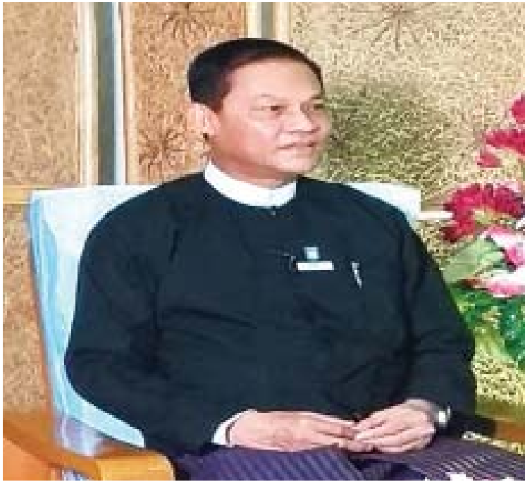
ပြည်ထောင်စုရှေ့နေချုပ် ဦးထွန်းထွန်းဦး

တွေ့ဆုံမေးမြန်း - သီသီမင်း၊ ဓာတ်ပုံ - မိုင်ခ