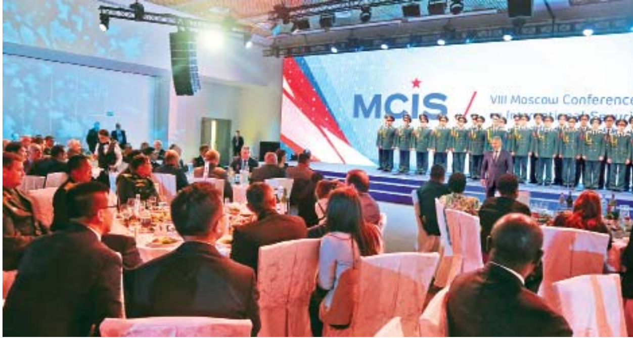
တပ်မတော်ကာကွယ်ရေးဦးစီးချုပ် ဗိုလ်ချုပ်မှူးကြီး မင်းအောင်လှိုင် ရုရှားဖက်ဒရေးရှင်းနိုင်ငံ ကာကွယ်ရေးဝန်ကြီး Army General Sergey Kuzhugetovich Shouigu က တည်ခင်းညွှန်ကြားမှု ဂုဏ်ပြုညစာစားပွဲသို့ တက်ရောက်စဉ်။

နေပြည်တော် ဧပြီ ၂၅ ရုရှားဖက်ဒရေးရှင်းနိုင်ငံ၌ ချစ်ကြည်ရေးခရီးရောက်ရှိနေသည့် တပ်မတော် ကာကွယ်ရေးဦးစီးချုပ် ဗိုလ်ချုပ်မှူးကြီး မင်းအောင်လှိုင်နှင့်အဖွဲ့သည် ဧပြီ ၂၄ ရက် မွန်းလွဲပိုင်းတွင် မော်စကိုမြို့၊ ဘာလာရီးခါ ရပ်ကွက်ရှိ မြန်မာ့ထေရဝါဒ ဗုဒ္ဓဝိဟာရကျောင်းတိုက် ကျောင်းထိုင်ဆရာတော် ဒေါက်တာအရှင်အစ္စရိယ အား ဖူးမြော်ကြည့်လိုက်သည်။