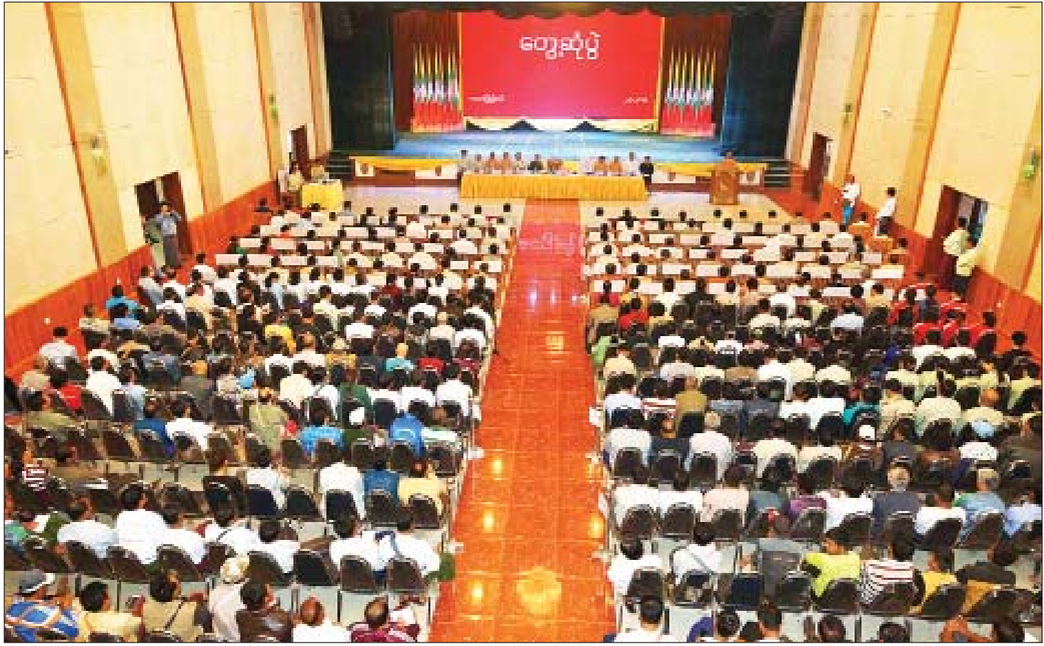
ကယားပြည်နယ်ဝန်ကြီးချုပ် ဦးအယ်လ်ဇောင်းရှိ ၂-၃-၂၀၁၉ ရက်က ကယားပြည်နယ်အစိုးရအဖွဲ့နှင့် ပြည်သူ့လူထုတွေ့ဆုံပွဲတွင် အမှာစကားပြောကြားစဉ်။

ရင်းနှီးမြှုပ်နှံမှု “ကျွန်တော်တို့ ထိုင်းနိုင်ငံ မယ်ဟောင် ဆောင်ခရိုင် မယ်ဟောင်ဆောင်မြို့နယ် ကယား ပြည်နယ် လှိုင်ကော်မြို့တို့ကို Sister City မြို့တော်အဖြစ် လက်မှတ်ရေးထိုးနိုင်ခဲ့ ပါတယ်။ ဒီလိုလက်မှတ်ရေးထိုးနိုင်ခဲ့တဲ့ အချိန်ကစပြီး ပိတ်နေတဲ့ ကျွန်တော်တို့ ပြည်နယ်ဟာ လမ်းကြောင်းပွင့်သွားတယ်။ ပြည်နယ်ခန်းမမှာ ဖိုရမ်တစ်ခု ကျင်းပနိုင်ခဲ့ ပြီးတဲ့နောက်မှာ ၃၀ ရာခိုင်နှုန်းရှိတဲ့ ရင်းနှီး မြှုပ်နှံလိုသူတွေ ဝင်ရောက်လုပ်ကိုင်လာ တာကို တွေ့ရပါတယ်။ ဒါဟာ ထင်သာမြင်သာ ပြင်ပြောင်းလဲမှု တစ်ရပ်ပါပဲ”ဟု ပြည်နယ် ဝန်ကြီးချုပ်က ပြောကြားသည်။ ကယားပြည်နယ်အတွင်း ရင်းနှီးမြှုပ်နှံ မှုလုပ်ငန်းရှင်များ ပိုမိုစိတ်ဝင်စားကာ ရင်းနှီး မြှုပ်နှံမှုလုပ်ငန်းများ စီးဝင်လာရန် ရည်ရွယ်လျက် ပြည်နယ်အစိုးရအဖွဲ့နှင့်