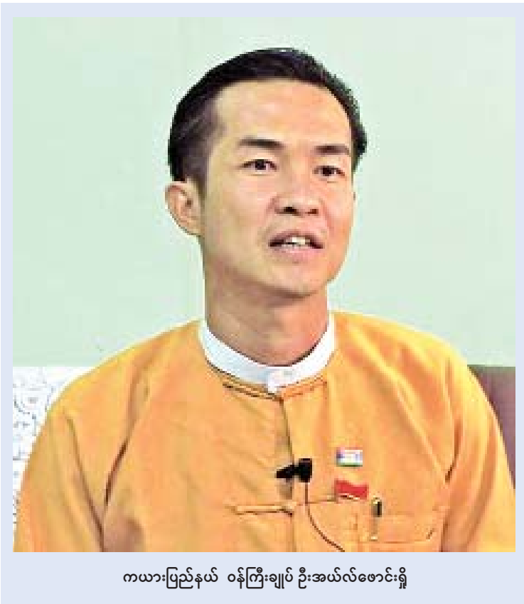
ကယားပြည်နယ် ဝန်ကြီးချုပ် ဦးအယ်လ်ဖောင်းရှိ

ကန္တရဝတီခေါ် ငွေတောင်ပြည် ခေါ် ကယား သွေးချင်းတို့ မြေတွင် ကယား၊ ကယန်း (ပဒေါင်)၊ ယင်းဘော်၊ ဂေခို၊ လထာ (ဇယ်မ်း)၊ ကယော၊ ဂေဘား၊ ယင်းတလဲ၊ ကော်ယော် မိုနု (မနမနော) စသည့် ကယားမျိုးနွယ်စု ကိုးမျိုးတို့နှင့်အတူ ဗမာ၊ ကရင်၊ ရှမ်း၊ ပအိုဝ်း၊ အင်းသားစသည့် တိုင်းရင်းသားလူမျိုးများ သည် ချစ်ကြည်ရင်းနှီးစွာ စုပေါင်းနေထိုင် လျက်ရှိသည်။