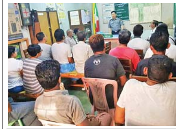
ပန်းဘဲတန်းမြို့နယ် အမှတ်(၅)ရပ်ကွက် ၂၈ လမ်းရှိ အုပ်ချုပ်ရေးမှူးရုံးတွင် ဧပြီ ၂၄ ရက်က မြို့နယ်ရဲတပ်ဖွဲ့မှူး ရဲမှူးကျော်ကျော်ညွန့် မှုခင်းကျဆင်းရေး အသိပညာပေး ဟောပြောစဉ်။

မြို့နယ် စစ်မှုထမ်းဟောင်းအဖွဲ့ဥက္ကဋ္ဌ ဗိုလ်မှူးကျော်စိုးကြည် (ငြိမ်း) နှင့် ကျောက်တန်းမြို့နယ် စစ်မှုထမ်းဟောင်း အဖွဲ့ဥက္ကဋ္ဌ အရာခံဗိုလ်ဝင်းကျော် (ငြိမ်း) တို့က မြို့နယ်စစ်မှုထမ်းဟောင်းအဖွဲ့ဝင်များ၏ လုပ်ငန်းစဉ်များကို ရှင်းလင်းသည်။ ထို့နောက် မြန်မာနိုင်ငံစစ်မှုထမ်းဟောင်းအဖွဲ့ ဗဟိုအမှုဆောင်အဖွဲ့ဝင် စစ်ဆေးရေးမှူး ဗိုလ်မှူးချုပ်ကိုကိုင်း(ငြိမ်း) က စစ်မှုထမ်းဟောင်းအဖွဲ့ဝင်များကို တွေ့ဆုံခြင်းနှင့် အသက် ၅၅ နှစ်အထက် အဖွဲ့ဝင်များအား ထောက်ပံ့ငွေပေးအပ်ခြင်းတို့ကို ရှင်းလင်းပြောကြားခဲ့သည်။ သက်ခိုင် (သန်လျင်)