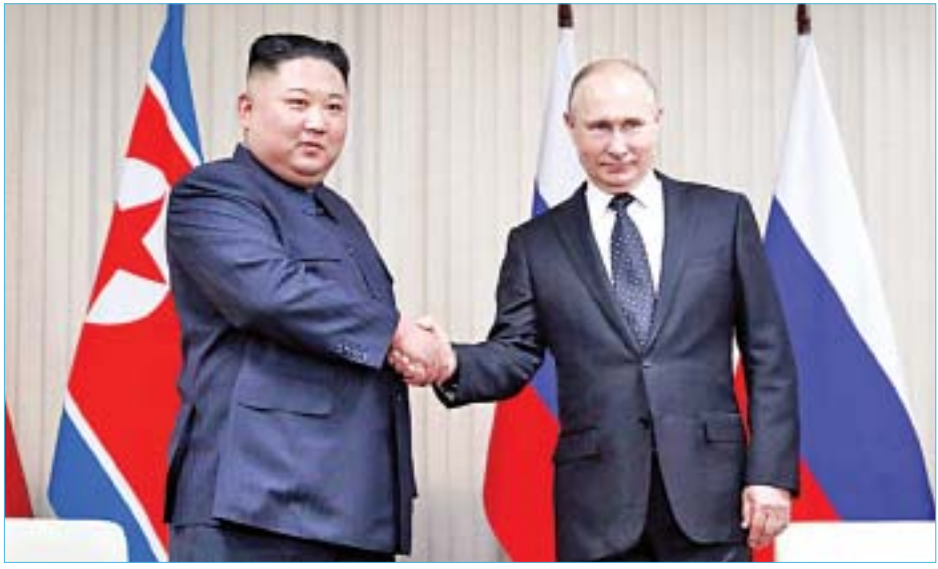
တန်-ပြုလုပ်မှု ခုတ်ယူအကြိမ်ထိပ်သီးအစည်းအဝေးပြီးနောက် ခေါင်းဆောင်ကင်၏ ပထမဆုံးအကြိမ် ထိပ်သီးအစည်းအဝေးဖြစ်သည်။ နှစ်နာရီကျော်ကြာဆွေးနွေးခဲ့သော ရုရှား-မြောက်ကိုရီးယား ထိပ်သီးအစည်းအဝေးသည် ပြုလုပ်မှု၏ နှုတ်ကမ်းလေးလက်နက်ကင်းစင်ပျောက်ရေးလုပ်ငန်းစဉ်တွင် မော်စကို၏ အရေးပါမှုကို မီးမောင်းထိုးပြခဲ့သည်ဟု နိုင်ငံရေးစောင့်ကြည့်လေ့လာသူများက ဆိုသည်။ ခေါင်းဆောင်ကင်သည် ဧပြီ ၂၆ ရက်တွင် ရုရှား ယဉ်ကျေးမှုကဏ္ဍများနှင့် ငါးပြတိုက်သို့ သွားရောက်ကြည့်ရှုမည်ဖြစ်ကြောင်း ရုရှားမီဒီယာက သတင်းဖော်ပြကြသည်။ အေအက်စ်ပီ

တကာဥပဒေ သက်ရောက်သည့် နိုင်ငံတစ်နိုင်ငံအသွင် ကူးပြောင်းရန် လိုအပ်သည်ဟု သမ္မတပူတင်က ဆက်လက်ပြောကြားခဲ့သည်။ ပြုလုပ်မှုနှင့် မော်စကို ဆက်ဆံရေးကို ပိုမိုတည်ငြိမ်ကောင်းမွန်သည့် ခေတ်သစ်ဆက်ဆံရေးအဖြစ် ဆက်လက်ထိန်းသိမ်းသွားမည်ဖြစ်ကြောင်း ခေါင်းဆောင်ကင်က ပြောကြားခဲ့သည်။ ထို့ပြင် ယခုထိပ်သီးအစည်းအဝေးသည် နှစ်နိုင်ငံ သံတမန်ဆက်ဆံရေးနှင့် စီးပွားရေးကဏ္ဍများတွင် ပိုမိုတိုးတက်မှုရှိစေရန် ရလဒ်ကောင်းများ ဆောင်ကြဉ်းပေးမည်ဟု ယုံကြည်ပါကြောင်း ခေါင်းဆောင်ကင်က ဆိုသည်။ ပြုလုပ်မှုနှင့် အမေရိကန်ဆက်ဆံရေး တိုးတက်ကောင်းမွန်ရန်ကြိုးပမ်းခဲ့သည့် ခေါင်းဆောင်ကင်၏ လုပ်ဆောင်ချက်များကို အသိအမှတ်ပြုထောက်ခံပါကြောင်း သမ္မတပူတင်က ပြောကြားခဲ့သည်။ နှုတ်ကမ်းလေးလက်နက်ကင်းစင်ပျောက်ရေးအတွက် ရုရှားနိုင်ငံအနေဖြင့် ကူညီနိုင်မည်နည်းလမ်းများကို ရှာဖွေနိုင်မည်ဟု မျှော်လင့်ပါကြောင်း သမ္မတပူတင်က ဆိုသည်။ ရုရှား-မြောက်ကိုရီးယား ထိပ်သီးအစည်းအဝေးသည် သဘောတူညီမှုတစ်ရပ်မျှ ချမှတ်ခဲ့ခြင်းမရှိသည့် ဝါရှင်