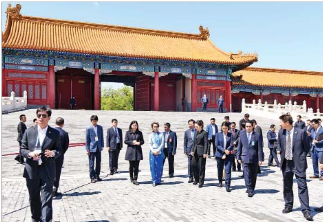
နိုင်ငံတော်၏အတိုင်ပင်ခံပုဂ္ဂိုလ် ဒေါ်အောင်ဆန်းစုကြည် ဦးဆောင်သော ကိုယ်စားလှယ်အဖွဲ့ဝင်များ Forbidden City ၌ လှည့်လည်ကြည့်ရှုစဉ်။

သွားရေး၊ မြန်မာနိုင်ငံမှ ဆန်တန်ချိန် ၁၀၀၀၀၀ အား တရုတ်နိုင်ငံသို့ တင်သွင်းခွင့်ခွဲတမ်းအား ဆက်လက်ပေးအပ်ရေးနှင့် မြန်မာနိုင်ငံမှ လယ်ယာထွက်ကုန်ပစ္စည်းများနှင့် မွေးမြူရေးထွက်ကုန်များ အနာဂတ်တွင် ပိုမိုဝယ်ယူနိုင်ရေးအတွက် ညှိနှိုင်းဆောင်ရွက်သွားရေး၊ နှစ်နိုင်ငံနယ်စပ်ဒေသတွင် ငြိမ်းချမ်းရေးနှင့် တည်ငြိမ်အေးချမ်းမှုရရှိရေး၊ နှစ်နိုင်ငံကုန်သွယ်မှုပမာဏ တိုးမြှင့်နိုင်ရေးအတွက် နယ်စပ်ဒေသများတွင် တရားမဝင်ကုန်သွယ်မှုများပပျောက်ရေး၊ လူကုန်ကူးမှု ကာကွယ်တားဆီးရေးအတွက် နှစ်ဖက်တာဝန်ရှိသူများအကြား ညှိနှိုင်းပူးပေါင်းဆောင်ရွက်ရေး၊ မြန်မာ-တရုတ် နှစ်နိုင်ငံ သတမန်ဆက်ဆံရေး နှစ်(၇၀)ပြည့်မြောက်မည့် ၂၀၂၀ ပြည့်နှစ်တွင် နှစ်နိုင်ငံအကြား ကဏ္ဍပေါင်းစုံတွင် ပူးပေါင်းဆောင်ရွက်မှုဖြင့်တင်ရေးဆိုင်ရာ ကိစ္စရပ်များနှင့်ပတ်သက်၍ ရင်းနှီးပွင့်လင်းစွာ အမြင်ချင်းဖလှယ် ဆွေးနွေးခဲ့ကြသည်။