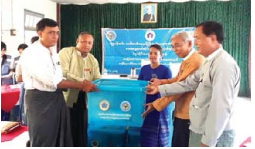
ကျောက်တံခါး ဧပြီ ၂၅ ပဲခူးတိုင်းဒေသကြီး ကျောက်တံခါးမြို့နယ်အတွင်း ဧပြီ ၂၁ ရက်က တိုက်ခတ်ခဲ့သော လေပြင်းဒဏ်ကြောင့်ပျက်စီးပြိုလဲသည့်အိမ်ခြေ ၂၂ လုံး၊ အမိုးလန်

နေအိမ်ပေါင်း ၂၁၈ လုံး၊ ဘုန်းတော်ကြီးကျောင်းနှစ်ကျောင်းအတွက် ထောက်ပံ့ငွေနှင့် ပစ္စည်းများကို ဧပြီ ၂၄ ရက် တွင် အင်းပတ်လည်ကျေးရွာဘုန်းတော်ကြီးကျောင်း၊ ကြာအင်းကုန်းကျေးရွာမဟာစည်ဘုန်းတော်ကြီးကျောင်းနှင့် မြို့နယ်အထွေထွေအုပ်ချုပ်ရေးဦးစီးဌာန အစည်းအဝေးခန်းမတို့တွင် ပြည်သူ့လက်ဝယ်အရောက်ပေးအပ်ခဲ့ကြောင်း သိရသည်။ နေရာသုံးနေရာခွဲ၍ ပေးအပ်ခဲ့ရာတွင် အိမ်၊ ကျောင်းဆောက်လုပ်ရန်အတွက် ပစ္စည်းဖိုးထောက်ပံ့ငွေကျပ် ၁၀၅၀၀၀၀၊ ပြုလဲနေအိမ်များမှ လူဦးရေ ၁၀၆ ဦးအတွက် ဆန်ရိက္ခာဖိုးငွေကျပ် ၂၂၂၆၀၀ စုစုပေါင်းငွေကျပ် ၁၃၂၇၂၆၀၀ ကို ဒေသခံများလက်ဝယ်အရောက် ပေးအပ်ခဲ့ကြောင်း သိရသည်။ ကိုလွင်(ဆွာ)