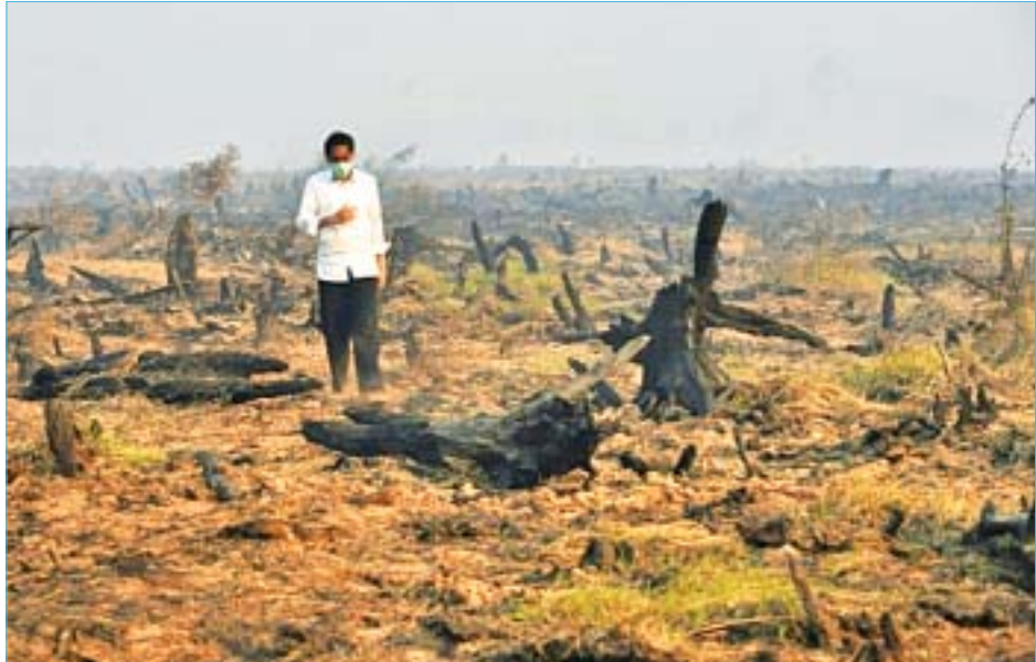
သစ်တောဧရိယာ၏ သုံးပုံတစ်ပုံနီးပါးမှာ မိုးသစ်တောများဖြစ်ပြီး ဧရိယာစတုရန်းကီလိုမီတာ ၃၆၀၀၀ ခန့်ဖြစ်ကြောင်း မေရီလန်-တက္ကသိုလ်အခြေစိုက် ကမ္ဘာလုံးဆိုင်ရာသစ်တောများစောင့်ကြည့်ရေးအဖွဲ့မှ သိပ္ပံပညာရှင်များ၏ နှစ်ပတ်လည် အကဲဖြတ်ချက်အစီရင်ခံစာအရ သိရသည်။ ကမ္ဘာလုံးဆိုင်ရာ သစ်တောများ ပျက်စီးဆုံးရှုံးမှုပမာဏသည် ၂၀၁၆ ခုနှစ်တွင် အမြင့်ဆုံးသို့ ရောက်ရှိခဲ့ပြီး အယ်နီညီရာသီဥတု ဖြစ်စဉ်က သစ်တောများဆုံးရှုံးမှုကို တစ်စိတ်တစ်ပိုင်းအားဖြင့် အားဖြည့်ပေးခဲ့ပြီး ဘရာဇီးနှင့် အင်ဒိုနီးရှားနိုင်ငံများ၌ ဖြစ်ပွားခဲ့သည့် တောမီးလောင်ကျွမ်းမှုများကို ထိန်းချုပ်၍ မရနိုင်ခဲ့ကြောင်း အစီရင်ခံစာတွင် ဖော်ပြသည်။ နှာ၊ ၀၀၀ စသည် တိရစ္ဆာန်မွေးမြူရေးလုပ်ငန်းများနှင့်ပမာဏကြီးမားသည့် လူသုံးကုန်ဆိုင်ရာ စိုက်ပျိုးရေးလုပ်ငန်းများဖြစ်သည့် အာရှနှင့် အာဖရိကတိုက်ဒေသများ၌ ဆီအုန်းစိုက်ခင်းများ တိုးချဲ့ခြင်းနှင့် တောင်အမေရိကတိုက်တွင် ပဲပုပ်နှင့် ဆီလောင်စာထုတ်လုပ်သည့် သီးနှံများ စိုက်ပျိုးမှုများသည် သစ်တောများဖြုန်းတီးစေသည့် အဓိကအကြောင်းတရားများဖြစ်ကြောင်း အစီရင်ခံစာတွင် ဖော်ပြသည်။ အေအက်စ်ပီ

ဝါရှင်တန် ဧပြီ ၂၅ လွန်ခဲ့သည့်နှစ်အတွင်းက လူသားတို့၏ ပယောဂကြောင့် ပျက်စီးခဲ့ရသည့် အပူပိုင်းသစ်တောဧရိယာ ပမာဏသည် အင်္ဂလန်နိုင်ငံ၏ အရွယ်အစားနီးပါးရှိခဲ့ပြီး ၎င်းမှာ ၂၀၀၁ ခုနှစ်ကတည်းကရရှိခဲ့သည့် ကမ္ဘာလုံးဆိုင်ရာပြိုဟ်တုမှ ရရှိခဲ့သည့် အချက်အလက်များအရ စတုတ္ထမြောက် အကြိမ်ဆုံး သစ်တောဧရိယာ ကျဆင်းမှုဖြစ်ကြောင်း သုတေသီများက ဧပြီ ၂၅ ရက်တွင် ထုတ်ပြန်သည့် အစီရင်ခံစာ၌ ဖော်ပြသည်။ ယင်းသို့သော ပမာဏရှိသည့် အပူပိုင်းသစ်တောများ ဆုံးရှုံးမှုပမာဏသည် တွက်ချက်ပိုင်းဆမှုများအရ မယုံနိုင်လောက်အောင်ရှိပြီး ၂၀၁၈ ခုနှစ်အတွင်း နေ့စဉ်နေ့တိုင်း၌ မိနစ်တိုင်းတွင် ဘောလုံးကွင်းပေါင်း ၃၀ အကျယ်အဝန်းရှိသည့် သစ်တောဧရိယာများ ပျောက်ကွယ်ခဲ့ရပြီး ယင်းနှစ်တစ်နှစ်တာလုံး ပျက်စီးခဲ့ရသည့် သစ်တောဧရိယာမှာ စတုရန်းကီလိုမီတာ ၁၂၀၀၀ (စတုရန်းမိုင် ၄၆၀၀၀)ရှိသည်။ ပျက်စီးဆုံးရှုံးခဲ့ရသည့် အပူပိုင်း