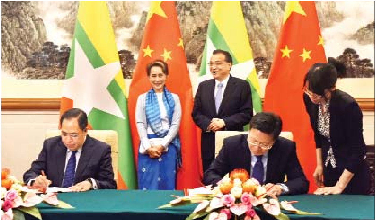
နိုင်ငံတော်၏အတိုင်ပင်ခံပုဂ္ဂိုလ် ဒေါ်အောင်ဆန်းစုကြည်နှင့် တရုတ်ပြည်သူ့သမ္မတနိုင်ငံ ဝန်ကြီးချုပ် မစ္စတာ လီချန်းတို့၏ ရှေ့မှောက်၌ ဒုတိယဝန်ကြီး ဦးဆက်အောင်နှင့် ဒုတိယဝန်ကြီး H.E. Mr. Yu Jianhua တို့ နားလည်မှုစာချုပ်လွှာ လက်မှတ်ရေးထိုးကြစဉ်။

တွေ့ဆုံစဉ် နှစ်နိုင်ငံဆွေမျိုးပေါက်ဖော် ချစ်ကြည်ရင်းနှီးသော ဆက်ဆံရေးအား နှစ်နိုင်ငံပြည်သူများ၏ အကျိုးစီးပွားအတွက် အရှိန်မြှင့်တင်ဆောင်ရွက်ရေး၊ ရပ်ဝန်းနှင့် ပိုးလမ်းမ ပူးပေါင်းဆောင်ရွက်ရေး မူဘောင်အောက်မှ မြန်မာနိုင်ငံ၏ လမ်းပန်းဆက်သွယ်ရေးနှင့် သယ်ယူပို့ဆောင်ရေးဆိုင်ရာ အခြေခံအဆောက်အအုံများ ဖွံ့ဖြိုးတိုးတက်ရေးအတွက် ပူးပေါင်းဆောင်ရွက်