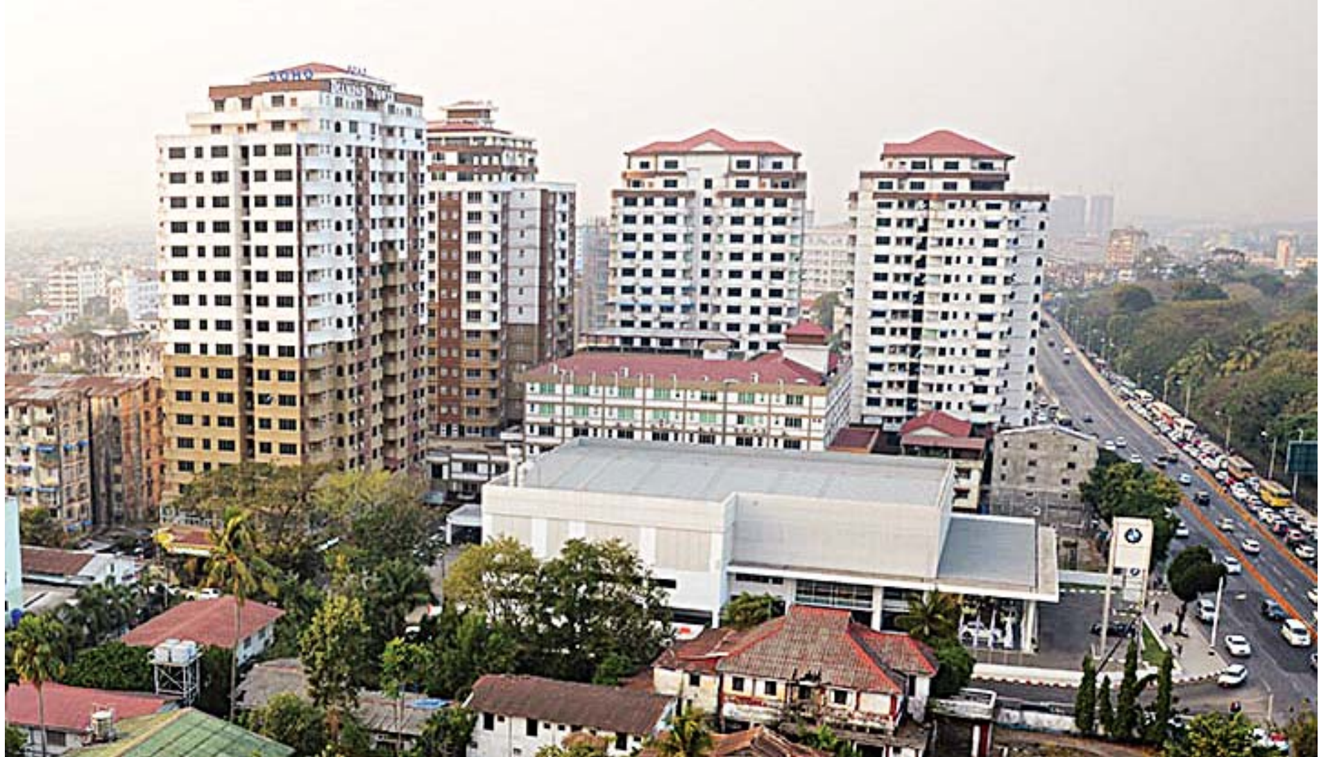
ရန်ကုန်မြို့ရှိ လူနေအထပ်မြင့်အဆောက်အအုံများကို တွေ့ရစဉ်။