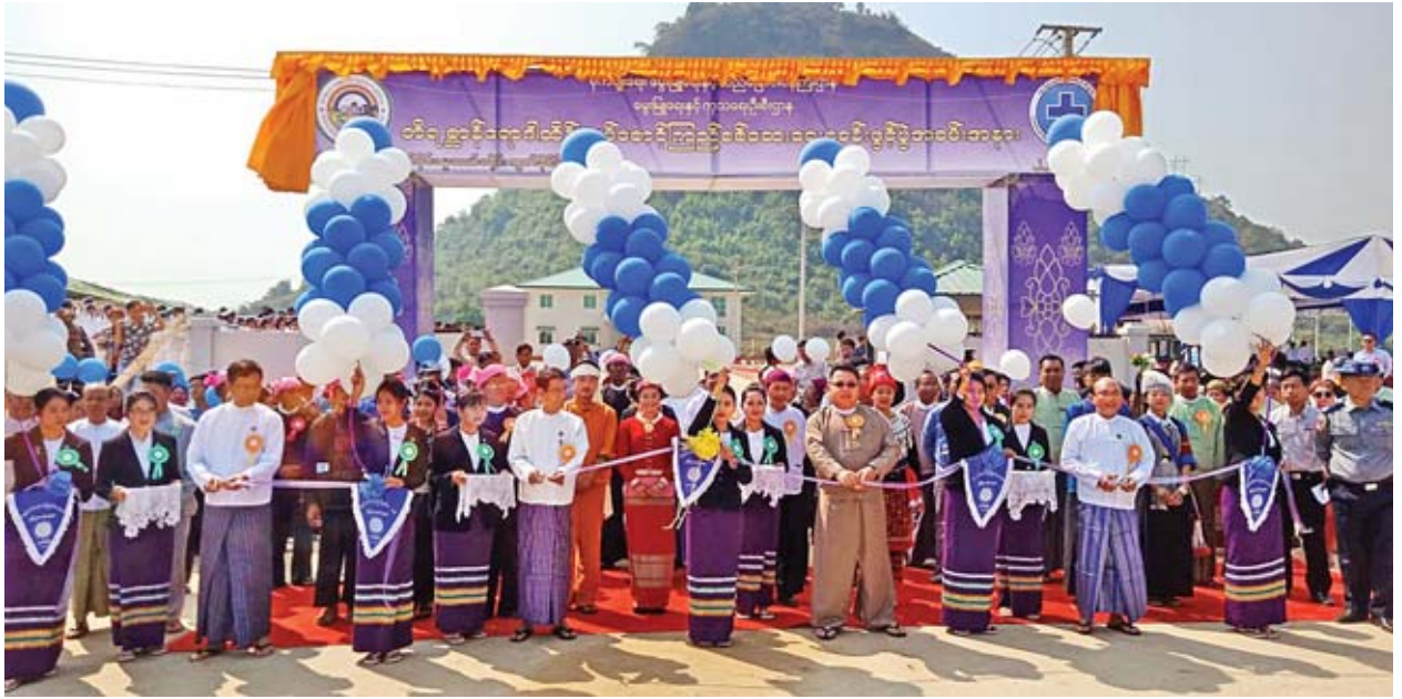
အတွက် ယခုကဲ့သို့ Animal Quarantine Station တည်ထောင်ဖွင့်လှစ် ရခြင်းဖြစ်ကြောင်း ပြောကြားသည်။

ထိုနေ့က ဖွင့်ပွဲအခမ်းအနားကို ဆက်လက်ကျင်းပရာ ပြည်ထောင်စု ဝန်ကြီး ဒေါက်တာအောင်သူက မွေးမြူသူတောင်သူများ ထိုက်သင့်သည့် အကျိုးအမြတ်ရရှိစေရန် နိုင်ငံတော်အစိုးရအနေဖြင့် ကျွဲ၊ နွားများ တရားဝင် တင်ပို့ရောင်းချနိုင်ရန် ၂၀၁၇ ခုနှစ် အောက်တိုဘာ ၉ ရက်စွဲပါ အမိန့် ကြော်ငြာစာအမှတ် (၄၉/၂၀၁၇) ကို ထုတ်ပြန်ပြီး ခွင့်ပြုပေးခဲ့ကြောင်း၊ ရောင်းလိုအားနှင့် ဝယ်လိုအားကို အခြေခံပြီး ကျွဲ၊ နွားများ တရားဝင်တင်ပို့ ရောင်းချနိုင်ရန်စီမံဆောင်ရွက်ခြင်းနှင့်အတူ တစ်ဖက်တွင်လည်း တစ်နိုင်ငံမှ တစ်နိုင်ငံသို့ တိရစ္ဆာန်များ ကုန်သွယ်မှုပြုလုပ်ရာတွင် နိုင်ငံတကာစံနှုန်း နှင့်အညီ လိုအပ်သည့် စစ်ဆေးမှုများကို ပြုလုပ်ပြီး ထိန်းသိမ်းစောင့်ကြည့် သွားခြင်းဖြင့် နယ်စပ်ဖြတ်ကျော် တိရစ္ဆာန်ကူးစက်ရောဂါများကို ထိန်းချုပ်ရန် လိုအပ်လာသဖြင့် ယခုကဲ့သို့ တိရစ္ဆာန်ရောဂါထိန်းချုပ်စောင့်ကြည့်စစ်ဆေး ရေးစခန်းကို ဖွင့်လှစ်ဆောင်ရွက်ခြင်းဖြစ်ကြောင်း၊ ကျွဲ၊ နွားများ ပြည်ပသို့ တင်ပို့ရောင်းချရာတွင် တိရစ္ဆာန်ရောဂါကူးစက်ပြန့်ပွားမှု မဖြစ်ပွားစေရေး မိတ်ဖက်အဖွဲ့အစည်းများ၊ ပြည်တွင်း ပြည်ပ ပညာရှင်များနှင့် တိုင်ပင် ဆွေးနွေးပြီး ဆောင်ရွက်ရမည် လုပ်ထုံး၊ လုပ်နည်းနှင့် စည်းမျဉ်း၊ စည်းကမ်းများ ချမှတ်ခြင်း၊ အမှတ်အသားတပ်ဆင်ပေးခြင်း၊ ကာကွယ်ဆေးထိုးပေးခြင်း၊ ကျန်းမာရေးစစ်ဆေးပေးခြင်း၊ စစ်ဆေးပြီးကြောင်း ထောက်ခံချက်လက်မှတ် ထုတ်ပေးခြင်း၊ Animal Quarantine Certificate ထုတ်ပေးခြင်း စသည့် လုပ်ငန်းများကို ဝန်ကြီးဌာန၏ ကြီးကြပ်မှုဖြင့် နိုင်ငံတကာစံချိန်စံညွှန်းများ နှင့်အညီ စနစ်တကျ အကောင်အထည်ဖော်ဆောင်ရွက်ရန် လိုအပ်သည်