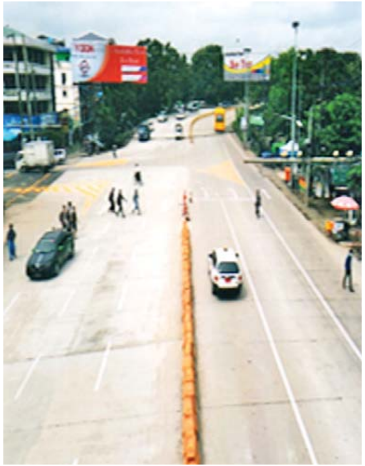
မြို့တွင်းလမ်းများ ဆောင်ရွက်ပေးထားမှုကို တွေ့ရစဉ်။