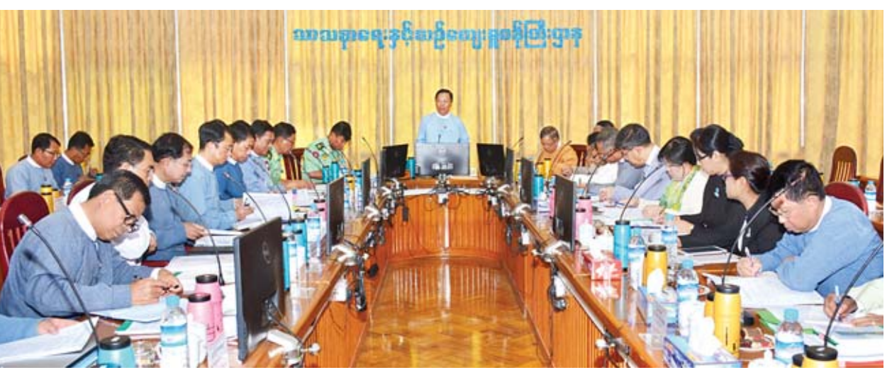
ထိုနေ့က ပြည်ထဲရေးဝန်ကြီးဌာန၊ မန္တလေးတိုင်းဒေသကြီးအစိုးရအဖွဲ့၊ ပြည်ထောင်စုအစိုးရအဖွဲ့ဝန်ကြီးဌာန၊ စီမံကိန်းနှင့်ဘဏ္ဍာရေးဝန်ကြီးဌာန၊ ရင်းနှီးမြုပ်နှံမှုနှင့် နိုင်ငံခြားစီးပွားဆက်သွယ်ရေးဝန်ကြီးဌာန၊ တိုတယ်နှင့် ခရီးသွားလာရေးဝန်ကြီးဌာန၊ ပြည်ထောင်စုရေနေချုပ်ရုံးနှင့် ညောင်ဦးခရိုင် အထွေထွေအုပ်ချုပ်ရေးဦးစီးဌာနတို့မှ တာဝန်ရှိသူများက ပုဂံဒေသတစ်ခုလုံး ရေရှည်အကျိုးစီးပွားလွှမ်းခြုံသက်ရောက်မှုရှိစေရေးနှင့် ရှေးဟောင်းယဉ်ကျေးမှု အမွေအနှစ်ဒေသ မထိခိုက်စေရေးနှင့် ဒေသတွင်းနှင့် နိုင်ငံသားလုပ်ငန်းရှင်များ နှစ်နာမူမရှိစေရေး ကိစ္စရပ်များနှင့်စပ်လျဉ်း၍ ညှိနှိုင်းဆွေးနွေးခဲ့ကြကြောင်း သိရသည်။