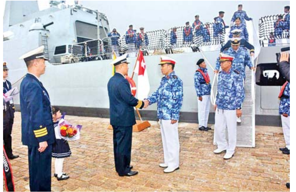
Maritime Exercise တွင် ပုံပြ မောင်းနှင်ခြင်းလေ့ကျင့်ခန်းများ၊ ရေ ယာဉ်ပေါ် တက်ရောက်ရှာဖွေ စီးနင်း သိမ်းပိုက်ခြင်း လေ့ကျင့်ခန်းများ၊ ရှာဖွေကယ်ဆယ်ရေး လေ့ကျင့်ခန်းများ၊ ရဟတ်ယာဉ်များ အပြန်အလှန် ဆင်းသက်ခြင်း လေ့ကျင့်ခန်းများ၊ ဆက်သွယ်ရေးလေ့ကျင့်ခန်းများနှင့် ဒဏ်ရာရလူနာများ သယ်ယူရွှေ့ပြောင်းခြင်းနှင့် ကုသမှုလေ့ကျင့်ခန်းများ ဆောင်ရွက်သွားမည်ဖြစ်ကြောင်း တပ်မတော်ကာကွယ်ရေးဦးစီးချုပ်ရုံး၏ သတင်းထုတ်ပြန်ချက်အရ သိရသည်။ သတင်းစဉ်

PLA Navy)၏ နှစ်(၇၀)ပြည့် အထိမ်းအမှတ် International Fleet Review -IFR အခမ်းအနားသို့ ပါဝင်တက်ရောက်မည်ဖြစ်ပြီး ဧပြီ ၂၄ ရက်မှ ၂၆ ရက်အထိ အခမ်းအနားသို့ တက်ရောက်လာမည့် စစ်ရေယာဉ်များ အပြန်အလှန်လေ့လာခြင်း၊ ချစ်ကြည်ရေးအားကစားပြိုင်ပွဲများ ပြုလုပ်ခြင်း၊ ချင်းတောင်မြို့တွင်း လေ့လာရေးခရီး သွားရောက်ခြင်းနှင့် ချင်းတောင်မြို့အနီး ပင်လယ်ပြင်တွင် တရုတ်ပြည်သူ့ လွတ်မြောက်ရေးတပ်မတော်ရေတပ်နှင့် အာဆီယံနိုင်ငံများမှ စစ်ရေယာဉ်များနှင့်အတူ China-ASEAN Joint Maritime Exercise ပြုလုပ်ခြင်းများ ဆောင်ရွက်သွားမည် ဖြစ်ကြောင်း သိရသည်။ China-ASEAN Joint