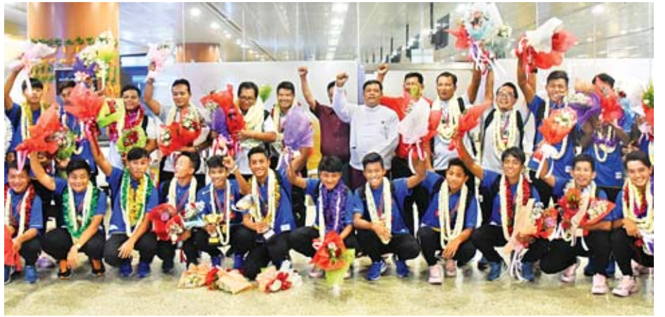
မြန်မာ ယူ-၁၈ အသင်းသည် မတ်လက ယှဉ်ပြိုင်သည့် ဗီယက်နမ် ယူ-၁၉ ဖိတ်ခေါ်ပြိုင်ပွဲတွင် အောင်မြင်မှုမရခဲ့

မြန်မာ ယူ-၁၈ အသင်းသည် ဟောင်ကောင်ဖိတ်ခေါ်ပြိုင်ပွဲတွင် ရှုံးပွဲမရှိဘဲ နှစ်ပွဲနိုင်၊ တစ်ပွဲသရေ ခုနစ်မှတ်ဖြင့် ဗိုလ်စွဲခဲ့ခြင်းဖြစ်သည်။ မြန်မာ ယူ-၁၈ အသင်းသည် အိမ်ရှင်ဟောင်ကောင်အသင်းကို နှစ်ဂိုး-ဂိုးမရှိ၊ စင်ကာပူအသင်းကို နှစ်ဂိုး-တစ်ဂိုးဖြင့် အနိုင်ရကာ ဗီယက်နမ်အသင်းနှင့် ဂိုးမရှိသရေကျပြီး ခုနစ်မှတ်ဖြင့် ဗိုလ်စွဲခဲ့ခြင်းဖြစ်သည်။