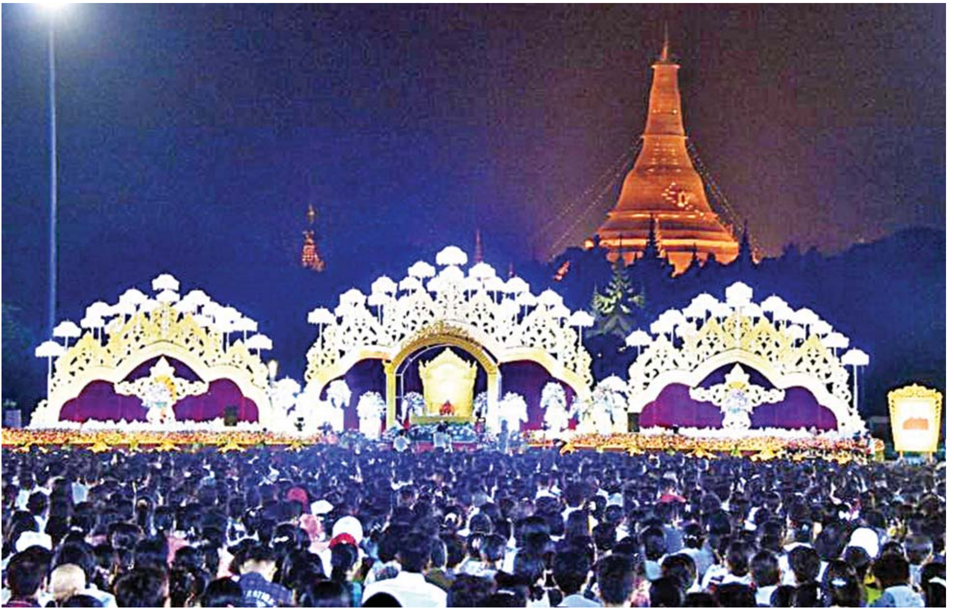
ရန်ကုန်တိုင်းဒေသကြီးအစိုးရအဖွဲ့က ကြီးမှူးကျင်းပသော နှစ်သစ်ကူးတရားအလှူတော် ဓမ္မသဘင်ကို ရန်ကုန်မြို့ပြည်သူ့ရင်ပြင်တွင် ကျင်းပစဉ်။