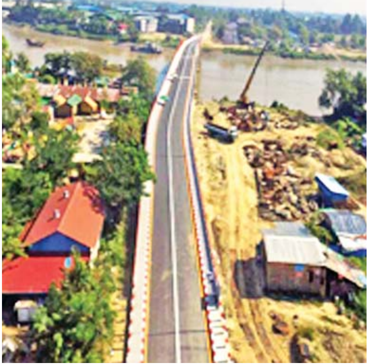
ချောင်းကူးတံတားများ ဆောင်ရွက်ပေးထားမှုကို တွေ့ရစဉ်။

မေး။ ဝန်ကြီးချုပ်အနေနဲ့ ပြည်သူတွေ သိရှိ စေဖို့တာများ ဖြည့်စွက်ပြောကြား လိုပါသလဲ။ ဖြေ။ သုံးနှစ်တာကာလအတွင်းမှာ တိုင်း ဒေသကြီးအနေနဲ့ ကျွန်တော်တို့ ရန်ကုန်မြို့ကို တကယ့်မြို့ပြအမွေအနှစ် တစ်ခုအဖြစ် နိုင်ငံတကာ ဧည့်သည်တွေ၊ မြို့ပြမှာ နေထိုင်သူတွေက မြို့အပေါ်မှာ ယုံကြည်မှု၊ သူတို့ရဲ့မြို့အပေါ်မှာ သူတို့ ဂုဏ်ယူတတ်မှုကို ဖြစ်စေလိုပါတယ်။ တစ်ဖက် မှာလည်း စိမ်းလန်းတဲ့ မြို့ပြတစ်ခုဖြစ်ဖို့ အတွက် ဆက်လက်ထိန်းသိမ်းသွားဖို့ လိုပါ တယ်။ ဖွံ့ဖြိုးတိုးတက်ပြီး တကယ့်ကို စီးပွားရေးမြို့တော်ကြီးတစ်ခုနဲ့ မြို့သူမြို့သား တွေက နေချင်စဖွယ်ဖြစ်တယ်ဆိုတဲ့ အခြေ အနေကို ရည်မှန်းချက်ထားပြီး ကျွန်တော်တို့ ကြိုးပမ်းဆောင်ရွက်နေပါတယ်။ ဒီရည်မှန်း ချက်တွေကို ဆောင်ရွက်တဲ့နေရာမှာ သုံးနှစ် အတွင်း ပန်းတိုင်ရောက်လိမ့်မယ်လို့ မဆို နိုင်ပါဘူး။ ဒါပေမယ့် ကျွန်တော်တို့ရဲ့ခြေလှမ်း တွေကို တစ်နှစ်ထက်တစ်နှစ် ပိုမိုတိုးတက်လာ အောင် ဆောင်ရွက်သွားကြဖို့ လိုပါတယ်။ ဒီလိုတိုးတက်အောင် ဆောင်ရွက်ခြင်းဖြင့် မြို့ပြဖွံ့ဖြိုးတိုးတက်မှု၊ ပြည်သူတွေရဲ့ လူမှုဘဝကို ဖွံ့ဖြိုးတိုးတက်လာစေဖို့နဲ့ စားဝတ် နေရေး လုံခြုံစိတ်ချရနိုင်တဲ့ လူမှုဘဝတွေ ဖန်တီးပေးနိုင်ဖို့ ကျွန်တော်တို့ ဆက်လက် ကြိုးပမ်းဆောင်ရွက်သွားကြမှာ ဖြစ်ပါတယ်။ သုံးနှစ်တာကာလကို ပြန်ကြည့်လိုက်ရင် ကျေနပ်စရာတွေ၊ စိန်ခေါ်မှုတွေနဲ့ ရင်ဆိုင်ရ တဲ့ အခက်အခဲတွေ များစွာရှိပါတယ်။ တိုင်း ဒေသကြီး အစိုးရအဖွဲ့အနေနဲ့ ပြည်သူနဲ့အတူ ဆက်လက်ကြိုးပမ်းသွားဖို့အတွက် အမြဲတစေ ဆောင်ရွက်နေမှာ ဖြစ်တယ်ဆိုတာ ပြောကြား လိုပါတယ်။