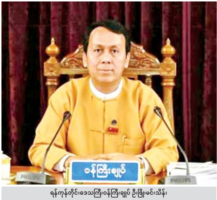
ရန်ကုန်တိုင်းဒေသကြီးဝန်ကြီးချုပ် ဦးဖိုးမင်းသိန်း

ပြည်သူသယ်ယူ ပို့ဆောင်ရေးကဏ္ဍအတွက် ဆောင်ရွက်နေမှုတွေကို သိပါရစေ။ ဖြေ။ အရင်က မြို့ပြဖွံ့ဖြိုးတိုးတက်ရေးကို ရန်ကုန်မြို့လယ်ကောင်လောက်ကိုပဲ မြို့ပြစနစ်နဲ့ တည်ဆောက်ခဲ့တာဖြစ်တယ်။ လှည်းတန်းကို ရောက်ပြီဆိုရင် စနစ်တကျ မြို့ပြတည်ဆောက်ထားတာ မဟုတ်တော့ ဘူး။ အင်းလျားလမ်းကနေပြီး ဖြတ်လမ်းတွေ မရှိပါဘူး။ ယာဉ်တွေက လမ်းမကြီးတွေထဲ မှာပဲ သွားလာရပါတယ်။ တစ်ပိုင်လောက်မှ တစ်ဖြတ်လောက်ရှိသလိုမျိုး တွေမှာ ဖြစ်ပါတယ်။ အင်းလျားကနေဆက်သွားရင် အေဒီ ဖီးပွိုင့်ကိုရောက်မှ ပါရမီလမ်း တစ်ဖြတ် ရောက်မှာဖြစ်ပါတယ်။ ရှေ့ဆက်သွားရင် ခုနစ်ပိုင်ကနေ ရှစ်ပိုင်ရောက်မှ ရှစ်ပိုင်လမ်းဆုံ တစ်ဖြတ်ဖြစ်ပါတယ်။ အဲဒီကနေဆက်သွားရင် ကိုးပိုင်ရောက်မှ တစ်ဖြတ်၊ ဆယ်ပိုင်ရောက်မှ တစ်ဖြတ်၊ အဲဒီတစ်ဖြတ်တွေက စနစ်တကျ လမ်းဖြတ်တွေ တည်ဆောက်ထားတာမျိုး မဟုတ်ပါဘူး။ ပါရမီတစ်ခုလောက်သာ ဟိုဘက်၊ ဒီဘက်တိုးလျှိုးပေါက် ဖြတ်ထားတဲ့ လမ်းမျိုးတွေ ဖြစ်ပါတယ်။ ဒါကြောင့် မြို့ပြကို စနစ်တကျ ပြန်လည်တည်ဆောက်နိုင်ဖို့ အတွက် လိုအပ်ပါတယ်။ ဒီနေရာမှာလည်း ကျွန်တော်တို့ နိုင်ငံမှာ မြို့ပြတွေကို အစိုးရအဆက်ဆက် တည် ဆောက်ခဲ့ပါတယ်။ တည်ဆောက်ခဲ့တဲ့ မြို့သစ်