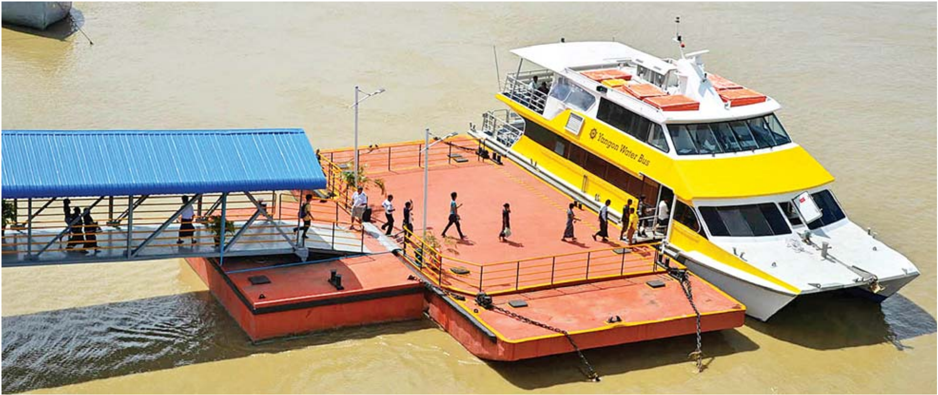
ရန်ကုန်တိုင်းဒေသကြီး သယ်ယူပို့ဆောင်ရေးတွင် အရေးပါလျက်ရှိသည့် Yangon Water Bus ကို တွေ့ရစဉ်။