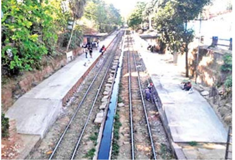
ရထားလမ်းများ အဆင့်မြှင့်တင်ဆောင်ရွက်ထားမှုကို တွေ့ရစဉ်။

တို့ နေရေးနဲ့ပတ်သက်ပြီး ကြိုးပမ်းဆောင် ရွက်နေပါတယ်။ ပြည်ထောင်စုအစိုးရဘက် က ဒီအပေါ်မှာ တွန်းအားပေးပြီး ကူညီ ဆောင်ရွက်ပေးနေတာတွေ ရှိပါတယ်။ ဆောက်လုပ်ရေးဝန်ကြီးဌာန ဘက်ကလည်း ရန်ကုန်မှာ အိမ်ရာစီမံကိန်းတွေ အကောင် အထည်ဖော်ဖို့အတွက် တိုင်းဒေသကြီး အစိုးရနဲ့ ပူးပေါင်းပြီး ဆောင်ရွက်နေတာတွေ ရှိပါတယ်။