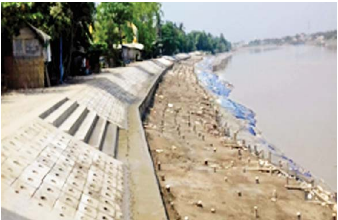
ကမ်းပြိုကာကွယ်ရေးလုပ်ငန်းဆောင်ရွက်ထားမှုကို တွေ့ရစဉ်။

“ရန်ကုန်မြို့မှာ ဥယျာဉ်မြို့တစ်မြို့လို ဖြစ်လာနိုင်အောင် ပြုပြင်သွား ဖို့ လိုပါတယ်။ ဒါကြောင့်မို့ ပန်းခြံတွေကို အများကြီး ပြုပြင်ခဲ့ပါတယ်။ တစ်ချိန်က ပန်းခြံတွေအခြေအနေနဲ့ ယခုအခြေအနေတွေကို ကြည့်မယ်ဆိုရင် ပန်းခြံတွေ တော်တော်များများက စိမ်းလန်းပြီး တိုးတက်လာတာကို တွေ့ရမှာဖြစ်ပါတယ်။ ဝမ်းသာစရာကောင်းတာက ပြည်သူတွေက ဒီပန်းခြံတွေကို အသုံးပြုပြီး အနားယူအပန်းဖြေကြ တယ်။ အားကစားလုပ်ကြတာတွေကို တွေ့မြင်ရတဲ့အတွက် ဝမ်းသာ ပါတယ်”