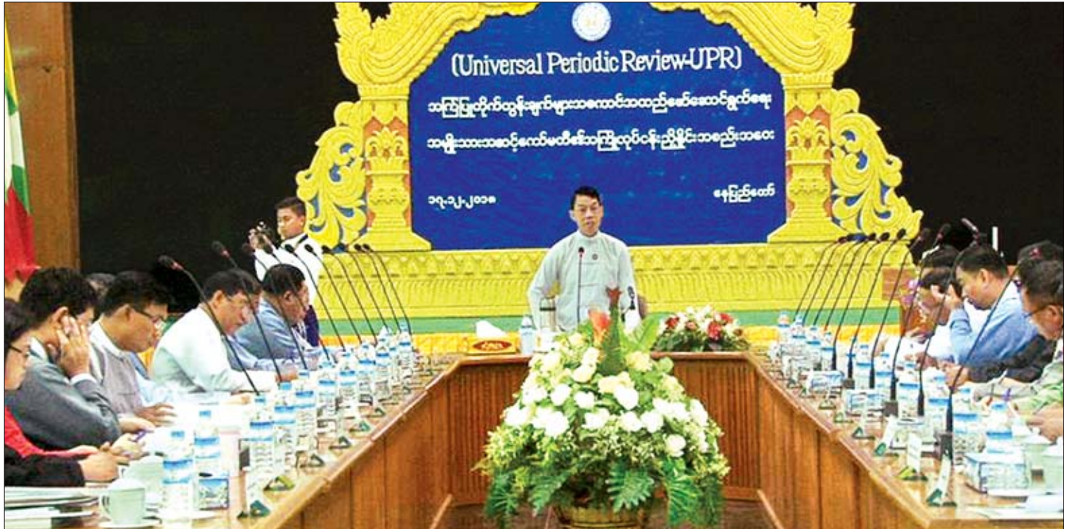
Universal Periodic Review-UPR အကြံပြုတိုက်တွန်းချက်များမှ ဘာသာပေါင်းစုံ ချစ်ကြည်ရေး၊ လွတ်လပ်စွာထုတ်ဖော်ခွင့်နှင့် စုဝေးခွင့်ဆိုင်ရာ အကြံပြုချက်များအပေါ် အကောင်အထည်ဖော်ဆောင်ရွက်ရေး အမျိုးသားအဆင့်ကော်မတီ၏ အကြံပြုလုပ်ငန်းညှိနှိုင်းအစည်းအဝေး ကျင်းပစဉ်။