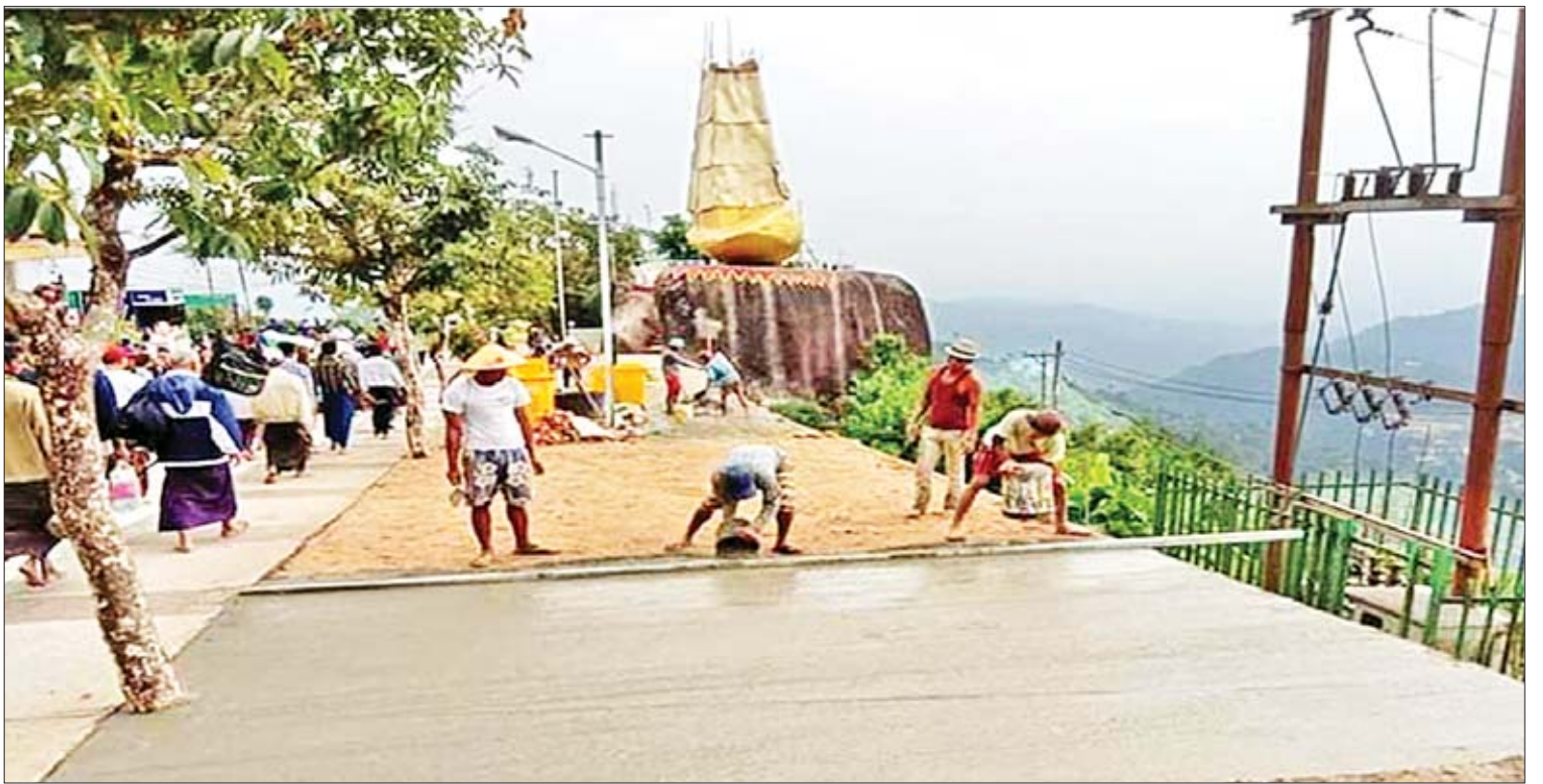
ကျိုက်ထီးရိုးစေတီတော် ရင်ပြင်အတက်လမ်းအား တာရာဇိုခင်းခြင်း ဆောင်ရွက်နေကြစဉ်။

စာရင်းဝင်အဖြစ် တင်သွင်းဖို့ကိစ္စကို ၂၀၁၈ ခုနှစ် နှစ်စဉ်လောက်ကနေစပြီး လုပ်ငန်းဆောင်ရွက်နေပါတယ်။ နည်းပညာပိုင်းဆိုင်ရာ ကြီးကြပ်ရေးအဖွဲ့အစည်းများ ပါဝင်ပြီး စာရင်းအချုပ်အခြာမှုကို တစ်စတစ်စ စိစစ်ကြည့်ရှုကြတာရှိပါတယ်။