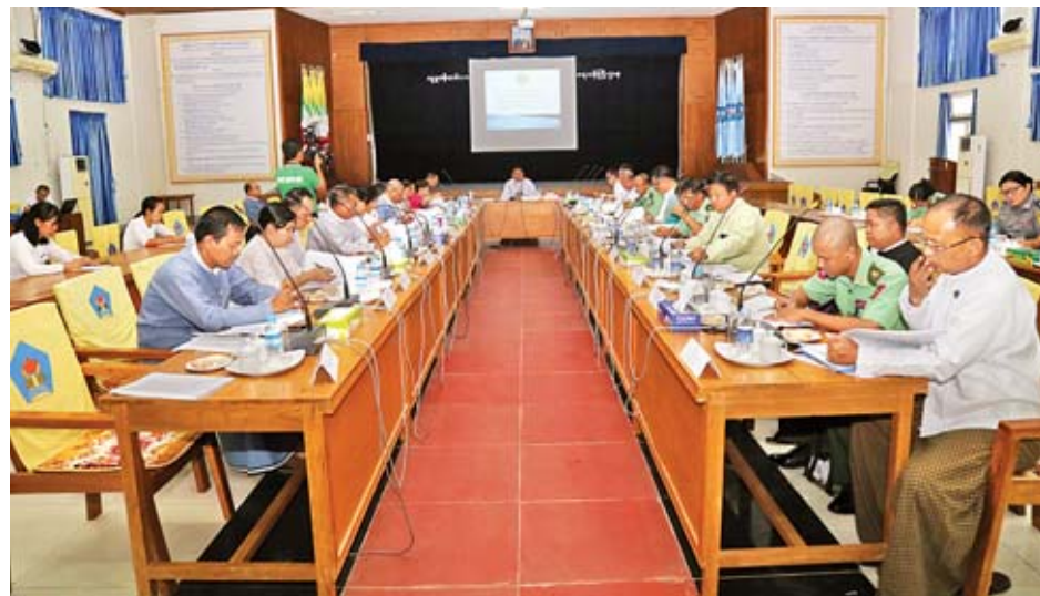
အဆိုပြုသည့် ကလေးသူငယ်များအား သေကျေထိခိုက်ဒဏ်ရာရစေခြင်းနှင့် ကလေးသူငယ်များအပေါ် လိင်ပိုင်းဆိုင်ရာ အကြမ်းဖက်မှုကျူးလွန်ခြင်းတို့အား အဆုံးသတ်ရေးနှင့်စပ်လျဉ်းသည့် လုပ်ငန်းစီမံချက်(၂)ရပ် မူကြမ်းကို ရှင်းလင်းကာ သက်ဆိုင်ရာဌာနဆိုင်ရာများအလိုက် ပါဝင်ဆွေးနွေးစေလိုကြောင်း ပြောကြားသည်။ ဆက်လက်၍ လုပ်ငန်းကော်မတီအတွင်းရေးမှူး ဦးဝင်းနိုင်ထွန်းက လက်နက်ကိုင်ပဋိပက္ခအတွင်း ကလေး

နေပြည်တော် ဧပြီ ၂၃ လက်နက်ကိုင်ပဋိပက္ခအတွင်း ကလေးသူငယ်များအပေါ် ကြီးလေးသော ကျူးလွန်မှုများမှ ကာကွယ်တားဆီးရေးလုပ်ငန်းကော်မတီ၏ ပထမအကြိမ်လုပ်ငန်းညှိနှိုင်းအစည်းအဝေး(၁/၂၀၁၉)ကို ယမန်နေ့ ဖွဲ့စည်းလှုပ်ရှားက လူမှုဝန်ထမ်း၊ ကယ်ဆယ်ရေးနှင့် ပြန်လည်နေရာချထားရေးဝန်ကြီးဌာန စုပေါင်းအစည်းအဝေးခန်းမ၌ ကျင်းပသည်။ အစည်းအဝေးသို့ လုပ်ငန်းကော်မတီဥက္ကဋ္ဌ ဦးမြင့်သူ (အမြဲတမ်းအတွင်းဝန်၊ နိုင်ငံခြားရေးဝန်ကြီးဌာန)၊ လုပ်ငန်းကော်မတီအတွင်းရေးမှူး၊ ဦးဝင်းနိုင်ထွန်း (ညွှန်ကြားရေးမှူးချုပ်၊ လူမှုဝန်ထမ်း၊ ကယ်ဆယ်ရေးနှင့် ပြန်လည်နေရာချထားရေးဝန်ကြီးဌာန ပြန်လည်ထူထောင်ရေးဦးစီးဌာန) နှင့် လုပ်ငန်းကော်မတီတွင်ပါဝင်သည့် ဌာနဆိုင်ရာအသီးသီးမှ အဖွဲ့ဝင်ကိုယ်စားလှယ်များ တက်ရောက်ကြသည်။ လုပ်ငန်းညှိနှိုင်းအစည်းအဝေးတွင် လုပ်ငန်းကော်မတီဥက္ကဋ္ဌ ဦးမြင့်သူက လက်နက်ကိုင်ပဋိပက္ခအတွင်း ကလေးသူငယ်များအပေါ် ကြီးလေးသောကျူးလွန်မှုများမှ ကာကွယ်တားဆီးရေး လုပ်ငန်းကော်မတီ ဖွဲ့စည်းရခြင်း၏ အဓိကအကြောင်းရင်းများကို ရှင်းပြပြီး ကုလသမဂ္ဂဘက်မှ