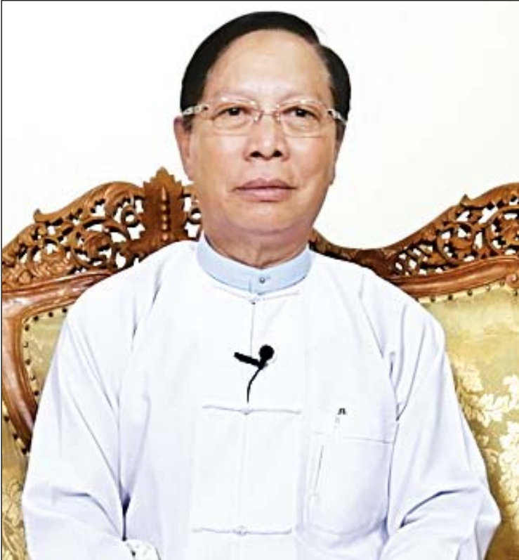
ပြည်ထောင်စုဝန်ကြီး သူရဦးအောင်ကို