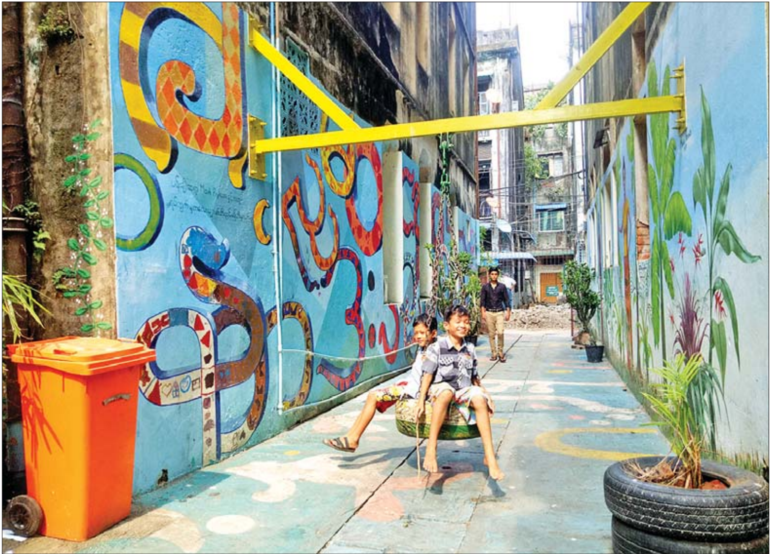
ဖန်တီးပြုပြင်ထားသော (၂၇)လမ်းနှင့် (၂၈)လမ်းကြား အလယ်ဘလောက်ရှိ နောက်ဖေးလမ်းကြားဥယျာဉ်သစ်ကို တွေ့ရစဉ်။

“ဒီရန်ကုန်မြောက်ဥယျာဉ်ကို ဆွစ်ဇာလန် သံရုံးရဲထောက်ပံ့ကူညီမှုနဲ့ ဆောင်ရွက်တာ ဖြစ်ပါတယ်။ ရန်ကုန်မြို့တော်စည်ပင်သာယာရေးကော်မတီက နောက်ဖေးလမ်းကြား သန့်ရှင်းတာနဲ့ ကွန်ကရစ်ခင်းတာတွေကို ပြုလုပ်ပေးတာဖြစ်ပြီး တိုင်းဒေသကြီး လွှတ်တော်ကိုယ်စားလှယ်တွေနဲ့ ရပ်ကွက် အုပ်ချုပ်ရေးမှူးတွေ ပါဝင်ဆောင်ရွက်ပေး တာဖြစ်ပါတယ်။ ဒီလုပ်ငန်းကိုစလုပ်တဲ့အခါမှာ ဒီဇိုင်းပိုင်းကို ကျွန်တော်တို့က ကိုယ်တိုင်လုပ် ဆောင်ပေးတာမျိုးမဟုတ်ဘဲ စီမံကိန်းအနီး အနားတစ်ဝိုက်မှာ နေထိုင်ကြတဲ့သူတွေနဲ့ ဆွေးနွေးပွဲတွေပြုလုပ်ပြီး အနာဂတ်မှာ ဒီနေရာကို ဘယ်လိုပုံစံမျိုးဖြစ်စေချင်လဲ၊ ဘယ်လို လုပ်ဆောင်သင့်တယ်ဆိုတာကို တစ်ဆင့်ချင်း စာမျက်နှာ ၁၃ ကော်လံ ၁ သို့ ၀