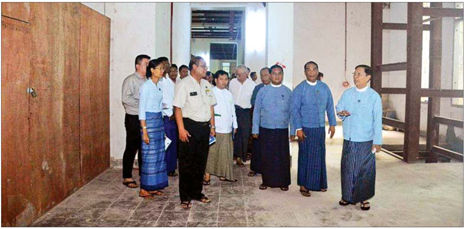
ပြည်ထောင်စုဝန်ကြီး သူရဦးအောင်ကို အမျိုးသားစာကြည့်တိုက်(ရန်ကုန်) ပြောင်းရွှေ့ဖွင့်လှစ်မည့် အဆောက်အအုံအား ကြည့်ရှုစစ်ဆေးစဉ်။

ချင်းပြည်နယ်နဲ့ ရခိုင်ပြည်နယ်ကလွဲရင် ပြည်နယ်အားလုံးမှာ ဘာသာပေါင်းစုံချစ်ကြည်ရေးအဖွဲ့တွေ ဖွဲ့စည်းပြီးဖြစ်ပါတယ်။ မြို့နယ်အဆင့်မှာတော့ ၇၈ ဖွဲ့၊ ခရိုင်အဆင့် ၄၀၊ တိုင်းဒေသကြီး/ပြည်နယ်အဆင့် ၁၂ ဖွဲ့