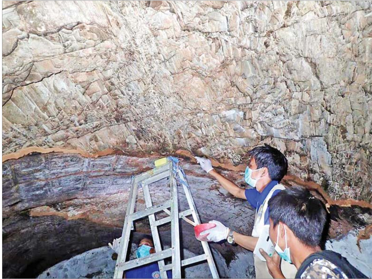
မြင်စိုင်းမြို့ဟောင်းအနီး စိတ္တဂုတ္တလိုဏ်ဂူအတွင်းရှိ နံရံဆေးရေးပန်းချီများ ထိန်းသိမ်းရေးလုပ်ငန်း ဆောင်ရွက်နေစဉ်။

သာသနာရေးနှင့် ယဉ်ကျေးမှု ဝန်ကြီးဌာနကို ဦးစီးဌာနငါးခု၊ တက္ကသိုလ် တစ်ခုနဲ့ ဖွဲ့စည်း ထားပါတယ်။ တက္ကသိုလ် တစ်ခုကတော့ အပြည်ပြည်ဆိုင်ရာ ထေရဝါဒ ပုဒ္ဒသနာပြု တက္ကသိုလ် ဖြစ်ပါတယ်။ မြတ်ဗုဒ္ဓရဲ့ ပိဋကတ်သုံးပုံ၊ နိကာယ် ငါးရပ်၊ ဓမ္မခန္ဓာပေါင်း ရှစ်သောင်းလေးထောင် ကို ကမ္ဘာသူ ကမ္ဘာသား တွေ လေ့လာစံစားနိုင် အောင် ဖွင့်လှစ်ထားတဲ့ တက္ကသိုလ်ဖြစ်