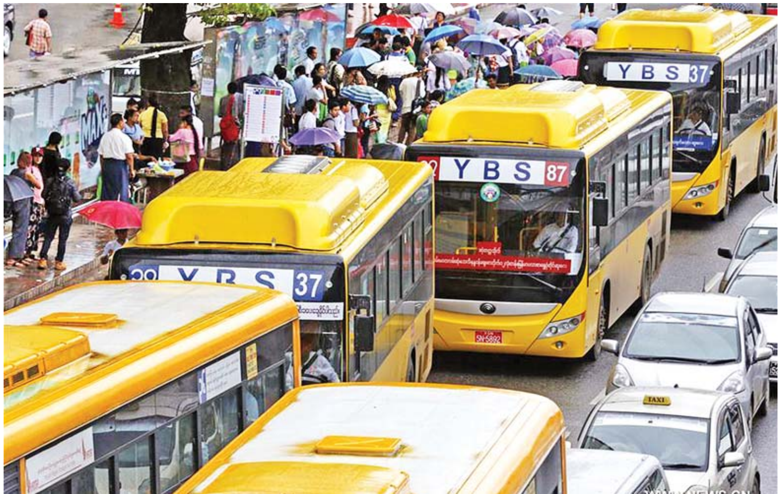
ရန်ကုန်တိုင်းဒေသကြီး သွားလာရေးတွင် လွယ်ကူအဆင်ပြေလျက်ရှိသည့် YBS ယာဉ်လိုင်းများကို တွေ့ရစဉ်။

ပြည်သူလူထုအတွက် သယ်ယူပို့ဆောင်ရေးကဏ္ဍက ပိုပြီးထိထိရောက်ရောက် ဆောင်ရွက်နိုင်မယ်လို့ ယုံကြည်ပါတယ်။ မေး။ ရန်ကုန်တိုင်းဒေသကြီး အတွင်း သောက်သုံးရေ ရရှိရေးအတွက် ဆောင်ရွက်မှုတွေကို ရှင်းပြပေးစေလိုပါတယ်။ ဖြေ။ သောက်သုံးရေကို လုံလုံလောက်လောက် မြို့ပြကို ဖြန့်ချိပေးနိုင်ဖို့အတွက် လိုအပ်ပါတယ်။ ကျွန်တော်တို့မှာ မြစ်ချောင်းတွေရှိပြီး မြစ်ရေကို စနစ်တကျ ထိန်းသိမ်းထားနိုင်ခြင်း မရှိပါဘူး။ ရန်ကုန်မြို့မှာ ပင်လယ်ဝမှာရှိတဲ့အတွက် ဆားငံရေရှိတာကြောင့် ရေကောင်းရေသန့် မရရှိတဲ့ နေရာတွေရှိပါတယ်။ ဒီနေရာတွေကို ရေပိုက်စနစ်နဲ့ သွယ်တန်းပြီး ရေပေးစေဖို့ မြို့တော်စည်ပင်သာယာဘက်က ဆောင်ရွက်ရမှာ ဖြစ်ပါတယ်။ ဒီနေရာမှာ အစိုးရကနေ စိုက်ထုတ်ပြီး ဆောင်ရွက်ပေးနေတယ်ဆိုတဲ့ အခြေအနေမျိုးနဲ့ ဖြတ်သန်းမယ်ဆိုရင် ရန်ကုန်တစ်မြို့လုံး ရေလုံလောက်စွာရရှိနိုင်ဖို့အတွက် အခက်အခဲရှိနိုင်ပါတယ်။ ဒီကဏ္ဍကို အစိုးရ၊ ပုဂ္ဂလိကနဲ့ ပြည်သူလူထု တစ်ရပ်လုံး ပူးပေါင်းပါဝင်ပြီး ပြုပြင်ပြောင်းလဲဆောင်ရွက်ဖို့ လိုပါတယ်။ ဒီလိုမှ မပြုပြင်၊ မပြောင်းလဲဘူးဆိုရင် ကြုံလာနိုင်တာက မြေအောက်ရေကို ထုတ်ယူသုံးစွဲနေတဲ့ အခက်အခဲကို ရင်ဆိုင်လာနိုင်ရဖွယ် ရှိပါတယ်။ မြေအောက်ရေကို ထုတ်ယူသုံးစွဲတဲ့ အတွက် မြေအောက်မှာ လျော့ကျသွားတဲ့ ရေနေရာကို ပင်လယ်ဆားငံရေတွေ ဝင်ရောက်လာတာမျိုးမဖြစ်ဖို့ ထိန်းရမယ့် အခြေအနေတစ်ခုဖြစ်ပါတယ်။