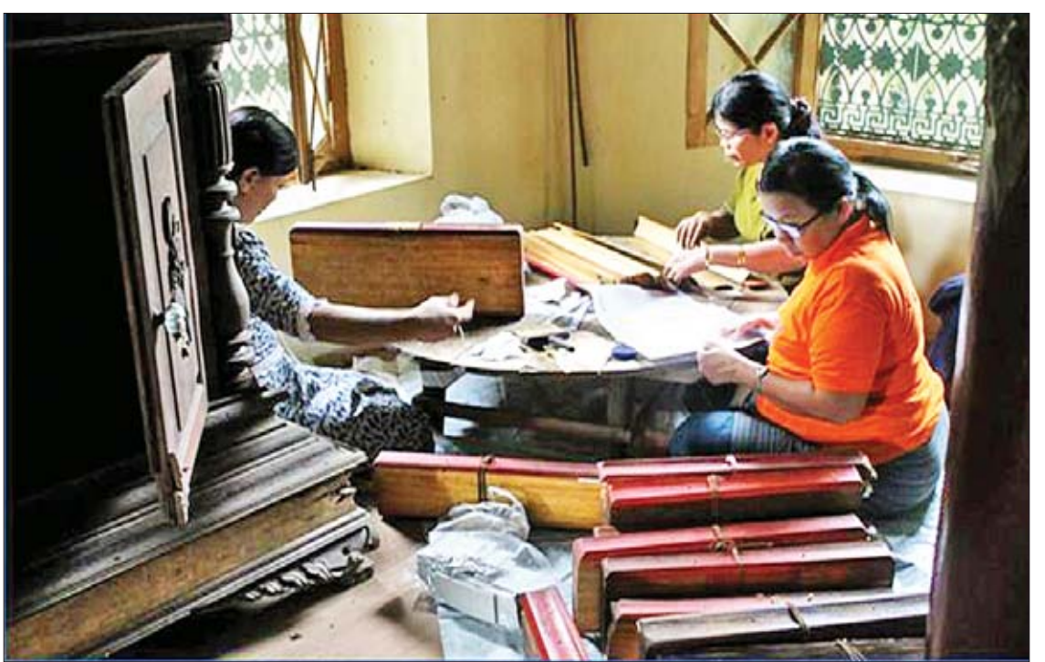
ဒြပ်ရိုး၊ ဒြပ်မဲ့ ယဉ်ကျေးမှုအမွေအနှစ်များနှင့်ပတ်သက်၍ ရှေးဟောင်းစာပေ၊ ပုရပိုက်များ စုဆောင်းထိန်းသိမ်းခြင်းလုပ်ငန်း ဆောင်ရွက်နေကြစဉ်။

ရခိုင်ပြည်နယ် မြောက်ဦးဒေသကို ယူနက်စကိုရဲ့ ကမ္ဘာ့ယဉ်ကျေးမှုအမွေအနှစ်