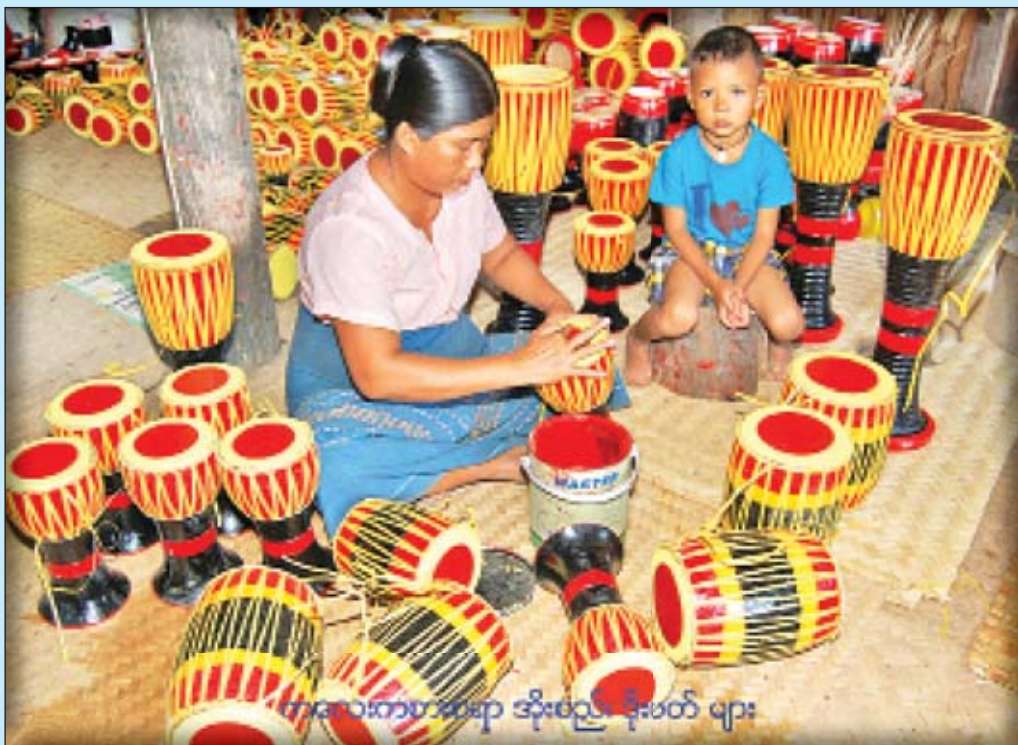
ကလေးကစားစရာ အိုးစည်၊ ဒိုးပတ် များ