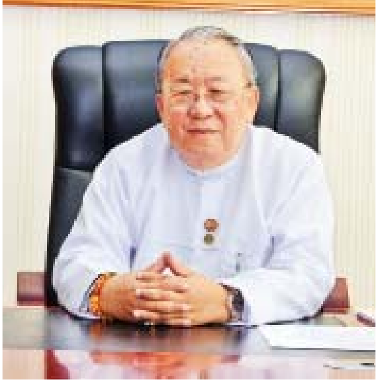
ဗဟိုဘဏ်ဥက္ကဋ္ဌ ဦးကျော်ကျော်မောင်

မြန်မာနိုင်ငံမှာ နိုင်ငံရဲတရားဝင်ငွေကြေး မြန်မာကျပ်ငွေကိုသာ အသုံးပြုစေချင်တဲ့အတွက် မြန်မာကျပ်ငွေပေးချေဖို့၊ မြန်မာကျပ်ငွေနဲ့သာ ဈေးနှုန်းသတ်မှတ်ဖို့အတွက် ၂၀၁၆ ခုနှစ်တွင် တစ်ကြိမ်အသိပေးခဲ့ပြီး ၂၀၁၈ ခုနှစ်မှာ ဝန်ကြီးဌာနတွေနဲ့ တိုင်းဒေသကြီး/ ပြည်နယ်အစိုးရတွေကို ထပ်မံအကြောင်းကြား အသိပေးခဲ့ပါတယ်။ ဗဟိုဘဏ်လက်အောက်မှာရှိတဲ့ အဖွဲ့အစည်းတွေကိုလည်း ညွှန်ကြားပေးဖို့ အကြောင်းကြား