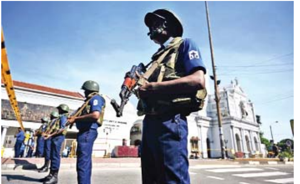
ဖြစ်သည်။ နိုင်ငံတွင် ဆယ်စုနှစ်တစ်ခုကျော်အတွင်း အဆိုးရွားဆုံး အေအက်မ်ပီ ယင်းအသေခံပုံးခွဲတိုက်ခိုက်မှုများသည် သီရိလင်္ကာ ဖြစ်သည်။

ကိုလံဘိုမြို့တွင် ဧပြီ ၂၁ ရက်က ဖြစ်ပွားခဲ့သည့် ပုံးခွဲတိုက်ခိုက်မှုများ၌ သေဆုံးသူအရေအတွက်သည် ဧပြီ ၂၂ ရက်တွင် ၂၉၀ အထိ မြင့်တက်သွားခဲ့ပြီး သေဆုံးသူများအနက် အများစုမှာ နိုင်ငံခြားသားများ