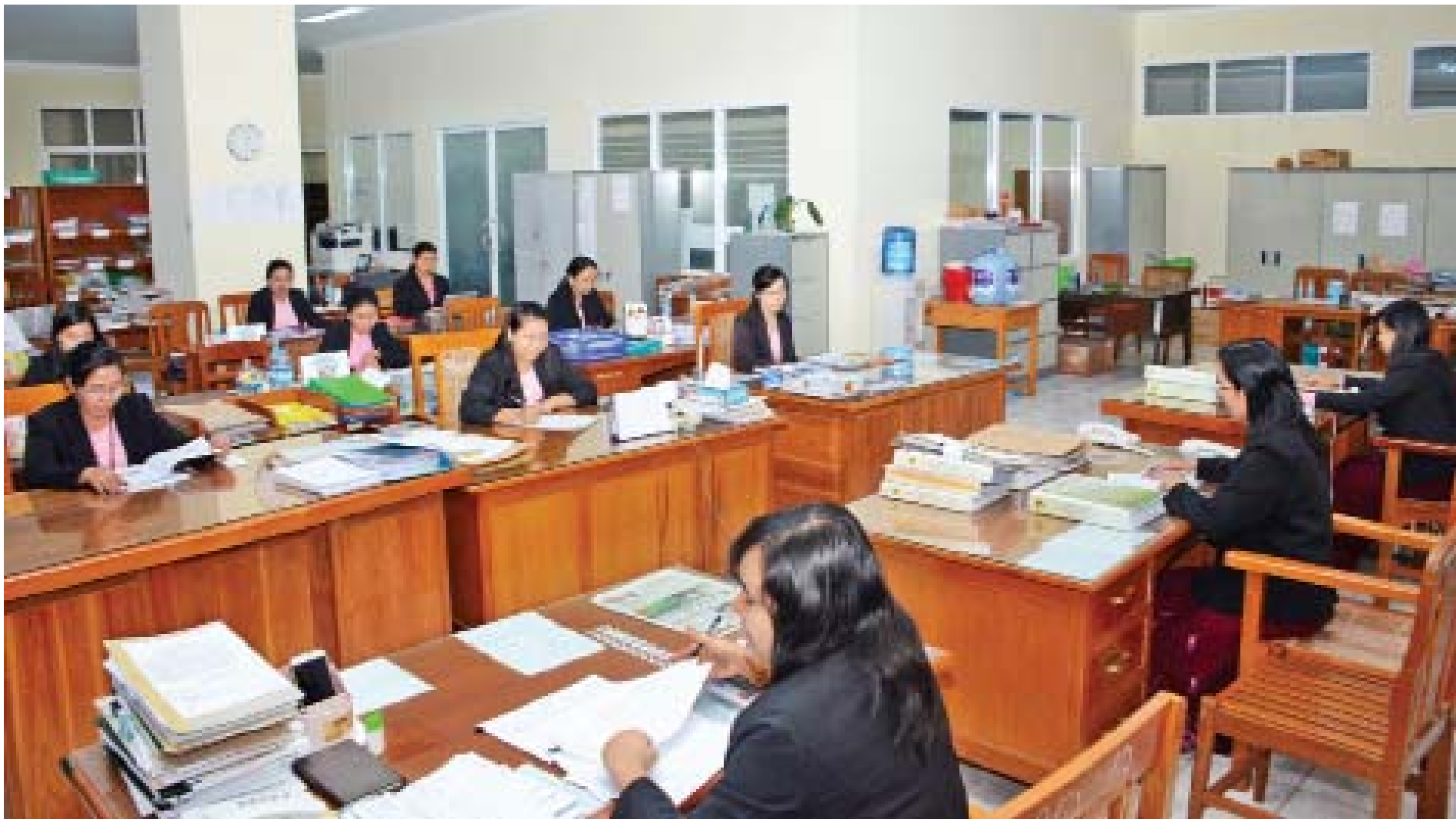
မြန်မာနိုင်ငံတော်ဗဟိုဘဏ်ဝန်ထမ်းများ လုပ်ငန်းဆောင်ရွက်နေကြစဉ်။