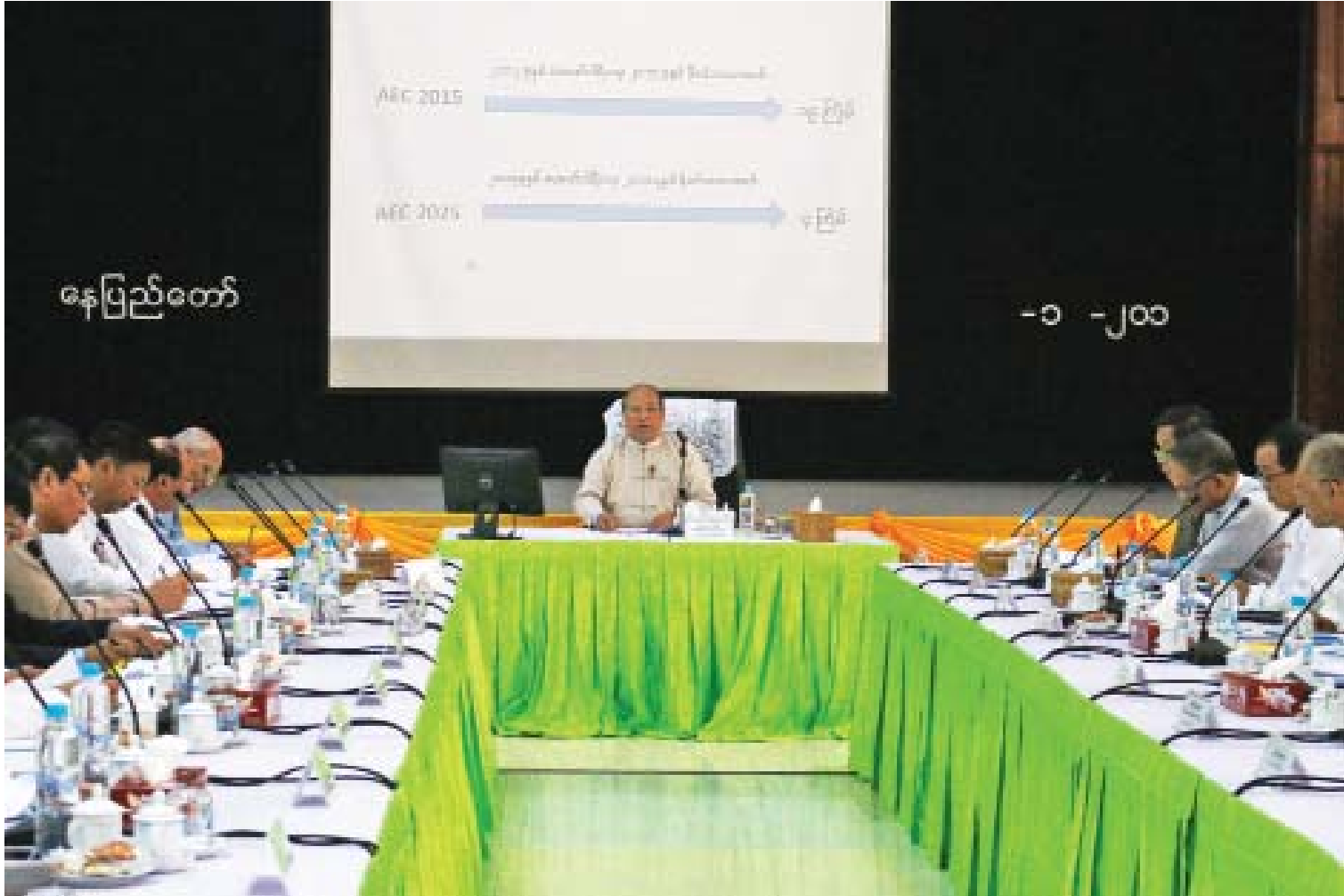
ပြည်ထောင်စုဝန်ကြီး ဦးသောင်းထွန်း အာဆီယံစီးပွားရေးအသိုက်အဝန်း အစည်းအဝေးတွင် အမှာစကားပြောကြားစဉ်။

“ကုမ္ပဏီမှတ်ပုံတင်ကို အွန်လိုင်းကနေ လုပ်ဆောင်နိုင်တာကြောင့် လုပ်ငန်းရှင်တွေ အနေနဲ့ ကုမ္ပဏီမှတ်ပုံတင်ခြင်းလုပ်ငန်းစဉ် အဆင့်ဆင့်ကို ရုံးလာစရာမလိုဘဲ ကိုယ့်ရဲ့ ရုံးခန်း၊ အိမ်ခန်းကနေပဲ အဆင်ပြေစွာ ဆောင်ရွက်နိုင်ပြီဖြစ်ပါတယ်။ အရင်က နှစ်တစ်နှစ်အတိုင်းအတာအရ ကုမ္ပဏီမှတ်ပုံတင်တဲ့ အရေအတွက်ဟာ ပျမ်းမျှ ၇၀၀၀ နဲ့ ၈၀၀၀ နီးပါး ရှိပါတယ်။ ယခုကုမ္ပဏီမှတ်ပုံတင် အွန်လိုင်းစနစ် စတင်ကျင့်သုံးတဲ့ ၂၀၁၈ ခုနှစ် ဩဂုတ်လ ၁ ရက်ကနေ ၂၀၁၉ ခုနှစ် ဖေဖော်ဝါရီလကုန်အထိ ခုနှစ်လတာကာလအတွင်းမှာ