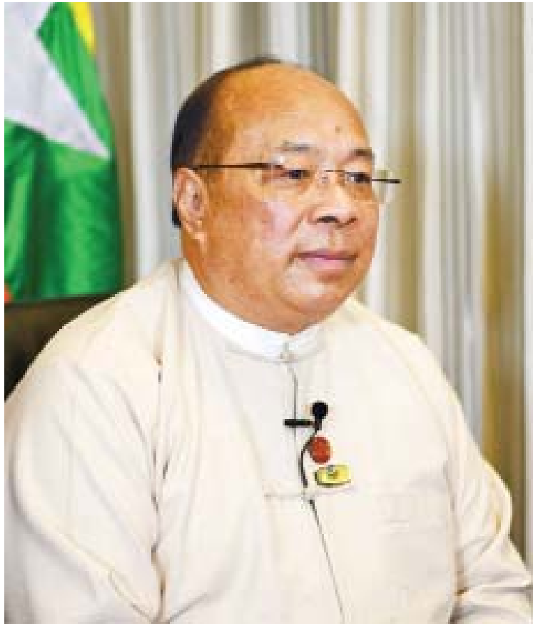
ပြည်ထောင်စုဝန်ကြီး ဦးသောင်းထွန်း။

ရင်းနှီးမြှုပ်နှံမှုနှင့် ကုမ္ပဏီများညွှန်ကြားမှုဦးစီးဌာနသည် ပြည်တွင်းပြည်ပ ရင်းနှီးမြှုပ်နှံမှုများ ပိုမိုတိုးတက်လာရန်