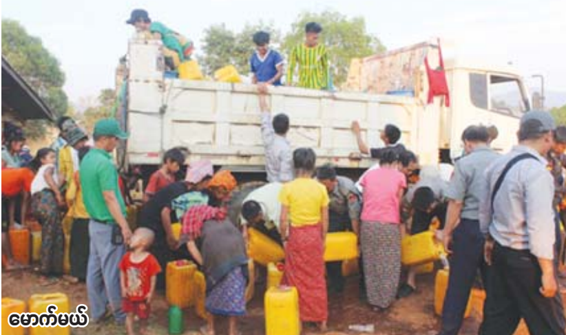
မောက်မယ်

စစ်ကိုင်းတိုင်းဒေသကြီး ဝက်လက်မြို့နယ်အတွင်း ရှိ သောက်သုံးရေခက်ခဲသော ကျေးရွာများဖြစ်