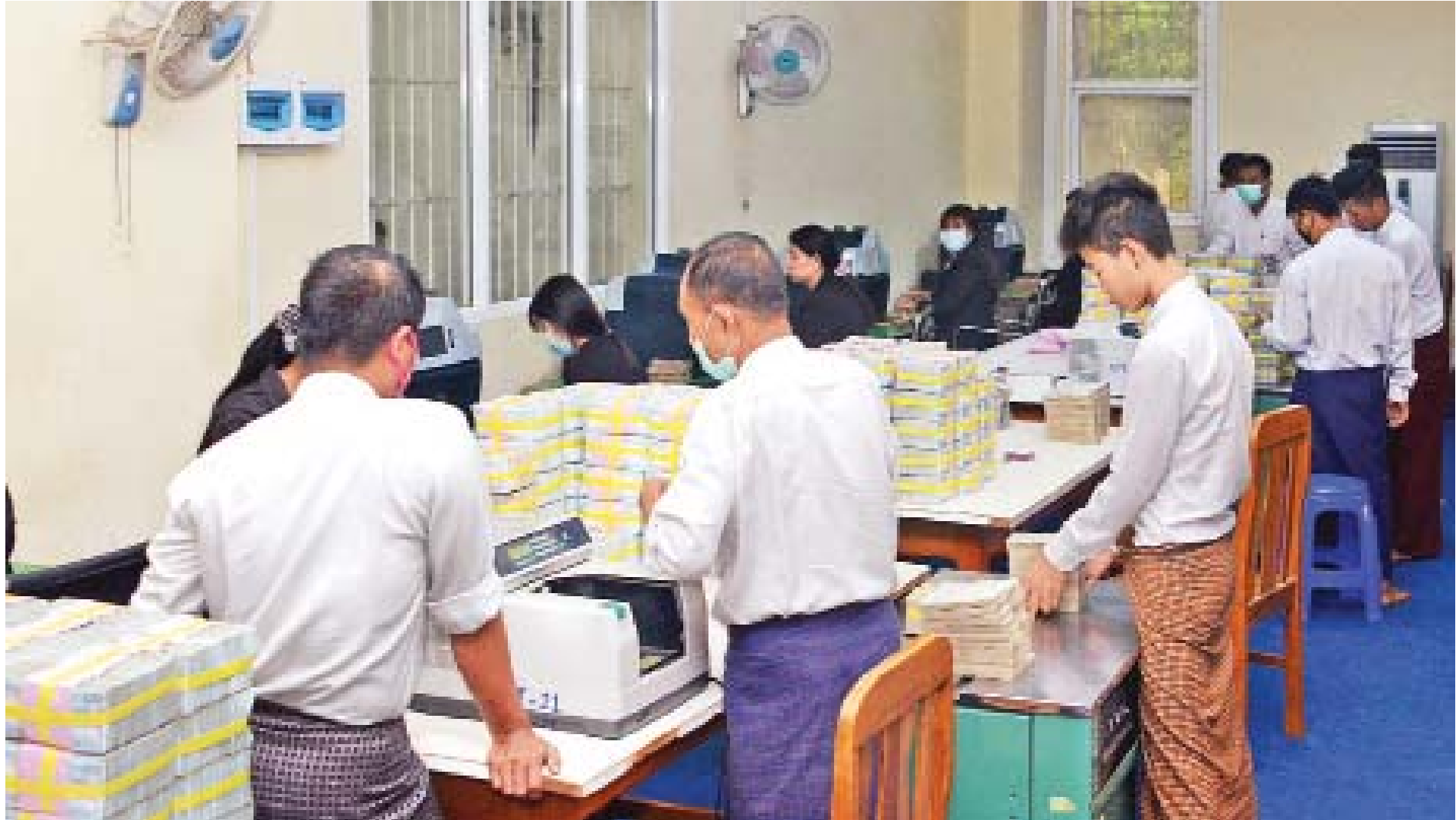
မြန်မာနိုင်ငံတော်ဗဟိုဘဏ်၌ ငွေများစစ်ဆေးရေးတွက်နေကြစဉ်။

မြန်မာနိုင်ငံတော်ဗဟိုဘဏ်အနေနဲ့ သီးခြားရပ်တည် တည်ရှိလာတဲ့ ၂၀၁၃ ခုနှစ် ကတည်းက ဘဏ်လုပ်ငန်းဖွံ့ဖြိုးတိုးတက်ရေးအတွက် ပိုမိုအလေးပေးပြီး ဆောင်ရွက်ခဲ့ပါ တယ်။ ယခုအခါ ပုဂ္ဂလိကဘဏ် ၂၇ ဘဏ်နဲ့ ဘဏ်ခွဲ ၁၈၀၀ ကျော်၊ နိုင်ငံခြားဘဏ်နဲ့ ဘဏ်ခွဲ ၁၃ ခု၊ ကိုယ်စားလှယ်ရုံး ၄၄ ခုရှိပါတယ်။ ဒီနှစ်အတွင်းမှာ နိုင်ငံခြားဘဏ်၊ ဘဏ်ခွဲနဲ့ လက်အောက်ခံဘဏ်(Subsidiaries)တွေ ခွင့်ပြုပေးဖို့စီစဉ်နေ