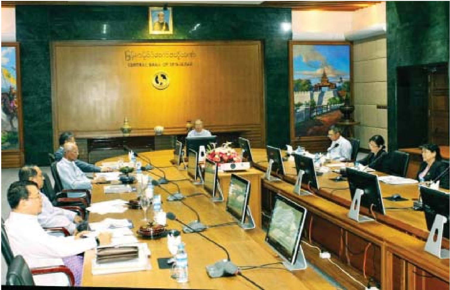
မြန်မာနိုင်ငံတော်ဗဟိုဘဏ် အစည်းအဝေးကျင်းပစဉ်။

ဗဟိုဘဏ်က နှစ်ချုပ်အစီရင်ခံစာကို ထုတ်ပြန်လျက်ရှိပြီး သုံးလတစ်ကြိမ် ငွေရေး ကြေးရေး စာရင်းအင်းအစီရင်ခံစာ (Quarterly Financial Statistics Bulletin)ကို ထုတ်ပြန်လျက်ရှိပါတယ်။ ငွေကြေးမူဝါဒ အစီရင်ခံစာ(Monetary Policy Report) ကို ထုတ်ပြန်ပါတယ်။ ဒီအစီရင်ခံစာတွေကို