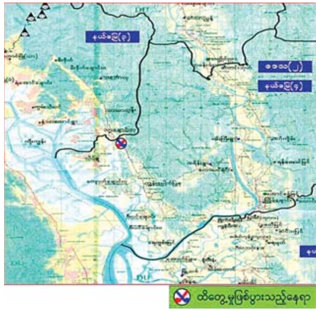
ထိတွေ့မှုဖြစ်ပွားသည့်နေရာ