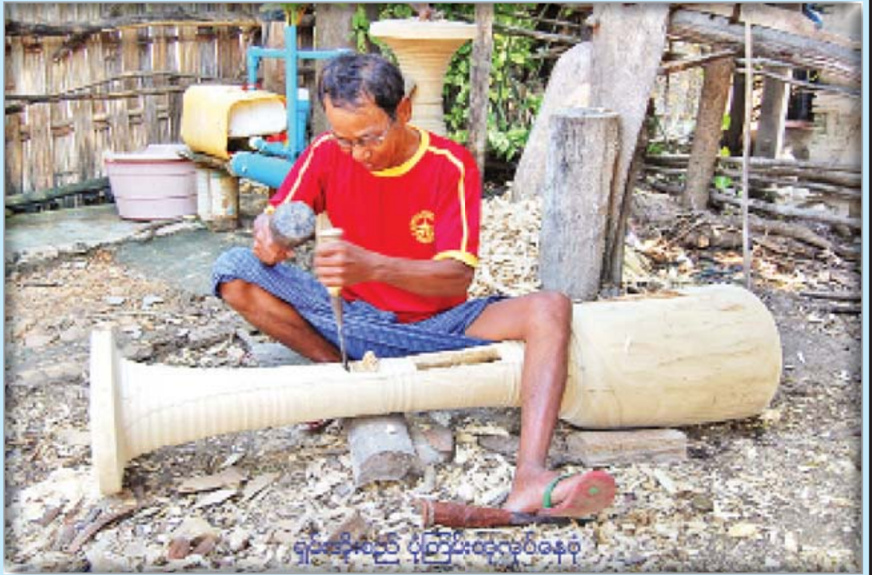
ရှမ်းအိုးစည် ပုံကြမ်းထုတ်လုပ်နေပုံ