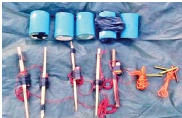
AA အဖွဲ့ထံမှ သိမ်းဆည်းရမိသော ဒေသန္တရလက်လုပ်မိုင်းများကို တွေ့ရစဉ်။