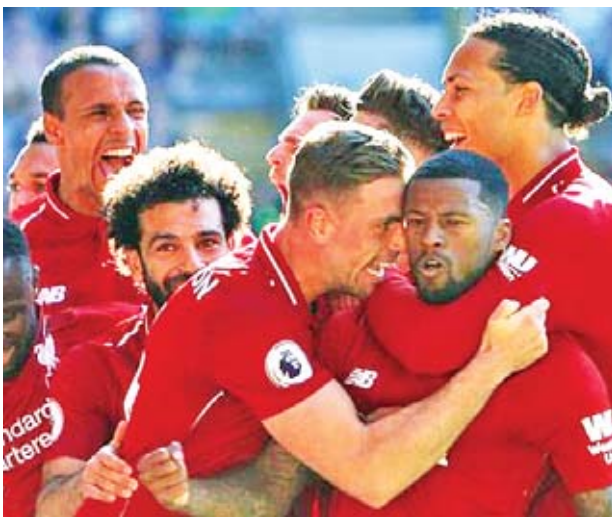
လီဗာပူးအသင်းအနေနဲ့ လက်ရှိ အသင်းထက် တစ်ပွဲပွဲကစားထားကာ ပွဲစဉ် ၃၅ အပြီးမှာ ရမှတ် ၈၈ မှတ် နှစ်မှတ်အသာနဲ့ အမှတ်ပေးဇယားကို အထိ ရယူစုဆောင်းနိုင်ခဲ့ပြီး မနစ်စီးတီး ဦးဆောင်နိုင်ခဲ့တာဖြစ်ပါတယ်။

လီဗာပူးအသင်းဟာ ပရီမီယာလိဂ် ပွဲစဉ် ၃၅ အဖြစ် ကာဒစ်စ်အသင်းနဲ့ ယှဉ်ပြိုင်ကစားခဲ့ရာမှာ နှစ်ရိုးပြတ်နဲ့ အနိုင်ရရှိခဲ့တာကြောင့် အမှတ်ပေး ဇယားကို ဦးဆောင်နိုင်ခဲ့ပါတယ်။ အဲဒီပွဲစဉ်မှာ လီဗာပူးအသင်း အတွက် သွင်းဂိုးတွေကို ပွဲကစားချိန် ၅၇ မိနစ်မှာ ဝစ်ဂျီနယ်လ်ဒမ်နဲ့ ၈၁ မိနစ်မှာ ပင်နယ်တီကနေ ဂျိမ်းစ်မီနာ တို့က သွင်းယူပေးခဲ့တာဖြစ်ပါတယ်။ လီဗာပူးအသင်းဟာ အခုပွဲစဉ် အနိုင်ရရှိခဲ့တာကြောင့် ပြိုင်ပွဲ အရပ်ရပ်မှာ ကိုးပွဲဆက်တိုက်နိုင်ပွဲ ရရှိသည့်စံချိန်တင်နိုင်ခဲ့ပြီး ၂၀၁၄ ခုနှစ်က နည်းပြဘရန်ဒန်ဂျော့ရှာ ကိုင်တွယ်ပြီးနောက်ပိုင်း နိုင်ပွဲဆက်မှု အရှည်ကြာဆုံးလည်း ဖြစ်ပါတယ်။