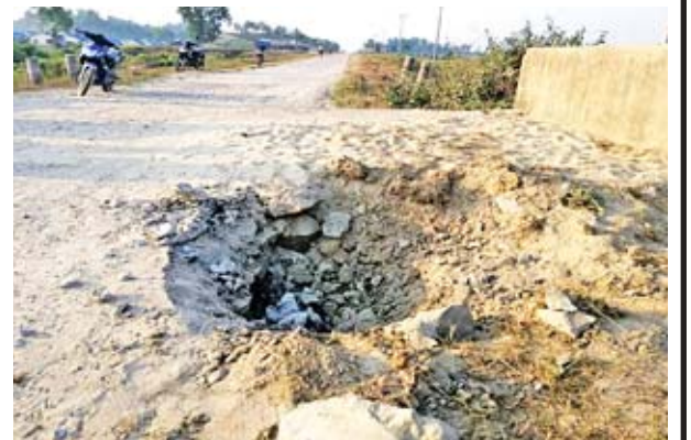
AA အဖွဲ့ ထောင်ထားသည့် မိုင်းပေါက်ကွဲသည့် နေရာအား တွေ့ရစဉ်။