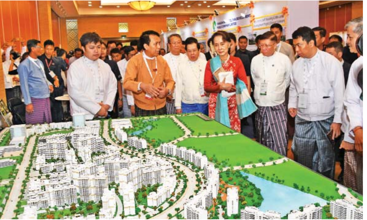
နိုင်ငံတော်၏အတိုင်ပင်ခံပုဂ္ဂိုလ် ဒေါ်အောင်ဆန်းစုကြည် Invest Myanmar Summit 2019 ဖွင့်ပွဲအခမ်းအနားတွင် ခင်းကျင်းပြသထားသည့် ရင်းနှီးမြှုပ်နှံမှု အခွင့်အလမ်းဆိုင်ရာ ပြခန်းကို ကြည့်ရှုအားပေးစဉ်။

ထိုကဲ့သို့ ရလဒ်ကောင်းများရရှိရန် နိုင်ငံခြားစီးပွားဆက်သွယ်ရေးဦးစီးဌာနအနေ ဖြင့် ကြိုးပမ်းဆောင်ရွက်လျက်ရှိသည်။ ထို ကဲ့သို့ ဆောင်ရွက်ရာတွင် ဦးစီးဌာနအနေဖြင့် မြန်မာနိုင်ငံ၏ လူမှုစီးပွားဖွံ့ဖြိုးတိုးတက်ရေး