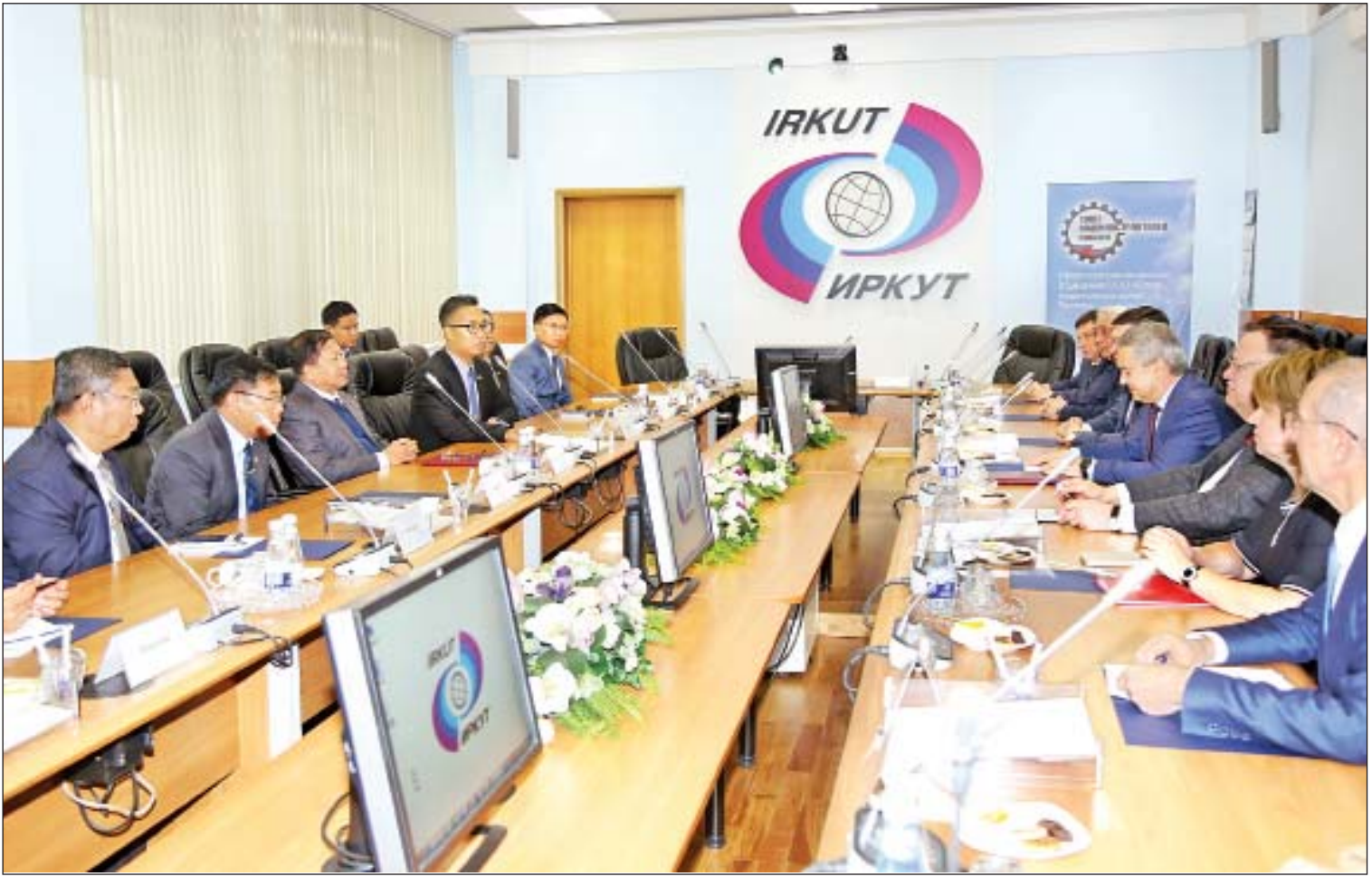
တပ်မတော်ကာကွယ်ရေးဦးစီးချုပ် ဗိုလ်ချုပ်မှူးကြီး မင်းအောင်လှိုင်နှင့် အဖွဲ့ဝင်များ Irkutsk Aviation Plant အစည်းအဝေးခန်းမ၌ တာဝန်ရှိသူများနှင့် တွေ့ဆုံဆွေးနွေးစဉ်။

နေပြည်တော် ဧပြီ ၂၂ ရုရှားဖက်ဒရေရှင်းနိုင်ငံ Irkutsk မြို့၌ ချစ်ကြည်ရေးခရီး ရောက်ရှိနေသည့် တပ်မတော်ကာကွယ်ရေးဦးစီးချုပ် ဗိုလ်ချုပ်မှူးကြီး မင်းအောင်လှိုင် ဦးဆောင်သော မြန်မာ့ တပ်မတော် ချစ်ကြည်ရေးကိုယ်စားလှယ်အဖွဲ့သည် ယနေ့ နံနက်ပိုင်းတွင် Irkutsk Aviation Plant ၌ လေယာဉ်များ ထုတ်လုပ်နေမှုအခြေအနေများကို သွားရောက်ကြည့်ရှု လေ့လာသည်။