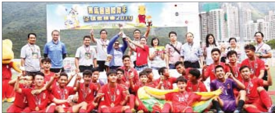
မြန်မာ ယူ-၁၈ အသင်းအား ဝိုင်းခွဲအပြီး တွေ့ရစဉ်။