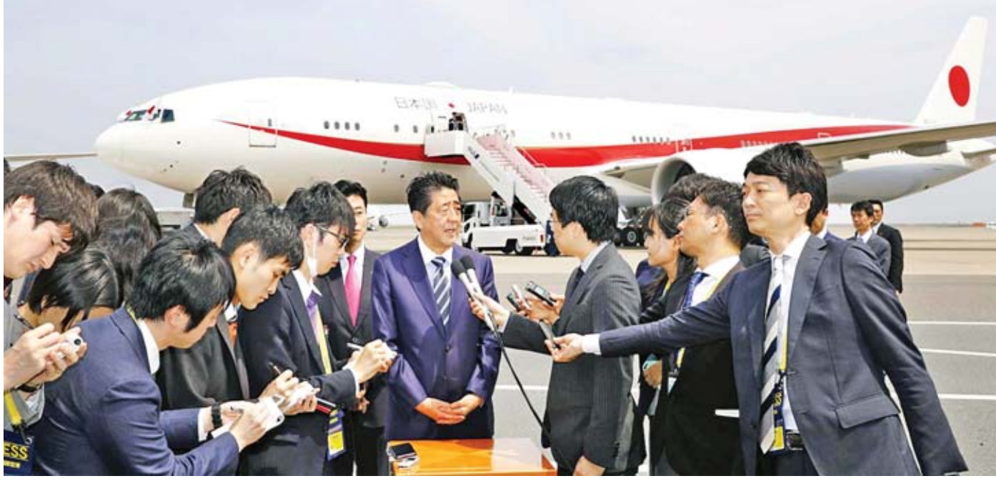
ဂျပန်ဝန်ကြီးချုပ် ရှင်ဇိုအာဘေး တိုကျိုမြို့ဟာနီဒါလေဆိပ်တွင် သတင်းထောက်များ၏ မေးမြန်းမှုများကို ဖြေကြားစဉ်။

ဂျပန်ဝန်ကြီးချုပ် ရှင်ဇိုအာဘေးသည် ယခုနှစ် ဂျီ-၂၀ ထိပ်သီးအစည်းအဝေးဥက္ကဋ္ဌအဖြစ် တာဝန်ထမ်းဆောင် ချိန်အတွင်း လွတ်လပ်သော ကုန်သွယ်မှုကဲ့သို့သော ကမ္ဘာ့ရေးရာကိစ္စရပ်များ ကိုင်တွယ်ဖြေရှင်းရာတွင် ထောက်ခံမှုရရှိရန် မျှော်လင့်ချက်ဖြင့် ရှစ်ရက်ကြာမည် ဥရောပနှင့် မြောက်အမေရိကခရီးစဉ်ကို ယနေ့စတင် လိုက်ပြီဖြစ်သည်။