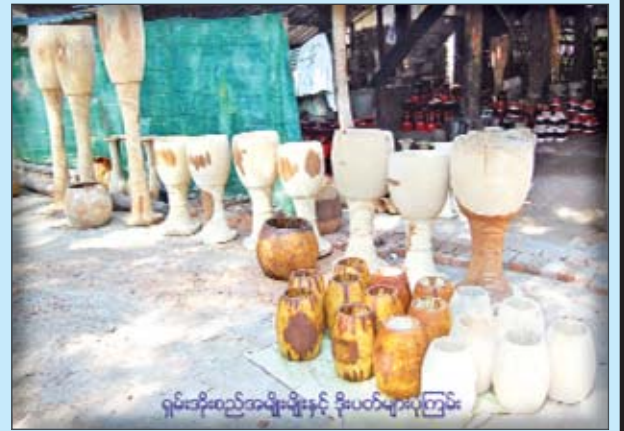
ရှမ်းအိုးစည်အမျိုးမျိုးနှင့် ဒိုးပတ်များပြကြမ်း