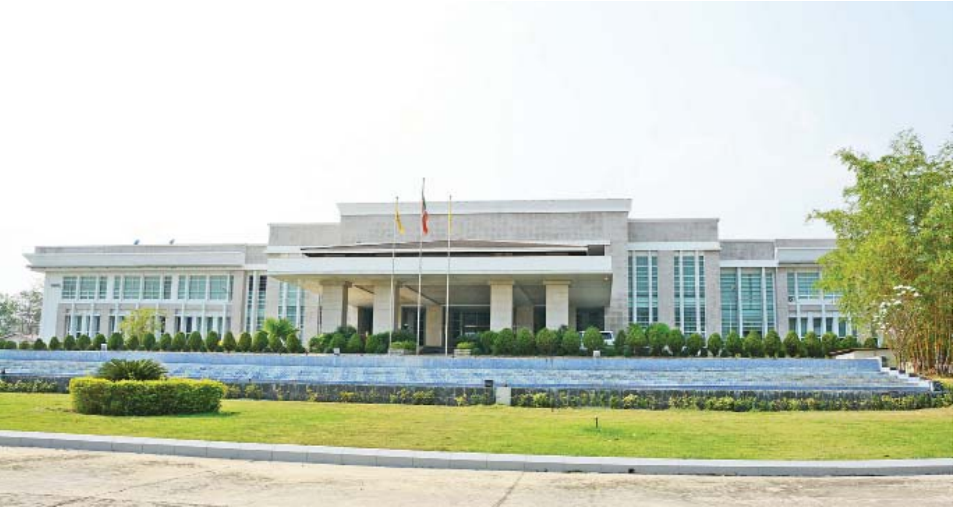
နေပြည်တော်ရှိ မြန်မာနိုင်ငံတော်ဗဟိုဘဏ်အဆောက်အအုံကို တွေ့ရစဉ်။

မြန်မာနိုင်ငံမှာ နိုင်ငံရဲတရားဝင်ငွေကြေး မြန်မာကျပ်ငွေကိုသာ အသုံးပြုစေချင်တဲ့အတွက် မြန်မာကျပ်ငွေပေးချေဖို့၊ မြန်မာကျပ်ငွေနဲ့သာ ဈေးနှုန်းသတ်မှတ်ဖို့အတွက် ၂၀၁၆ ခုနှစ်တွင် တစ်ကြိမ်အသိပေးခဲ့ပြီး ၂၀၁၈ ခုနှစ်မှာ ဝန်ကြီးဌာနတွေနဲ့ တိုင်းဒေသကြီး/ ပြည်နယ်အစိုးရတွေကို ထပ်မံအကြောင်းကြား အသိပေးခဲ့ပါတယ်။ ဗဟိုဘဏ်လက်အောက်မှာရှိတဲ့ အဖွဲ့အစည်းတွေကိုလည်း ညွှန်ကြားပေးဖို့ အကြောင်းကြား