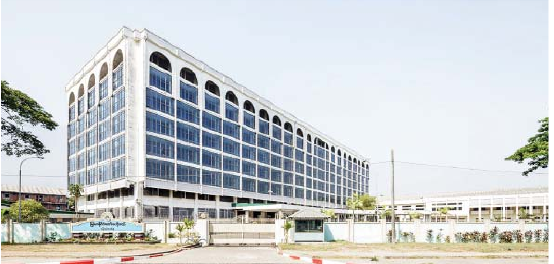
မြန်မာနိုင်ငံတော်ဗဟိုဘဏ် ရန်ကုန်ဘဏ်ခွဲကို တွေ့ရစဉ်။