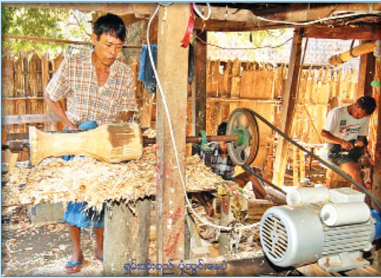
ရှမ်းအိုးစည် ပုံထွင်းနေပုံ