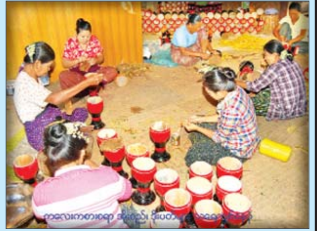
ကလေးကစားစရာ အိုးစည်၊ ဒိုးပတ်များထုတ်လုပ်နေပုံ