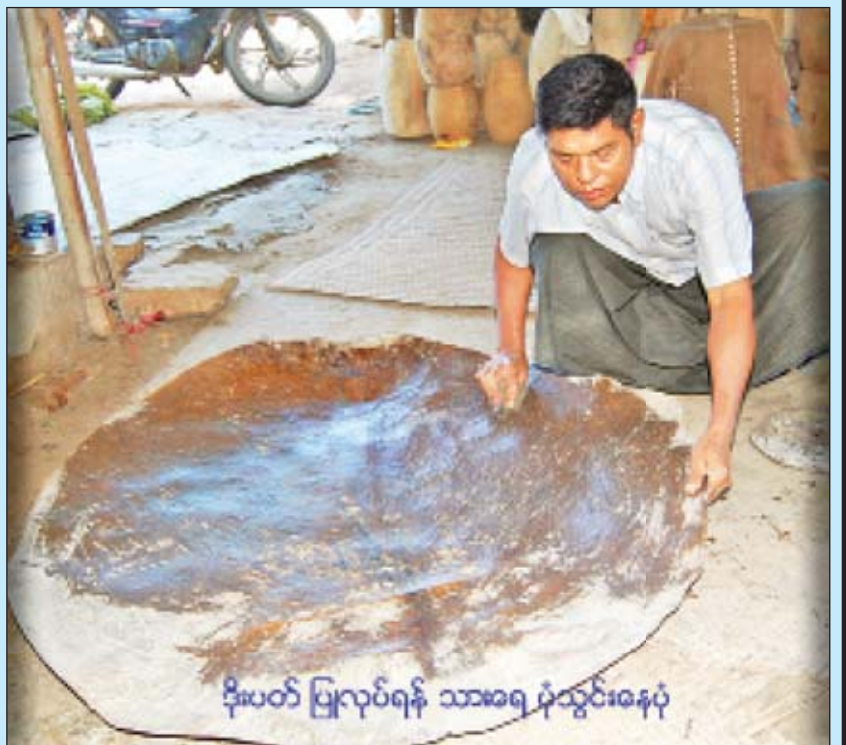
ဒိုးပတ် ပြုလုပ်ရန် သားရေ ပုံသွင်းနေပုံ