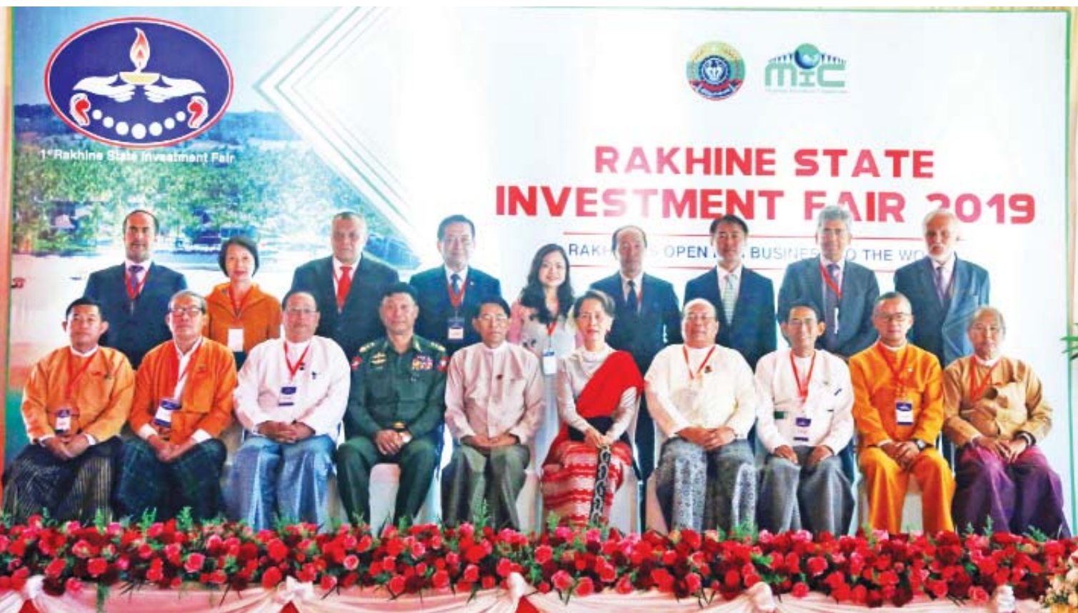
နိုင်ငံတော်၏အတိုင်ပင်ခံပုဂ္ဂိုလ် ဒေါ်အောင်ဆန်းစုကြည်၊ ပြည်ထောင်စုဝန်ကြီးများ၊ ပြည်နယ်/တိုင်းဒေသကြီး ဝန်ကြီးချုပ်များနှင့် သံအမတ်ကြီးများ ၂၂-၂-၂၀၁၉ ရက်က ကျင်းပသော ရခိုင်ပြည်နယ် ရင်းနှီးမြှုပ်နှံမှုပြပွဲ (၂၀၁၉) တွင် စုပေါင်းမှတ်တမ်းတင်ဓာတ်ပုံရိုက်ကြစဉ်။

“ရင်းနှီးမြှုပ်နှံမှုကဏ္ဍကို ပိုပြီးအားရုံစိုက်နိုင်အောင်၊ စူးစမ်းလေ့လာနိုင်အောင် ဝန်ကြီးဌာနအသစ် ဖွဲ့စည်းခဲ့တာဖြစ်ပါတယ်။ စတင်ဖွဲ့စည်းလိုက်တဲ့ ယခုနှစ်အတွင်းမှာ ရလဒ်ကောင်းတွေ ရရှိနေပြီဖြစ်ပါတယ်” ဟု ရင်းနှီးမြှုပ်နှံမှုနှင့် နိုင်ငံခြားစီးပွားဆက်သွယ်ရေး