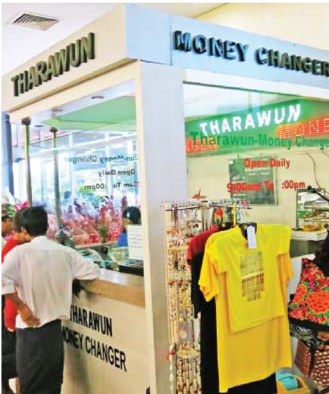
နိုင်ငံခြားငွေကြေးလဲလှယ်ရေးကောင်တာ တစ်ခုကို တွေ့ရစဉ်။