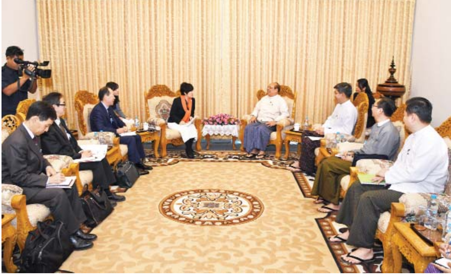
ပြည်ထောင်စုဝန်ကြီး ဦးသောင်းထွန်း၊ ဂျပန်နိုင်ငံခြားရေးဝန်ကြီးဌာန ဒုတိယဝန်ကြီးနှင့် တွေ့ဆုံစဉ်။

“ကမ္ဘာ့ဘဏ်က မြန်မာနိုင်ငံမှာ အဓိက အကူအညီပေးနေတဲ့ ကဏ္ဍတွေကတော့ ကျန်းမာရေး၊ ပညာရေး၊ လျှပ်စစ်၊ ကျေးလက် မီးလင်းရေး၊ စိုက်ပျိုးရေးနှင့် ဆက်သွယ်ရေး တို့ပဲ ဖြစ်ပါတယ်။ ကမ္ဘာ့ဘဏ်ကနေ ၂၀၁၈ နဲ့ ၂၀၁၉ ခုနှစ် (၂) နှစ်အတွက် အမေရိကန် ဒေါ်လာ ၁ ဒသမ ၁ ဘီလီယံကို သုံးစွဲဖို့ လျာထားသတ်မှတ်ထားတဲ့အတွက် ခုနက ပြောခဲ့တဲ့ ကဏ္ဍတွေမှာ ထိထိရောက်ရောက် အသုံးပြုနိုင်ဖို့ သက်ဆိုင်ရာဝန်ကြီးဌာနများနဲ့ ညှိနှိုင်းဆောင်ရွက်နေပြီ ဖြစ်ပါတယ်” ဟု ညွှန်ကြားရေးမှူးချုပ် ဦးသန်းအောင်ကျော်က