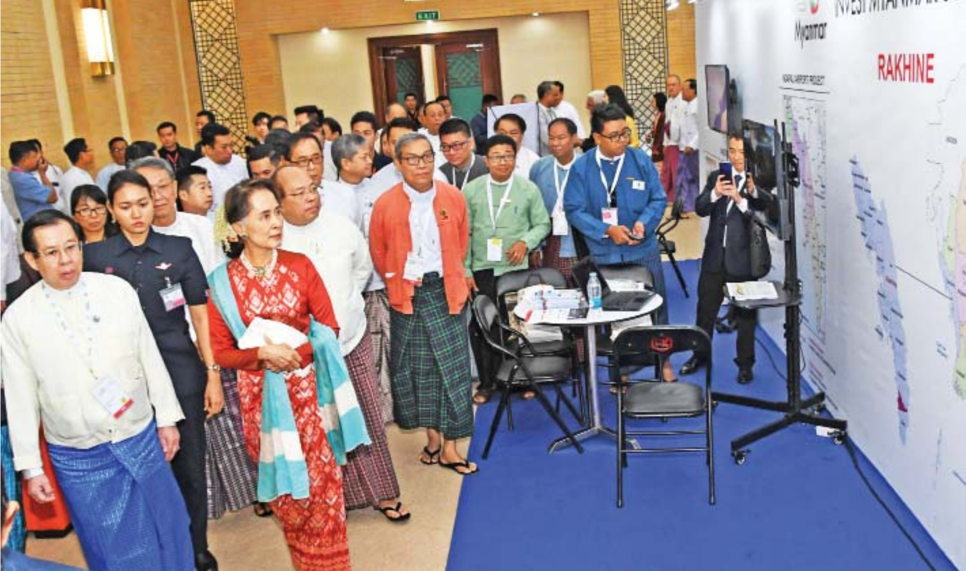
နိုင်ငံတော်၏အတိုင်ပင်ခံပုဂ္ဂိုလ် ဒေါ်အောင်ဆန်းစုကြည် Invest Myanmar Summit 2019 ဖွင့်ပွဲအခမ်းအနားတွင် ရခိုင်ပြည်နယ်၏ ရင်းနှီးမြှုပ်နှံမှုအခွင့်အလမ်းဆိုင်ရာပြခန်းကို ကြည့်ရှုအားပေးစဉ်။