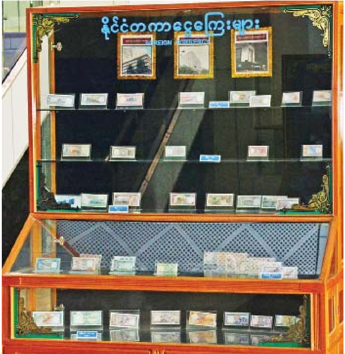
မြန်မာနိုင်ငံတော်ဗဟိုဘဏ်ရှိ နိုင်ငံတကာငွေကြေးများ ပြခန်းကို တွေ့ရစဉ်။

အဝယ်ပြုလုပ်ခြင်း (Open Market Operation) တို့ ဖြစ်ပါတယ်။ နိုင်ငံရဲ့ ဖွံ့ဖြိုးတိုးတက်မှုနဲ့ လိုက်လျောညီထွေဖြစ်တဲ့ ငွေကြေးမူဝါဒနည်းလမ်းအသစ်တွေကို အကောင်အထည်ဖော်နိုင်ရေးအတွက် နိုင်ငံတကာငွေကြေး ရန်ပုံငွေအဖွဲ့ (IMF) နဲ့ ညှိနှိုင်းပြီး အမြဲတမ်းသုံးသပ်လျက်ရှိပါတယ်။ အခုလို ဖြေကြားပေးတဲ့အတွက် ကျေးဇူးတင်ပါတယ်။ ။