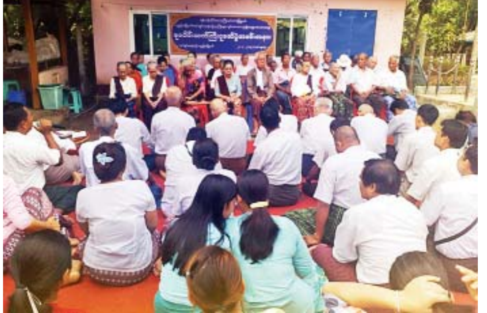
ဧပြီ ၂၁ ရက်က ရန်ကုန်တိုင်းဒေသကြီး မင်္ဂလာဒုံမြို့နယ် ရွှေနံသာကျေးရွာအုပ်စု ပတ္တမြားမြို့သစ် အုပ်ချုပ်ရေးမှူးရုံးခွဲ၌ အသက် ၈၀ နှင့်အထက် သက်ကြီးဘိုးဘွား ၉၆ ဦးအား လှူဖွယ်ပစ္စည်းများဖြင့် ပူဇော်ကန်တော့ကြစဉ်။

လိုက်လံဝေငှပေးခဲ့ကြသည်။ ယခုနှစ် နွေရာသီသည် ယခင်နှစ်များထက် အပူချိန် ပိုမိုလာသောကြောင့် မြို့နယ်အတွင်းရှိပြည်သူများ အပူ ဒဏ်အန္တရာယ်ကြောင့်ဖြစ်ပေါ်လာမည့် သတိထားရ မည့်အချက်များအား စန္ဒာ-သူရိယ ကျန်းမာပညာကူညီ ရေးအသင်းက ကျန်းမာရေးသတိပေးချက်လက်ကမ်းစာ စောင်များနှင့် ဓာတ်ဆားထုပ်များ၊ ရေသန့်ဘူးများကို ဝေငှပေးခြင်းဖြစ်ကြောင်း သိရသည်။ နိုင်ငံ-(ပြန်/ဆက်)