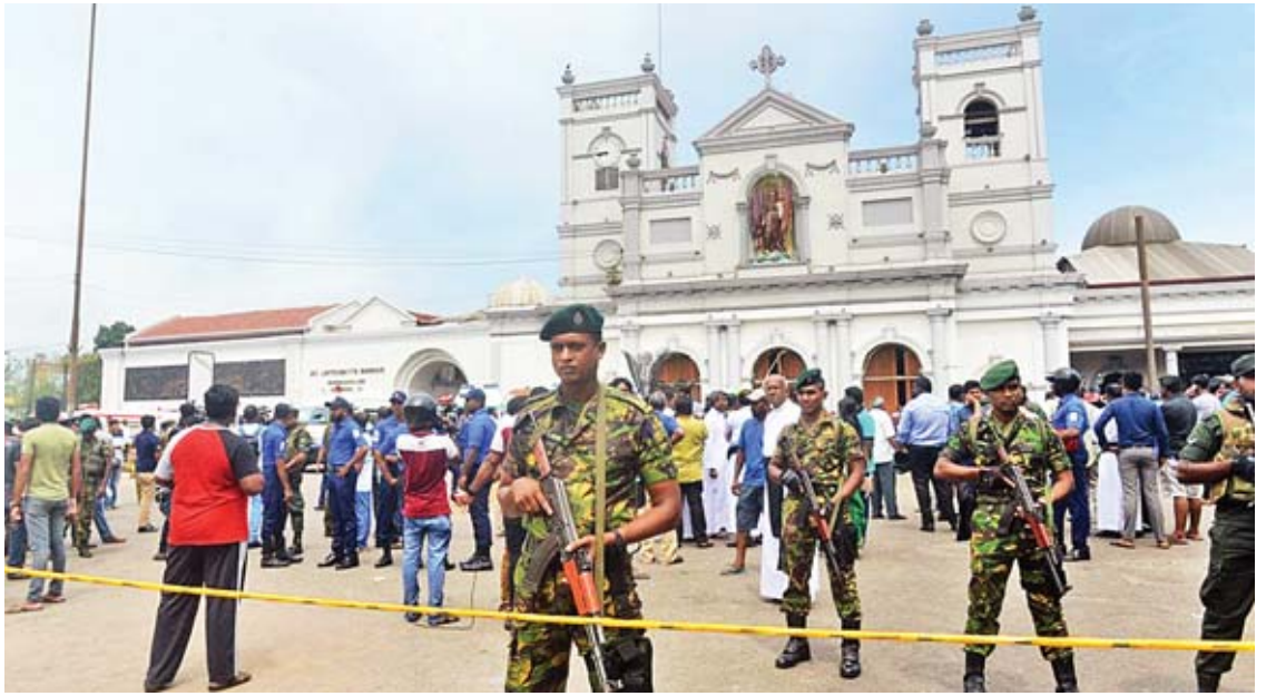
ထိရောက်စွာ ချမှတ်မည်ဖြစ်ပါကြောင်း သီရိလင်္ကာ အာဏာပိုင်များက တစ်ဝန်းတွင် ညမထွက်ရအမိန့် ထုတ်ပြန် ရုပ်သံလိုင်းတစ်ခုတွင် ပြောကြားခဲ့သည်။ ဖုံးခြောက်မှု ဖြစ်ပွားခဲ့ပြီးနောက် နိုင်ငံ ထားကြောင်း သိရသည်။ အေအက်ဗီ

ဖြစ်သည်။ မြို့တော်ကိုလံဘိုရှိ St. Anthony's Shrine ခရစ်ယာန်ဘုရားကျောင်း၊ တစ်ကျောင်းနှင့် the Kingsbury Colombo Sri Lanka၊ the Cinnamon Grand Colombo နှင့် the Shangri-La ဟိုတယ်သုံးလုံးတွင် အဆိုပါဖုံးခြောက် ပေါက်ကွဲခဲ့ကြောင်း သိရသည်။ ထို့ပြင် ဘတ်တီကာလိုရာမြို့ရှိ စိန်စီဘရန်းနှင့် ဇူရီယန် ခရစ်ယာန်ဘုရား ကျောင်းများတွင်လည်း ဖုံးခြောက်ခဲ့ကြောင်း သိရသည်။ ခရစ်ယာန်ဘုရားကျောင်းသုံးကျောင်း ၌ ခရစ်ယာန်ဘာသာဝင်များ ဘုရားဝတ်ပြု နေချိန်တွင် ဖုံးခြောက်ခဲ့ခြင်းဖြစ်သည်။ သီရိလင်္ကာ သမ္မတ မိုင်သရီပါလာ သီရိသေနက အဆိုပါဖုံးခြောက်မှုများသည် အကြမ်းဖက်သမားများ၏ လုပ်ရပ်ဖြစ်ကြောင်း နှင့် ပြစ်မှုကျူးလွန်သူများအား ပြစ်ဒဏ်