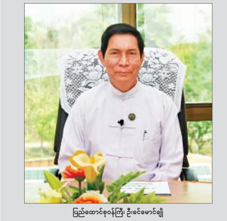
ပြည်ထောင်စုဝန်ကြီး ဦးခင်မောင်ချို

နိုင်ငံ၏ စက်မှုကဏ္ဍ ဖွံ့ဖြိုးတိုးတက်ရေးအတွက် မူဝါဒ(၄)ရပ်၊ ရည်မှန်းချက်(၂)ရပ်နှင့် လုပ်ငန်းစဉ်(၆)ရပ် ချမှတ်ပြီး ဝန်ကြီးရုံး၊ ဦးစီးဌာန ၂ ခု၊ စက်မှုလုပ်ငန်း ၄ ခုဖြင့် ၂၀၁၅ ခုနှစ် ဧပြီလ ၁ ရက်တွင် စက်မှုဝန်ကြီးဌာနကို ပြင်ဆင်ဖွဲ့စည်းခဲ့သည်။