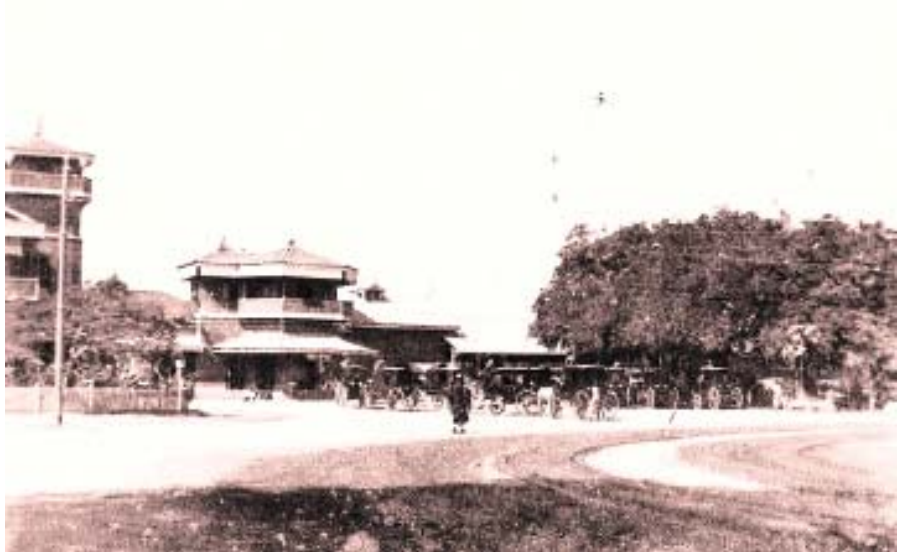
စစ်ကြီးမဖြစ်မီက မန္တလေးဘူတာ

နောက်တစ်ခုက မန္တလေးဆိုတာ မြန်မာအများစု နေထိုင်ရာမြို့ဖြစ်ခဲ့တယ်။ နောက်ဆုံးမင်းနေပြည်တော် ဖြစ်ခဲ့ဖူးတဲ့မြို့ဖြစ်တယ်။ မြန်မာ့စရိုက်၊ မြန်မာ့အနု ပညာ၊ မြန်မာ့ယဉ်ကျေးမှုသာမက မြန်မာ့နိုင်ငံရေး သမိုင်းဖြတ်ပိုင်းအတော်များများရဲ့ပုံရိပ်တွေ ထင်ဟပ် နေတဲ့မြို့ဖြစ်တယ်။ ဒီပုံရိပ်တွေဟာ မန္တလေးရဲ့လမ်းတွေ ပေါ်မှာထင်ဟပ်နေတာပေါ့။ ဒီအဆောက်အအုံက ဂျပန် တော်လှန်ရေးအတွက် အထက်ဗမာပြည် စစ်ရုံးစိုက်ပြီး ဗိုလ်မှူး၊ ဗဟူးရုံးထိုင်တဲ့ အဆောက်အအုံက အထက် ဗမာပြည် ဖ-ဆ-ပ-လ အဖွဲ့ချုပ်ရုံး။ ဒီကျောင်းက ဂျပန် ခေတ်ဆေးရုံကြီး။ ဒီအိမ်မှာ သခင်ဗဟိန်းနေခဲ့တာပေါ့။