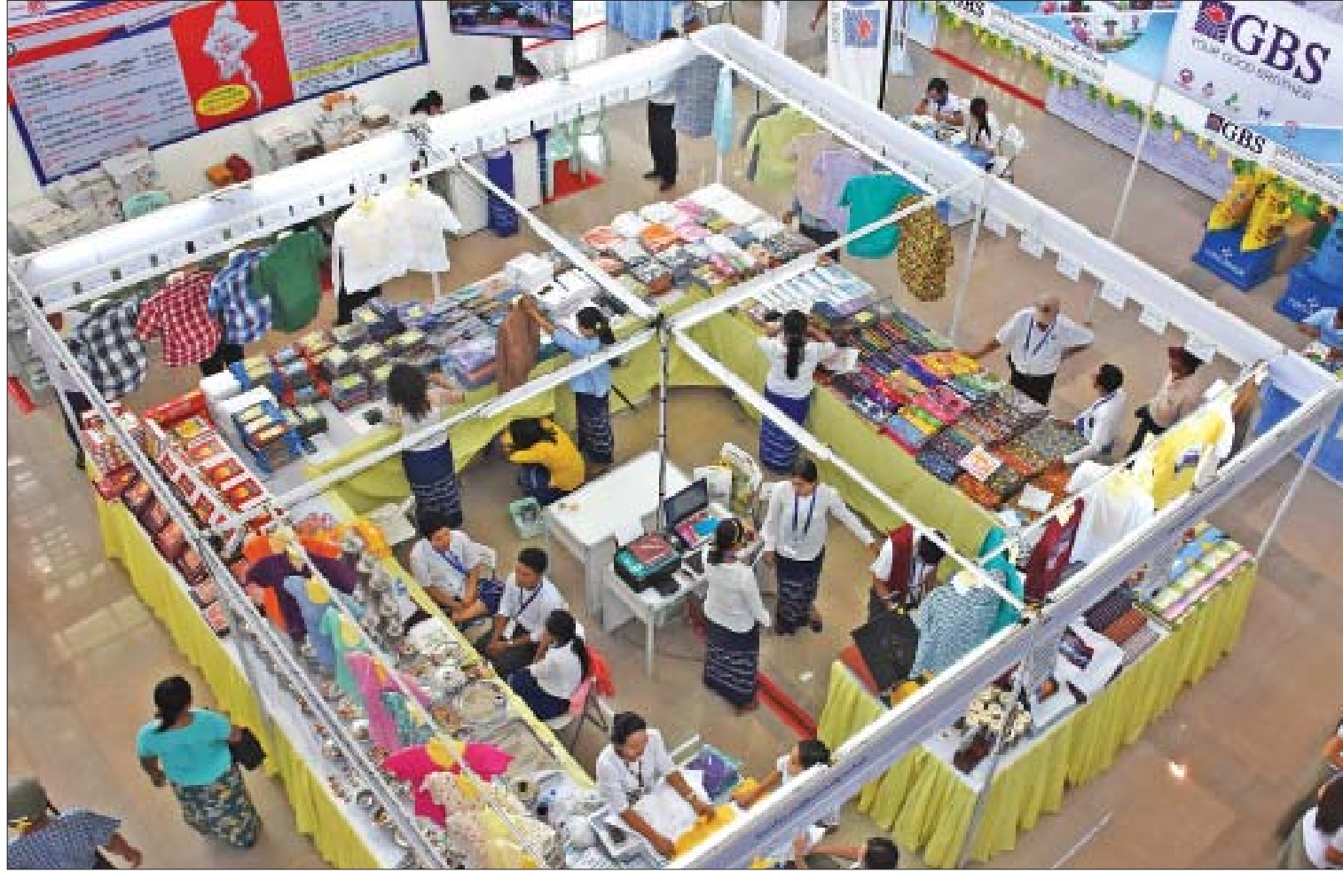
နိုင်ငံတော်အဆင့် MSMEs ထုတ်ကုန် ပြပွဲ၊ ပြိုင်ပွဲ (နေပြည်တော်) တွင် ခင်းကျင်းပြသထားသည့် ပြခန်းများကို တွေ့ရစဉ်။

နိုင်ငံတော်၏ စီးပွားရေးမူဝါဒများနှင့်အညီ စက်မှုဆိုင်ရာမူဝါဒများ ရေးဆွဲပြဋ္ဌာန်းနိုင်ရေးအတွက် တာဝန်ခံဆောင်ရွက်ခြင်း၊ စက်မှုဖွံ့ဖြိုးရေးမဟာဗျူဟာနှင့် စက်မှုဇုန်ဥပဒေများရေးဆွဲခြင်း၊ အသေးစားနှင့်အလတ်စား စီးပွားရေးလုပ်ငန်းများ ဖွံ့ဖြိုးတိုးတက်ရေးမူဝါဒ၊ ဥပဒေနှင့် နည်းဥပဒေများအရ အကောင်အထည်ဖော် ဆောင်ရွက်ခြင်း၊ စွမ်းအင်ခြုံငုံချွေတာရေးအတွက် မူဝါဒများ၊ လမ်းညွှန်ချက် (သို့မဟုတ်) ဥပဒေမူဘောင် ပေါ်ထွက်လာရန် ဆောင်ရွက်ခြင်း၊ စက်မှုဆိုင်ရာ လူ့စွမ်းအားအရင်းအမြစ်များ ဖွံ့ဖြိုးတိုးတက်ရေးအတွက် စက်မှုသင်တန်းကျောင်းများတွင် စက်မှုကျွမ်းကျင်လုပ်သားများကို လေ့ကျင့်သင်ကြား မွေးထုတ်ပေးခြင်းများကို ဆောင်ရွက်လျက်ရှိ