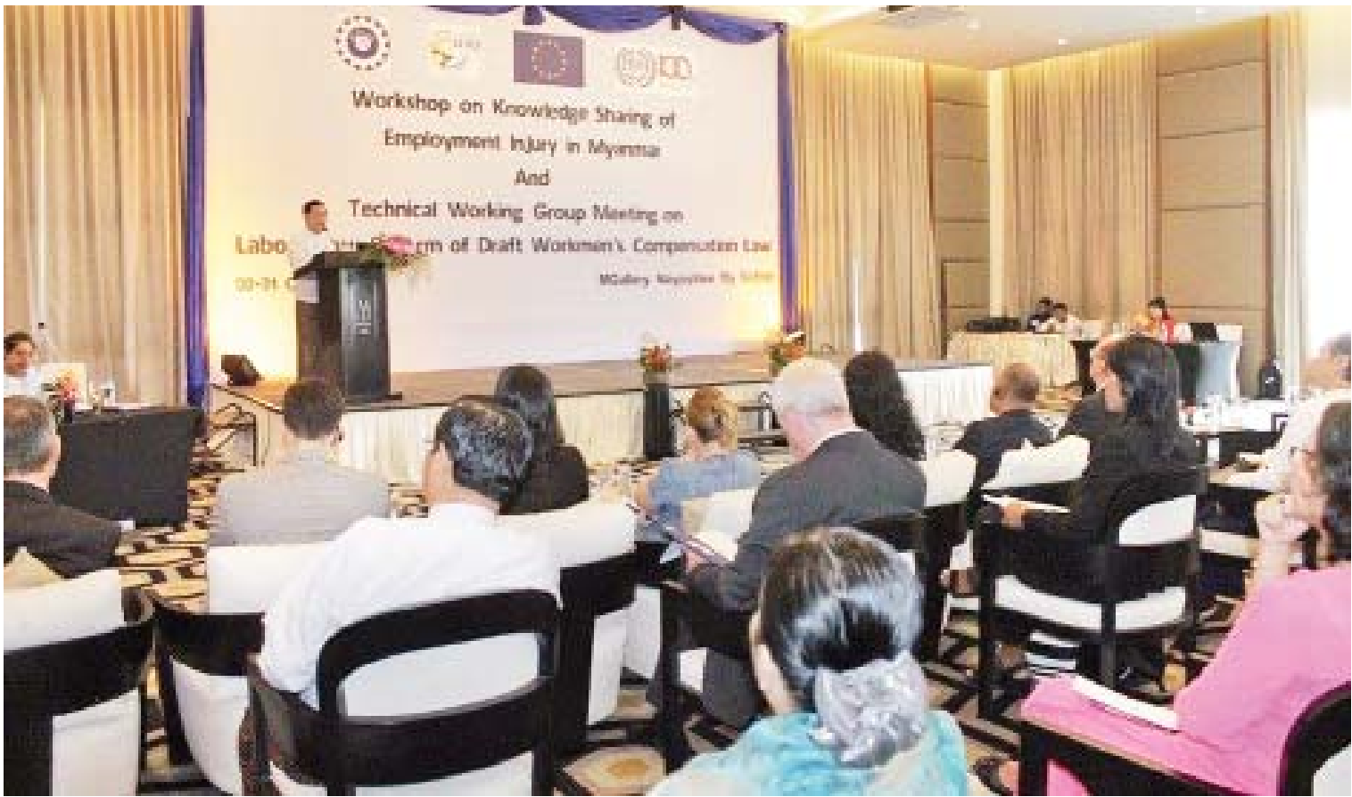
အလုပ်တွင်ထိခိုက်မှု အကျိုးခံစားခွင့် အာမခံစနစ်နှင့်ပတ်သက်၍ အသိပညာမျှဝေသည့် အလုပ်ရုံဆွေးနွေးပွဲ ကျင်းပစဉ်။

အစိုးရသက်တမ်းအတွင်း နိုင်ငံသားအဖြစ် ၂၈၅ ဦး၊ နိုင်ငံသားပြုခွင့်ရသူ ၃၅၂၉ ဦး၊ အသက် ၁၈ နှစ်အထက် သားသမီး နိုင်ငံသားပြုအဖြစ် ၁၈၈ ဦး၊ ၁၈ နှစ်အောက် သားသမီးနိုင်ငံသားပြုအဖြစ် ၁၀၄၆ ဦး၊ အသက် ၁၈ နှစ်အထက် ဧည့်နိုင်ငံသားအဖြစ် ၁၃ ဦး တို့ကို စိစစ်ခွင့်ပြုထားခဲ့ပြီး ဒေသအသီးသီးက သာသနာ့အဖွဲ့ဝင်စိစစ်ရေးကတ်ပြားအဖြစ် သာမဏေ ၁၇၅၄၅ ပါ၊ ရဟန်းအပါး ၃၇၆၆၀ နဲ့ သီလရှင်အပါး ၆၈၃၀ တို့ကိုလည်း စိစစ်ထုတ်ပေးခဲ့ကြောင်း လူဝင်မှုကြီးကြပ်ရေး