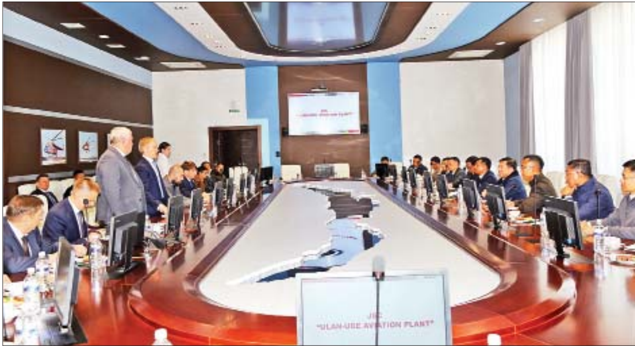
တပ်မတော်ကာကွယ်ရေးဦးစီးချုပ် ဝိုင်းချုပ်မှူးကြီး မင်းအောင်လှိုင်နှင့်အဖွဲ့ ULAN-UDE Aviation Plant ၏ တာဝန်ရှိသူများနှင့် တွေ့ဆုံစဉ်။