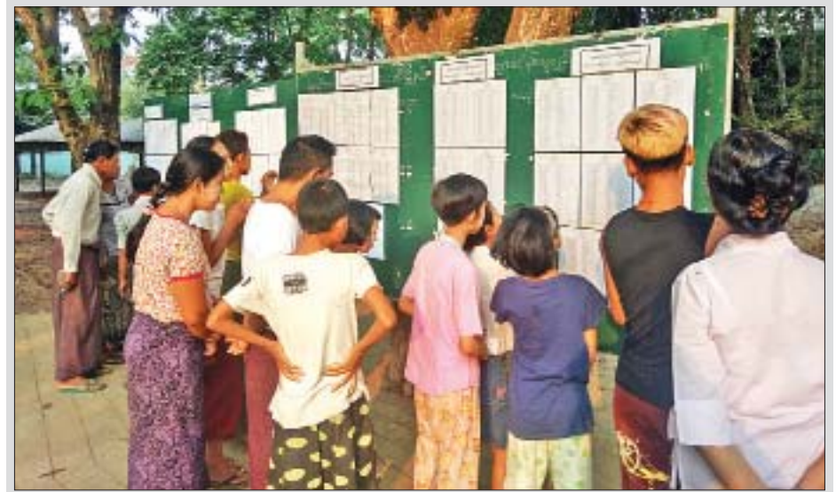
ပဲခူးတိုင်းဒေသကြီး ညောင်လေးပင်မြို့နယ်တွင် ဧပြီ ၂၁ ရက် နံနက်ပိုင်းက အခြေခံပညာကျောင်းများ၌ အောင်စာရင်း များ ထုတ်ပြန်ခဲ့ရာ အောင်စာရင်းကြည့်ရှုသူများကို တွေ့ရစဉ်။ နေလင်း(ညောင်လေးပင်)