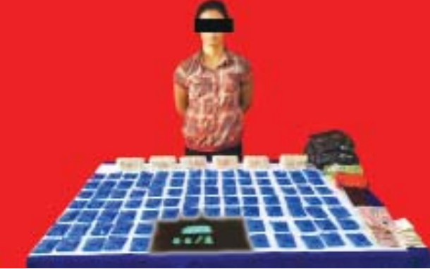
မအားမိန်း(ခ)မရန်အားမိန်းအား သိမ်းဆည်းရမိသည့် စိတ်ကြွေးသွပ်ဆေးပြား များနှင့်အတူ တွေ့ရစဉ်။

သည် မအားမိန်း(ခ)မရန်အားမိန်း၏ လွယ်အိတ်အတွင်းမှ စိတ်ကြွေးသွပ် ဆေးပြား ၁၈၀၀၀၊ ၎င်းအနီးရှိ