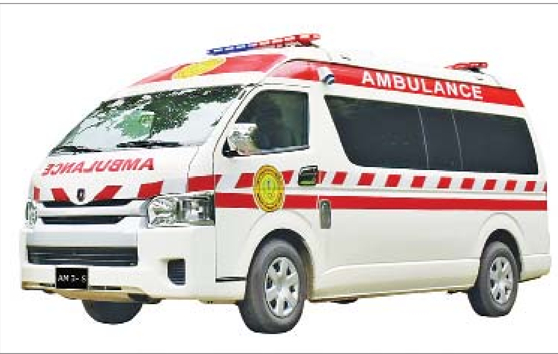
ဒီဇိုင်းအသစ်ဖြင့် ပြောင်းလဲထုတ်လုပ်မည့် Model AM3-S လူနာတင်ယာဉ်။

ဖွဲ့စည်းဆောင်ရွက် စက်မှုလယ်ယာကဏ္ဍသို့ ပြောင်းလဲဖော်