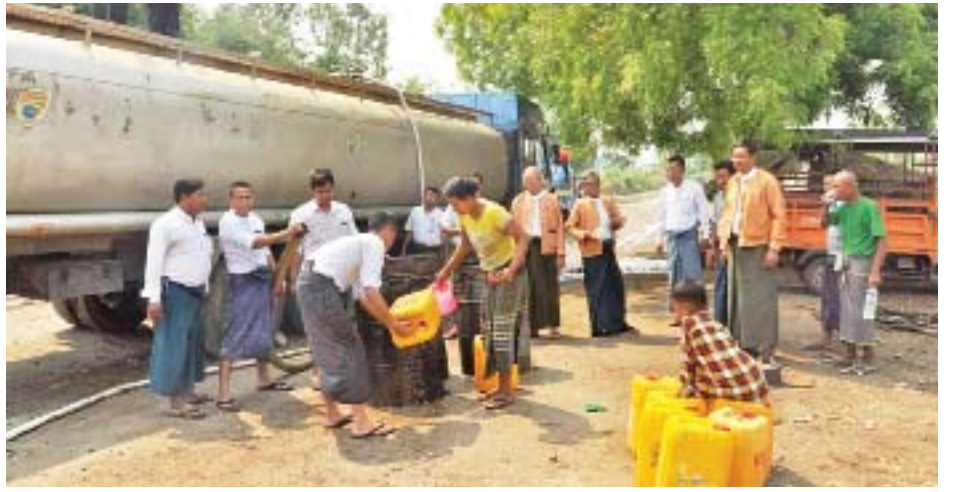
အနေဖြင့် အစီစီတွင်းရေကိုသာ အဓိကထား အသုံးပြု ရေခန်းခြောက်မှု ဖြစ်ပေါ်သဖြင့် နှစ်စဉ်သောက်သုံးရေ နေကြရသည်။ အဆိုပါ အစီစီတွင်းများမှာ နှေရာသီတွင် အခက်အခဲများ ဖြစ်ပေါ်လေ့ရှိကြောင်း သိရသည်။ ၀၀၂

လက်ရှိ သောက်သုံးရေအခက်အခဲ ဖြစ်ပေါ်နေသည့် စစ်ကိုင်းမြို့နယ် ရွာသာယာကျေးရွာမှာ အိမ်ခြေ ၁၀၃ အိမ်၊ လူဦးရေ ၃၄၃ ဦးရှိပြီး ကျေးရွာနေပြည်သူများ