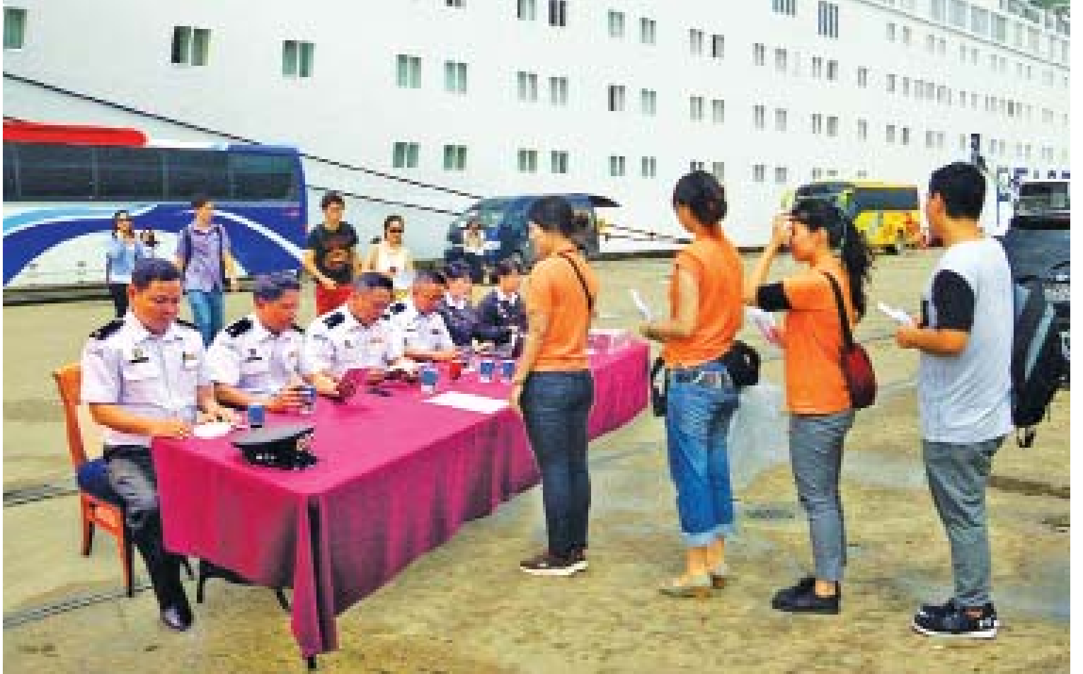
ပင်လယ်ကူးသင်္ဘောဖြင့် ပြည်ပသို့ ပြန်လည်ထွက်ခွာမည့် နိုင်ငံခြားသားများအား လူဝင်မှုကြီးကြပ်ရေးလုပ်ငန်းများ ဆောင်ရွက်ပေးစဉ်။

အဓမ္မခိုင်းစေမှု ပပျောက်ရေး နောက်ဆက်တွဲ နားလည်မှုစာချွန် လွှာ(SU)ကို မြန်မာအစိုးရနှင့် ILO တို့ ၂၀၀၇ ခုနှစ်မှ စတင် ၍ စမ်းသပ်ကာလ(၁)နှစ်စီ သက်တမ်းတိုး လက်မှတ်ရေးထိုး ၍ အဓမ္မခိုင်းစေမှုတိုင်ကြားချက် များကို ဖြေရှင်းဆောင်ရွက်လျက် ရှိရာ ၂၀၁၈ ခုနှစ် ဇန်နဝါရီလတွင် သက်တမ်းတိုးနိုင်ခဲ့ပြီး အဓမ္မခိုင်း စေမှုပပျောက်ရေး လုပ်ငန်း စီမံချက်(၂၀၁၈)ကို ၂၀၁၈ ခုနှစ် ဒီဇင်ဘာလအထိ အကောင် အထည်ဖော်ဆောင်ရွက်ခဲ့