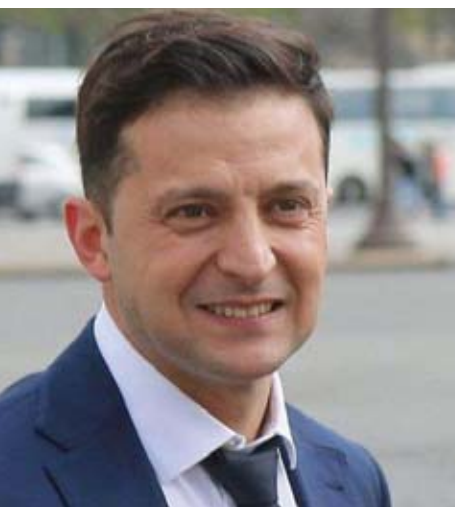
ရုပ်ရှင်သရုပ်ဆောင် ဝိုလီဒီမာ ဇီလန်စကီ