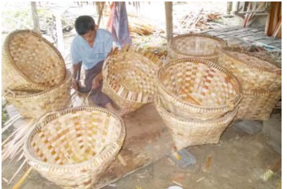
များ တစ်နှစ်ပတ်လုံးရက်လုပ်နိုင်ရန်အတွက် ငွေကျပ် သိန်း ၄၀ ကျော် ရင်းနှီးမြှုပ်နှံကာ ထန်းလျှော်များဝယ်ယူ စုဆောင်းထားကြရသည်။ အများအားဖြင့် တစ်ပိုင်တစ်နိုင် မိသားစုလုပ်ငန်းအဖြစ် လုပ်ကိုင်ကြပြီး လက်ခစားရက်သူ များလည်းရှိကြောင်း သိရသည်။ နေနဒီ (မြစ်ငယ်)

ထန်းလျှော်အစုံမှ အခြောက်အထိ အဆင့်ဆင့်ပြုလုပ်ကာ ရေစိမ်ခြင်း၊ ထန်းလျှော်သပ်ခြင်းများကို ပြုလုပ်ကြရသည်။ ထန်းလျှော်ကို အကြိမ်ကြိမ်နေလှန်းခြင်း၊ ရေစွတ်ခြင်းများ ပြုလုပ်ပြီးမှသာ ထန်းလျှော်တောင်း ရက်လုပ်ကြရသည်။ လက်ရှိကာလတွင် ဒေသအခေါ် တစ်တင်းခွဲဝင်တောင်းနှင့် သရက်သီးထည့်သည့်တောင်းမှာ အများဆုံးရက်လုပ် ရောင်းချလျက်ရှိသည်။ ထန်းလျှော်တောင်းဈေးကွက်မှာ ပြာသို၊ တပို့တွဲ၊ တပေါင်း၊ တန်ခူး၊ ကဆုန်လအထိ ငါးလသာဈေးကွက် ကောင်းပြီး ကျန်သည်လများတွင် ထန်းလျှော်တောင်းဈေး ကွက် ကျဆင်းသွားလေ့ရှိသည်။ လက်ရှိကာလ သရက်သီး ရာသီချိန်တွင် ထန်းလျှော်တောင်းဈေးကွက် ကောင်းမွန် နေသည့်အတွက် အားထားရက်လုပ်လျက်ရှိသည်။ လက်ရှိ ကာလတောင်းဈေးကွက်မှာ တစ်တင်းခွဲဝင် တောင်းတစ် တောင်းလျှင် ငွေကျပ် ၂၅၀၀ ဖြင့် ဖောက်သည် သွင်းကြရသည်။ တောင်းအကြီးအသေး လက်ရာပေါ်မူ တည်ကာ တောင်းတစ်လုံးလျှင် ငွေကျပ် ၃၀၀၀ ကျော် အထိ အမျိုးမျိုးရောင်းချကြရသည်။ ထန်းလျှော်တောင်း