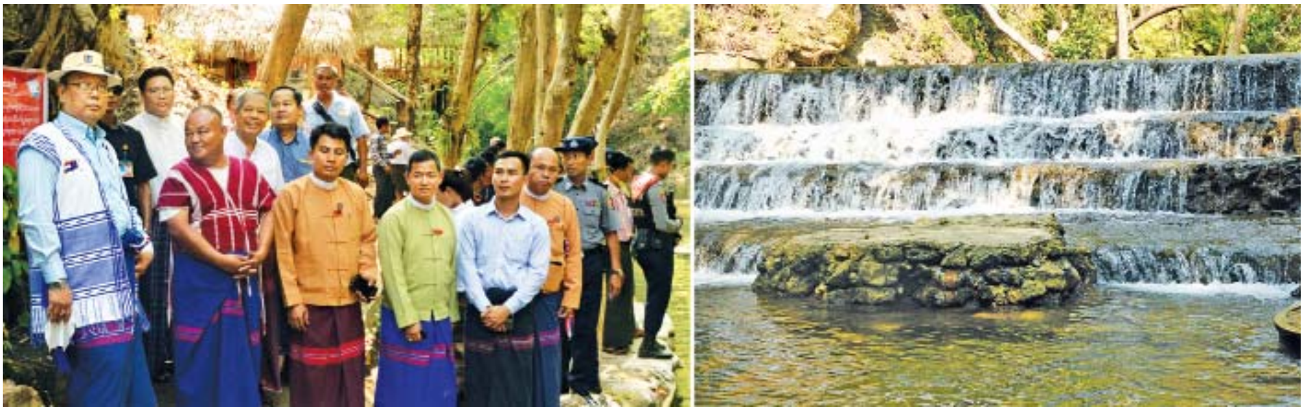
အမျိုးသားလွှတ်တော်ဥက္ကဋ္ဌ မန်းဝင်းခိုင်သန်း လေးကေ့ကော်မြို့သစ်အတွင်းရှိ လေးကပေါ် ရေတံခွန်အပန်းဖြေစခန်းတွင် လှည့်လည်ကြည့်ရှုစဉ်။