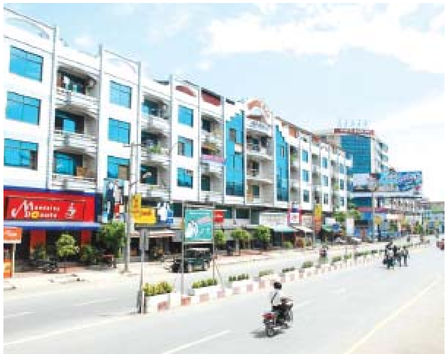
မြင်ကွင်းသစ်ဂုလမ်း

အဟောင်းတွေ သိစရာမလိုတော့ဘူး။ နောက် ဆုံးပေါ်အသစ်တွေသိရင်ပြီးတာပဲ။ ဒီလိုပြောလိုတော့ ရတာပေါ့။ ဒါပေမယ့် ဂလိုဘယ်လိုက်ဇေးရှင်းဆိုပြီး ကမ္ဘာ့မြေပုံထဲက ကိုယ့်တိုင်းပြည် ကိုယ့်နိုင်ငံ နယ် နိမိတ်မျဉ်းကြောင်းတွေကို ဘယ်နိုင်ငံဘယ်လူမျိုးကမှ ဖျက်ပစ်မှာမဟုတ်ပါဘူး။ ဂလိုဘယ်လိုက်ဇေးရှင်းတွင် တွင်အော်ပြီး မြေပုံနယ်နိမိတ်မျဉ်းကိုချဲ့ထွင်ဖို့ ကြိုး စားကြသူချည်းပါ။ အနည်းဆုံးကိုယ့်နယ်နိမိတ်မျဉ်း ကို ပိုမိုပြင်အောင်၊ ပိုထင်ရှားအောင် လုပ်ဆောင်ကြ မယ့်သူချည်းပဲ မဟုတ်ပါလား။ ဒါကြောင့် ကမ္ဘာ့မြေပုံပေါ်မှာ ကွင်းကွင်းကွက်ကွက် ထင်ထင်ရှားရှားရှိခဲ့၊ ရှိဆဲဖြစ်တဲ့ ပြည်ထောင်စုမြန်မာ နိုင်ငံတော် မြေပုံကိုကြည့်ကာ ‘ဒါတို့တိုင်းပြည်၊ ဒါတို့ မြေ’ လို့ ရင်ထဲအသည်းထဲက ခြွင်းချက်မရှိ သီဆို တစ်ကြွေးနိုင်ဖို့က သမိုင်းကိုသိရမယ်။ အစဉ်အလာ ကိုသိရမယ်။ ဇာတိကိုသိကြရပါမယ်။ ဒါမှ မအကြမှာ ပေါ့။