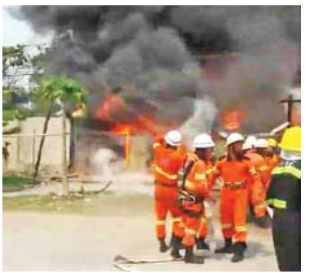
ပြည်ကြီးတံခွန်မြို့နယ်ရှိ ဖိနပ်ချုပ်လုပ်ငန်းအလုပ်ရုံ မီးလောင်မှုဖြစ်ပွား