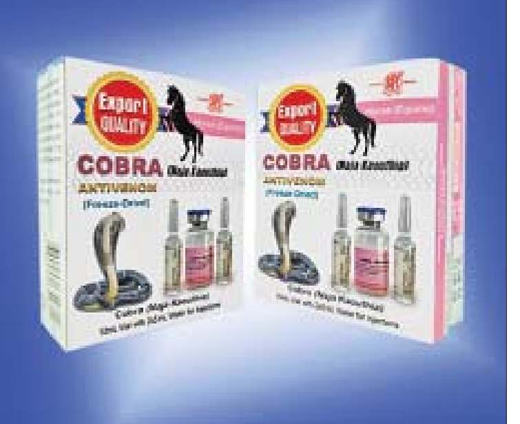
မြွေဆိပ်ဖြေဆေးများကို အေးခဲခြောက်စနစ်ဖြင့် ထုတ်လုပ်ထားမှုကို တွေ့ရစဉ်။