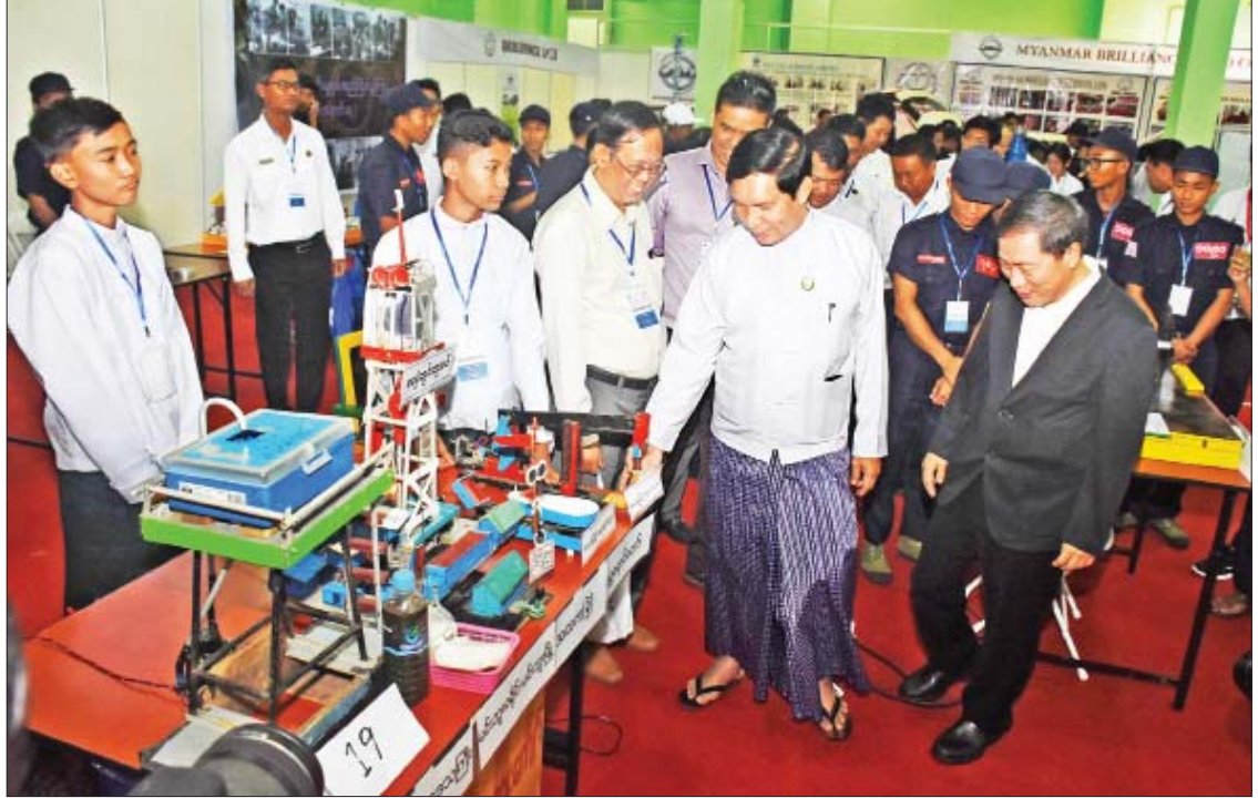
ပြည်ထောင်စုဝန်ကြီး ဦးခင်မောင်ချို (၆)ကြိမ်မြောက် နိုင်ငံတကာစက်မှုနည်းပညာပြပွဲ၊ တီထွင်စနစ်တိုးမှုစွမ်းရည်ပြိုင်ပွဲတွင် ခင်းကျင်းပြသထားသည့် စက်မှုထုတ်ကုန်ပစ္စည်းများကို လှည့်လည်ကြည့်ရှုစဉ်။

စက်မှုဝန်ကြီးဌာနမှ နိုင်ငံဝန်ထမ်းများ အတွက် ပြည်တွင်း၊ ပြည်ပ သင်တန်းများ စေလွှတ်ခြင်း၊ ဦးစီးဌာန၊ လုပ်ငန်းများအလိုက် ပြည်တွင်းသင်တန်း၊ Workshop နှင့် Seminar များ ဆောင်ရွက်ပေးခဲ့ခြင်း၊