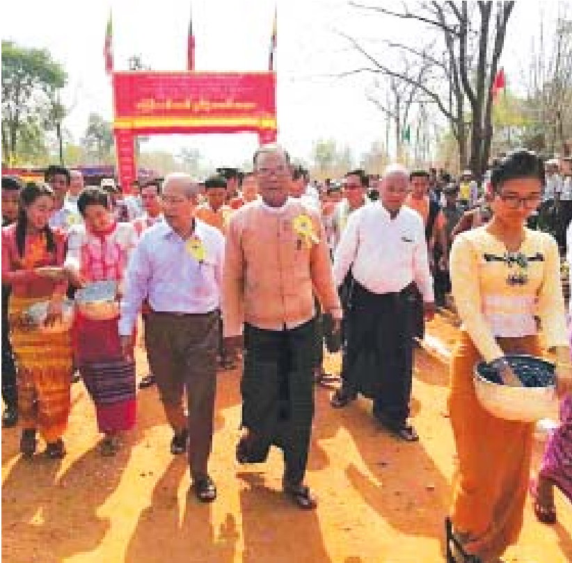
အဆိုပါ ကန်ကျော-ပေတောကုန်း-ရှမ်းတပ်ကြီး-ပုသိမ်-မုံရွာလမ်းအား တိုင်းဒေသကြီးအစိုးရ ရန်ပုံငွေကျပ် ၁၂၇ ဒသမ ၅ သန်းဖြင့် အကျယ် ၁၈ ပေ၊ အရှည် ၈ မိုင် ၄ ဖာလုံ မြေနီကျောက်စရစ် လမ်းခင်းခြင်းဆောင်ရွက်ပေးခဲ့ပြီး ပေတောကုန်းကျေးရွာအပါအဝင် ကျေးရွာပေါင်း ၁၅ ရွာမှ ဒေသခံပြည်သူများ ရာသီမရွေးသွားလာအသုံးပြုနိုင်မည် ဖြစ်ကြောင်းသိရသည်။ ဇာဇာ(အထက်မင်းလှ)

ဆက်လက်၍ လမ်းဖွင့်ပွဲကို တိုင်းဒေသကြီး ဝန်ကြီးချုပ် ဒေါက်တာအောင်မိုးညို၊ တိုင်းဒေသကြီး ဆောက်လုပ်ရေး၊ ပို့ဆောင်ဆက်သွယ်ရေးဝန်ကြီး ဦးတင်နွယ်ဦး၊ ပြည်သူ့လွှတ်တော်ကိုယ်စားလှယ် ဦးကျော်ကြီး၊ သရက်ခရိုင်အုပ်ချုပ်ရေးမှူး ဦးနေလင်း၊ ကျေးလက်လမ်းဦးစီးဌာန ညွှန်ကြားရေးမှူးချုပ် ဦးသိန်းစန်းလှိုင်တို့က ဖဲကြိုဖြတ် ဖွင့်လှစ်ပေးခဲ့သည်။