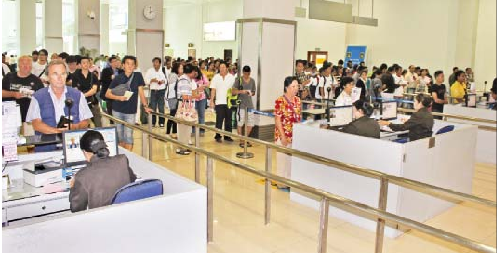
ရန်ကုန်အပြည်ပြည်ဆိုင်ရာလေဆိပ်၌ ပြည်ပခရီးသည်များအား လူဝင်မှုကြီးကြပ်ရေးဆိုင်ရာ စစ်ဆေးရေးလုပ်ငန်းများ ဆောင်ရွက်နေမှုကို တွေ့ရစဉ်။