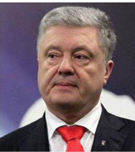
သမ္မတ ပတ်ထရီ ပိုရီရန်ကို