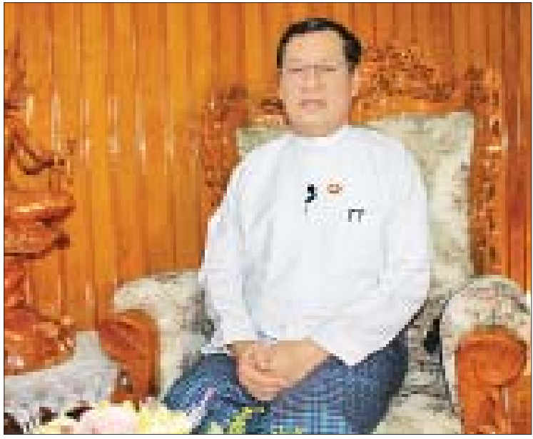
ပြည်ထောင်စုဝန်ကြီး ဦးသိန်းဆွေ

များ သွားရောက်အလုပ်လုပ်ကိုင်နိုင်ရေးအတွက် ပညာရေး၊ ကျန်းမာရေးနှင့် လူ့စွမ်းအားအရင်းအမြစ် ဖွံ့ဖြိုးတိုးတက်ရေး ကော်မတီ အစည်းအဝေးများမှတစ်ဆင့် သဘောတူညီပြုမှုများ လုပ်ဆောင်ပေးလျက် ရှိကြောင်း အလုပ်သမား၊ လူဝင်မှုကြီးကြပ်ရေးနှင့် ပြည်သူ့အင်အားဝန်ကြီးဌာနမှ သိရှိရသည်။ “ပြည်တွင်း အလုပ်အကိုင်ပေးနိုင်တဲ့ ပမာဏဆိုရင် ၂၀၁၈ ခုနှစ် ဧပြီ ၁ ရက်က နေ့ ၂၀၁၉ ခုနှစ် ဖေဖော်ဝါရီ ၂၈ ရက်အထိ အစိုးရဌာနဆိုင်ရာတွေမှာ အလုပ်အကိုင်အခွင့်အလမ်း ၉၀၅၄ ခု၊ ပုဂ္ဂလိကကဏ္ဍမှာ ၂၄၆၇၉၁ ခုအထိ ပေးနိုင်ခဲ့ပါတယ်။ ပြည်ပအလုပ်အကိုင်ခန့်အပ်ပေးနိုင်မှုအနေအထားက ပြည်ပအလုပ်အကိုင်ဆိုင်ရာ ဥပဒေအရ ပြည်ပအလုပ်အကိုင် အကျိုးဆောင်လိုင်စင်ရ အေဂျင်စီ ၂၆၉ ခုကနေတစ်ဆင့် ပြည်ပနိုင်ငံပေါင်းကိုးနိုင်ငံကို အထောက်အထားပြည့်စုံစွာ နဲ့အလုပ်သမား ၂၅၁၆၂၂ ဦး စေလွှတ်ပေးနိုင်ခဲ့ပါ