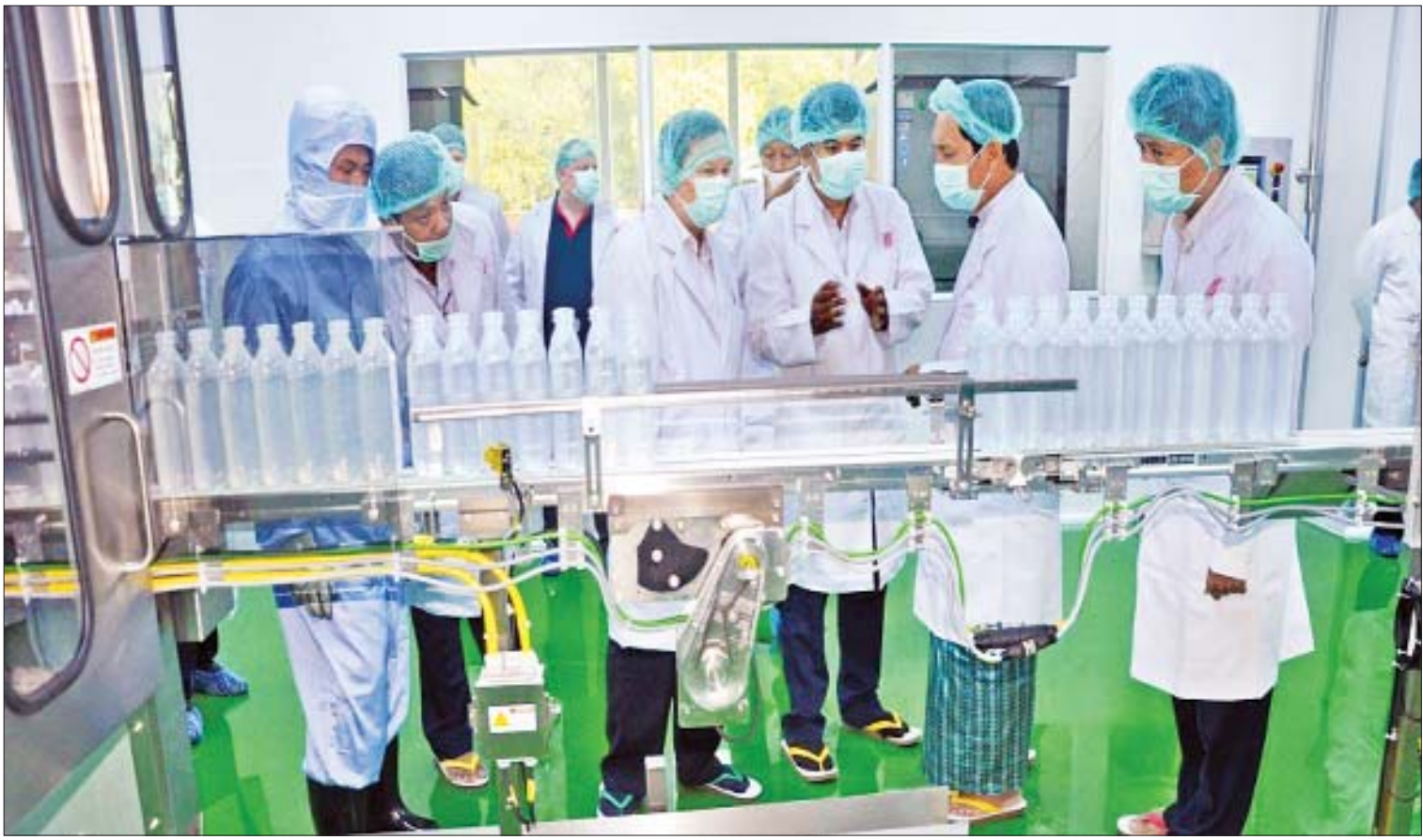
ပြည်ထောင်စုဝန်ကြီး ဦးခင်မောင်ချို သွေးကြောသွင်းဆေးရည် ထုတ်လုပ်မှုကို ကြည့်ရှုစဉ်။

စက်မှုထုတ်ကုန်ပစ္စည်းများကို ဈေးနှုန်းမှန်ကန်စွာ သုံးစွဲသူလက်ဝယ်အရောက်ပို့ဆောင်နိုင်ရေးအတွက် ဆိုင်ခန်းသဖွယ်