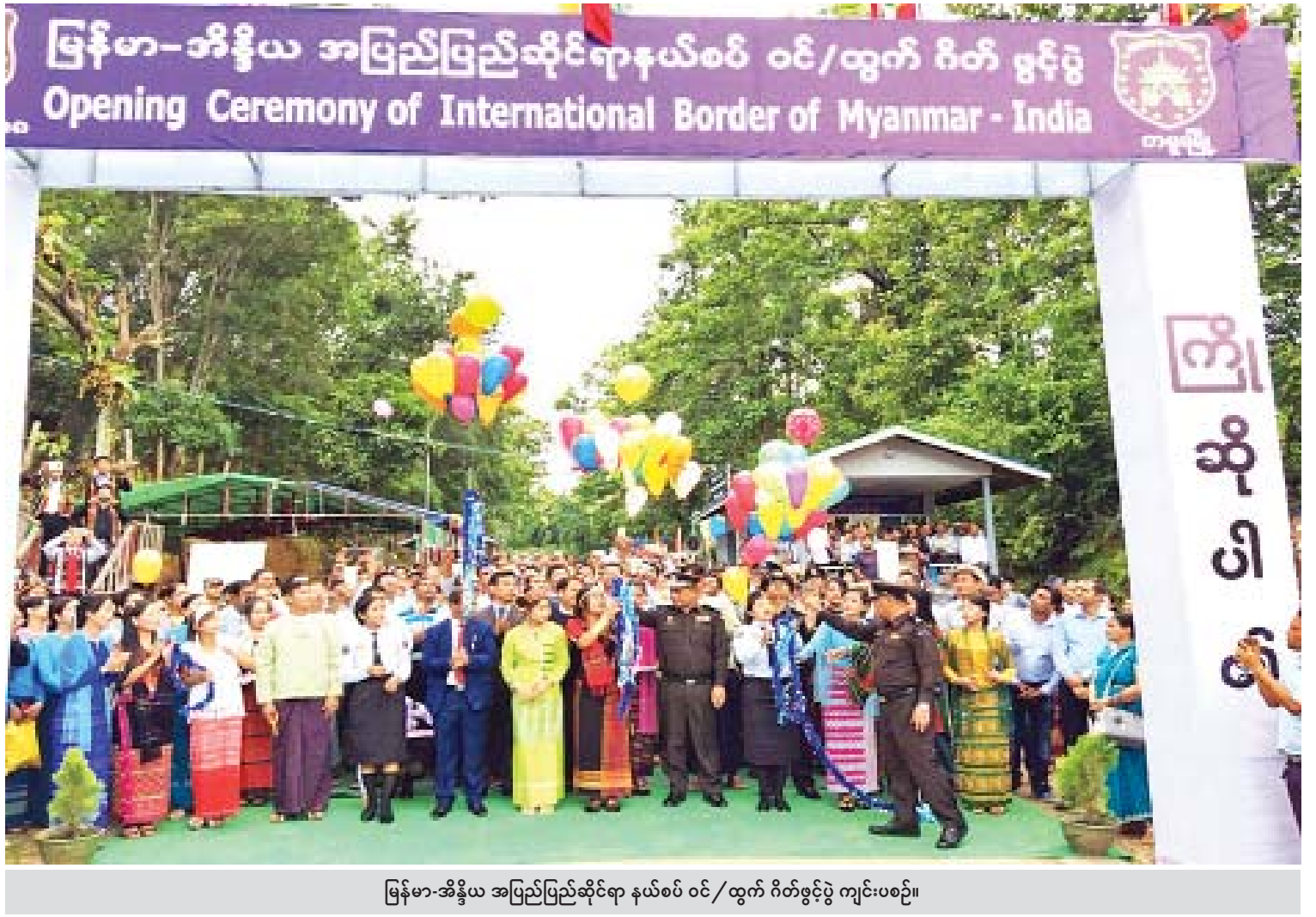
မြန်မာ-အိန္ဒိယ အပြည်ပြည်ဆိုင်ရာ နယ်စပ် ဝင်/ထွက် ဂိတ်ဖွင့်ပွဲ ကျင်းပစဉ်။

အလုပ်သမားရေးရာ ကိစ္စရပ်များကို အစိုးရ၊ အလုပ်ရှင်နှင့် အလုပ်သမားသုံးပွင့်ဆိုင် ပူးပေါင်းဆောင်ရွက်မှုစနစ်ဖြင့် အရှိန်အဟုန် မြှင့်ဆောင်ရွက်နိုင်ရန်နှင့် Decent Work Agenda ကို အကောင်အထည်ဖော်ရန်အတွက် အမျိုးသားအဆင့် သုံးပွင့်ဆိုင်အဖွဲ့ (National Tripartite Body- NTB) ကို ၂၀၁၆ ခုနှစ်တွင် ဖွဲ့စည်းခဲ့ပြီး ၂၀၁၈ ဒီဇင်ဘာအထိ အမျိုးသားအဆင့် သုံးပွင့်ဆိုင် ဆွေးနွေးပွဲ (၁၁) ကြိမ်ကျင်းပ၍ အလုပ်သမားရေးရာကိစ္စရပ်များ ဆွေးနွေးအတည်ပြုဆုံးဖြတ်ခြင်းများဆောင်ရွက်ခဲ့ကြောင်း သိရှိရသည်။ Decent Work Country Programme ရေးဆွဲနိုင်ရေးအတွက် DWCP-TWG အစည်းအဝေး ခြောက်ကြိမ်ကျင်းပ၍ စီးပွားရေးလုပ်ငန်းစဉ်များ သတ်မှတ်ခြင်း၊ လေ့လာဆန်းစစ်မှုများ ပြုလုပ်ခြင်း၊ DWCP-TWG အဖွဲ့ဝင်များကို စွမ်း