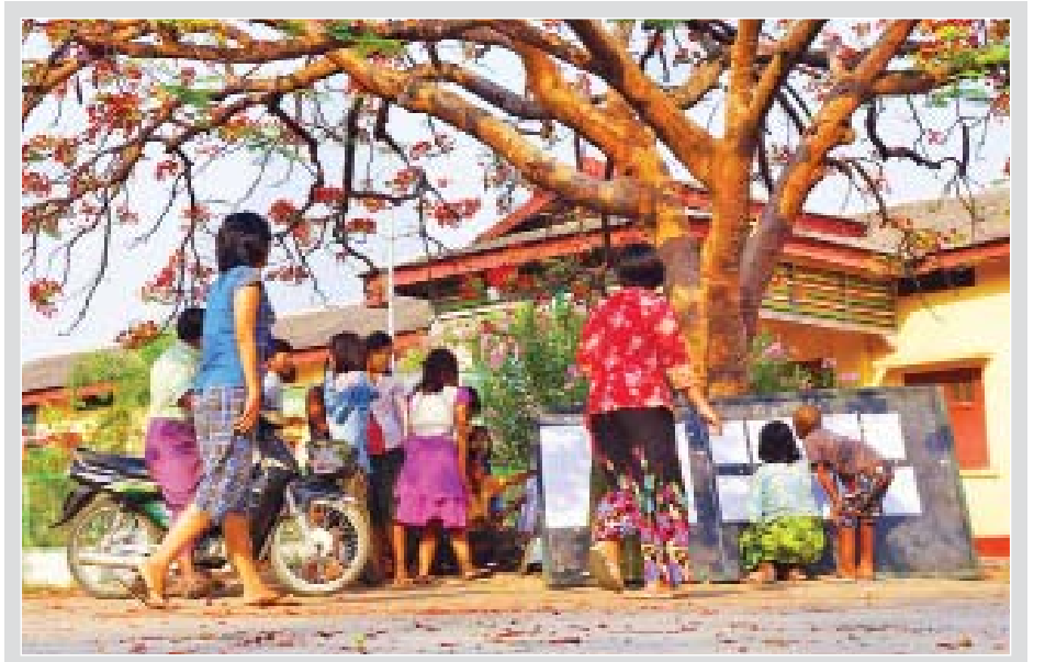
မိတ္ထီလာမြို့နယ် အခြေခံပညာကျောင်းများ၌ ၂၀၁၈ - ၂၀၁၉ ပညာသင်နှစ် စာမေးပွဲအောင်စာရင်းများကို ဧပြီ ၂၁ ရက် နံနက် ၅ နာရီက ထုတ်ပြန်ကြေညာခဲ့ရာ ကျောင်းသား ကျောင်းသူများနှင့် ကျောင်းသားမိဘများ လာရောက် ကြည့်ရှုကြစဉ်။