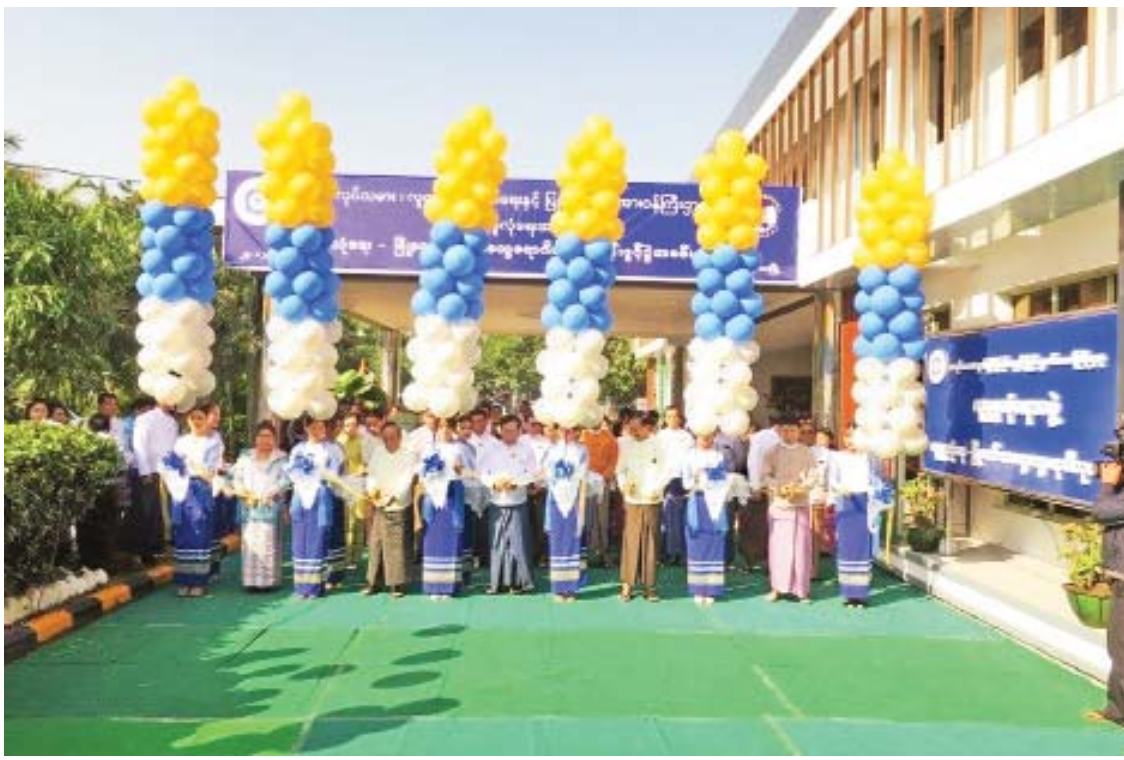
မန္တလေးမြို့၌ လူမှုဖူလုံရေး-မြို့တော်အထွေထွေရောဂါကုဆေးခန်း ဖွင့်ပွဲကျင်းပစဉ်။

“ထိုင်းနိုင်ငံသို့ရောက်ရှိနေပြီး နိုင်ငံ သားအထောက်အထား တင်ပြနိုင်ခြင်းမရှိတဲ့ မြန်မာအလုပ်သမားတွေကို မည်သူမည်ဝါ ဖြစ်ကြောင်း သက်သေခံလက်မှတ် (Certificate of Identity-CI) ထုတ် ပေးနေပါတယ်။ ထုတ်ပေးရေးစခန်း ကိုးခုနဲ့ ရွှေလျားအဖွဲ့ နှစ်ဖွဲ့က အလုပ်သမားတွေဆီ အရောက် ဆောင်ရွက်ပေးခဲ့တဲ့အတွက် ၂၀၁၈ ခုနှစ် မတ် ၁၁ ရက်ကနေ ၂၀၁၈ ခုနှစ် ဇွန် ၃၀ ရက်အတွင်း လူဦးရေ ၆၆၄၁၂ ဦးကို CI လက်မှတ်ထုတ်ပေးနိုင်ခဲ့ပါတယ်။ ၂၀၁၈ ခုနှစ် ဇူလိုင်လမှာ အစီအစဉ်ရပ်ဆိုင်း ခဲ့ပြီး ထိုင်းနိုင်ငံ သာမန်နိုင်ငံကူးလက်မှတ် ထုတ်ပေးရေးဌာနစိတ်၊ CI စခန်းတွေနဲ့