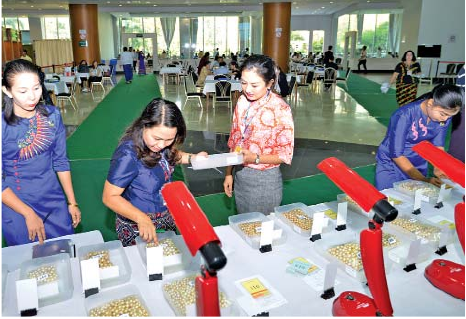
(၅၆) ကြိမ်မြောက် မြန်မာ့ကျောက်မျက်ရတနာပြပွဲတွင် ခင်းကျင်းပြသထားသည့် ပုလဲအတွဲများကို စိတ်ဝင်တစား ကြည့်ရှုနေကြစဉ်။

ဖြေ။ နိုင်ငံတော်အတွင်း စက်မှုလုပ်ငန်းတွေ အပါအဝင် လူမှုစီးပွားဖွံ့ဖြိုးရေးဆိုင်ရာ ရင်းနှီးမြှုပ်နှံမှုလုပ်ငန်းစီမံကိန်းတွေ အကောင်အထည်ဖော်တဲ့နေရာမှာ သဘာဝနဲ့ လူမှုပတ်ဝန်းကျင်ထိခိုက်မှု မရှိစေဖို့အပြင် ပြည်သူတွေအနေနဲ့ ၎င်းတို့ရဲ့ လူနေမှုဘဝနဲ့ ပိုင်ဆိုင်မှုတွေအပေါ် အကျိုးသက်ရောက်နိုင်တဲ့ ပတ်ဝန်းကျင်ဆိုင်ရာ ဆုံးဖြတ်ချက်ချမှတ်မှု