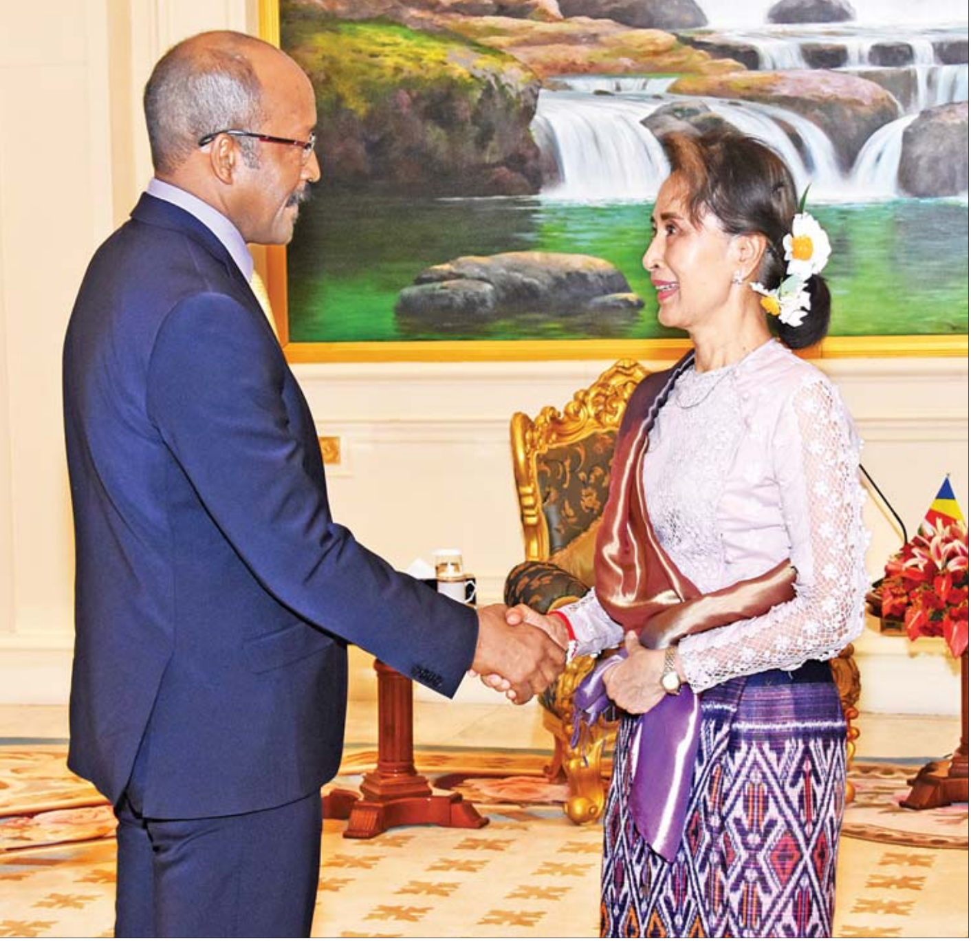
နိုင်ငံတော်၏အတိုင်ပင်ခံပုဂ္ဂိုလ် ဒေါ်အောင်ဆန်းစုကြည် ဆေးရုံလ်သမ္မတနိုင်ငံ ဒုတိယသမ္မတ H.E.Mr.Vincent Meriton အား ရင်းရင်းနှီးနှီးနှုတ်ဆက်စဉ်။