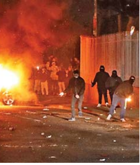
ကျူးလွန်ခဲ့ခြင်းဖြစ်သည်ဟု ဒုတိယရဲချုပ် မက်ဟာမီတန်က အစီရင်ခံစာတစ်ရပ်တွင် ပြောကြားခဲ့သည်။ ထို့အပြင် ယခုဖြစ်ပွားခဲ့သည့်ဖြစ်စဉ်ကို အကြမ်းဖက်မှု တစ်ခုဟု ယူဆပါကြောင်းနှင့် အဆိုပါ ရဲအရာရှိကို

လူသတ်မှုဖြင့် အရေးယူဆောင်ရွက်သွားမည်ဖြစ်ကြောင်း ဒုတိယရဲချုပ် မက်ဟာမီတန်က ဆက်လက်ပြောကြားခဲ့သည်။