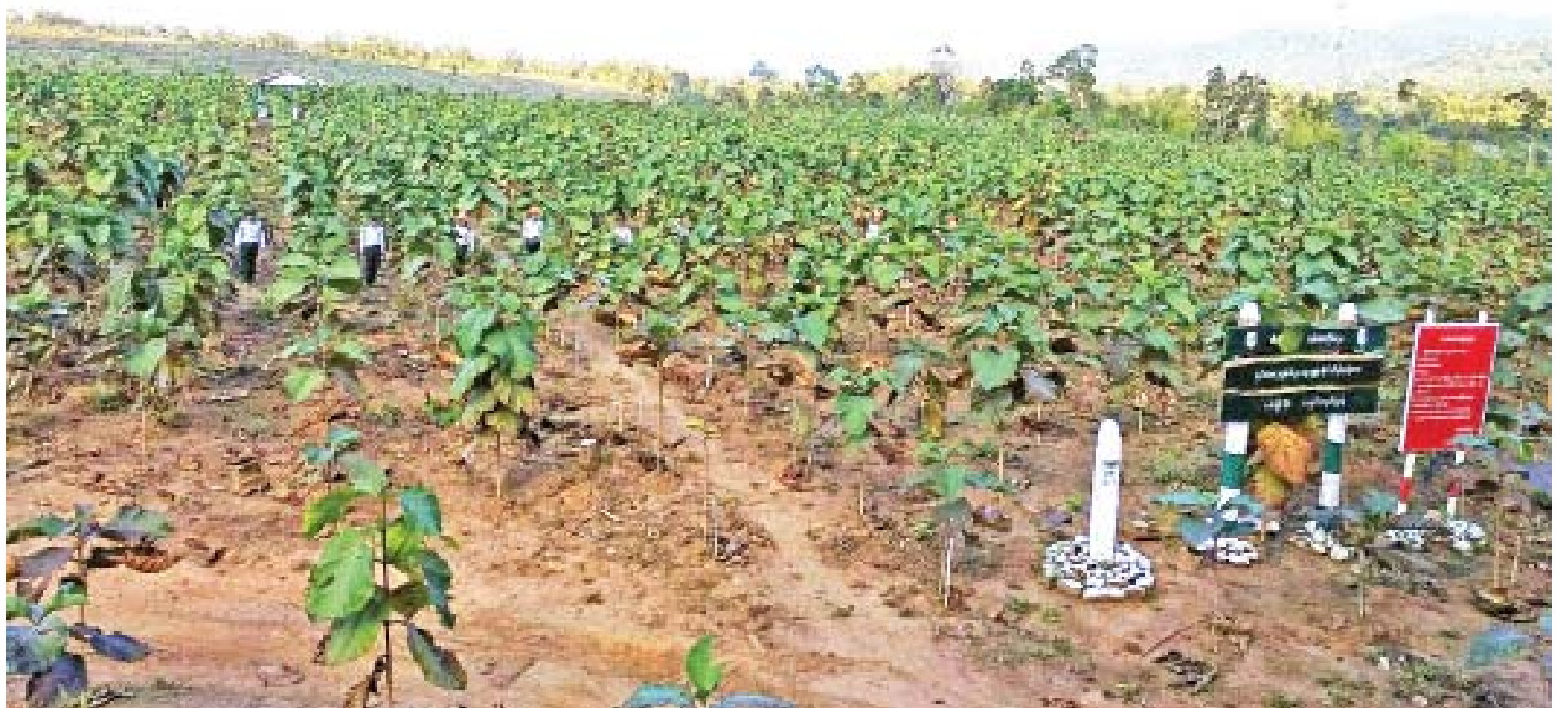
သစ်တောစိုက်ခင်းများ ထူထောင်ထားမှုကို တွေ့ရစဉ်။