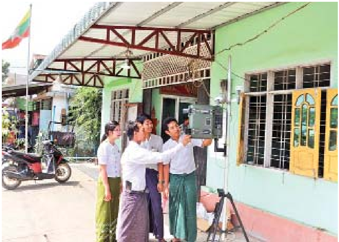
လှိုင်သာယာမြို့နယ်တွင် လေထုအရည်အသွေးတိုင်းတာခြင်းလုပ်ငန်း ဆောင်ရွက်စဉ်။

ပုလဲထုတ်လုပ်မှုမှ စုစုပေါင်းထုတ်လုပ်မှု တန်ဖိုး ငွေကျပ် ၇၆၅၂၁ ဒသမ ၅၆ သန်း လျာထားပြီး ငွေကျပ် ၁၃၂၆၀၆ ဒသမ ၇၇၂ သန်း ရရှိခဲ့တဲ့အတွက် ၁၇၂ ဒသမ ၈၄ ရာခိုင် နှုန်း အကောင်အထည်ဖော်နိုင်ခဲ့ပါတယ်။ ၂၀၁၈ ခုနှစ် ဧပြီလမှ ၂၀၁၉ ခုနှစ် မတ်လအထိ သတ္တု၊ ကျောက်စိမ်း၊ ကျောက်မျက်နဲ့ ပုလဲ ထုတ်လုပ်မှုတို့မှ စုစုပေါင်းထုတ်လုပ်မှုတန်ဖိုး ငွေကျပ် ၇၃၉၀၆၆ ဒသမ ၈၇၆ သန်းလျာထား ပြီး စုစုပေါင်းငွေကျပ် ၁၀၂၇၇၄ ဒသမ ၆၈၇ သန်း ရရှိခဲ့တဲ့အတွက် ၁၃၉ ဒသမ ၀၆ ရာခိုင်နှုန်း အကောင်အထည်ဖော်နိုင်ခဲ့