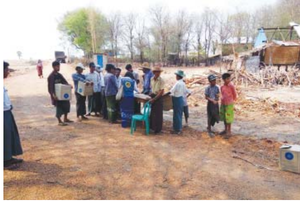
မကွေး ဧပြီ ၁၉

မကွေးမြို့နယ် ဖိုးဝေးကျေးရွာနှင့် ဆူးပြစ်စမ်းကျေးရွာတို့တွင် ဧပြီ ၁၇ ရက် ညနေ ၅ နာရီ မိနစ် ၄၀ တွင် လေပြင်းတိုက်ခတ်မှုကြောင့် ဖိုးဝေးကျေးရွာတွင် အိမ်ခြေ ၁၆ လုံးနှင့် ဘုန်းတော်ကြီးကျောင်းတစ်ကျောင်း၊ ဆူးပြစ်စမ်းကျေးရွာတွင် အိမ်ခြေ ၁၃ လုံး ပျက်စီးခဲ့သည်။ ဖိုးဝေးကျေးရွာတွင် ပျက်စီးခဲ့သော ဘုန်းကြီးကျောင်းနှင့် အိမ်ထောင်စုများအတွက် ရန်ပုံငွေကျပ် ၇၆၈၀၀ နှင့် အိမ်ထောင်စု ၁၅ စုအား ကယ်ဆယ်ရေးပစ္စည်းကိရိယာများနှင့် အိမ်ထောင်စုတစ်စုကို ကယ်ဆယ်ရေးပစ္စည်း ၁၅ မျိုးကိုလည်း