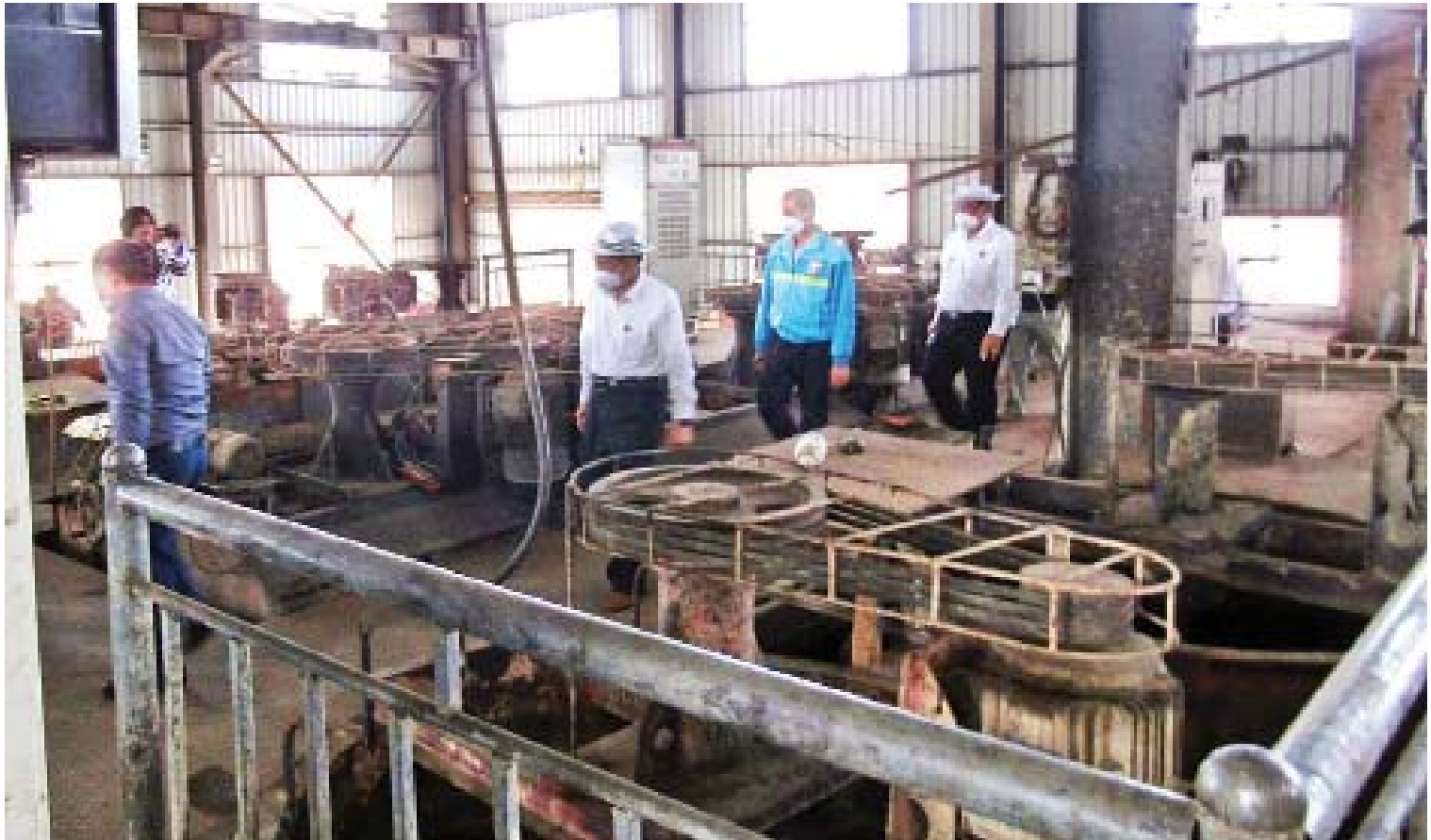
ပြည်ထောင်စုဝန်ကြီး ဦးအုန်းဝင်း ကလောမြို့နယ် ဘော်ဆိုင်ဒေသရှိ ခဲသတ္တုသန့်စင်စက်ရုံကို ကြည့်ရှုစစ်ဆေးစဉ်။

ဖြေ။ မြန်မာ့သတ္တုတွင်းဥပဒေကို ပြင်ဆင်တဲ့ ဥပဒေနဲ့အညီ နည်းဥပဒေတွေကို ပြည်ထောင်စုအစိုးရအဖွဲ့ရဲ့ သဘောတူညီ ချက်နဲ့ ၂၀၁၈ ခုနှစ် ဖေဖော်ဝါရီ ၁၃ ရက်မှာ ထုတ်ပြန်ခဲ့ပါတယ်။ မြန်မာ့ပုလဲလုပ်ငန်း ဥပဒေကို ဒုတိယအကြိမ် ပြင်ဆင်တဲ့ဥပဒေ ကို ၂၀၁၈ ခုနှစ် စက်တင်ဘာ ၂၉ ရက်မှာ ပြည်ထောင်စုလွှတ်တော်က ပြဋ္ဌာန်းခဲ့ပါ တယ်။ မြန်မာ့ကျောက်မျက်ရတနာဥပဒေကို ခေတ်ကာလအခြေအနေနဲ့ လိုက်လျော