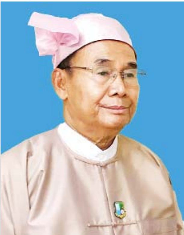
ပြည်ထောင်စုဝန်ကြီး ဦးအုန်းဝင်း

အမေး၊ အရေး - မော်စီ၊ ဓာတ်ပုံ - ခန့်မော်ဦး