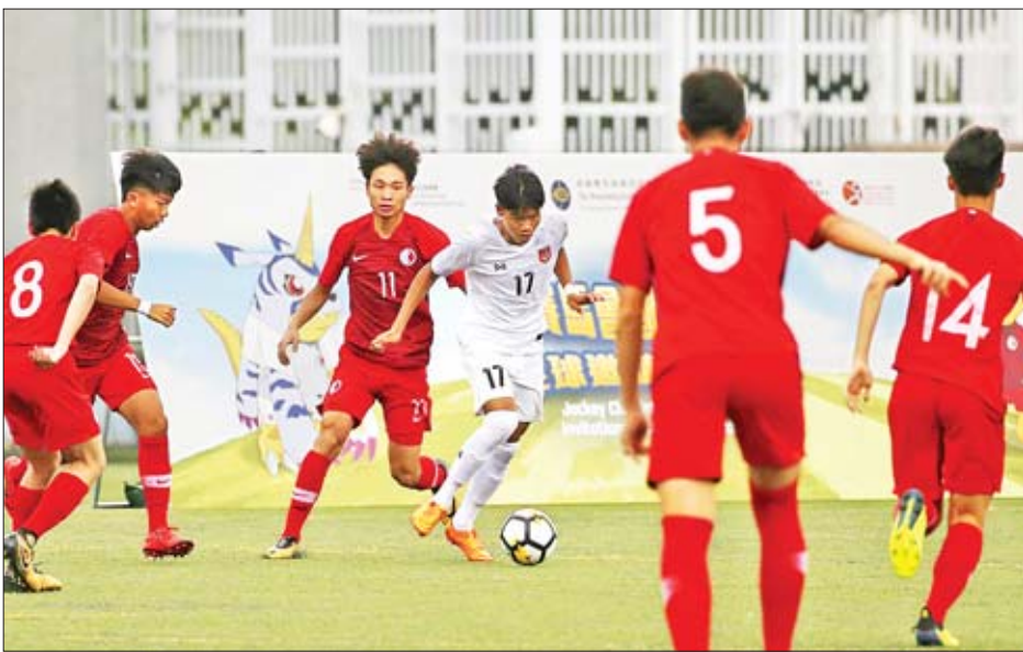
မြန်မာ ယူ-၁၈ အသင်းနှင့် ဟောင်ကောင် ယူ-၁၈ အသင်း ယှဉ်ပြိုင်နေစဉ်။

၂၀၁၉ ဟောင်ကောင် ယူ-၁၈ ဖိတ်ခေါ်ပြိုင်ပွဲ (Jockey Club International Youth Invitational Football Tournament 2019) ပထမနေ့ကို ယနေ့နံနက်ပိုင်းက ဟောင်ကောင်၌ စတင်ကျင်းပရာ မြန်မာ ယူ-၁၈ အသင်း နိုင်ပွဲစတင်ရရှိခဲ့သည်။