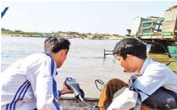
ရာဝတီမြစ်ရေနမူနာကောက်ယူခြင်းနှင့် ရေအရည်အသွေး တိုင်းတာခြင်းလုပ်ငန်း ဆောင်ရွက်စဉ်။

GEF မှ ရာသီဥတုပြောင်းလဲမှုဆိုင်ရာ စီမံကိန်းသုံးခုအတွက် အမေရိကန်ဒေါ်လာ ၁၂ သန်းခန့်ရရှိအောင် ဆက်သွယ်ညှိနှိုင်း ဆောင်ရွက်ပေးနိုင်ခဲ့ပါတယ်။ ကမ္ဘာ့ဘဏ်ရဲ့ အကူအညီ အမေရိကန်ဒေါ်လာ သုံးသိန်း ကျော်နဲ့ ပတ်ဝန်းကျင်ကာကွယ်စောင့် ရှောက်မှုဆိုင်ရာ လေ့ကျင့်သင်ကြားမှုဟိုဠာနဲ့ တည်ထောင်ဖွင့်လှစ်နိုင်ရေး ဆောင်ရွက် လျက်ရှိပါတယ်။ ပတ်ဝန်းကျင်ထိန်းသိမ်းရေး ဥပဒေပုဒ်မ ၈ မှာ ပြဋ္ဌာန်းထားတဲ့ ပတ်ဝန်းကျင် စီမံခန့်ခွဲမှုရန်ပုံငွေကို နိုင်ငံတော်ရဲ့ ဘဏ္ဍာရေး စည်းမျဉ်းနဲ့အညီ တည်ထောင်နိုင်ဖို့ကို ဆက်စဉ်ဌာနတွေ၊ နိုင်ငံတကာအဖွဲ့အစည်း တွေနဲ့ ပူးပေါင်းဆောင်ရွက်လျက်ရှိပါတယ်။