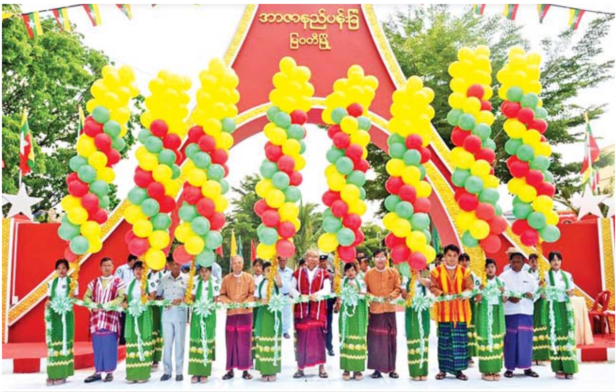
အမျိုးသားလွှတ်တော်ဥက္ကဋ္ဌ မန်းဝင်းခိုင်သန်း၊ ပြည်နယ်စီမံကိန်း၊ ဘဏ္ဍာရေးနှင့် စည်ပင်သာယာရေးဝန်ကြီး ဦးသန်းနိုင်၊ ပြည်သူ့လွှတ်တော်ကိုယ်စားလှယ် ဦးစိန်ဗိုလ်နှင့် ပြည်နယ်လွှတ်တော်ကိုယ်စားလှယ်များ အာဇာနည်ပန်းခြံမှန်ဦးကို ဖဲကြိုးဖြတ်ဖွင့်လှစ်ပေးကြစဉ်။

ဆက်လက်၍ အမျိုးသားလွှတ်တော်ဥက္ကဋ္ဌ မန်းဝင်းခိုင်သန်းနှင့် အဖွဲ့ဝင် များသည် မြဝတီမြို့ အမှတ်(၁)ရပ်ကွက် ဗိုလ်ချုပ်လမ်းရှိ အာဇာနည်ပန်းခြံ၌