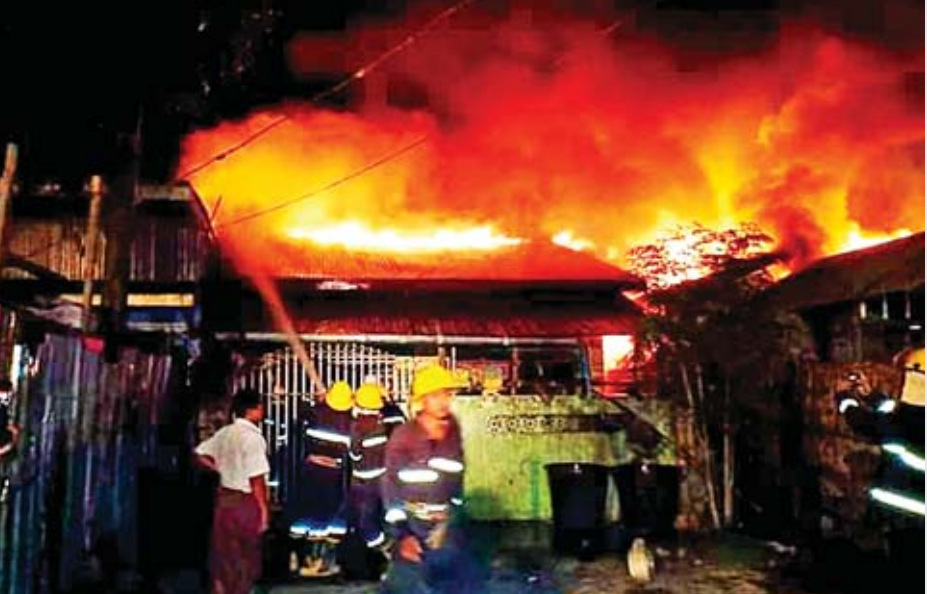
ရပ်ဖများနှင့် မီးသတ်ယာဉ် ငါးစီးတို့ဖြင့် မီးငြိမ်းသတ်ခဲ့ရာ နံနက် ၁၀ နာရီတွင် မီးငြိမ်းသတ်နိုင်ခဲ့ကြောင်း သိရသည်။

မီးလောင်ရာသို့ မိုင်းယု(၁၀၅)မိုင်၊ မူဆယ်မြို့နယ် တို့မှ သန္ဓေမီးသတ်တပ်ဖွဲ့ဝင်များ၊ အရန်မီးသတ်တပ်ဖွဲ့ ဝင်များ၊ မူဆယ်ခရစ်ယာန်မီးသတ်တပ်ဖွဲ့ဝင်များ၊ ရပ်မိ