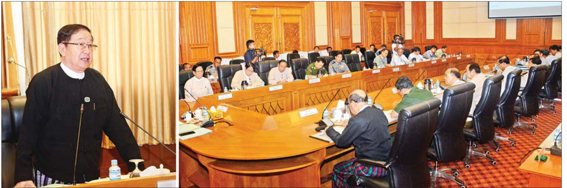
ပြည်ထောင်စုလွှတ်တော်နာယက ဦးတီခွန်မြတ် လွှတ်တော်အစည်းအဝေးများကျင်းပရေးဗဟိုကော်မတီနှင့် လုပ်ငန်းကော်မတီများ၏ လုပ်ငန်းညှိနှိုင်းအစည်းအဝေး အမှတ်စဉ်(၂/၂၀၁၉) တွင် အမှာစကားပြောကြားစဉ်။