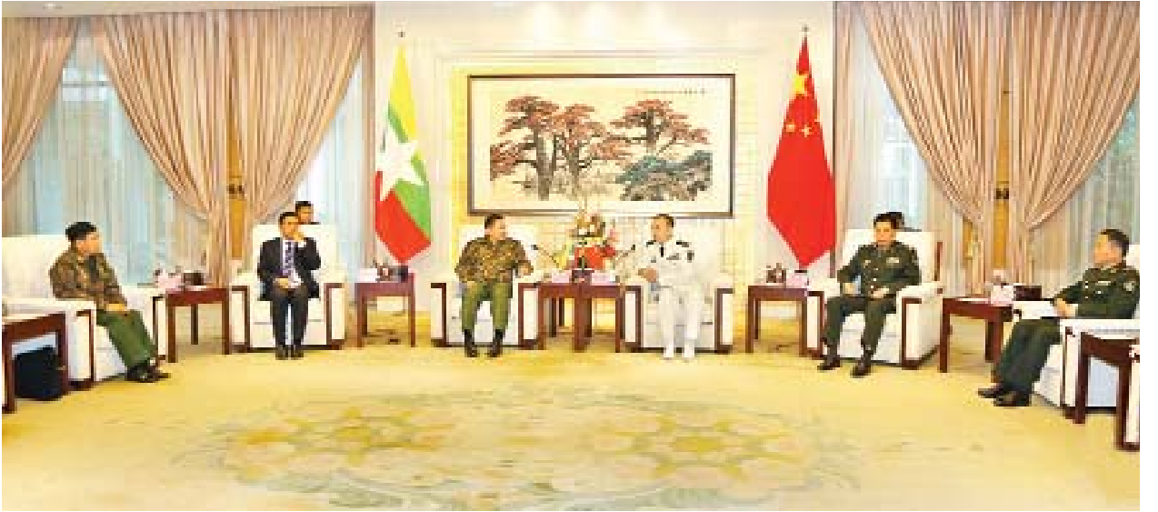
တပ်မတော်ကာကွယ်ရေးဦးစီးချုပ် ဗိုလ်ချုပ်မှူးကြီးမင်းအောင်လှိုင် တောင်ပိုင်းစစ်နယ်ဝန်းကွပ်ကဲမှုဌာနချုပ် ဌာနချုပ်မှူး Vice Admiral Yuan Yubai နှင့် တွေ့ဆုံဆွေးနွေးစဉ်။

တရုတ်ပြည်သူ့သမ္မတနိုင်ငံ၌ ရောက်ရှိနေသည့် တပ်မတော်ကာကွယ်ရေး ဦးစီးချုပ် ဗိုလ်ချုပ်မှူးကြီးမင်းအောင်လှိုင်နှင့်အဖွဲ့သည် ယနေ့နံနက်ပိုင်းတွင် ကွေ့ယန်းလေဆိပ်မှ ထွက်ခွာကြပြီး ကွမ်ကျိုးမြို့ရှိ Baiyuan လေဆိပ်သို့ ရောက်ရှိကြရာ တောင်ပိုင်းစစ်နယ်ဝန်းကွပ်ကဲမှုဌာနချုပ် ဒုတိယဌာနချုပ်မှူး Maj. Gen. Tao Guang နှင့် တပ်မတော်အရာရှိကြီးများက ကြိုဆိုနှုတ်ဆက် ကြသည်။ ထို့နောက် တပ်မတော်ကာကွယ်ရေးဦးစီးချုပ်သည် တောင်ပိုင်း စစ်နယ်ဝန်းကွပ်ကဲမှုဌာနချုပ် ဌာနချုပ်မှူး Vice Admiral Yuan Yubai နှင့် တွေ့ဆုံဆွေးနွေးသည်။