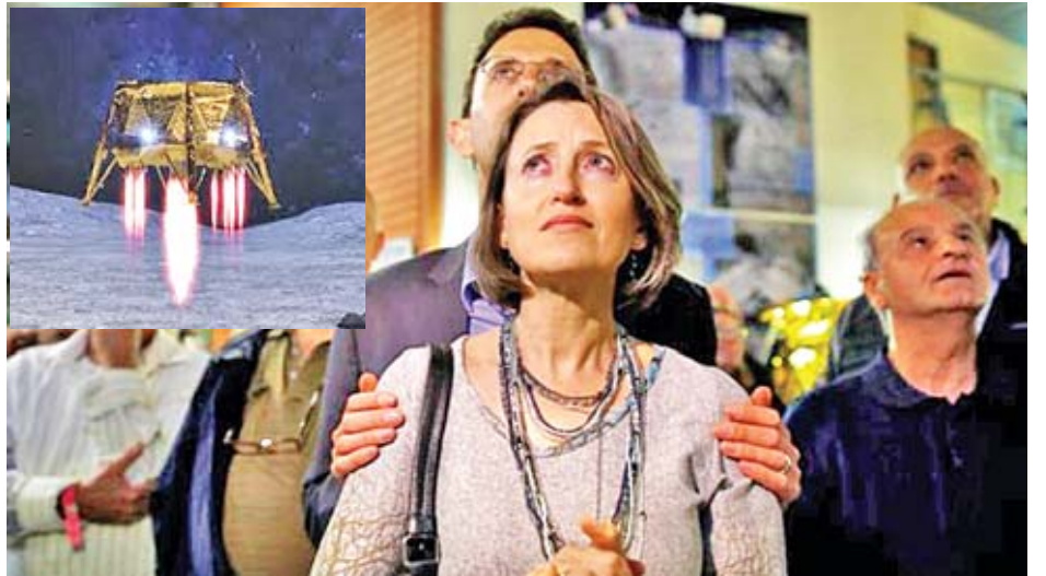
အစွရေးဝန်ကြီးချုပ် နေတန်ယာဟုသည် အစွရေး အာကာသယာဉ် လမျက်နှာပြင်ပေါ်သို့ ဆင်းသက်မှုအား ယင်းအာကာသယာဉ်အား ထိန်းချုပ်သည့် စခန်းအတွင်းမှ စောင့်ကြည့်နေခဲ့ပြီး အဆိုပါခရီးစဉ် ပျက်စီးသွားမှုအပေါ် တွင် မှတ်ချက်ပေးပြောကြားရာ၌ လမျက်နှာပြင်သို့လဆင်း ယာဉ်တစ်စင်း ဆင်းသက်နိုင်ရေးအတွက် အစွရေးနိုင်ငံမှ နှစ်နှစ် သို့မဟုတ် သုံးနှစ်ခန့် ကြိုးစားရဖွယ်ရှိသည်ဟု ပြောကြားခဲ့သည်။ ဆင်ဟွာ

အစွရေးနိုင်ငံ အာကာသယာဉ်သည် လမျက်နှာပေါ် တွင် ဆင်းသက်နိုင်ခြင်း မရှိခြင်းကြောင့် မိမိတို့အနေဖြင့် စိတ်ပျက်ရကြောင်း၊ အကယ်၍ ဆင်းသက်နိုင်ပါက ကြီးမားသော သတင်းအချက်အလက်များ ရရှိနိုင်မည်ဟု အစွရေးသမ္မတက ပြောကြားသည်။