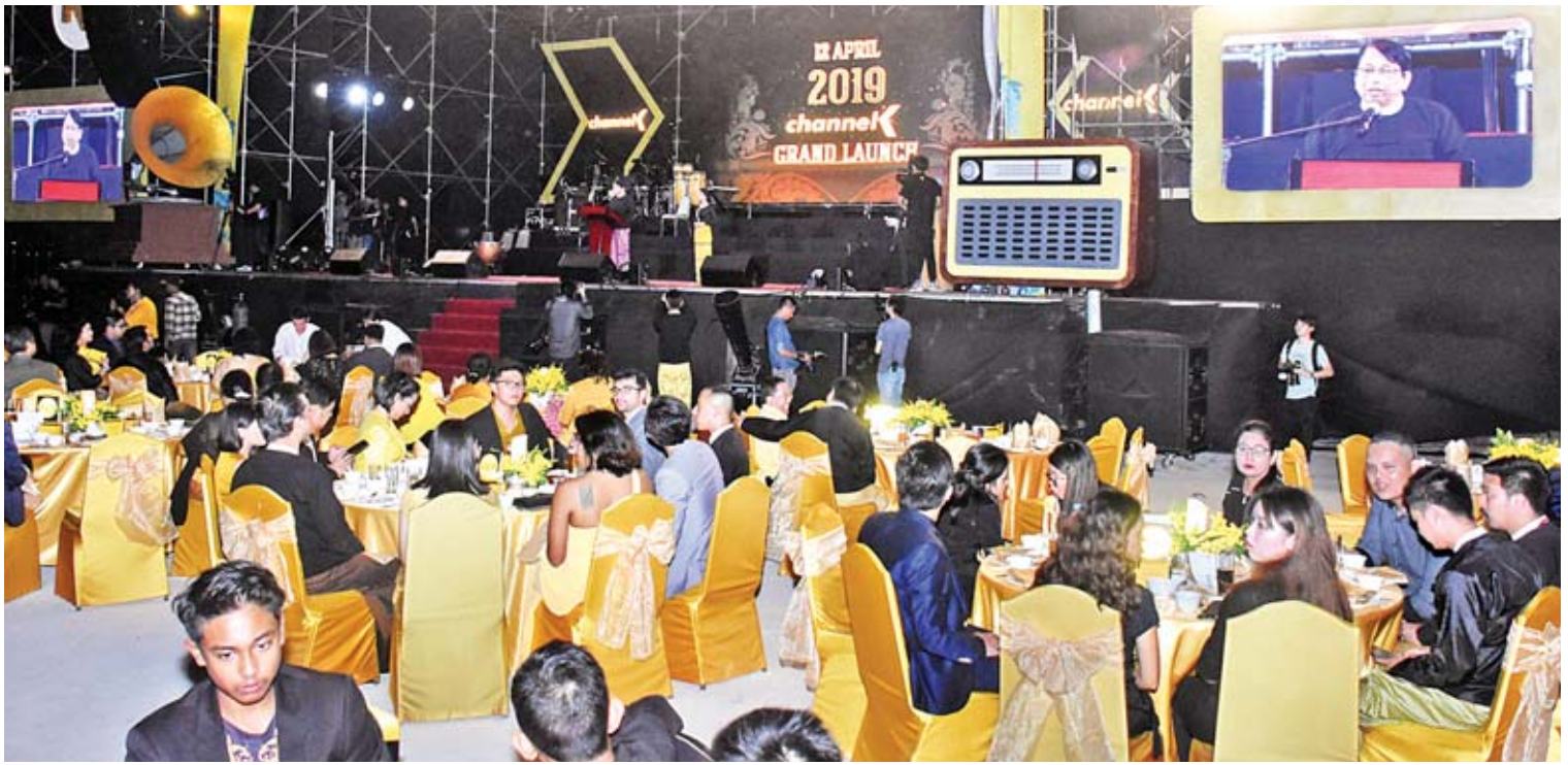
ပြည်ထောင်စုဝန်ကြီး ဒေါက်တာဖေမြင့် Channel K ရုပ်သံလှိုင်းဖွင့်ပွဲတွင် ဂုဏ်ပြုအမှာစကားပြောကြားစဉ်။

ယင်းနောက် ပြည်ထောင်စုဝန်ကြီး ဒေါက်တာဖေမြင့်က Channel K ရုပ်သံလှိုင်းဖွင့်ပွဲနှင့်ပတ်သက်၍ ဂုဏ်ပြုအမှာစကား ပြောကြားရာတွင် ပြန်ကြားရေးဝန်ကြီးဌာန အနေဖြင့် အစိုးရမီဒီယာလုပ်ငန်းများ လုပ်ကိုင်သကဲ့သို့ ပုဂ္ဂလိက မီဒီယာများ ဖွံ့ဖြိုးရှင်သန်ရေးကိုလည်း လုပ်ကိုင်ရပါကြောင်း၊ ပုဂ္ဂလိက မီဒီယာဆိုရာတွင် ပုံနှိပ် မီဒီယာများနှင့် ရုပ်သံမီဒီယာများ ပါဝင်ပါကြောင်း၊ ရုပ်သံပိုင်းမှာ ယခင်အစိုးရ လက်ထက်က ရွှေသံလှိုင်နှင့် Forever ကုမ္ပဏီများက လုပ်ကိုင်ခွင့်ရခဲ့ပါကြောင်း၊ မိမိတို့အနေဖြင့် နောက်ထပ်လုပ်ကိုင်ချင်သူများ