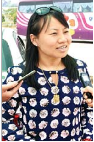
ဒေါ်အိရွှေငွေ