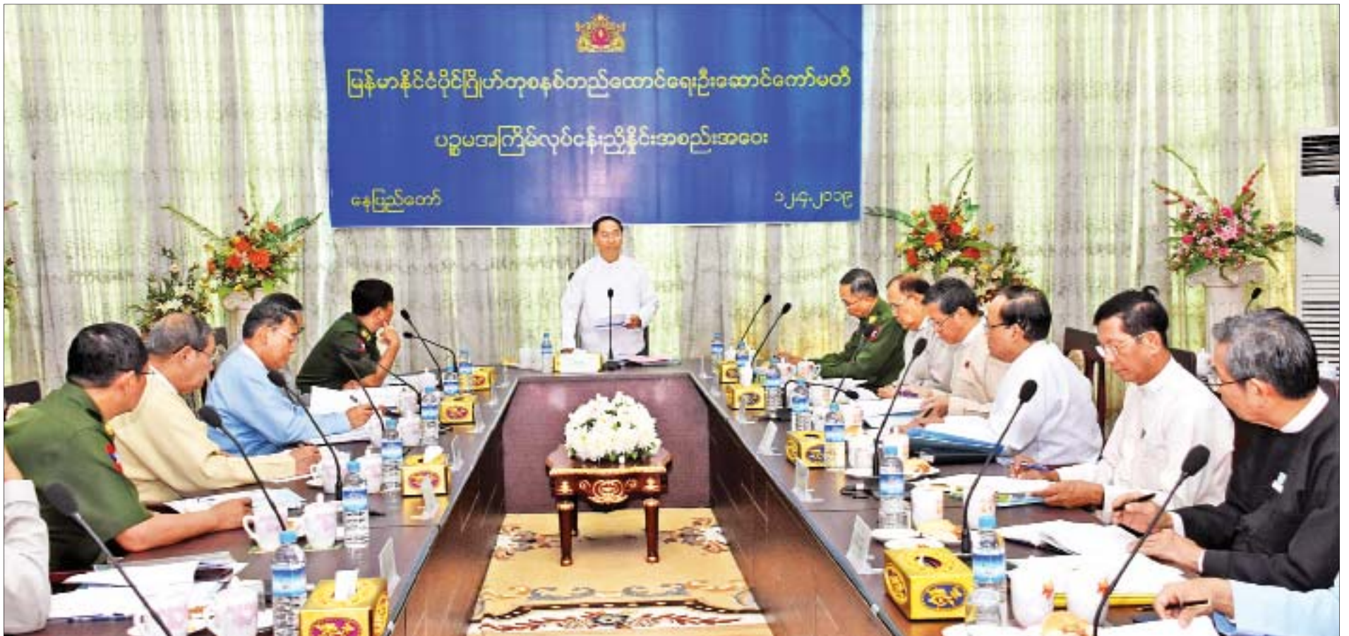
ဒုတိယသမ္မတ ဦးမြင့်ဆွေ မြန်မာနိုင်ငံပိုင် ဂြိုဟ်တုစနစ်တည်ထောင်ရေး ဦးဆောင်ကော်မတီ၏ ပဉ္စမအကြိမ် လုပ်ငန်းညှိနှိုင်းအစည်းအဝေးတွင် အမှာစကားပြောကြားစဉ်။