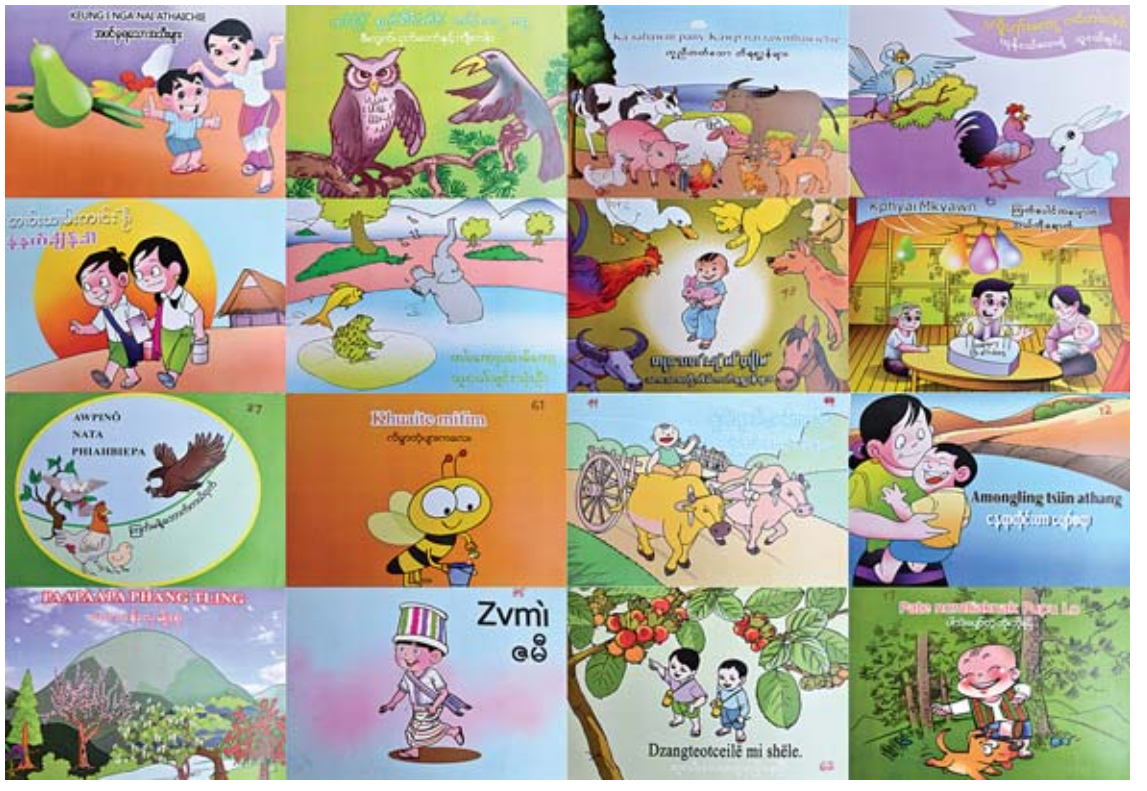
တိုင်းရင်းသားပုံပြင်စာအုပ် (ရုပ်ပြ)များကို တွေ့ရစဉ်။