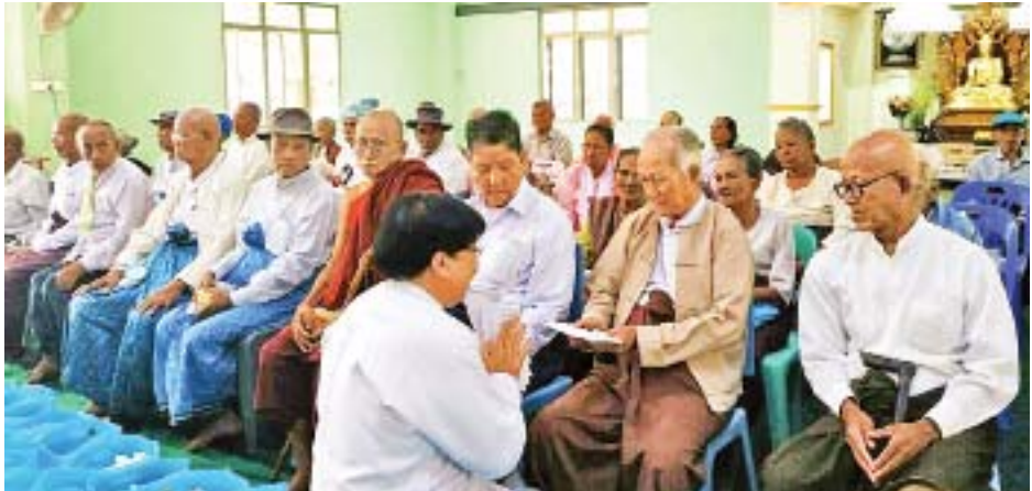
ငွေကျပ် ၁၉၆ သိန်းကို သီလဝါ အတွင်းရှိ ရင်းနှီးမြှုပ်နှံသူများက ကို ပါဝင်အားဖြည့်လှူဒါန်းခဲ့ကြ အထူးစီးပွားရေးဇုန်မှ ထောက်ပံ့လှူဒါန်းခဲ့ပြီး သီလဝါစီးပွားရေးဇုန် အခြားအသုံးအဆောင်ပစ္စည်းများ

ရန်ကုန် ဧပြီ ၁၁ မြန်မာ့ရိုးရာ နှစ်သစ်ကူးကာလကို ကြိုဆိုသောအားဖြင့် သက်ကြီးဘိုးဘွား ၂၀၀ ခန့်အား ထောက်ပံ့လှူဒါန်းပွဲကို သီလဝါအထူးစီးပွားရေးဇုန်အတွင်းရှိ မိုးကြိုးစွမ်းတုန်းတော်ကြီးကျောင်း အဂ္ဂဓမ္မသာသနာ့ဗိမာန်တော်၌ ယနေ့နံနက်ပိုင်းက ပြုလုပ်ခဲ့သည်။