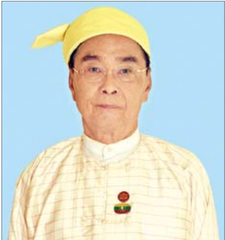
ပြည်ထောင်စုဝန်ကြီး နိုင်သက်လွင်