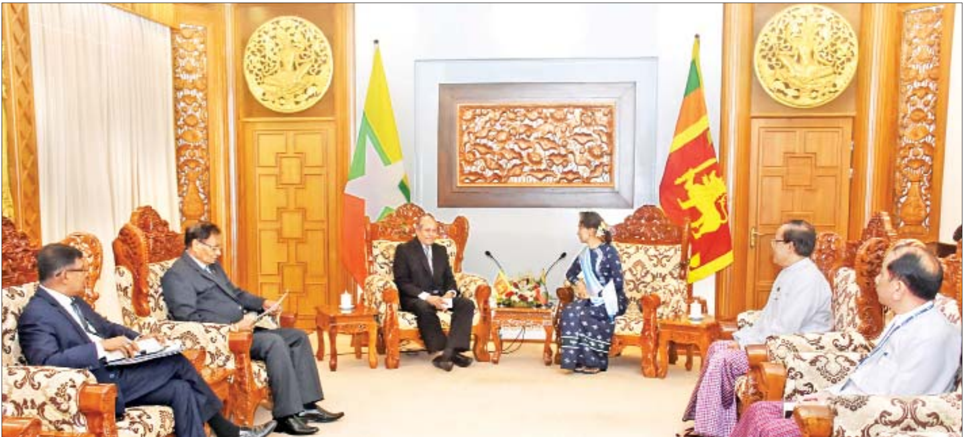
နိုင်ငံတော်၏အတိုင်ပင်ခံပုဂ္ဂိုလ် ဒေါ်အောင်ဆန်းစုကြည် သီရိလင်္ကာနိုင်ငံခြားရေးဝန်ကြီး မစ္စတာ တီလက် မာရာပါနာအား လက်ခံတွေ့ဆုံစဉ်။