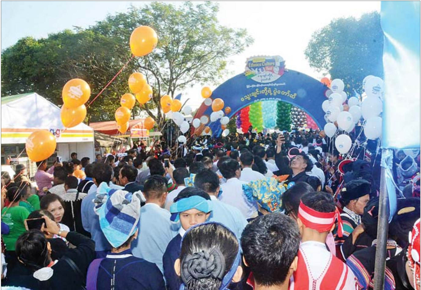
“သွေးချင်းတို့ရဲ့ပွဲတော်ဆီ” ပွဲတော်ဖွင့်ပွဲအခမ်းအနား ကျင်းပစဉ်။

တိုင်းရင်းသားဒေသတွေက ထွက်ကုန်တွေကို အသေးစား၊ အငယ်စားနဲ့ အလတ်စားလုပ်ငန်းရှင်တွေ ဈေးကွက်ဝင်အောင် ကျန်တဲ့ ဖွံ့ဖြိုးပြီးဒေသကို သွားရောက်ရင်းနှီးပြီး ဆက်စပ်မှုရှိအောင် လုပ်ကြရမယ်။ တိုင်းရင်းသားတွေ စဉ်ဆက်မပြတ် ဖွံ့ဖြိုးတိုးတက်ရေးဖိုရမ်ကနေ တိုင်းရင်းသားလုပ်ငန်းရှင်များအသင်းကို ဖွဲ့စည်းခဲ့ပါတယ်။ မဖွံ့ဖြိုးသေးတဲ့ တိုင်းရင်းသားဒေသတွေမှာ တိုင်းရင်းသားလုပ်ငန်းရှင်အသင်းတွေဖွဲ့မယ်။ အသင်းကကြီးမှူးပြီး ရန်ကုန်မှာ တိုင်းရင်းသားအားလုံး ပါဝင်ဆင်နွှဲနိုင်တဲ့ “သွေးချင်းတို့ရဲ့ ပွဲတော်ဆီ” ပွဲတော်ကို ကျင်းပခဲ့