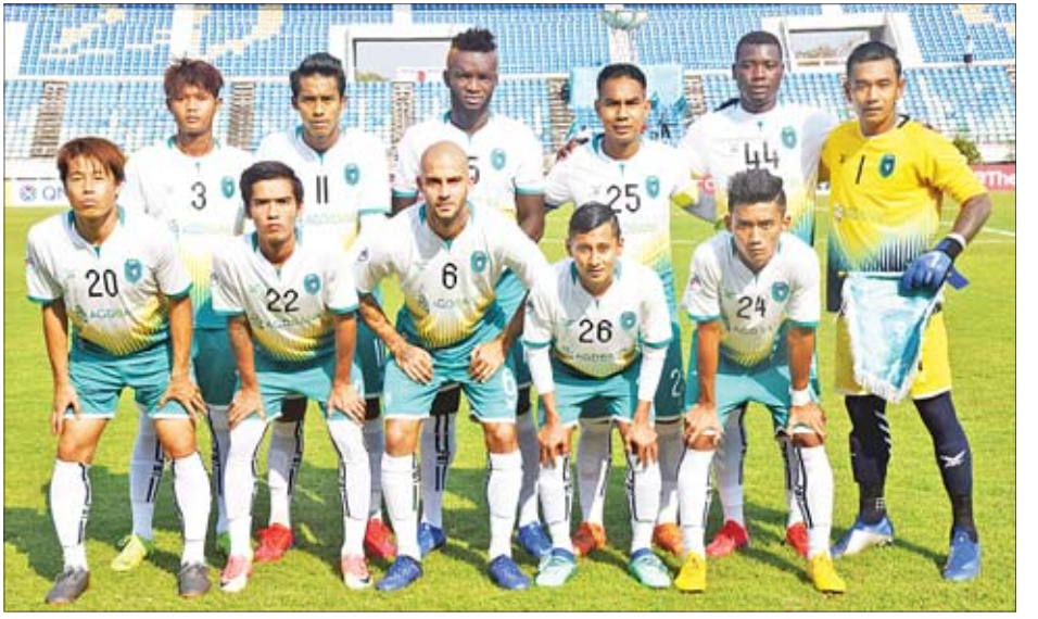
အိမ်ကွင်းကစားရမည့် သုံးမှတ်ရထားသည့် ရန်ကုန်အသင်း