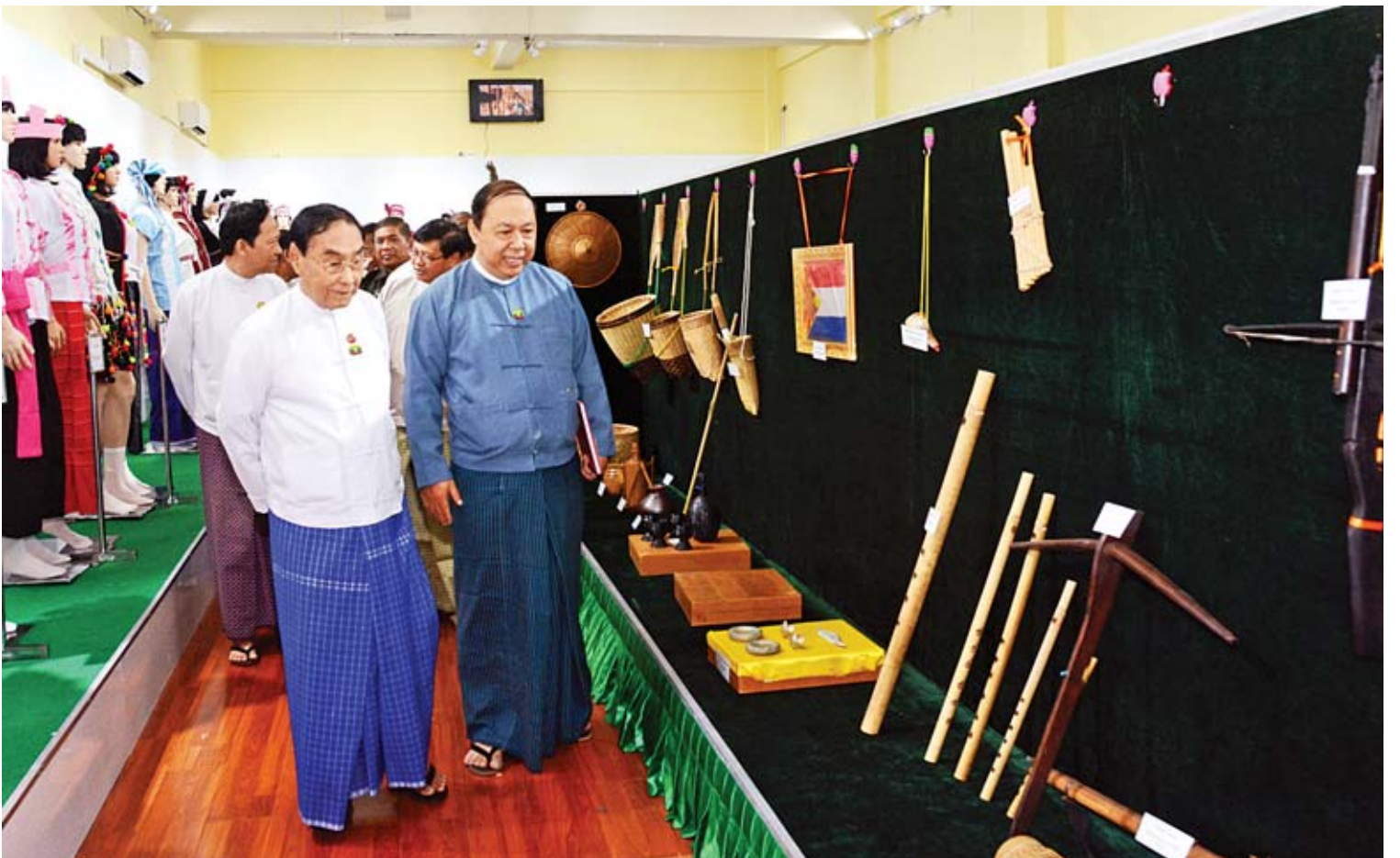
ပြည်ထောင်စုဝန်ကြီး နိုင်သက်လွင် တိုင်းရင်းသားလူမျိုးရေးရာဝန်ကြီးဌာန၌ ခင်းကျင်းပြသထားသည့် တိုင်းရင်းသားရိုးရာယဉ်ကျေးမှုနှင့် ဝတ်စားဆင်ယင်မှုပြခန်းများ၊ ခြပ်မဲ့ ယဉ်ကျေးမှုအမွေအနှစ်ထိန်းသိမ်းစောင့်ရှောက်ရေးပြခန်းများကို လှည့်လည်ကြည့်ရှုစဉ်။

တိုင်းရင်းသားအခွင့်အရေးများဆိုင်ရာ ပညာပေး ဟောပြောဆွေးနွေးပွဲများကို တိုင်းရင်းသားဒေသများတွင် ၂၀၁၈ - ၂၀၁၉