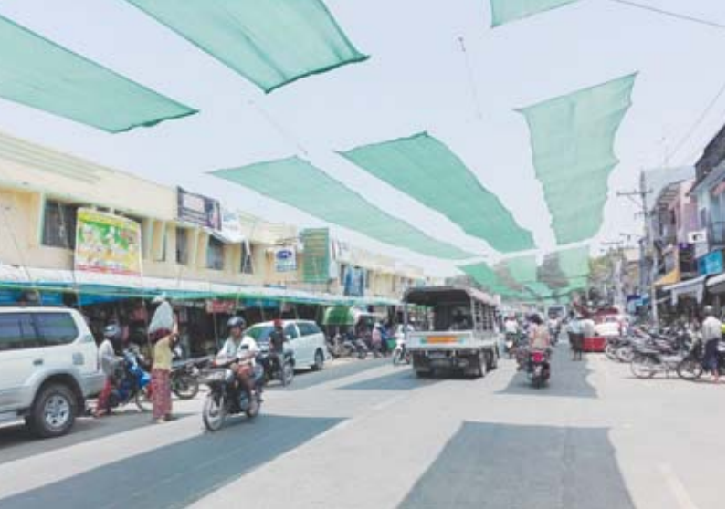
အကြံပြုနေမှုစတင်၍ တစ်နေ့လျှင်နှစ်ကြိမ် ပါဝင်ကြောင်း သိရသည်။ စတုဒိသာ ကျေးမွေးလှူဒါန်းမည့် အစီအစဉ်များ ကျော်ကျော်(ပြန်/ဆက်)

အဆိုပါ လမ်းလျှောက်သင်္ကြန်ကို ပဒေသာ ဈေးနှင့် အားကစားဈေးလမ်းမကြီးတွင် ကျင်းပ နိုင်ရန် ဦးဆောင်အဖွဲ့များနှင့် ဈေးလူငယ်အဖွဲ့များ က အပြီးသတ်ပြင်ဆင်မှုများ ဆောင်ရွက်နေပြီး ယင်းလမ်းလျှောက်သင်္ကြန်တွင် မဟာသင်္ကြန်