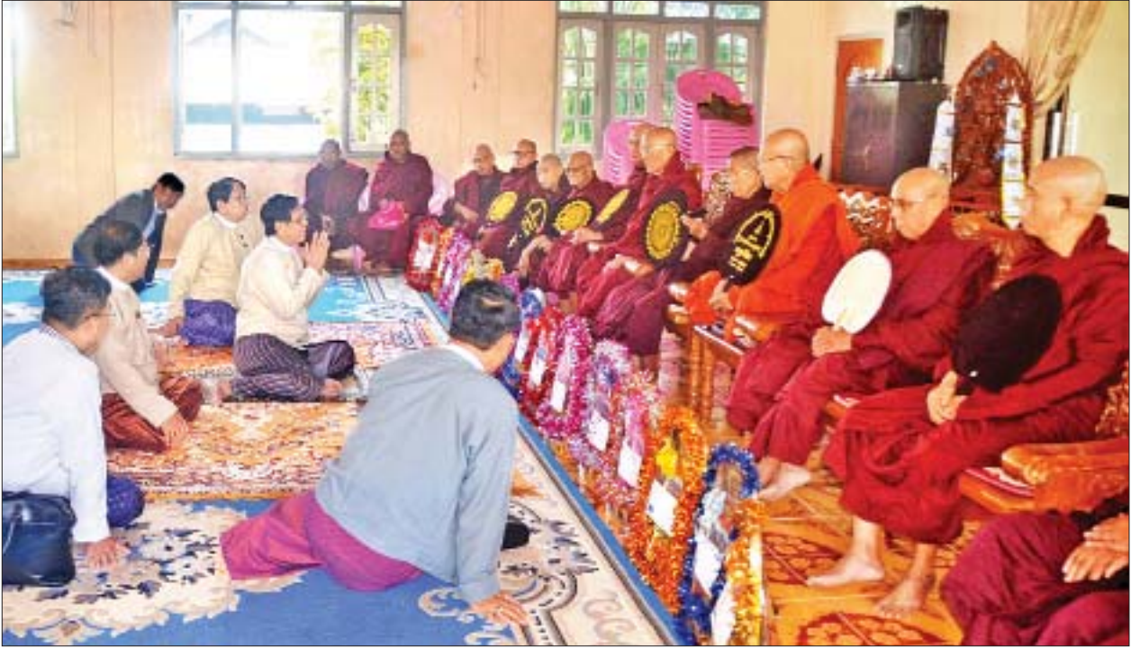
ရခိုင်ပြည်နယ် တည်ငြိမ်အေးချမ်းရေး အထောက်အကူပြုကော်မတီဥက္ကဋ္ဌ အမျိုးသားလွှတ်တော် ဒုတိယဥက္ကဋ္ဌ ဦးအေးသာအောင် ဆရာတော်၊ သံဃာတော် များအား ရခိုင်ပြည်နယ်တည်ငြိမ်အေးချမ်းရေးအတွက် ကော်မတီက ဆောင်ရွက်သွားမည့် လုပ်ငန်းစဉ်များကို ရှင်းလင်းလျှောက်ထားစဉ်။

ထို့နောက် ရခိုင်ပြည်နယ် တည်ငြိမ်အေးချမ်းရေး အထောက်အကူပြု