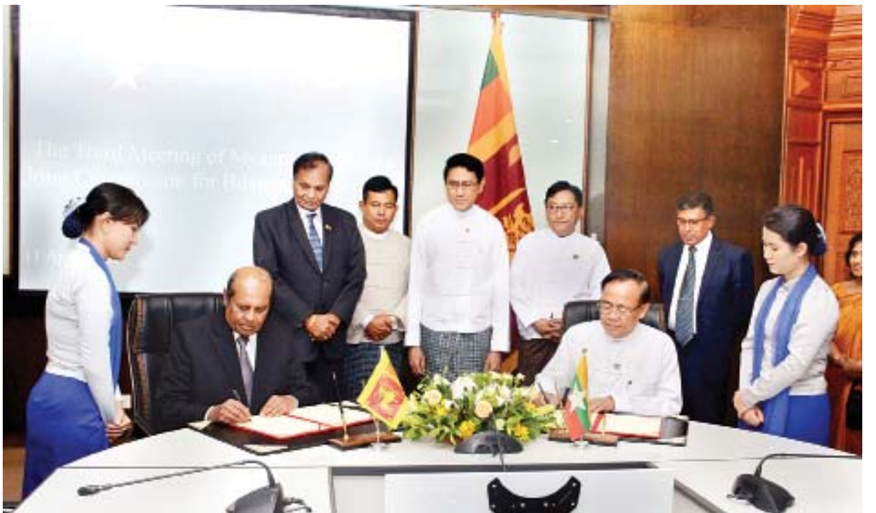
သီရိလင်္ကာနိုင်ငံခြားရေးဝန်ကြီးသည် ပုဂံမြို့နှင့် ရန်ကုန်မြို့တို့ရှိ သာသနာရေးနှင့်ယဉ်ကျေးမှုဆိုင်ရာ အထင်ကရနေရာများသို့လည်း သွားရောက်လည်ပတ်သွားမည်ဖြစ်ပြီး ဧပြီ ၁၅ ရက်တွင် မြန်မာနိုင်ငံမှ ပြန်လည်ထွက်ခွာမည်ဖြစ်သည်။ သတင်းစဉ်

ညနေပိုင်းတွင် အပြည်ပြည်ဆိုင်ရာ ပူးပေါင်းဆောင်ရွက်ရေးဝန်ကြီးဌာန ပြည်ထောင်စုဝန်ကြီးက သီရိလင်္ကာနိုင်ငံခြားရေးဝန်ကြီးနှင့် ကိုယ်စားလှယ် အဖွဲ့အား ရွှေစံအိမ်တိုက်၌ ဂုဏ်ပြုညစာစားပွဲဖြင့် တည်ခင်းစည်ခံသည်။