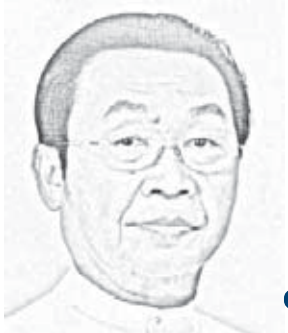
မောင်စာက

“အမှုများတွင် ဥပဒေအရ ခုခံချေပခွင့်နှင့်အယူခံပိုင် ခွင့်ရရှိရေး” သည် တရားစီရင်ရာတွင် အခြေခံရမည့် တတိယမြောက်အခြေခံဖြစ်ပါသည်။ ဤမူကို ၂၀၀၈ ခုနှစ်၊ ဇူလိုင်လ ၂၅ ရက်နေ့ ဥပဒေပုဒ်မ ၁၉ (ဂ) နှင့် ၃၇၅ တို့တွင်လည်း ဖော်ပြထားပါသည်။ ပြစ်မှုထင်ရှားစီရင်ခြင်း မပြုသေးသမျှ မည်သူ့ကိုမျှ ပြစ်မှုကျူးလွန်သူအဖြစ် မှတ်ယူ၍မရပါ။ ခုခံချေပခွင့်မပေးဘဲ မည်သူ့ကိုမျှ ပြစ်ဒဏ်တစ်စုံတစ်ရာ ချမှတ်ခြင်းမပြုရပါ။ တရားခံ အား ကြားနာခြင်းမပြုဘဲ တရားခံအပေါ်နှစ်နာစေသည့် အမိန့်မျိုး ချမှတ်ခြင်းမပြုရပါ။ ဤသည်တို့ကိုလည်း တရားဥပဒေနယ်ပယ်တွင် လိုက်နာစောင့်ထိန်းရမည့် မူများအဖြစ် လက်ခံထားကြသည်။ ဤသို့ဆိုလျှင် အမှုများတွင် ဥပဒေအရ ခုခံချေပခွင့်နှင့် အယူခံပိုင်ခွင့် ရရှိရေးသည်လည်း အဓိကလိုအပ်ချက်တစ်ရပ် ဖြစ်နေပါသည်။ အနှစ်ချုပ်မျှဝေပါရစေ။