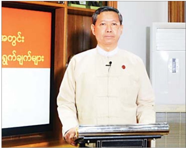
ပြည်ထောင်စုဝန်ကြီး ဒေါက်တာမျိုးသိမ်းကြီး