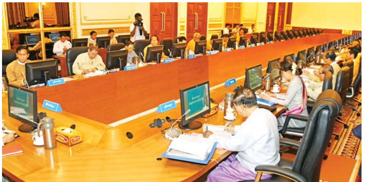
ဘဏ္ဍာရေးကော်မရှင်ဥက္ကဋ္ဌ နိုင်ငံတော်သမ္မတ ဦးဝင်းမြင့် ဘဏ္ဍာရေးကော်မရှင် (၁/၂၀၁၉)ကြိမ်မြောက်အစည်းအဝေးတွင် လမ်းညွှန်အမှာစကားပြောကြားစဉ်။

အစည်းအဝေးသို့ နိုင်ငံတော်၏အတိုင်ပင်ခံပုဂ္ဂိုလ် ဒေါ်အောင်ဆန်းစုကြည်၊ ဘဏ္ဍာရေးကော်မရှင် ဒုတိယဥက္ကဋ္ဌများဖြစ်ကြသည့် ဒုတိယသမ္မတ ဦးမြင့်ဆွေနှင့် ဒုတိယသမ္မတ ဦးဟင်နရီဗန်ထီးယူ၊ ဘဏ္ဍာရေးကော်မရှင် အတွင်းရေးမှူး ပြည်ထောင်စုဝန်ကြီး ဦးစိုးဝင်း၊ အဖွဲ့ဝင်များဖြစ်ကြသည့် ပြည်ထောင်စုရှေ့နေချုပ်၊ ပြည်ထောင်စုစာရင်းစစ်ချုပ်၊ နေပြည်တော်ကောင်စီ ဥက္ကဋ္ဌ၊ တိုင်းဒေသကြီးနှင့် ပြည်နယ်ဝန်ကြီးချုပ်များနှင့် တာဝန်ရှိသူများ တက်ရောက်ကြသည်။