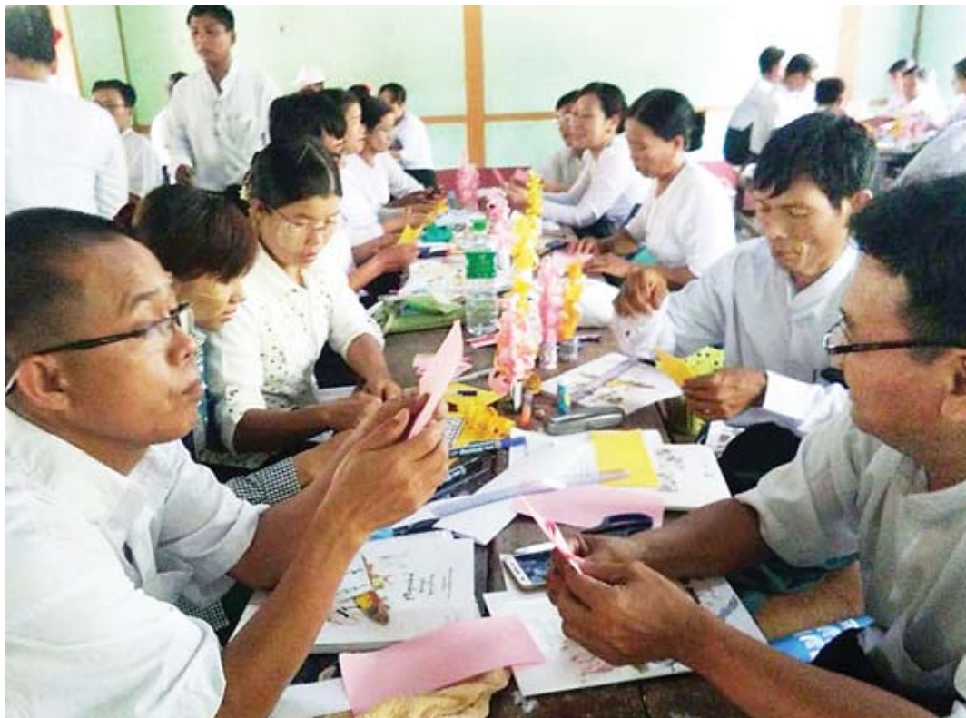
ဒုတိယတန်း (Grade - 2) ကျောင်းသုံး စာအုပ် အုပ်အသစ်များနှင့် ဆရာကိုင် စာအုပ် များ အသုံးပြုပြီး သင်ကြားသင်ယူရန် အတွက် မူလတန်းပြ ဆရာ ဆရာမများ အားလုံးကို ၂၀၁၀ ခုနှစ် ဧပြီလနှင့် မေ လတို့တွင် သင်ကြား သင်ယူမှုနည်းလမ်း များ သင်တန်းပေးခဲ့ သည်။

မြန်မာနိုင်ငံ၏ ရေရှည်တည်တံ့ခိုင်မြဲပြီး ဟန်ချက်ညီသော ဖွံ့ဖြိုးတိုးတက်မှု စီမံကိန်း (MSDP) မျှော်မှန်းရလဒ်များကို ပိုမိုအရှိန်အဟုန်မြှင့်တင် အကောင်အထည်ဖော်ရန် ပညာရေးဝန်ကြီးဌာနသည် ပညာရေးပြုပြင် ပြောင်းလဲမှုများအား စနစ်တကျ ထိထိရောက်ရောက်နှင့် ပွင့်လင်းမြင်သာစွာ အကောင်အထည်ဖော်ရေး ကြိုးပမ်းဆောင်ရွက်ရာတွင် အဓိကစိန်ခေါ်မှုများ ရှိနေပြီး ပညာသင်ယူရန် အခက်အခဲရှိသောသူများ၊ လိုအပ်ချက်ရှိသော ဒေသများကို ပိုမိုဖြည့်ဆည်းပံ့ပိုးပေးရေး၊ ကျောင်းနေခြင်းနှင့် ကျောင်းထွက် နှုန်းမြှင့်တင်ရေးများကို လျှော့ချရေး၊ ကျောင်းသားဦးရေ တိုးလာသဖြင့် စာသင်ခန်းလိုအပ်ချက်နှင့် အခြေခံအဆောက်အအုံစာသင်တို ဖြည့်ဆည်းရေး၊ ကျောင်းသား၊ ဆရာအချိုး မျှတရေး၊ ဆရာ ဆရာမများ၏ အရည်အသွေး မြှင့်တင်ရေး၊ မူလတန်းပညာသင်ယူနေသူအားလုံး မူလတန်းပညာသင်ယူ ပြီးမြောက်ပြီး အလယ်တန်း၊ အထက်တန်းပညာဆက်လက်သင်ယူပြီး မြောက်ရေး၊ သက်မွေးဝမ်းကျောင်းသင်တန်းများသို့ တက်ရောက်ပြီး ကျွမ်းကျင် သူများ ဖြစ်လာရေးတို့အတွက် ကြိုးပမ်းဆောင်ရွက်သွားမည်ဖြစ်ပြီး ပညာရေး အရည်အသွေးမြှင့်တင်ရေးလမ်းညွှန် အလေးထားကြိုးပမ်းအကောင်အထည်ဖော် ဆောင်ရွက်လျက်ရှိနေပါကြောင်း တင်ပြလိုက်ရပါသည်။