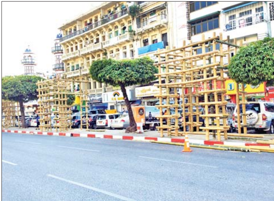
ပိတောက်ပန်းများဖြင့် အလှဆင်

ထို့အပြင် ဆူးလေဘုရားလမ်းမလယ်တွင် ဆူးလေစေတီမြောက်ဘက်မှအနီးမှ ဆူးလေဘုရားလမ်းနှင့် အနော်ရထာလမ်းဆုံရှိ ခုံးကျော်တံတားအထိ ပေ ၃၀၀ ကျော်ကို ဝါးထရုံ၊ ကျူဖျာဖြင့် အလှဆင်ကာရံပြီး ပိတောက်ပန်းများဖြင့် ဝေဝေဆာဆာထားရှိမည်ဖြစ်သည်။