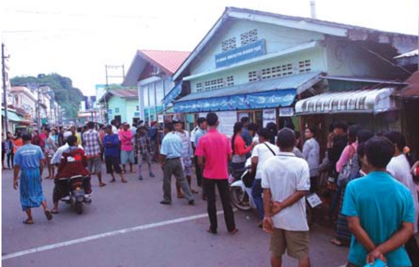
ဒေသခံမြို့နေပြည်သူများသည် အများအားဖြင့် မြန်မာ့ရိုးရာသင်္ကြန်အကြိုနေ့နှင့် အကျနေ့များတွင် တစ်ဖက်ထိုင်းနိုင်ငံ သင်္ကြန်ပွဲတော်အား သွားရောက်လည်ပတ်ဆင်နွှဲလေ့ရှိပြီး သင်္ကြန်အကြိုနေ့နှင့် အတက်နေ့များတွင် မြန်မာနိုင်ငံဘက်တွင် ပျော်ရွှင်စွာ ရေပက်ကစားဆင်နွှဲကြလေ့ရှိသည်။ အဆိုပါနေ့များတွင် ထိုင်းနိုင်ငံဘက်မှ နိုင်ငံခြားသားဧည့်သည်များလည်း ကော့သောင်းမြို့ သင်္ကြန်ပွဲတော်သို့ အပြန်အလှန် လာရောက်ဆင်နွှဲလေ့ရှိကြောင်း သိရသည်။ ကျော်စိုး (ကော့သောင်း)

ကော့သောင်း ဧပြီ ၉ မြန်မာ့ရိုးရာ မဟာသင်္ကြန်ပွဲတော် ရက်များမတိုင်မီ ယခုရက်ပိုင်းအတွင်း ထိုင်း-မြန်မာ နယ်စပ်မြို့ဖြစ်သည့် ကော့သောင်းမြို့မှ ထိုင်းနိုင်ငံရနောင်းမြို့သို့ သွားရောက်လည်ပတ်ကြသူ များပြားသဖြင့် ကော့သောင်းမြို့ လူဝင်မှုကြီးကြပ်ရေး နယ်စပ်ဖြတ်သန်းကိတ်တွင် သွားရောက်လည်ပတ်မည့်သူများ ဧပြီ ၉ ရက် နံနက်ပိုင်းက နယ်စပ်ဖြတ်သန်းမှု အခွန်ဆောင်ရန် တန်းစီစောင့်ဆိုင်းနေသူများဖြင့် စည်ကားလျက်ရှိသည်ကို တွေ့မြင်ရသည်။