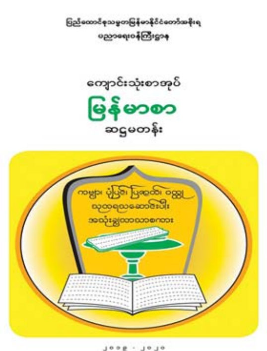
၂၀၁၉-၂၀၂၀ ပညာသင်နှစ်တွင် စတင်အသုံးပြုမည့် သင်ရိုးသစ် Grade-6 ကျောင်းသုံးစာအုပ်များ။

(Mentor)သင်တန်း လက်ကမ်းစာစောင်နှင့် သင်တန်းနည်းပြလက်စွဲ စာအုပ် တို့ကို ပြန်လည်ပြင်ဆင်ရေးသားခြင်းများ လုပ်ဆောင်ခဲ့ကြောင်း သိရှိရသည်။ ကမ္ဘာ့ဘဏ်နှင့်ပူးပေါင်း၍ မူလတန်းအောက်ဆင့် ကလေးများ၏ သင်ရိုးစွမ်းရည်စစ်ဆေးအကဲဖြတ်မှု (Early Grade Mathematics Assessment-EGMA) နှင့် စာဖတ်စွမ်းရည်စစ်ဆေးအကဲဖြတ်မှု သုတေသန လုပ်ငန်း (Early Grade Reading Assessment-EGRA) ကို National Level ဆောင်ရွက်နိုင်ရန် တိုင်းဒေသကြီးနှင့် ပြည်နယ်များမှ ရွေးချယ်ထားသည့် မြို့များသို့ သွားရောက်ပြီး ဆရာ ဆရာမများ၊ ကျောင်းသား ကျောင်းသူများအား ကွင်းဆင်းသုတေသနလုပ်ဆောင်ခဲ့သည်။ မူလတန်း အောက်ဆင့် ကလေးများ စာဖတ်စွမ်းရည်တိုးတက်ရေးလုပ်ငန်း လမ်းညွှန် စာအုပ်ပြုစုခြင်း၊ ရှမ်းပြည်နယ်တောင်ပိုင်းမြို့နယ် ၁၀ မြို့နယ်ရှိ အခြေခံ ပညာကျောင်း ၃၀ မှ မူလတန်းအောက်ဆင့် မြန်မာစာသင်ကြားနေသော ဆရာ ဆရာမ ၈၈ ဦး အား သင်တန်းပေးခြင်းများလည်း ပြုလုပ်ခဲ့ကြောင်း သိရသည်။