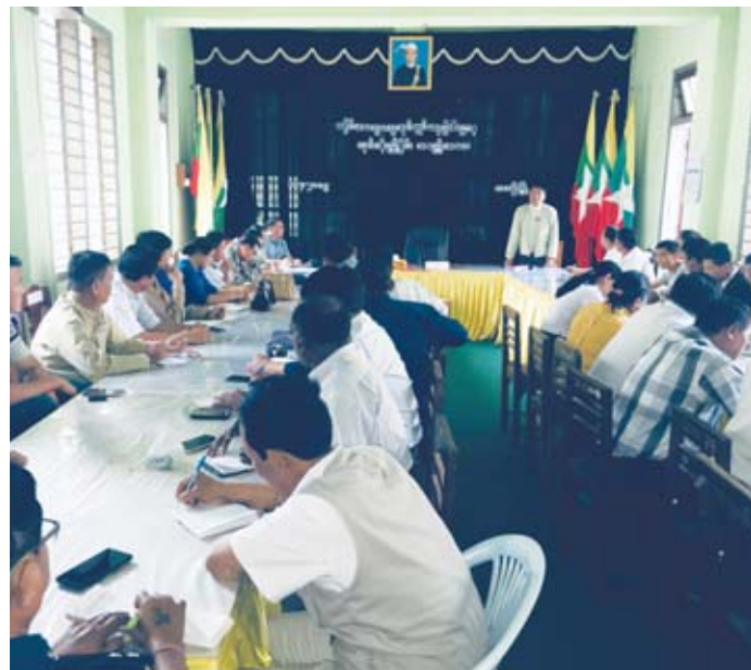
မုံရွာမြို့၊ ချင်းတွင်းသင်္ကြန် ကျင်းပမည့်ကွင်းအတွင်း အပူရှိန်လျှော့ချရန် ရေပန်း ၁၀၀ ကျော်တပ်ဆင်

ပါဝင်ယှဉ်ပြိုင်ခဲ့ကာ ပြည်သူ့ဂုဏ်ဆောင် တိုင်းကျိုးပြည်ပြု သံချပ်အဖွဲ့ (မန္တလေး) က ပထမဆုကိုလည်းကောင်း၊ တိုးတက်သောလူငယ်များ၏ လူထုကိုယ်စား ပြု ကာဒိုင်းသံချပ်အသင်း (မုံရွာ) က ဒုတိယဆု ကိုလည်းကောင်း၊ ဒုတိယရေသောက်မြစ် မန္တလေးသံချပ်အသင်းက တတိယဆုကို လည်းကောင်း အသီးသီးရရှိခဲ့ကြောင်း ထွန်းထွန်းနိုင် သိရသည်။