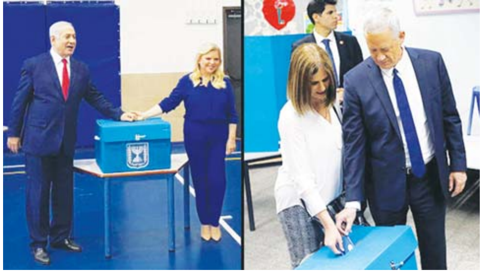
အစွရေးဝန်ကြီးချုပ် ဘင်ဂျမင်နေတန်ယာဟု ဆန္ဒမဲ ထည့်နေစဉ်။

အစွရေးအထွေထွေရွေးကောက်ပွဲတွင် မဲဆန္ဒပေးကြသည့် မဲရုံများကို ဧပြီ ၉ ရက် ည ၁၀ နာရီတွင် ပိတ်သိမ်းမည်ဖြစ်ပြီး ဧပြီ ၁၀ ရက် နံနက်အစောပိုင်းတွင် ကနဦးမဲရလဒ်များ ထွက်ပေါ်လာမည်ဟု မျှော်လင့်ရကြောင်း ဒေသတွင်းသတင်းများ၌ ဖော်ပြသည်။ အင်န်အိတ်ချ်ကေ