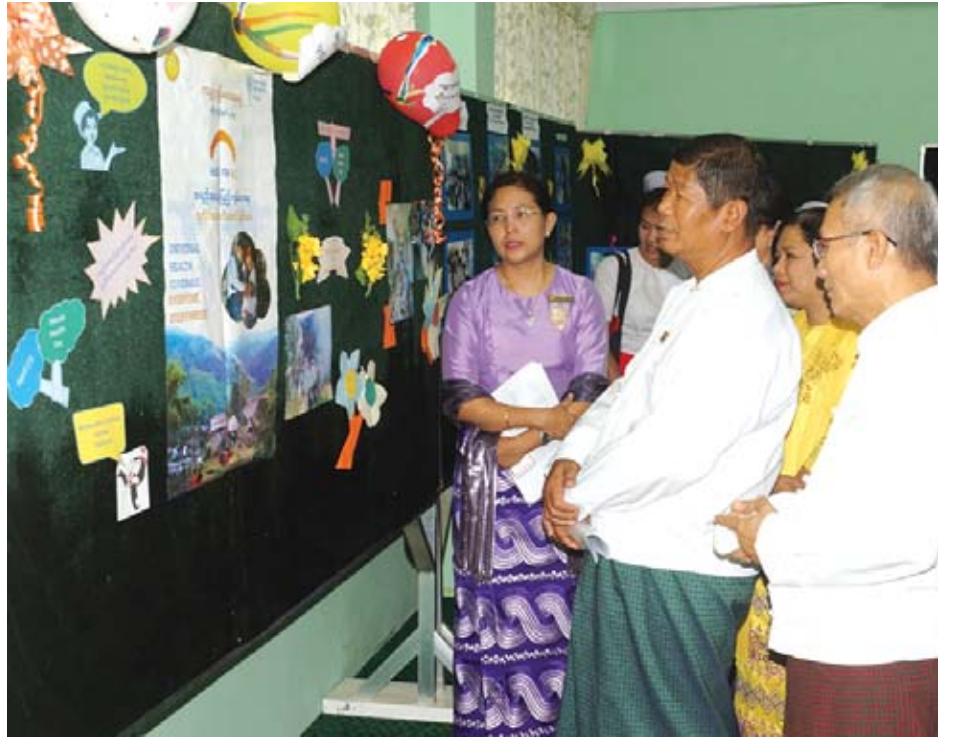
ယင်းနောက် စံပြုမြို့နယ်ဆေးရုံဆရာ စံပြုတိုက်နယ် ဆေးရုံဆရာနှင့် စံပြုမြို့နယ်ပြည်သူ့ကျန်းမာရေးဦးစီးဌာန တို့အား နေပြည်တော်ကောင်စီဝင် ဦးတင်ထွန်းနှင့် တာဝန်ရှိသူများက ဆုများအသီးသီးပေးအပ်ချီးမြှင့်ကြပြီး ခင်းကျင်းပြသထားသည့် လုပ်ငန်းဆောင်ရွက်မှုပြခန်းများကို လှည့်လည်ကြည့်ရှုအားပေးခဲ့ကြကြောင်း သိရသည်။ ရွှေကုက္ကို

ထို့နောက် ကမ္ဘာ့ကျန်းမာရေးအဖွဲ့ အရှေ့တောင်အာရှဒေသဆိုင်ရာ ညွှန်ကြားရေးမှူး၏ ၂၀၁၉ ခုနှစ် ကမ္ဘာ့ကျန်းမာရေးနေ့အထိမ်းအမှတ် သဝဏ်လွှာကို နေပြည်တော်ကုသရေးဦးစီးဌာနမှ ဒုတိယကုသရေးဦးစီးဌာနမှူး ဒေါက်တာဆွေဇင်ဝင်းက ဖတ်ကြားသည်။