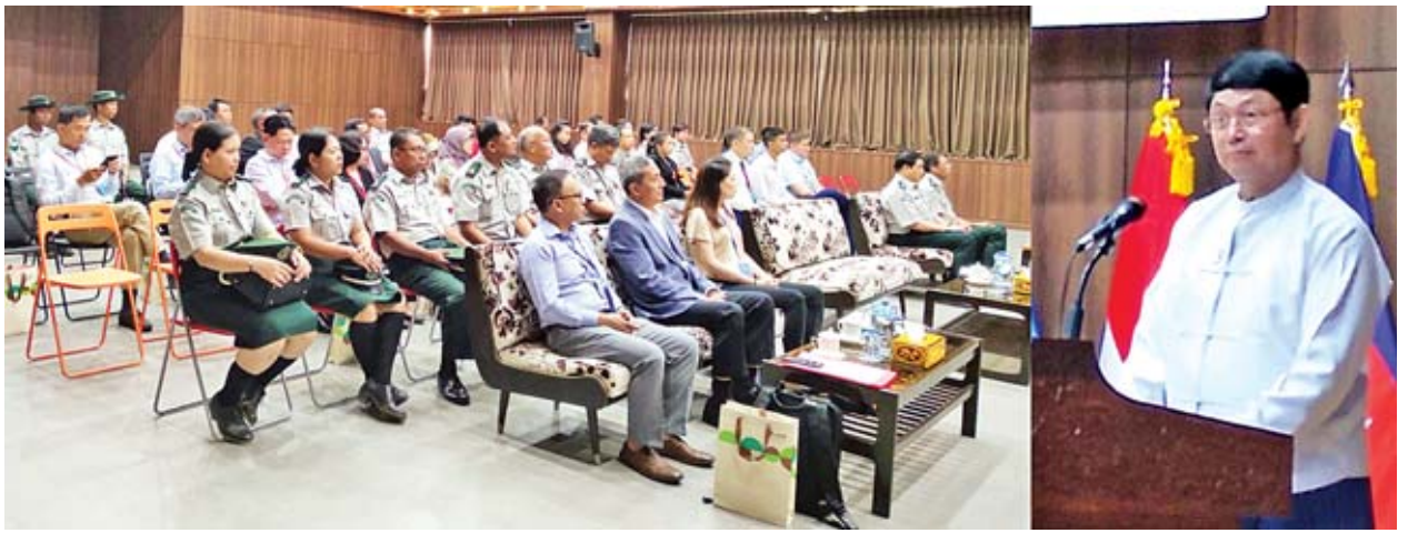
သင်တန်းတွင် AFOCO အဖွဲ့ဝင်နိုင်ငံများဖြစ်သည့် ဘူတန်၊ မိတ်ကြားထားသော ဧည့်သည်တော်များ တက်ရောက်ပြီး သင်တန်းကို ဧပြီ ၈ ရက်မှ ၁၂ ရက်အထိ ၅ ရက်တာ ကျင်းပသွားမည်ဖြစ်ကြောင်း သိရသည်။

အဆိုပါ သင်တန်းကို AFOCO စီမံကိန်းများကို သိမြင်နားလည်မှု မြှင့်တင်လာစေရန်၊ စီမံကိန်းရေးဆွဲဖော်ထုတ်ခြင်း လုပ်ငန်းစဉ်များကို လေ့လာ သိရှိနိုင်စေရန်နှင့် AFOCO ၏ မဟာဗျူဟာနှင့် စီမံကိန်းလက်စွဲများနှင့် အညီ သင်တန်းသားများ၏စီမံကိန်းနှင့် အဆိုပြုလွှာရေးဆွဲခြင်းဆိုင်ရာ စွမ်းဆောင်ရည်များကို မြှင့်တင်ပေးရန် ရည်ရွယ်လျက် ဖွင့်လှစ်ခဲ့ခြင်းဖြစ်ကြောင်း သိရသည်။