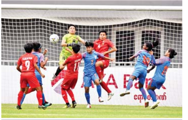
မြန်မာအမျိုးသမီးအသင်းနှင့်အိန္ဒိယအမျိုးသမီးအသင်းတို့ ယှဉ်ပြိုင်ကစားနေစဉ်။

ရန်ကုန် ဧပြီ ၉ မြန်မာနိုင်ငံက အိမ်ရှင်အဖြစ် လက်ခံကျင်းပနေသည့် ၂၀၂၀ တိုကျိုအိုလံပစ် အမျိုးသမီး တောလုံး ဒုတိယအဆင့်ခြေစစ်ပွဲ အုပ်စု (က) နောက်ဆုံးနေ့ကို ယနေ့ညနေပိုင်းက မန္တလေးမြို့ရှိ ကွင်းနှစ်ကွင်း၌ တစ်ပြိုင်နက် ကျင်းပရာ မြန်မာအသင်းသည် အိန္ဒိယအသင်း ကို သရေကစားပြီး တတိယအဆင့်ခြေစစ်ပွဲသို့ တက်ရောက်သွားသည်။ (မန္တလေးသီရိကွင်း) မြန်မာ - သုံးဂိုး အိန္ဒိယ - သုံးဂိုး မြန်မာအမျိုးသမီးအသင်းသည် အုပ်စုနောက်ဆုံးပွဲတွင် အိန္ဒိယအသင်းကို သရေ ကစားပြီး တတိယအဆင့်ခြေစစ်ပွဲသို့ တက်ရောက်ခွင့်ရခဲ့သည်။ အိန္ဒိယအသင်း၏ ကစားပုံကြောင့် မြန်မာအသင်းသည် သရေရလဒ်ရယူနိုင်ရန် ခက်ခက်ခဲခဲကစားခဲ့ရပြီး နှစ်ကြိမ်တိုင် နောက်မှလိုက်ကစားကာ သရေတစ်မှတ်ရယူနိုင်ခဲ့ခြင်းဖြစ်သည်။ မြန်မာ အမျိုးသမီးအသင်းသည် မထင်မှတ်ဘဲ ရုန်းကန်ခဲ့ရသော်လည်း လိုအပ်နေသည့် အမှတ်ကို ရယူနိုင်ခဲ့ခြင်းဖြစ်သည်။ စာမျက်နှာ ၁၃ ကော်လံ ၁ သို့ ၀