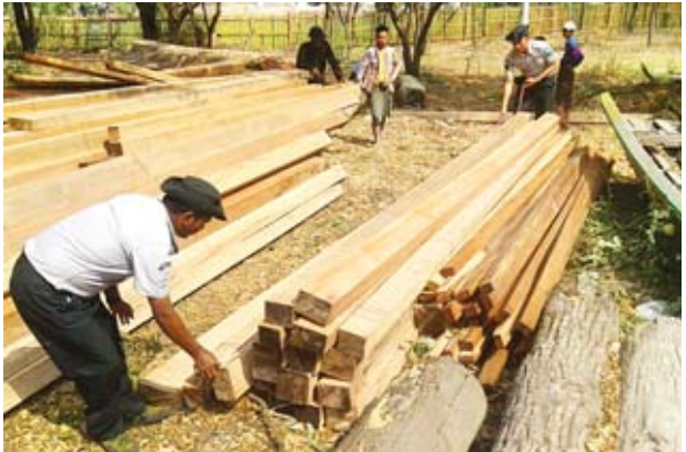
စုစုပေါင်း ၉ ဒဿမ ၇၅၈၈ တန်ကို သိမ်းဆည်းရမိခဲ့ကြောင်း သိရ

နေပြည်တော် ဧပြီ ၉ သစ်တောဦးစီးဌာနသည် တရားမဝင် သစ်နှင့် သစ်တောထွက်ပစ္စည်းများကို နည်းလမ်းမျိုးစုံဖြင့် ရှာဖွေဖမ်းဆီး လျက်ရှိရာ သစ်တောဦးစီးဌာနမှ ဝန်ထမ်းများ၊ မြန်မာနိုင်ငံရဲတပ်ဖွဲ့ဝင် များနှင့် ကျေးရွာအုပ်ချုပ်ရေးမှူးများ ပါဝင်သော ပူးပေါင်းအဖွဲ့သည် ဧပြီ ၄ ရက်မှ ၈ ရက်အတွင်း ပဲခူးတိုင်း ဒေသကြီး ပေါက်ခေါင်းမြို့နယ် အရှေ့ တောင်ဘက် လေးမိုင်ခန့်အကွာ တောင်ကုန်းအနီးမှ တရားမဝင် ကျွန်း၊ ပျဉ်းကတိုး၊ သစ်ဖြူ သစ်ခွဲသား