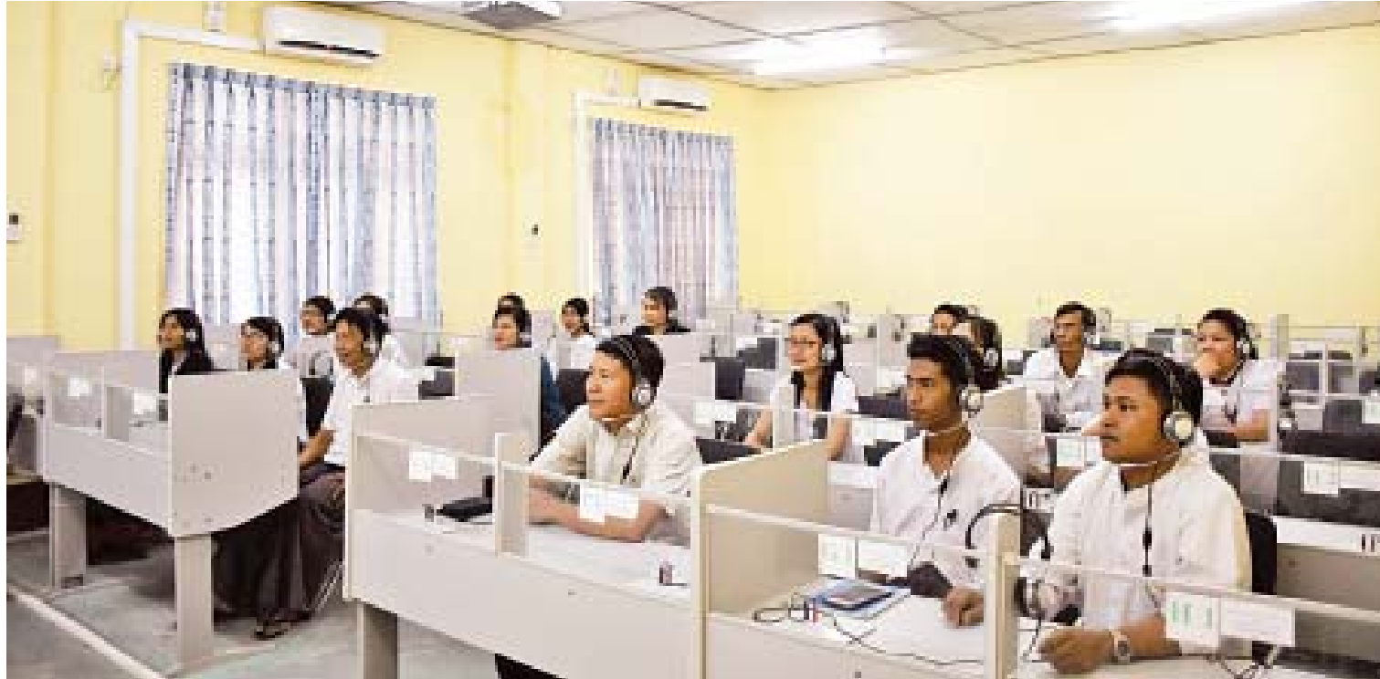
ပြည်ထောင်စုစာရင်းစစ်ချုပ်ရုံး၏ ဌာနတွင်း အင်္ဂလိပ်စာသင်တန်း သင်ကြားပို့ချစဉ်။

ပြည်ထောင်စုစာရင်းစစ်ချုပ်ရုံးရဲ့ လုပ်ငန်းဆောင်ရွက်မှုတွေ ပိုမိုတိုးတက်ကောင်းမွန်ရန်၊ ပွင့်လင်းမြင်သာမှု ပိုမို ရှိလာရန်၊ တာဝန်ခံ/တာဝန်ယူဆောင်ရွက်မှုကို သေချာစွာရရှိရန်၊ အင်္ဂတိလိုက်စားမှုတိုက်ဖျက်ရန်၊ အများပြည်သူ ရဲ့ ယုံကြည်ကိုးစားမှု တိုးမြှင့်ရရှိနိုင်ရန်၊ နိုင်ငံသားတွေရဲ့ တန်ဖိုးထားမှုနဲ့ အကျိုးစီးပွားအတွက် ပြည်သူ့ဘဏ္ဍာ အရင်းအမြစ်တွေကို စွမ်းဆောင်ရည်ပြည့်ဝပြီး ထိရောက်စွာရယူသုံးစွဲခြင်းကို မြှင့်တင်ရန်အတွက် နိုင်ငံတကာ စံနှုန်းနဲ့အညီ ဆောင်ရွက်နိုင်သော အရည်အသွေးပြည့်ဝတဲ့ ဝန်ထမ်းတွေနဲ့ နိုင်ငံတော်အစိုးရကို အကူအညီပေး နိုင်ရန် “ပြည်သူ့ဘဏ္ဍာစီမံခန့်ခွဲမှု တိုးတက်ကောင်းမွန်စေရေး ထိန်းကျောင်းပေး” ဆိုတဲ့ ဆောင်ပုဒ်နဲ့အညီ ကြိုးပမ်းဆောင်ရွက်လျက်ရှိ