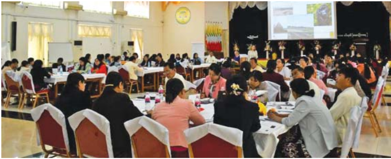
ပြည်ထောင်စုစာရင်းစစ်ချုပ်ရုံးနှင့် နော်ဝေနိုင်ငံ စာရင်းစစ်ချုပ်ရုံးတို့ ပူးပေါင်း၍ ပတ်ဝန်းကျင်ဆိုင်ရာ စာရင်းစစ်ဆေးခြင်း အလုပ်ရုံဆွေးနွေးပွဲ ကျင်းပစဉ်။

ဖြေ။ ။ မြန်မာနိုင်ငံ စာရင်းကောင်စီ ဥပဒေ(၂၀၁၅) ပြင်ဆင်တဲ့ဥပဒေကို ၂၀၁၉ ခုနှစ် ပြည်ထောင်စုလွှတ်တော်ဥပဒေ အမှတ်(၅)နဲ့ ယခုနှစ် ဇန်နဝါရီလ ၃၀ ရက်မှာ ပြဋ္ဌာန်းနိုင်ခဲ့ပြီဖြစ်ပါတယ်။ ပြောင်းလဲမှုတွေ ဖြစ်လာမယ့်အချက်တွေက ပြည်ထောင်စု လွှတ်တော်ဥပဒေအမှတ် ၃၁ နဲ့ ၂၀၁၅ ခုနှစ် ဇွန်လ ၅ ရက်က ပြဋ္ဌာန်းခဲ့တဲ့ မြန်မာနိုင်ငံ အထူးကဏ္ဍ [ ၁ ] သို့ »»