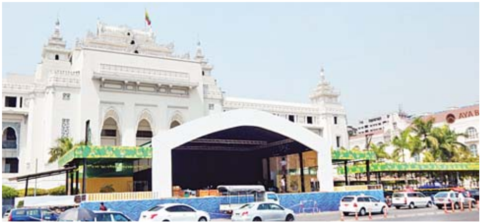
၁၃၈၀ ပြည့်နှစ် ရန်ကုန်မြို့တော် မဟာသင်္ကြန်ရေသဘင်မဏ္ဍပ် ဆောက်လုပ်ပြီးစီးနေမှုကို ယနေ့ ညနေပိုင်းက တွေ့ရစဉ်။

“ဒီနှစ်အတွက်ကတော့ ပြည်သူလူထုအကြား ကျယ်ကျယ်ပြန့်ပြန့် ပညာပေးလုပ်ဆောင်ရန်နဲ့ ပြည်ပ နိုင်ငံတွေလို ကျောင်းနေအရွယ်ကလေးတွေ အမှိုက်တွေ ကို စနစ်တကျစွန့်ပစ်နိုင်ကြဖို့နဲ့ ခွဲခြားတတ်ဖို့အတွက်ကို လူစုလူဝေးရှိတဲ့နေရာဖြစ်တဲ့ ဗဟိုမဏ္ဍပ်အပါအဝင် အခြားခရိုင်နဲ့ မြို့နယ်တွေက မဏ္ဍပ်တွေမှာပါ ပရဟိတအဖွဲ့ တွေ၊ စည်ပင်ကလောင်တွေနဲ့ အသိပညာပေးလုပ်ဆောင်