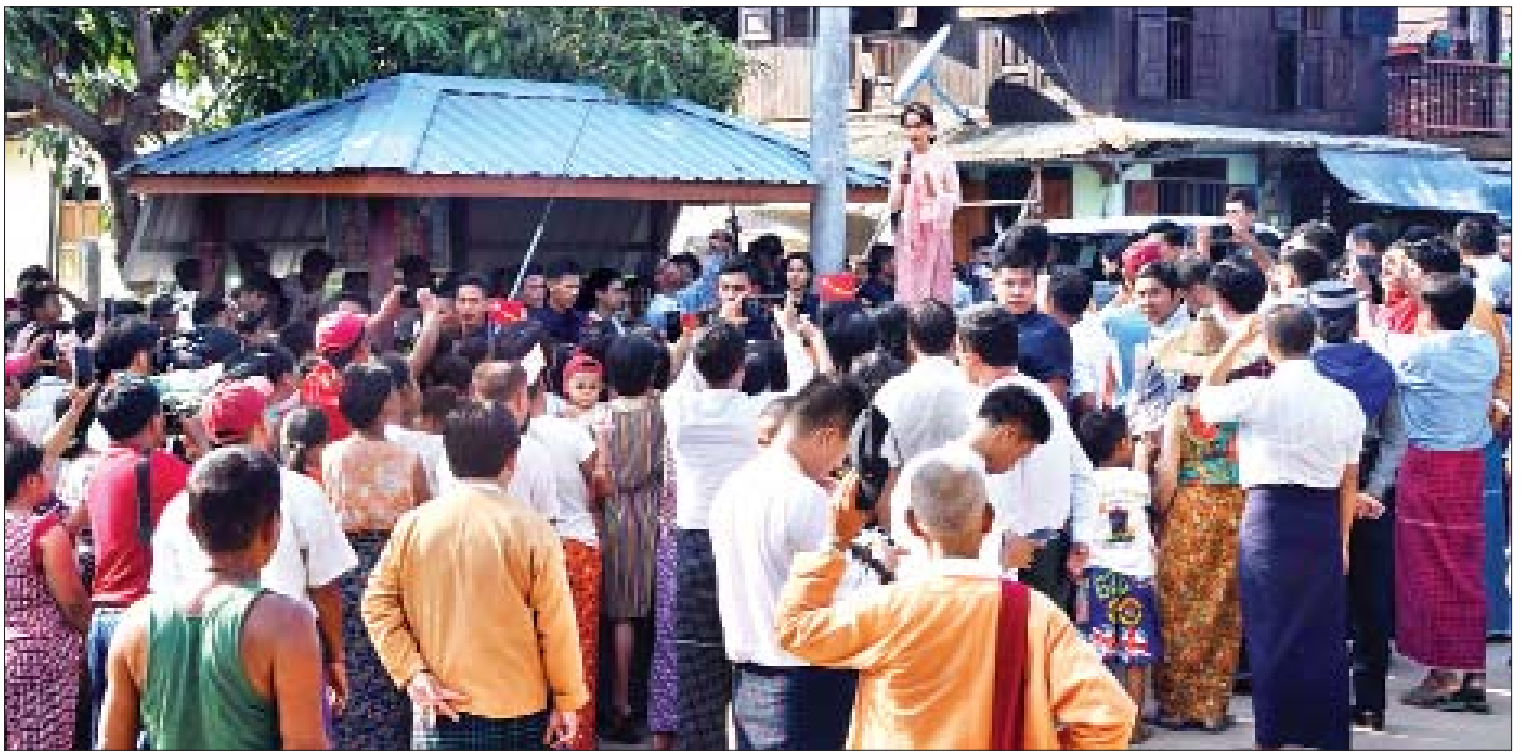
နိုင်ငံတော်၏အတိုင်ပင်ခံပုဂ္ဂိုလ် ဒေါ်အောင်ဆန်းစုကြည် ချောင်းဆုံမြို့နယ် ရွာလွတ်ကျေးရွာ ဒေသခံပြည်သူများနှင့် တွေ့ဆုံအမှာစကားပြောကြားစဉ်။

လှေများဖြတ်သန်းရာတွင် အခက်အခဲရှိခြင်း၊ ကမ်းဘေးရှိ ကျေးရွာများတွင် ရေကြီးရေလျှံမှုများ ခံစားနေရခြင်းတို့ကြောင့် သံလွင်မြစ်အတွင်းရှိ သောင်များကို တူးဖော်ပေးရေး၊ မော်လမြိုင် တက္ကသိုလ်တွင် DBL, DIL, MBA, MPA ဘွဲ့လွန် ဒီပလိုမာသင်တန်းများ ဖွင့်လှစ်သင်ကြားပေးရေး၊ ချောင်းဆုံ မြို့နယ် ကရင်ဝင်းစိန်-ဝဲကူး-တော်ပွန်လမ်းအား လမ်းချဲ့၍ တွန့်ကရစ်လမ်းအဖြစ် အဆင့်မြှင့်တင်ပေးရေးနှင့် လယ်သမားများက လမ်းချဲ့ခြင်းအတွက် မလွတ်ကင်းသည့် လမ်းဘေးဝဲ၊ ယာ လယ်ယာမြေများမှ မြေစရိယာများ လှူဒါန်းပေးသွားမည့် အခြေအနေ၊ ချောင်းဆုံမြို့နယ် ဖံပ-ထန်းပင်ကုန်းမြေသားလမ်းအား လမ်းချဲ့၍ ကတ္တရာလမ်းအဖြစ် ဆောင်ရွက်ပေးရေး၊ ကျိုက်မရောမြို့နယ် အနောက်ဘက်ခြမ်းတွင် ကဒါကျေးရွာအပါအဝင် ကျေးရွာပေါင်း ၃၂ ရွာယနေအထိ လျှပ်စစ်မီးမရရှိသေးမှု၊ ဓာတ်အားလိုင်းများ တပ်ဆင်ထားပြီးဖြစ်သော်လည်း ဓာတ်အားခွဲရုံ လိုအပ်နေသဖြင့် ဓာတ်အားခွဲရုံ တစ်ရုံ တည်ဆောက်ပေးရေး၊ ကျိုက်ပရံ-ကော့ဘီး လမ်းနှင့် ၎င်းလမ်းပေါ်ရှိ တံတားနှစ်စင်းအား ပြုပြင်ဆောင်ရွက်ပေးရေး၊ မုဒုံမြို့နယ် ဝဲကလိကျေးရွာနှင့် ဘလောက်ညောင်ပိုင်းကျေးရွာကို ဆက်သွယ်သည့် ဝဲကလိချောင်းကူးတံတား အမြန်အကောင်အထည်ဖော်ပေးရေး၊ မုဒုံမြို့နယ် ဆက်သွယ်နီးပဒေါလမ်းနှင့် တံတားအား ပြင်ဆင်ပေးရေး