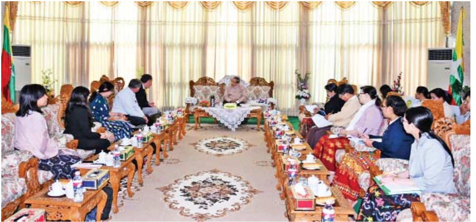
ပြည်ထောင်စုစာရင်းစစ်ချုပ် ဦးမော်သန်း ကမ္ဘာ့ဘဏ်ကိုယ်စားလှယ်အဖွဲ့အား လက်ခံတွေ့ဆုံစဉ်။

ဖြေ။ ။ ပြည်ထောင်စု စာရင်းစစ်ချုပ်ရုံးနဲ့ နော်ဝေနိုင်ငံ စာရင်းစစ်ချုပ်ရုံးတို့ အကြား ပူးပေါင်းဆောင်ရွက်မှု သဘောတူညီ ချက် နားလည်မှုစာချုပ်သဘာဝ (MoU) လက်မှတ် ရေးထိုးထားသကဲ့သို့ အာရှဖွံ့ဖြိုးရေး ဘဏ် (ADB)၊ ကမ္ဘာ့ဘဏ် (World Bank)၊ ဂျာမန်အပြည်ပြည်ဆိုင်ရာ ပူးပေါင်း ဆောင်ရွက်မှုအဖွဲ့ (GIZ)၊ ဥရောပသမဂ္ဂ (EU) တို့နှင့် တွေ့ဆုံဆွေးနွေးမှုအရ နိုင်ငံ တကာစာရင်းစစ်ချုပ်ရုံးတွေ လိုက်နာရမယ့် စံတွေ (ISSAI) အခြေပြုဘဏ္ဍာရေး စာရင်း စစ်ဆေးခြင်း၊ လုပ်ငန်းဆောင်ရွက်မှုစစ်ဆေး ခြင်း၊ လိုက်နာမှုစစ်ဆေးခြင်းဆိုင်ရာ လမ်းညွှန် တွေ ထုတ်ပြန်နိုင်ရေး၊ IT Audit ဆောင်ရွက် နိုင်ရေးတို့အတွက် အလုပ်ရုံဆွေးနွေးပွဲတွေ ကျင်းပခြင်း၊ Performance Audit လက်တွေ့စမ်းသပ်စစ်ဆေးခြင်း (Pilot Audit) တွေအတွက် Pre Planning ကြိုတင်ပြင်ဆင်ခြင်း၊ Financial Audit