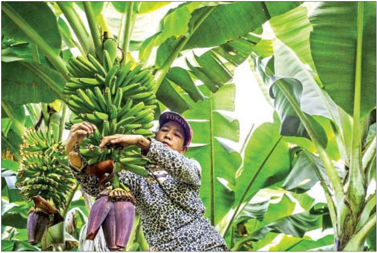
ဝိုင်းမော်မြို့နယ်ရှိ ငှက်ပျောစိုက်ခင်းတစ်ခုကို တွေ့ရစဉ်။

နေပြည်တော် ဧပြီ ၄ မြန်မာနိုင်ငံ သတင်းစာဆရာအသင်းမှ ကြီးမှူးပြီး Star Award 2018 ရုပ်ရှင်နှင့် ရုပ်သံဇာတ်လမ်းတွဲ ထူးချွန်ဆုချီးမြှင့်ပွဲအခမ်းအနားကို ဧပြီ ၅ ရက် ညနေ ၆ နာရီတွင် ရန်ကုန်မြို့သုဝဏ္ဏဘူမိ Event Park ၌ ကျင်းပသွားမည်ဖြစ်သည်။ ထုတ်လွှင့်ပြသ ယင်းအခမ်းအနားကျင်းပပုံများကို မြန်မာ့အသံနှင့် ရုပ်မြင်သံကြား (MRTV) မှ ညနေ ၅ နာရီမှစတင်၍ ည ၈ နာရီအထိ တိုက်ရိုက် ထုတ်လွှင့်သွားမည်ဖြစ်ပြီး ည ၈ နာရီသတင်းအပြီးတွင် ဆက်လက်ထုတ်လွှင့် ပြသသွားမည်ဖြစ်ကြောင်း သိရသည်။ သတင်းစဉ်