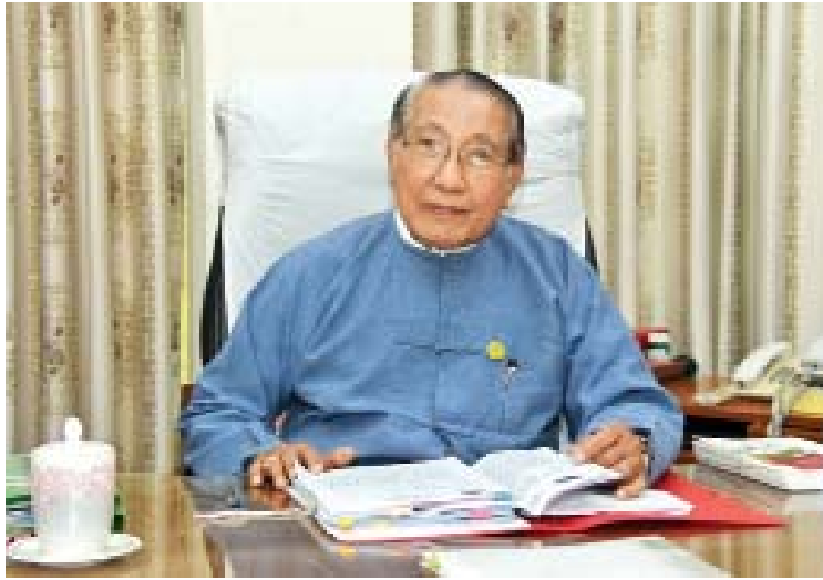
ပြည်ထောင်စုစာရင်းစစ်ချုပ် ဦးမော်သန်း

သက်ရောက်မှုရှိခြင်း ရှုထောင့်တွေနဲ့ ပြည်ထောင်စုဘဏ္ဍာငွေ အရအသုံးဆိုင်ရာ ဥပဒေ၊ ပြည်ထောင်စု၏ အခွန်အကောက်ဥပဒေ၊ အချိုးသားစီမံကိန်းဥပဒေတို့အပေါ် အကောင်အထည်ဖော်နိုင်မှုတို့အပြင် အစိုးရရဲ့ ကြွေးမြီနဲ့ ပြည်ထောင်စုဘဏ္ဍာရန်ပုံငွေနဲ့ ဆက်စပ်ဆောင်ရွက်တဲ့ ကြွေးမြီ၊ အပ်ငွေ၊ ယာယီစာရင်းတွေရဲ့ စစ်ဆေးတွေ့ရှိချက်တွေကို ဖော်ပြထားပါတယ်။ မေး။ ။ ပြည်ထောင်စု လွှတ်တော်ဆိုင်ရာ ဖွံ့ဖြိုးရေးရန်ပုံငွေကို စစ်ဆေးဆောင်ရွက်ခဲ့မှုကို ရှင်းပြပေးပါဦး ခင်ဗျာ။ ဖြေ။ ။ ဒါ့အပြင် ပြည်ထောင်စုလွှတ်တော်ဆိုင်ရာ ဖွံ့ဖြိုးရေးရန်ပုံငွေနဲ့ ဆောင်ရွက်တဲ့ ဒေသဖွံ့ဖြိုးရေးလုပ်ငန်းတွေကိုလည်း ၂၀၁၃ - ၂၀၁၄ ဘဏ္ဍာနှစ်က စတင် စစ်ဆေးပြီး ၂၀၁၇ - ၂၀၁၈ ဘဏ္ဍာနှစ်အထိ နှစ်စဉ် အစီရင်ခံစာတင်ပြလျက်ရှိတဲ့အတွက် ဒေသဖွံ့ဖြိုးရေးလုပ်ငန်းတွေ စနစ်တကျ တိုးတက်ဖြစ်ပေါ်မှုကို အထောက်အကူပြုလျက်ရှိပါတယ်။ ဒီကာလအတွင်း လုပ်ငန်းတာဝန်တစ်ခုက နိုင်ငံတော်သမ္မတချုပ်ရုံး၊ တာဝန်ပေးချက်အရ တိုင်းဒေသကြီး၊ ပြည်နယ် အစိုးရအဖွဲ့တွေနဲ့