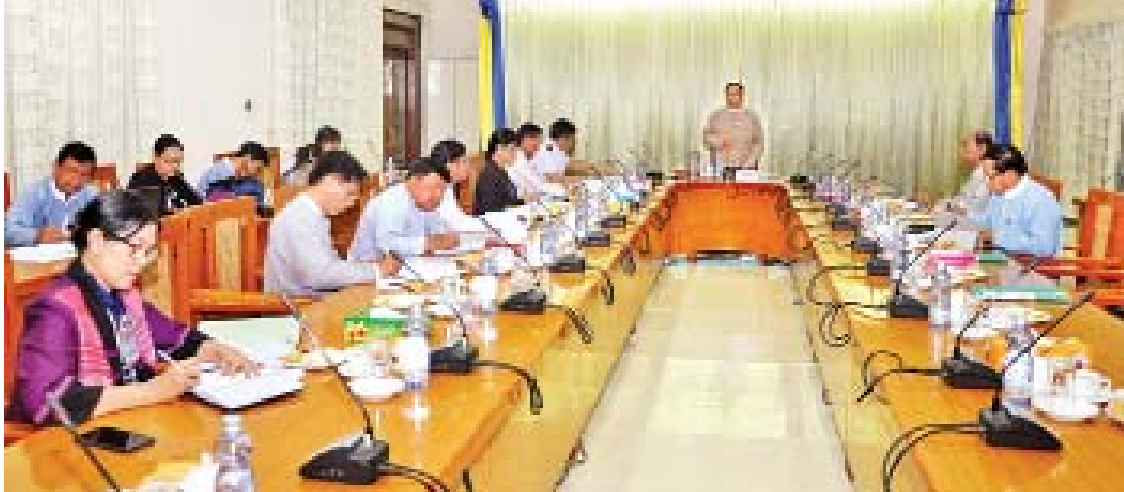
Myanmar Sat-2 အား ထိရောက်အကျိုးရှိစွာ အသုံးပြုနိုင်ရေး ဦးစားပေးဆောင်ရွက်ရန်ဖြစ်သည့် မြန်မာနိုင်ငံပိုင် အနိမ့်ပျံဂြိုဟ်တု လွှတ်တင်နိုင်ရေးကို ဆက်ကော်မတီဖွဲ့စည်း ထားပြီးဖြစ်၍ ဆောလျင်စွာ အကောင်အထည်ဖော်ဆောင်ရွက်ရေး၊ Space Agency ဖွဲ့စည်းဆောင်ရွက်ရေးတို့ကို အကောင်အထည်ဖော်ဆောင်ရွက်ရန် ပြောကြားသည်။ ယင်းနောက် အစည်းအဝေးတက်ရောက်

မြန်မာနိုင်ငံပိုင်ဂြိုဟ်တုစနစ် တည်ထောင်ရေးအတွက် ဦးဆောင်ကော်မတီ၏ လမ်းညွှန်ချက်များအား အကောင်အထည်ဖော် ဆောင်ရွက်နိုင်ရန် မြန်မာနိုင်ငံပိုင် ဂြိုဟ်တုစနစ် တည်ထောင်ရေး လုပ်ငန်းကော်မတီ၏ လုပ်ငန်းညှိနှိုင်းအစည်းအဝေးကို ယနေ့ ဗွန်းလှပိုင်တွင် နေပြည်တော်ရှိ ပို့ဆောင်ရေးနှင့် ဆက်သွယ်ရေးဝန်ကြီးဌာန ရုံးအမှတ် (၂) အစည်းအဝေးခန်းမ၌ ကျင်းပသည်။