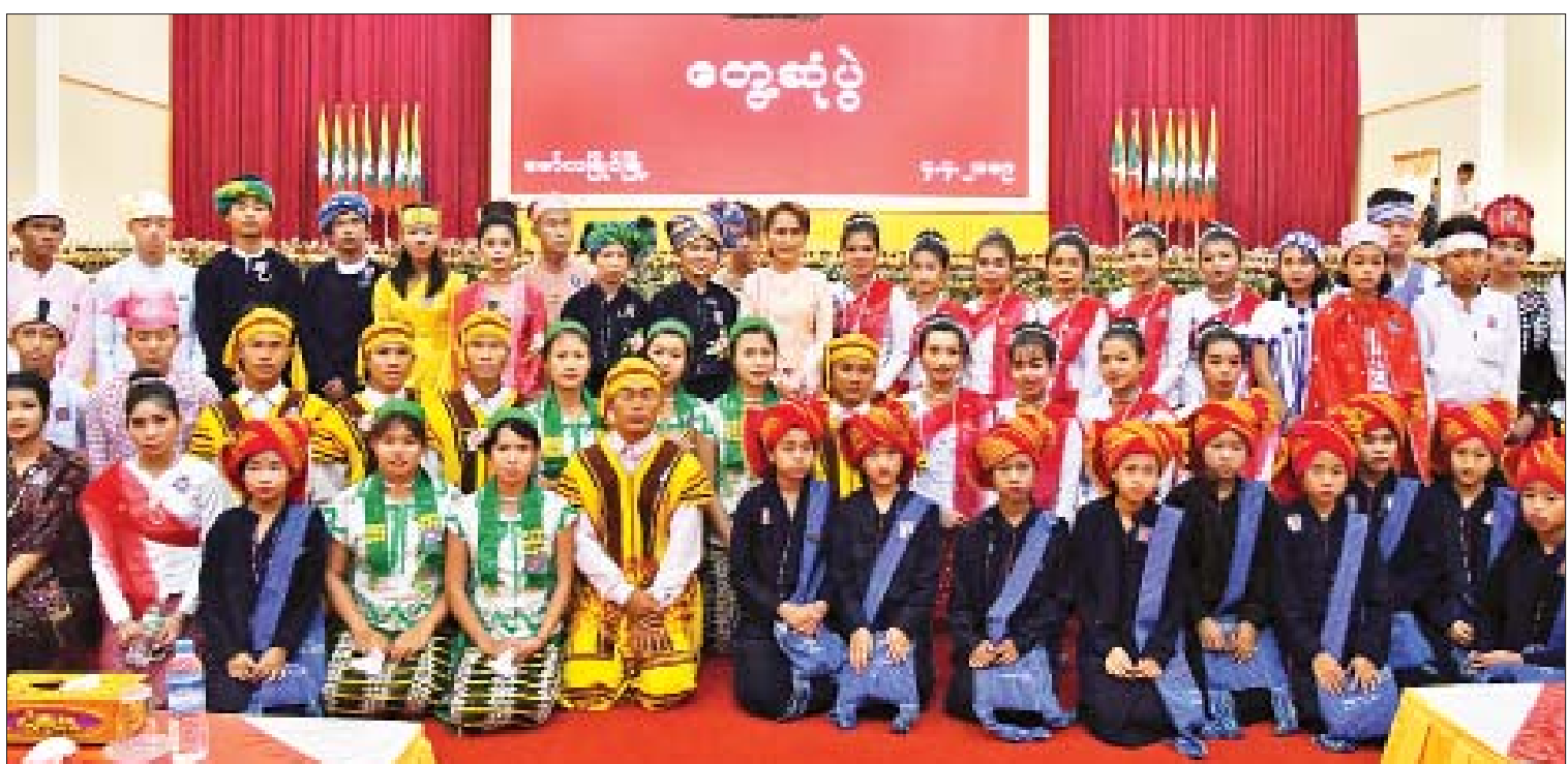
နိုင်ငံတော်၏အတိုင်ပင်ခံပုဂ္ဂိုလ် ဒေါ်အောင်ဆန်းစုကြည် မော်လမြိုင်မြို့ ဒေသခံပြည်သူများနှင့်တွေ့ဆုံပွဲသို့ တက်ရောက်လာကြသည့် ဒေသခံတိုင်းရင်းသား တိုင်းရင်းသူလူငယ်များနှင့် စုပေါင်းမှတ်တမ်းတင်ဓာတ်ပုံရိုက်စဉ်။

မိမိတို့သွားရောက်ခဲ့သည့် နေရာတိုင်း တွင် တင်ပြသည့် ပြဿနာများမှာ တူညီသည် ကို တွေ့ရပါကြောင်း၊ ယခုဆိုလျှင် အခြေခံ ပြဿနာ (၆)ခုရှိသည်ကို တွေ့ရပါကြောင်း၊ သောက်သုံးရေးမလုံလောက်မှုပြဿနာမှာ နည်းပါးလာပါကြောင်း၊ သို့သော် ရှိသေးပါ ကြောင်း၊ သောက်သုံးရေးမလုံလောက်မှုမှာ အတွက် အခြေခံလိုအပ်ချက် ဖြစ်ပါကြောင်း၊ သို့ဖြစ်၍ ယင်းကို အလေးထားဆောင်ရွက် လျက်ရှိပါကြောင်း၊ ဒုတိယအချက်မှာ လမ်းပန်း ဆက်သွယ်ရေး ကဏ္ဍဖြစ်ပါကြောင်း၊ လမ်းပန်း ဆက်သွယ်ရေးမှာ စီးပွားရေး၊ ပညာရေး၊ ကျန်းမာရေးတို့အတွက် အကျိုးသက်ရောက်မှု ရှိပါကြောင်း၊ တတိယကိစ္စမှာ လျှပ်စစ်မီး ဖြစ်ပါကြောင်း၊ လျှပ်စစ်မီးကို တစ်နိုင်ငံလုံးရရှိ စေရန် ကြိုးစားနေပါကြောင်း၊ ယခုနှစ် မကုန်ခင် မိမိတို့နိုင်ငံ၌ ၅၀ ရာခိုင်နှုန်းကျော် လျှပ်စစ်မီးရရှိမည်ဟု မျှော်လင့်ထားပါကြောင်း။