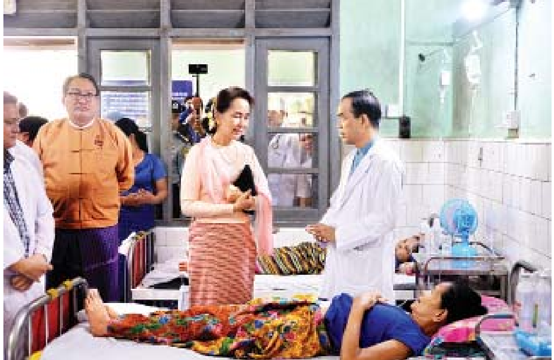
နိုင်ငံတော်၏အတိုင်ပင်ခံပုဂ္ဂိုလ် ဒေါ်အောင်ဆန်းစုကြည် မော်လမြိုင်မြို့အထွေထွေရောဂါကုဆေးရုံကြီးတွင် ဆေးဝါးကုသမှုခံယူနေကြသည့် လူနာများအား ရင်းရင်းနှီးနှီး လိုက်လံနှုတ်ဆက်အားပေးစကား ပြောကြားစဉ်။

မိမိအနေဖြင့် ခရီးများသွားသည့်အခါ မိမိတို့နိုင်ငံ၏ စိန်ခေါ်မှုများကို မြင်တွေ့ရပါကြောင်း၊ ပြဿနာများမှာ ဆင်တူယိုးမှားဖြစ်ပါကြောင်း၊ သို့သော်လည်း ပြည်သူလူထုနှင့် ယခုလို တိုက်ရိုက်ထိတွေ့ပြီး မျက်နှာချင်းဆိုင် ဖြေရှင်းဆောင်ရွက်ခွင့်ရခြင်းမှာ မိမိတို့ အတွက် အကျိုးရှိပါကြောင်း၊ ကမ္ဘာပေါ်တွင် ချမ်းသာသည်နိုင်ငံ အချို့တွင်လည်း ဆင်းရဲမွဲတေမှု မလွတ်ကင်းပါကြောင်း၊ ထို့ကြောင့် မိမိတို့နိုင်ငံ တိုးတက်ရာတွင် ညီညီမျှမျှ ဖွံ့ဖြိုးတိုးတက်စေချင်ပါကြောင်း၊ ချမ်းသာမှုနှင့် ဆင်းရဲမှု ကွာခြားလေလေ နိုင်ငံ၏ တည်ငြိမ်မှု နည်းလေဖြစ်ပါကြောင်း၊ ထို့ကြောင့် တစ်နိုင်လုံး ဟန်ချက်ညီညီ ဖွံ့ဖြိုးတိုးတက်စေလိုပါကြောင်း၊ သို့သော် မလွယ်ကူပါကြောင်း၊ တိုင်းဒေသကြီး၊ ပြည်နယ်များသည် ဖွံ့ဖြိုးတိုးတက်မှုမှာ မတူညီပါကြောင်း၊ အချို့တိုင်း ဒေသကြီး၊ ပြည်နယ်များတွင် ဖွံ့ဖြိုးတိုးတက်မှု သည် မြန်ဆန်မှုရှိသော်လည်း အချို့တွင် နှေးကွေးနေပါကြောင်း၊ ဖွံ့ဖြိုးတိုးတက်မှုကို ဆောင်ရွက်ရာတွင် စာမျက်နှာ ၄ သို့ >>>