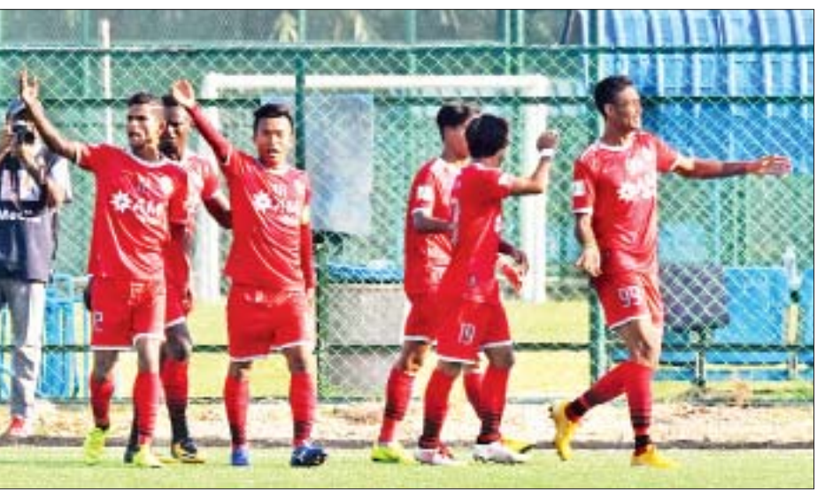
ရှုံးပွဲမရှိဘဲ တတိယနေရာတွင် ရပ်တည်နေသည့် ရော့တီအသင်း။

ရန်ကုန် ဧပြီ ၄ ၂၀၁၉ ရာသီ MNL အမှတ်ပေးပြိုင်ပွဲ ပွဲစဉ်(၇)ကို ဧပြီ ၆၊ ၇ ရက်တွင် ကျင်းပမည်ဖြစ်ပြီး အမှတ်ပေးဇယား ထိပ်ဆုံးနေရာတွင် ဦးဆောင်နေသည့် ဟံသာဝတီအသင်းနှင့် တတိယနေရာ မှ ရော့တီအသင်းတို့ ထိပ်တိုက် တွေ့ဆုံနေသည်။ ယခုတစ်ပတ်ပွဲစဉ်များမှာ အသင်း ကြီးအချင်းချင်း တွေ့ဆုံမှုမရှိသော် လည်း စိတ်ဝင်စားစရာပွဲကောင်းများ ပါဝင်လျက်ရှိသည်။ ပွဲစဉ်(၇)အဖြစ် ဧပြီ ၆ ရက်တွင် သုဝဏ္ဏကွင်း၌ ဇွဲကပင်အသင်းနှင့် ရတနာပုံအသင်း၊ စာမျက်နှာ ၁၃ ကော်လံ ၁ သို့ ❖