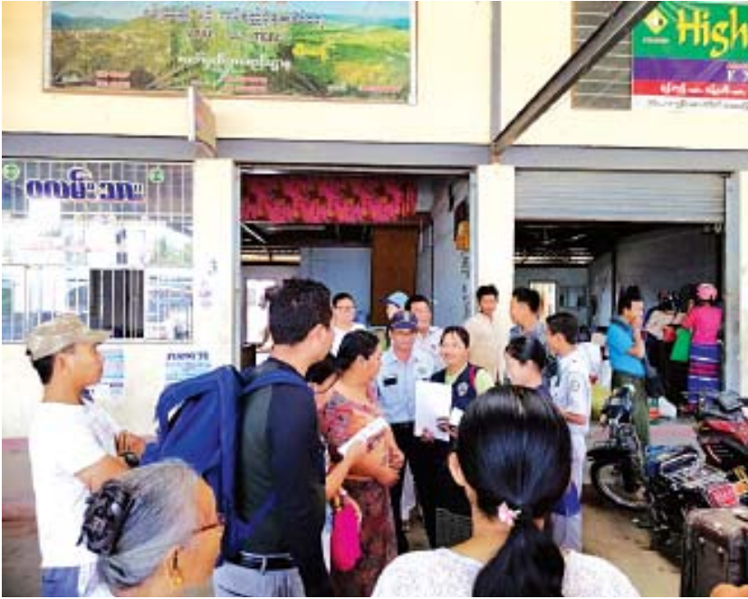
ရာတွင် ကြော်ငြာထားသည့်နေ့ရက်တွင် အမှန်တကယ် ဝယ်ယူရရှိမှုမရှိခြင်းများရှိပါက မိမိတို့ဌာနသို့ အသိပေးတိုင်ကြားနိုင်ကြောင်း အသိပေးရှင်းလင်းဆွေးနွေးခဲ့ကြသည်။ ဇိုဟေဆာ

ကလေး ဧပြီ ၄ မြန်မာ့ရိုးရာနှစ်သစ်ကူး မဟာအတာသင်္ကြန် ပွဲတော်ကာလ ခရီးသွားမိဘပြည်သူများ အဆင်ပြေချောမွေ့စွာ သွားလာနိုင်ရန် ရည်ရွယ်လျက် ကလေးခရိုင် စားသုံးသူရေးရာဦးစီးဌာနမှဦးဆောင်၍ သက်ဆိုင်ရာဌာနများနှင့် မိတ်ဖက်အဖွဲ့အစည်းများပူးပေါင်းကာ ကလေးမြို့တပ်ဦးသီတာရပ်ကွက် ပင်မယာဉ်ရပ်နားစခန်း(ကားကြီးကွင်း)တွင် ဧပြီ ၃ ရက် မွန်းလွဲ ၃ နာရီက ခရီးသွားမိဘပြည်သူများအား အသိပညာပေး လက်ကမ်းစာစောင်များ ဖြန့်ဝေပေးခဲ့သည်။