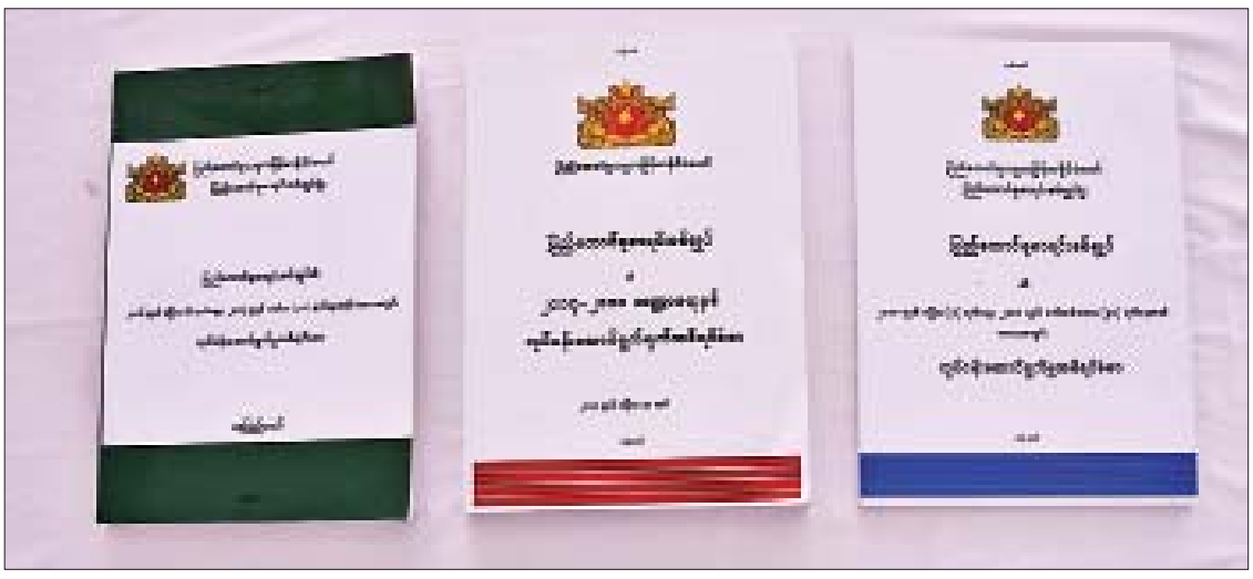
ပြည်ထောင်စုစာရင်းစစ်ချုပ်၏ အစီရင်ခံစာများကို တွေ့ရစဉ်။