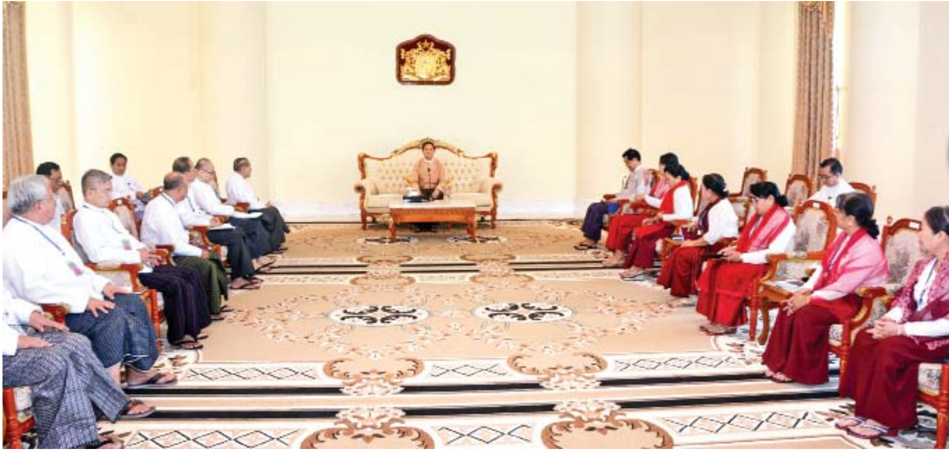
နိုင်ငံတော်သမ္မတ ဦးဝင်းမြင့် ပြည်ထောင်စုစာရင်းစစ်ချုပ် ဦးမော်သန်း ဦးဆောင်သည့် တိုင်းဒေသကြီး/ပြည်နယ်စာရင်းစစ်ချုပ်များကို ၂၀၁၈ ခုနှစ် မေ ၄ ရက်က တွေ့ဆုံစဉ်။