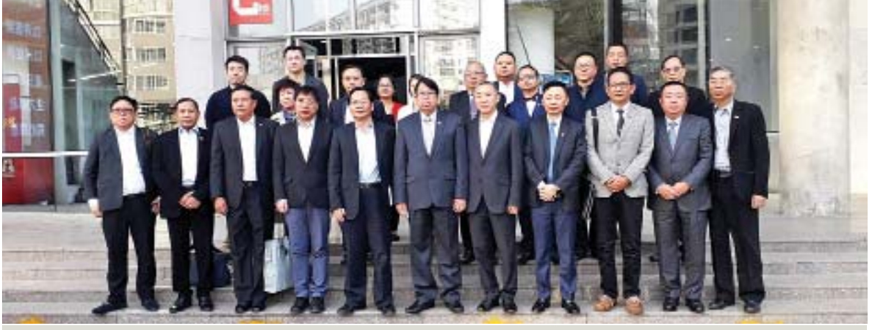
ပြည်ထောင်စုဝန်ကြီး ဒေါက်တာဖေမြင့် ဦးဆောင်သော မြန်မာကိုယ်စားလှယ်အဖွဲ့ ပေကျင်းရုပ်ရှင်အကယ်ဒမီသို့ စုပေါင်းမှတ်တမ်းတင်ဓာတ်ပုံရိုက်ကြစဉ်။

မွန်းလွဲပိုင်းတွင် ပြည်ထောင်စုဝန်ကြီး ဒေါက်တာဖေမြင့် ဦးဆောင်သော မြန်မာကိုယ်စားလှယ်အဖွဲ့သည် ပေကျင်းရုပ်ရှင်အကယ်ဒမီသို့ ရောက်ရှိကြရာ တာဝန်ရှိသူများက ရုပ်ရှင်သင်တန်းကျောင်း၏ သမိုင်းကြောင်း၊ ဌာနများ အလိုက် ဘာသာရပ်ဆိုင်ရာများ သင်ကြားပို့ချမှုနှင့် လက်တွေ့ဆောင်ရွက်မှု၊ သင်တန်းများဖွင့်လှစ်နိုင်မှုနှင့် ထူးချွန်အနုပညာရှင်များ မွေးထုတ်နိုင်မှု