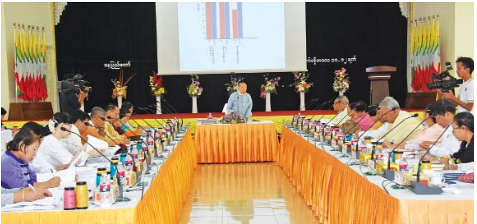
ပြည်ထောင်စုစာရင်းစစ်ချုပ်နှင့် တိုင်းဒေသကြီး/ပြည်နယ် စာရင်းစစ်ချုပ်များ၏ လုပ်ငန်းညှိနှိုင်းဆွေးနွေးပွဲ ကျင်းပစဉ်။

မေး။ ။ စာရင်းစစ်ချုပ်ရုံးရဲ့ ထူးထူးခြားခြား ဆောင်ရွက်နိုင်ခဲ့မှုတွေကို ပြောပြ ပေးပါ။ ဖြေ။ ။ စာရင်းစစ်ချုပ်ရုံးရဲ့ ထူးထူးခြားခြား Activity တစ်ခုက နိုင်ငံတော် သမ္မတက ပြည်ထောင်စုစာရင်းစစ်ချုပ် ဦးဆောင်တဲ့ တိုင်းဒေသကြီး၊ ပြည်နယ် စာရင်း စစ်ချုပ်တွေကို ၂၀၁၈ ခုနှစ် မေလ ၄ ရက်မှာ တွေ့ဆုံခဲ့ပါသည်။ နိုင်ငံတော်သမ္မတက ပြည်သူ့ဘဏ္ဍာငွေတွေ လေလွင့်ဆုံးရှုံးမှုမရှိ ရေးအတွက် ပြည်ထောင်စုစာရင်းစစ်ချုပ်ရုံး အနေနဲ့ နိုင်ငံတော်ရဲ့ အရအသုံးစာရင်းတွေ စစ်ဆေးရန်၊ သတ်မှတ်ချထားပေးတဲ့ ခွင့်ပြု ဘဏ္ဍာငွေတွေ အပြည့်အဝရရှိရေး ဆောင်ရွက် ထားခြင်း ရှိ/မရှိ၊ ရငွေတွေကို ထိရောက်စွာ အသုံးပြုခြင်း ရှိ/မရှိ၊ ချမှတ်ပေးတဲ့ ရည်ရွယ် ချက်၊ ရည်မှန်းချက်တွေကို အကောင်အထည် ဖော် ဆောင်ရွက်နိုင်ခြင်း ရှိ/မရှိ၊ စစ်ဆေး