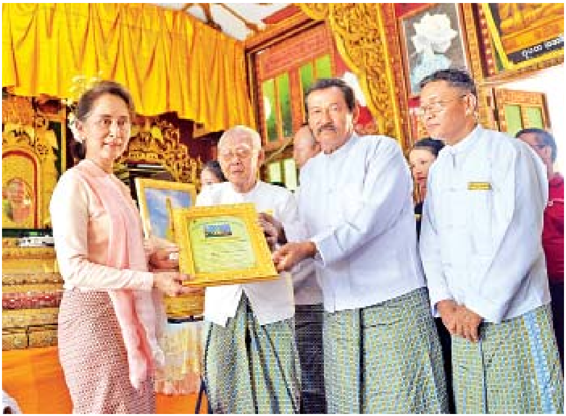
နိုင်ငံတော်၏အတိုင်ပင်ခံပုဂ္ဂိုလ် ဒေါ်အောင်ဆန်းစုကြည် နိုင်ငံတော်ကိုယ်စား ကျိုက်သလုံစေတီတော်မြတ်ကြီး ပြန်လည်ပြုပြင်မွမ်းမံရန်အတွက် အလှူငွေကျပ်သိန်း ၅၀၀၀ ပေးအပ်လှူဒါန်းရာ ဂေါပကအဖွဲ့က ဂုဏ်ပြုမှတ်တမ်းလွှာ ပြန်လည်ပေးအပ်စဉ်။

ယခုလုပ်ငန်းသည် ကုသိုလ်ဖြစ်လုပ်ငန်း ဖြစ်သည့်အတွက်ကြောင့် ဒေသခံ ပြည်သူများက သဒ္ဓါစိတ်ဖြင့် လှူဒါန်းပံ့ပိုးကြလိမ့်မည်ဟု ယုံကြည်ပါကြောင်း၊ ပြန်လည်တည်ဆောက်သည့် နေရာတွင် အရည်အသွေးကို စနစ်တကျ စစ်ဆေးသွားရန် လိုအပ်ပါကြောင်း၊ အဆင့်မီခြင်း ရှိ/မရှိကို ဂေါပကအဖွဲ့က ဦးဆောင်ပြီး သေသေချာချာ ကြပ်မတ်စစ်ဆေးစေလိုပါကြောင်း၊ အဆင့်မီမီ မလုပ်ပါက လုပ်သမျှသည် ရာနန်းပြည့် ထိရောက်မှု ရှိနိုင်မည် မဟုတ်ပါကြောင်း၊ ပြန်လည်ပျက်စီးခြင်း၊ ပြုပြင်မွမ်းမံခြင်းလုပ်ငန်းများ