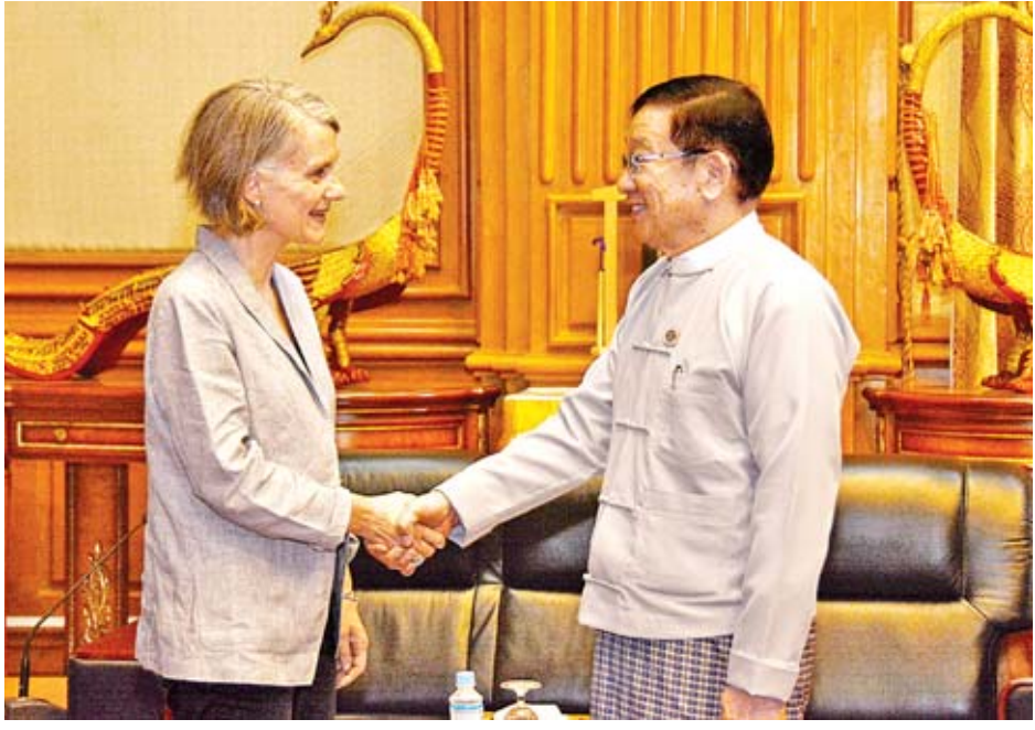
ဥပဒေပြင်ဆင်ရေး လုပ်ငန်းစဉ်ဆိုင်ရာ ကိစ္စရပ်များနှင့် စပ်လျဉ်း၍ ရင်းနှီး ပွင့်လင်းစွာ အမြင်ချင်းဖလှယ်ဆွေးနွေး ခဲ့ကြသည်။ ပြည်သူ့လွှတ်တော် ရုံးမှ တာဝန်ရှိသူ များ တက်ရောက်ခဲ့ကြကြောင်း သိရသည်။ သတင်းစဉ်

နေပြည်တော် ဧပြီ ၄ ပြည်သူ့လွှတ်တော်ဥက္ကဋ္ဌ ဦးတီခွန်မြတ် သည် မြန်မာနိုင်ငံဆိုင်ရာ ဩစတြေး လျနိုင်ငံ သံအမတ်ကြီး မစ္စအင်ဒရီရာ ဖော့ခ်နာအား ယနေ့နံနက် ၁၁ နာရီတွင် နေပြည်တော်ရှိ လွှတ်တော်အဆောက် အအုံ ပြည်သူ့လွှတ်တော်ဆောင် ဧည့်ခန်းမ၌ လက်ခံတွေ့ဆုံသည်။