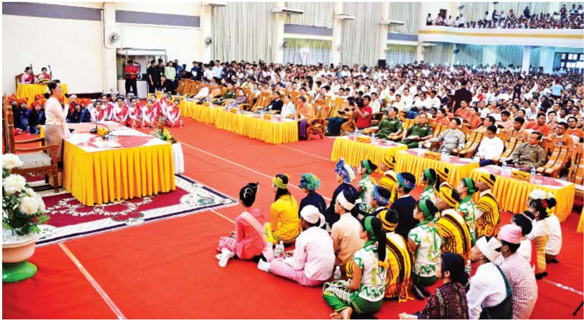
နိုင်ငံတော်၏အတိုင်ပင်ခံပုဂ္ဂိုလ် ဒေါ်အောင်ဆန်းစုကြည် မွန်ပြည်နယ် မော်လမြိုင်မြို့ပြည်နယ်ခန်းမ၌ ဒေသခံပြည်သူများနှင့် တွေ့ဆုံပွဲတွင် အမှာစကားပြောကြားစဉ်။

နယ်စပ်ဒေသနှင့် တိုင်းရင်းသားလူမျိုးများ ဖွံ့ဖြိုးတိုးတက်ရေးတို့ကို အတိုင်ပင်ခံပုဂ္ဂိုလ် ဒေါ်အောင်ဆန်းစုကြည်သည် ပြည်ထောင်စုဝန်ကြီးများဖြစ်ကြသည့် ဒုတိယဗိုလ်ချုပ်ကြီးကျော်ဆွေ၊ ဒုတိယဗိုလ်ချုပ်ကြီးရဲအောင်၊ ဦးမင်းသူ၊ ဒေါက်တာအောင်သူ၊ ဦးအုန်းဝင်း၊ တာဝန်ရှိသူများနှင့်အတူ ယနေ့နံနက်ပိုင်းတွင် နေပြည်တော်မှ အထူးလေယာဉ်ဖြင့် ထွက်ခွာကြရာ မွန်ပြည်နယ် မော်လမြိုင်မြို့သို့ ရောက်ရှိကြသည်။