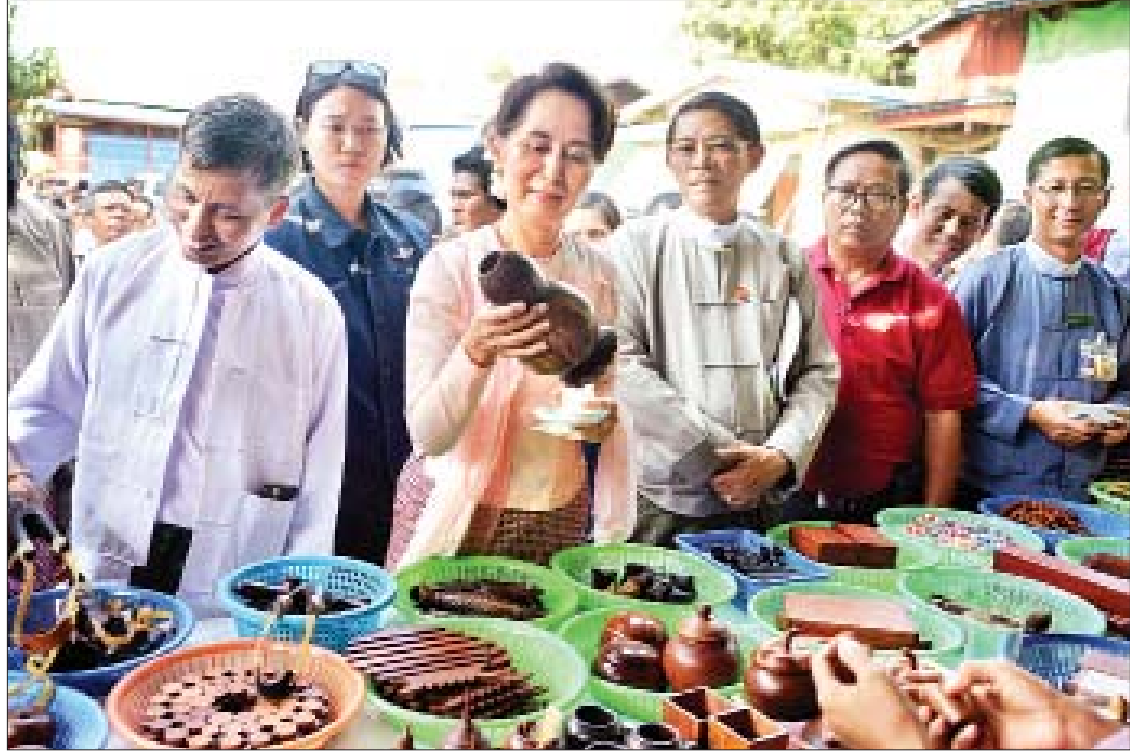
နိုင်ငံတော်၏အတိုင်ပင်ခံပုဂ္ဂိုလ် ဒေါ်အောင်ဆန်းစုကြည် ချောင်းဆုံမြို့နယ် ရွာလွတ်ကျေးရွာ လက်မှုပညာထုတ်ကုန်အရောင်းဆိုင်များတွင် ကြည့်ရှုလေ့လာစဉ်။

ယင်းနောက် ဒေသခံပြည်သူများက အမှိုက်သိမ်းယာဉ်ချပေးရေး၊ စာကြည့်တိုက်တွင် စာအုပ်စာပေကောင်းများ ထားရှိပေးရေး၊ ငွေဝတ္တုအတုတိုက် တိုက်နယ်ဆေးရုံအတွက် ဓာတ်မှန်စက်ထားရှိပေးရေးနှင့် လျှပ်စစ်မီးရရှိရေးဆိုင်ရာ ကိစ္စရပ်များကို တင်ပြကြရာ ပြည်နယ်ဝန်ကြီးချုပ်နှင့် ပြည်နယ်ဝန်ကြီးတို့က ဆောင်ရွက်ပေးနိုင်မည့် ကိစ္စရပ်များ ပြန်လည်ဖြေကြားပြီး နိုင်ငံတော်၏ အတိုင်ပင်ခံပုဂ္ဂိုလ်က ဖြည့်စွက်ရှင်းလင်း ဖြေကြားသည်။ ထို့နောက် နိုင်ငံတော်၏အတိုင်ပင်ခံပုဂ္ဂိုလ်သည် ချောင်းဆုံမြို့နယ် မုဒုံနန်းရွာရှိ လက်မှုထုတ်ကုန် အမှတ်တရပစ္စည်း အရောင်းဆိုင်သို့ရောက်ရှိပြီး ကျောက်သင်ပုန်းများ၊ လူသုံးကုန်နှင့် အိမ်တွင်းအလှဆင် လက်မှုထုတ်ကုန်များ ထုတ်လုပ်ရောင်းချနေမှုကို ကြည့်ရှုကာ လက်မှုထုတ်ကုန်များဆောင်ရွက်ရာတွင် လိုအပ်သည်များကို ပံ့ပိုးကူညီဆောင်ရွက်ပေးရန် ဖွန်ပြည်နယ်ဝန်ကြီးချုပ်အား မှာကြားခဲ့သည်။ သတင်းစဉ်