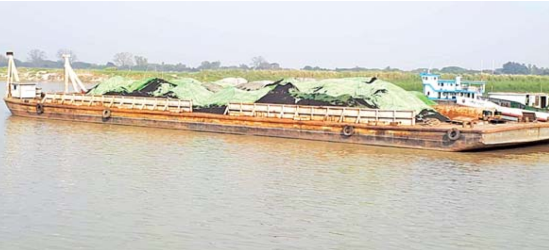
ထားရှိခြင်းများ ဆောင်ရွက်ထားရှိမှုအပေါ် နှင့် လွယ်ကူချောမွေ့စွာ ခုတ်မောင်းသွားလာ ရေစူးကို လိုက်နာရန် သတ်မှတ်ပေးထား အားကိုးသွားလာလျက်ရှိကြသည်။ နိုင်ရန်အတွက် ရေအရင်းအမြစ်နှင့် မြစ် ကြောင်း သိရသည်။ ဧရာဝတီ(ကသာ)

များ၌ အင်ဂျင်ပါဝါ မြှင့်တင်မောင်းနှင်သဖြင့် ရေလမ်းကြောင်း ပြောင်းလဲထိခိုက်စေနိုင်၍ ရေယာဉ်မောင်းနှင်သူများ အထူးသတိပြု မောင်းနှင်ကြရလျက်ရှိသည်။ “တချို့ယာဉ်တွေဆိုလျှင် သဲသောင်ထု ရှိရာ ရေစီးပါးစပ်ကိုဖြတ်သန်းမိရာ အင်ဂျင် ပါဝါအားမြှင့်တင် မှတ်ထုတ်ကာ နောက်ပြန် ဆုတ်မောင်းနှင်ရသည့် အနေအထားများ ကြောင့် ရေစီးလမ်းကြောင်း ပြောင်းလဲသည့် အနေအထားမျိုး ကြုံတွေ့ရမှုများရှိတယ်”ဟု သင်္ဘောရေယာဉ်မောင်းနှင်သူတစ်ဦးက ပြော သည်။ ဧရာဝတီမြစ်ကြောင်းအတွင်း ရေယာဉ် များ ဘေးအန္တရာယ်မကြုံတွေ့ရစေရန် ရေကြောင်းပြအမှတ် အနီ၊ အစိမ်း၊ အဖြူ ရောင်ရေဇာများ သတ်မှတ်ထားရှိခြင်းနှင့် နေ့/ည မြင်နိုင်သော ဇာများ သတ်မှတ်